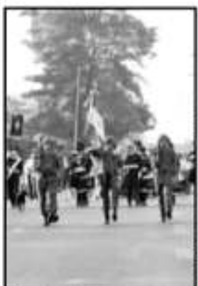
LA MAYORÍA DE LOS CONTINGENTES FUERON MILTARES, EN LC.

En el desfile que recuerda una de las fechas más importantes para la historia de México, como lo es el inicio de la Independencia de México, no participaron escuelas de preescolar ni primarias y sólo una escuela secundaria, la General José María Morelos en su turno matutino presentó un contingente.