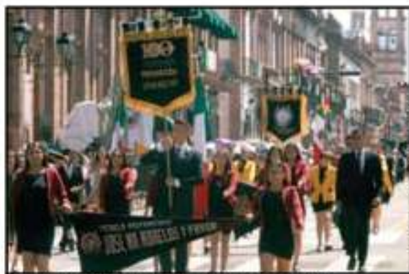
LA UNIVERSIDAD MICHOACANA NO PODÍA FALTAR EN EL DESFILE.