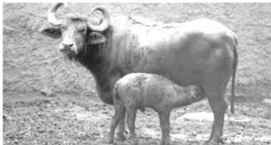
Un total de 114 nacimientos de especies pequeñas y otras no tanto, son logros que reafirman el compromiso del Zoológico para continuar con los programas de conservación de la vida animal y la preservación de nuestro medio ambiente.

Por igual, estos logros reafirman el compromiso del Zoológico para continuar con los programas de conservación de la vida animal y de protección al medio ambiente. El Parque Zoológico trabaja los 365 días del año.