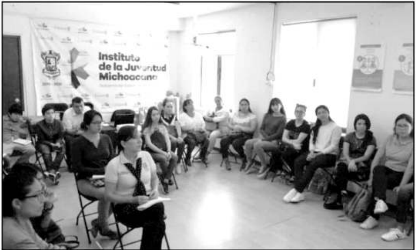
El taller incluyente se llevará a cabo del 17 de septiembre al 4 de octubre y se realizarán sesiones de práctica con la comunidad sorda, aprendizaje de abecedario, número y señas comunes.

Los interesados deberán inscribirse de forma anticipada o el mismo día del evento en las instalaciones del Instituto, de 9 a 18 horas.