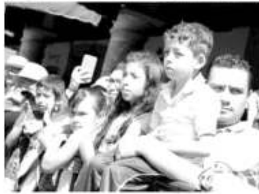
En orden se realizaron la noche del grito y el desfile en Morelia y municipios del estado.