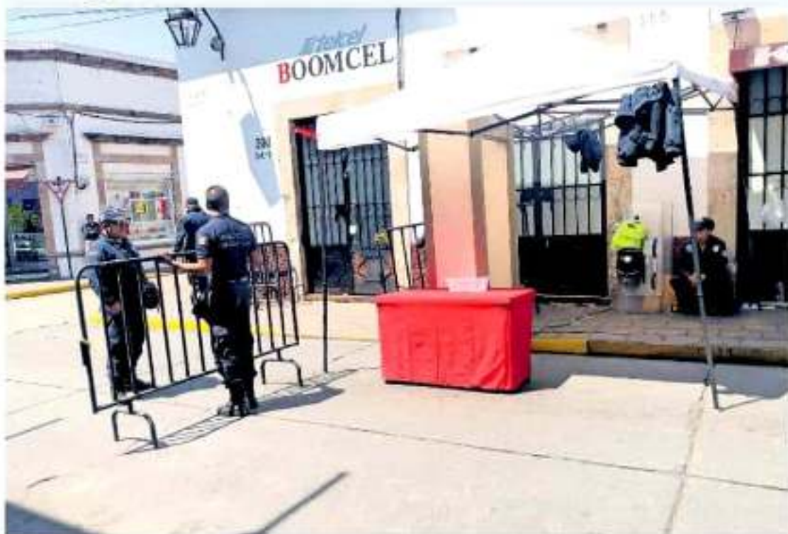
En las otras regiones de la entidad, las celebraciones para conmemorar la Independencia se desarrollaron sin incidentes.