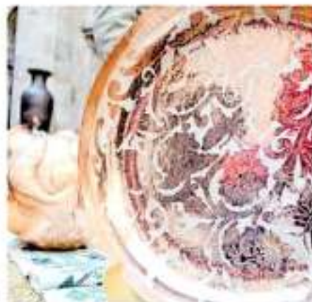
Apoyar los concursos de arte popular estimulan la sana competencia. Amorcy

La de recursos que durante el periodo 2013-2018 se entregaron a través de Fonart un total de 25 mil 969 apoyos a los artesanos de Michoacán por más de 7.8 millones de pesos.