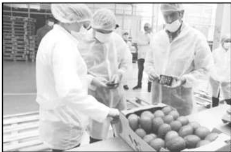
RECURSO ES EL PLAN DE TRABAJO DE LOS INSPECTORES DE USDA EN LAS EXPORTACIONES DE AGUACATE.

Es un interés económico mutuo, sin embargo señalaron, las políticas públicas de aquel gobierno privilegian la seguridad de quienes son parte de sus instituciones, por lo que exigen a cambio comportamientos éticos y responsables para brindar todo el res-