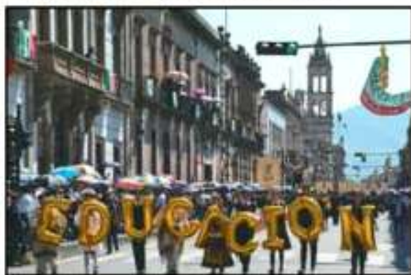
TAMBIEN PARTICIPARON ALUMNOS DE EDUCACION BASICA DE LA CAPITAL.