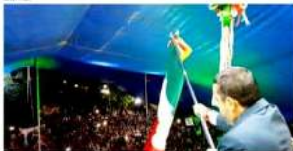
LOS REYES, MICH.- Abarrotada lució la plaza principal durante el Grito de Independencia.

El recorrido, encabezado por el alcalde, se llevó a cabo por la ruta ya conocida a través de algunas de las principales calles de la ciudad, concluyendo alrededor de dos horas después, de una forma fluida y sin incidentes; por la noche se llevó a cabo el último programa socio cultural de las fiestas, en lo que fue el cierre de unas fiestas en las que destacó la organización y la participación de la ciudadanía.