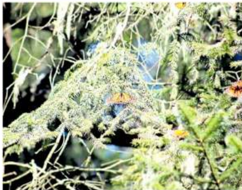
Se realizará un esfuerzo para difundir este referente natural de Michoacán. CSM

Uno de los objetivos es que esté listo este espacio para la apertura oficial de la tempe-