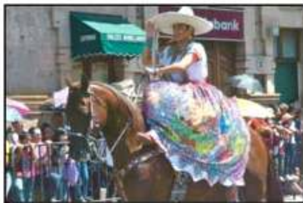
CHINBOS Y ESCONAMUJAS LUCIERON ENFERMOS DE LUMPLARES Y VESTIDOS.

antes miles de ciudadanos que observan el desfile en las calles de cartón rosa o lo siguen desde plataformas digitales. Finalmente, también desfila la Policía Estatal. Se presumen los vehículos tipo "Rino", el personal de élite que desfila con el rostro cubierto, los perros y las caballos amasestrados. Culmina el desfile que mostró no sólo el poder militar, sino también la educación y cultura de Michoacán. Un alto mando da informe del saldo del desfile: 3 mil 319 efectivos, 61 vehículos, 29 motocicletas, tres lanchas, 330 pretes a caballo y 15 binomios de canes.