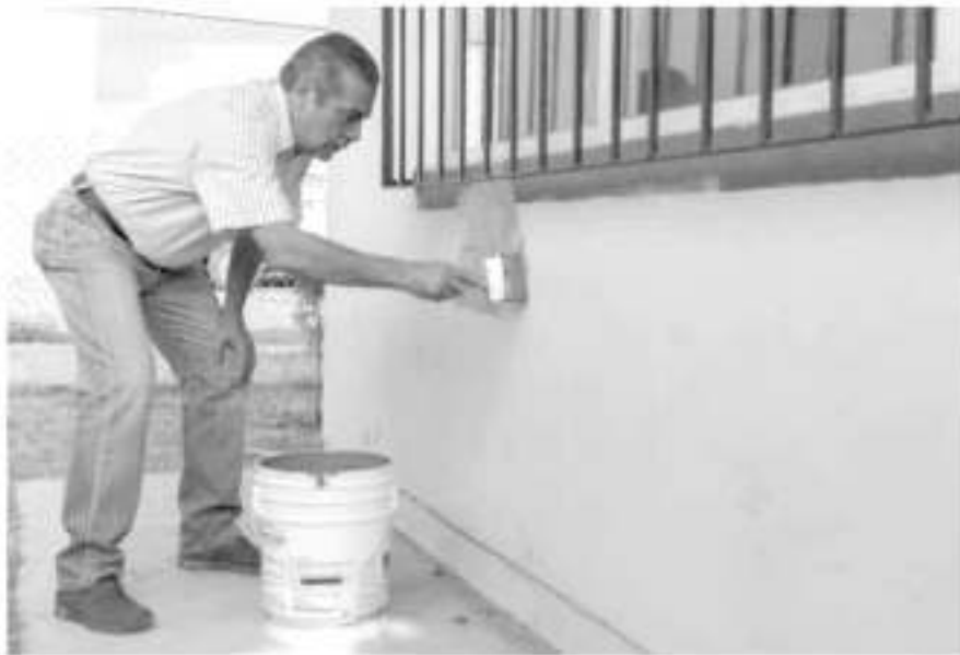
El alcaldecapitalino, Raúl Morón Orozco, arrancó la jornada «Juntos Pintando mi Escuela» en la Telesecundaria 16, en la Aldea.

alrededor de 800 escuelas de educación básica en el municipio, en ese sentido adelantó que