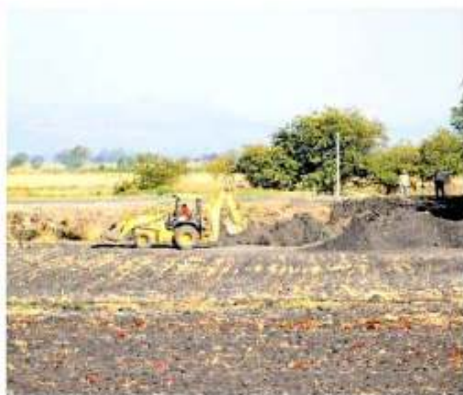
El año que viene no habrá participaciones federales en productividad, modernización y equipamiento para producción agroalimentaria.