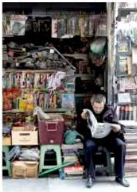
Los medios impresos que tienen registros a disposición de padrón deberán cumplir con los requisitos establecidos para la foto, en caso contrario, no podrán acceder a partidas de publicidad oficial del gobierno federal.

Además, la Segob agregó que buscan que el Padrón Nacional de Medios Impresos no sólo a los periódicos y revistas, sino también a los medios de radio, televisión,