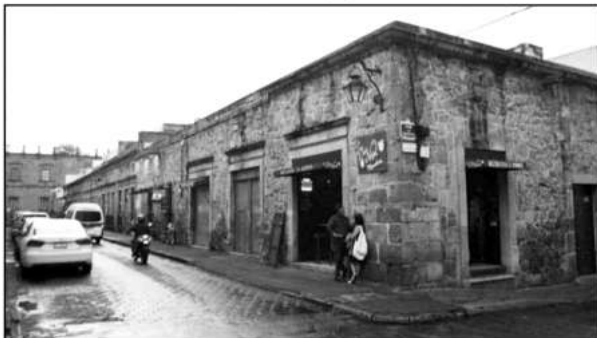
PARA LA GRAN CANTIDAD DE BARES, RESTAURANTES Y NEGOCIOS DE DISTINTOS GIROS COMERCIALES EN GENERAL, EL NÚMERO DE INSPECTORES ES ÍNFILO.

El secretario también hizo referencia a que se han detectado unos 60 casos en los que hubo estable-