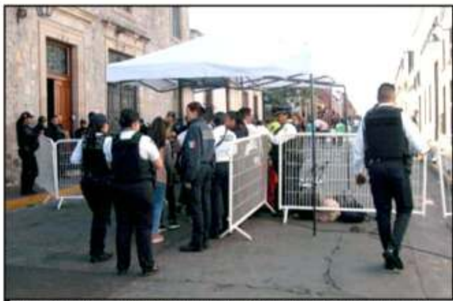
MILES DE MIL POLICÍAS SE ENCARGARON DE VIGILAR LA ENTRADA AL CENTRO HISTÓRICO DURANTE LOS FESTEJOS

"Ellos lo hicieron sin temer, sin pensar que en ello les costaría la vida. Fue más grande su convicción patriótica, su amor a los habitantes de la colonia española, que padecían injusticias, pobreza, miseria, marginación e ignorancia. Su lucha fue por rescatar a sus semejantes de la esclavitud y de las injusticias que los peninsulares les provocaban", expresó.