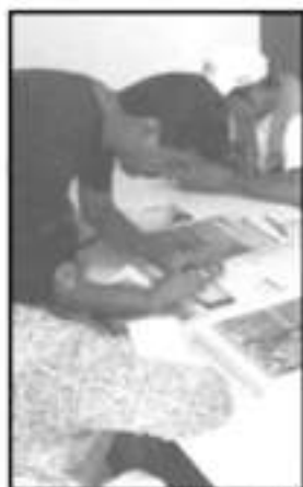
LOS BAJOS INGRESOS TRIBUTARIOS PUEDEN FRENAR EL CRECIMIENTO