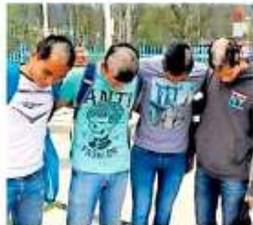
Se publicaron en redes sociales imágenes de jóvenes trasquilados. /Cortés

Ya se tienen en marcha investigaciones sobre las denuncias públicas que se hicieron en plataformas de las redes sociales sobre las lesiones y agresiones sufridas por alumnos de reciente ingreso en la Escuela Normal de Educación Física (ENEF), quienes fueron objeto de una “novatada”. Este hecho fue denunciado el 7 de septiembre cuando se publicaron en redes sociales imágenes de jóvenes con el cabello mal cortado y trenzas colgando sobre una barqueta. Se habla de una estudiante que se disculpó un hombre al intentar defenderse del acto. Aunque no es la primera vez que se dan a conocer este tipo de abusos para