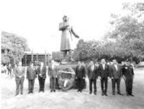
Ceremonia Cívica Conmemorativa del 209 Aniversario del Inicio de la Independencia Nacional.

En su mensaje, Herrera aseveró que todos los actores políticos, sociales, académicos y empresariales tienen la obligación moral y cívica de velar por los intereses de todos aquellos que tengan sed de justicia y con ello, evitar que