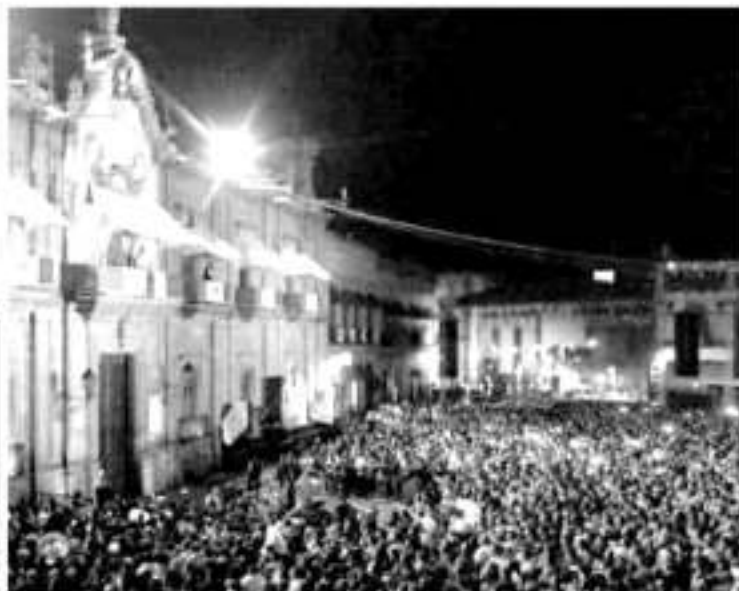
Aspectos de las celebraciones con motivo de la Independencia de México.