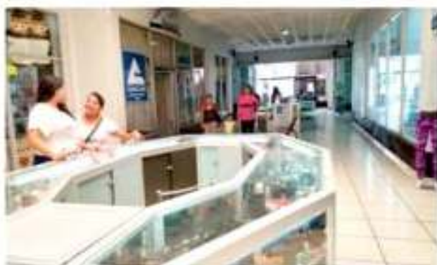
ZAMORA, MICH.- Los sectores productivos de la región enfrentan un panorama de crisis severa, producto de una constante contracción económica alimentada por la inseguridad y bajas ventas.

"Los grandes hoteles tienen muchos problemas para subsistir, los que están saliendo adelante son los hoteles que tienen pocos cuartos. Estamos en la situación que alguna vez tuvo Uruapan, donde con una capacidad superior a Zamora, tenían cuartos cerrados o inhabilitados por la falta de ocupantes. Ahora así estamos aquí", añadió.