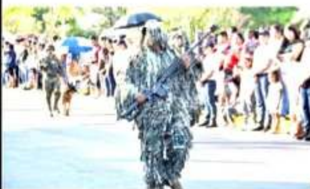
CD. LÁZARO CÁRDENAS, MICH.- Un total de 1,604 personas participaron en el desfile por motivo del CCIX aniversario del Inicio de la Guerra de Independencia, celebrado este lunes por la mañana.