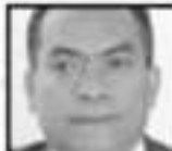
“Indiscutiblemente hay una tendencia creciente del número de homicidios” Adrián López, FISCAL DEL ESTADO

Esa misma mañana, un joven maniatado fue baleado en la colonia Lucio Cabañas. Con un disparo en la cabeza, el ahora occiso alcanzó a llegar a un nosocomio local en donde falleció producto de las heridas del disparo de arma