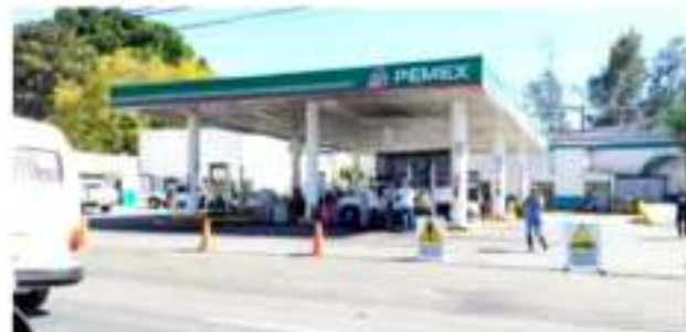
ZAMORA, MICH.- La volatilidad en los precios de los combustibles, es factor que detona la espiral inflacionaria.

Esta obra cuenta con recursos provenientes del Fondo de Aportaciones para la Infraestructura Social, con una inversión de 485 mil pesos.