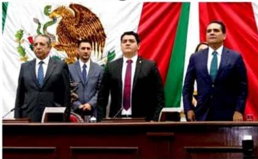
El pasado 15 de septiembre, dio inicio el segundo año legislativo en el Congreso del Estado.