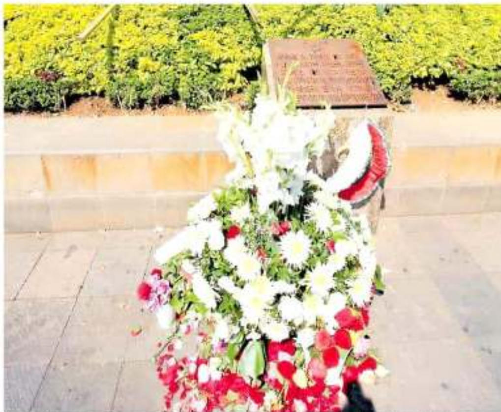
Como cada año, familiares y amigos de personas fallecidas en 2008 dejaron una ofrenda en el lugar del hecho. www.cdmx.com