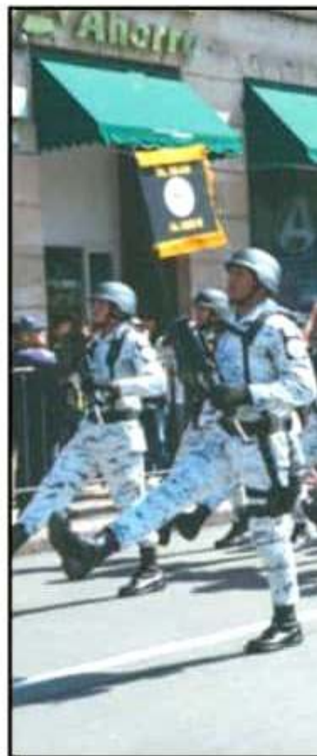
CONTINGENTES DE LA GUARDIA NACIO

recta. Siguen regidores y funcionarios del Ayuntamiento capitalino. Después se pierde la formación y los altos mandos desfilan en un contingente desordenado. Por un momento intentan dar vuelta hacia el Palacio de Gobierno, pero rectifican y siguen de frente.