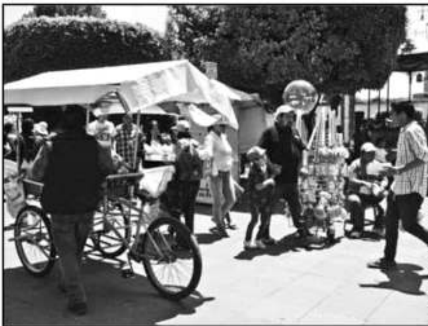
EL EXHORTO TAMBIÉN ES A NO SER DIVISOS CONTRA EL AMBULANTAJE Y SERVIDORES, QUE HAN CREADO EN EL CENTRO

mero de comerciantes que persistían en la vía pública del Centro Histórico. No obstante, enumeró 5 puntos que siguen siendo los de mayor conflicto por presencia de vendedores sin tolerancia: Valladolid y Alameda, Vasco de Quiroga y Plaza Capuchinas, Andrés del Río y Ana María Gallaga, las inmediaciones de la Catedral y la zona del Carmen junto con la Casa de la Cultura.