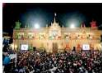
La ceremonia del Grito en Morelia no tuvo incidentes mayores, así como