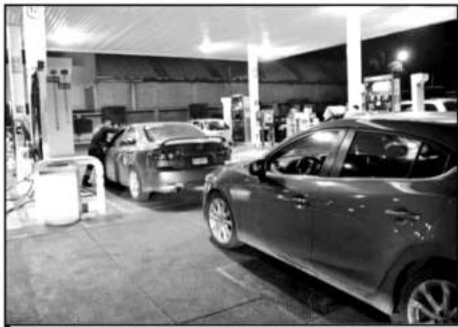
PEMEX MANTIENE LAS INVESTIGACIONES PARA EVITAR LA COMPRA-VENTA DE COMBUSTIBLE DE PROCEDENCIA ILÍCITA.