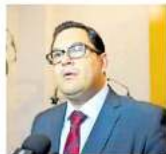
La Guardia Nacional debe tener estrategia, señaló el ombudsman. www.cdmx.com

“No hay que ofensa al Ejército que quitarle el arma parlamentaria”, agregó.