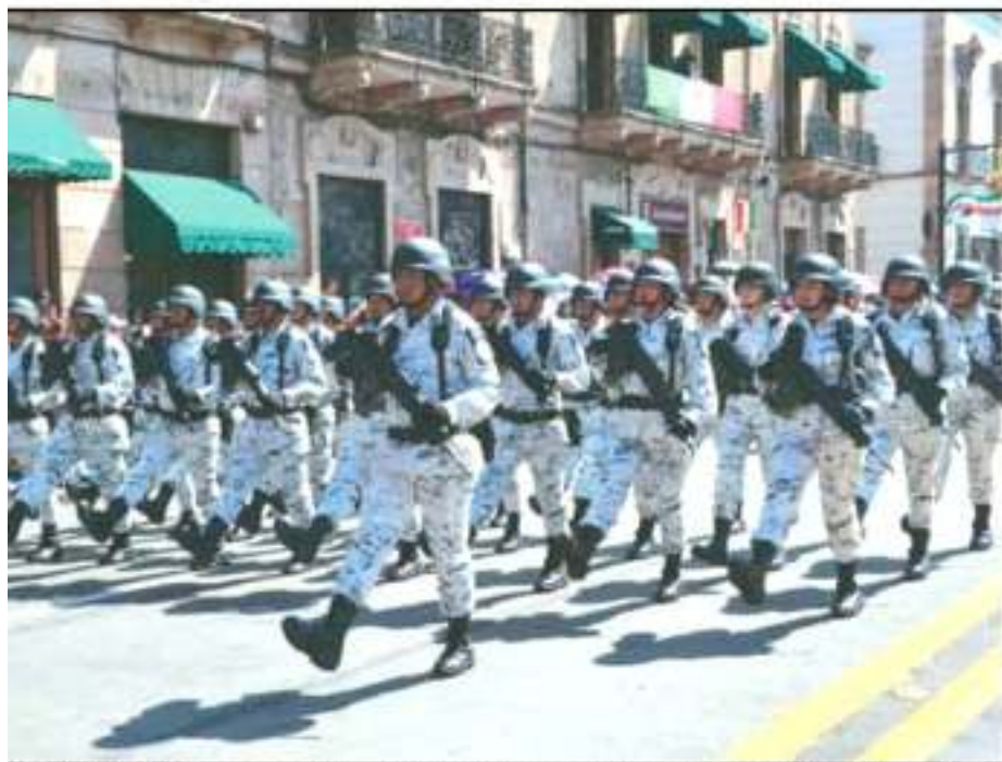
AL PARTICIPARON EN EL DESFILE, JUNTO CON OTRAS CORPORACIONES MILITARES Y POLICIALES DE LOS TRES ORDENES DE GOBIERNO.

Por primera vez, con sus características: uniformes blancos, desfilan en Michoacán los agentes de la Guardia Nacional del presidente Andrés Manuel López Obrador. A este desfile del 16 de septiembre la nueva corporación llega sin haber cumplido las expectativas de la población. Cuando se presentó oficialmente su uniforme, expertos en seguridad señalaron que sería como "llo al blanco" en un enfrentamiento armado. Se distribuyó en Michoacán, no disminuyó los índices de inseguridad. Finalmente, en su primer informe de gobierno, AMLO