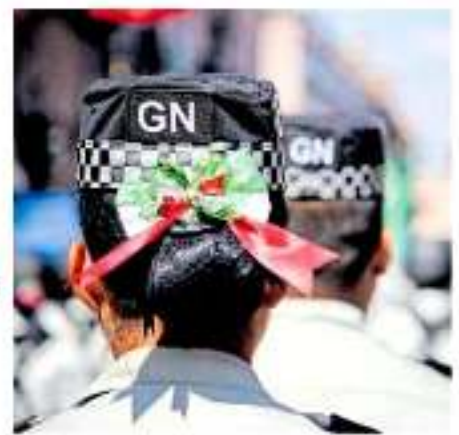
La operatividad de la Guardia Nacional es un tema que ha causado desencuentros.

En su discurso destacó que es necesario enseñarse en los grandes personajes