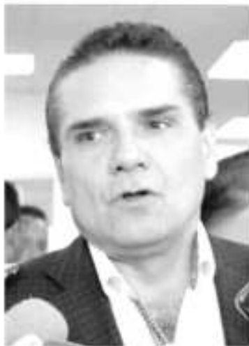
Silvano Aureoles Canjeo.