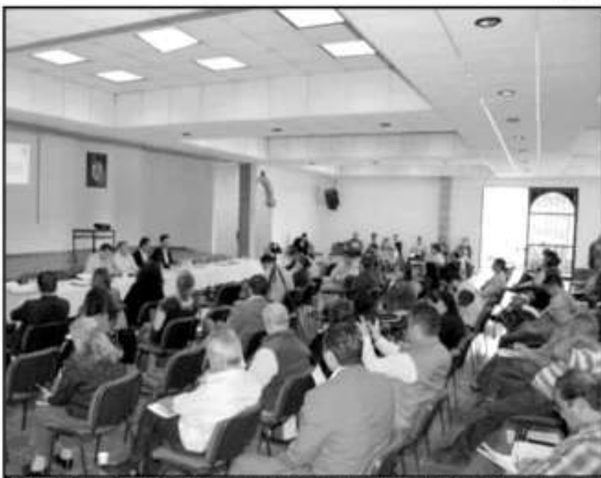
ANALIZARÁ EL SINDICATO DE PROFESORES LOS AVANCES QUE HAY RESPECTO A LOS PAGOS REZAGADOS DE PRESTACIONES

Será a las 11:00 horas en comienzo la reunión sindical donde se defina la votación que tuvieren las delegaciones. Cabe recordar que el SPUM prorrogó para el jueves 17 de octubre, a las 19:00 horas, la huelga proyectada para hoy.