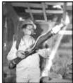
CONTINUA LA SSM CON LAS LABORES DE PUNTIACIÓN EN EL ESTADO.

Apatzingán, Aguililla, Bonifacio Moreno, La Huacana, Tepalcatepec, La Piedad, Yurécuaro, Lázaro Cárdenas, Guacamayas, Morelia, Talitán, Carácuaro, Nocupétaro, Tacámbaro, Pedernales, Puruarán, Lombardía, Los Reyes, Uruapan, Sahuayo, Zamora, Huatimo, San Lucas, Vicente Riva Pala-