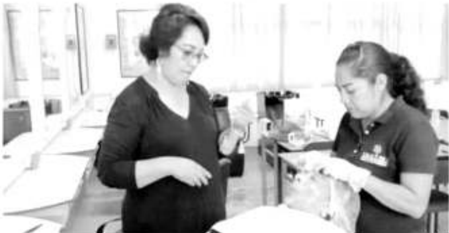
El Icatmi, abrió inscripciones para el periodo septiembre-diciembre; sus talleres tendrán un costo de 400 pesos en promedio, por una capacitación de alta calidad con valor curricular.

de se requieren potenciar el desarrollo económico, situación por la que «nuestros costos están al al-