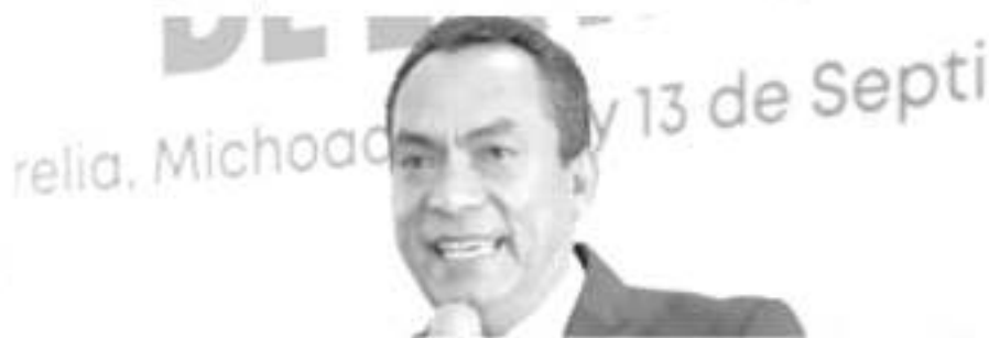
El Fiscal General del Estado declaró que haría la solicitud formal a la FGR para que reabriera el caso y se volviera a indagar para dar con los responsables.

En este escenario, recordó que los únicos detenidos fueron puestos en libertad.