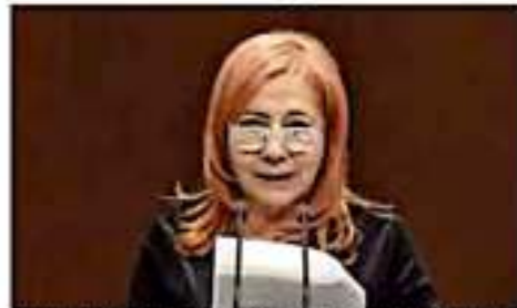
La organización no quiere someter al evento que las declaraciones de la titular de la CNDH en contra de la prensa nublarán los derechos de cientos de periodistas. | CHIAYOLINI

Después de esta situación, la organización no gubernamental interpuso una queja en