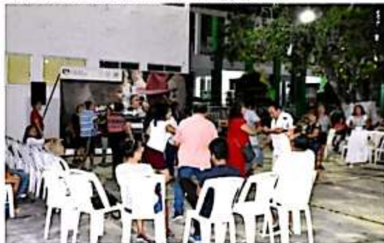
CD. LÁZARO CÁRDENAS, MICH.- Con gran éxito se llevaron a cabo el pasado sábado tanto el "Sábado de Danzón" como el "Emprende Fest LZC", los cuales contaron con una gran asistencia.

A la par de esta actividad, celebrada en la Explanada Municipal, la Casa de la Cultura "José Vasconcelos" realizó el "Sábado de Danzón" en donde un gran número de adultos mayores y familias pudieron bailar al ritmo de salsa, merengue y danzón.