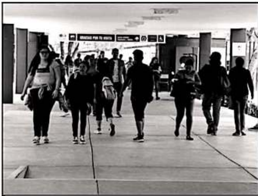
CON PROBLEMAS FINANCIEROS ENORMES, LA UMSNH SÓLO TENDRÁ ACTIVIDADES JUEVES Y VIERNES, POR FECHA DE ASUETO.

sente se otorgue como día de asueto para los agremiados al SPUM, y habiendo recibido una respuesta afirmativa al respecto, lo hago de su conocimiento".