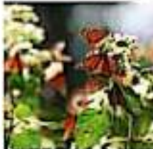
Los sembreros de la Monarca han abierto sus puertas a los turistas. 1007250