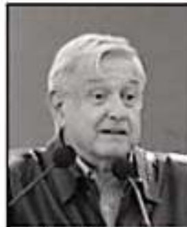
Andrés Manuel López.

Los días 19 y 20 de noviembre se registrarán los aspirantes a suceder al ombudsman estatal. Esperemos que, en Michoacán,