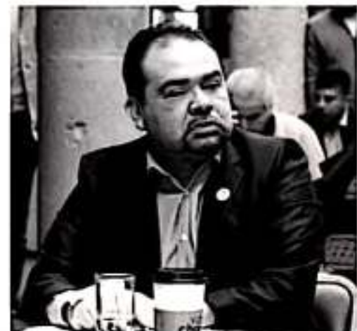
MORELIA, MICH.- El gobierno federal a través de su bancada parlamentaria en San Lázaro, debe reconsiderar los contenidos del proyecto presupuestal para el 2020.

"Al menos esperamos que de aquí al miércoles en que se retomará en el Congreso Federal la sesión para la discusión y análisis final del presupuesto, pueda insertarse de manera clara lo relacionado a la nómina educativa ya que seguimos sin detectar de dónde saldrá el presupuesto que la Federación asegura ya se tiene previsto para Michoacán", dijo.