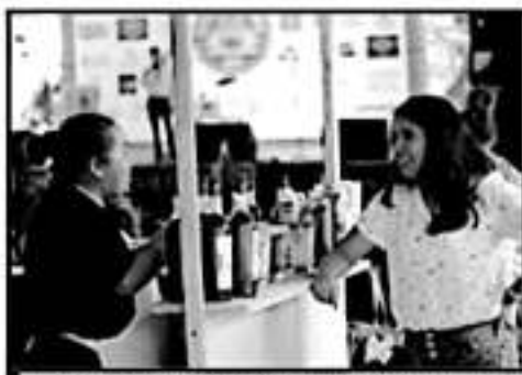
LA CHARANDA ES UN SELLO CARACTERÍSTICO DE LA REGIÓN