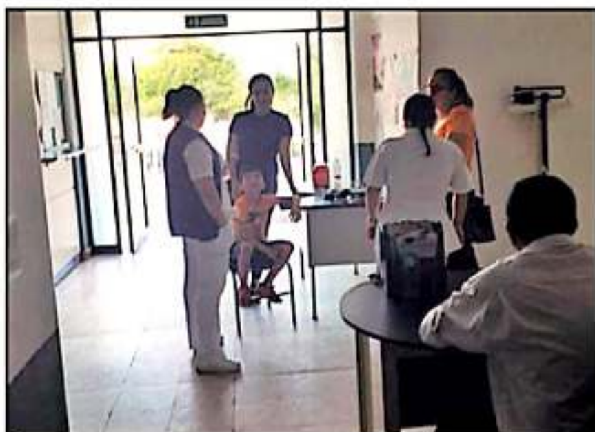
SIN PROBLEMAS NI CONTRATIEMPOS LABORA LA CLÍNICA DE NUEVA ITALIA DURANTE EL PASADO FIN DE SEMANA.

En los últimos días han surgido diversas "fake news" en temas como seguridad, salud e incluso educación, por lo que el esturbo es menor cuando con lo que se publica y se comparte en redes sociales, y mejor tener confianza en medios tradicionales.