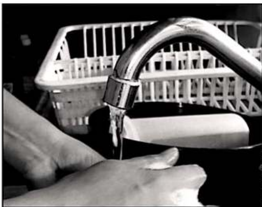
EL INCREMENTO A LA TARIFA DE AGUA POTABLE PARA EL AÑO PRÓXIMO TODAVÍA ES UN TEMA QUE PUEDE RA CONCRETARSE.

incrementaría el costo al servicio medido