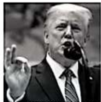
El presidente de Estados Unidos, Donald Trump, en un evento en la Casa Blanca.

de llevarlo a donde tiene que estar. Debería actuar rápidamente, cerrar el acuerdo. ¡Hasta pronto!. Aún no está claro qué fue lo que provocó el enojo de Corea del Norte con Biden, pero el comunicado se dio a conocer luego de que se divulgara un aviso de la campaña del ex vicepresidente en el que condena la política exterior de la administración de Trump. En la pieza se escucha la frase "se elogian dictadores y trancos, nuestros aliados desplazados", y la palabra "trancos" coincide con una imagen del apretón de manos entre Trump y Kim en Singapur, en 2018.