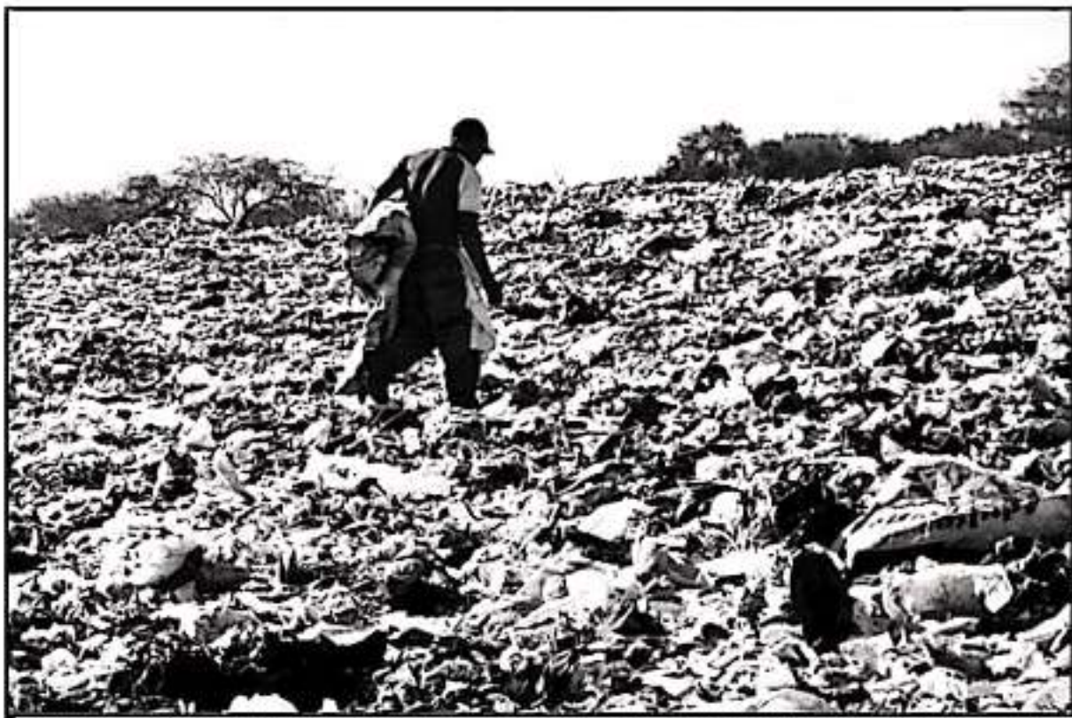
LOS RELLENOS SANITARIOS EN LA MAYORÍA DE MUNICIPIOS MICHOACANOS SE HA CONVERTIDO EN UN GRAN PROBLEMA DEBIDO A UN MAL MANEJO DE RESIDUOS

La situación se ha complicado en diferentes municipios; en años pasados, luego de que la Proam multó al cabildo de Álvaro Obregón y clausuró el relleno sanitario, trajo como consecuencia que los recolectores de basura comenzaran a vender los contenidos de sus camiones en otros puntos, muchos de ellos clandestinos; y además, al aire libre.