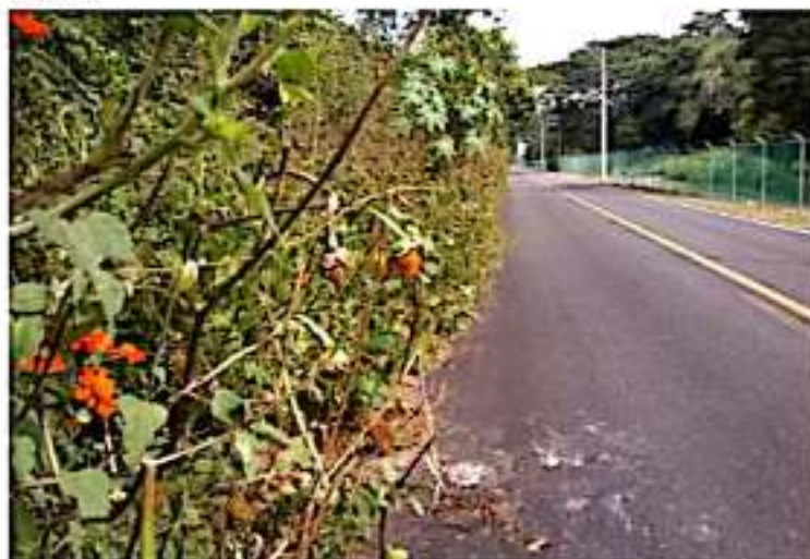
ZIHUATANEJO, GRO.- Esta foto fue enviada como evidencia de lo urgente que es cortar el monte que invade parte de la cinta asfaltada.