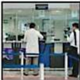
POR SER DÍA FESTIVO LOS BANCOS NO TRABAJARÁN ESTE LUNES

Refirió que la Ley para la Transparencia y Ordenamiento de los Servicios Financieros establece que, en caso de que la fecha límite de un pago corresponda a un día inhábil, el pago podrá llevarse a cabo al día hábil siguiente.