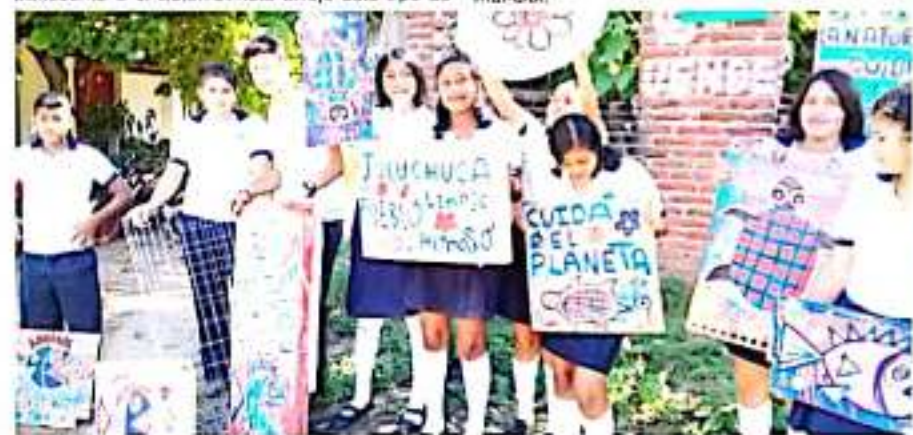
CD. LÁZARO CÁRDENAS, MICH.- Integrantes del Colectivo Azulita buscan emprender el proyecto "Ruta del Reciclaje", con la participación planteles educativos, el ayuntamiento local y sociedad civil.