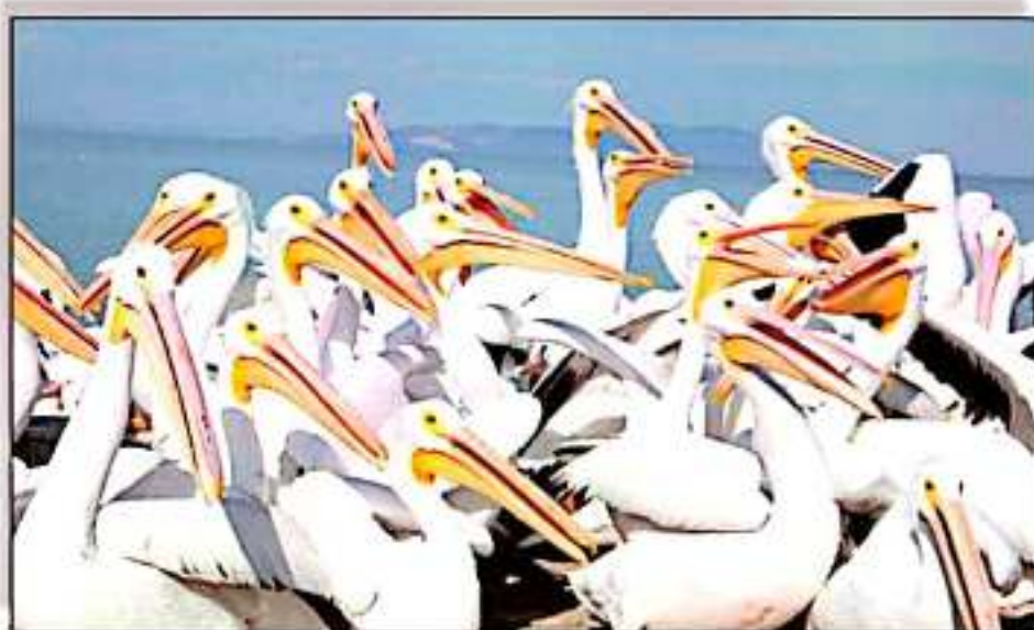
Michoacán bendecido por la Naturaleza: llegan Pelicanos Borregones.