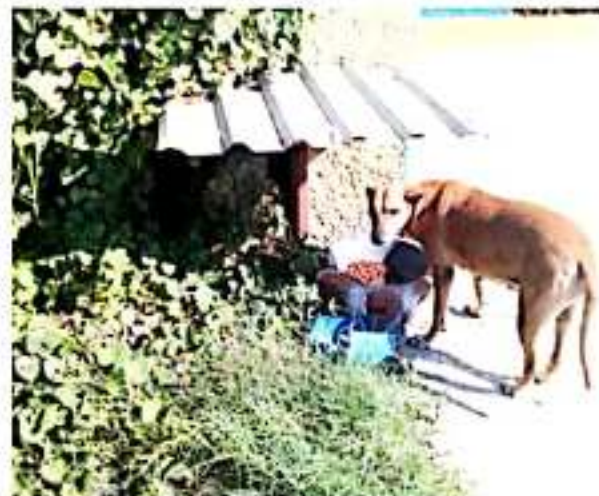
CD. LÁZARO CÁRDENAS, MICH.- Asociaciones protectoras de animales de la ciudad porteña, alertan sobre la probable desaparición "intencionada" de perros callejeros.

Por ello, advierten a la presidencia municipal que, de continuar con este tipo de acciones aberrantes, se manifestarán para que el ayuntamiento esclarezca el paradero de estos perros callejeros, ya que esto no es una solución y se requiere de otro tipo de protocolos para el manejo de perros en situación de calle, y como asociación se dedican intensamente a la esterilización, a alimentarlos y ofrecerles alguna atención médica veterinaria cuando lo requieren, sin apoyo del ayuntamiento, por lo que pronuncian su total rechazo a este tipo de conductas del ayuntamiento local.