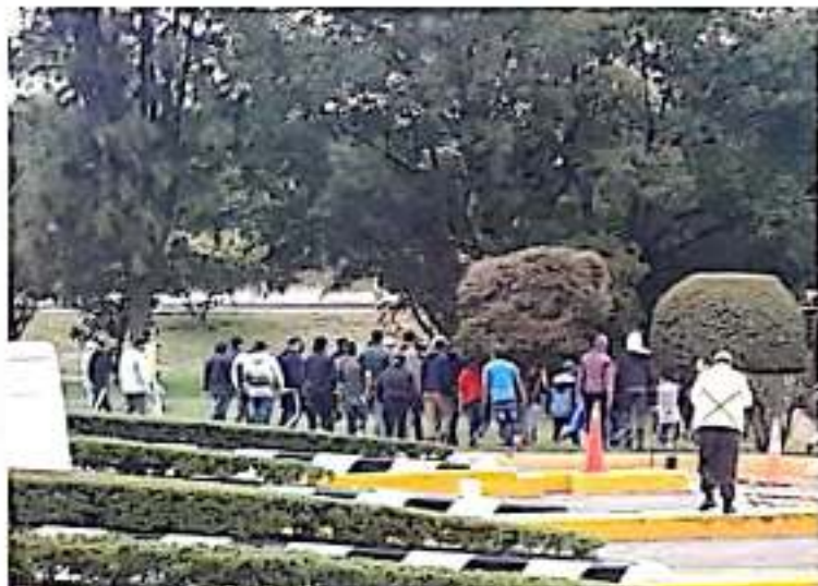
CD. LÁZARO CÁRDENAS MICH.- Durante el fin de semana, agrupaciones sociales y normalistas tomaron casetas en el estado, pidiendo la cooperación de los automovilistas.

Con lo anterior, este asunto queda archivado y resuelto en definitiva, por lo que el síndico municipal no podrá interferir bajo ninguna circunstancia ni mucho menos, en su calidad de representante legal del ayuntamiento, en las atribuciones y facultades del resto de los funcionarios de la administración pública municipal.