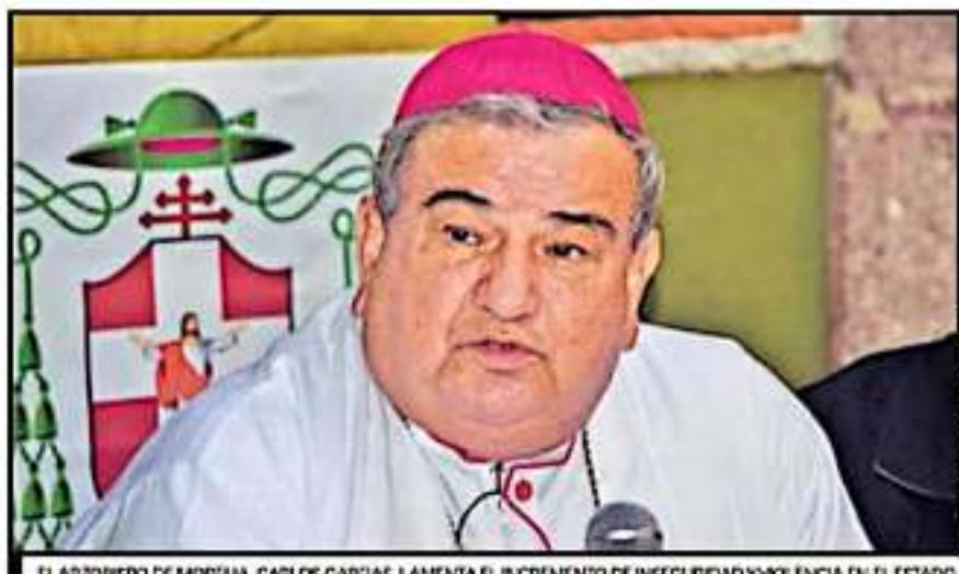
EL ARZOBISPO DE MORELIA, CARLOS GARFIAS, LAMENTA EL INCREMENTO DE INSEGURIDAD Y VIOLENCIA EN EL ESTADO.

"El empeño es que podamos generar un modelo que pueda irse planteando a nivel de otros estados o por regiones en México. He estado en diálogo con el gobernador del Estado de México, con el gobernador de Guerrero, con el gobernador de Michoacán, para implementar alguna forma de Ruta de Paz, así hemos estado pensando llamarle, para tener un plan o programa interestatal, en donde tenemos la intención de involucrar también al estado de Querétaro y de Jalisco y, de ser posible a Querétaro e Hidalgo".