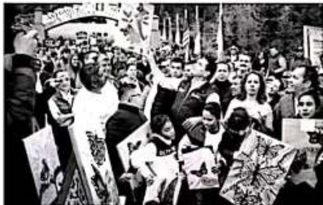
OCAMPO, MICH.- Con el arranque de obras que permitirán mejorar el entorno y la atención a miles de turistas, este sábado el Gobernador Silvano Aureoles Conejo encabezó la apertura de los santuarios de la Mariposa Monarca en la región Oriente de Michoacán.

Además, para garantizar que los turistas tengan una estancia más confortable, el mandatario dio el arranque a la construcción de seis cabinas y un arco perenne en el ejido de "El Rosario".