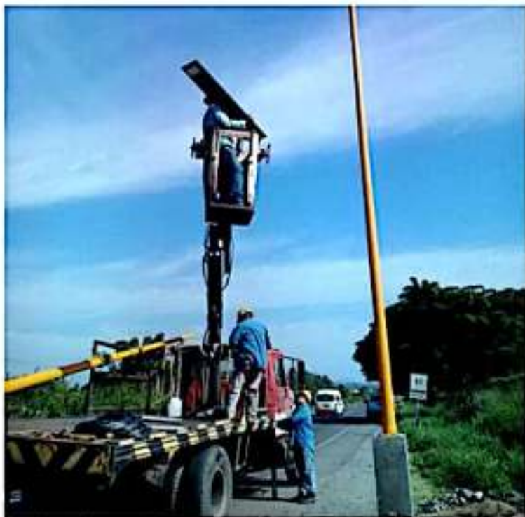
CD. LÁZARO CÁRDENAS, MICH.- Fueron colocadas por el departamento de Alumbrado Público las primeras cuatro de 10 lámparas previstas para la calle Prolongación Morelos.