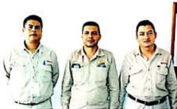
LOS REYES, MICH.- Personal del Área de Vectores, de la SSM, ha redoblado esfuerzos en el combate al mosquito transmisor del dengue.

Los síntomas del dengue son principalmente fiebre por arriba de los 38 grados y dolor de cabeza, dolor retroocular (detrás de los ojos), huesos, articulaciones y músculos, lo que causa limitaciones y discapacidad por algunos días, y si bien no existe vacuna o una cura como tal es posible prevenirlo evitando la proliferación del vector.