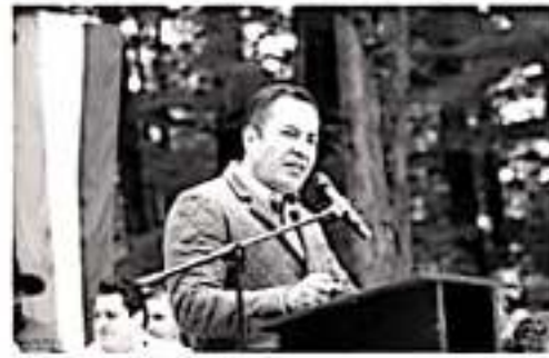
TLAPUJAHUA, MICH.- Desde la Secretaría de Gobierno trabajaremos de manera horizontal, con las y los presidentes municipales para mejorar el desarrollo regional de Michoacán.

rias, hombres y mujeres valientes, como los hermanos López Rayón lucharon por un México justo y celebrar este hecho, es una defensa de la libertad y la soberanía", manifestó. Por último, el secretario de Gobierno resaltó que Michoacán es una tierra rica de tradiciones y gente amable, particularmente mencionó que Tlapujahuá está lleno de tradición artesanal y reconoció la labor de los creadores de las esferas, quienes producen millones cada año en el municipio situado en el oriente michoacano.