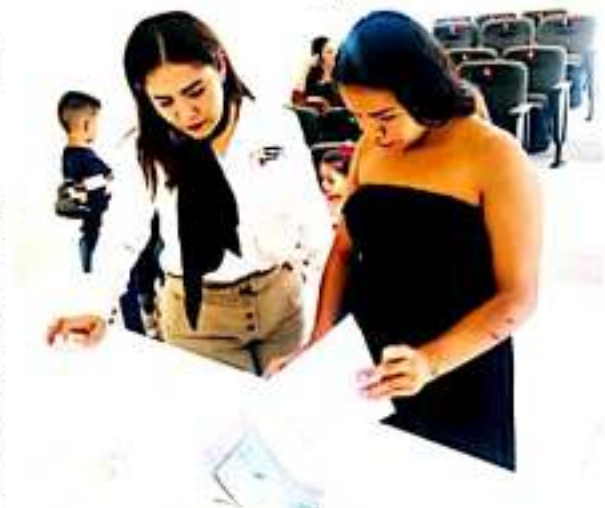
CD. LÁZARO CÁRDENAS, MICH.- La dirección de la Unidad Regional de Servicios Educativos hizo entrega de los apoyos del Programa Nacional de Becas para Madres Jóvenes y Jóvenes embarazadas.

A este proyecto, el cual aún está en proceso y con fecha aún por definir, se sumarán más de 4 universidades, quienes se encargarán de elaborar los cestos de basura, mientras que el ayuntamiento sería el responsable de recolectar diariamente los plásticos generados en cada uno de los más de 50 contenedores que pretenden colocar sobre la referida ruta, con el entendido de que deberán reciclarse para que estos no terminen en los rellenos sanitarios. El Colectivo Azulita invita a la población a sumarse y hacer conciencia sobre el tema del reciclaje, iniciando desde sus hogares, planteles educativos y empresas laborales, pues por el simple hecho de separar este tipo de productos se hace la diferencia en propiciar un mejor entorno ambiental no solo en el municipio de Lázaro Cárdenas, sino se contribuye a nivel mundial.