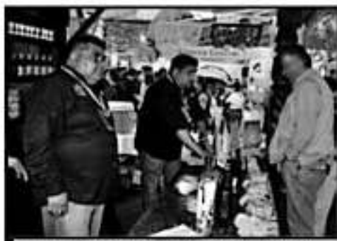
LOS ASISTENTES PUJERON DISFRUTAR DE ESTA BEBIDA

EVENTO EXITOSO FESTIVAL INTERNACIONAL DE CHARANDA