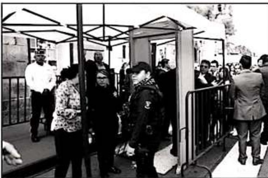
COMO YA ES COSTUMBRE DESDE LOS GRANADAZOS, INSTALARÁN ARCOS DE SEGURIDAD E INSPECCIÓN POLICIAL.

policíacos tomarán la vigilancia a su cargo