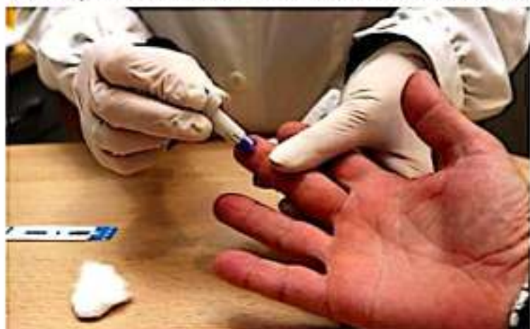
ZIHUATANEJO, GRO.- Habrán pruebas gratis el próximo viernes en la plaza de la "Libertad de Expresión".

Los trabajos se realizan en coordinación con la Jurisdicción Sanitaria 05 de