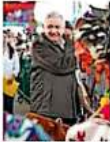
El próximo año se fabricará el camino a la comunidad de la Yesca, de acuerdo con López Obrador.

"Estoy seguro de que esos 260 millones van a aumentar. Y esa es la primera