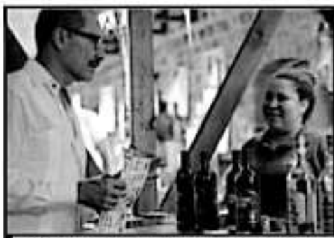
EL FESTIVAL HARÍA SUPERADO DERRAMA ECONÓMICO DE 2018