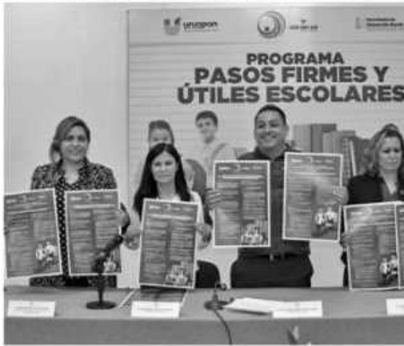
URUAPAN, MICH.- Son programas sociales que forman parte de la Re... aligerar la carga económica a los padres de familia al inicio del ciclo... aproxima.

dos lápices. Mientras que en el de Pasos Fir- mes se apoyará a mil 600 estudiantes de pre- escolar y primaria. El registro de solicitudes Educación, ubica- nas 144, colonia A rario de 8 a 15 ho