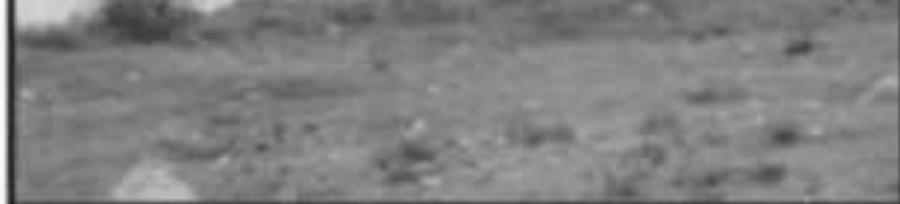
ALGUNAS PERSONAS TAMBIÉN VANDALIZARON Y LE BAJARON EL AIRE DE LAS LLANTAS A UNIDADES DE LOS SERVIDORES.