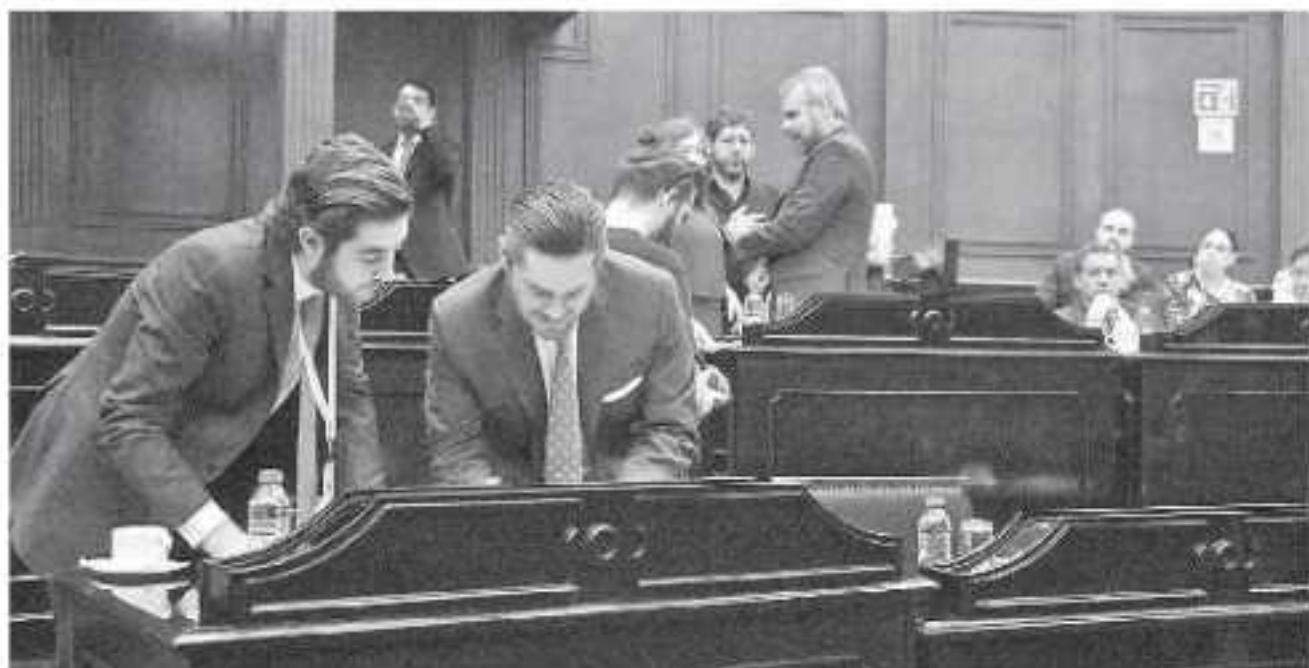
Se realizó un balance de la productividad de los asambleístas de cada grupo parlamentario.