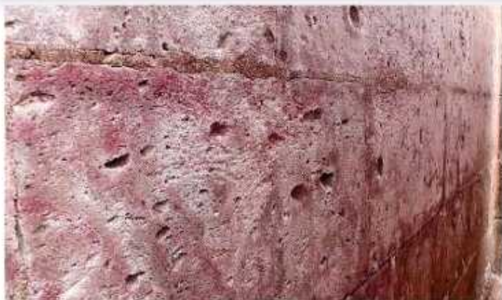
Esta editora constató que la limpieza no se realizó cabalmente. FERNANDO MALDONADO