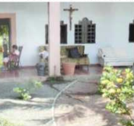
Los ancianos "Bienaventurados los pobres",