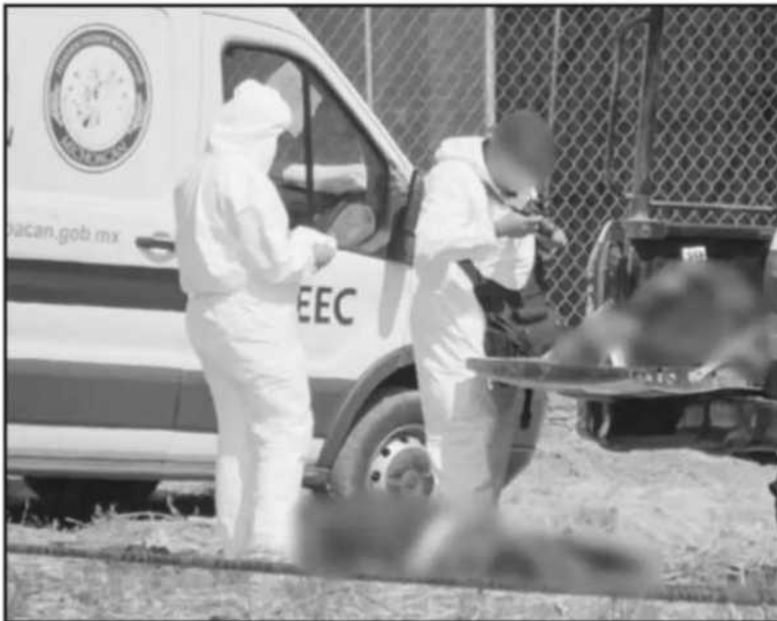
EN ABRIL PASADO EL INTENTO DE ROBO A UNA CAMIONETA DE VALORES DE BANSEFI DERIVÓ EN TRES AGENTES MUERTOS. EL PROG

estado de Michoacán, todavía existe una gran cantidad de adultos mayores que residen en zonas rurales de alta marginación, alejadas de los centros urbanos y que tendrían que trasladarse por horas solo para recibir el pago de los recursos