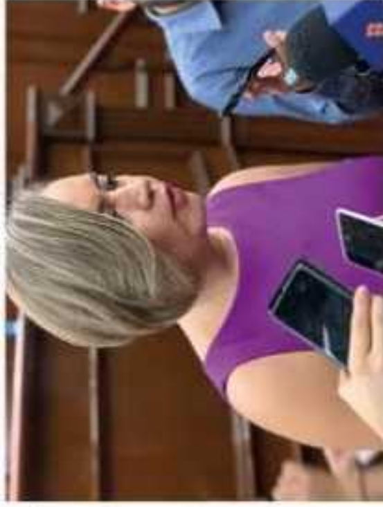
De las 13 iniciativas presentadas, cuatro fueron aprobadas, mientras que algunas ya están en proceso de ser dictaminadas, refirió la diputada del PRI.

La diputada refirió que si bien aún quedan pendientes, seguirán trabajando de la mano con las comisiones responsables de dictaminar las iniciativas que están en la espera de ser avaladas, para que se logre retroalimentarse y hacerse las consideraciones que sean pertinentes, a fin de dar paso a una legislación que impacte de manera directa en el desarrollo de Michoacán y el bienestar de sus ciudadanos.