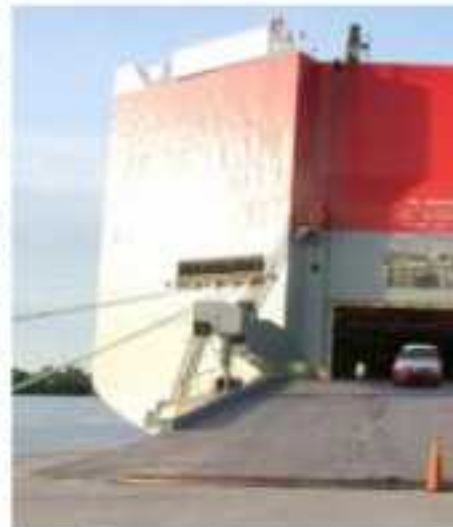
CD. LÁZARO CÁRDENAS, MICH.- El buque Niagara Highway, de la línea K-Line arribó al Puerto Lázaro Cárdenas; proveniente de Japón movilizando 167 unidades de importación de Suzuki y 199 unidades de transbordos a cargo de la agencia Mexshipping.

Este navío, construido por Shipbuilding y botado hace la última de una serie de buques que comenzaron a ser entregados por K-Line, con la entrega del H... La infraestructura portuaria es fundamental en el desarrollo económico de lo que Lázaro Cárdenas tiene como ventaja ya que le permite agilizar las operaciones portuarias y la logística portuaria de mercancías, promoviendo el comercio que ayuda al mantener