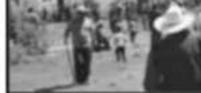
...U GRUPO DE VECINOS DE L REUNIERON CON EL FIN DE R