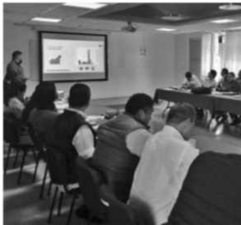
URUAPAN, MICH.- se priorizaron las actividades próximas, con las cooperativas escolares para la expedición de alimentos saludables.