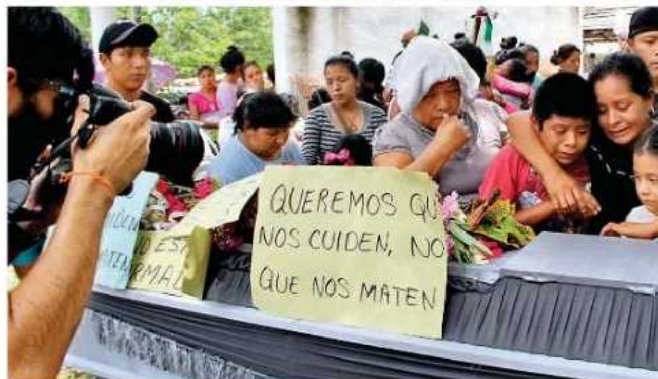
Lo ocurrido en la comunidad de Ostula quedó asentado por la Comisión Nacional de Derechos

del daño hacia seis víctimas, que en su caso tiene que ver con el disparo directo de balas de goma y gases lacrimógenos hacia manifestantes, hecho que viola el protocolo de uso de la fuerza por parte de la entonces llamada Fuerza Ciudadana.