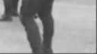
...RON CON EL GRUPO DE IN- CAMBIO DE JEFE DE TENENCIA.