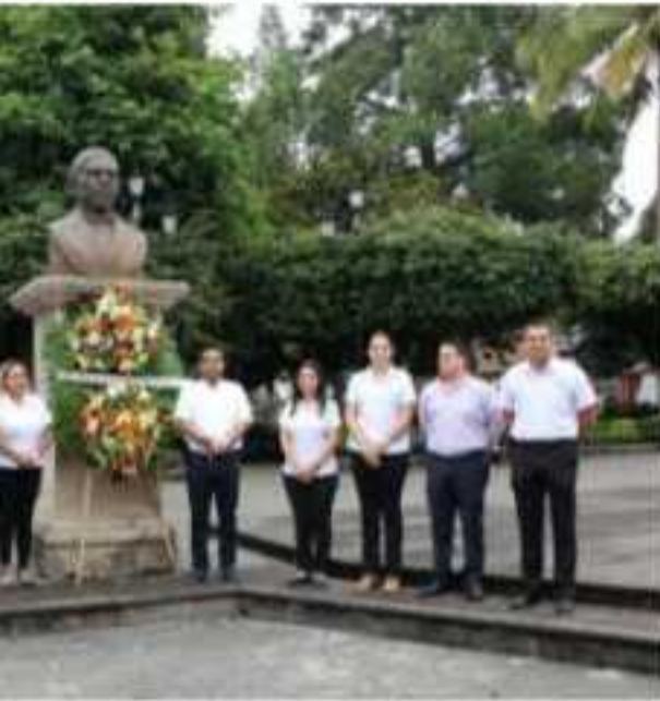
municipales montaron una guardia de honor en diversario luctuoso.

De acuerdo a su biografía, el Benemérito de las Américas falleció a causa de una angina de pecho, a pesar de los esfuerzos de los médicos mexicanos más prestigiados de entonces como Gabino Barrera y Rafael Lucio acudieron a Palacio Nacional a atenderlo, pero nada se pudo hacer.