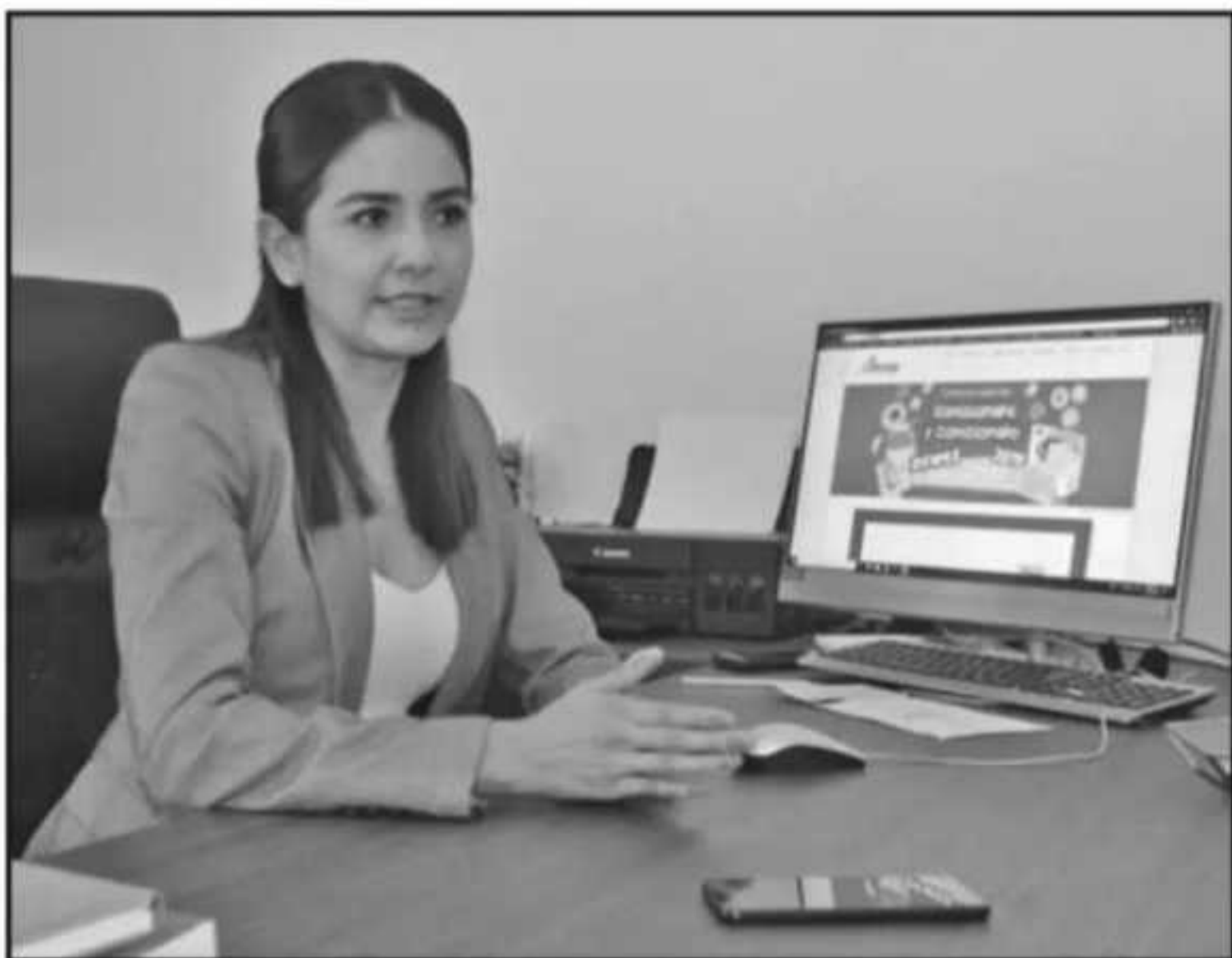
LA PRESIDENTA DEL IMAIP DETALLÓ QUE HAN TENIDO AVANCES SIGNIFICATIVOS EN LA RENDICIÓN DE CUENTAS.

gobierno y otras instancias su- ellos ahora conocen que pueden en atención no a un capricho