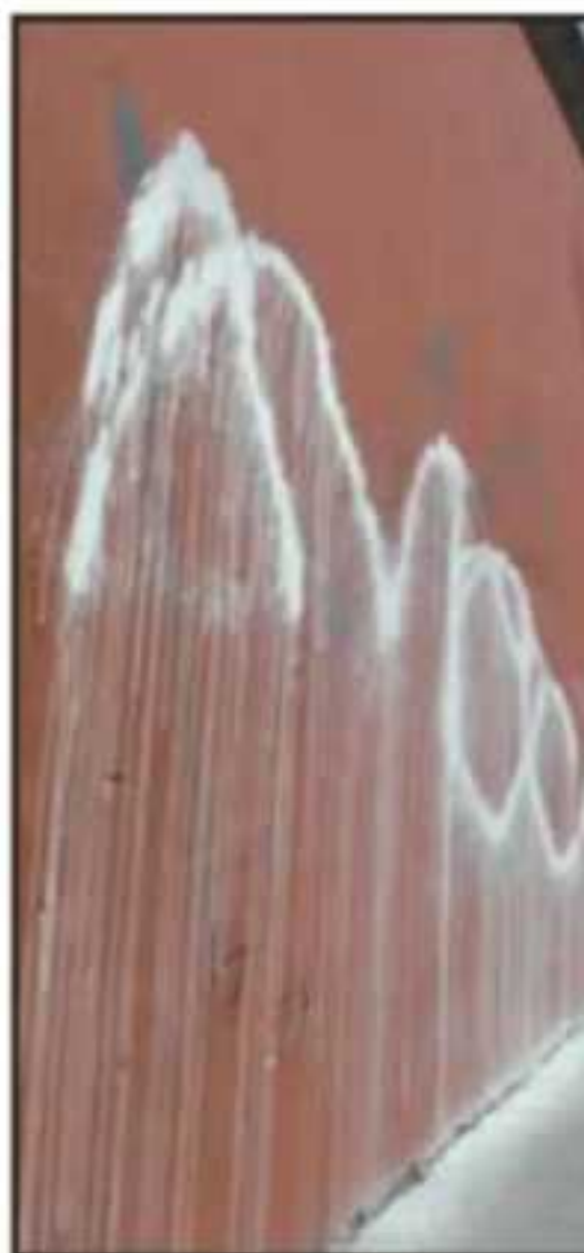
SEGÚN LA AUTORIDAD SON MÁS EDIFI

"Nosotros tendemos fachadas planas únicamente con pintura, cuando es cantería es un procedimiento mucho más largo, mucho más profundo y se tiene que trabajar con el permiso del INAH. En la cantera el número de daños es mucho menor y lo que más les interesa en el sistema de grafiti son los remates visuales, porque les interesa estar al frente o en los remates, son alrededor de 25. Nosotros hemos estado haciendo los permisos y se van limitando poco a poco", explicó la funcionaria en entrevista con medios, tras informar que el daño al inmueble religioso fue atendido en un proceso menor a 24 horas.