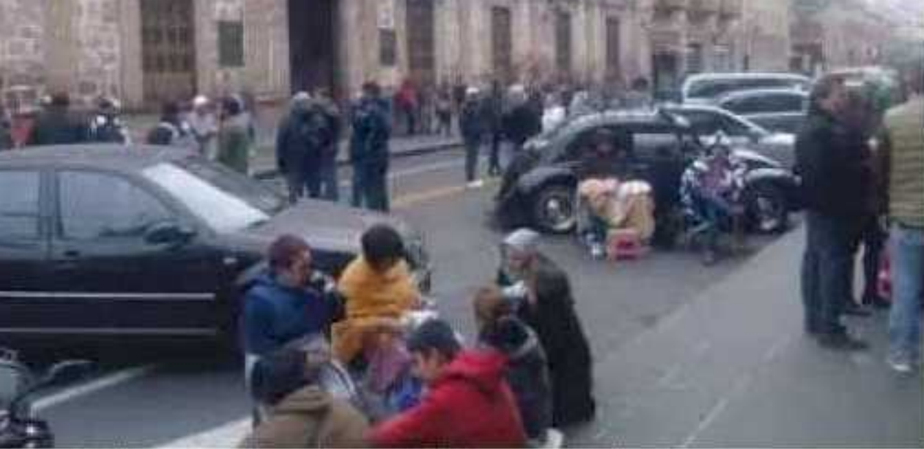
Integrantes del SUEUM se niegan reformar el régimen de jubilaciones y pensiones.

“Siempre se ha mantenido un trato respetuoso, transparente con los sindicatos y en total respeto a la autonomía de la institución”.