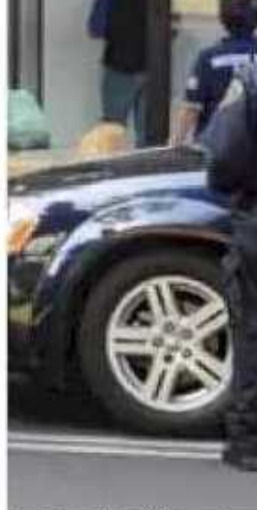
En la época decembrina se incre- más transacciones.

Entre ellos destaca que el Edomex encabeza las inves- tigaciones, con 306 mil 647; la CDMX ocupa el segundo lugar, con 224 mil 369; Gua-