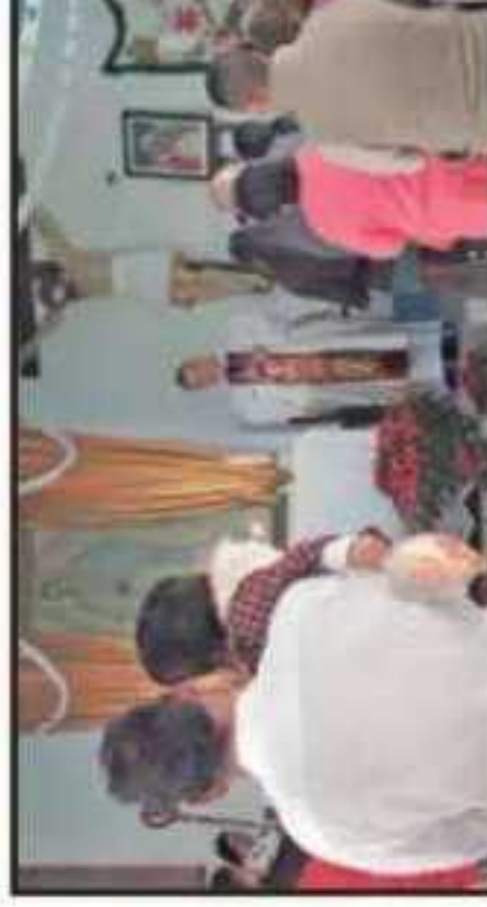
EL ARZOBISPO CARLOS GARRÍAS OFICÓ UNA MISA EN EL CENTRO

FINANCIARIAS Y RELIGIOSAS CONFÍAN EN LOS BUENOS RESULTADOS QUE TRAERÍA LA AMNISTÍA