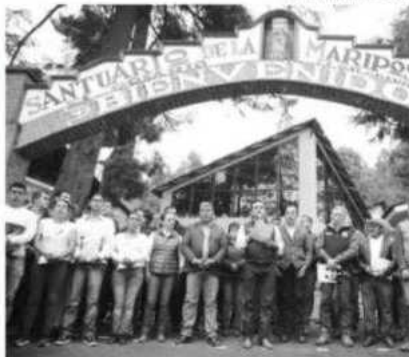
MORELIA, MICH.-Para el periodo 2018 a 2019 se contabilizaron 5,000... das en el área, de las que 4,190 hectáreas fueron impactadas por sequía