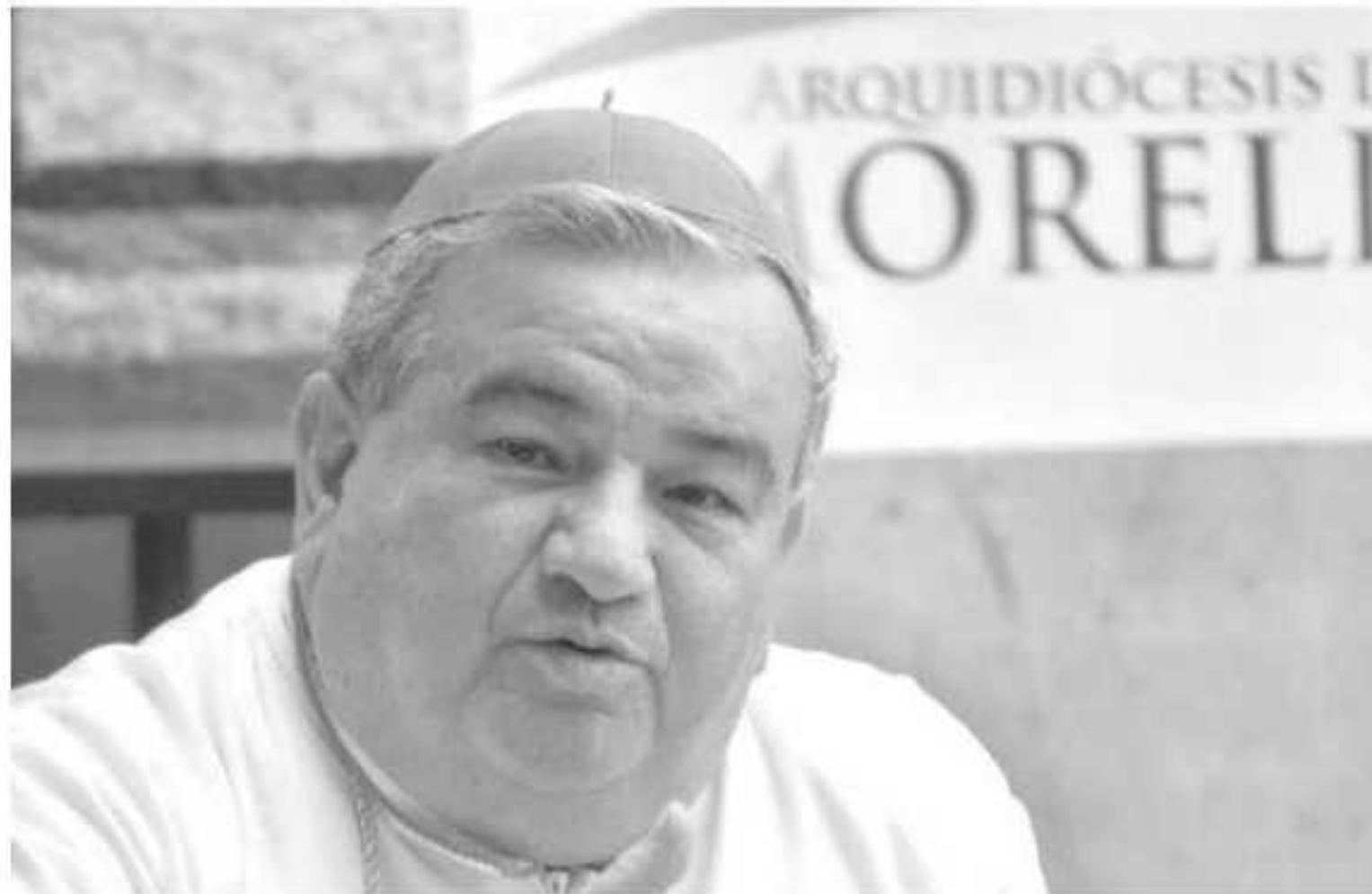
La Iglesia católica criticó la falta de seriedad para atender la estrategia de pacificación, a un año de que se ofreció incluir a todos los cr

tenci... mom... de in... atenc... blac... recl... ca la... el sig... datos