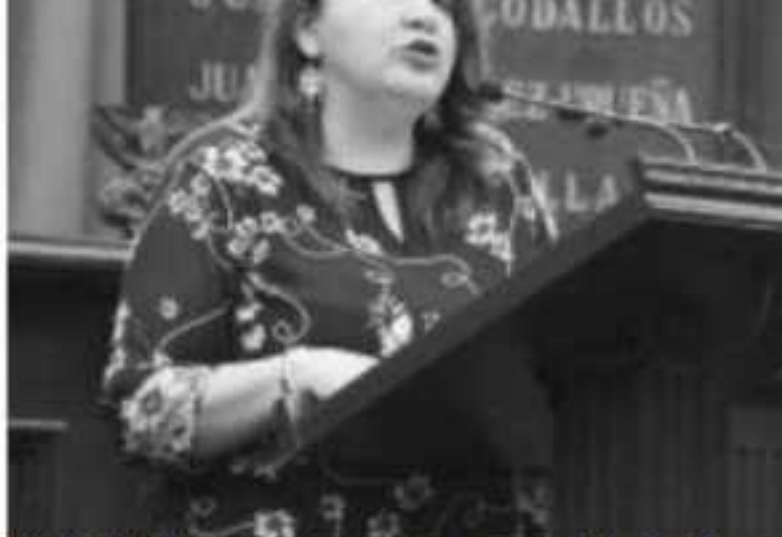
MORELIA, MICH.-El actual momento económico del país y del mundo, así como el cobro de nuevos impuestos en Michoacán, señaló la diputada C...

En tanto, se instruyó a la ASM que en el ámbito de su competencia, contemple una Auditoría al Fondo Estatal para la Infraes- tructura de los Servicios Públicos Muni- cipales (FAEISPM), incluyendo una revi- sión general, legal, financiera, administra- tiva y contable, abarcando todo lo relativo a la situación financiera y presupuestal de dicho fondo. En lo relativo a las Haciendas Municipales, la Comisión solicitó auditoría de obra pública para los municipios de Huiramba, Zacapu, Zinapécuaro y Tarímbaro; una auditoría financiera a las ya contempladas al ayuntamiento de Coeneo, Copándaro, Tumbiscatio,