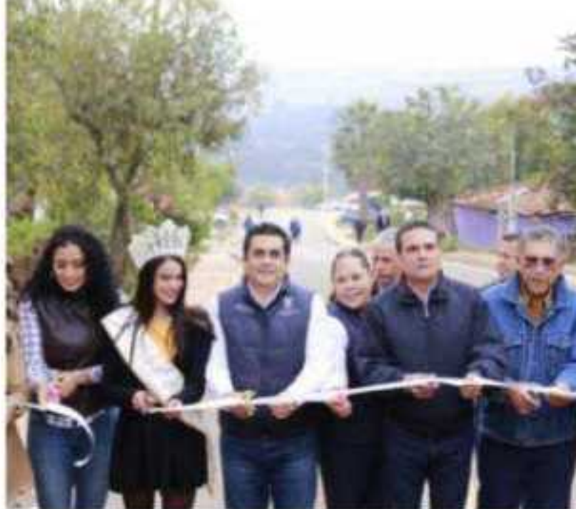
SAN ISIDRO, MPIO. DE COJUMATLÁN DE RÉGULES, MICH.- Con un peso, ayer inauguró el gobernador Silvano Aureoles la carretera comunicará a los municipios de Cojumatlán de Régules y Marco

Los trabajos que realiza el gobierno del estado a través de la Secretaría de Comunicaciones y Obras Públicas (SCOP), son parte del esfuerzo para modificar los indicadores de acceso a los servicios básicos de la población.