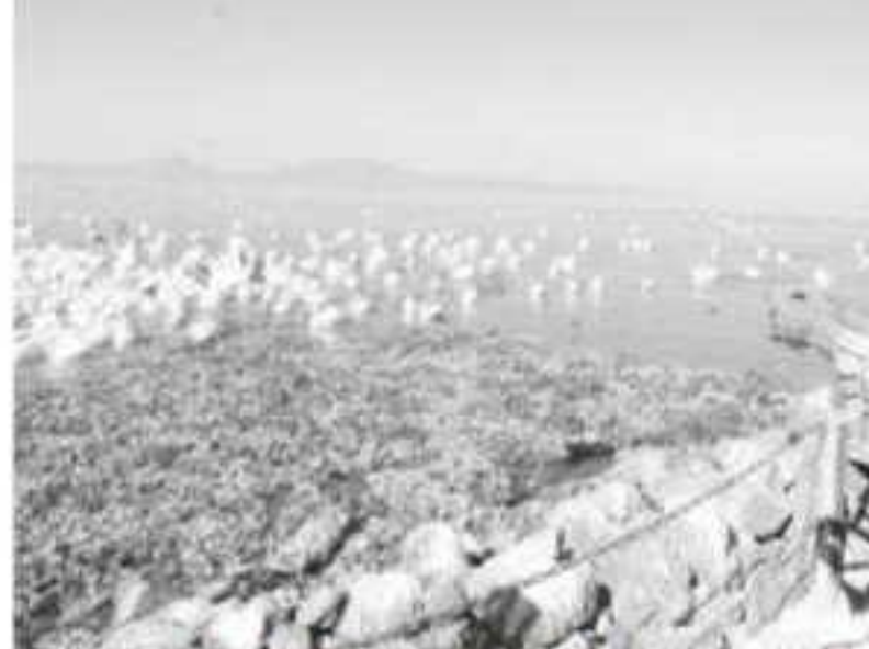
PETATÁN, El mandatario invitó a la población a vivir la experien- michoacana, hecha por gente buena y hospitalaria