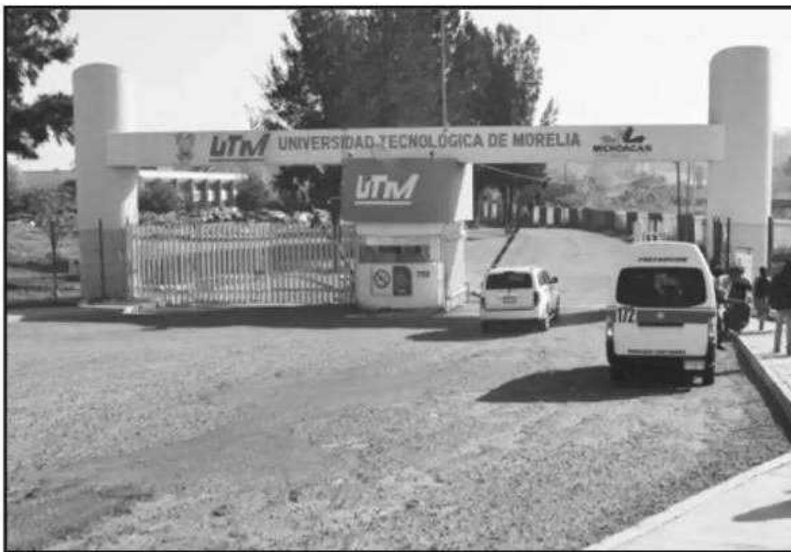
TRABAJA CON "NÚMEROS ROJOS" LA UNIVERSIDAD TECNOLÓGICA DE MORELIA. RECONOCE LA SEE, PERO BUSCAN SANEAR LA

Toda esta semana hemos estado en gestión de los recursos y dialogando con los representantes gremiales