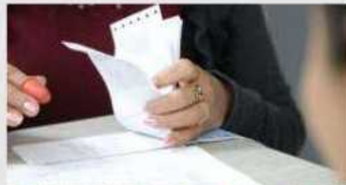
CD. LÁZARO CÁRDENAS, MICH.- La CNTE anunció

H.- Coordinadora Nacional de Educación (CNTE)