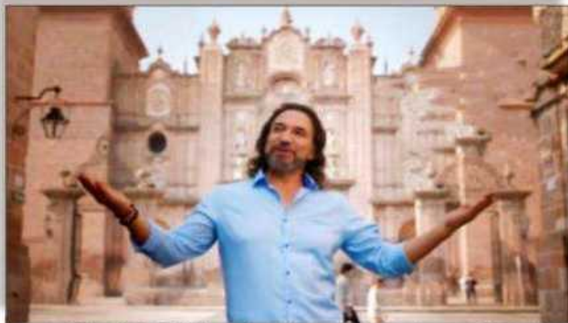
La sencillez de El Buki lo catapulta en preferencias a gobernador.

Giga Watts hora. De su red de abastecimiento depende la capital de Michoacán, Morelia... Durante ese evento, en su mensaje, el gobernador reiteró su agradecimiento al presidente López Obrador por su respaldo para resolver la federalización de la nómina educativa y establecer a través de la Secretaría de Hacienda y Crédito Público una ruta que da certeza de pago a las y los maestros del estado. "Mi más sincero agradecimiento por el trabajo que hemos venido realizando para la federalización de la nómina, porque por primera vez un presidente de la República retomó el asunto para poner fin a la situación de las y los maestros michoacanos", subrayó el mandatario estatal... Por su parte, López Obrador recalcó que en adelante la educación del país y con el apoyo de los propios maestros y maestras, impulsará el desarrollo de la Nación. Dijo que su gobierno "ha rectificado el rumbo del sector educativo", empezando por derogar lo que consideró la "mal llamada Reforma Educativa"... En su mensaje, el presidente de México también señaló que al igual que su gobierno "está