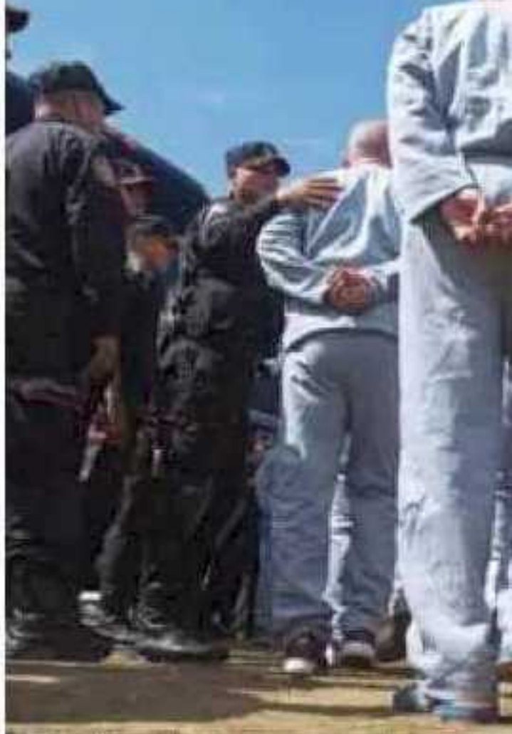
En el estado hay en total 11 penales con una población de más de

La propuesta del gobierno federal señala que las personas a quienes beneficie la Ley no podrán ser, en lo futuro, detenidas ni procesadas por los mismos hechos que ya fueron perdonados, y busca liberar a personas indiciadas, procesadas o sentenciadas con abstrac-