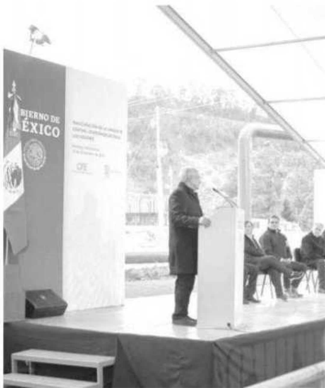
El diputado de Morena tras acompañar al presidente a la inauguración de la Unidad 18 Central Geotermoeléctrica «Los Azufres».

«El plan de desarrollo que el presidente de la República tiene para la CFE y Pemex, debe ser valorado y respaldado por todos los sectores y niveles de gobierno, pues sólo se garantizará la defensa de nuestra soberanía nacional», finalizó.