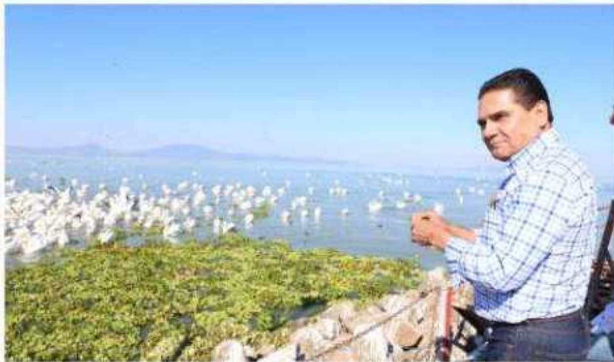
PETATÁN, MPIO DE COJUMATLÁN DE RÉGULES, MICH.- El espectáculo que ofrecen los pelícanos borregones en la isla de Petatán, es una de las ofertas turísticas más emblemáticas de Michoacán, constató el gobernador, Silvano Aureoles Conejo.

ó en Cojumatlán de Régules, el ción a vivir la experiencia de la echa por gente buena y hospi- cibir a visitantes nacionales e os abiertos y una variedad de