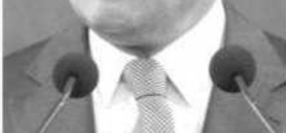
Silvano Aureoles Conejo.