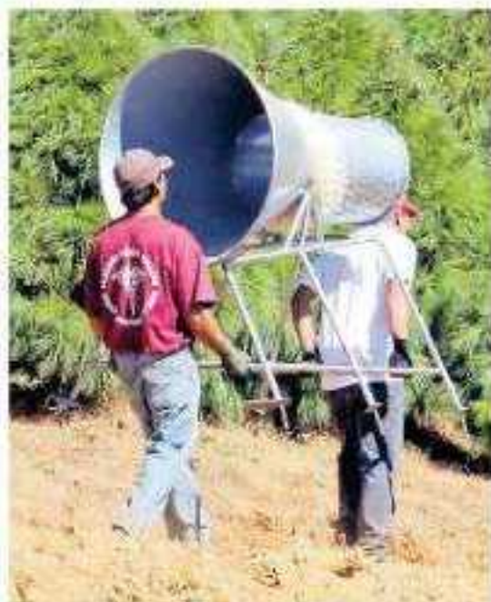
En México 3.44 millones de trabajado-

A nivel nacional, el ingreso mensual de la población ocupada es de 6 mil 405 pesos de enero a septiembre; para