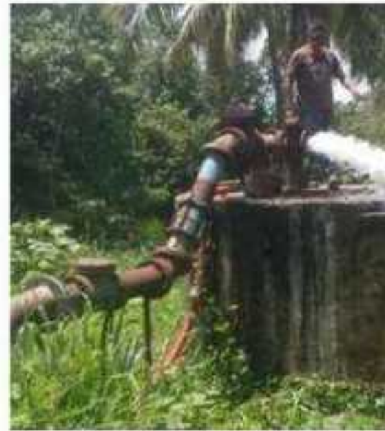
CD. LÁZARO CÁRDENAS, MICH.- Será pa tenencia de La Mira tendrá nuevo pozo de a