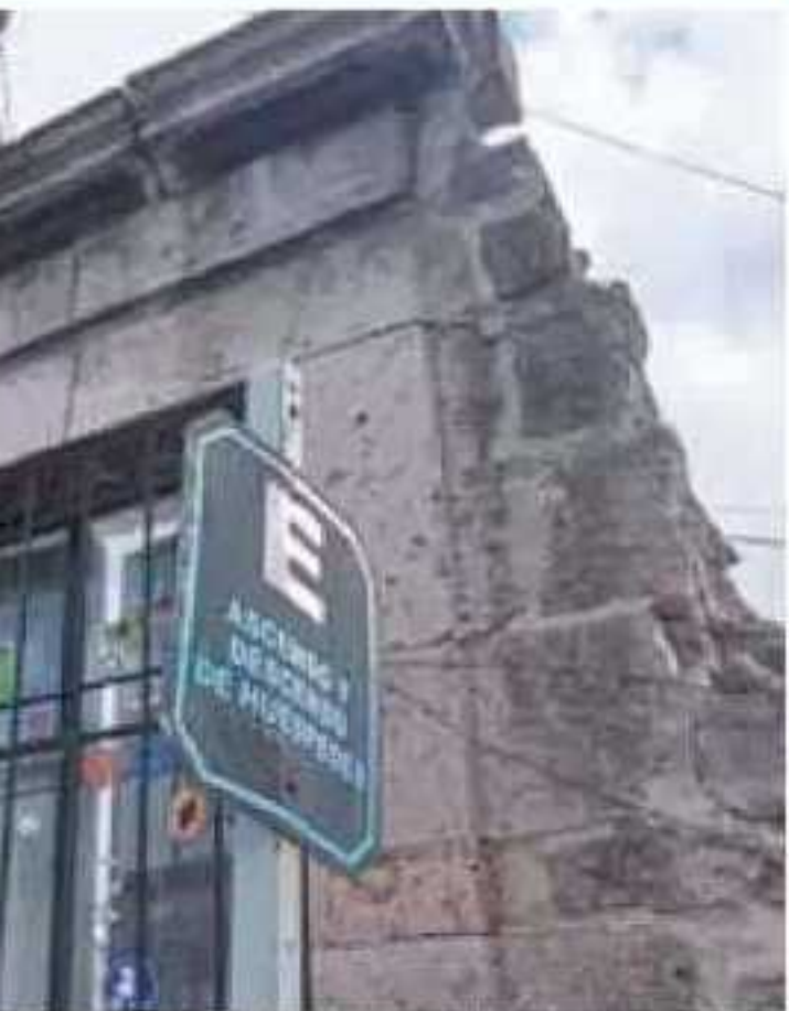
Los autores hacen un llamado a los dueños de los inmuebles a realizar acciones de conservación.

En sus conclusiones, el investigador señala que "el proceso de conservación del patrimonio edificado, incluso de aquel de propiedad privada, debe ser viable como modelo de desarrollo urbano solamente si genera beneficios colectivos y cumple con la función social que se le atribuye como palanca del desarrollo regional y en el combate a la pobreza; lo cual justifica no sólo la intervención del Estado, sino también las inversiones públicas que se requieren".