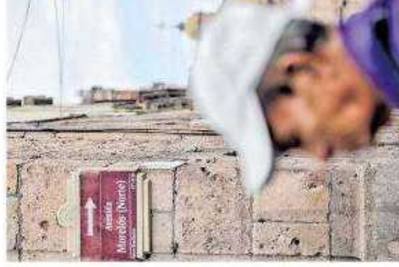
En el Sector República está compo- nido el Sector Norte / CARMEN HERNÁNDEZ

El Sector Nueva España es el área com- prendida entre la Avenida Francisco I. Madero Oriente y la Avenida Morelos Sur; el Sector Independencia, es el área com- prendida entre la Avenida Francisco I. Madero Poniente y la Avenida Morelos Sur; Sector República, es el área compren- dida entre la Avenida Francisco I. Madero Poniente y la Avenida Morelos Norte y el Sector Revolución, es el área compren- dida entre la Avenida Francisco I. Madero Oriente y la Avenida Morelos Norte. Mien- tras que aquellas calles que se encuentran