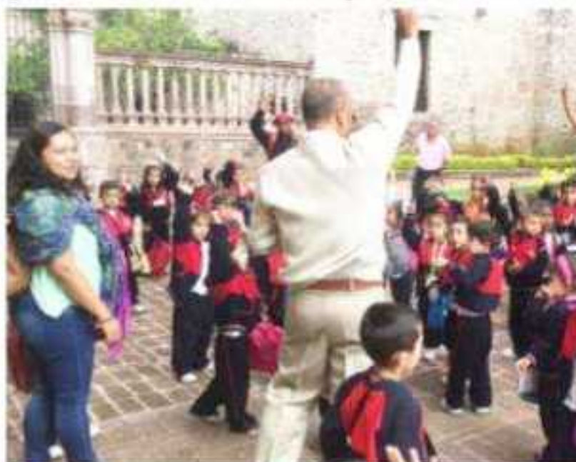
MORELIA, MICH.- Importante la colaboración y estrechamiento de la cultura.

Para cerrar la jornada de conferencias, presentaciones, conversatorios, lecturas, talleres y representaciones artísticas, se llevó a cabo una venta especial con descuentos, donde se encontraron libros desde los 25 y 50 pesos hasta los mil.