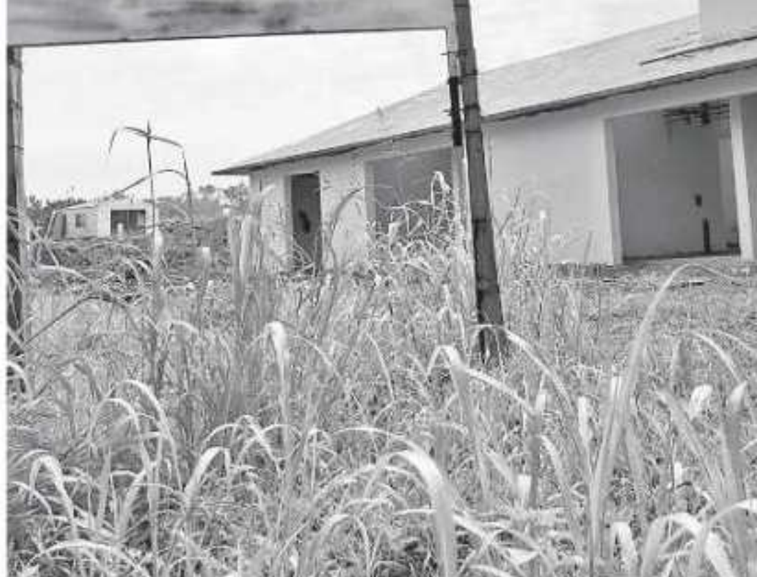
El espacio albergará a estudiantes de las áreas de la Salud para realizar prácticas

La obra, que inicialmente se preveía concluir en 2018, inició el 23 de febrero del año pasado cuando autoridades universitarias, locales y del Instituto Mexicano del