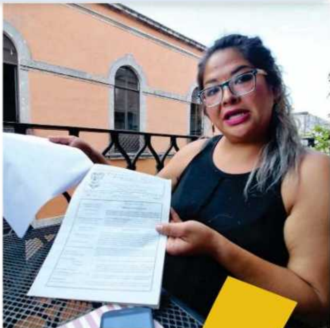
La CEDH quiso carearla con sus agresores; hasta el momento no se ha concretado

... vista que la Procuraduría... aplicación del Protocolo... rma internacional para