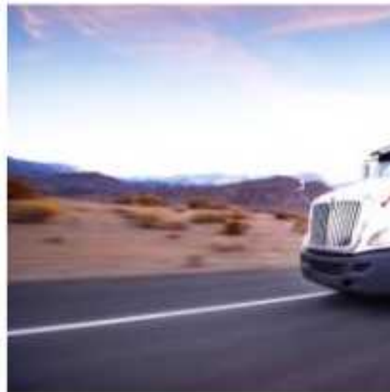
CD. LÁZARO CÁRDENAS, MICH.- El pro Lozano Herrera, señaló que no es prior como para el concesionario de la autopista tramo carretero de Pátzcuaro a Lázaro Cárdenas.

Cerraría el presidente de la Atlac exponiendo también el mal estado de la "Siglo XXI", la cual queda de manifiesto en ni siquiera contar con agua en los sanitarios.