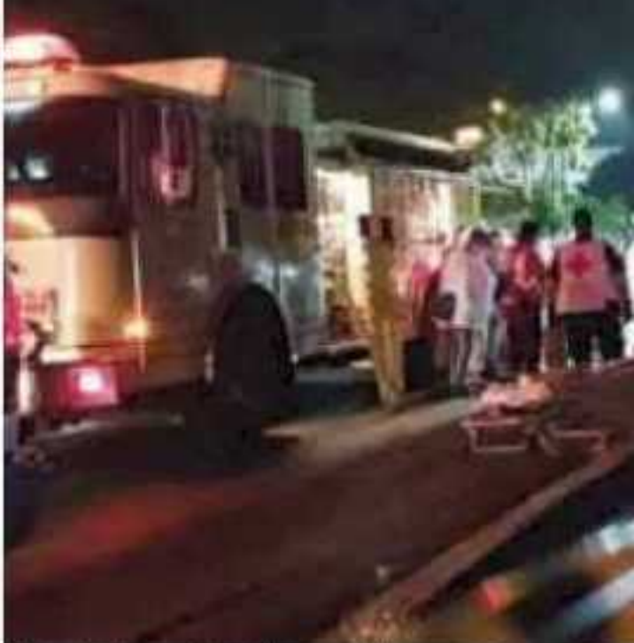
El actual Código Penal aienta la impunidad y no contribuye a promover

El artículo 137 del Código Penal, referente a homicidio o lesiones culposas con motivo de tránsito vehicular, estipula que "se impondrá la mitad de las penas previstas en los artículos 117 y 125, respectivamente, cuando se den los siguientes casos: el sujeto activo conduzca en estado de ebriedad o bajo el influjo de