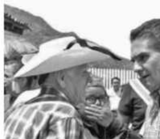
SAN MIGUEL CANARIO, MPIO. DE TIQUICHE continúa con la transformación de los Cent población servicios médicos de calidad.

Además, señaló que en el muni- cipio se han invertido 100 millones de pesos para transformar un total de 15 Centros de Salud.