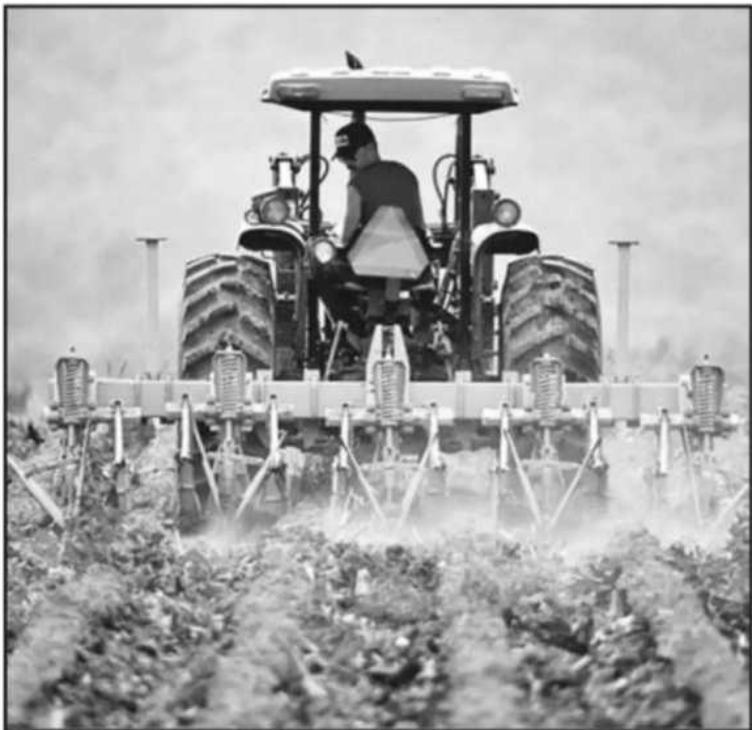
LA META ES DEJAR DE LADO LOS INDUSTRIALIZADOS PROCESOS AGRÍCOLAS, ESPECIALMENTE EN MONOCULTIVOS.

mado regiones enteras para la producción de alimentos, y a partir de esto es que nace de la gran necesidad de conservar la biodiversidad. Otra parte importante son los servicios ecosistémicos que no se toman en cuenta más la decisión