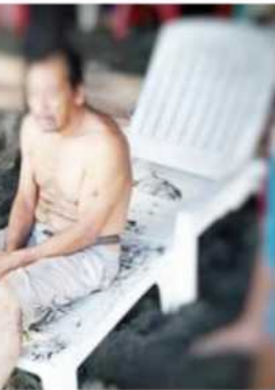
Gracias a la oportuna intervención de los salvavidas y de las corporaciones que trabajan de Operativo de Verano 2019, se ha logrado tener el saldo blanco en las playas del municipio.