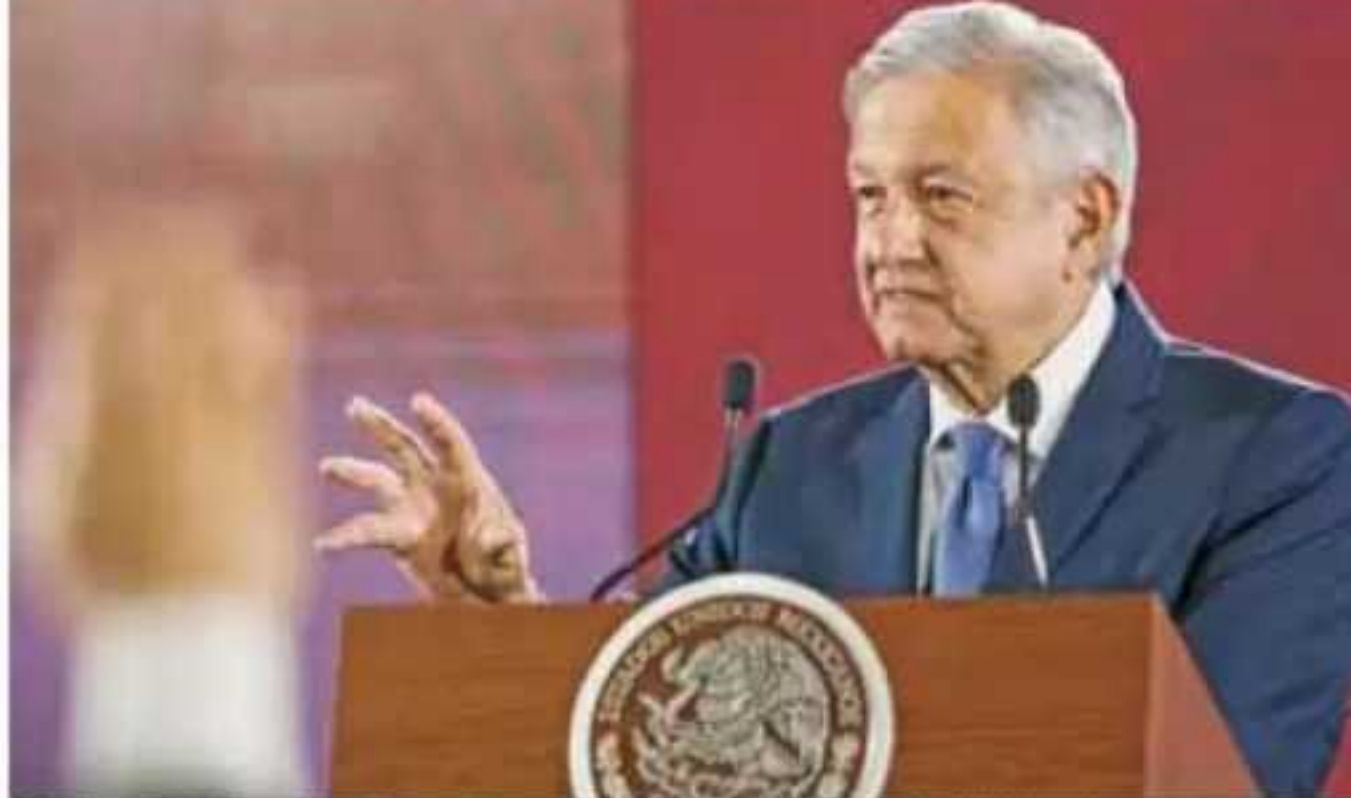
El mandatario sólo hizo referencia directa de Guanajuato, Jalisco, Baja California, Estado de México y Veracruz.

tando elementos para tener más presencia y esto nos va a ayudar; pero si estamos constantemente viendo dónde hay más incidencia delictiva", afirmó el mandatario.