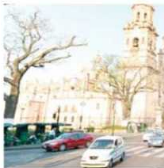
MORELIA, MICH.- El diputado del PAN, A... una reforma de Ley que plantea derogar l... vehicular.

El vicecoordinador del Grupo Parlamentario del albiazul en el Congreso Local, cuestionó el doble discurso del Ejecutivo, esto al señalar que el gobernador primero dice una cosa y luego otra. "Yo recibí al titular de la Secretaría del Medio Ambiente, Cambio Climático y Desarrollo Territorial (Semaccdet) por una propuesta de que se derogue la verificación vehicular.