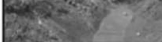
SE HAN ATENDIDO DIVERSAS COLONIAS LIMPIANDO ARROYOS Y AFLUENTES PARA EVITAR...