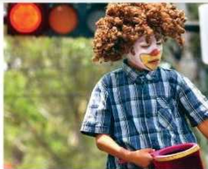
El Dif descartó registro de violencia en niños rescatados