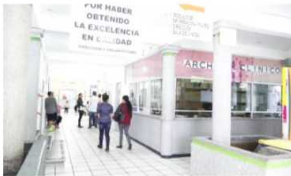
APATZINGÁN, MICH.- Como parte de los procesos para lograr una certificación en calidad de servicios e infraestructura, se inició la verificación de algunos centros de salud de la Secretaría de Salud en el Valle de Apatzingán.

En las tres instituciones se sigue brindando atención a todo el público que acuda a ellas para recibir medicamentos, así como otros tipos de servicios o la atención de distintas especialidades. En cada una de las instituciones se tiene un responsable y con los conocimientos necesarios para la atención que se requiera.