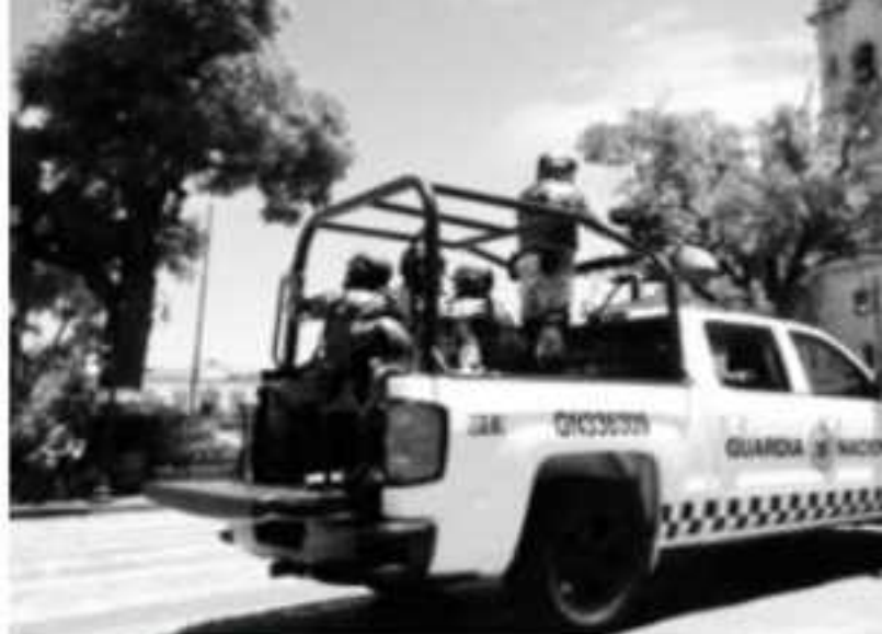
MORELIA, MICH.- El Instituto Estatal de Estudios Superiores en Seguridad Pública (IEESSPP) participa en la capacitación de elementos de la Guardia Nacional.