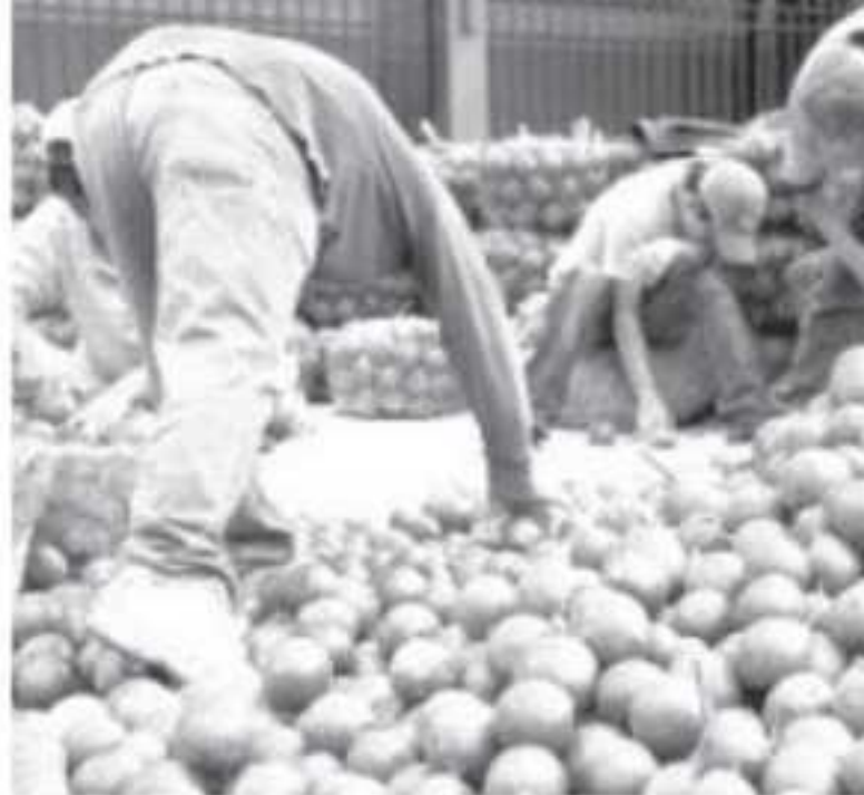
El productor gasta 10 pesos en producir un kilo de aguacate; el kilo, esto quiere decir que no es negocio.