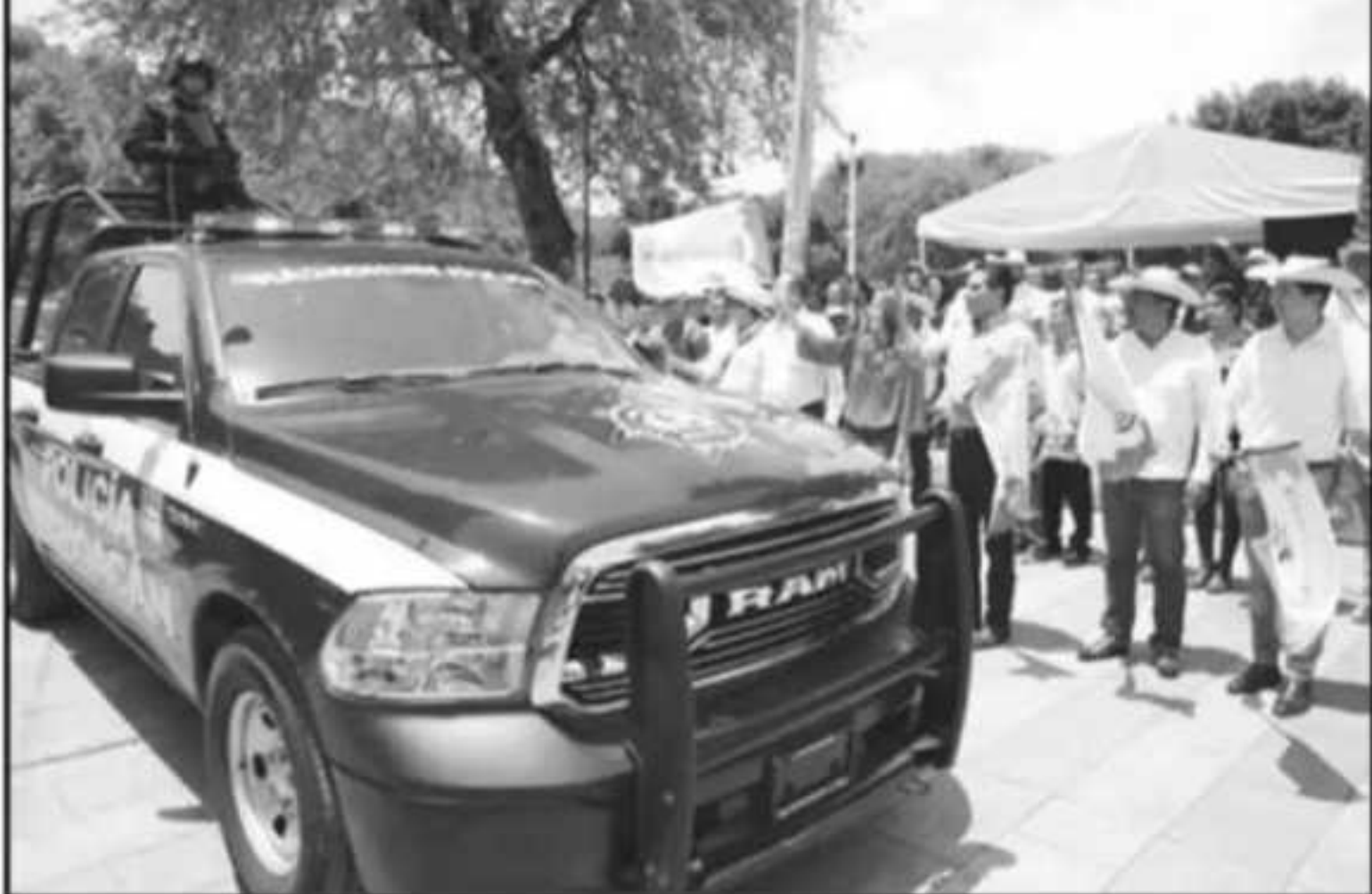
SE INTEGRARON 19 ELEMENTOS DE LA POLICIA CERTIFICADA A TUZANTLA Y SE LES DOTÓ DE EQUIPO Y UNIDADES.