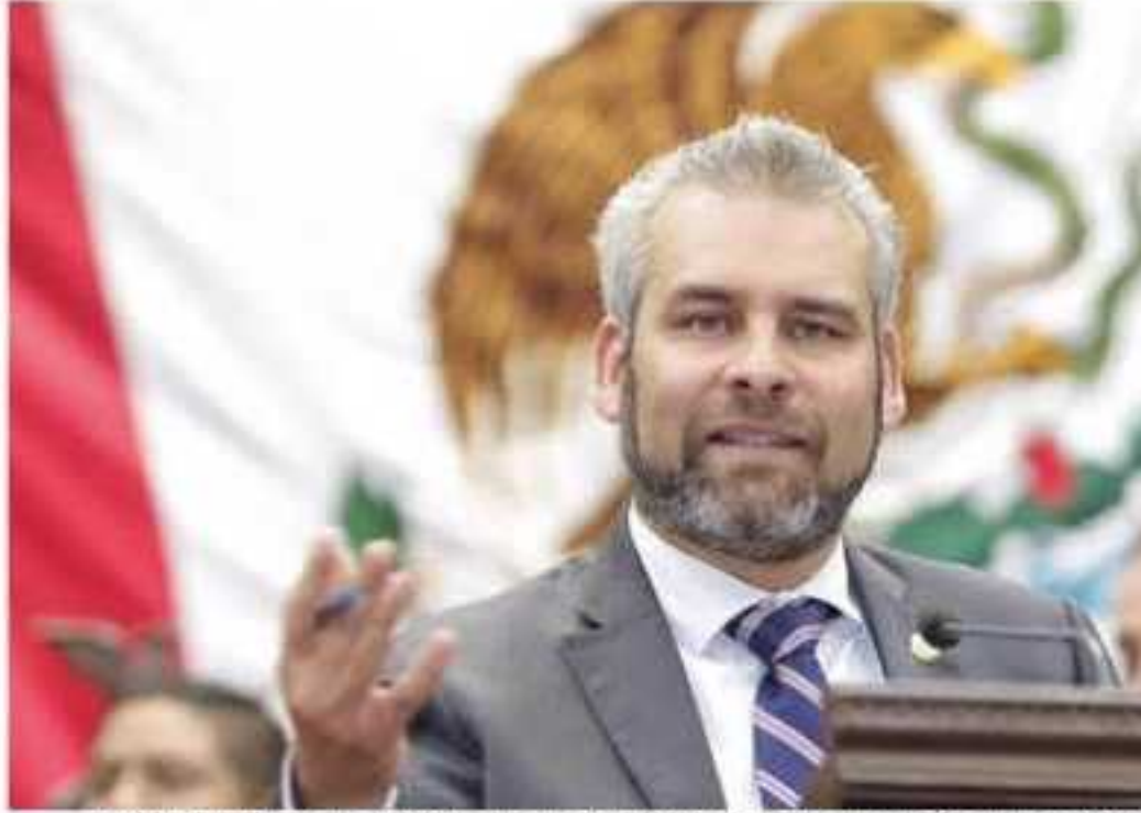
Alfredo Ramírez Bedolla, integrante del grupo parlamentario de Morena en la 74 Legislatura local.

Ataque a balazos dejó como saldo dos hombres muertos y tres lesionados.