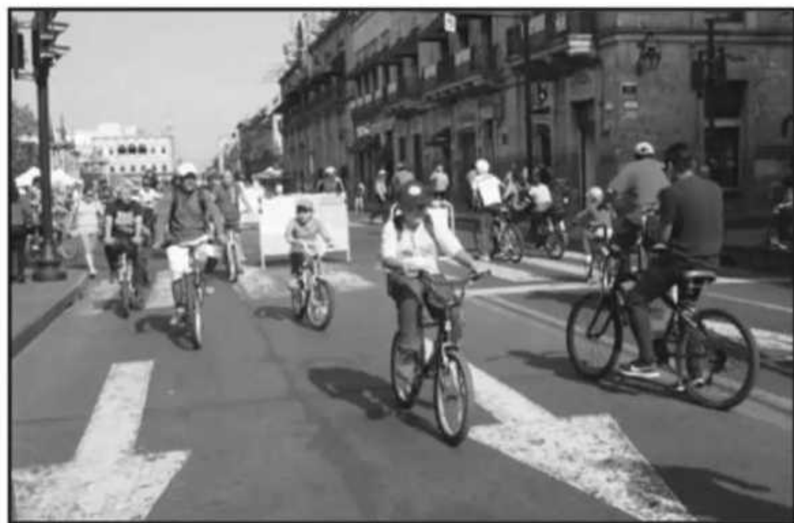
LOS PASEOS DE DOMINGO EN BICI SE HAN VUELTO MUY CONCURRIDOS. UNA DE LAS ACTIVIDADES FAVORITAS DEL DÍA.