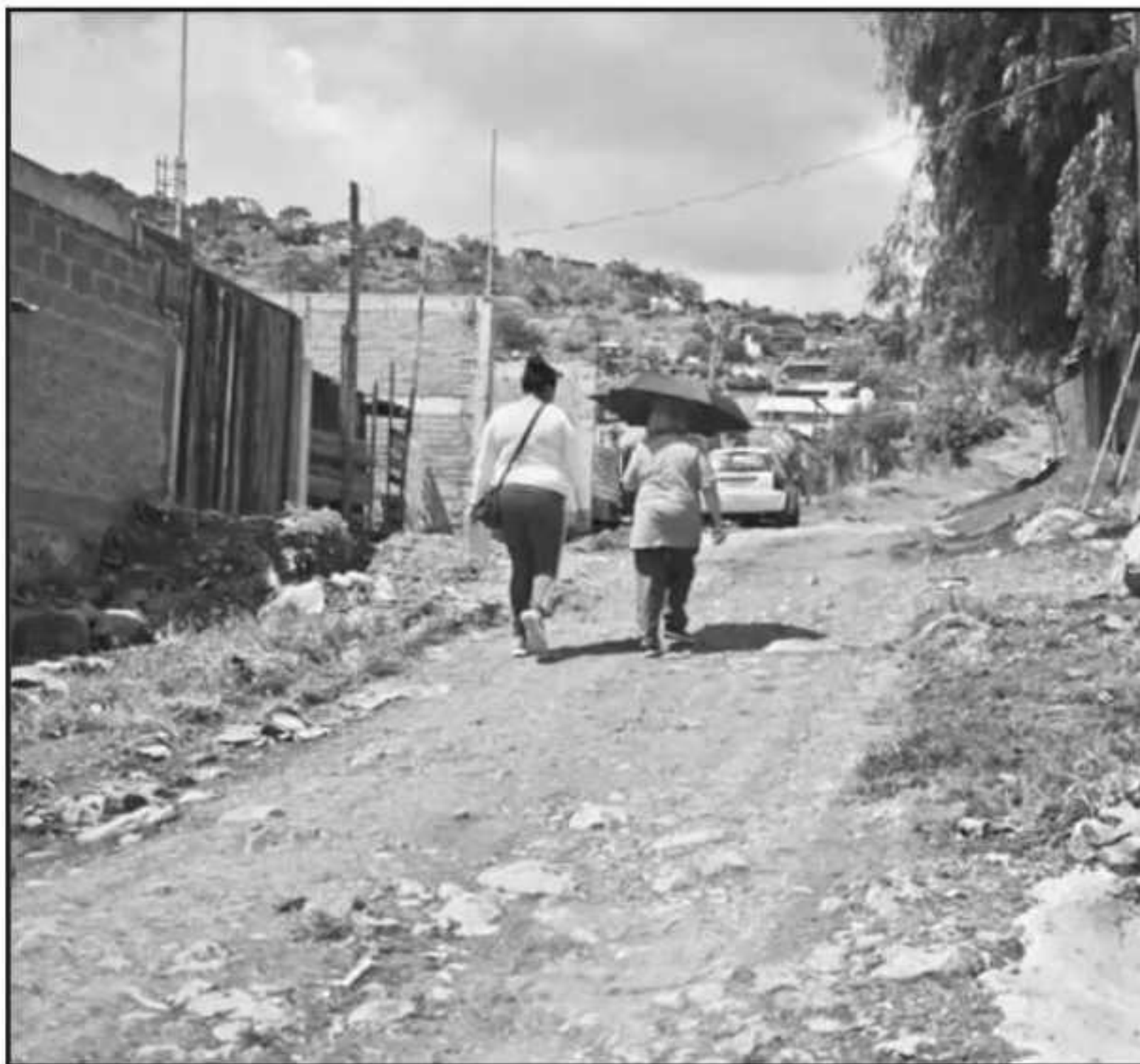
MILES DE FAMILIAS SE ENCUENTRAN EN ZONAS DE RIESGO, POR LO QUE BUSCARÁN LLEGAR A UN ACUERDO PARA QUE SEAN

zonal es que genera un problema de movilidad a quienes se van a vivir a esas colonias y tenemos que buscar alternativas”.