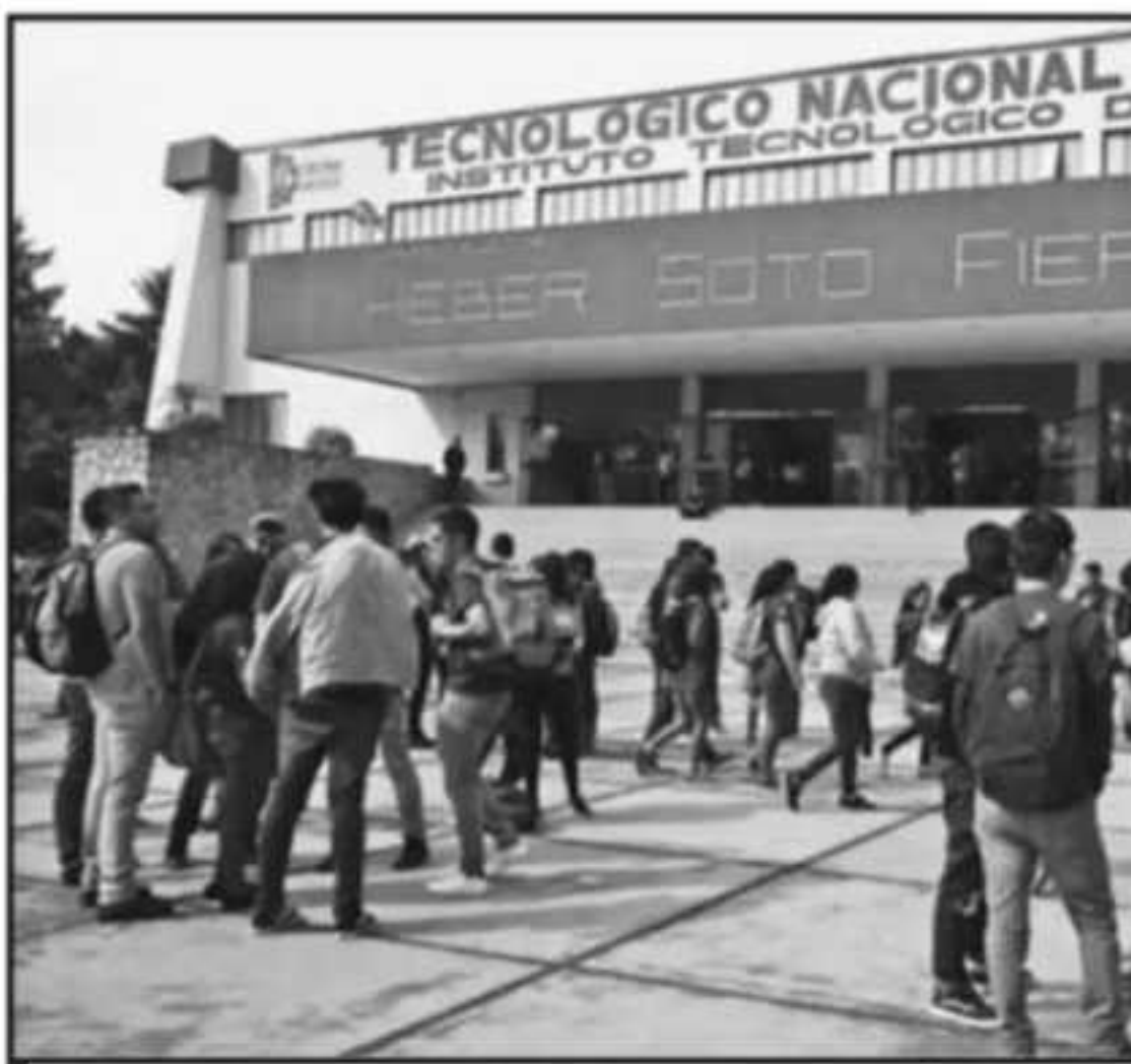
DECENAS DE ALUMNOS PARTICIPAN EN LOS VERANOS DE INVESTIGACIÓN QUE ORGANIZA