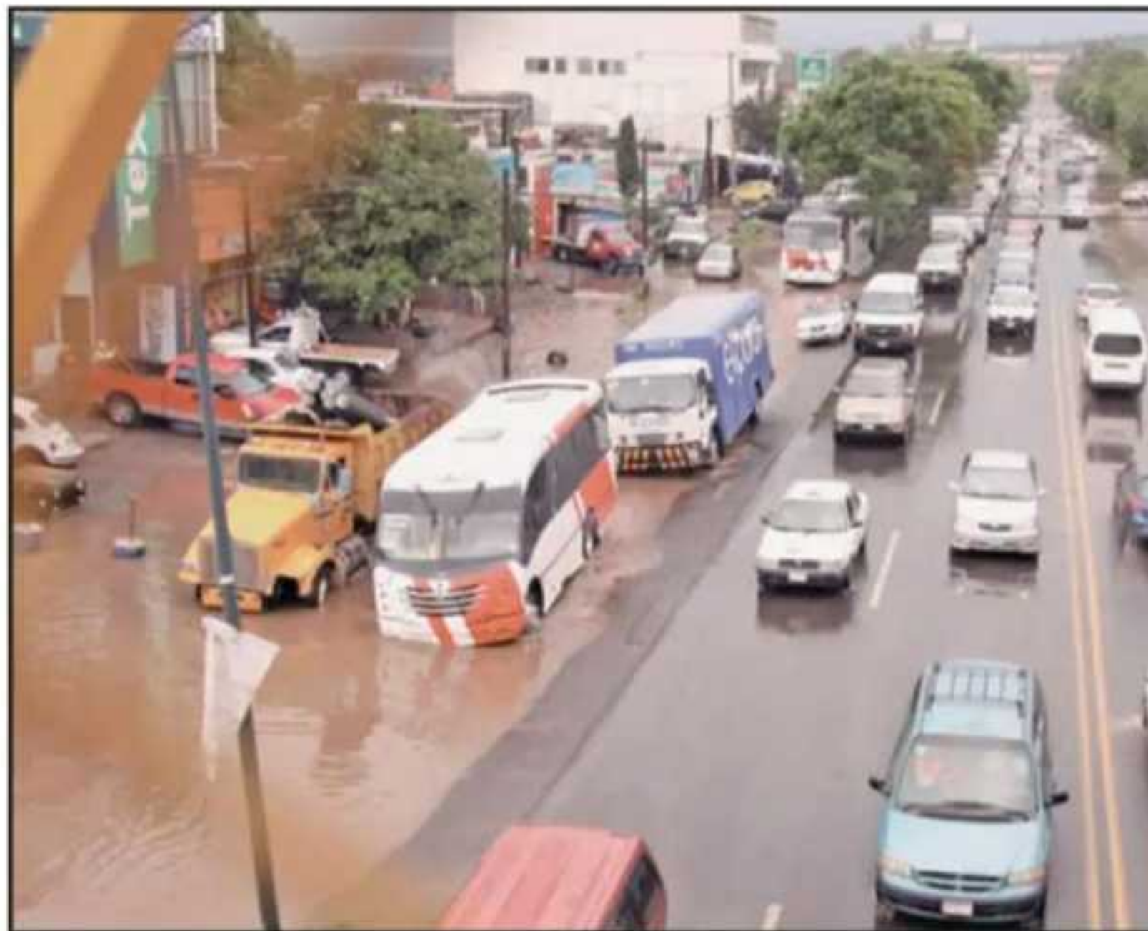
EN LA SALIDA A QUIROGA LOS CARRILES LATERALES SE INUNDARON, MIENTRAS QUE LOS CENTRALES TUVIERON UN TRÁFICO

ordinación Estatal de Protección Civil, la onda tropical número 20 desde el sureste del país y su interacción con un canal de baja presión, por lo que se originarán lluvias fuertes a puntuales inten-