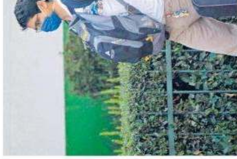
El caso de sospecha está en proceso de la autoridad sanitaria