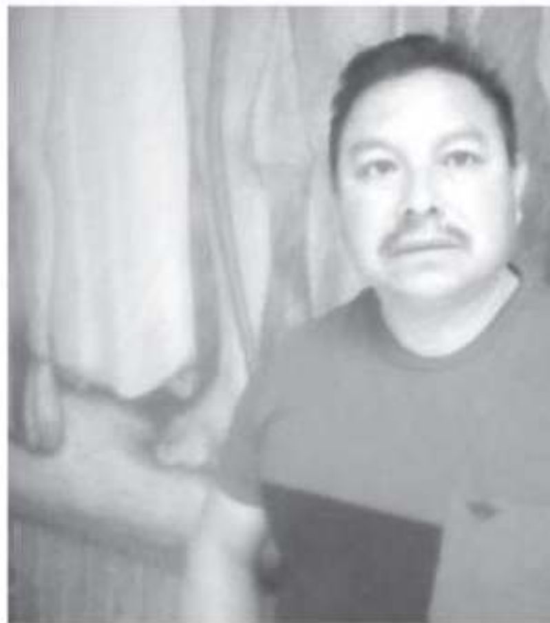
Es importante que acudan no solo los habitantes de los pueblos que estén interesados en el tema de los pueblos y su desarrollo

ferencia, algunos representantes de los medios de comunicación iva que la ostenta como Señorita Fotogenia.