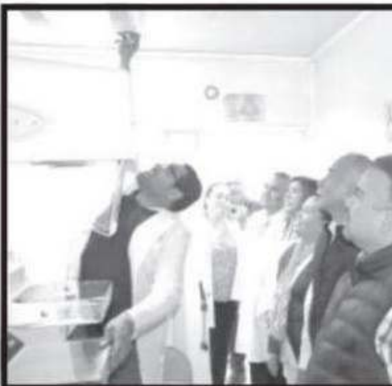
La jornada tiene la finalidad de prevenir el cáncer de mama en el municipio, lo cual, el H. Ayuntamiento en coordinación con el Centro de Diagnóstico y Referencia Epidemiológicos acercará este estudio de manera gratuita a la población.