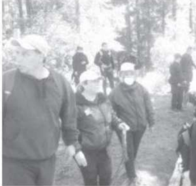
Las labores de búsqueda, donde también se han empleado binoculares y por aire en diversos puntos de la Región Oriente.