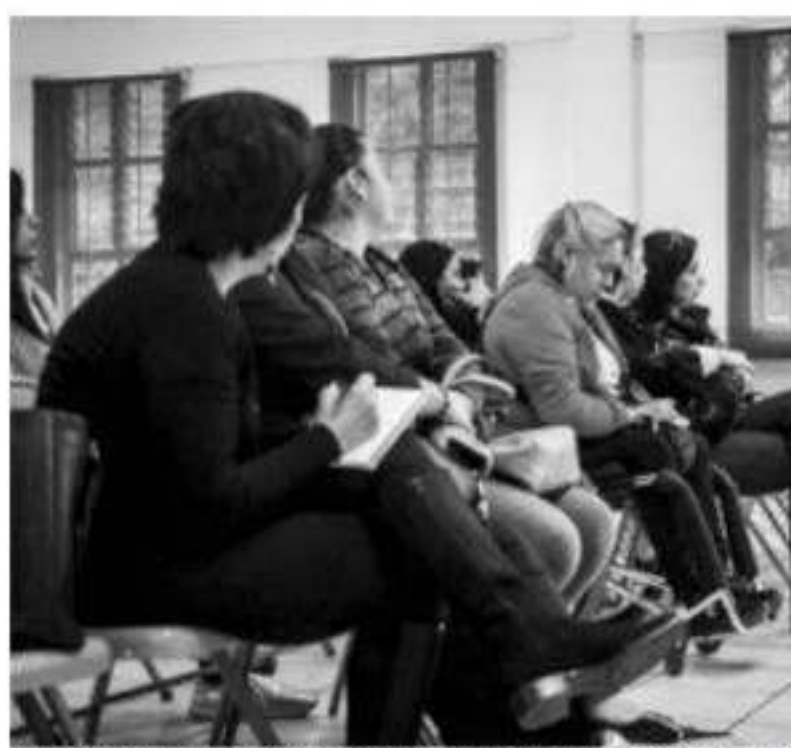
En presencia de las mujeres empresarias y emprendedoras, la funcionaria afinó los detalles en aspectos de seguridad, logística y organización para que el evento se desarrolle de la mejor manera durante los tres días mencionados.

Apuntó que se estima una derrama superior a los 120 mil pesos y reiteró que la convocatoria a las interesadas en participar puede acudir a las oficinas del Instituto Municipal de la Mujer, ubicadas en Obregón No. 87, colonia Centro, de lunes a viernes de 8 a 15 horas o bien comunicar del número telefónico 4525286619.