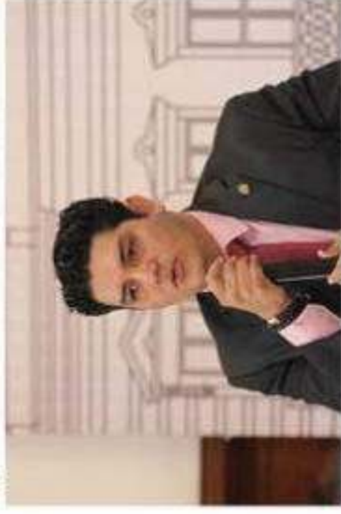
El presidente de la mesa directiva del Congreso local, reconoce importancia que recae sobre el magisterio, en torno al desarrollo educativo del estado.

Ante ello, es apremiante legislar para generar mejores condiciones de vida a la niñez michoacana, bajo el principio del respeto y protección de los derechos de las niñas, niños y adolescentes, y también armonizar el marco normativo estatal, con la Ley General y Estatal de los Derechos de Niñas, Niños y Adolescentes, con la finalidad de homologar la protocolización de los procesos regulatorios que delimitan la figura de la adopción en Michoacán.