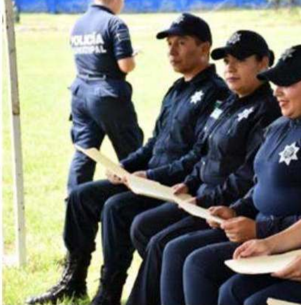
Para este 2020 el Fortaseg ha destinado poco más de 13.8 millones de pesos de la seguridad pública. (Foto de archivo).

Fortalecer la capacidad tecnológica que permita a las instituciones de seguridad de los tres órdenes de gobierno el intercambio seguro de la información