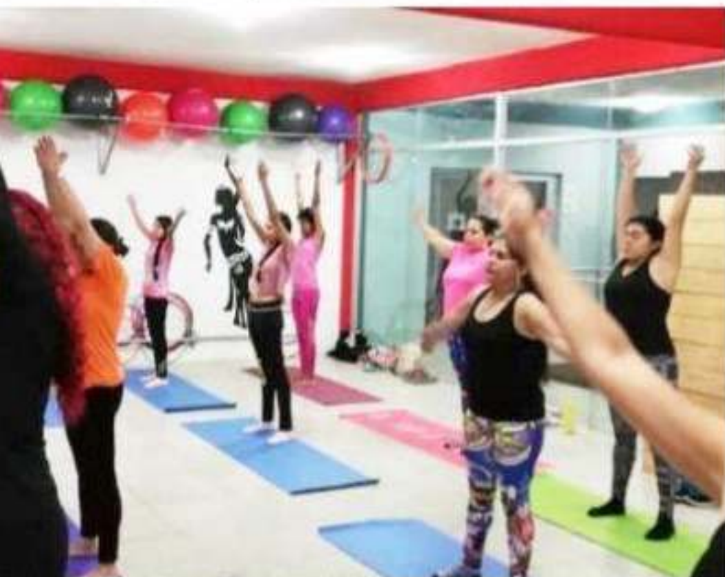
UMBO, MICH.- La Casa de la Cultura de esta tenencia inició su ciclo de cursos 2020.