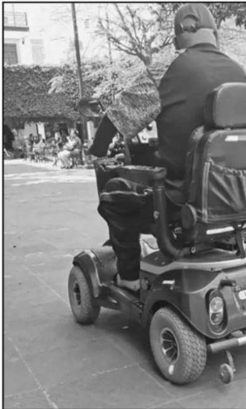
NO HAY TALLERES ESPECIALIZADOS QUE ATIENDAN UN DESPERFECTO DE APAR