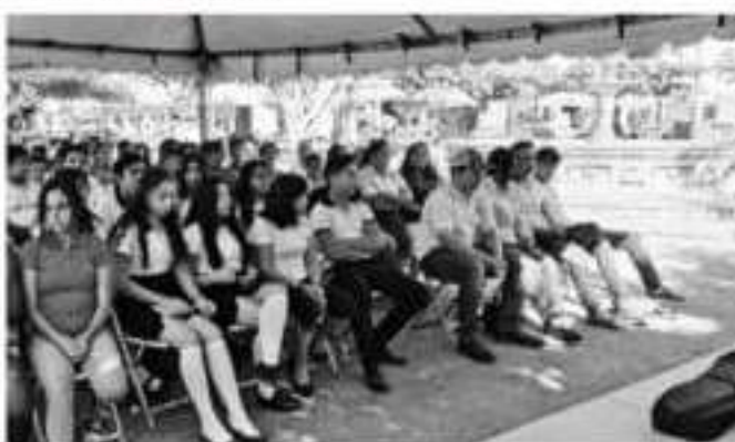
JOVENES de secundaria y bachillerato, asistieron a la conferencia titulada "Prevención del Suicidio", auspiciada en coordinación al DIF Municipal de Apatzingán y al Instituto Municipal de la Mujer Apatzinguense.