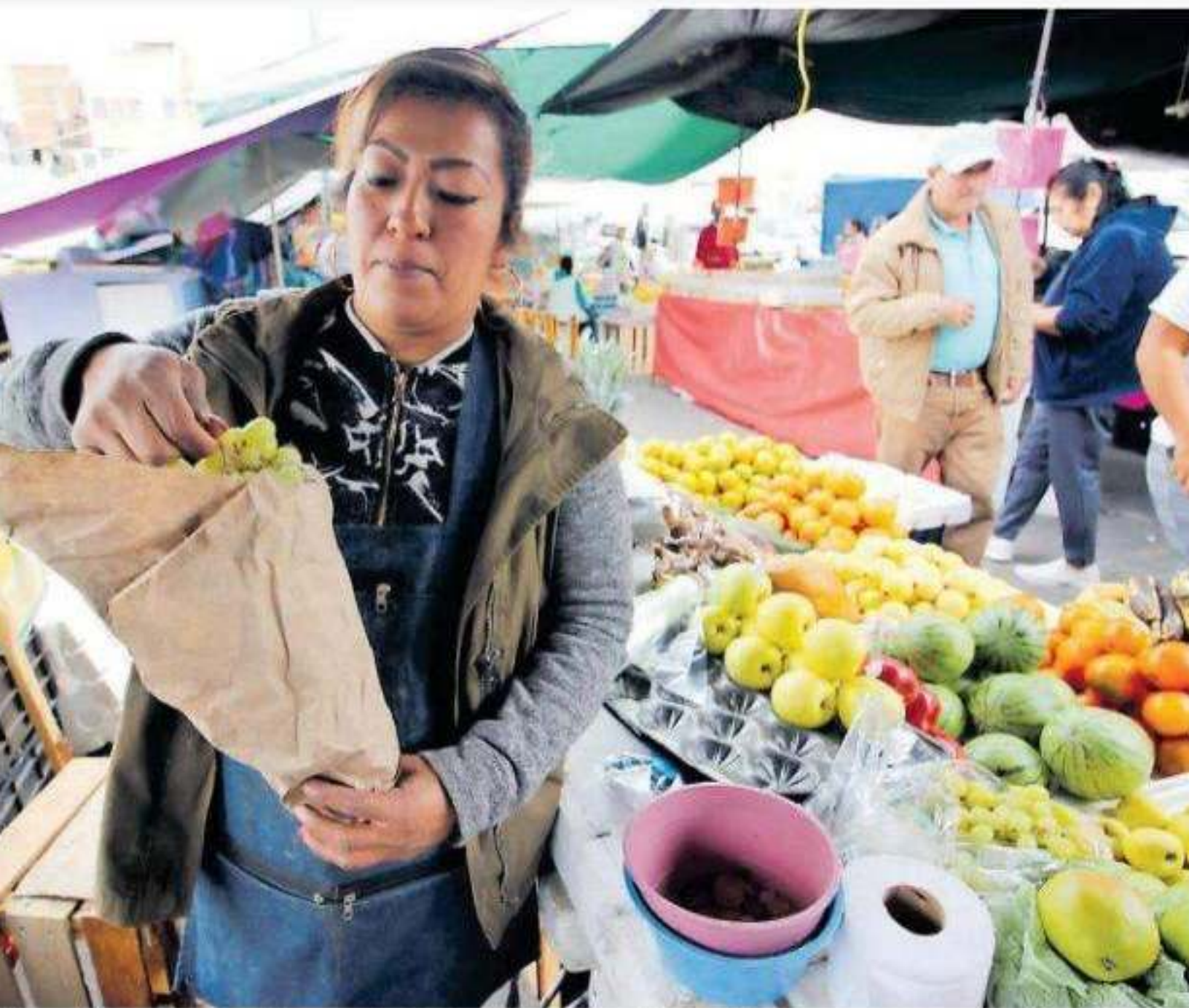
...ido volver a lo tradicional: los cucuruchos hechos con papel cartón o periódico

de los niveles de contaminación z más alarmante, salen a relucir o las antiguas bolsas de mandado