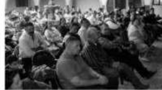
MORELIA, MICH.- Es necesario generar fortalezas municipales para su correcto desarrollo administrativo. Esto garantizará una mayor eficiencia en el cumplimiento de sus responsabilidades.

El diputado recalcó que el fortalecimiento de los gobiernos municipales, en mucho depen-