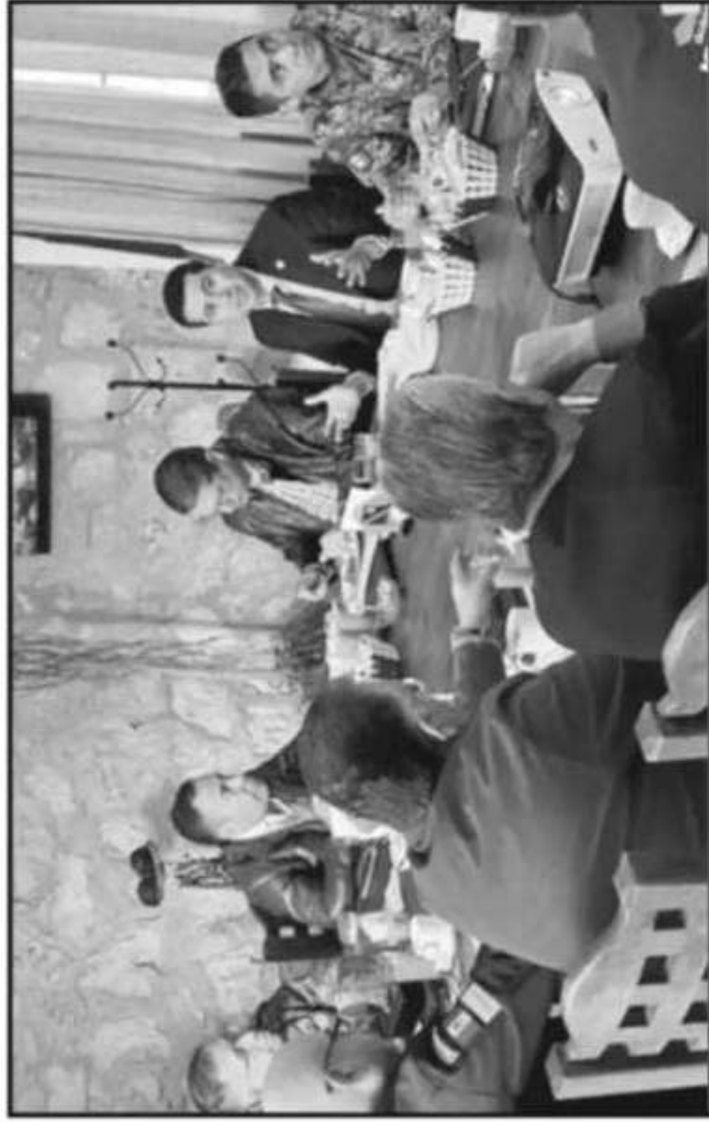
DE FORMA INTERINSTITUCIONAL AUTORIDADES TRABAJAN EN MEJORAR LAS ESTRATEGIAS DE SEGURIDAD.

stituciones, de vigilancia so la impor- emos traba- en beneficio ansportistas por esta au-