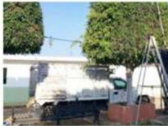
COTIJA, MICH.- El ayuntamiento continúa verdes.