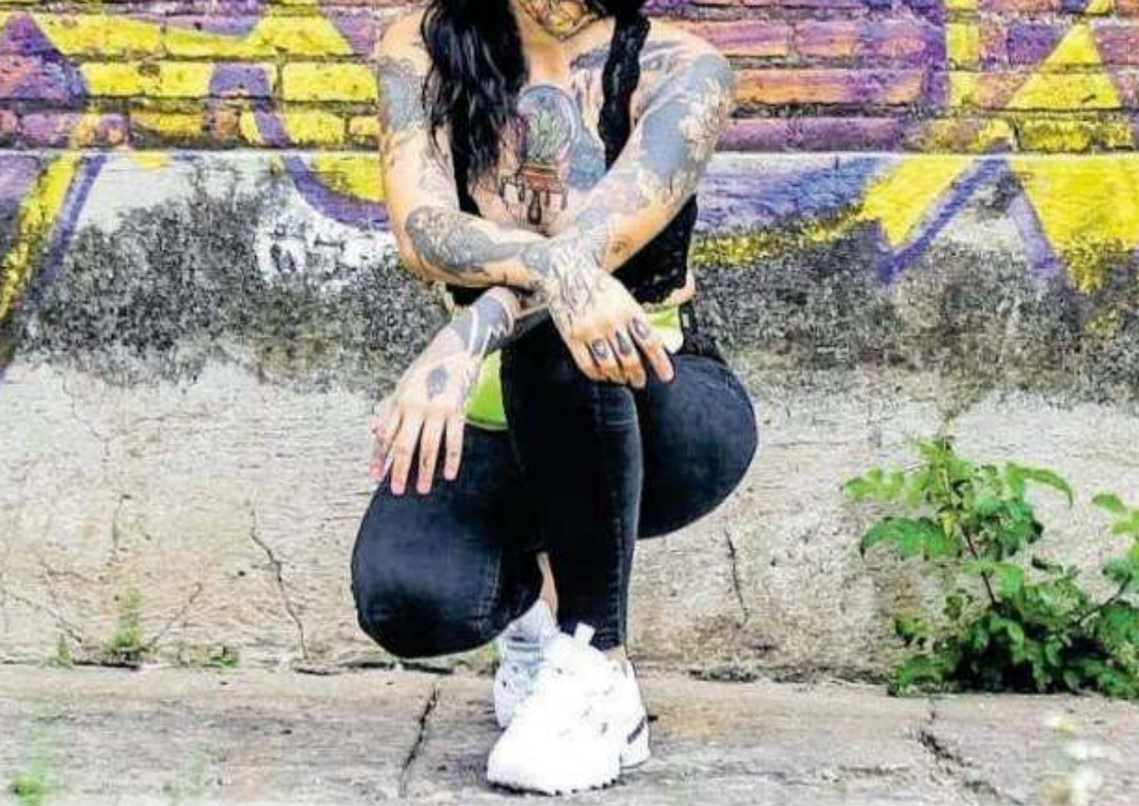
Los tatuajes que la gente elige tienen que ver con un proceso de curación

afirma que como barbe- unos 200 cuatro ta- dibujar.