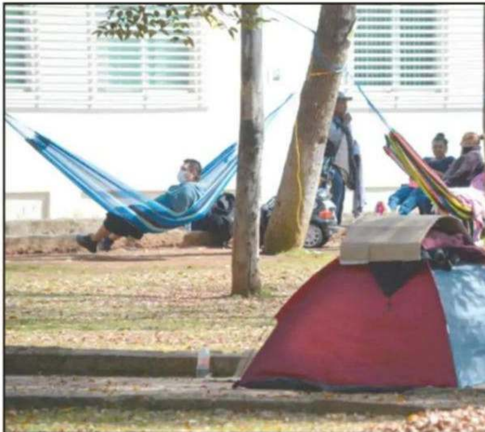
PESE A HABERSE INAUGURADO UN REFUGIO PARA FAMILIARES DE PACIENTES DEL HOSPITAL INFANTIL, LA GENTE VUELVE A INSTA

cinco casas de campaña y hamacas en las cercanías del Hospital Infantil de Morelia, aunque algunas familias presentes señalaron que éstas son usadas únicamente durante el día y no se trata de un campamento en el que se resguarden durante la