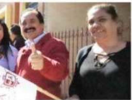
la ReciCanje, la Secretaría de Desarrollo ca apoyar a niños y adultos que luchan

, de refrescos, agua, garrafones, pasta nvases de plástico, todas pueden ser ar los "kilos de ayuda".