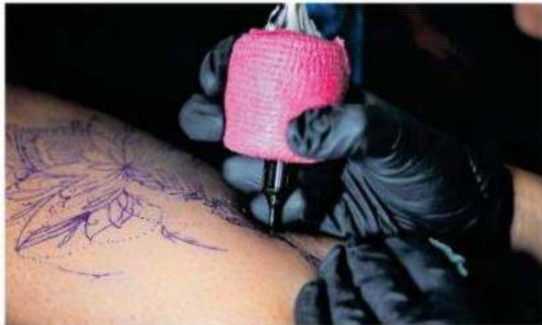
En la actualidad, los tatuadores se han expandido por toda la ciudad

ajes que la un proceso nuestro ser por la que ". Dueña se agrada, es- asi todo su organ algo n trazados, es del dolor para con- historias, estros. "Pa- lo; nos vol- ver y a de-