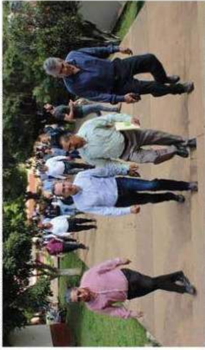
El diputado Antonio Soto Sánchez destacó la importancia de acabar las inercias que han debilitado la figura del