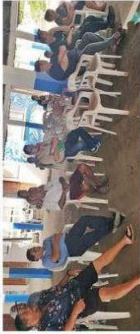
Aspecto de la reunión con prestadores de servicios de Caleta de Campos y Playa Azul, con quienes el municipio se comprometió a reforzar la recolección de basura en esas tenencias y a la vez centros turísticos.