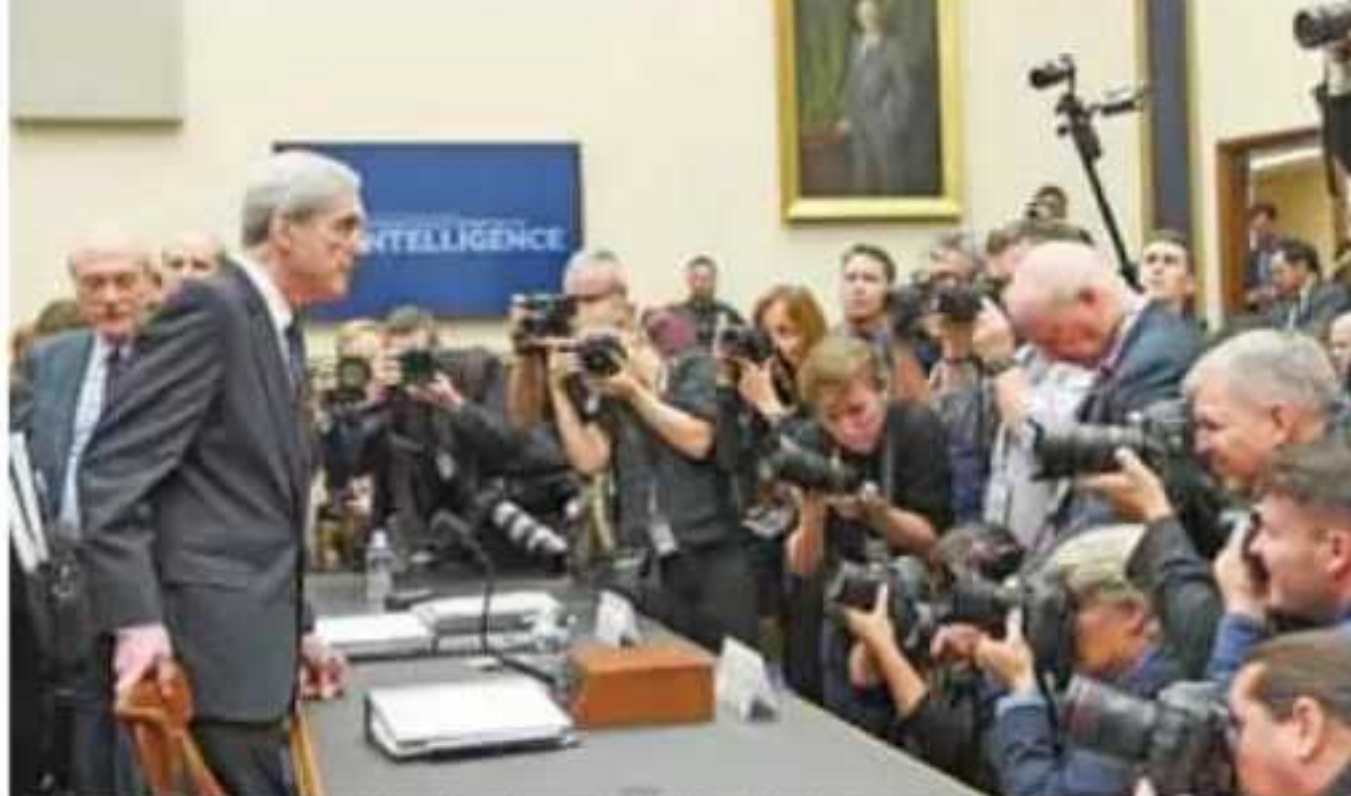
El fiscal reconoció que Trump podría ser juzgado cuando deje la Presidencia.

este año, Mue- el Departamento EU un informe umia los hallaz- estigación, que averiguar si el Trump "conspi- remlin durante