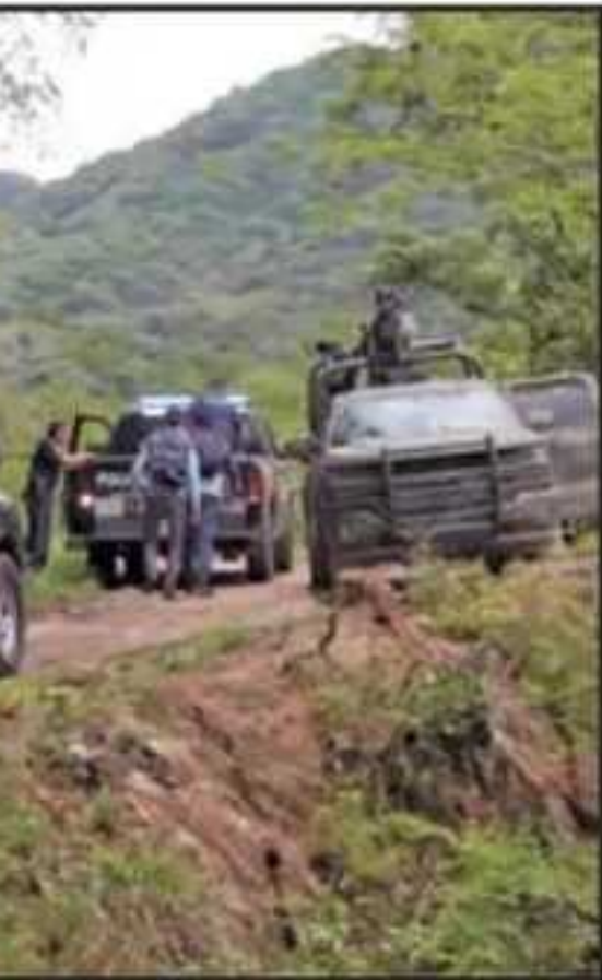
ICADO, PUES ADEMÁS DE UN LARGO CAMINO CIACCOS NO PERMITÍAN EL PASO NI EL DIÁLOGO.