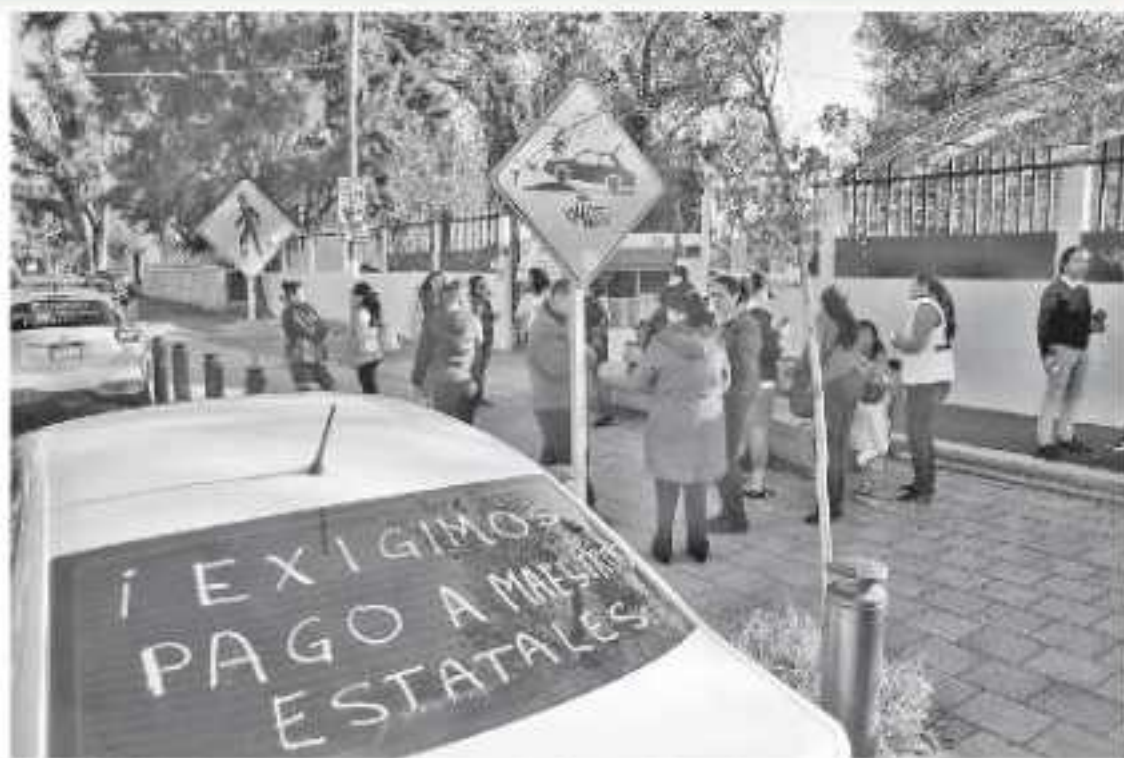
Autoridades esperan cerrar el año sin afectación a docentes / CARMEN HERNÁNDEZ

tampoco uará co- urrencia ducación o que "lo