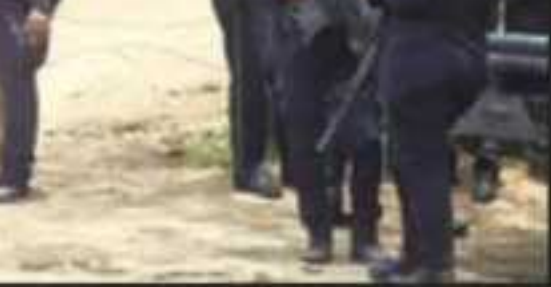
ROL SE ESTABLECIERON EN LOS CAMINOS DE S DE SEGURIDAD FUERTEMENTE ARMADOS.