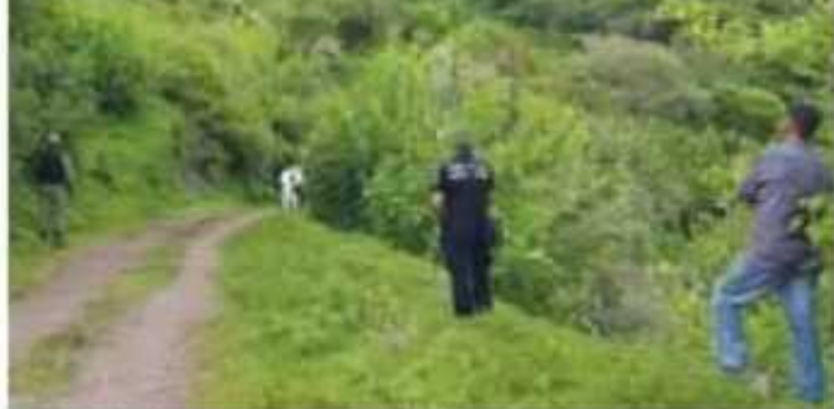
El sitio del accidente permanece resguardado. | RED 113

a en Twitter, la e Gobernación, z Cordero, ex- r por la muerte narios y de los ue viajabán en