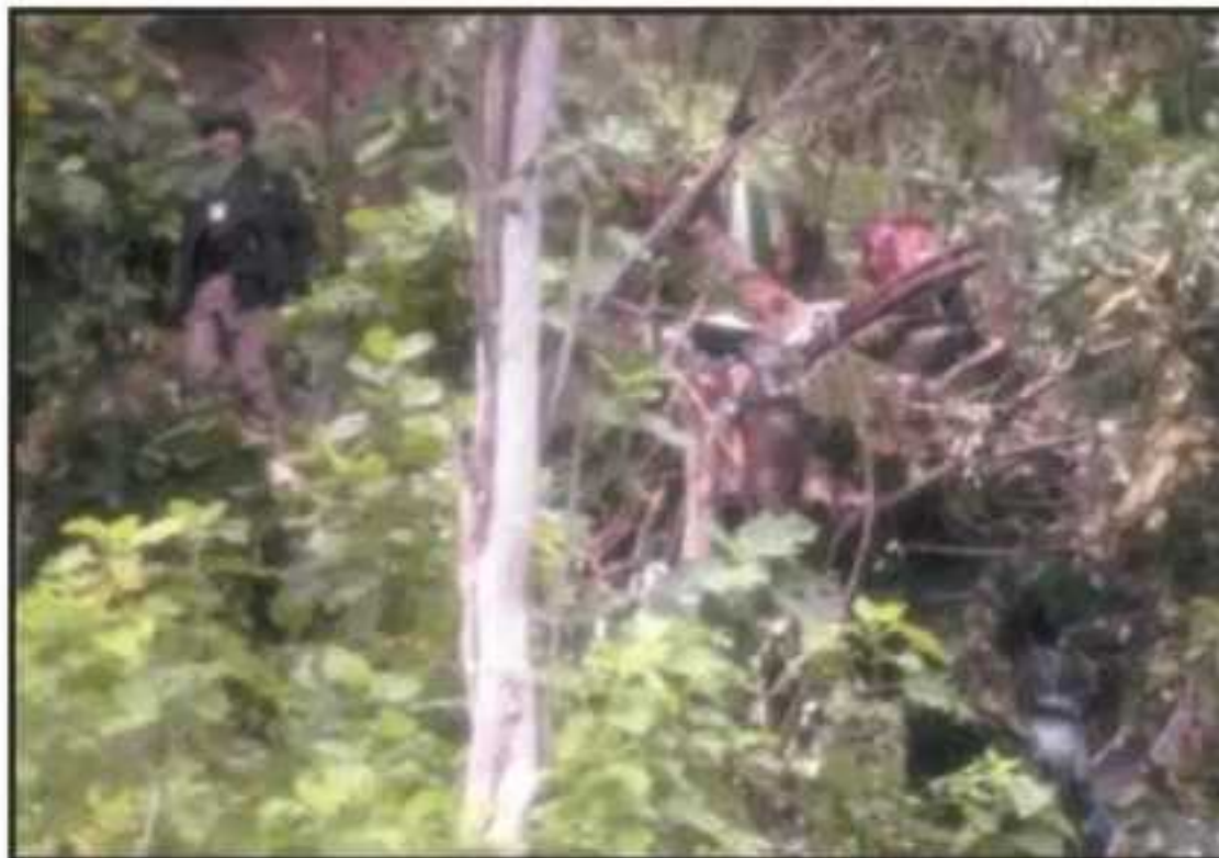
LOS RESTOS DE LA AERONAVE FUERON RESGUARDADOS POR LA FISCALÍA GENERAL DEL