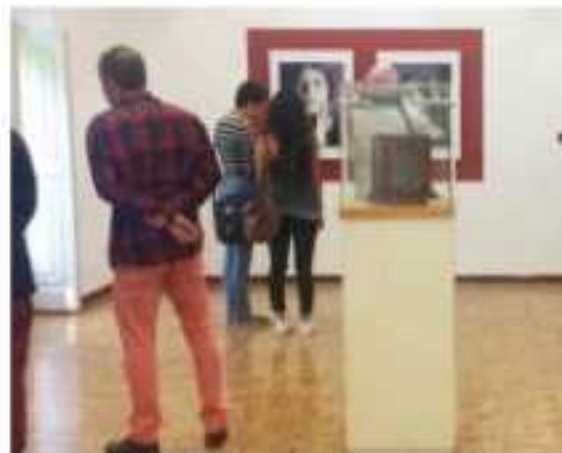
MORELIA, MICH.- Llega al Macaz Tina Modotti "México en México".

El recinto administrado por la Secretaría de Cultura de Michoacán se ubica en la calle Benito Juárez 240, en el centro histórico de la ciudad de Morelia; y abre sus puertas al público en un horario de lunes a viernes de 9 de la mañana a 8 de la noche, y sábados, domingos y días festivos de 10 de la mañana a 2 de la tarde, y de 3 a 6 de la tarde.