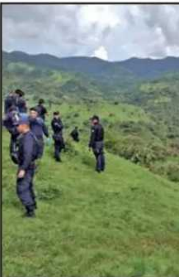
LA SIERRA DE VILLA MADERO ES UN LUGAR DE DIFÍCIL ACCESO Y CON UNA DENSA ZONA BOSCOSA KI-