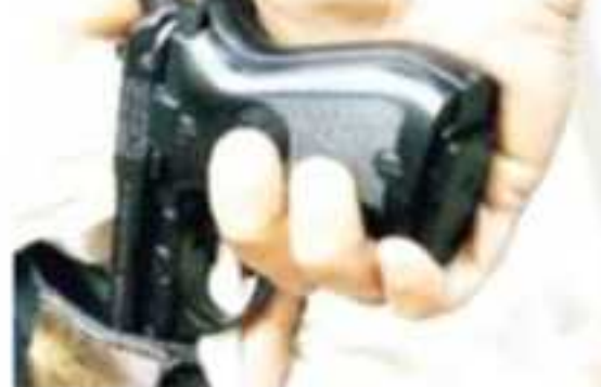
CD. LÁZARO CÁRDENAS, MICH.- Un 29.6% de 18 años manifestó haber modificado su percepción de la delincuencia.

En tanto que un 34.6% de la población aseguró escuchar disparos por arma de fuego de manera frecuente, un 42.2% dijo que presenció la venta o consumo de drogas en la calle y un 27.3% afirmó haber presenciado algún acto de vandalismo.