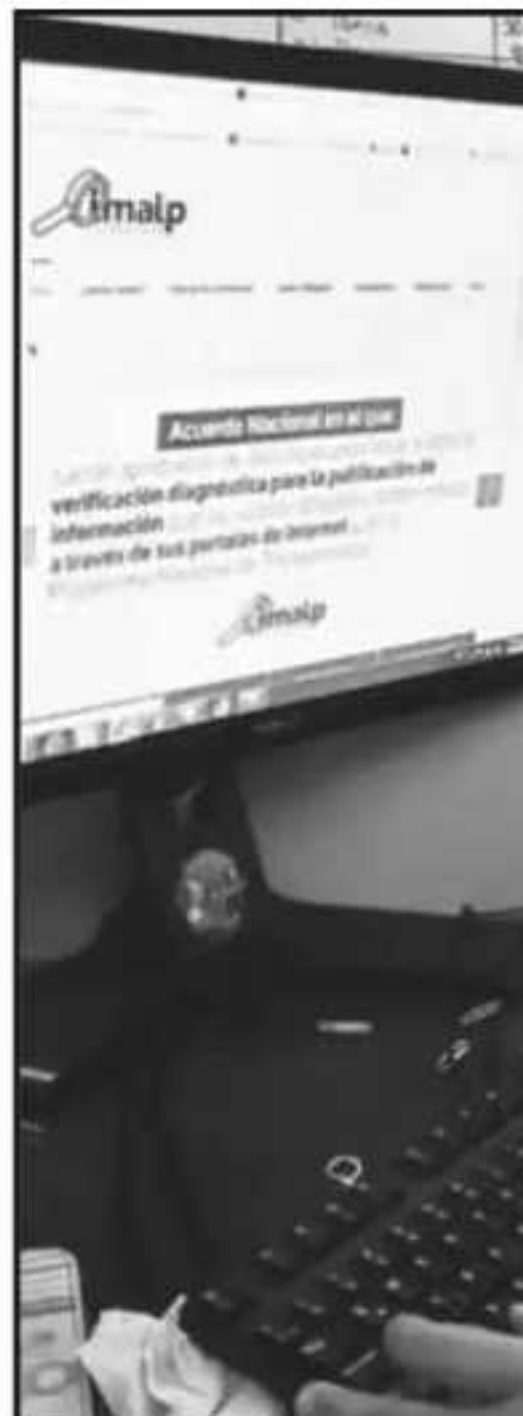
CIUDADANOS SE HAN QUEJADO DE Q

Ya contamos con Anticorrupción, q tenemos ya todo