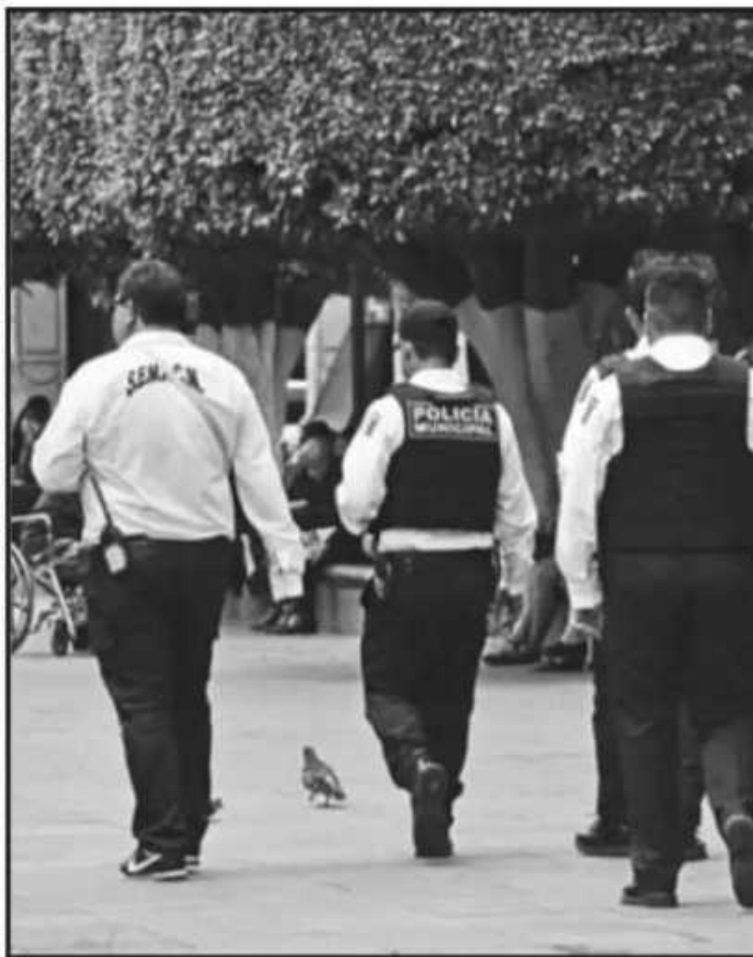
PESE A LA FALTA DE RECURSOS PARA LABORES DE SEGURIDAD, NO SE APLICARÍA

Cuestionado respecto a que los elementos de la Guardia