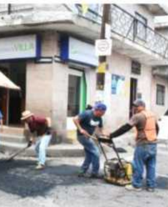
Las calles están siendo objeto de bacheo, ello particular en esta temporada.

Se realiza de manera provisional con diferentes puntos del municipio, con la finalidad de mantener en buen estado las calles y evitar problemas de tránsito a consecuencia del temporal de lluvias.