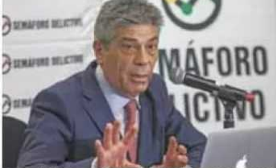
En el reporte destacan que de 2008 a junio de 2019 se han registrado al menos 144 mil 571 ejecuciones. [CUARTOSURDO]

El reporte destaca que de enero a junio de 2019 se han