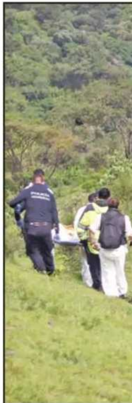
EN DOS VIAJES, ELEMENTOS DE DIVERS