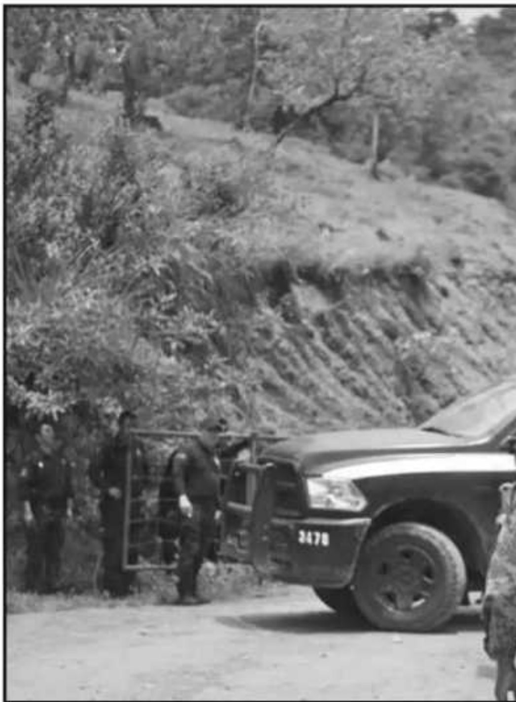
SOLDADOS MONTARON GUARDIA SOBRE LA ZONA DEL INCIDENTE. LA MUERTE D

de Michoacán y la familia de las gentes que han perdido la vida esta