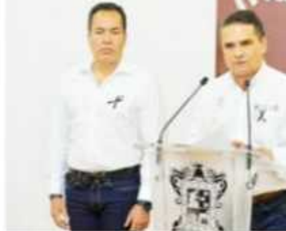
MORELIA, MICH.- El gobernador de Michoacán, Aureoles Conejo, llamó a no caer en especulaciones con respecto al accidente y a esperar lo que arrojen las investigaciones.

Morón Orozco fue entrevistado al inicio del recorrido que efectuó en el Centro Bienestar Educativo Ruiz, donde con