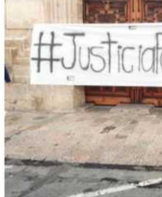
MORELIA, MICH.- Protestaron en F... Pulido, en el municipio de Aquila hac...

De este modo, fue como ayer varias organizaciones sociales protestaron en Morelia por el homicidio de la defensora de derechos humanos activista Zenaida Pulido; se realizó una breve marcha de la Fuente de las Tarascas hacia Palacio de Gobierno y también se colga- ron mantas y pancartas sobre Palacio de Gobierno.