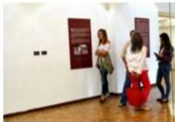
MORELIA, MICH.- Serie fotográfica en el archivo del Sistema Nacional de Fototecas del INAH.