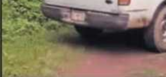
SERVICIOS PERICIALES ARRIBÓ TAMBIÉN PARA LOS CUERPOS COMO EN LOS PRIMEROS PERI-