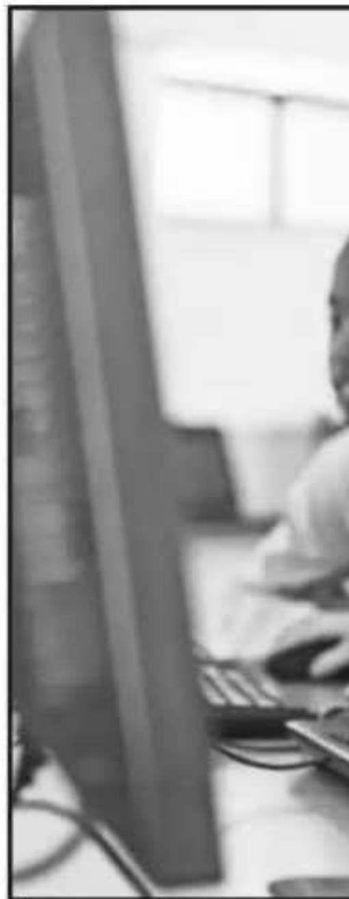
MÉXICO SE ENCUENTRA REZAGADO

La idea de esta escuela de verano surge a partir de esto del cambio que hay a nivel mundial en estos temas; en primaria y secundaria vamos un poquito retrasados en este