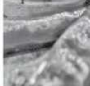
La Feria del Chile de Queréndaro, del 9 al 11 de agosto próximo.

El chile de Queréndaro cuenta con reconocimiento a nivel nacional, por su secado en costales bajo los rayos del sol, le permiten conservar color, sabor, texturas y olor. Contrario a lo que ocurre con los