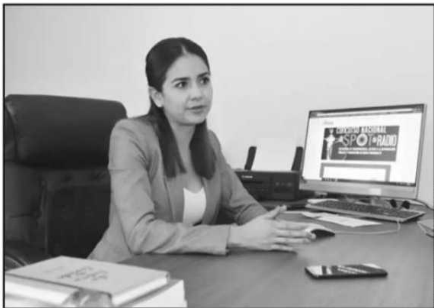
LA COMISIONADA PRESIDENTA DEL IMAIP, ARELI NAVARRETE, DETALLÓ LOS RETOS QUE SIGUEN A LA TRANSPARENCIA.

cumental, ya quitamos la idea de que los documentos son de uno, eso ya lo superamos, ya sabemos que los documentos que genera-