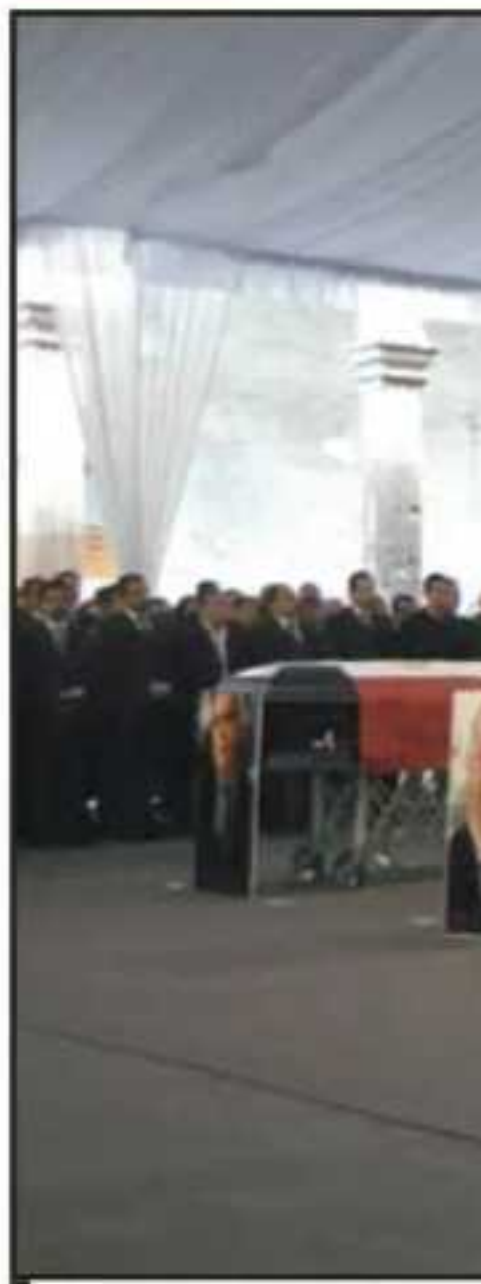
LOS CUATRO ATAÚDES FUERON COL

tero. Fue cuando mencionó al director del Seguro Popular, Germán Ortega, cuando interrumpió su discurso por breves segundos. Con voz quebrada, el mandatario luchó por contener las lágrimas mientras