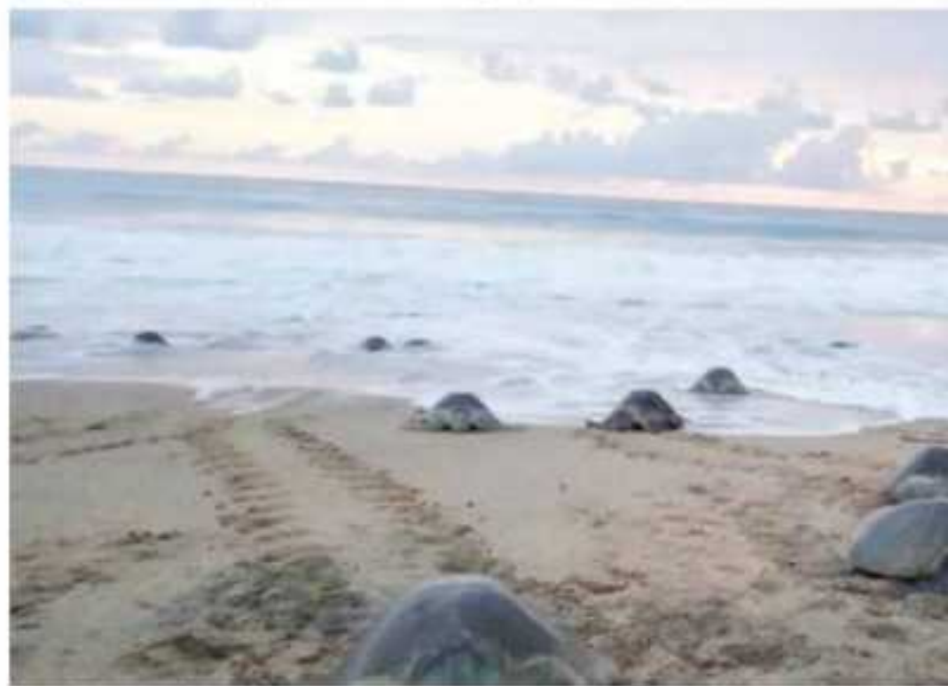
CD. LÁZARO CÁRDENAS, MICH.- Hasta este jueves se mantiene la llegada de crías de Ixtapilla, en el municipio de Aquila.

gente, tanto a presenciar la arribazón de la tortuga laúd, como a la liberación de las crías, como ejemplo refiere que este lunes se