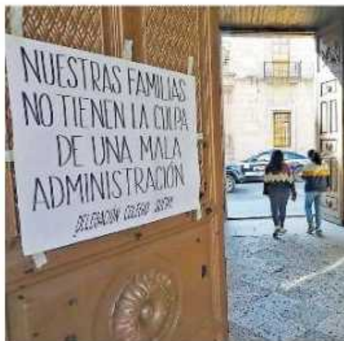
La institución aseguró que están en marcha los pagos

Para el pendiente de 2017 en abril pasado se pagó una despensa, pero el resto de los pendientes están en análisis, pues "tenemos que hacer un filtro porque las cuatro