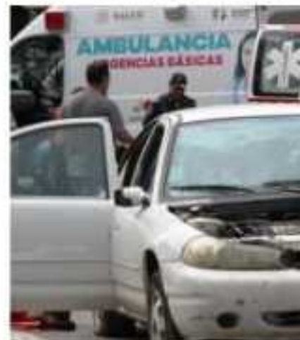
LOS REYES, MICH.- Con un espectáculo concluyó el Curso de Primeros Respondientes.