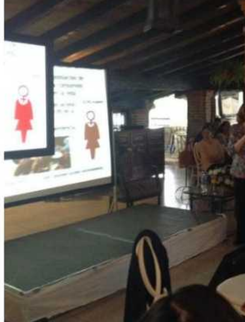
MORELIA, MICH.- En uno de los restaurantes más caros de Morelia se realizó la conferencia magistral "La Mujer y las Drogas".

De este modo fue como ayer en uno de los restaurantes más caros de Morelia el CIJ realizó la conferencia magistral "La Mujer y las Drogas", donde asistieron mujeres de la alta sociedad michoacana y donde la ponente pidió al gobierno municipal editar su libro, que aseguró cuenta con perspectiva de género; "no es posible que haya recortes presupuestales federales realizados con el machete, hay que organizarnos contra los abusos de los recortes a los albergues de mujeres violentadas y a las estancias infantiles", fustigó y cerró.