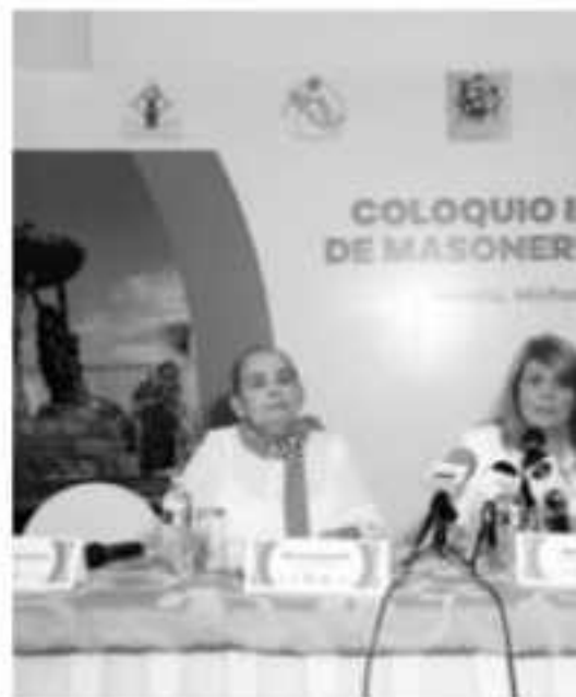
MORELIA, MICH.- Las integrantes de la Federación Femenina anunciaron la realización del 3er Coloquio que tendrá lugar en la capital michoacana.

"Preocupamos por lo que suce- de en la sociedad y saber que po- demos hacer algo para llevar solu- ciones" apuntó. Cabe hacer men- ción que en este Coloquio partici- parán mujeres de Argentina, Chile, Bolivia, Estados Unidos, Brasil, Venezuela, Perú y Panamá.