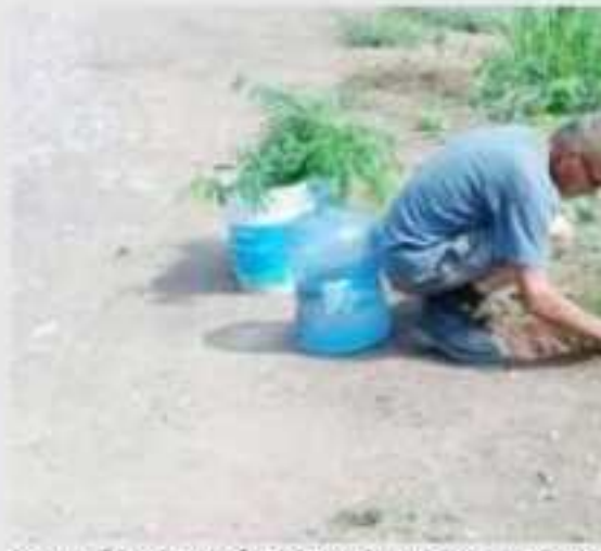
CD. LÁZARO CÁRDENAS, MICH.- Presta Nexpa, preocupados por el medio ambiente reforestación, limpieza y concientización importancia de cuidar el medio ambiente.

esperan que, con la colaboración de la sociedad que desee donar más arbolitos de más especies, puedan plantar más variedad, que daría una buena imagen al destino turístico. Además y como parte de la concientización ambiental, se colocarán letreros para que se respete la vida silvestre de algunos animales endémicos de la zona, como armadillos, iguanas, así como los arbolitos recién plantados, los cuales, serán colocados a lo largo del acceso que conduce a playa, para que los turistas tomen sus debidas precauciones.