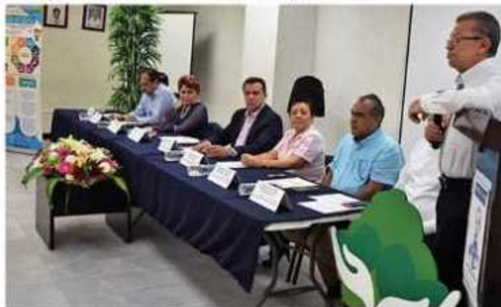
En conferencia de prensa se informó que el Centro Estatal de Trasplantes de Guerrero, y el Centro de Trasplantes (CENATRA), llevan a cabo el Curso de Formación de Promotores Líderes de la Donación de Órganos y Tejidos con fines de Trasplante.

esta donación". Ap- apoyo del CENATRA director José Salva en las labores de de la cultura de d órganos y tejidos o trasplantes.