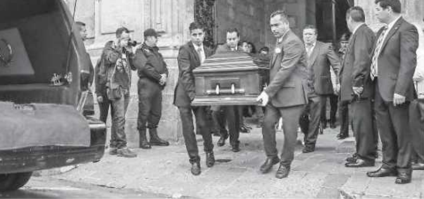
Procesión por la Avenida Madero de Morelia /CARMEN HERNÁNDEZ