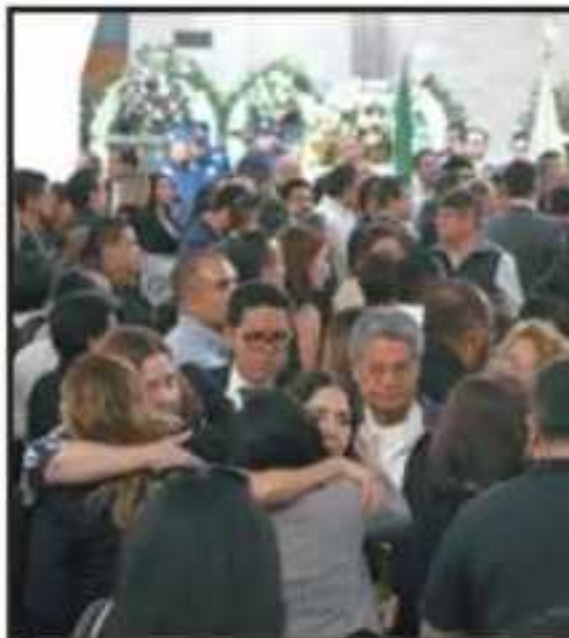
ENTRE ABRAZOS, SOLLOZOS Y UN SILENCIO TRISTE, EL SUCESO CONMOVIÓ A TODA LA CIUDAD DE TULA.