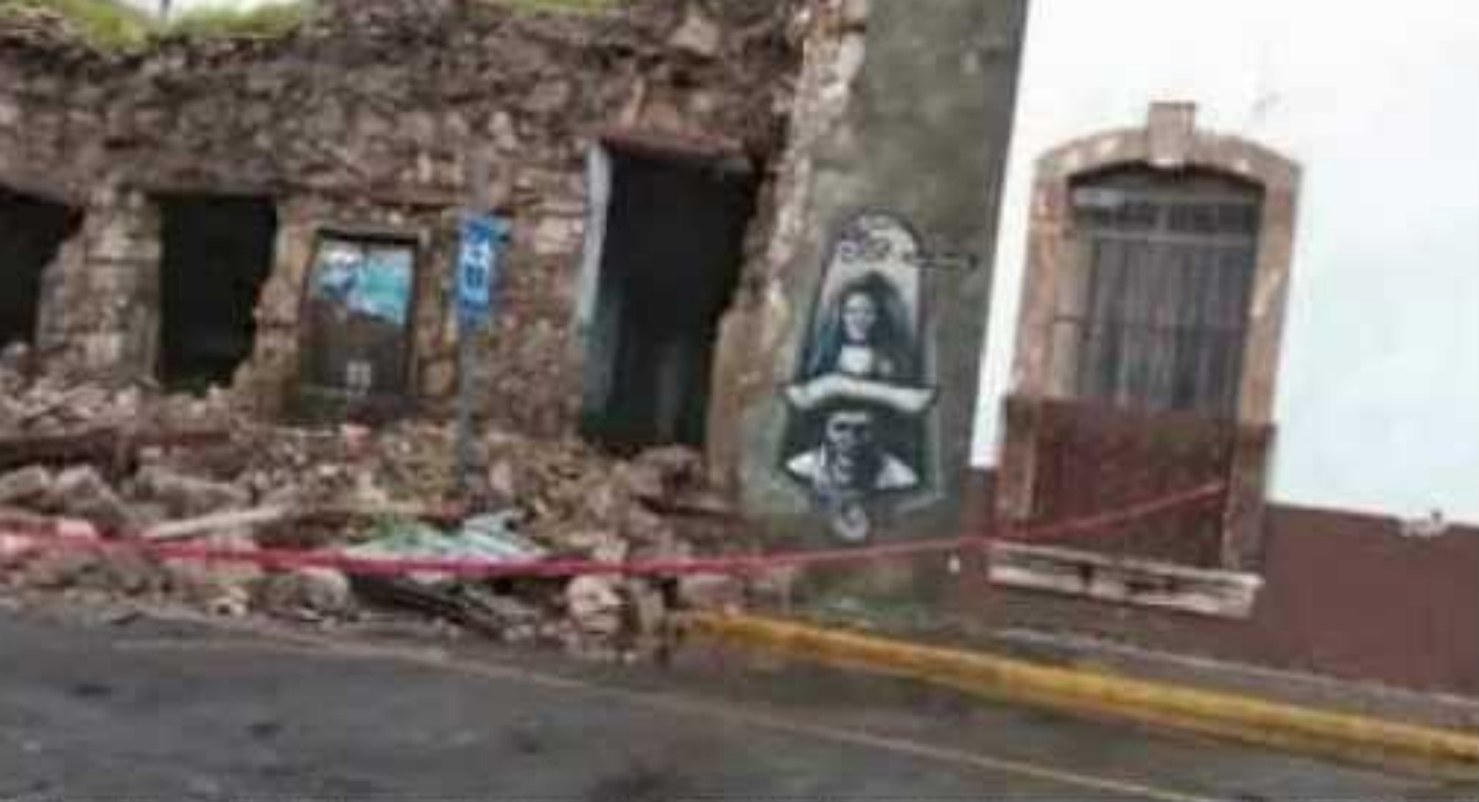
Ciudadanos piden a los dueños de estas viviendas reportarse ante el Ayuntamiento para encontrar una solución.

“Lo que queremos es que los propietarios conozcan el proceso que se debe seguir para restaurarla (la propiedad); nosotros no podemos hacerlo, porque son propiedades privadas”