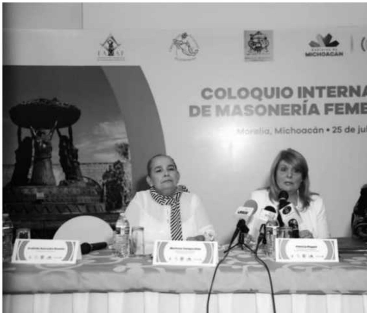
Con la participación de mujeres de por lo menos ocho países, se realizará Coloquio Internacional de Masonería Femenina 2019.