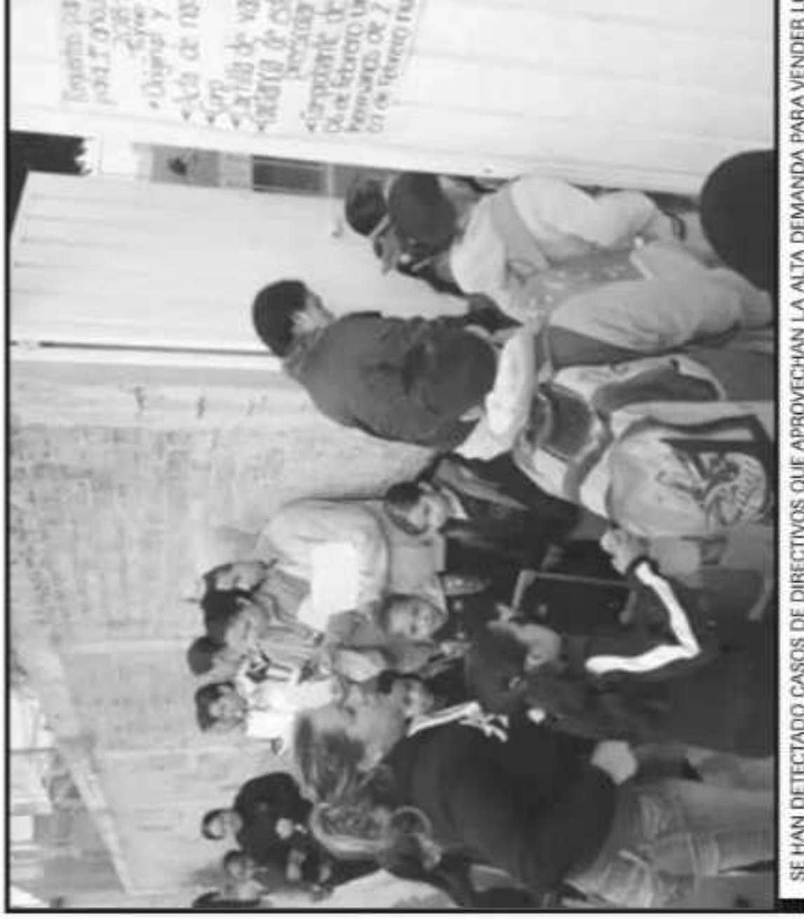
SE HAN DETECTADO CASOS DE DIRECTIVOS QUE APROVECHAN LA ALTA DEMANDA PARA VENDER L

Expuso que estas quejas se refieren no solamente a cuestiones de cuotas por inscripción, sino también algunas tienen que ver con entrega de documentación y otro tipo de cuotas que se estable-