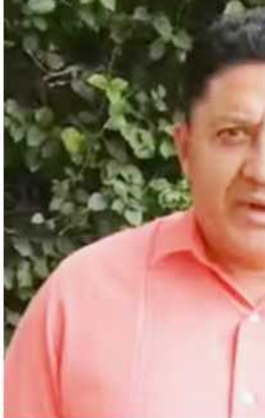
CD. LÁZARO CÁRDENAS, MICH.- El diputado explicó las necesidades que enfrentan los usuarios de Riego, luego de sostener una gira p

Esto, según se explicó, a raíz de la falta de plantas para el tratamiento del agua, de drenajes y colectores en diversas poblaciones asentadas en la periferia del lago.