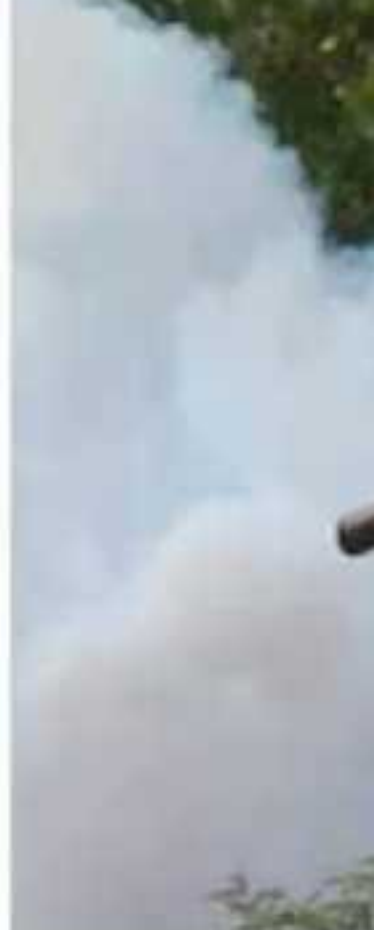
Lázaro Cárdenas, La Piedad, Zira- más casos.

casos confirmados, pero es- tadísticas de la Secretaría de Salud indican que de 2015 a 2018 Michoacán ha reporta- do 70 casos, una de las cifras más bajas en comparación con otros estados, como Ve- racruz y Yucatán, con dos mil 103 y mil 325, respecti- vamente.