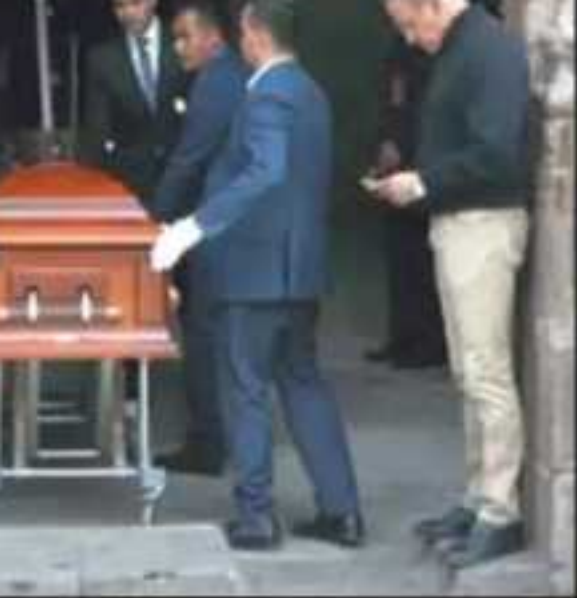
...CIDOS AL PATIO PRINCIPAL, DONDE UN HOME- ...ANIZADO POR EL GOBIERNO LES AGUARDABA.