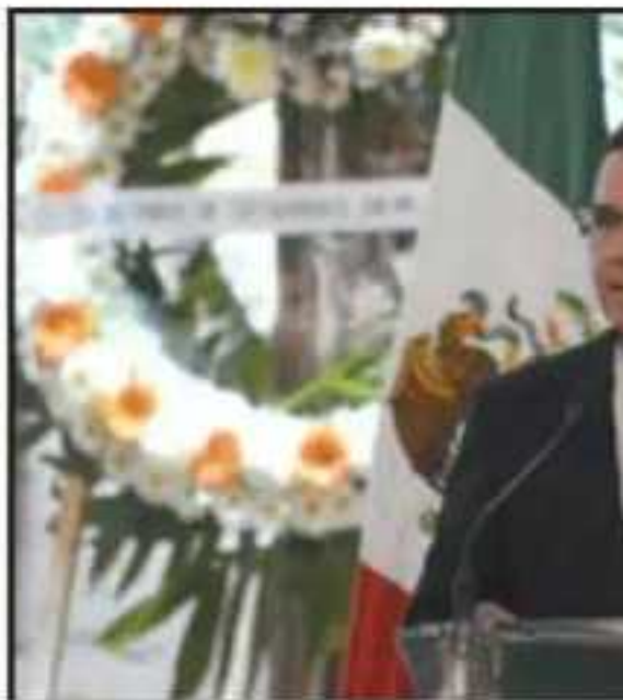
EL GOBERNADOR SILVANO AUREOLES RESISTIÓ LAS EMOCIONES Y SE DIRIGIÓ A LOS FAMILIARES Y PILOTOS FALLECIDOS