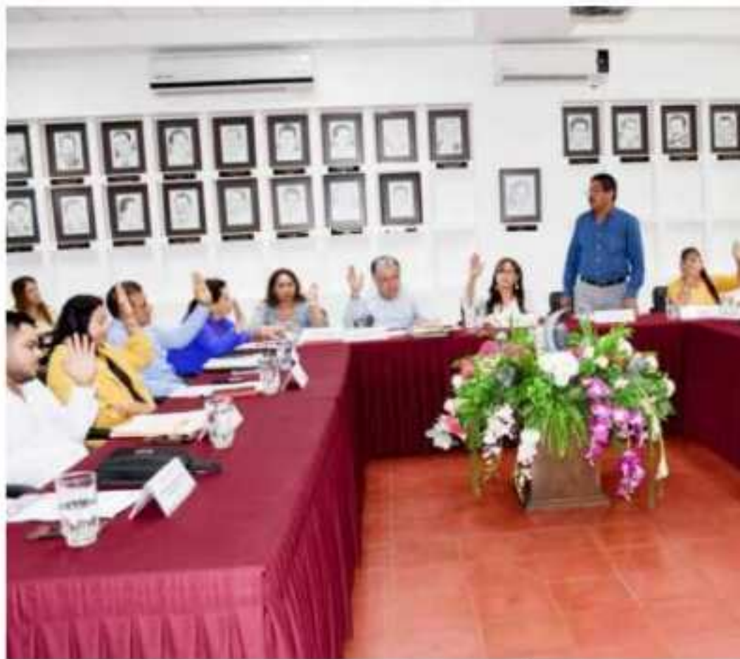
CD. LÁZARO CÁRDENAS, MICH.- Por mayoría de votos, el Órgano de Gobierno autorizó el Presupuesto de Ingresos y Egresos para el Ejercicio Fiscal 2019.