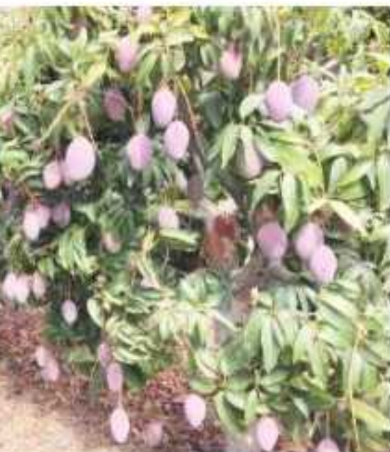
Para la exportación de este fruto, 2 mil 998 hectáreas de superficie de 13 mil 065 hectáreas en 10