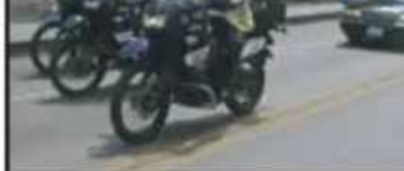
LAS CARROZAS FÚNEBRES TRANSITARON BAJO UN CIELO TRISTE EN LA CIUDAD DE TULA, EN LA QUE IBA A SER SU ÚLTIMO DESTINO.

decir que me haya acompañado más allá del compromiso como funcionario público, no lo olvidaré nunca aquel abril de 2016, el día que como gobernador decidí ir a una de las zonas más complejas, sobre todo