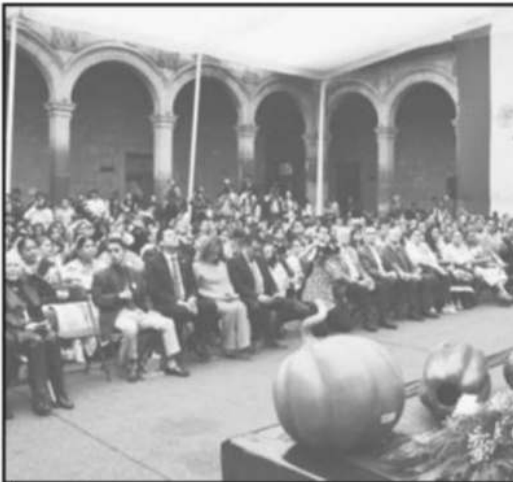
EL GOBERNADOR DEL ESTADO, SILVANO AUREOLES, ENCABEZÓ LA CELEBRACIÓN

acuerdo con el objetivo 8.9 de los ODS, se le debe reconocer al turismo su potencial para proporcionar acceso tanto al empleo decente como reactivando las industrias locales, tradicionales”.