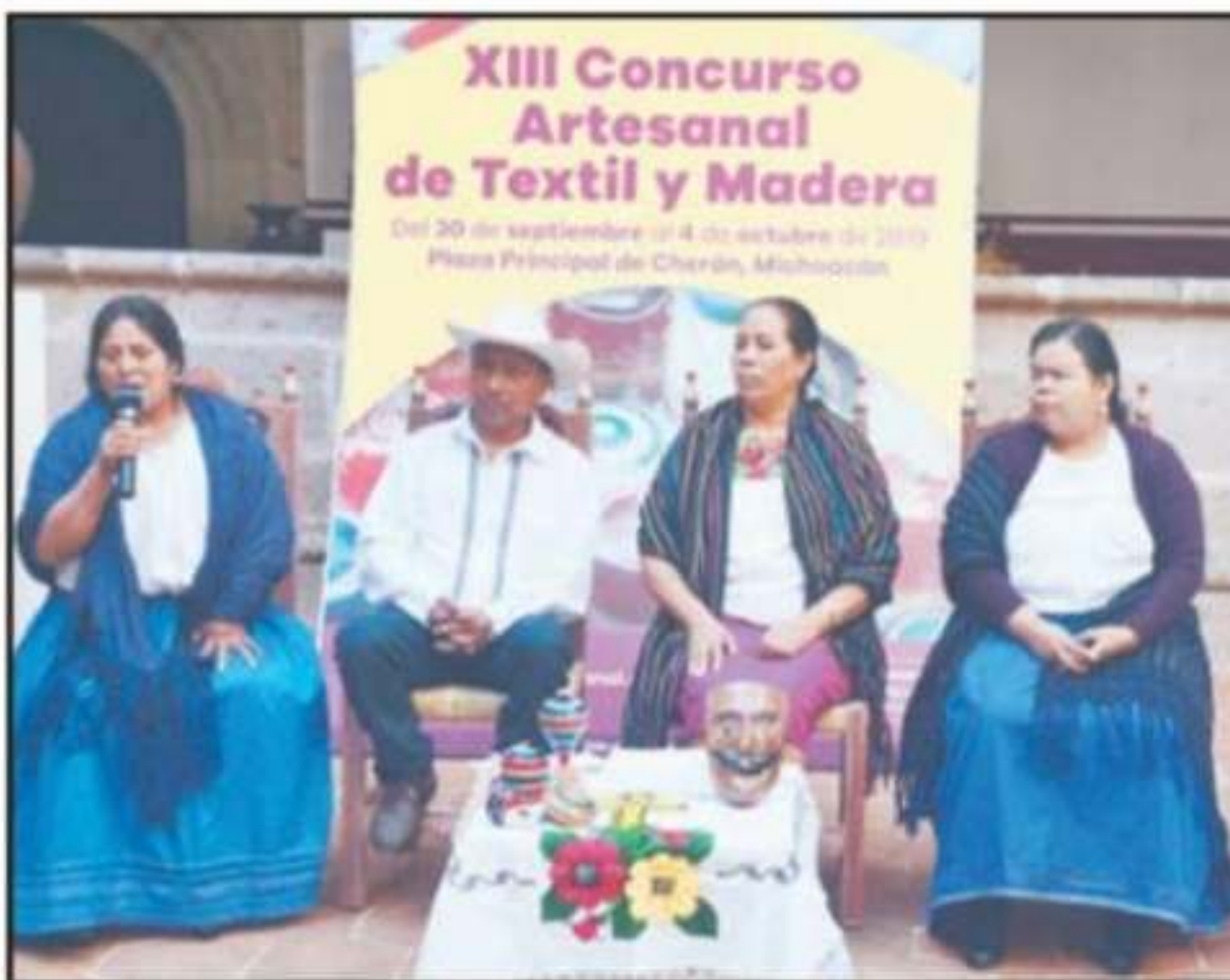
EL 4 DE OCTUBRE, ARTESANOS DE LA MADERA Y EL TEXTIL SERÁN GALARDONADOS EN CHERÁN.