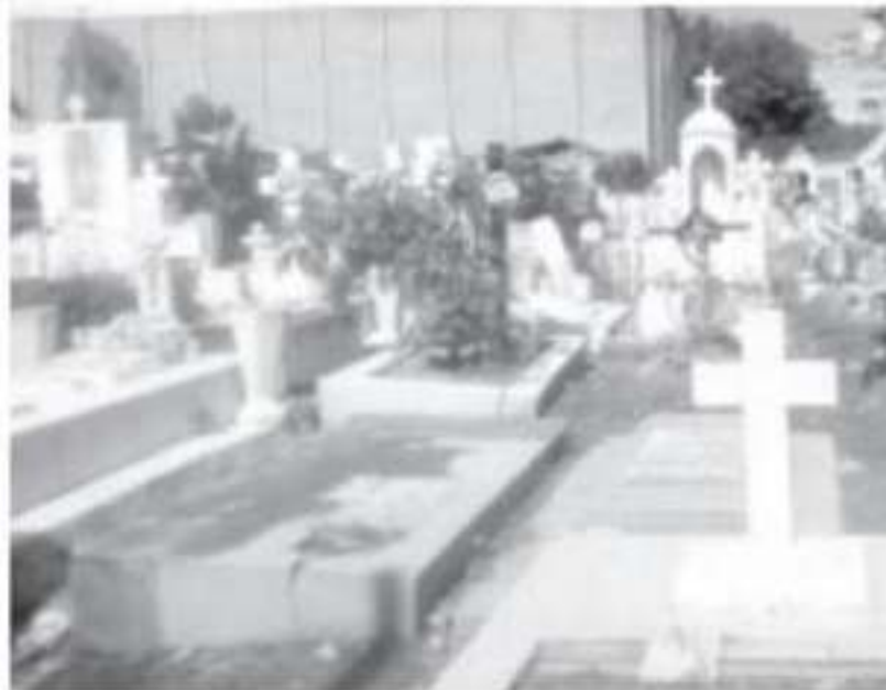
Para tener listo el panteón en los Días de Muertos se han llevado a cabo algunas actividades que se hacen algunas semanas por parte del personal.

Como administrador, se pretende que en todo momento haya personal que pueda atender hasta una brigada.