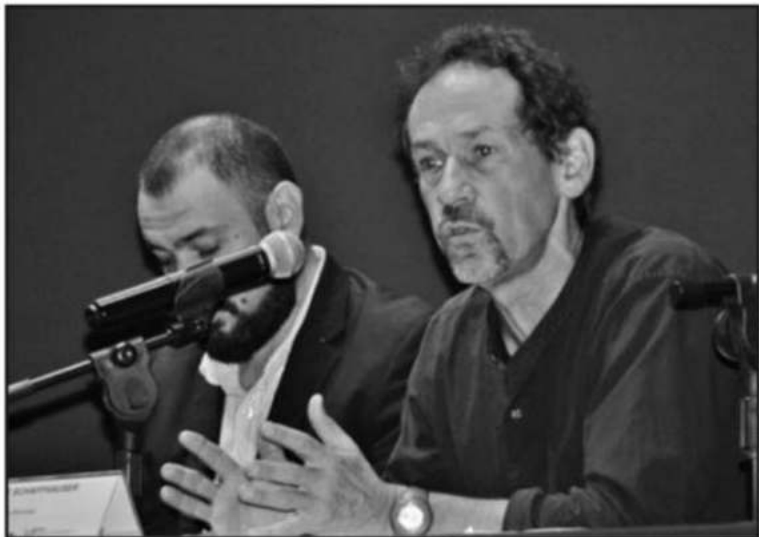
EL ABOGADO SEÑALÓ DE TIBIOS A LOS GOBIERNOS QUE NO HAN LOGRADO DAR SOLUCIÓN Y DE ALARGAR EL PROBLEMA.

taron entre los integrantes y especialistas, debido a que en los últi