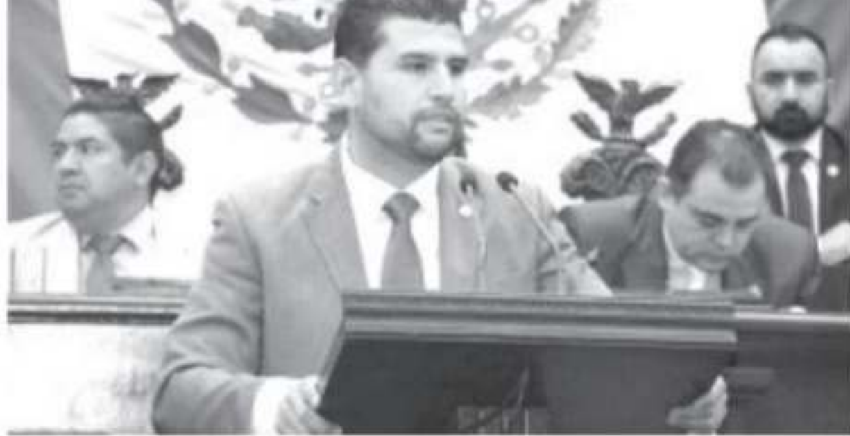
Esta reforma también propone modificaciones a la Ley de Protección Integral a las Personas Adultas Mayores, para implementar programas de cobertura alimenticia y nutricional.

Protección Mayores, al ánica de la igo Familiar, en la que se de adultos. en la máxima presenta en ma Zavala, y o y dictamen n integral de de cada diez violencia. esta iniciativa garantizar una sector de la blicas que se o sean letra