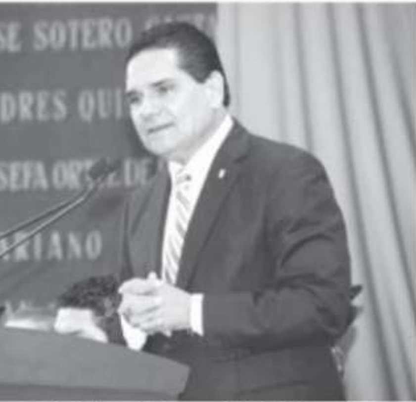
...rencias ideológicas, políticas y partidarias, legítimas todas, no sean Michoacán salga adelante, expresó el gobernador.

de septiembre de Michoacán fue el izo el Gobernador les Conejo, en el uarto Informe de Poder Legislativo. con el Presidente pido que nosotros án", convocó ante representantes de las as en la entidad, sociedad civil, gobernadores. aló que en la es importante histórico que le choacán en los choacán necesita putados federales de Egresos de la las prioridades idad, como la ra, la tecnificación tura turística local