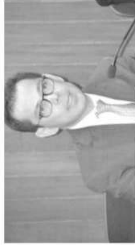
Los magistrados, Omero Valdovinos Mercado y Yolanda Camacho Ochoa.

: sábado la ma- amacho Ochoa ia del Tribunal de Michoacán