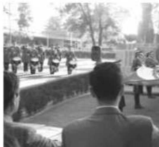
Posterior a los honores a Morelos, dio inicio el

«Esta actividad es un ejemplo de las acciones académicas y extraescolares que los estudiantes y personal docente y no docente de la academia de Ingeniería Electrónica realizan, ya que esta