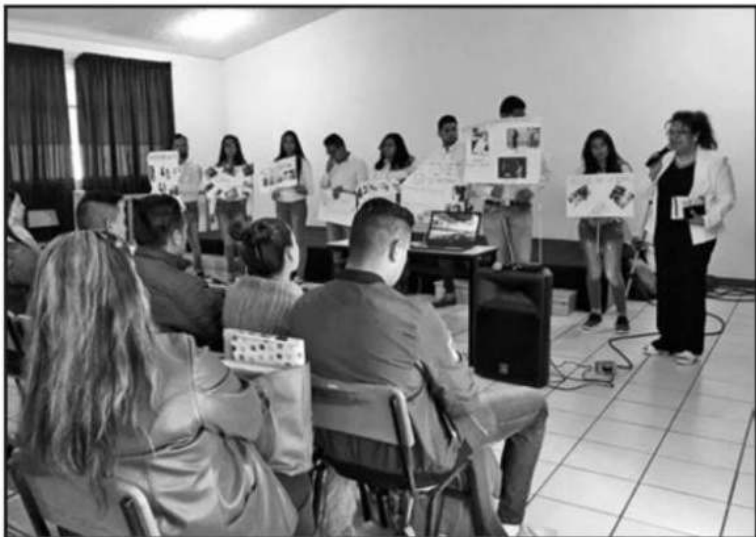
LOS ALUMNOS DE NUEVO INGRESO DE LA UBBJ SEGUIRÁN SIEMPRE QUE SE GARANTICE CONTINUIDAD.

cursan carrera universitaria tecnológica