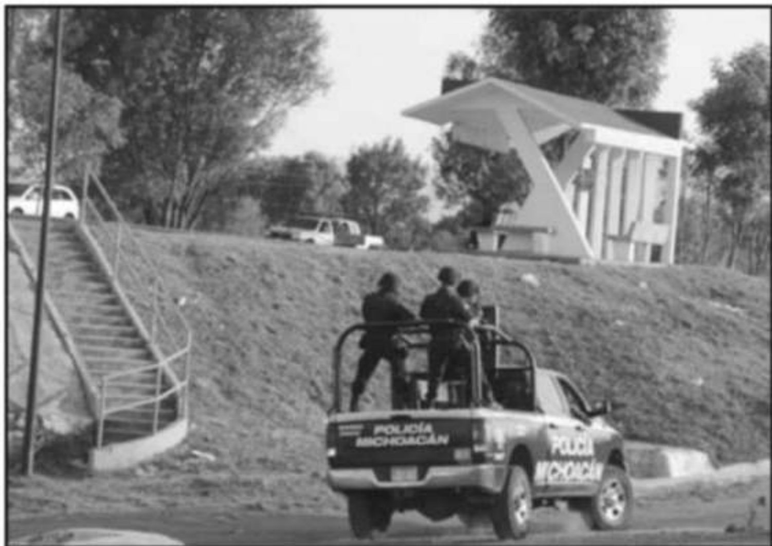
LOS AGENTES SE HAN QUEJADO DE LOS BAJOS SUELDOS Y LAS MALAS CONDICIONES PARA HACER SU TRABAJO.

Silvano Aureoles Conejo, GOBERNADOR DE MICHOACÁN