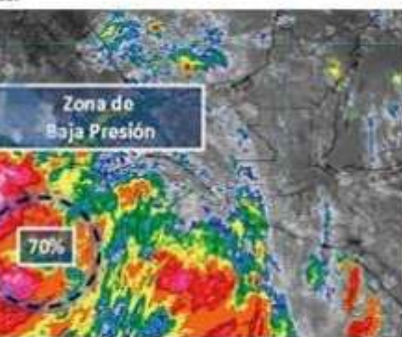
El litoral de Guerrero en alerta ante potencial ciclónico en el litoral.