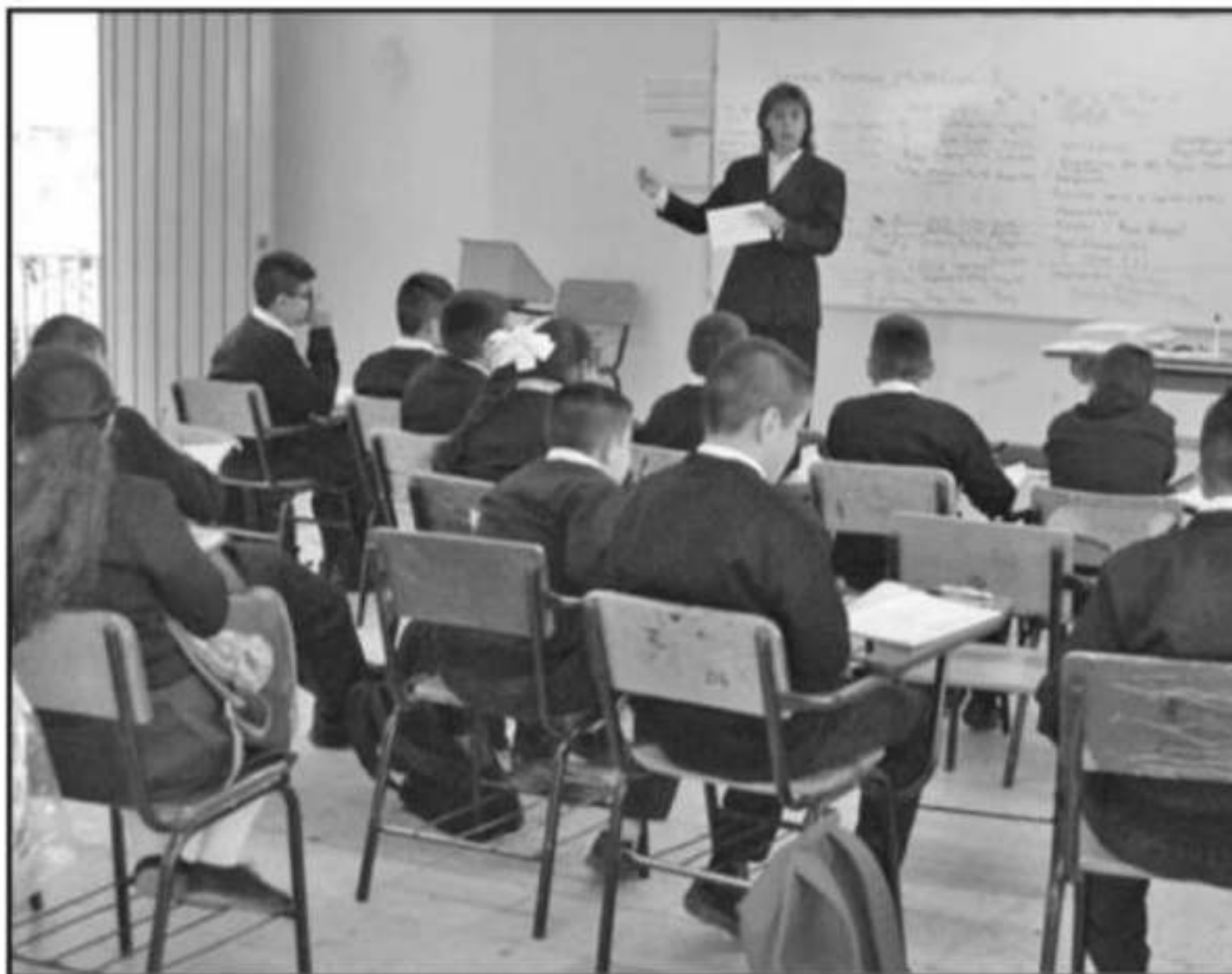
LA REPROBACIÓN EN NIVEL SECUNDARIA ES UNO DE LOS PRINCIPALES INDICADORES QUE BUSCAN DISMINUIR EN LA ENTIDAD

tos externos por los que muchos de los problemas no pueden ser atendidos, como estos fenómenos sociales ligados a la situación de pobreza o vulnerabilidad, y por ello era la importancia de que programas compensatorios sigan existiendo.