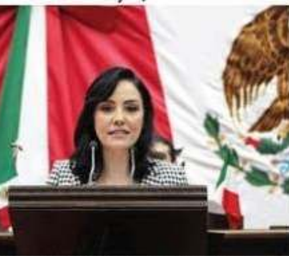
Presentó la iniciativa de reforma a la fracción VI del artículo 5 de la Ley de Protección de Datos Personales en Posesión de Sujetos Obligados.

Mantener vigilancia en escurrimientos que pueden presentarse en zonas de riesgo, tener precaución con el riesgo de caída de árboles, cables aéreos y tendido eléctrico, hacer caso a rumores, seguir las indicaciones del personal de Protección Civil y reportar cualquier incidencia al número de emergencias 911.