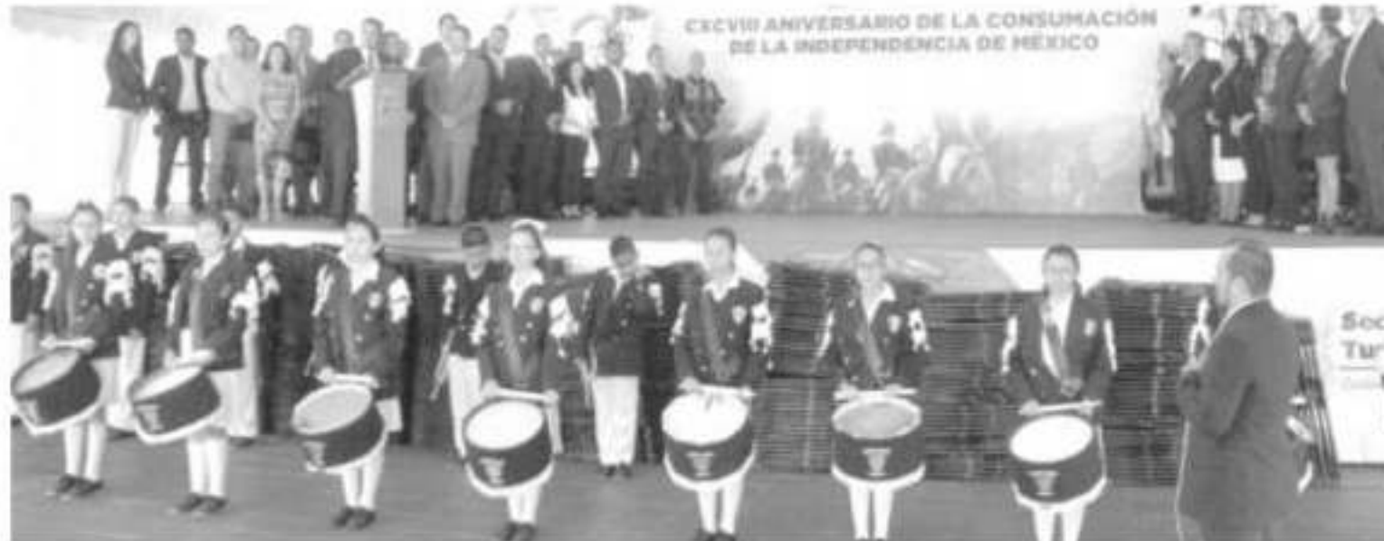
Alumnos del 1º D de la Escuela Secundaria Técnica 66, declamaron la poesía Ante el altar de los caudillos de la Independencia .

directivo de la Escuela Secundaria Técnica 66, el orador subrayó que a 198 años de la consumación de la Independencia, la sociedad mexicana sigue exigiendo justicia e igualdad.