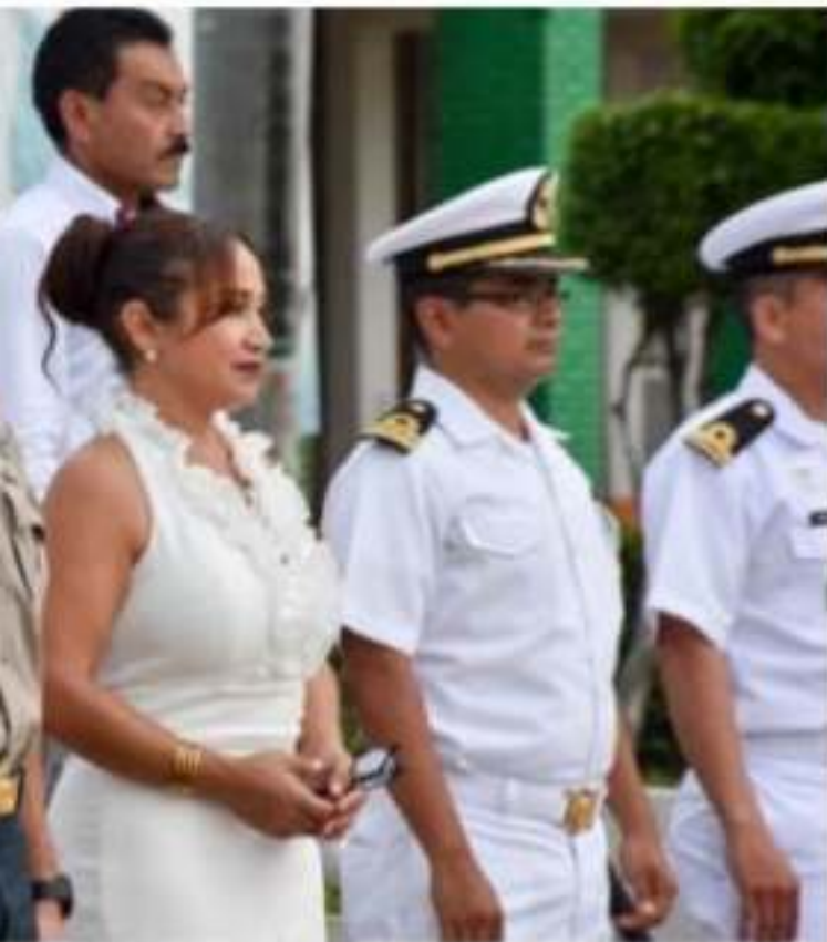
Con un acto cívico, al que acompañaron alumnos de la Academia Federal "Jaime Torres Bodet", el gobierno municipal de la Consumación de Independencia de México.