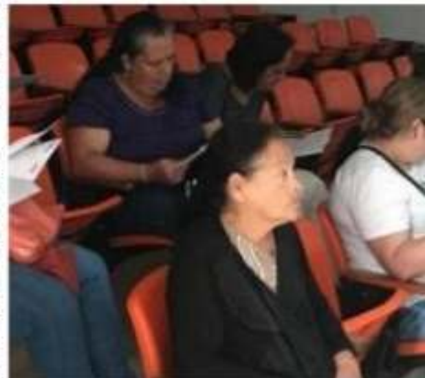
TOCUMBO, MICH.- El ayuntamiento viene promoviendo el programa Palabra de Mujer.

Finalmente la funcionaria recibiendo las solicitudes; Para acceder a este programa las interesadas deben acudir a las instalaciones de la Casa de la Mujer en Santa Clara o en la presidencia municipal.