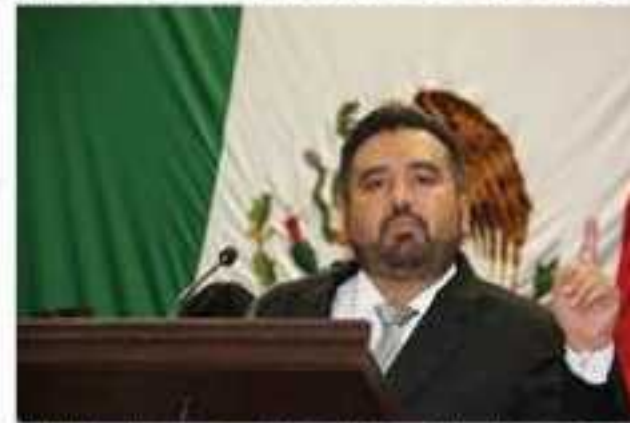
Erik Juárez Blanquet, presidente de la Comisión de Puntos Constitucionales del Congreso del Estado.

“Nuestro deber como legisladores es tomar las medidas pertinentes para solucionar el problema del incumplimiento de la obligación alimentaria puesto que todas las normas que regulan los problemas inherentes a la familia se consideran de interés social y de orden público”.