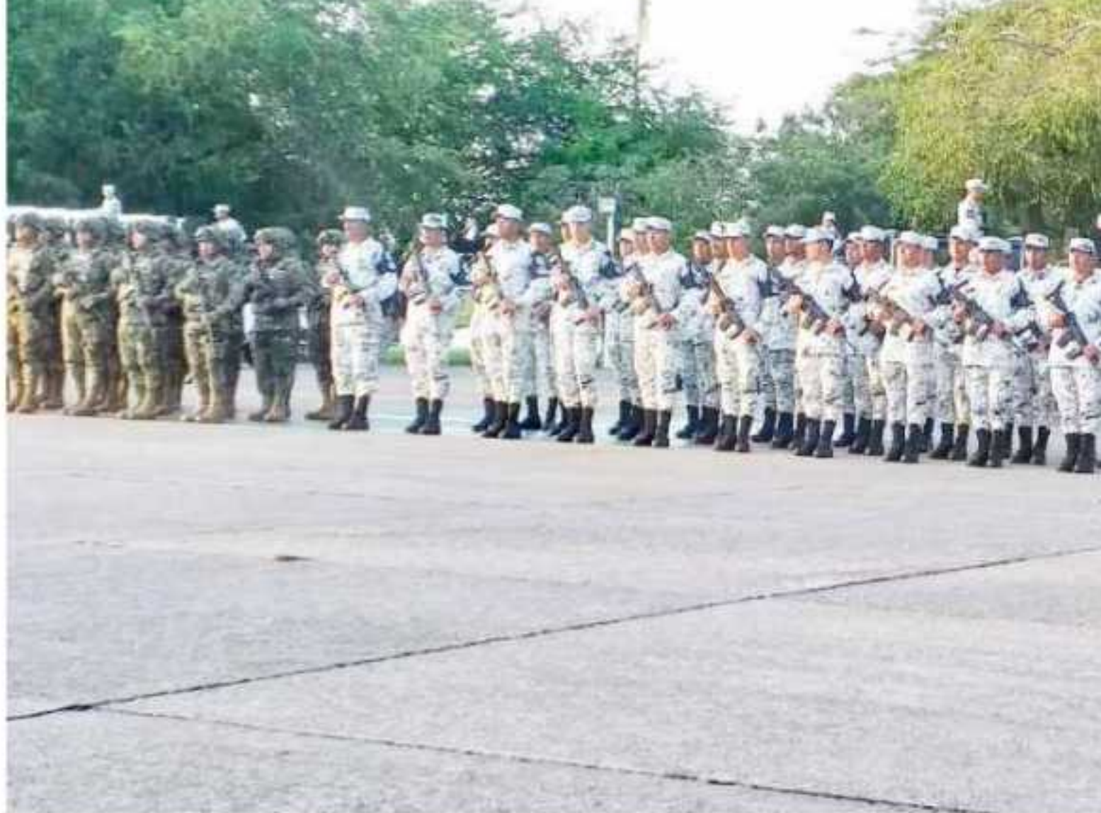
CD. LÁZARO CÁRDENAS, MICH.- La confianza como la efectividad de la Guardia Nacional para las personas mayores de 65 años de edad, según la Encuesta Nacional de Seguridad Pública Urbana, es del 76.3 por ciento, señala la Encuesta Nacional de Seguridad Pública Urbana.

dad o la e la rso- zaro ento. e al se ción ncu- las s en a la con dad de cre- nal 9%, esto por- bajo licia nza así en taje e de que, nal, mejor dos el