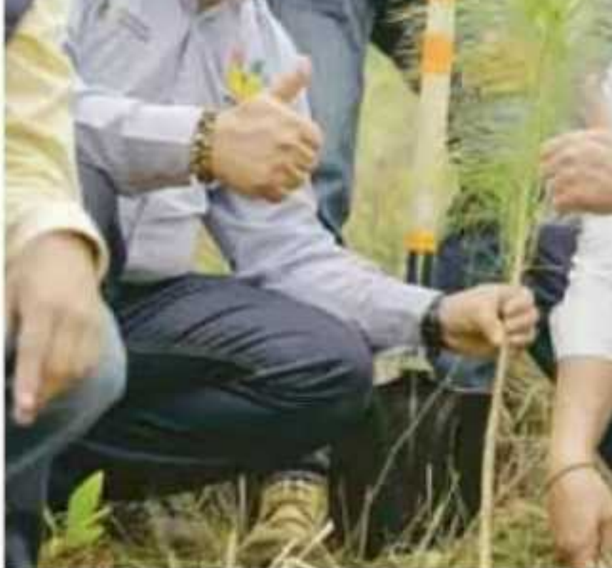
La restauración de las laldas del Cerro de la Cruz comenzó este fin de semana; abastece de agua por filtración y escurrimiento al río Cupatitzio, uno de los pu- incendios en el municipio de Uruapan. En compañía de brigadistas, sociedad c- no, se llevó a cabo un trabajo integral donde se tiene proyectado que sobrevi- que se prevé plantar, toda vez que se trabajará de manera conjunta con la Polis Ambientales. Las jornadas de reforestación se realizarán en todo el estado y t- tras el cambio ilegal de uso de suelo, incendios y tala ilegal.

En noviembre de 2011, durante el sexenio de Felipe Calderón, el entonces secreta-