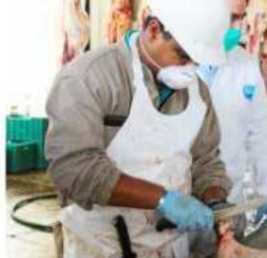
ZAMORA, MICH.- La administración local busca lograr la certificación del rastro municipal para garantizar que los cárnicos inocuos.

ar para poder lograr el objetivo, se tuvo la visita de personal de la Segunda trabaja de manera coordinada con ellos, para atender los detalles que les faltan, tención a evitar que ingresen alimentales con clenbuterol, para evitar daños en