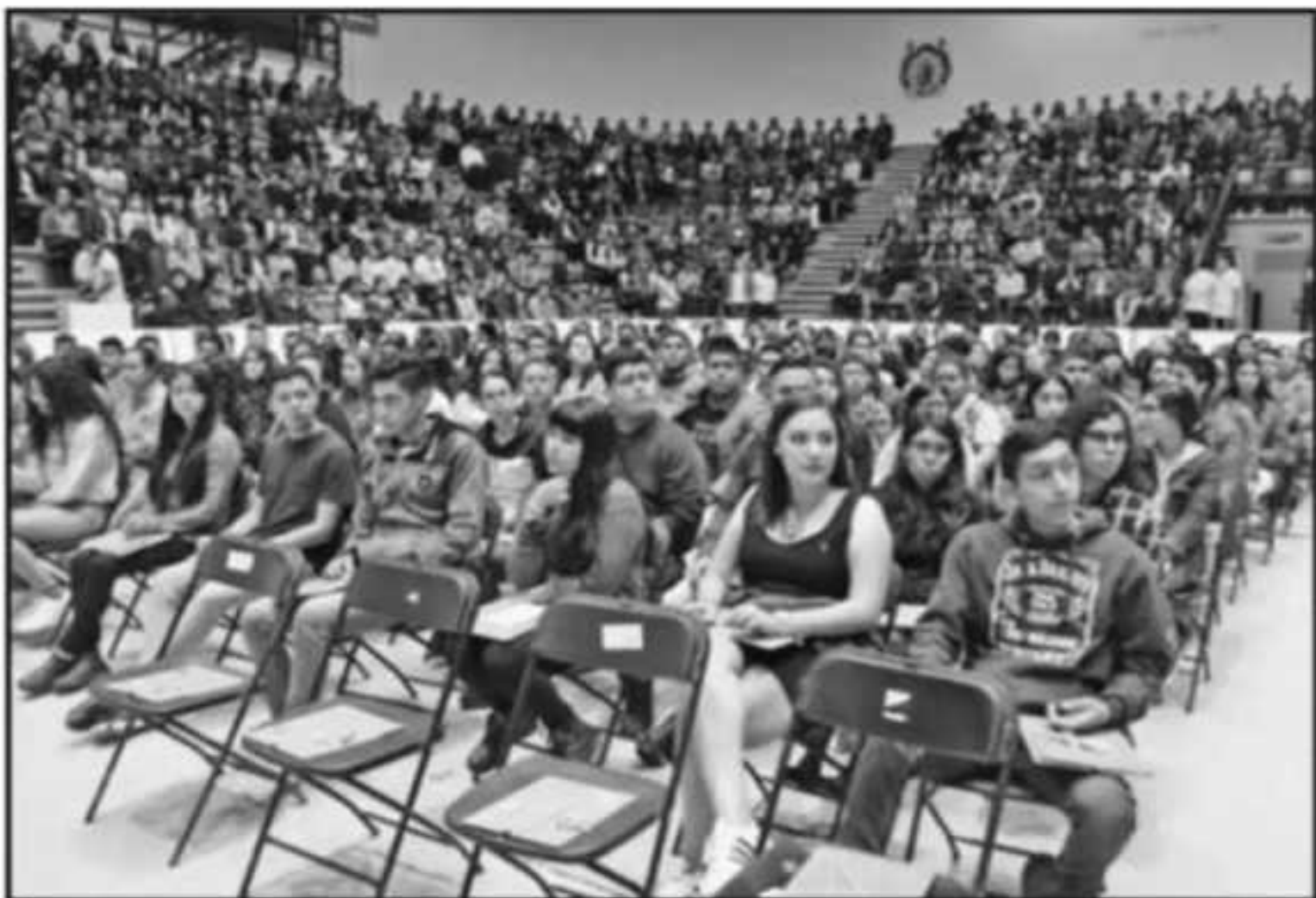
EL PRÓXIMO EXAMEN DE INGRESO A LA UNIVERSIDAD MICHOACAN DE SAN NICOLÁS DE HIDALGO ES EL 2 DE AGOSTO.

tas, Metalurgia, Materiales Ingeniería y Arquitectura el cupo es de 406 y las prefichas son 247; en Humanidades y Derecho son 778 el cupo y van 330 prefichas.