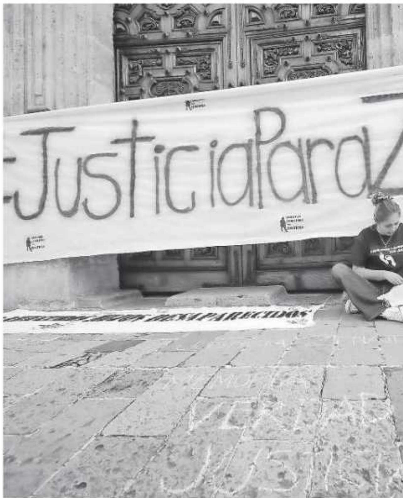
Organizaciones civiles exigen a las autoridades solución y respuesta a las investigaciones

plica cuando acuden a la Ejecutiva de Atención a así lo denunció también