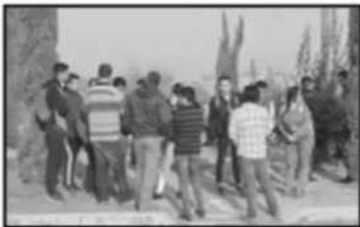
NO FUE SINO HASTA HACE UNAS SEMANAS QUE LOS SINDICALIZADOS PERMITIERON REGRESAR A CLASES.