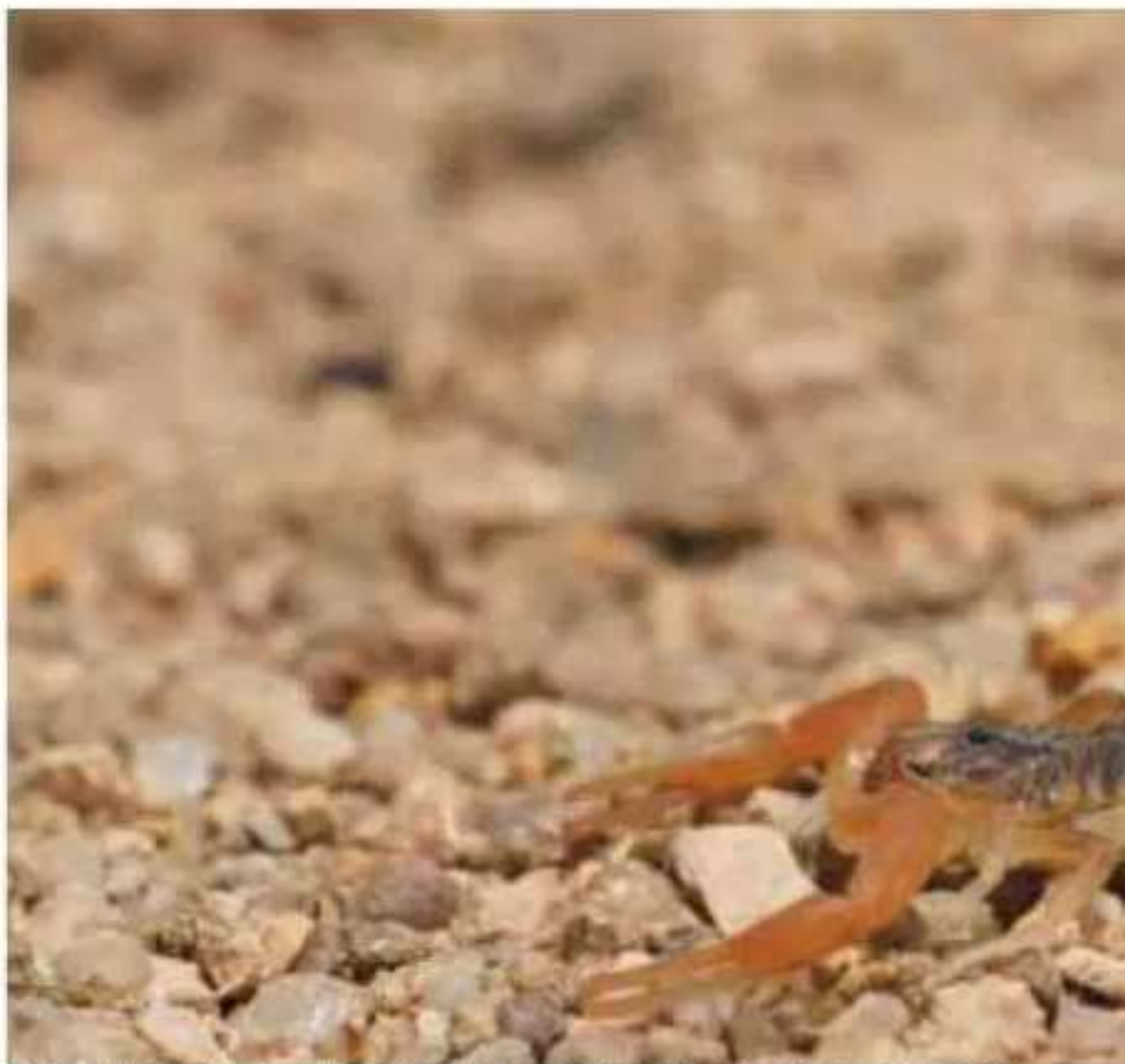
Es importante sacudir ropa y calzado antes de ser usado, además de evitar andar descalzo.

Estos animales suelen esconderse o anidar en lugares como piedras, árboles, cuevas, huecos en la pared o el piso, entre otros