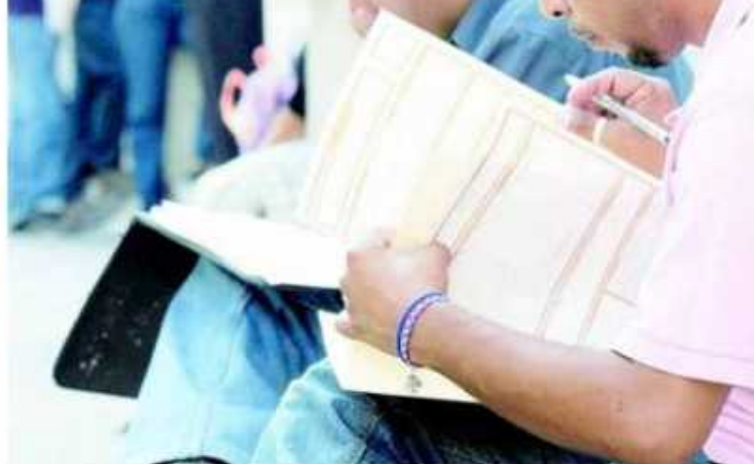
APATZINGÁN, MICH.- A través del programa nacional de becas "Jóvenes Construyendo el Futuro" se beneficiarán a más de mil 365 jóvenes.

Los trabajos de atención médica y el "Convoy de la Salud" en coordinación con el gobierno estatal se realizará a partir de este día a las nueve de la mañana en el Mercado de Aguililla.