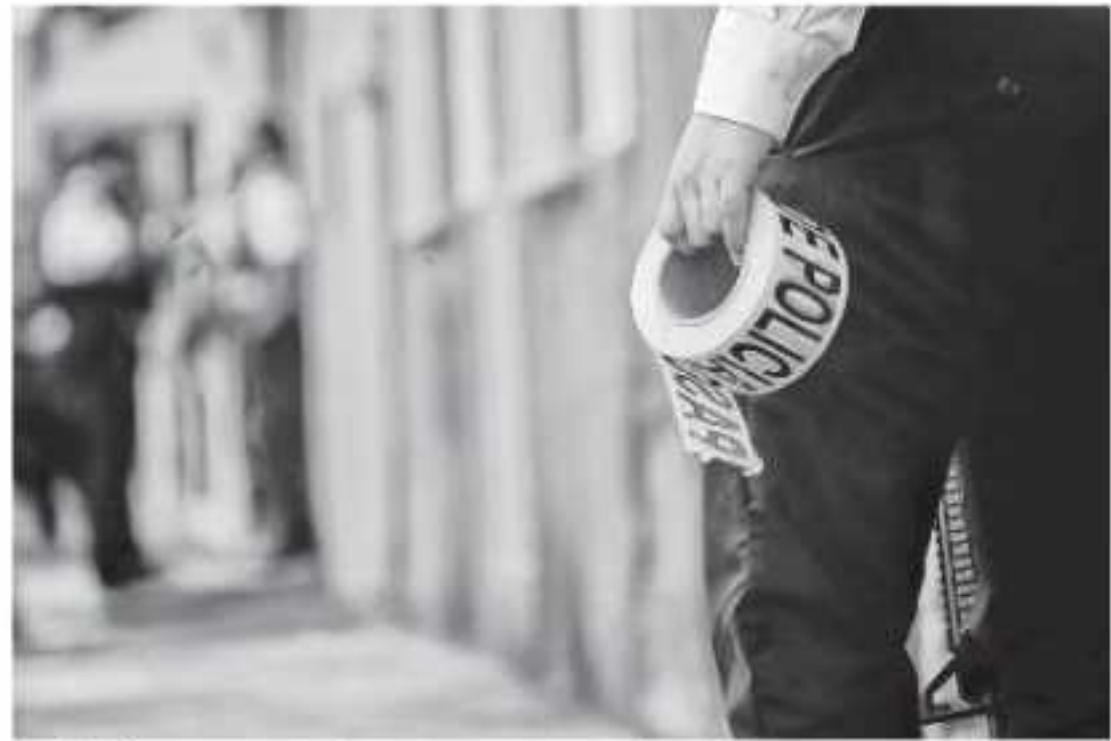
En el primer semestre de este año se acumularon 682 casos

ra la paci- durante la gobernador onejo los ertes vio- ido incre- n se des- eliminara cional de