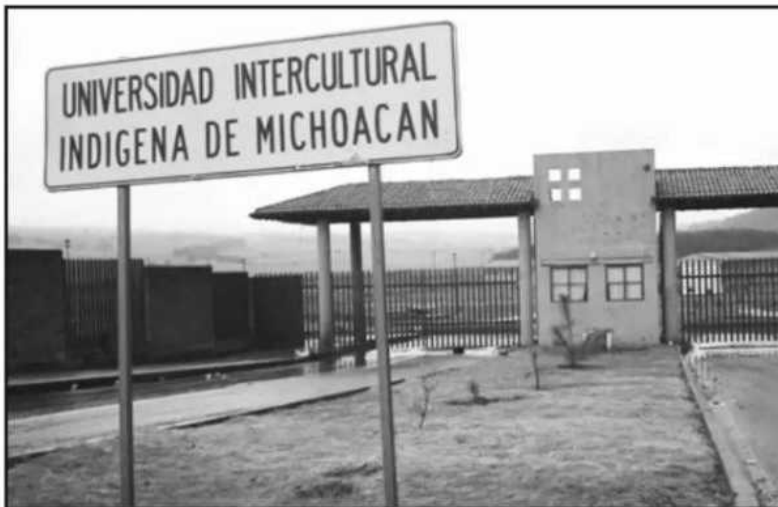
UBICADO EN EL KILÓMETRO 3 DE LA CARRETERA DE PÁTZCUARO A ERONGARICUARO, EL CAMPUS DE LA UNIVERSIDAD INTERCULTURAL