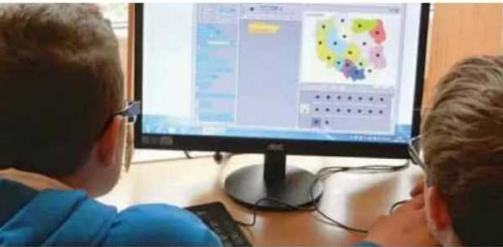
Tecnologías de Información y Comunicación son un factor clave para el desarrollo, aseguran expertos.