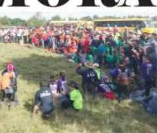
Conafor en esta región coordina labores de reforestación en 10 hectáreas.