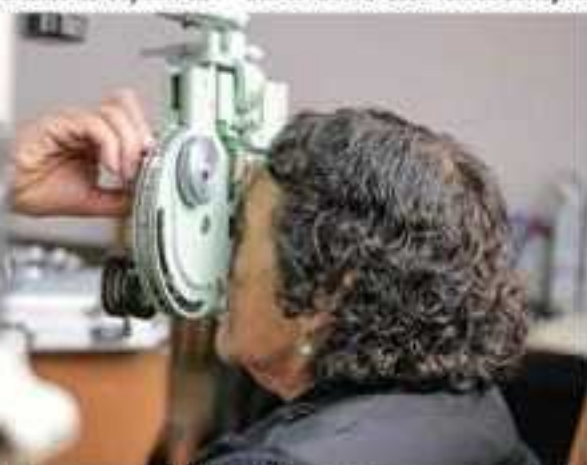
El médico recorre municipios del Distrito 01 para mejorar calidad de vida de michoacanos.

"En nuestra Casa de Estamos con un médico que servicios a los habitantes de 01 y cuenta con medicación bajo costo que ha gestiona Grupo Parlamentario de Acción Nacional, siempre yo a los michoacanos mables", sostuvo.