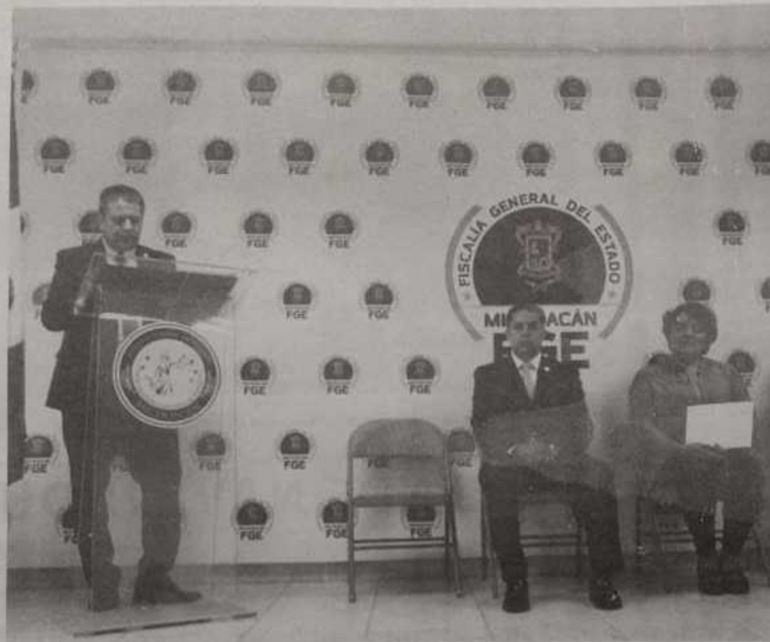
Clausura FGE y UAQ especialidad en Instrumentación Analítica con lo cual Michoacán es pionero en certificación en este rubro de investigación