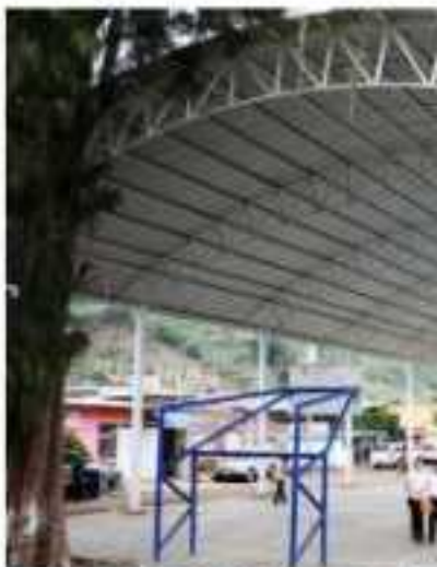
LOS REYES, MICH.- Continúan supervisando e inaugurando obras.

El director de Obras Públicas aseguró que en otras ocasiones en el sentido de 'relumbrón', sino trabajos específicos de la ciudad que se ejecutaron con los más altos costos. Mucho trabajo que no se ve en las líneas hidráulicas y sanitarias que duran por muchos años.