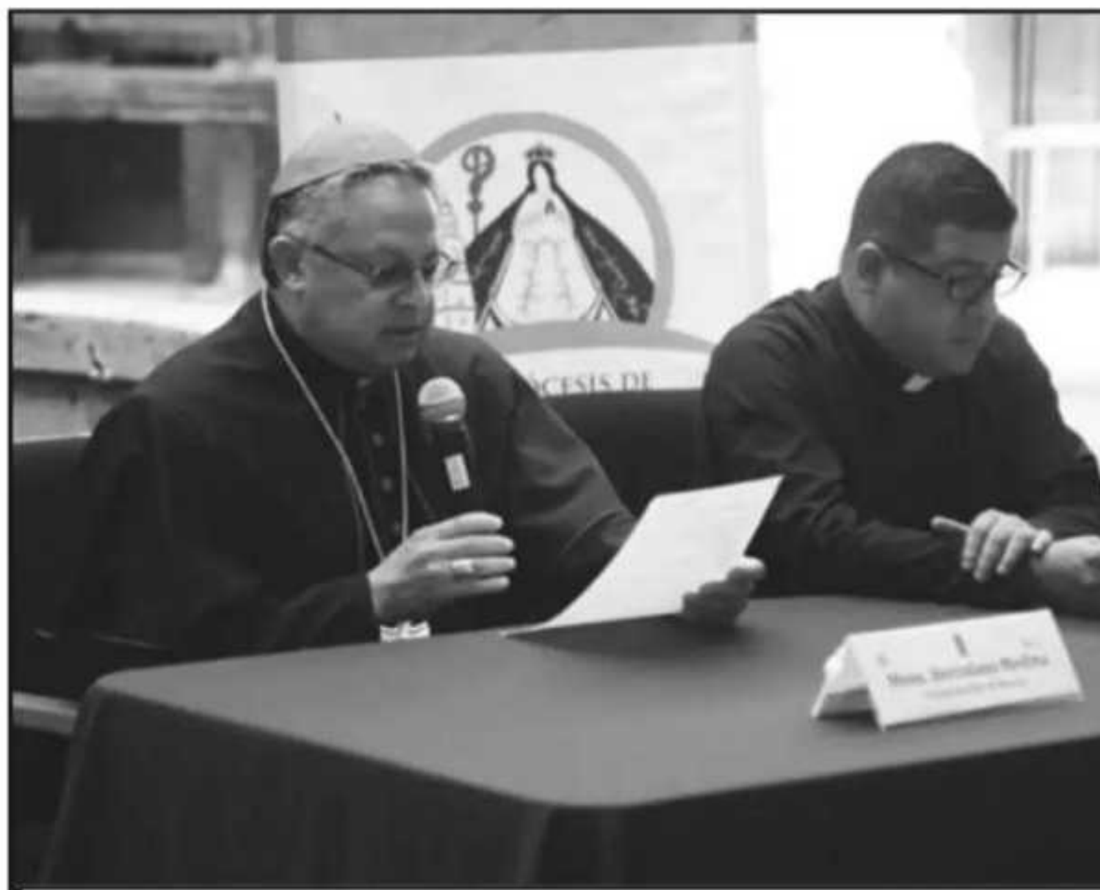
LA ARQUIDIÓCESIS LOCAL ORDENA CONTINUAMENTE SACERDOTES Y LOS ACTUALIZA EN DIVERSOS TEMAS; ENTRE ELLOS H

con la Ouija, abren puertas", comentó el obispo.