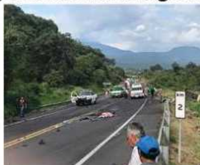
Un muerto y cinco lesionados dejó el choque de una camioneta y un autobús el pasado sábado en la autopista Siglo XXI.

Diversas organizaciones de auxilio acudieron al lugar, así como elementos policiacos, estos últimos para acordonar el lugar.