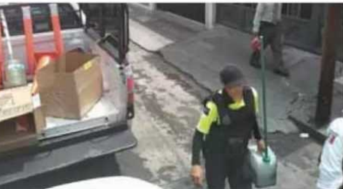
844 a mil 267 pesos.

ara que la población no puede utilizar artículos que