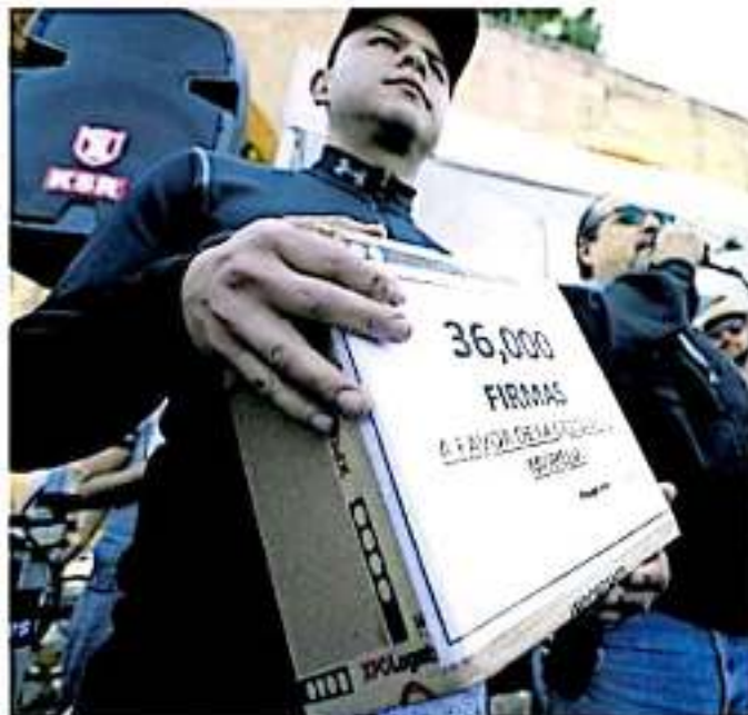
Se buscan alternativas para resolver el conflicto por dicha vialidad.

Hace pocos meses de dos semanas fue lanzada una encuesta ciudadana en la plataforma de change.org "Si a la Ciclovia en Morelia" que ha logrado reunir 36 mil firmas electrónicas y tiene una expectativa de llegar a los 50 mil firmas.