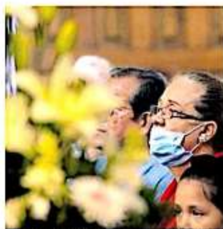
Aún no se ha fijado medidas sanitarias para prevenir el contagio.

De acuerdo con la Dirección General de Epidemiología Nacional, existen cinco casos positivos en el país en Ciudad de México, Chiapas, Estado de México, Coahuila y Sinaloa, mientras que cuatro se encuentran como casos sospechosos, los cuales están ubicados en Guerrero, Jalisco, Veracruz y Aguascalientes.