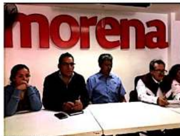
MORELIA, MICH.- En conferencia de prensa, este domingo se dio a conocer que el próximo fin de semana Morena elegirá nueva dirigencia estatal.