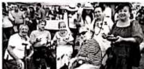
MORELIA, MICH.- Las y los michoacanos nos unimos para ayudar a quienes más lo necesitan, eso nos enorgullece como michoacanos porque lo sabemos hacer bien.

"Nosotros venimos desde el municipio de Zitácuaro muy contentos y muy felices de poder contribuir para apoyar a quienes más lo necesitan y más, si se trata las niñas y niños de nuestro estado" finalizó.