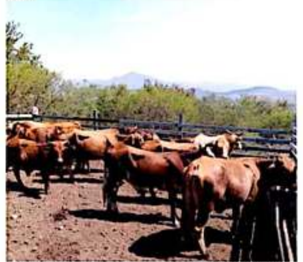
URUAPAN, MICH.- La cancelación que el gobierno federal ha hecho de programas de apoyo a la actividad agropecuaria, pone en riesgo de desaparecer al sector ganadero en esta región.

Finalmente, dijo que están a la espera de propuestas de proyectos por parte de autoridades municipales y estatales, en apoyo al sector ganadero.