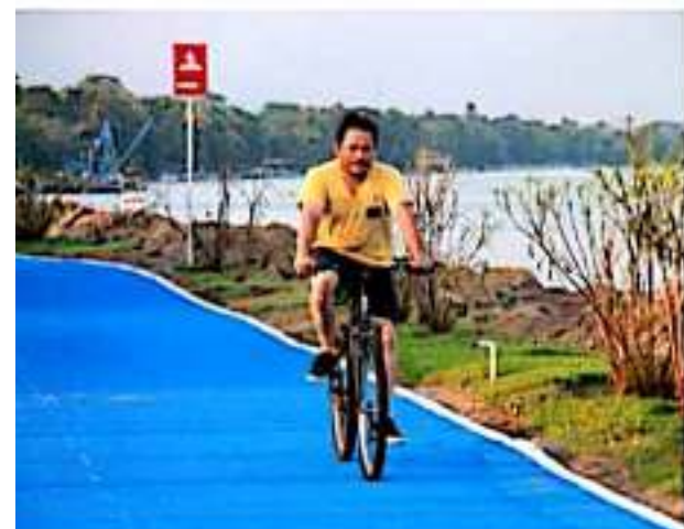
CD. LÁZARO CÁRDENAS, MICH.- Apliac dio a conocer que durante el 2019 se ofreció el préstamo de 4,115 bicicletas a diversos usuarios, cifra que se espera incrementar en este año;

Con el uso de las APIbicls en el Malecón de la Cultura y las Artes