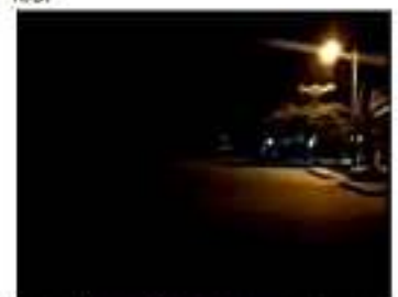
CD. LÁZARO CÁRDENAS, MICH.- Van dos asaltos en esta semana por la ausencia de iluminación en calles de la colonia El Ejido de Las Guacamayas.

Por ello hacen un exhorto a la autoridad municipal, tanto de Alumbrado Público, como de Seguridad Pública, ya que esta carencia ha permitido que se incrementen los robos a casa habitación y los asaltos a transeúntes, por lo que señalan como urgente la rehabilitación de lámparas, pero también el incremento de la vigilancia de elementos policiales.