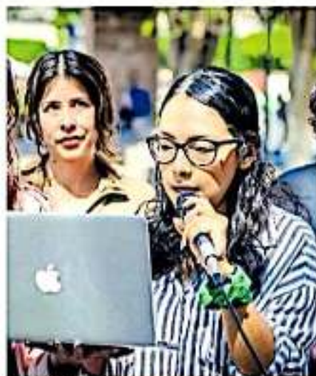
En rueda de prensa señalaron que es importante politizar esta fecha.