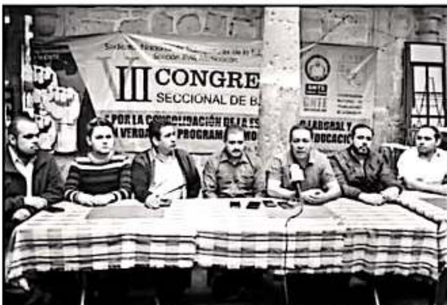
GRUPO SINDICAL ZAVALESTA ANALIZA LA RUTA A SEGUIR EN MEDIO DE LAS PUGNAS Y DIVISIONISMO EN LA CNTE.

violencia, como profesores deben ser un ejemplo y que están contratados para dar clases, además del que el problema de pago está resuelto”.