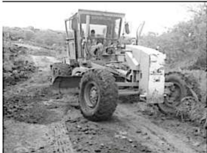
Tan sólo en Uruapan, fueron 120 acciones las realizadas en 2019 en beneficio de mil 200 familias de 25 comunidades del municipio, y se invirtió una cantidad superior a los 2.4 millones de pesos.

Finalmente, el funcionario citó que la institución a su cargo cuenta con 250 equipos de maquinaria pesada, la cual de manera permanente, realiza labores en diferentes municipios de la entidad.