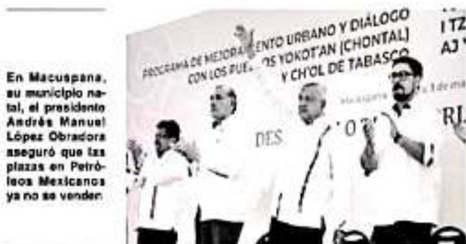
En Macuspána, su municipio natal, el presidente Andrés Manuel López Obrador aseguró que las plazas en Petróleos Mexicanos ya no se venden.