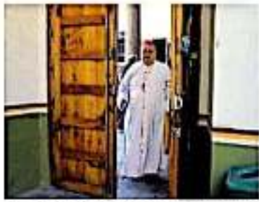
El prelado solicitó enfrentar la enfermedad siguiendo las medidas de salud.

En otro tema, externó que la Arquidiócesis de Morelia permitió que las integrantes del sexo femenino que trabajan en dicha institución participen en el paro nacional del próximo 9 de marzo, si así lo desean.