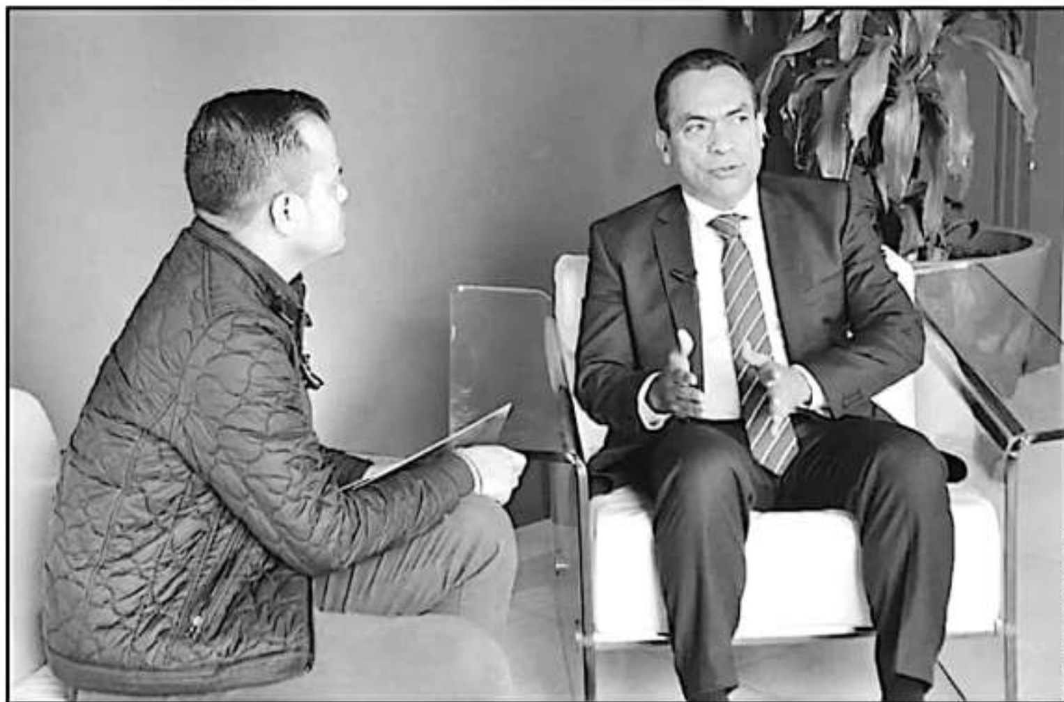
PARA EL FISCAL, LAS ESTADÍSTICAS DICEN QUE, SALVO LOS HOMICIDIOS DOLOSOS, LOS OTROS DELITOS DE ALTO IMPACTO MANTIENEN UNA TENDENCIA A LA BAJA, TAMBIÉN EN EL IMÉJ COMO EN MICHOACÁN.

porque se trata de la privación de la vida de una persona, sin embargo, por esa lentitud en crecimiento se debería recargar en recursos humanos y materiales para combatir algo que está lastimando sensiblemente a la sociedad michoacana.