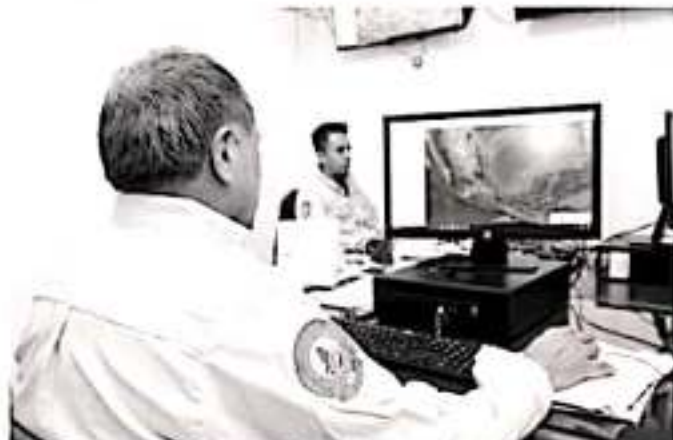
MORELIA, MICH.-Son más de 40 llamadas de emergencia las que, en promedio, se reciben diariamente en este Centro durante la temporada de estiaje

Finalmente, y tras lamentar que el 90 por ciento de los incendios son provocados por la población, Julio César lanzó un llamado a tener conciencia del daño que causan los incendios de pastizales y de bosques e invitó a la ciudadanía en general, a cuidar nuestras zonas forestales atendiendo todas las recomendaciones.