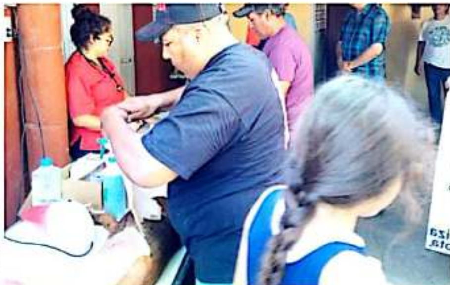
APATZINGÁN, MICH.- 112 animales fueron intervenidos durante la jornada de esterilización de perros y gatos.