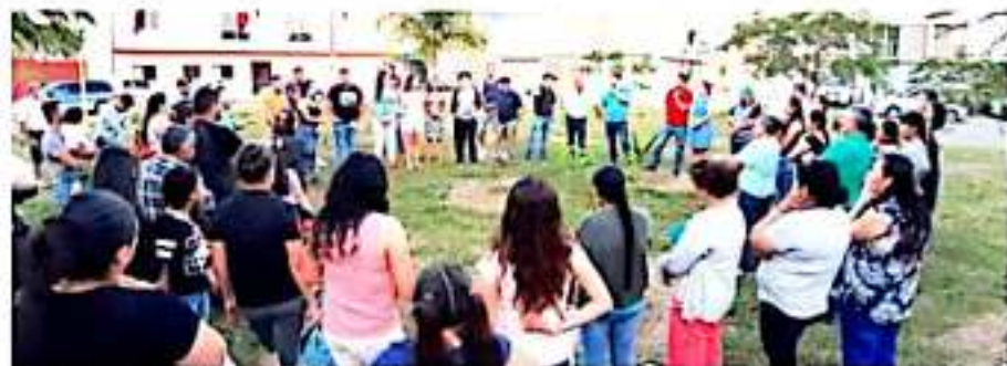
LOS REYES, MICH.- Se formalizó la creación del comité vecinal del Fraccionamiento Agua Blanca.

Finalmente, integrantes del recién conformado consejo manifestaron su total disposición para trabajar hombro con hombro con el ayuntamiento y de entrada, plantearon una serie de acciones como aprovechamiento de áreas verdes, creación de espacios deportivos y medidas en rubros como seguridad y vialidad, entre otros.