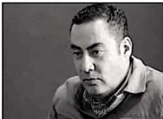
EL DIRECTOR DE RECAUDACIÓN, SEÑALÓ QUE ANTE LA OLA DE FRAUDES EN LA COMPRA Y VENTA DE UN AUTO ACUDAN POR ORIENTACIÓN.

Atiende tu salud y que regrese el a la cama.