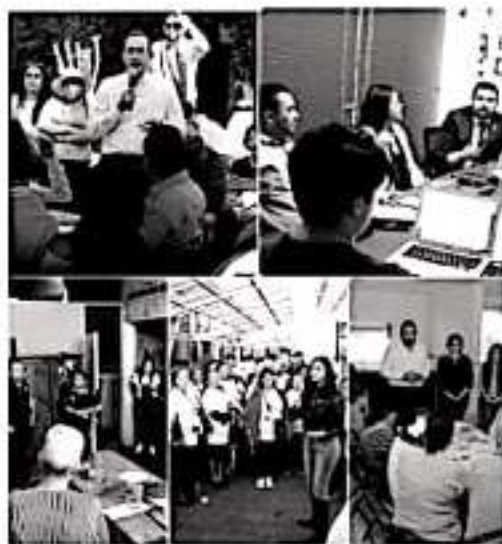
MORELIA, MICH.- Ante la presencia de casos de coronavirus en territorio nacional, el Gobierno Federal debe implementar protocolos para atender a la población de manera oportuna y hacer llegar a toda la población la información clara y precisa sobre este virus.

Cabe señalar que este brote de coronavirus, se originó por exposiciones en un mercado de pescados y mariscos de la ciudad de Wuhan en China, y debido a que se da por contagio humano, han venido registrándose casos en diferentes países.