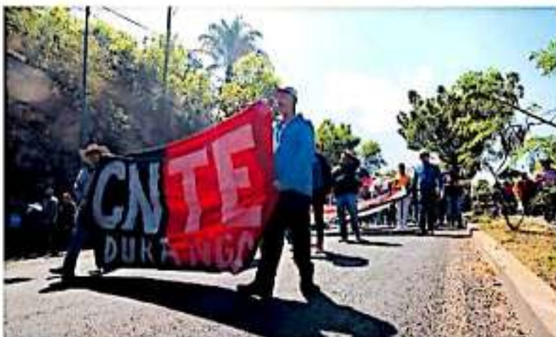
Se ha llamado a una movilización el próximo miércoles 4 de marzo.