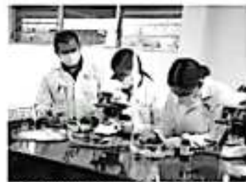
Son mujeres con ímpetu, carácter, fuerza e inteligencia, quienes además de ser un orgullo para su estado, día a día buscan conquistar sus sueños.

Así, sencillas, inteligentes y campeonas, son las alumnas del CECyTEM, son mujeres extraordinarias.