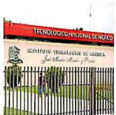
Este año ampliaron en nivel de absorción pasando de 60 a 65 por ciento

MÁS DEL 70 por ciento de las personas que logran egresar en la institución emigran a otros estados