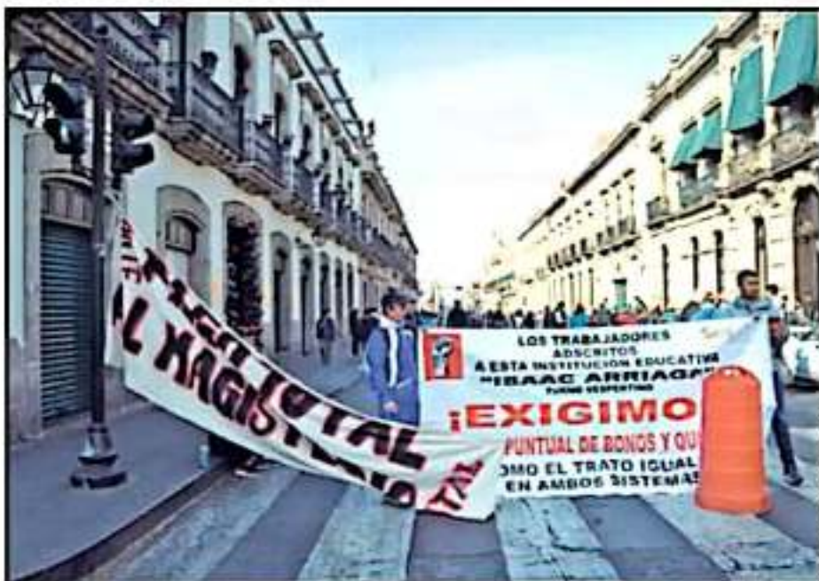
PROFESORES DE NIVEL MEDIO SUPERIOR Y SUPERIOR EXIGEN EL PAGO DE PRESTACIONES AJRASADAS, COMO BONOS

Sin embargo, reiteró que no se puede lavar las manos el Gobierno del Estado, parte de la negociación fue que se pagaba el último bono del 2018 primero el 20 de diciembre y todo el adeudo de 2019 se iba a negociar con mesas de trabajo para su calendarización, ambos compromisos no se cumplieron.