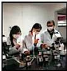
ALUMNAS DESARROLLAN SU PROYECTO DENOMINADO “HIBICUS”.

Destacó que en su grupo participan unos 20 personas que practican dos o tres días por la tarde, ello sin interrumpir sus labores productivas. “Atender y comprender la esencia de la cultura purépecha, es una prioridad para nosotros, pues no se trata de un movimiento de moda, es una participación integral.