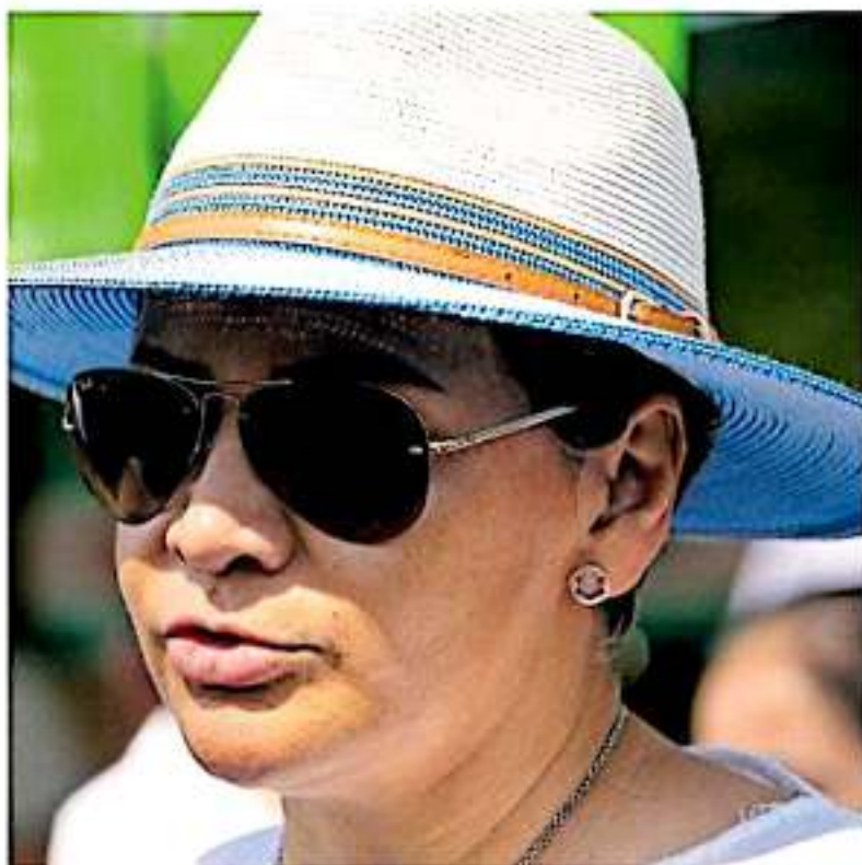
La funcionaria recordó que el virus oriental tiene “alta transmisibilidad” EL SOL DE MORELIA

“Muchos nos podemos enfermar, pero pocos podemos morir por la enfermedad”, aseguró la secretaria de Salud. Señaló que todas las defunciones que se susciten y no