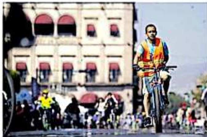
Se estará experimentando en los próximos días con las rutas del transporte, señaló el titular de Cicorra.