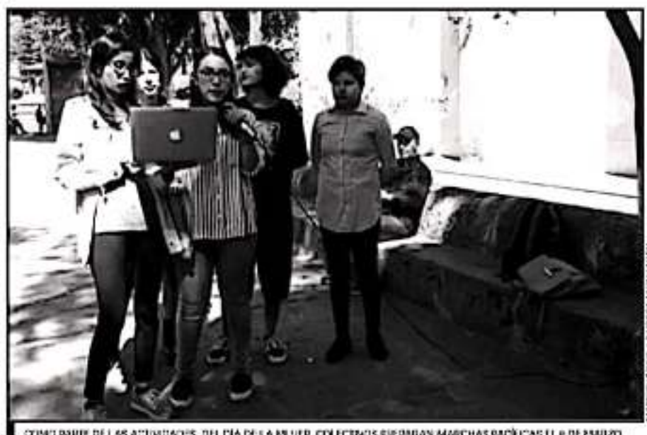
COMO PARTE DE LAS ACTIVIDADES, DEL DÍA DE LA MUJER, COLECTIVOS PREPARAN MARCHAS PACÍFICAS EL 8 DE MARZO.

habrá la oportunidad de que hombres se integren a la manifestación, siempre y cuando respeten los espacios designados.