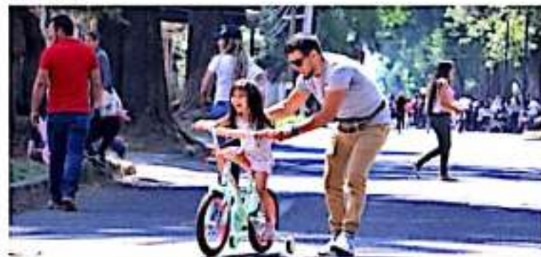
URUAPAN, MICH.- Los "Domingos Familiares" cumplen con su objetivo de fortalecer la convivencia de la célula de cualquier sociedad.

La funcionaria reiteró también el reconocimiento al trabajo de los elementos de Protección Civil y Seguridad Pública para garantizar la tranquilidad de los asistentes.