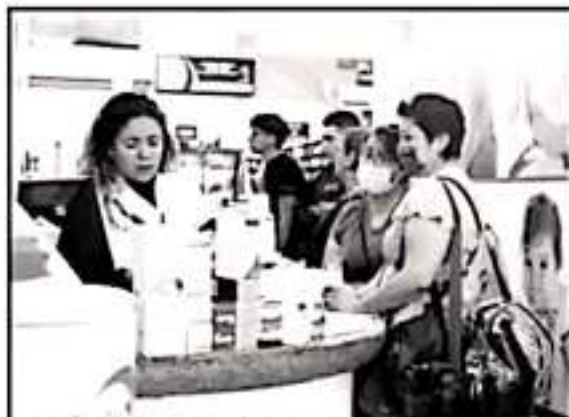
PREMIO ESTARÁ AL PENDIENTE CON LOS PRECIOS DE LOS MEDICAMENTOS.

En este sentido, la Secretaría de Salud reiteró que el caso sigue sin ser alarma nacional, por lo que pidió mesura en las compras. La dependencia federal señaló que no es mala idea la adquisición de algodón, alcohol, desinfectantes cloro e incluso algunos alimentos no perecederos, más reiteró en no abusar ni comenzar con las compras de pánico.