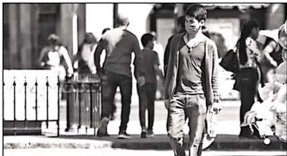
EL USO DE CUBREBOCAS NO GARANTIZA EVITAR EL CONTAGIO DE CORONAVIRUS, SI NO SE SIGUEN OTRAS MEDIDAS COMO LAVARSE LAS MANOS FRECUENTEMENTE.