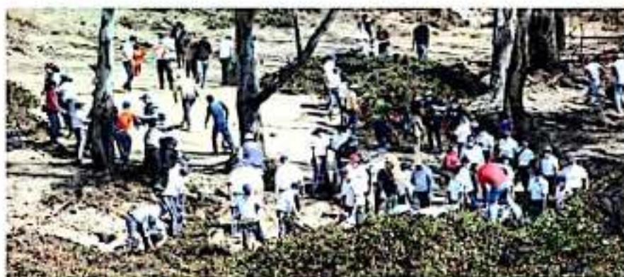
Instancias estatales se suman a los trabajos de prevención, contención y remediación de daños ambientales en la zona de Morelia, de cara a la temporada de estiaje

Por ello, el Gobernador Silvano Aureoles ha dado indicaciones de destinar maquinaria para facilitar e intensificar la extracción del lirio acuático, a la vez que ha efectuado aportaciones económicas para la reparación de equipos destinados a esta actividad, medidas que serán complementadas por apoyos financieros, materiales y humanos de diversas instancias y dependencias estatales.