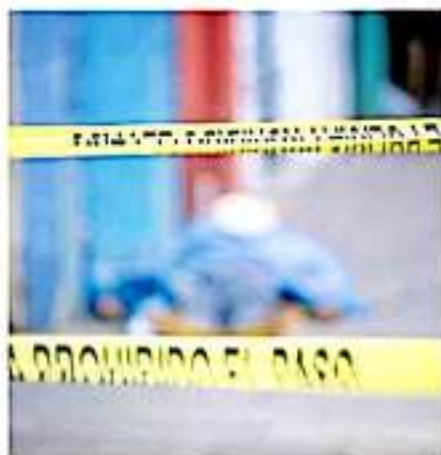
En el municipio de Uruapan, la víctima quedó tendida sobre la cinta asfáltica.

punzo cortante. Luego de notificarse una llamada al 911, la Policía de Morelia fue alertada de que al interior de un domicilio en la calle Manantial del Obispo en el estado fraccionamiento, se encontraba el cuerpo sin vida de una mujer de entre 20 y 30 años. Elementos de la Fiscalía se apresuraron al lugar donde se observó una zona para iniciar el levantamiento del cuerpo en coordinación con las investigaciones correspondientes. En ninguno de los casos se confirmó la detención de los presuntos autores de los crímenes. Con bifemación de Beth Cruz.