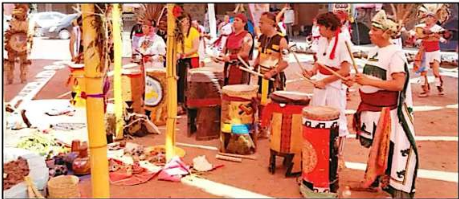
UNA FIESTA DE COLOR SE REALIZÓ EN URUAPAN EN DONDE EL COLECTIVO MEXICANIDAD PRESENTÓ DANZAS Y MÚSICA PREHISPÁNICA Y LOGRÓ REUNIR A MÁS DE 150 PARTICIPANTES.

MOVIMIENTO DIFUNDEN LA CULTURA PURÉPECHA