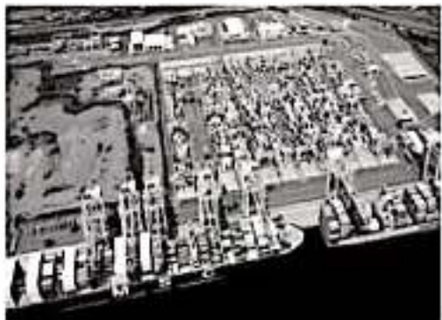
MORELIA, MICH.- La propagación del coronavirus no ha afectado los movimientos de entrada y salida de barcos de carga en el Puerto de Lázaro Cárdenas, principalmente con China u otras naciones de Asia.

Hasta la fecha se han reportado casos en 57 países fuera de China, como Irán, Corea del Sur, Italia, Japón, Francia y Filipinas.