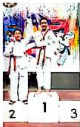
crecimiento de los deportistas de Uruapan y sus alrededores.