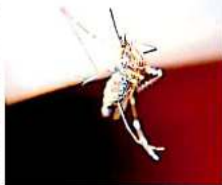
Para acabar con el dengue es necesario eliminar los criaderos, señalaron las autoridades. (ARCA)

Subrayó que para acabar con el dengue es necesario eliminar los criaderos, y esto es algo que no se logra de forma manual como lo hacen las fumigaciones, la prevención seguirá siendo la principal herramienta contra el mosquito.