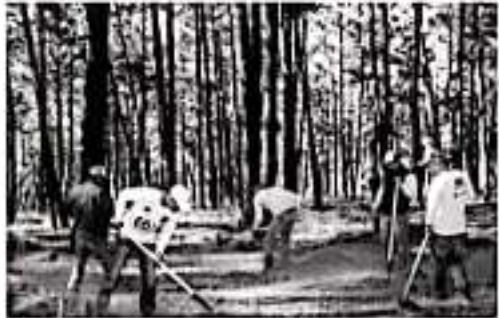
MORELIA, MICH.- Salvar la vida de los bosques es tarea de todos y todas, por ello las brechas corta fuego representan la mejor opción de prevención para mitigar el daño que los incendios generan a las zonas forestales del estado.

"Con estas líneas se logra controlar los incendios hasta en un 50 por ciento, porque lo que hacen es detener la tumba y que no avance y afecte los árboles; por lo regular participamos por lo menos 15 hombres en cada brigada y venimos dos brigadas", agregó. Finalmente, hizo una extensa invitación a la población a hacer conciencia y tener más cuidado con el fuego que se usa en las áreas boscosas de nuestras comunidades.