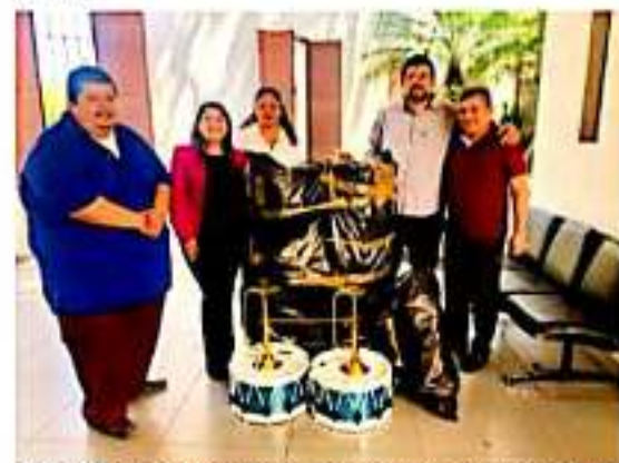
CD. LÁZARO CÁRDENAS, MICH.- Donan equipo a banda de guerra de la Escuela Secundaria 110, que el próximo 30 de marzo estará participando en el concurso estatal de bandas de guerra.

Por su parte, los docentes de la Escuela Secundaria 110, agradecieron este apoyo, manifestando que estos nuevos instrumentos motivarán aún más a los alumnos, quienes estarán dando su mayor esfuerzo en la competencia.