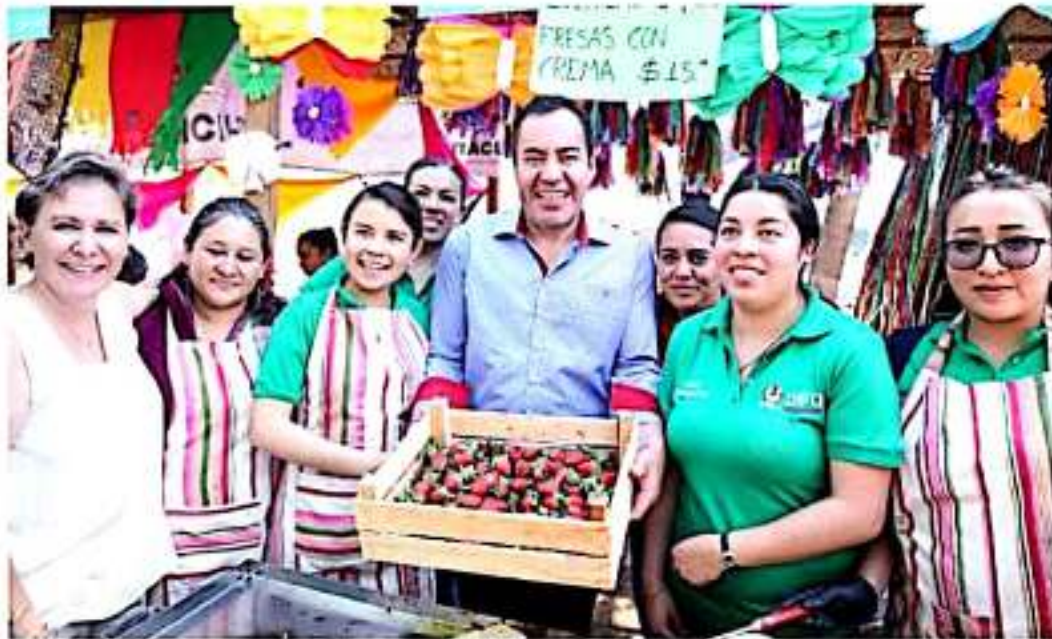
MORELIA, MICH.- El titular de Segob, Carlos Herrera, inauguró la Kermés 2020 del DIF estatal.

En la Kermés "Ayudar te hace DIFerente" hubo venta de la diversidad gastronómica del estado y tuvo actividades durante todo el domingo en las instalaciones en los jardines del Centro de Convenciones y Exposiciones (Coconexpo) de la capital michoacana.