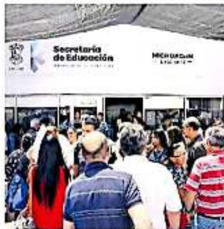
Se determinaron 19 resultados, de los cuales en siete no se detectaron irregularidades.

Los 9 restantes generan: 1 Recomendación, 3 Promociones del Ejercicio de la Facultad de Comprobación Fiscal, 1 Promoción de Responsabilidad Administrativa Sancionatoria y 4 Pliegos de Observaciones, remarca el documento ofi-