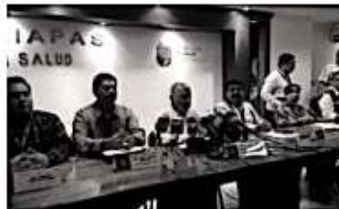
Tuxtla Gutiérrez, Chiapas. El paciente es una adolescente, originaria de Tuxtla Gutiérrez, quien se encuentra bajo vigilancia médica permanente en su domicilio y es asintomática.

epidemiológica en el estado", así también el titular de Salud pidió a la población "mantenerse informado por la vía oficial y evitar compartir información no verificada". Puntualizó que desde diciembre pasado se reforzaron las medidas de vigilancia y prevención en Chiapas, específicamente en la frontera sur por donde han ingresado las caravanas migratorias.