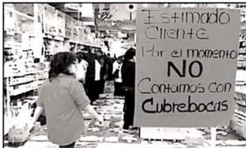
ANTE LOS CASOS CONFIRMADOS DE COVID-19, LA GENTE COMPRO CUBREBOCAS EN EXCESO Y A ELEVADOS PRECIOS.

Esos datos se los pidieron en Nueva Walmart de México, en Sorsana, en Chedraui, Comercializadora Farmacéutica de Chiapas (Farmacias de Ahorro), Farmacia Guadalajara, Pharma Plus (Farmacias San Pablo), Comercial City Fresko (La Comer), Farmacias de Similares y Tiendas Tres B.