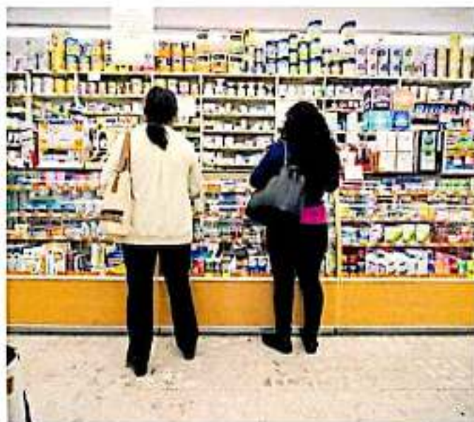
Hasta el momento, en la ciudad no se perciben compras de pánico. (ANAVALENA)

"Le sé la historia, yo creo que no es verdad, en México han generalizado tantas cosas de humo con temas de este estilo, hoy en día es difícil creer en una noticia de este tipo, hay muchos temas que preocupan y ocupan y esta es la mejor