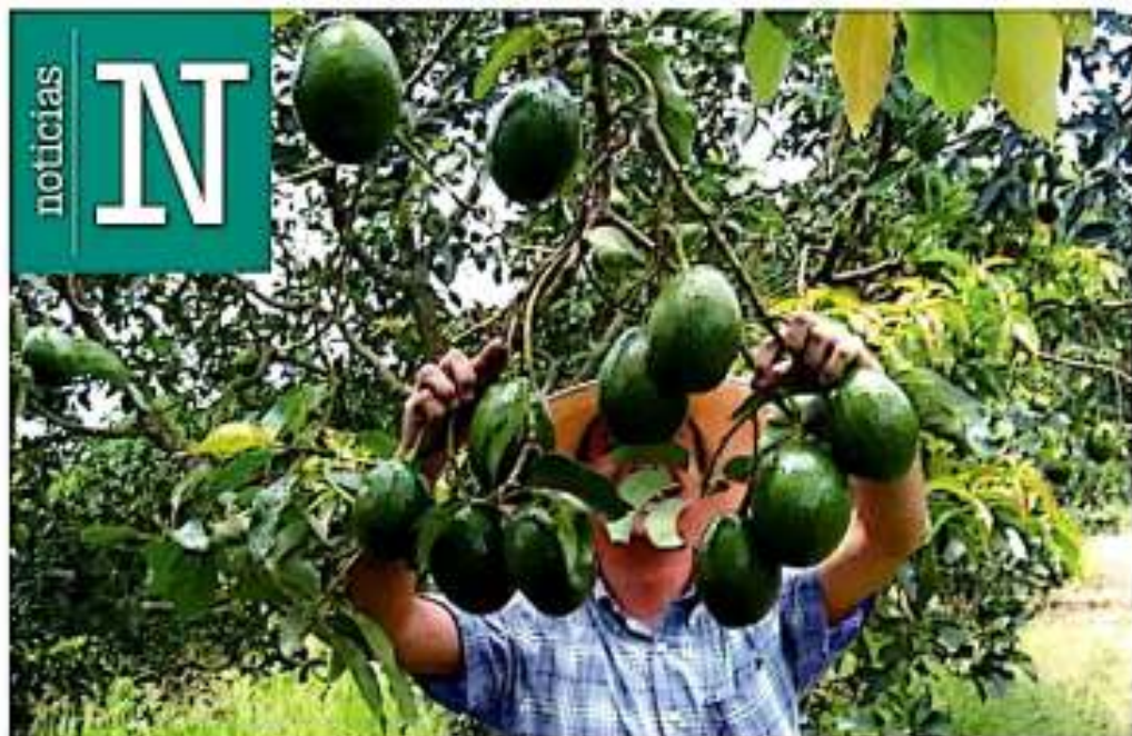
Pequeños productores. El 94% de los aguacateros que exportan cultivan huertos menores a 10 hectáreas.