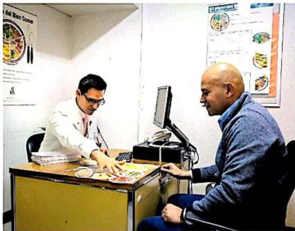
Afecta a hombres mayores de 60 años y con antecedentes de cáncer de próstata en familiares cercanos