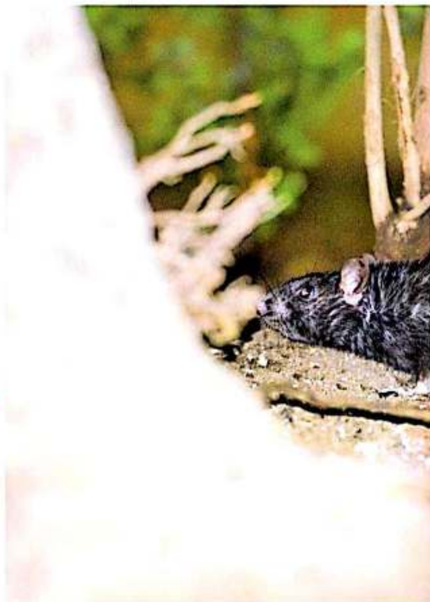
Una rata negra se oculta entre los arbustos de una jardinería en la plaza de San José

A decir de los expertos en control de plagas muchas personas no tienen la cultura de la fumigación periódica por lo que un pequeño bicho de estos animales e insectos pueden convertirse rápidamente en una plaga si no se atiende adecuadamente