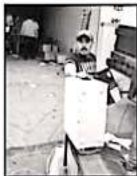
LA PIEDAD IMPULSA JORNADA DE ACOPIO DE RESIDUOS ELÉCTRICOS.

De acuerdo al plan, para los días 27 y 28 de marzo el contenedor se instalará en Villas de la Loma; el 29 de marzo en la colonia Santa Fe; el 24 y 25 de abril en el Parque Morelos; el 26 y 27 de junio en el parque Lázaro Cárdenas "La Plaza"; el 24 y 25 de julio en el Centro Comunitario del traccionamiento 180a; el 28 y 29 de agosto en el Centro Comunitario de la Vasco de Quiroga; el 10 y 11 de septiembre en el Centro Comunitario de México