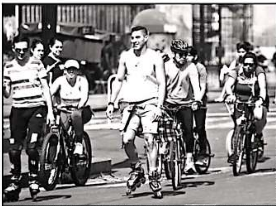
LA CICLOVÍA DOMINICAL ES UN ESPACIO PARA HACER ALGO DE EJERCICIO Y CONVIVIR CON LA FAMILIA, DIFERENCIAN MORELIANOS

Además, "la bicicleta es mucho mejor medio de transporte, es rápida y consume menos, eso que