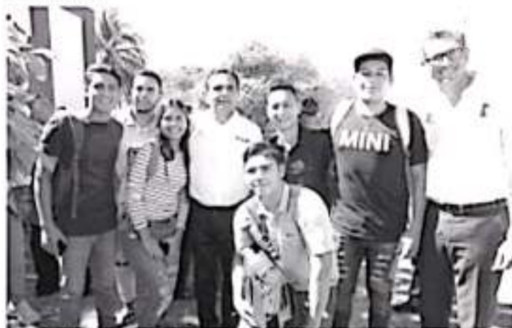
Para mí no hay otro asunto más importante que la educación, por mi experiencia y origen, por eso necesitamos cuidar la educación de nuestros jóvenes.

Apatzingán, Michoacán, a 29 de enero de 2020.- Al aseverar que el tema educativo, es fundamental para el desarrollo, el gobernador de Michoacán, Silvano Aureoles Conejo, entregó al Instituto Tecnológico Superior de Apatzingán, la techumbre que beneficiará a más de dos mil alumnos y alumnas del plantel.