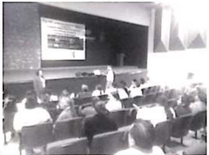
De no tener las medidas básicas de higiene y si representan un riesgo para la salud, se aplicarán sanciones y de ser necesario se suspenderá la actividad.

Recalcó que la finalidad de organizar a los pueblos indígenas es encontrar solución a la falta de oportunidades, una de las formas serán los proyectos productivos para los artesanos, campesinos, productores de aguacate, de guayaba y para todos los representantes de las cadenas productivas.