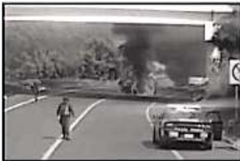
EN CARRETERA LIBRE A PATZCUARO Y EN LA AUTOPISTA SIKOLOXO TAMBIÉN SE REGISTRÓ LA QUEMA DE VARIOS VEHÍCULOS