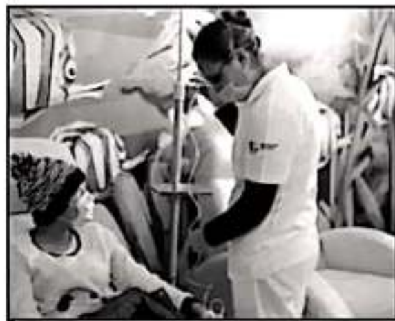
EL GOBERNADOR SILVANO ALFREDES GARANTIZA EL ABASTO PUNTUAL DE LOS MEDICAMENTOS QUE SE REQUIERAN EN LOS CENTROS DE SALUD.

Miguel Ángel Aguirre Abellameda, fue enfático al señalar que desde su llegada a este encargo ha visto un Congreso del Estado que quiere atacar la corrupción y no un Poder Legislativo que actúa con tintes partidistas o afines a intereses particulares.