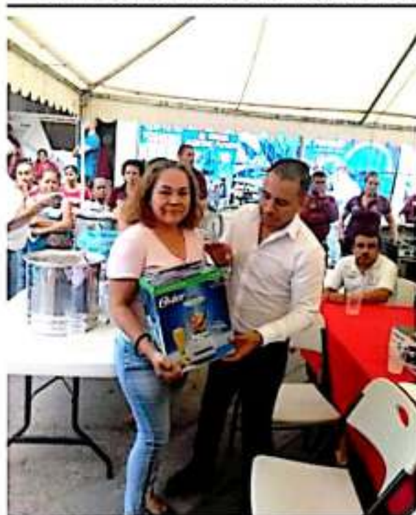
APATZINGÁN, MICH.- Un total de 43 premios, entre planchas, licuadoras, pantallas, estufas, lavadoras y refrigeradores, sorteó Capama entre sus usuarios cumplidos y puntuales.