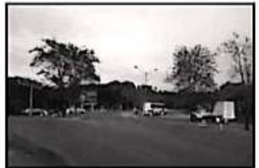
ALFCA DE LAS 19:30 HORAS LA SEDE DE LA OFICINA DE SEGURIDAD PÚBLICA INFORMÓ QUE SE HABÍA REESTABLECIDO EL ORDEN EN LA ZONA

esas vías, acción que se prolongó hasta las 15:00 horas cuando la policía estatal, con apoyo de fuerzas federales, procedieron a retirar las unidades quemadas y a dejar el libre tránsito.