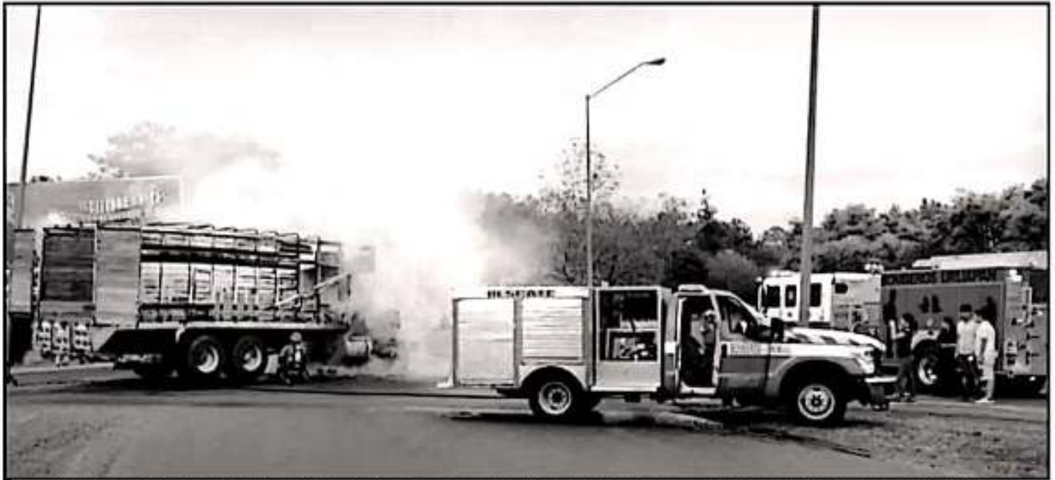
DETENCIÓN DE PRESUNTOS DELINCUENTES DESATÓ LA JORNADA DE VIOLENCIA EN URUAPAN CON BALACERAS EN LA CIUDAD Y LA QUEMA DE VARIOS VEHÍCULOS PARA TRATAR DE FRENAR OPERATIVO POLICÍACO