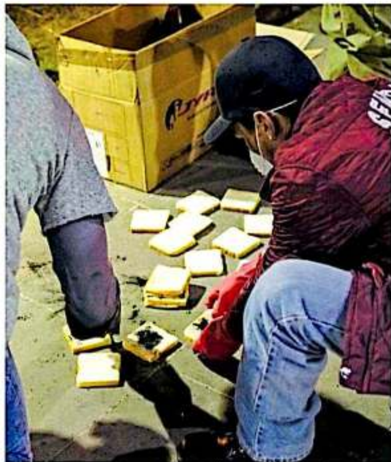
El método para envenenar a las ratas es muy sencillo; se unta mayonesa en rebanadas de pan blanco, que luego es espolvoreado con el raticida.

En el caso de las cucarachas, la transmisión de enfermedades se realiza a través del contacto con algún tipo de secreciones de los insectos, como orina o excremento.