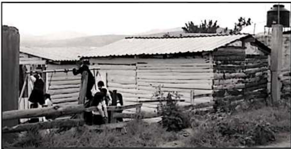
LOS PADRES DE FAMILIA DE LA COLONIA IRREGULAR EL CUISILLO, UBICADA EN LA TENENCIA MORELOS, RECLAMAN LA PRESENCIA DE MAESTROS EN SU ESCUELA.

Apuntó que esta situación está repercutiendo en el aprendizaje de los niños, ya que muchos apenas están aprendiendo a leer o escribir, lo cual es un problema muy grave.