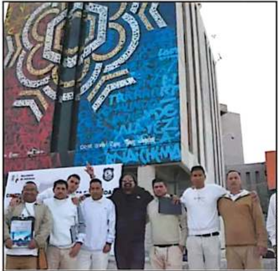
EN LA ELABORACIÓN DE LOS MEGAMURALES PARTICIPARON ARTISTAS MEXICANOS Y 29 REOS DEL CERESO.

gobiernos, se denomina así cuando tienen el control del penal y ustedes pasaron fluidamente. Tenemos seguridad y podremos descargar todos esos temas", manifestó.