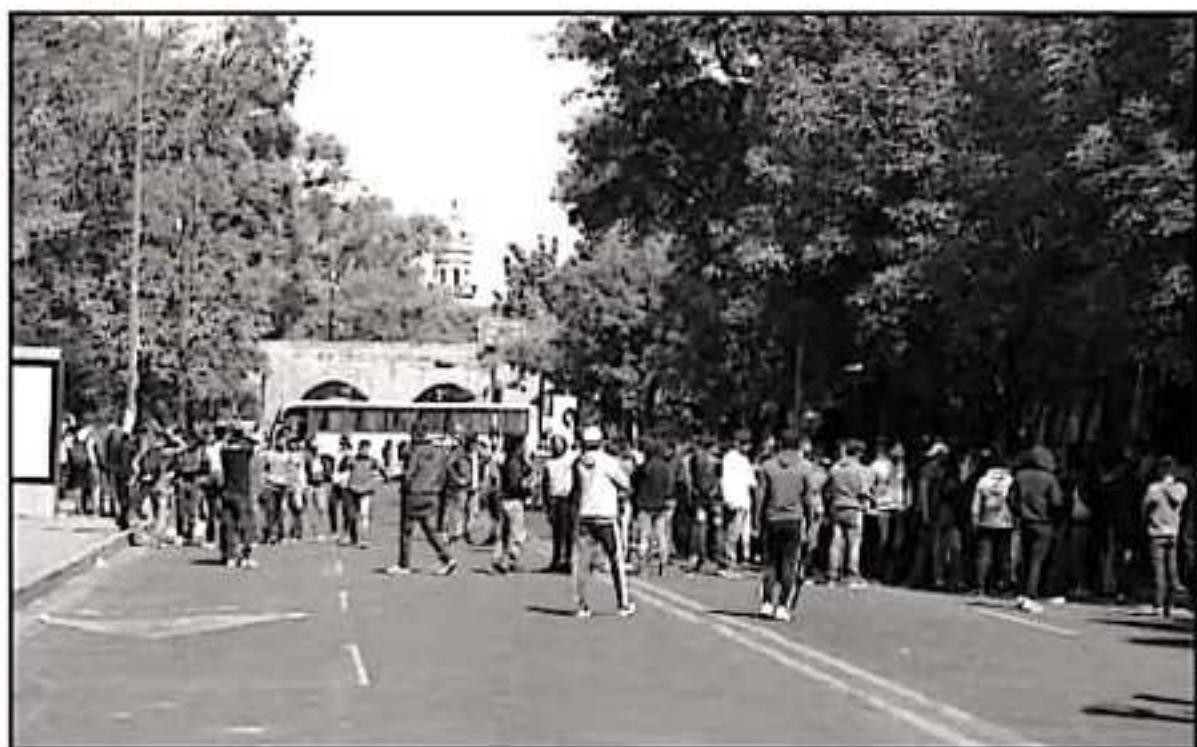
RINDEN 'FRUTOS' LOS PAROS Y BLOQUEOS DE LOS NORMALISTAS EN MORELIA, YA QUE LA CNTE CONFIRMÓ LA CONTRATACIÓN DE EGRESADOS A PARTIR DEL LUNES

Por otro lado, los egresados normalistas han permanecido manifestándose desde el inicio del año en reclamo de la contratación comprometida por parte