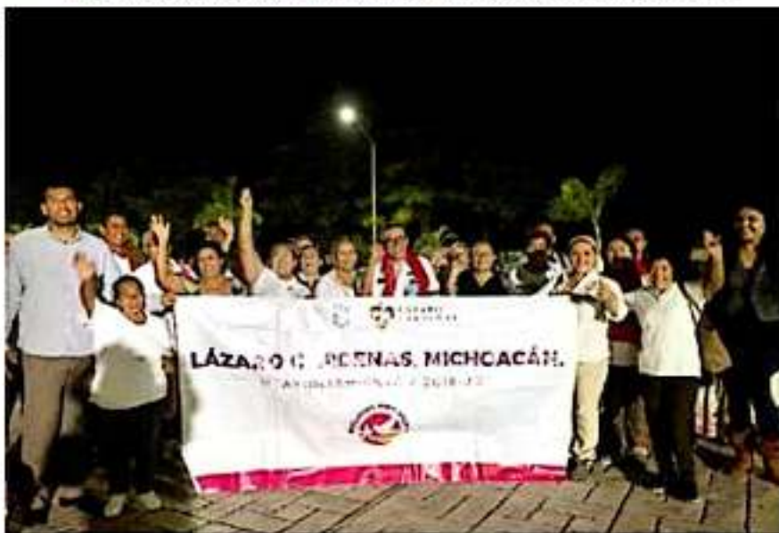
De 24 personas de este municipio, fueron 17 las que consiguieron su visa americana para ir a visitar a sus familiares que se encuentran en los Estados Unidos de Norteamérica, a través del programa estatal Palomas Mensajeras.