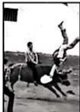
DESTACA LA PLAZA DE SAN JUANITO UTECIUARO PARA JARRIPEOS.

También, añadió, se buscará que no se erróquien las capacitaciones, que son la base para fortalecer las capacidades y habilidades de los combatientes en acción. "Hoy por hoy, somos de las mejores brigadas que existen en Latinoamérica y destacan las de Michoacán", concluyó.