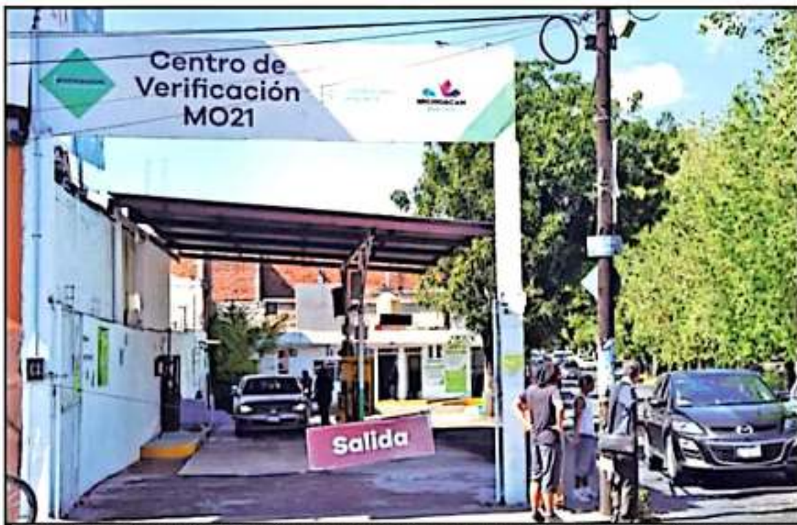
QUIENES REQUIERAN IR A LA CIUDAD DE MÉXICO O AL EDOMEX, DEBEN SOLICITAR UN PASE TURÍSTICO PARA QUE CIRCULEN ALLÁ Y REGRESAR A VERIFICAR

desde que se tabularon multas por no verificar