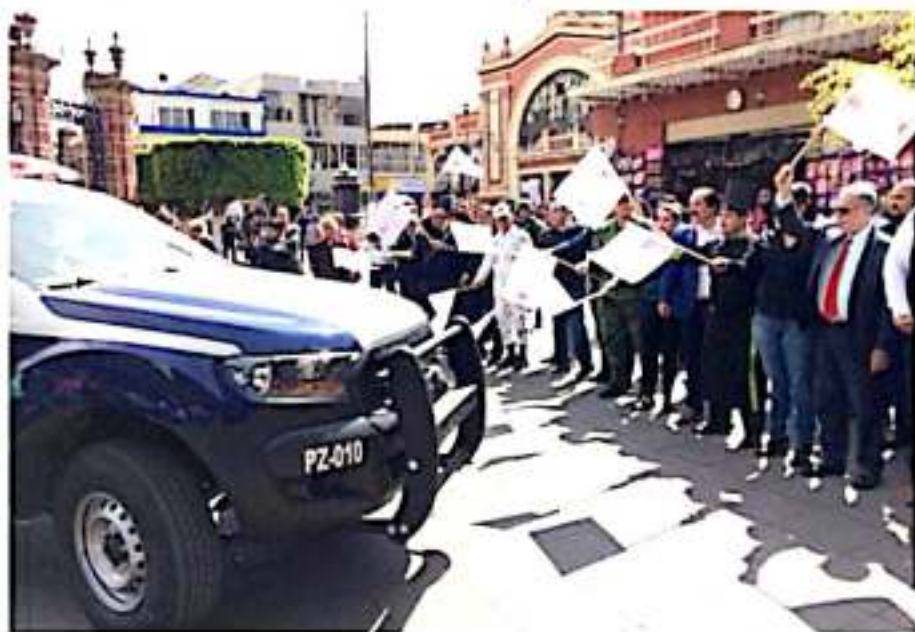
ZAMORA, MICH.- Se entregaron a la Dirección de Seguridad Pública siete patrullas, más de 700 uniformes e igual número de pares de botas, 350 impermeables, 340 chamarras, 20 bastones, 350 fornituras, 150 gorras y más de 100 chalecos.

Aseguró que éste no es un trabajo que es solo de las autoridades de gobierno y policíacas, también le compete a la ciudadanía.