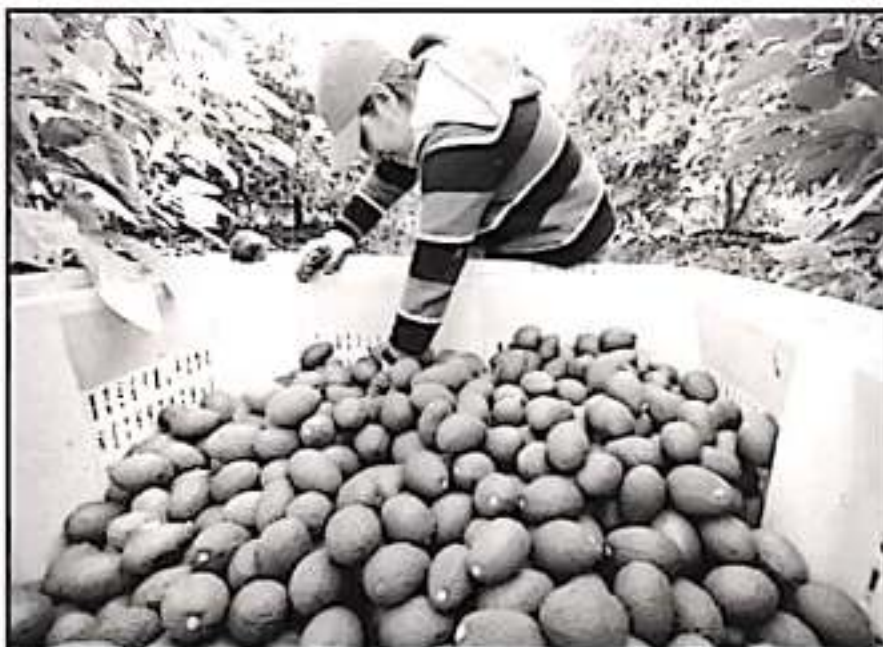
LA COSECHA DE AGUACATE Y LIMÓN, SON RUBROS QUE MÁS GENERARON CRECIMIENTO PARA EL ESTADO, DICE INEGI.

reflejan únicamente en el sector primario, por el orden del 13 por ciento, suficiente para "arrastrar" la caída en el indicador dentro del ramo de actividades industriales y de manufactura, así como en el de