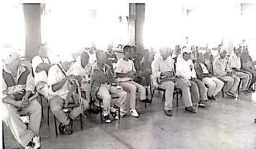
El funcionario estimó que entre el 20 a 25 por ciento de las personas recluidas en los siete centros penitenciarios estatales.

Actualmente, los centros penitenciarios del estado albergan una población femenil y varonil de 5 235 personas, de las cuales 1 158 se encuentran presas por