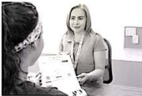
A partir de febrero el resello registrará un aumento del 2.83%, correspondiente a la Unidad de Medida y Actualización (UMA).