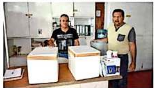
El departamento de Desarrollo Agropecuario informó del arribo de mil vacunas contra el derriengue.