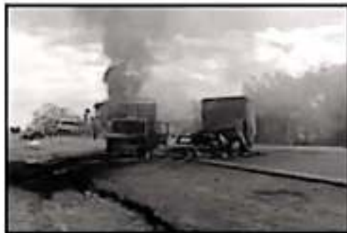
EN LA REFREGIA FUERON INCENDIADOS DOS CAMIONES QUE MOMENTOS ANTES HABÍAN DESPIDIENDO PARA SALDIRAR CARRETERAS