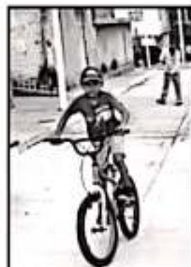
EL AYUNTAMIENTO DE LA PIEDAD SIGUE REMOZANDO VIALIDADES

eficiencia y racionalización del gasto público, a efecto de resolver la problemática financiera y dejar la deuda pública para otro momento, porque hoy en día Michoacán puede salir adelante sin más deuda", expresó.