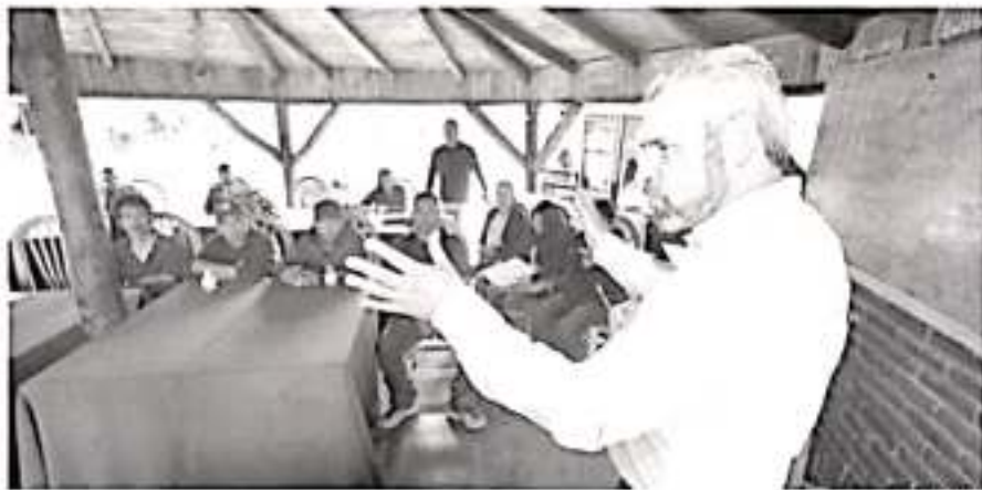
El diputado Alfredo Ramírez Bedolla, durante su gira de trabajo.

El diputado Alfredo Ramírez Bedolla acató con pescadores de diversas comunidades parépecha trabajar juntos en la formación de cooperativas, y fortalecer así las gestiones para el desarrollo sustentable en las cuencas de Pátzcuaro y Zirahuén.