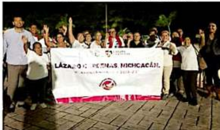
CD. LÁZARO CÁRDENAS, MICH.- De las 24 personas que el pasado jueves acudieron a la Ciudad de México para solicitar su visa americana a través del programa "Palomas Mensajeras", únicamente 17 lograron obtenerla.