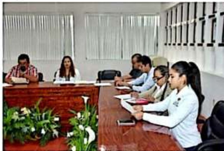
CD. LÁZARO CÁRDENAS, MICH.- En la primera reunión de trabajo del Grupo Municipal para Prevención de Embarazos en Adolescentes.