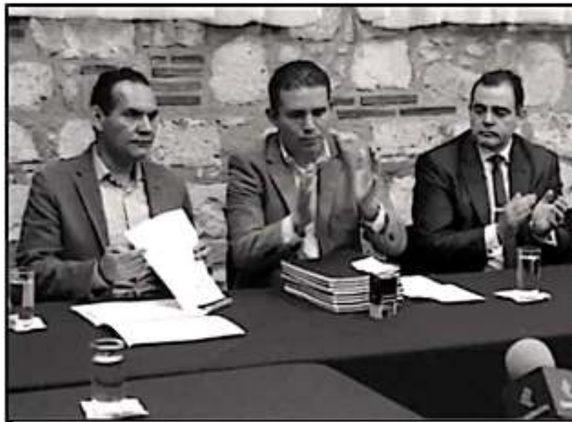
MARCO POLO AGUIRRE RECIBE EL INFORME GENERAL DEL AUDITOR DEL ESTADO MIGUEL ÁNGEL AGUIRRE ABELLAMEDA.

En ese sentido, Aguirre Chávez expresó que el compromiso del Congreso del Estado, y en específico de esta LXXIV legislatura es erradicar la corrupción en todas las áreas y niveles del gobierno, en los municipios, en los diferentes poderes del Estado y en todos los organismos que reciben dinero del erario