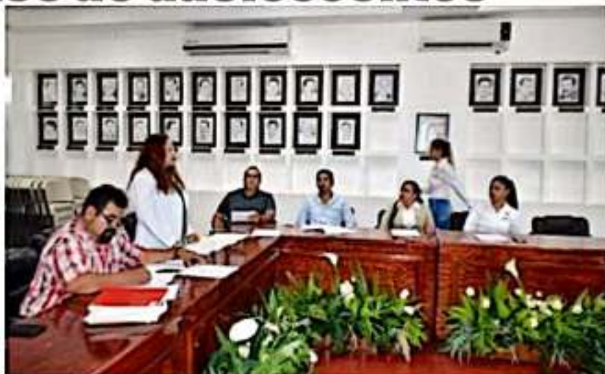
Grupo Municipal para la Prevención de Embarazos en Adolescentes, se reunió ayer para acordar estrategias sobre este tema.