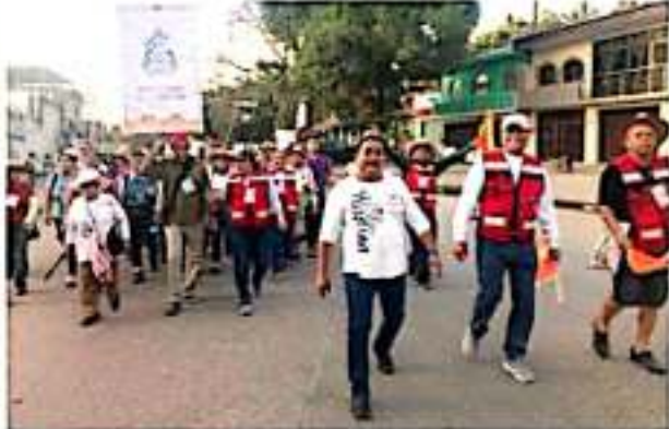
CD. LÁZARO CÁRDENAS, MICH.- Integrantes de la caravana que por dos días recorren diversas comunidades para demostrar su devoción a la Virgen de la Candelaria, estuvo ayer en la tenencia de Las Guacamayas y comunidades vecinas.