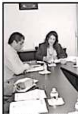
DAN A CONOCER LINEAMIENTOS DE LA DIRECCIÓN DE ARCHIVOS