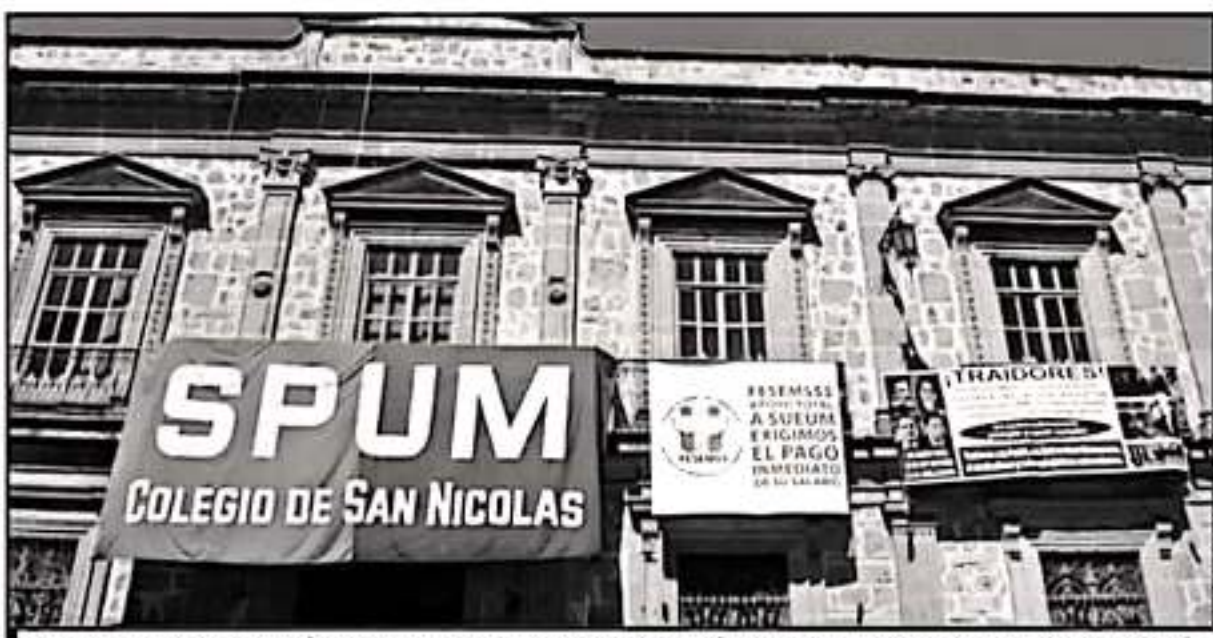
LAS BANDERAS ROJINEGRAS SEGUIRÁN COLGANDO EN LOS EDIFICIOS DE LA UMSNH, DESPUÉS DE QUE LOS MAESTROS NO ACEPTARON PLAN DE LA RECTORÍA.

nuestra casa de estudios un referente nacional".