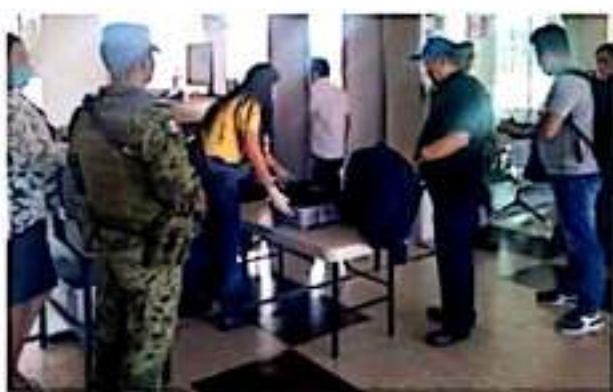
CD. LÁZARO CÁRDENAS, MICH.- Personal del aeropuerto nacional trabajan coordinados con la JSN8, para verificar arribo de pasajeros del continente asiático.