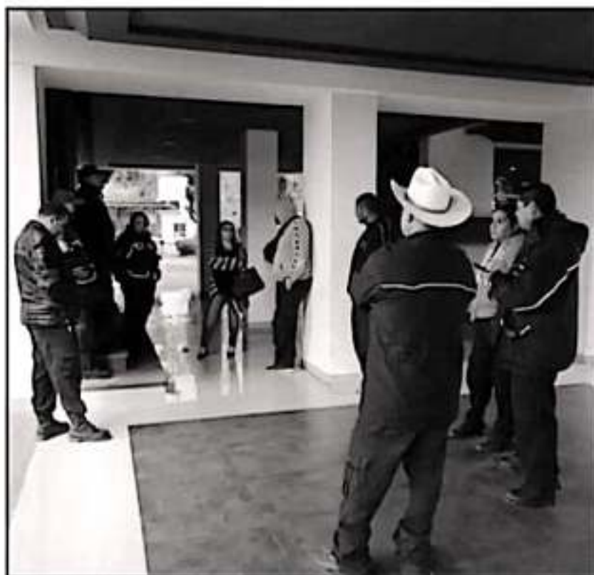
BRIGADISTAS DE LA CONAFOR SE SUMARON A PARO NACIONAL ANTE LA FALTA DE EQUIPO PARA SUS ACTIVIDADES

y Morelia, así como diez campamentos más en Aguililla, Arzo de Rosales, Patzcuaro, Zacapu, Carapan, Los Reyes, Ciudad Hidalgo y Zitacuaro, indicó el entres estado.