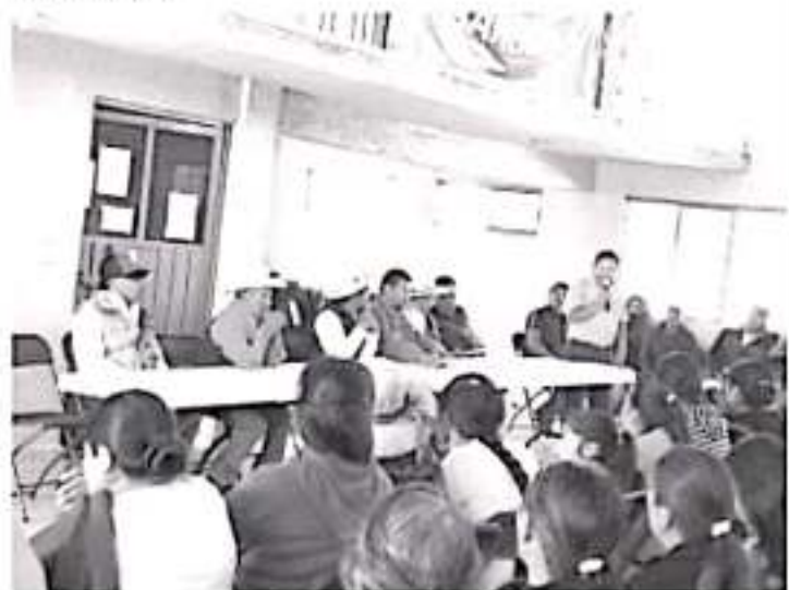
La idea es que los artesanos locales oferten sus productos en las ferias del país, ya no sólo en unas cuantas exposiciones y muestras.

«Estaremos vigilantes de que todo se haga bien y vamos a actuar según correspondiera», dijo la titular de la COEPRIS.