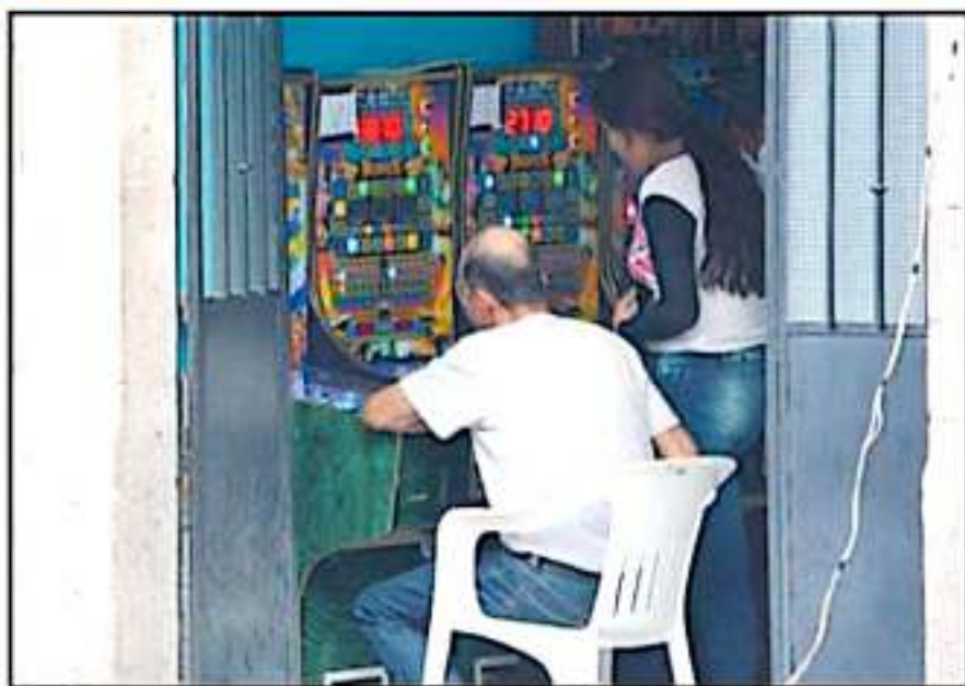
CADA VEZ SON MÁS COMUNES POR TODA LA CIUDAD ESTOS ESPACIOS DONDE HAY MÁQUINAS 'TRAGAMONEDAS'.

MÁQUINAS llegan a tener los distintos locales