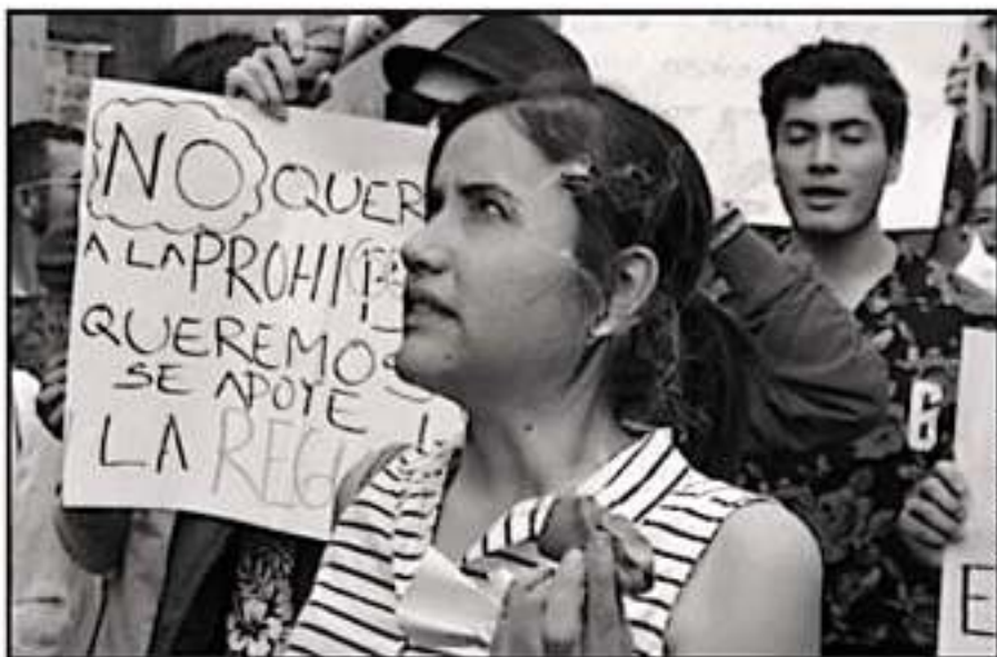
COLECTIVOS SE HAN MANIFESTADO A FAVOR DEL USO LÚDICO DE LA MARIJUANA, TANTO EN EL PAÍS COMO EL ESTADO

Según el diputado proponente, dicha ley estatal consti-