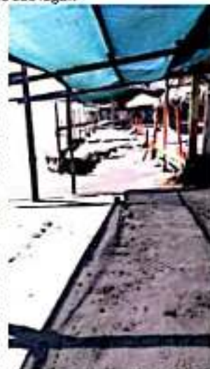
CD. LÁZARO CÁRDENAS, MICH.- Al menos 48 enramadas de Playa Eréndira resultaron afectadas por las corrientes pluviales provocadas por el paso de "Narda".

Beltrán Arreola dijo que esto ocurrió el pasado lunes, cuando se dio la bajada de agua más importante y que causó la mayor afectación, sin embargo, este martes varios negocios ya limpiaron, pues no pueden frenar sus actividades pues sus comercios son parte de su sustento diario, sin embargo, si se va a requerir de una fuerte inversión para