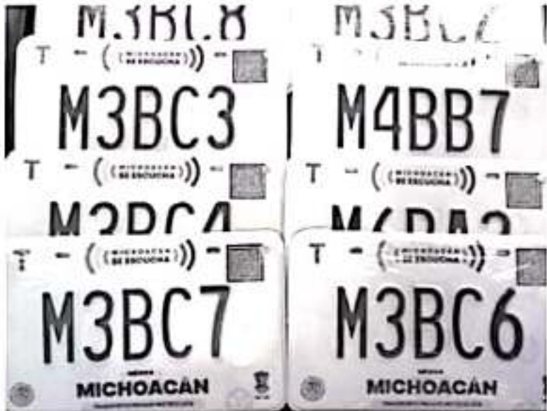
La Secretaría de Finanzas y Administración, puntualiza que las y los automovilistas no deben cambiar las placas expedidas a partir de 2016.

La ciudadanía puede consultar los costos y requisitos en la página www.seefinanzas.michoacan.gob.mx , en el submenú Trámites Vehiculares, en el apartado Dotación de Placas o en el 070 opción 2.