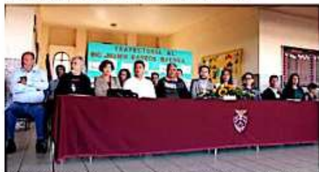
TINGÜINDÍN, MICH.- Se conmemoró el aniversario luctuoso de Javier Barros Sierra.

Finalmente los funcionarios municipales atestiguaron un evento cultural el cual fue presentado por los alumnos de los diferentes grados escolares así como demás actividades organizadas para conmemorar un aniversario luctuoso más del ingeniero Barros Sierra.