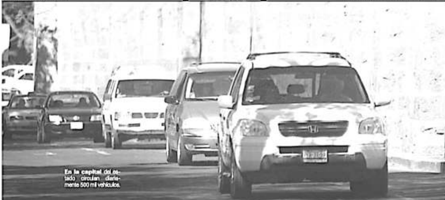
En la capital del estado circulan diariamente 600 mil vehículos.