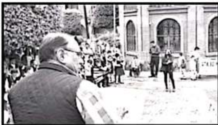
El día de hoy el 100% de las escuelas de la zona 075 están rehabilitadas, asegura el presidente municipal.