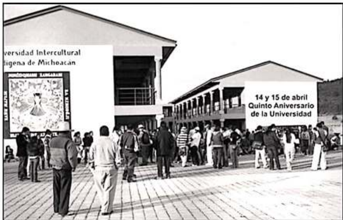
SINDICALIZADOS DE LA UNIVERSIDAD INTERCULTURAL INDÍGENA AMAGAN CON REALIZAR PROTESTAS ANTE LA FALTA DE PAGOS SALARIALES Y PRESTACIONES.

La contratación de docentes es bajo a figura de profesor invitado de asignatura, no son plazas las que se entregan