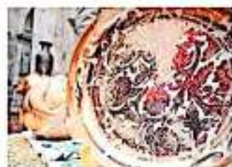
Estas marcas denotan como finalidad distinguir un producto de otro.