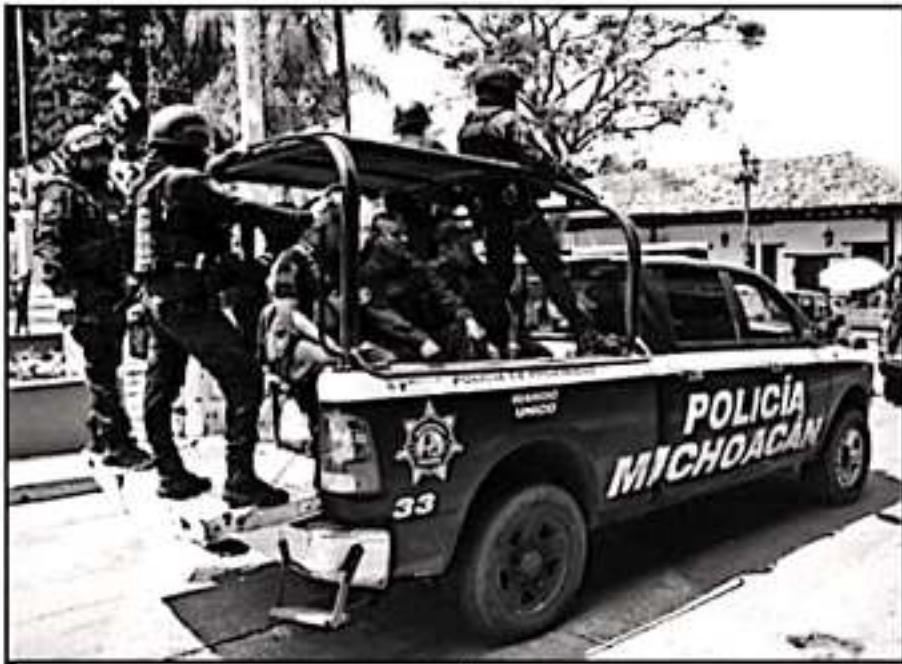
OTRO PROBLEMA SON LOS SEÑALAMIENTOS DE CORRUPCIÓN HACIA EL INTERIOR HACIA ALGUNAS CORPORACIONES.