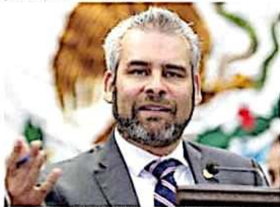
El diputado Alfredo Ramírez Bedolla, presentará una propuesta de ley para prevenir y combatir adicciones.

Es así que la Ley Estatal de Prevención, Atención y Combate de Adicciones, explica el diputado, plantea un enfoque integral que aborda los distintos aspectos que rodean a las adicciones: la prevención, el tratamiento y la reinserción en la sociedad.