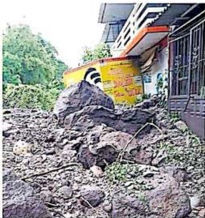
Tras las afectaciones registradas en varios asentamientos de Lázaro Cárdenas se espera un apoyo oportuno del Gobierno de México

Asimismo, el funcionario federal resaltó lo fundamental del trabajo en coordinación con los tres niveles de gobierno para llevar a cabo el levantamiento del diagnóstico de daños y solicitar lo más pronto posible la Declaratoria de Emergencia ante la Secretaría de Gobernación.