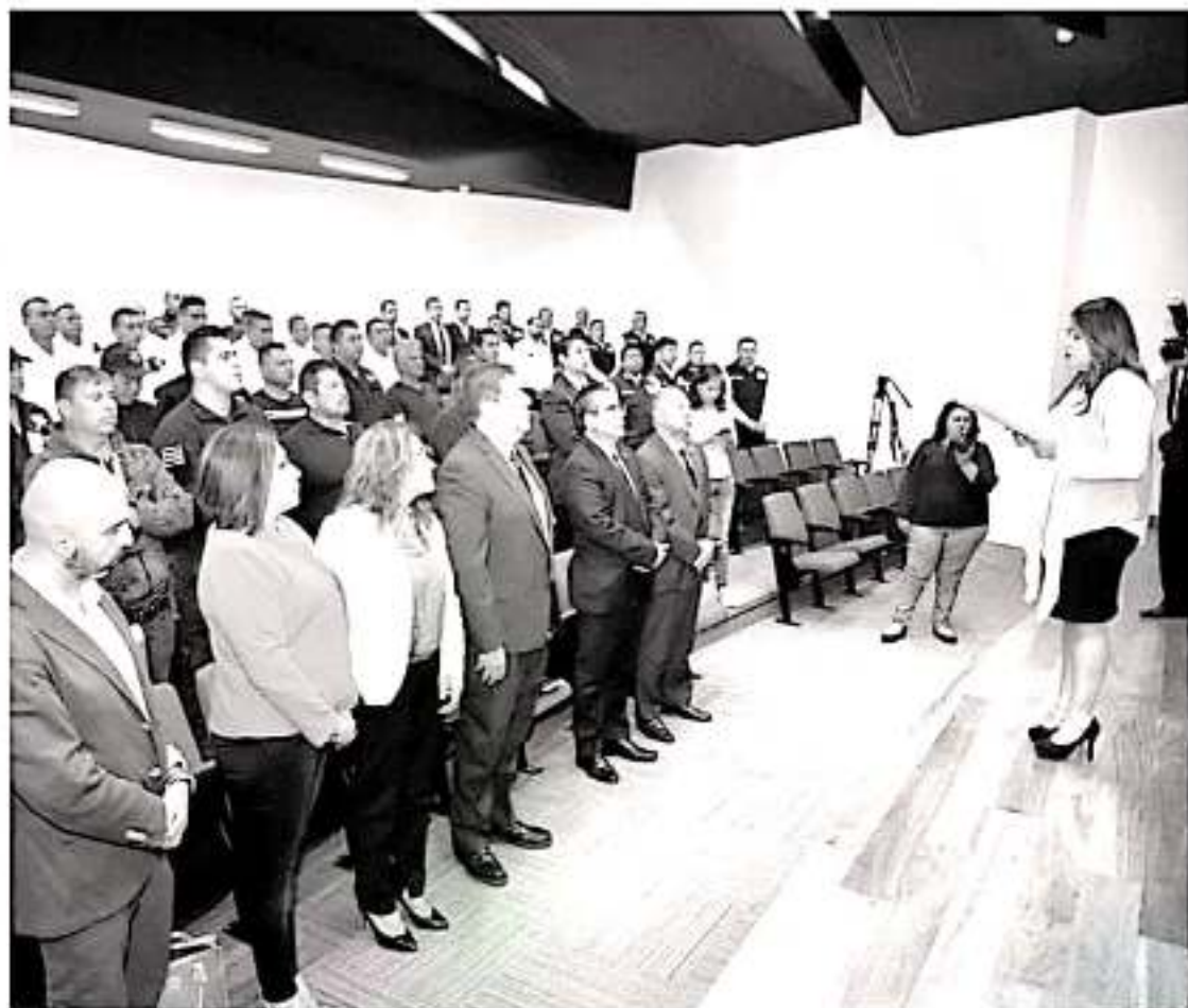
Michoacán se convierte en el primer estado del país en ofrecer una capacitación de este tipo, única para hombres servidores públicos.

pues son el primer contacto que busca una mujer que es víctima de violencia de género, y en ese sentido va esta capacitación, deben entenderse ustedes para cambiar el chip machista que es propio de