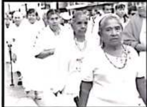
La gente se apoderó de las principales calle de la cabecera municipal en familia para recordar a uno de sus hijos predilectos, El Generalísimo Morelos.