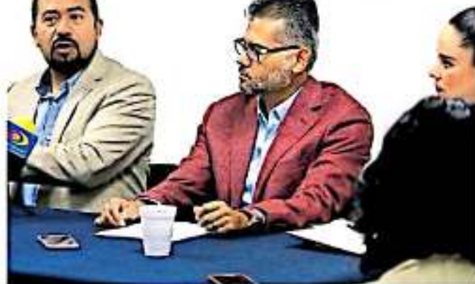
El funcionario indicó que la convocatoria lanzada desde ayer martes da paso a la primera etapa de la realización del evento.

gidas por las líneas estratégicas de desarrollo de Michoacán.