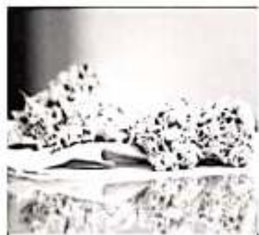
Mario Delgado presentó una iniciativa para la creación de un mercado legal para la compra y venta de la marihuana con la creación de una empresa pública, totalmente del Estado, denominada Cannabisud.

Los propósitos fundamentales de la creación de esta empresa incluyen abaratar y facilitar la Morena va por que el Estado compre y venda cannabis. Los propósitos fundamentales de la creación de esta empresa incluyen abaratar y facilitar la verificación sanitaria de los productos, registrar y sistematizar la información relativa a la producción, flujo, volumen, calidad, destino, existencia del producto y evitar, al menos temporalmente, la integración vertical de la industria a fin de evitar que los grandes intereses comerciales estén en posición de avasalar o capturar al regulador.