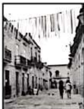
DIPUTADA BUSCA ELIMINAR EL COBRO EN LOS BAÑOS PÚBLICOS