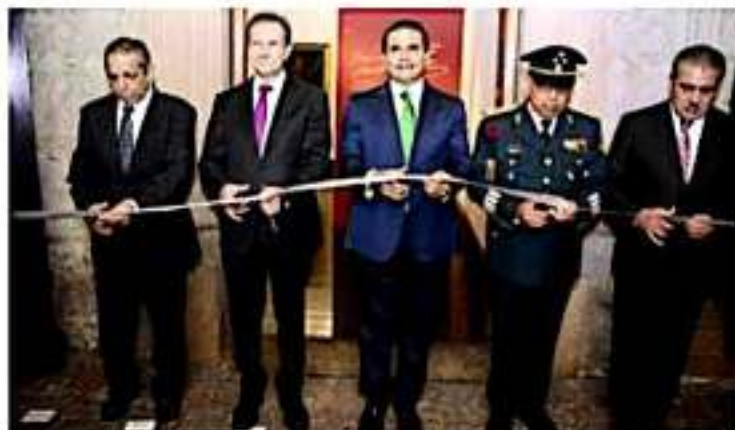
MORELIA, MICH.- El gobernador de Michoacán, Silvano Aureoles Conejo, acompañado del secretario de Educación Pública Federal, Esteban Moctezuma inauguró la colección de piezas que integran la iconografía del Servo de la Nación.

La colección de piezas estará en Palacio de Gobierno hasta el 14 de octubre