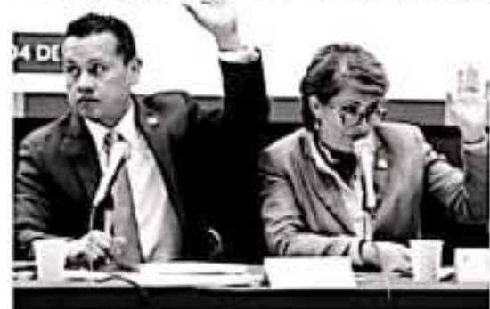
CIUDAD DE MÉXICO.- Los diputados federales de Morena han presentado la iniciativa de ley que permitirá modificar el etiquetado de los alimentos procesados, como un método que permita combatir la obesidad.