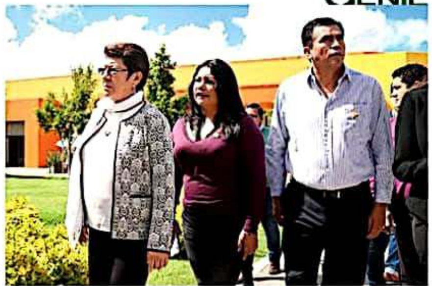
La diputada local visitó el CRIT Michoacán en compañía de los integrantes de la JUCOPO, en este marco propuso que mesas de trabajo al interior del Congreso a fin de apoyar instituciones que atienden a niñas y niños con alguna discapacidad.

De igual forma, la legisladora por el distrito 20 de Uruapan Sur, manifestó que el hecho de que en el CRIT se estén atendiendo cerca de 640 familias es maravilloso, el poder cambiarles y construir sus realidades es excelente, sin embargo, dijo también que hay una lista enorme de situaciones y circunstancias importantes que atender y que deben de trabajar en ello.