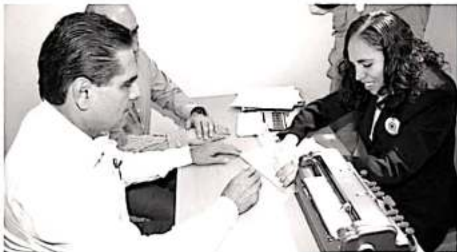
Centro de Atención a Personas con Discapacidad Visual ofrece 17 talleres a la población.