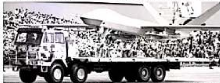
Pekín celebró un histórico desfile militar este martes, en conmemoración de la fundación de la República Popular hace 70 años. El 40% de las armas expuestas nunca antes se habían mostrado al público.

Gregy Arreges Los otros cargos de gobierno y del Partido Comunista presenciaron desde la Puerta Celestial de la Ciudad Prohibida el desfile militar.