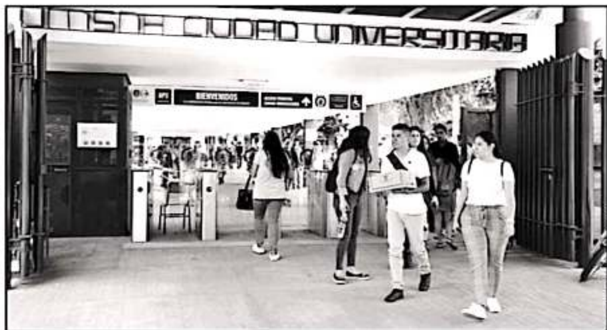
LOS RECURSOS DE LA UNIVERSIDAD MICHOCANA SE ACABAN ESTA QUINCENA. MILES DE ALUMNOS SE VERÍAN AFECTADOS SI LOS SINDICATOS VAN A HUELGA.

Detalló que los avances que se han tenido hasta documentados,