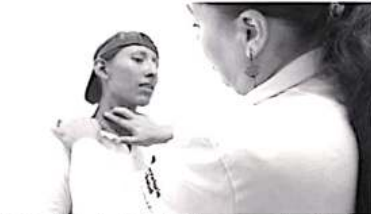
El Gobierno de Silvano Aureoles Conejo, brinda tratamiento gratuito en la Infancia y la Adolescencia a pacientes con cáncer a través de la Secretaría de Salud de Michoacán.

Platicó, «fue atendido súper rápido, todos los doctores y enfermeras siempre estuvieron y están al pendiente de que no me falte el medicamento, antes no podía mover el brazo por el dolor, y desde que comencé con quimioterapia me he sentido mejor, se me ha ido desinflando mi brazo y se me quitó ese dolor, ya puedo agarrar la cuchara, no podía ni comer, me costaba mucho trabajo, ahora empiezo a comer y pasando el tiempo me voy ir curando».