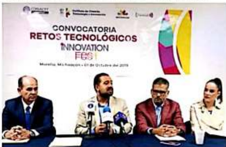
MORELIA, MICH.- los retos son: Gobierno digital; Internet de las cosas; Salud; Smart Cities; Agroindustria y Retos abiertos.

Los presentes, coincidieron en señalar que aún falta mucho por hacer, pero que se está avanzando de manera considerable en la implementación del proyecto dentro del nosocomio, lo que permitirá seguir abatiendo la mortalidad de cáncer infantil.