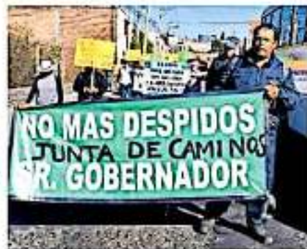
Desde agosto y septiembre los cerca de 400 empleados no han cobrado sus quincenas. / NOTICIA

Aunado a ello, y pese a las continuas movilizaciones y manifestaciones por parte de los trabajadores, las tres iniciativas legislativas para definir la situación de la propia dependencia continúan enfrentadas en la Comisión de Gobernación del