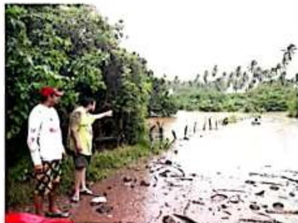
CD. LÁZARO CÁRDENAS, MICH.- En El Habillal, al menos 40 viviendas resultaron afectadas tras el paso de las torrenciales lluvias que dejó la tormenta "Narda".