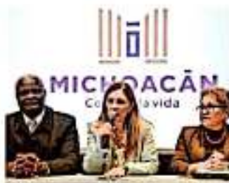
El programa contempla conferencias y talleres.