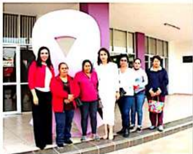
JACONA, MICH.- El DIF municipal elaboró un programa de actividades para sumarse a la cruzada mundial contra el cáncer en mujeres.