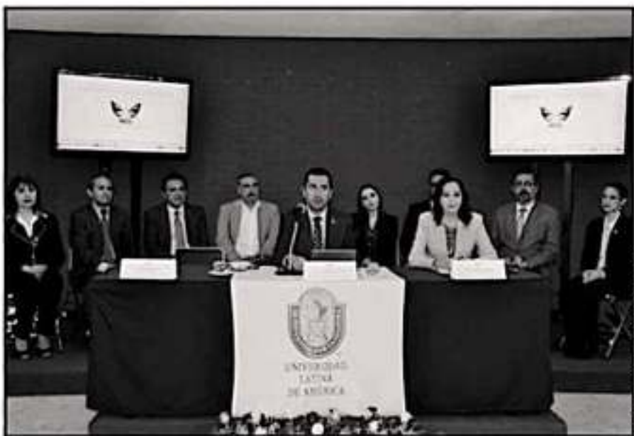
LA UNIVERSIDAD LATINA DE AMÉRICA FUE LA SEDE DE LA PRESENTACIÓN DE LA RED JUNTOS POR MICHOACÁN.

estos ejes se tienen contemplados dos eventos, como es un encuentro estudiantil y otro encuentro de docentes con estos ejes de trabajo, “en particular el encuentro docente con lo correspondiente a tópicos como justicia y derechos humanos”.