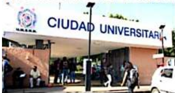
MORELIA, MICH.- Incierto aun el futuro financiero de la Universidad Michoacana.