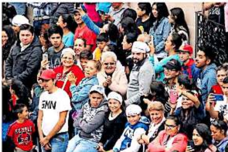
El costo de dichas paretetas asciende a los 14 pesos por unidad, dando un total de 70 mil pesos entre el costo del mismo y las impresiones

No obstante, más allá de los casi tres millones y medio que se utilizaron para el espectáculo que se llevó a la ciudadanía