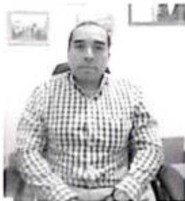
Borrón y Cuenta Nueva, es una estrategia de la Secretaría de Finanzas del Gobierno del Estado, ha logrado beneficiar a 2 mil personas de todo el estado de Michoacán.

- El programa se mantendrá hasta diciembre