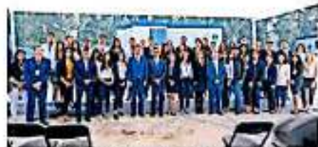
La autoridad nicolista espera no haya afectaciones en el salario a los trabajadores

El cumplimiento de los cinco compromisos que fueron firmados en diciembre pasado, entre los que se contempla la modificación al régimen de pensiones y jubilaciones, es otro de los temas que se to-