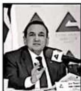
PLAN CONTRA INSEGURIDAD.

Ante ello, ejemplificó que a nivel nacional cerraron 12 administraciones de Hacienda, entre ellas la de Uruapan, labor que absorbió, con su misma logística y personal, la unidad de Morelia. En este orden de ideas destaca estar en contra de adecuaciones que vayan en contra de la celeridad de las propias gestiones administrativas del Gobierno de la República.