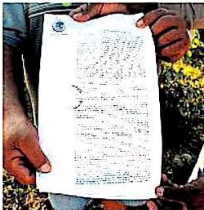
Según los afectados, hay un contrato donde Leonel Goday, exgobernador de Michoacán, vendió a la ferroviaria KCSM 184 hectáreas. GEORGINA GASCA

En el sexenio del próterno de Lázaro Cárdenas Batel, pagaron al comisariado