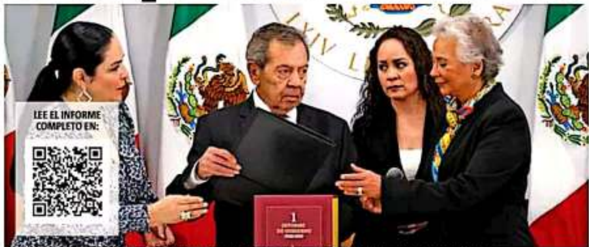
A todo batiente en el Congreso de la Unión se le presentaron los primeros documentos para establecer un posicionamiento respecto a los resultados de la gestión del gobierno en curso. | ILUSTRACION

El documento fue presentado ante el Congreso de la Unión y liberado para que cualquier ciudadano pueda leerlo de manera íntegra.