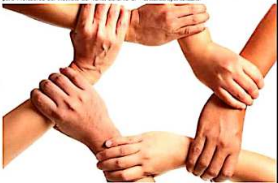
APATZINGÁN, MICH.- En la tarea para el rescate del tejido social, resta mucho por hacer.