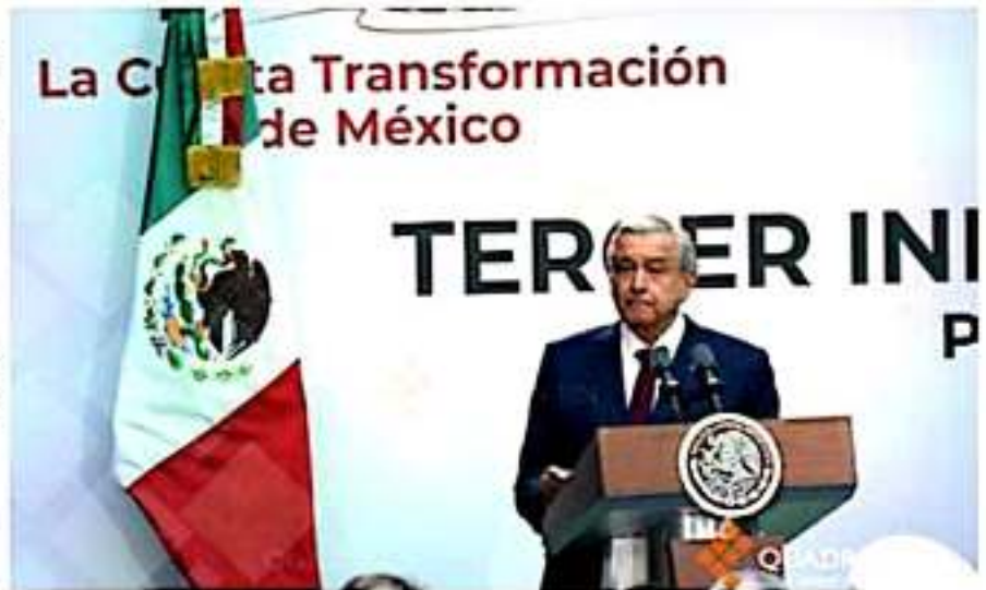
El presidente Andrés Manuel López Obrador, rindió ayer su primer informe constitucional, aunque el letrero a sus espaldas decía "Tercer Informe".

Afirmó que no han perdido producción y aseguró que en diciembre aumentarán a 50 mil barriles diarios más la producción de petróleo para recuperar Pemex y mejorar la