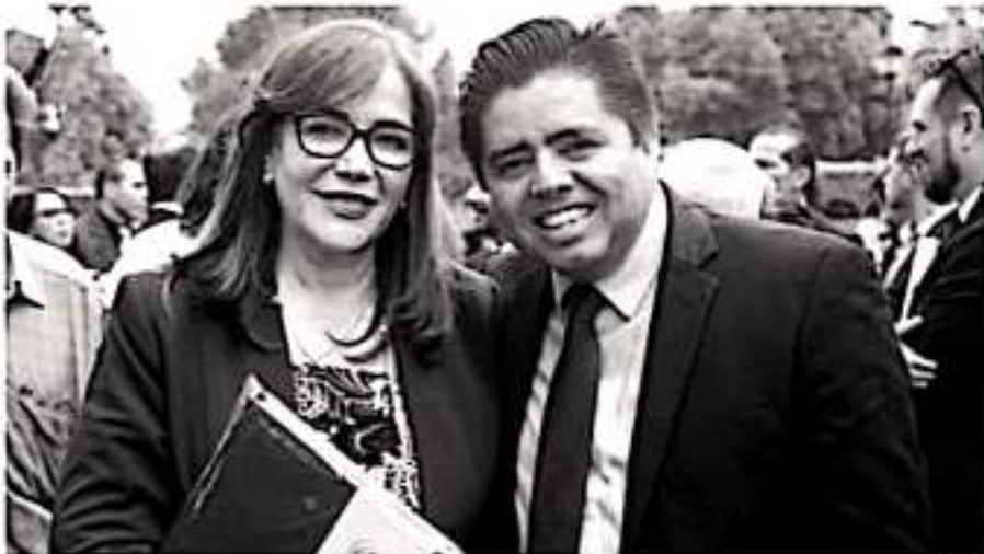
El servidor público refirió que ahora hay un poco más atención a personas de diferentes sectores de la población.

«Es un honor acompañar al presidente con alegría y la esperanza que vive en millones de mexicanos, la Cuarta Transformación será una realidad, nunca antes en la historia México ha tenido un presidente con tanta popularidad y aceptación entre el 67 y 74 por ciento», declaró.