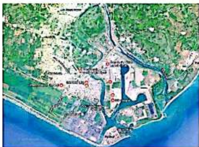
Sobre una parte de la Isla La Palma están hechos trabajos de industrialización no concluidos; de ahí se suministra agua cruda a la industria local.