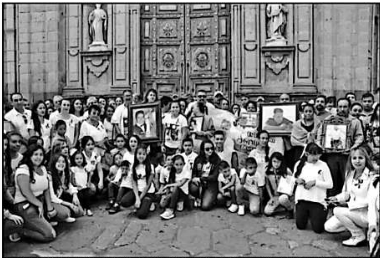
ESPECIALISTAS MÉDICOS DEL IMSS JUNTO A FAMILIAS DE DONADORES Y DONANTES PARTICIPARON EN LA TRADICIONAL MISA REALIZADA EN LA CATEDRAL.