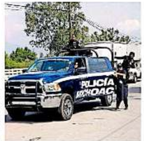
Autoridades continúan el proceso de averiguación y se mantiene en resguardo la localidad.

El funcionario público comentó que ante este fenómeno de violencia en el estado, el único camino que permitirá re-