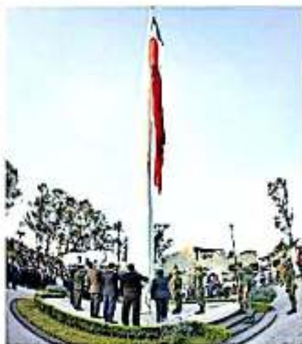
Autoridades de los tres niveles de gobierno participaron del izamiento de la bandera.

El gobernador Silvano Aureoles no pudo participar en el protocolo de arranque de los festivos patrios toda vez que se trasladó a la Ciudad de México para asistir al Primer Informe de Gobierno del presidente de la República, Andrés Manuel López Obrador.