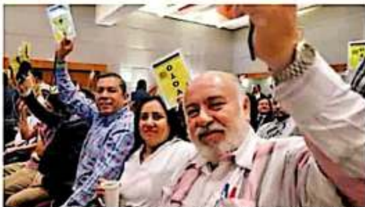
En el congreso del PRD, más de 700 asistentes votaron por el futuro del partido rumbo al proceso electoral de 2021. JOSUEVA