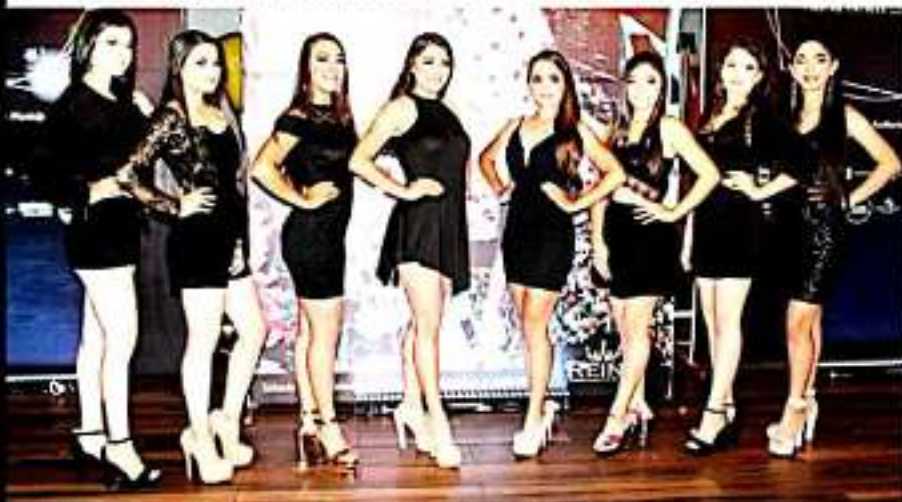
LOS REYES, MICH.- Fueron presentadas las candidatas a Reina de las Fiestas Patrias 2019.

Todas estudiantes de nivel medio superior o superior, deportistas y apoyadas a sus familias, posteriormente desfilaron con las fotografías oficiales que también se presentaron de manera oficial ante los medios de comunicación que se dieron cita al evento, las cuales se estarán exponiendo en el centro de la ciudad.