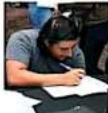
Se han creado 74 mil 963 plazas laborales en 46 meses. Sedec. (CORTINA)

Según la propia dependencia, en la administración anterior, del empleo generado, el 63% (18 mil 289) fue permanente, y el 37% (10 mil 814) fue eventual.