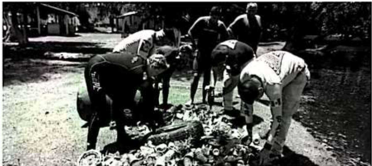
La extracción de residuos sólidos urbanos de los mantos acuíferos es parte fundamental de las acciones de restauración ecológica emprendidas por el Gobierno de Michoacán en sitios como la Laguna de Zacapu y el manantial de La Mintzita.

fecha para llevar a cabo la limpieza subacuática en el Parque Nacional Laguna de Camécuaro, en el municipio de Tangancicuaro, a fin de mitigar el daño que la presencia de contaminantes sólidos urbanos ocasiona.