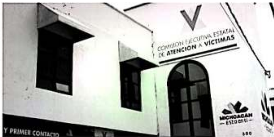
Alrededor de 20 ayuntamientos signaron convenios para impulsar Centros de Atención a Víctimas.