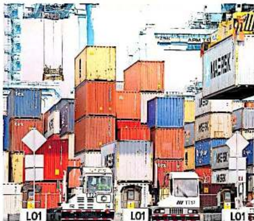
Hubo temas prioritarios para el estado, entre los que destacan seguridad, infraestructura, transferencia de los servicios educativos y la ZEE.