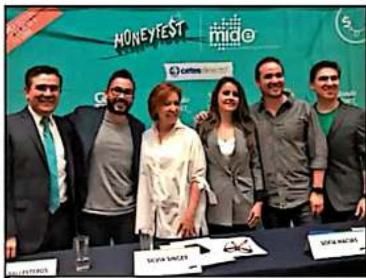
LOS ORGANIZADORES DESTACAN LA NECESIDAD DE ORGANIZAR LAS FINANZAS PERSONALES.

El evento se llevará a cabo el próximo 9 de noviembre en las instalaciones del museo y tendrá un horario de 9 de la mañana a 5 de la tarde, éste se conformará por diversas actividades entre las que destacan música, stand up,