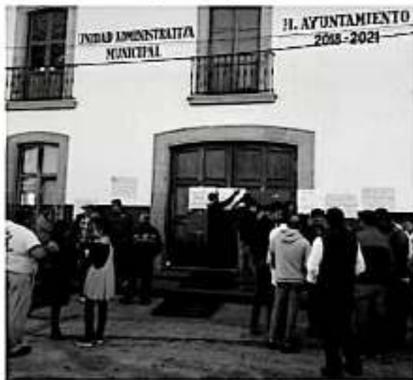
Decenas de personas durante los bloqueos en cada una de las dependencias.