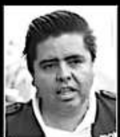
Marko Cortés, LÍDER NACIONAL DEL PAN

"Nunca antes en la historia de México un presidente había tenido tanta popularidad y aceptación social"