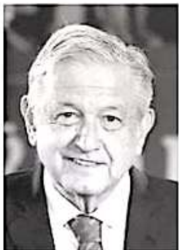
Andrés Manuel López Obrador.

Se espera que los resultados que se obtengan con la nueva convocatoria permitan a los congresistas designar al titular de la contraloría y con ello permitir