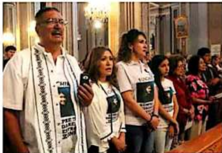
Familias de receptores de órganos agradecen a las familias de los donadores. (CORTINA)

GUADALUPE MARTÍNEZ (Michoacán) Familias de donadores de órganos celebraron este domingo una misa en la Catedral de Morelia para recordar a sus seres queridos, quienes se convirtieron en donantes.