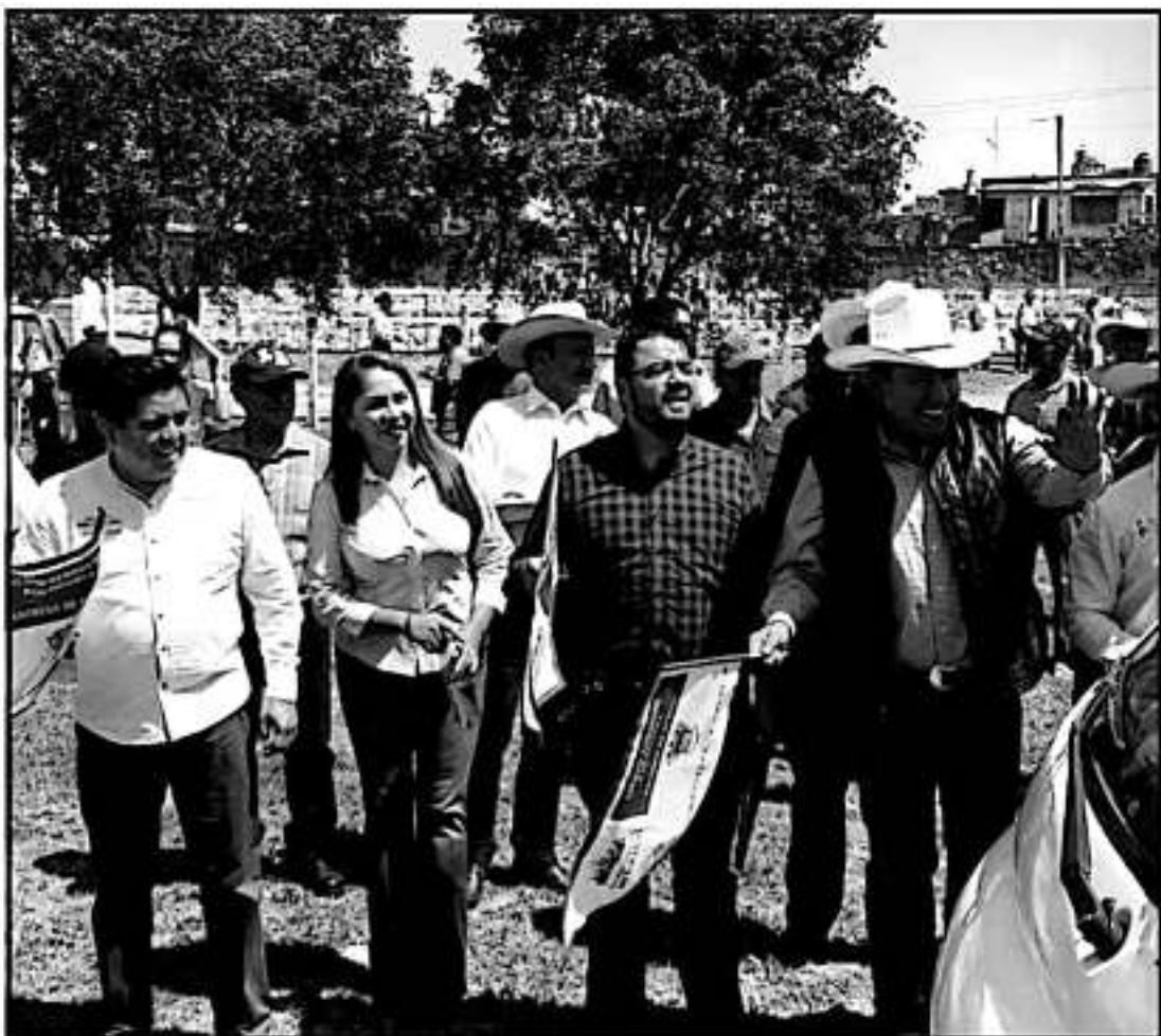
Esta es segunda entrega que se realiza en el estado, 82 sementales fueron elegidos por productores michoacanos.