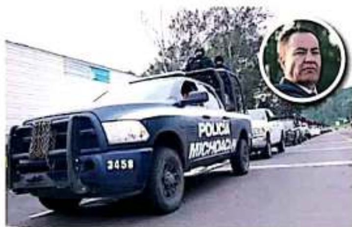
Desde el pasado viernes se mantiene una fuerza operativa de seguridad en la frontera con el estado de Jalisco.