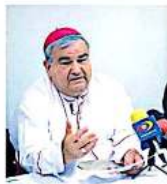
Lamentó que el estado continúe inmerso en la violencia. ANED

Aseveró que es responsabilidad de la Federación dar cuentas de los logros y desaciertos que se han generado tras el primer año de gobierno, señalando que es necesario resaltar la situación de violen-