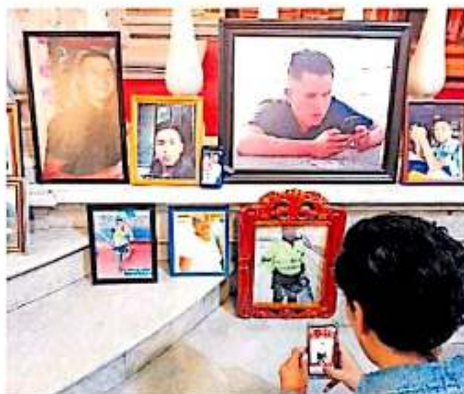
Se ofreció una misa para honrar la memoria de los donadores cadavéricos, así como de los vivos y quienes recibieron el trasplante.

"No quisé donar todo, me imaginé el dolor de las manos, yo por mi hijo ya no podía hacer nada". Ahora, es una mujer tranquila y orgullosa, cumplió con la vo-