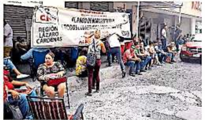
Docentes de plazas federales se suman a las movilizaciones

Los docentes aseguran que persiste la falta de tres pagos, el bono de ajuste fiscal;