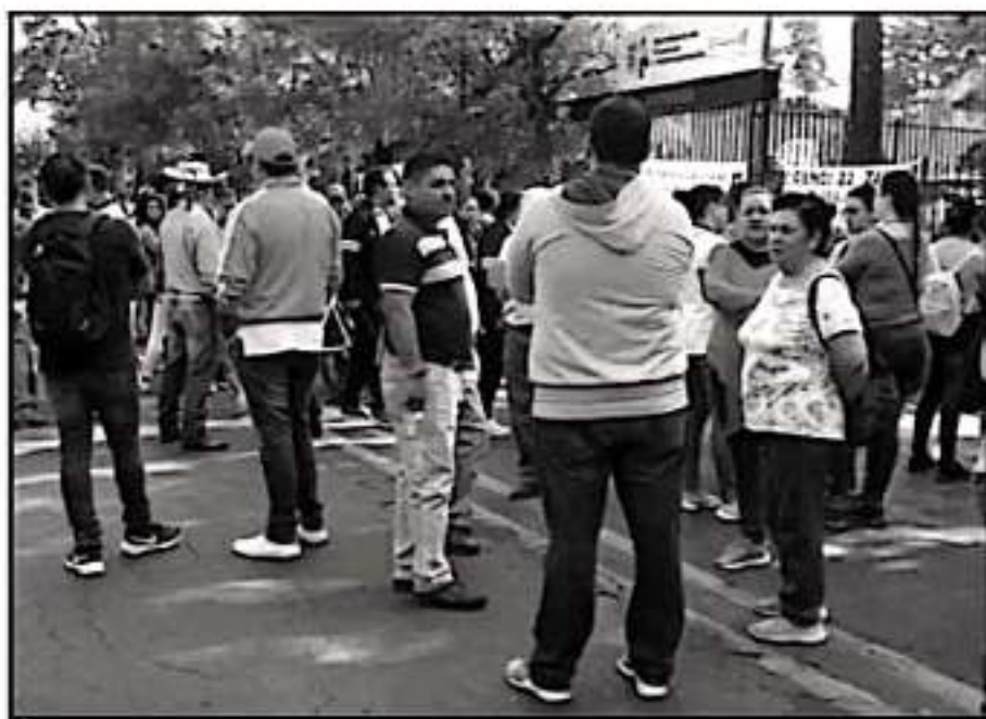
SEGUN LO ANTICIPADO POR LOS DOCENTES, VOLVERÁN A REALIZAR UNA MANIFESTACIÓN EN LA SECRETARÍA DE FINANZAS

De igual forma, la AER se realizará este lunes 2 de septiembre a las 12:00 horas, a donde acudirán delegados de todas las regiones magisteriales para tomar determinaciones en torno al tema de falta de pago, así como información de las mesas nacionales.