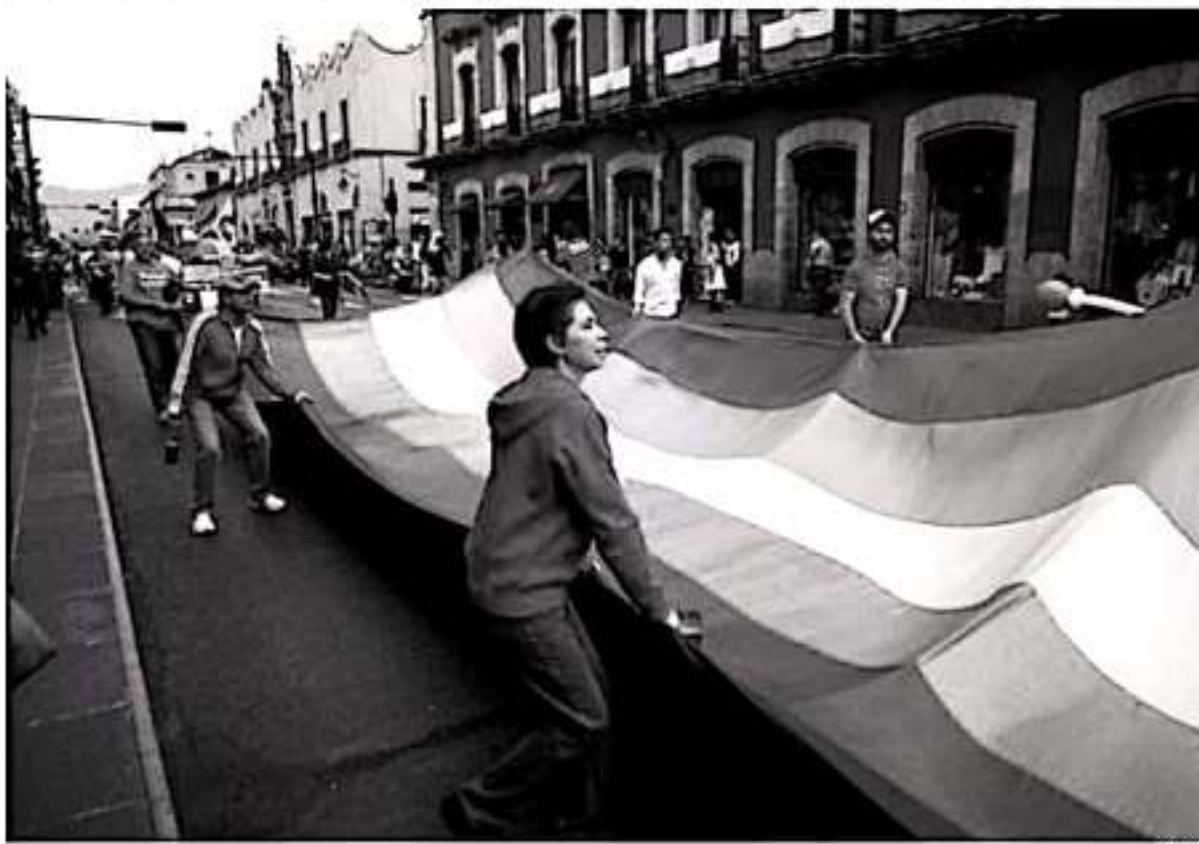
La Seimujer impartirá un taller sobre derechos de población LGBTTTI+, el seminario será gratuito y abierto para el público en general.

La FGE reafirma su compromiso de velar por la integridad de las michoacanas.