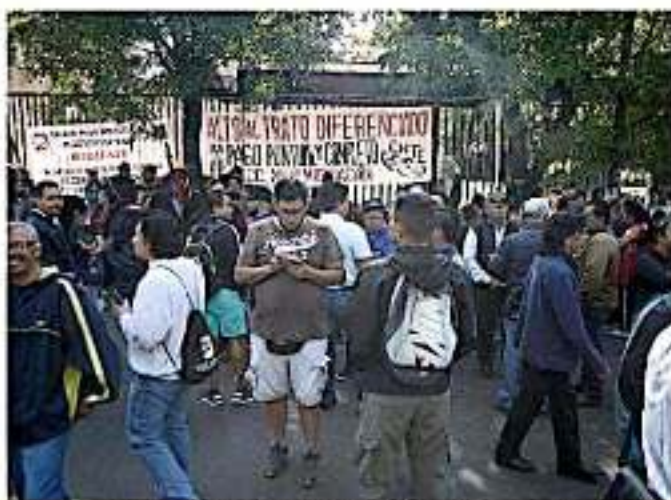
El sector educativo será prioridad en los pendientes económicos que arrastra el estado. Esperan se normalice la situación con la federalización. CARLOS HERRERA

En tanto eso ocurre, aseguró que "nos tocará ser creativos, tener paciencia para