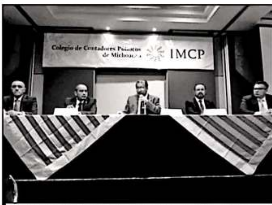
LOS CONTADORES DEL ESTADO RECONOCEN QUE ES IMPORTANTE ACABAR CON LOS BENEFICIOS FISCALES EN EL PAÍS.

de Hacienda cerraron en primeros 8 meses