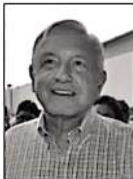
Andrés Manuel López.

No necesitaba López Obrador acudir al Congreso para quedar bien con nadie. No tiene contrapesos políticos en San Lázaro. La Glosa del Informe se hará en comisiones legislativas, cuyas presidencias, en su mayoría, están en manos de Morena. Tampoco volverá a tener problemas para cabildear el Presupuesto de Egresos, cuyo anteproyecto para el año 2020 deberá remitir el próximo 8 de