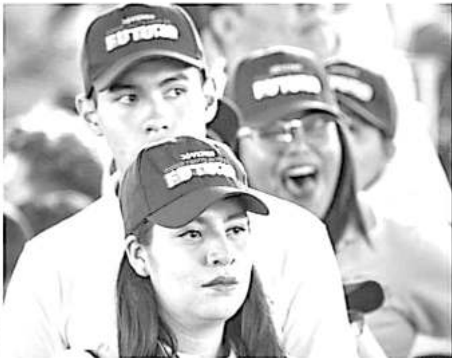
Se han incorporado más de 56 mil jóvenes en Michoacán.