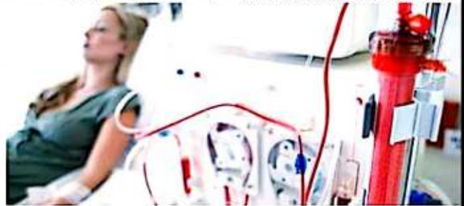
ECUANDUREO, MICH.- El aumento de pacientes con insuficiencia renal, obliga a mantener vigente el proyecto intermunicipal para consolidar un centro que brinde este servicio.

Donde se considera imprescindible contar con la asistencia del Gobierno y sociedad ya que todos son piezas importantes para hacer alguna aportación u observación referente al tema.