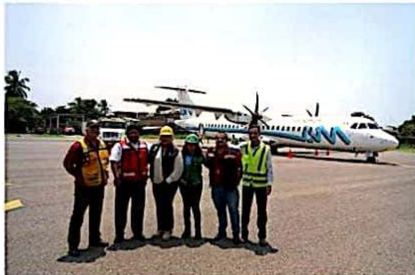
Personal del Aeropuerto local, de las áreas de Comandancia, ASA y bomberos y de la aerolínea Aeromar, dieron la bienvenida al nuevo vuelo de esta empresa.

También trabajó sobre una iniciativa de Decreto mediante el cual se derogan diversas disposiciones de la Ley de Hacienda del Estado de Michoacán de Ocampo; se glosó el "Tercer Informe del Estado que guarda la Administración Pública Estatal"; se atendió una iniciativa de Decreto para abrogar el Decreto Legislativo; otra iniciativa