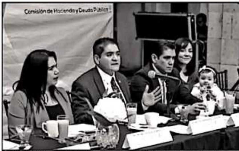
LA COMISIÓN LEGISLATIVA DE HACIENDA Y DEUDA PÚBLICA CITO A MIEMBROS DEL CONJUGACIÓN ESTE LUNES.

El también expresidente municipal de Tangancicuaro propuso priorizar el pago de nómina "de abajo hacia arriba", y recordó que él, siendo alcalde, sacrificó los aguinaldos del Cabildo para pagarle primero a los elementos de seguridad, protección civil, bomberos y limpieza.