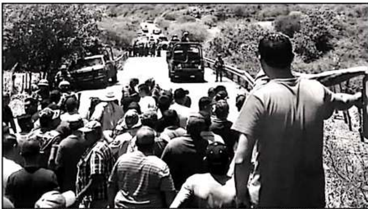
LA REGIÓN DE TEPALCATEPEC ES UNA DE LAS MÁS CONFLICTIVAS, DOMINADA POR UN GRUPO CRIMINAL QUE COLOCA INCLUSO A LOS LÍDERES, SEGÚN GOBIERNO ESTADAL.

de ser señalado por asesinatos en el estado