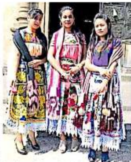
El registro de jóvenes continúa, pero ahora están enfocados a comunidades indígenas.