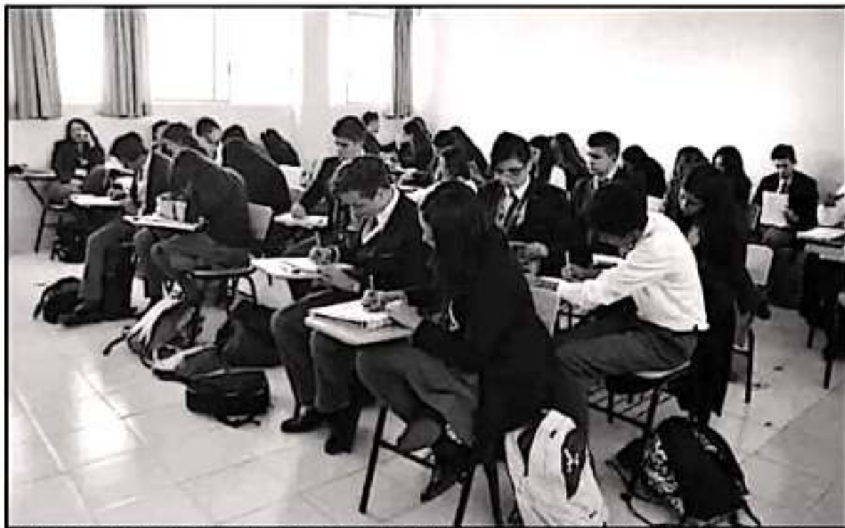
LA UNIVERSIDAD LA SALLE ESTÁ COMPROMETIDA CON DAR SIEMPRE UN PLUS EN LA OFERTA ACADÉMICA, POR LO QUE DESTACA SU SISTEMA DE BECAS.