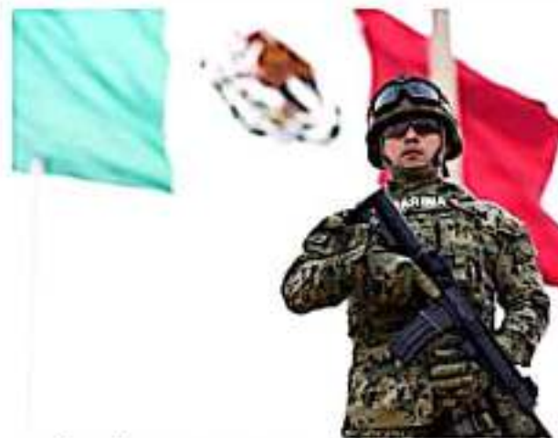
CD. LÁZARO CÁRDENAS, MICH.-La Semar, está invitando a personal civil ingresar al servicio activo de esta Institución y formar parte de sus filas como Marinero de Infantería de Marina.

Los interesados deberán presentarse en las instalaciones de la Décima Zona Naval, de lunes a viernes en horario de oficina, con los documentos indicados en los requisitos.