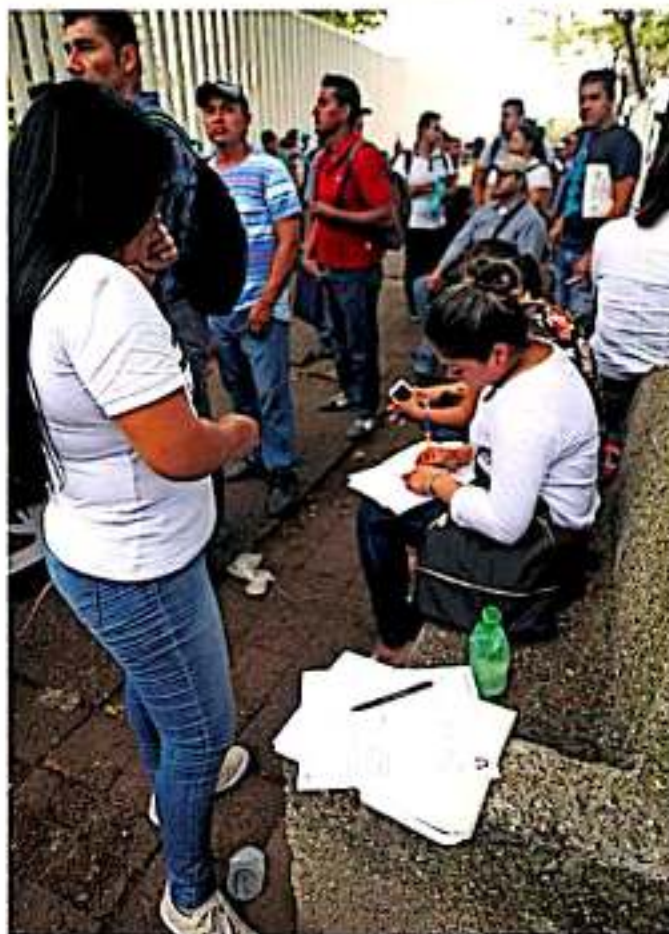
La vertiente de vinculación laboral incluye acciones como: bolsa de trabajo, talleres para buscadores de empleo, ferias y jornadas laborales. Alcorno

Para conocer que se han generado 73 mil 963 fuentes laborales (tanto permanentes como eventuales), lo que repre-