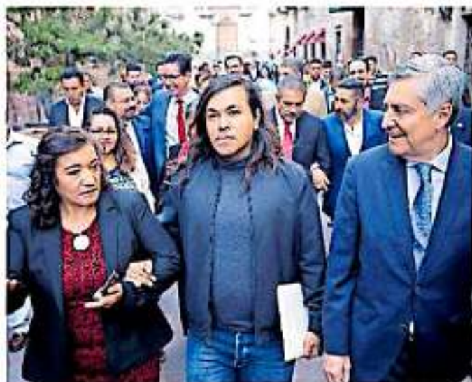
El líder del partido guía esta vez acompañado por diputados federales, senadores, presidentes municipales y algunos legisladores locales.