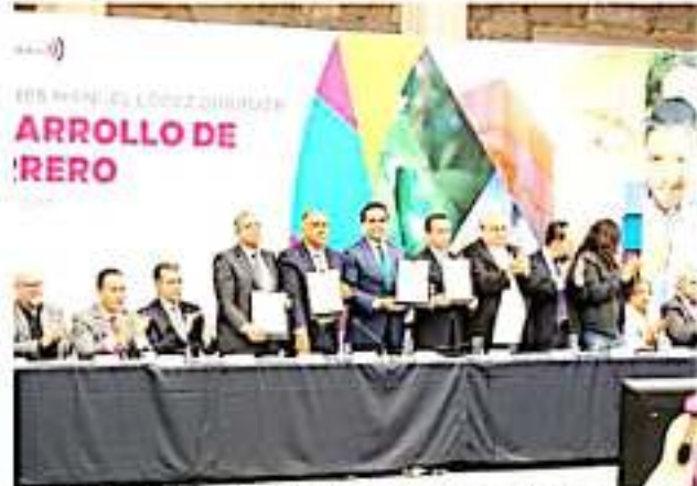
MORELIA, MICH.- A fin de impulsar un proyecto regional que reemplazará a la Zona Económica Especial, los gobernadores de Guerrero, Héctor Astudillo Flores y de Michoacán, Silvano Aureoles, acordaron hacer un planteamiento al presidente, Andrés Manuel López Obrador, para que la región costera de ambas entidades federativas sea declarada Zona Libre Fronteriza, en la que se disminuya el IVA y se aumente el salario mínimo.

Cabe mencionar que la carta signada este lunes por los gobernadores Silvano Aureoles Conejo y Héctor Astudillo Flores, así como de los representantes de distintos sectores de la sociedad, en sus cinco ejes contempla la implementación de una política pública de atracción inversión e incorporar a las MIPymes en los planes de desarrollo. De igual forma, figura la creación de un fideicomiso para infraestructura social, garantizar a las empresas con incentivos tengan trabajadores con mínimo de tres salarios de sueldo y la generación de un Corredor Industrial que conecte Pacífico, Bajío y Ciudad de México.