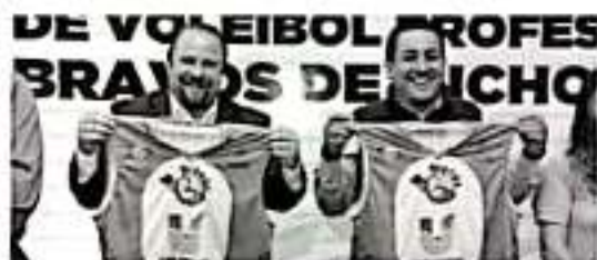
URUAPAN, MICH.- Producto de las gestiones del presidente municipal, Víctor Manuel Manríquez González, Uruapan se convirtió en sede del equipo profesional de voleibol "Bravos Michoacán".

Añadió que no obstante contar con algunos elementos de selección nacional, Bravos Michoacán se refuerza con elementos nacionales y extranjeros para ser protagonista en el próximo torneo, en el que también se dará cabida a más talentos locales que den mayor sentido de pertenencia a Uruapan.