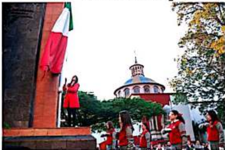
URUAPAN, MICH.- En Uruapan se cumplen 33 años que distintos sectores de la población se agrupan cada año, para involucrarse en la organización de las fiestas patrias.

Añadió que las fiestas patrias son el marco perfecto, para que todos los ciudadanos retomemos los valores cívicos y los llevemos a la práctica a cada momento en el hogar, la escuela, el centro de trabajo, en la vía pública y en todas nuestras actividades.