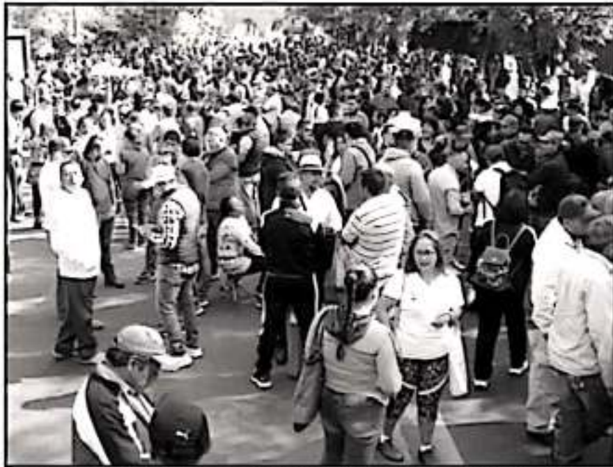
LAS MANIFESTACIONES Y BLOQUEOS DE ALGUNOS DOCENTES SE HAN MANTENIDO DESDE LA SEMANA PASADA.