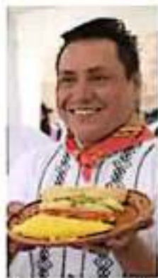
En el festival también se podrá degustar los otros platos mexicanos.

Por cuarto año consecutivo, los morelianos podrán degustar una amplia variedad de platillos mexicanos limpios y a costos accesibles en el Festival del Buñuelo y Tamal, que organizan los comerciantes del templo de Mater Dolosa, y en esta ocasión será los días 7 y 8 de septiembre.