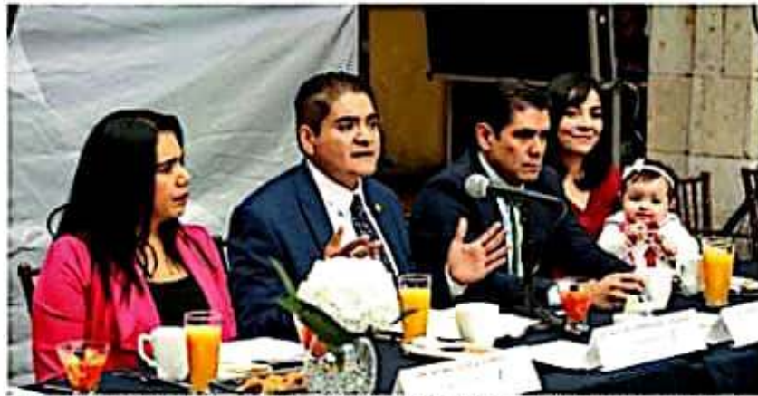
Arturo Hernández Vázquez, presidente de la Comisión de Hacienda y Deuda Pública del Congreso del Estado.