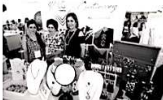
URUAPAN, MICH.- Debido a que el bazar Business Woman realizado el año pasado alcanzó una derrama económica por alrededor de un millón de pesos, este año solicitaron la intervención del ayuntamiento para cambiar la sede a una zona más céntrica.