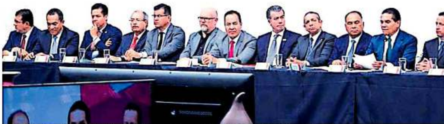
El acuerdo fue entre más de 180 sectores de la sociedad de ambos estados, con la finalidad de potenciar el desarrollo económico y social.

Morelia, Michoacán • 2 de septiembre de 2019