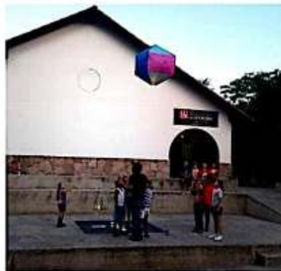
APATZINGÁN, MICH.- El Centro Cultural La Estación ha preparado una serie de actividades que se realizarán durante todo el mes patrio.

que se está viviendo una situación económica considerada como muy crítica y no todas las personas pueden hacer ese tipo de gastos.