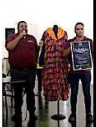
Todo listo para que los integrantes de la Rondalla Arpegio festejen un aniversario

El evento para la celebración del séptimo aniversario tendrá lugar el sábado 7 de septiembre a las 7 de la noche al interior del Teatro Obrero, donde se contará con la actuación especial de la Rondalla Sentimientos Juveniles, evento que tendrá un costo mínimo de 70 pesos para quienes gusten asistir.