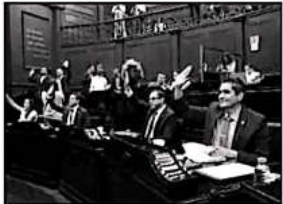
CONTINUAN LAS DISPUTAS INTERAS AL INTERIOR DE MORENA PARA LIBERAR LA BANCADA GUINDA Y LA JUNTA DE COORDINACIÓN POLÍTICA.

19. Examen de conocimientos: El examen de conocimientos se aplicará el día 24 de agosto de 2019, a las 10:00 horas, en el Instituto Electoral y de Procesos de Justicia de Michoacán, en el día 24 de agosto de 2019, a las 10:00 horas.