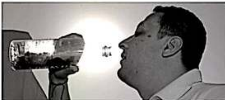
MORELIA, MICH.- Debido a los cambios climáticos que se han presentado en las últimas semanas en la entidad, la Secretaría de Salud en Michoacán (SSM), invita a la población a evitar la ingesta de alimentos en la vía pública.

Por ello, la importancia de no bajar la guardia en la implementación de acciones preventivas para el cuidado de la salud de la población, para evitar se incrementen los padecimientos.