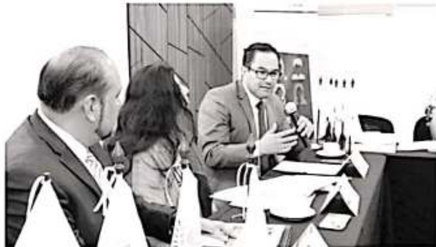
El presidente de la Comisión Estatal de Derechos Humanos hizo un llamado a la Federación para que garantice en Michoacán condiciones de seguridad y tranquilidad a la población.

En ese contexto señala que ante la impunidad de miembros de la delincuencia organizada y la utiliza-