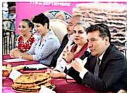
MORELIA, MICH.- Anuncian dependencias municipales el 4to. Festival del Tamal y el Buñuelo.

esquina entre General Jesús González Ortega y Avenida Francisco I. Madero Poniente, a unos pasos del Jardín Niños Héroes.