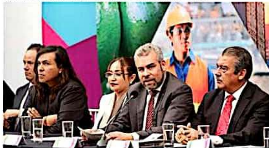
Alfredo Ramírez Bedolla, suscribió también el Acuerdo por el Desarrollo de Michoacán y Guerrero.