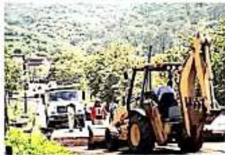
LOS REYES, MICH.- También se ha dado continuidad a la limpieza de diferentes tramos carreteros y calles, como el acceso al Tecnológico y al Catimi.

Con el apoyo de camiones de volteo y maquinaria pesada, incluso se procedió a rellenar con material un socavón ocasionado por una crecida en las inmediaciones de una conocida tienda de conveniencia y la recién construida gasolinera ubicada en el tramo antes mencionado.