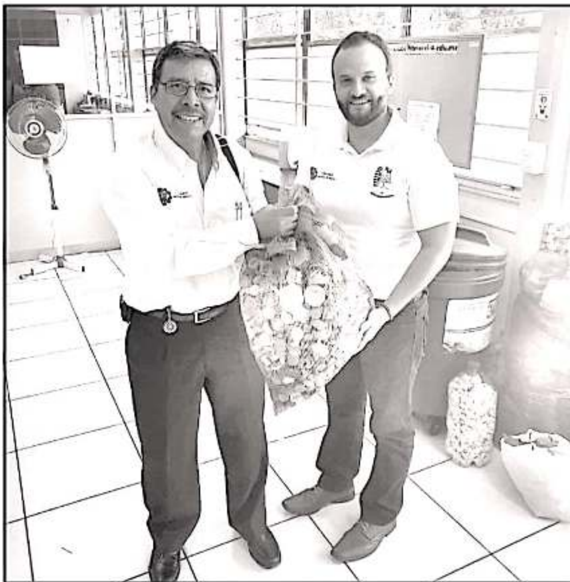
Unos 35 kilogramos de tapas de plástico donó la coordinación de Lenguas del ITM como parte de la colecta correspondiente al periodo primavera-verano que busca dar tratamiento a niños con cáncer.

Es importante mencionar que en la Coordinación de Lenguas Extranjeras una vez por semestre realizan acciones por beneficio de la sociedad, como entrega de viveros a grupos vulnerables y la colecta de tapas.