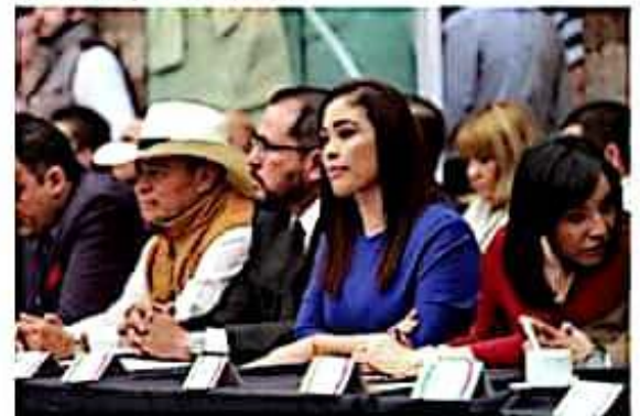
La legisladora local Miriam Tinoco Soto, se une a los esfuerzos por el desarrollo de Michoacán.

Por su parte Miriam Tinoco Soto reconoció la disposición de legisladores locales, federales, senadores, secretarios, gobernadores, sector empresarial y social de impulsar esta medida, al señalar que la suma de esfuerzos es indispensable para el fortalecimiento de la economía de ambas entidades.