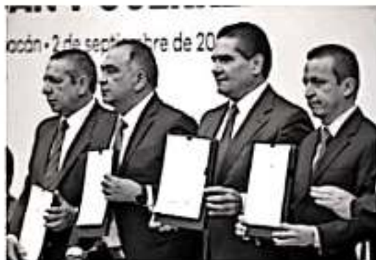
MORELIA, MICH.- En un acto histórico, representantes de los tres niveles de Gobierno, legisladores, universidades y líderes partidistas y empresariales, además de la sociedad civil y religiosa, de Michoacán y Guerrero, se unieron para impulsar el crecimiento de la región del Balsas.

Garantizar a las empresas con incentivos tengan trabajadores con mínimo de 3 salarios de subsistencia. La generación de un Corredor Industrial que conecta Pacífico, Ba-