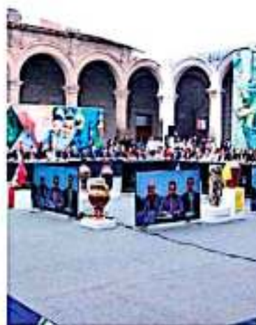
El mandatario guerrerense se pronunció por un real crecimiento económico y de inversiones.

"Tenemos que hacer este corredor de inversiones que conecta a Lázaro Cárden-