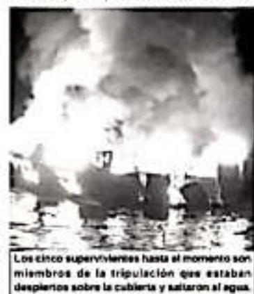
Los cinco supervivientes hasta el momento son miembros de la tripulación que estaban despiertos sobre la cubierta y saltaron al agua.

Se esperaba que la embarcación regresara a la costa hoy sobre las 17:00 hora local (00:00 hora).