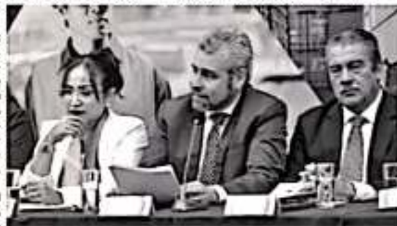
MORELIA, MICH.- Por iniciativa de Alfredo Ramírez, el 14 de noviembre del 2018 el Congreso del Estado aprobó por unanimidad un exhorto al presidente Andrés Manuel López Obrador para que decretara una Zona Libre Fronteriza en la entidad.

Esto es lo que hoy venimos a proponer como un pueblo unido, dispuesto a trabajar por un buen porvenir", concluyó Ramírez Bedolla.