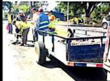
LOS REYES, MICH.- Intensa campaña de bacheo viene realizando la Dirección de Obras Públicas.