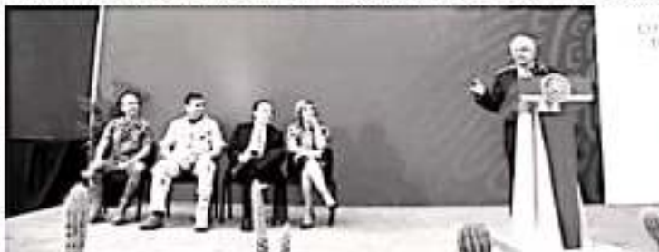
Este lunes 2 de septiembre la conferencia mañanera del presidente Andrés Manuel López Obrador se desarrolló en la Base Aérea en Hermosillo, Sonora.