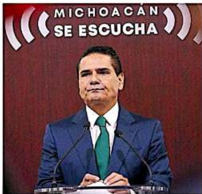
El gobernador reprochó al munipke proteger una "guardia delincencial" (ARREBO)

Situándose hasta el momento sobre la vigilia la penitente en los límites de Tepalcatepec con Jalisco, tras haberse des-