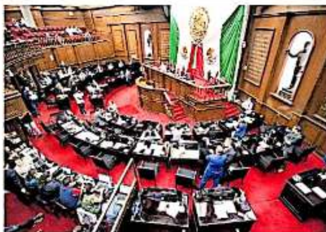
Algunas comisiones no tenían conocimiento de las particularidades de los terrenos y casas a desincorporarse