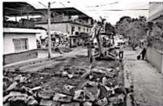
URUAPAN, MICH.- La Comisión de Agua Potable, Alcantarillado y Saneamiento de Uruapan (Capasu), registró un total de 383 reportes atendidos durante el mes de agosto.