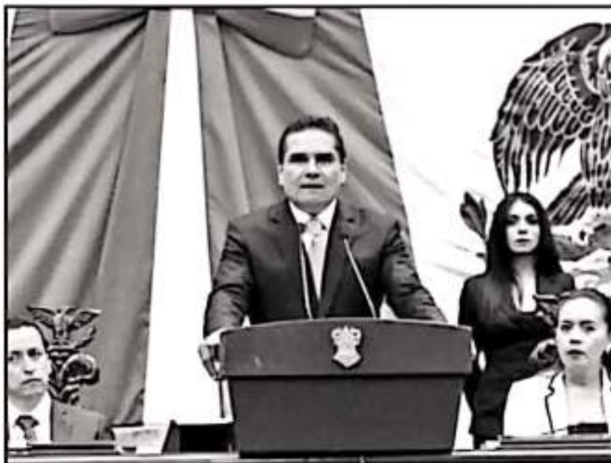
DENTRO DE TRES SEMANAS EL GOBERNADOR PRESENTARÁ EL BALANCE DE SU CUARTO AÑO DE ADMINISTRACIÓN

“Tentativamente el informe será el 25 de septiembre, estamos trabajando para determinar si puede ser ese día porque no depende solamente de mí, eso se acuerda con los diputados del Congreso y esa es una posibilidad antes del 30, está en esas fechas y tentativamente sería el 25 de septiembre, en las previsiones presupuestales hemos trabajado mucho con Hacienda y estamos haciendo las consi-