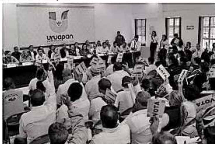
URUAPAN, MICH.- El Consejo de Desarrollo Municipal (CDM) priorizó por unanimidad 30 obras de electrificación.

En la sesión también se abordaron temas de electrificación, agua potable, servicio de recolección de basura, seguridad y otros tópicos planteados por los comités vecinales.