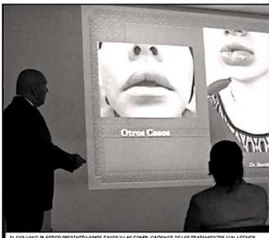
EL CIRUJANO PLÁSTICO PRESENTÓ VARIOS CASOS Y LAS COMPLICACIONES DE LOS TRATAMIENTOS MAL HECHOS

En ese sentido, señaló que los registros de salud pública no cuentan con estadísticas precisas sobre los malos presentados en pacientes a causa de la aplicación de modelantes inyectables, pues las personas que acuden a los servicios médicos suelen mentar sobre las causas de sus padeci-