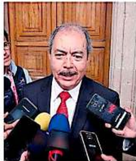
Silva Tejeda le recordó al Ejecutivo que los dos munipkes anteriores emanaron del PRI. (MARIBEL LUNA)

Finalmente, señaló que si bien el edil no ha dicho haber recibido amenazas, sí existe preocupación por los recientes hechos registrados en la zona.