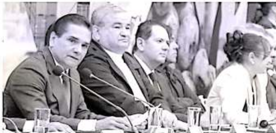
El mandatario estatal aseguró que de nada sirve que haya Guardia Nacional en municipios si no interviene.

Por ello dijo que durante las próximas horas enviará una misiva al comandante de la Guardia Nacional y al Fiscal General de la