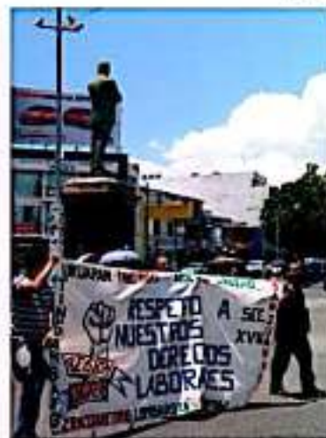
URUAPAN, MICH.- Ante la falta de respuesta pese a la toma de Rentas, los docentes michoacanos optaron por una marcha por diversas vías de la ciudad, hasta su arribo a palacio municipal.

Durante un lapso de hora y media, el desquiciamiento vial en esta zona de la ciudad fue la constante, haciéndose notar los elementos motorizados que con cierres a la circulación totales y parciales, contribuyeron a mejorar el flujo vehicular, quedando totalmente normalizada la circulación luego de las 14:15 horas.