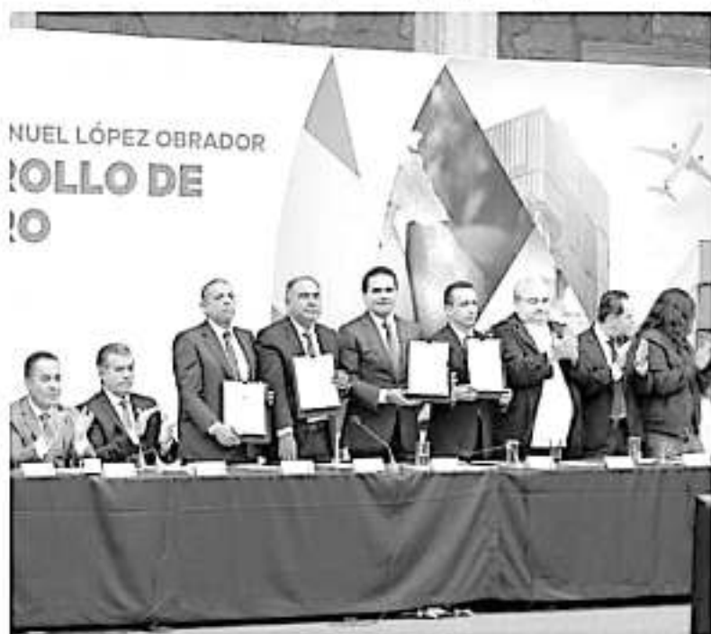
Los mandatarios de Michoacán y Guerrero signaron el acuerdo en Palacio de Gobierno y convocaron a la unidad.

Por su parte, el gobernador de Guerrero, Héctor Astudillo Flores, felicitó al mandatario michoacano por lograr esta iniciativa que beneficia al territorio guerrerense, esta-