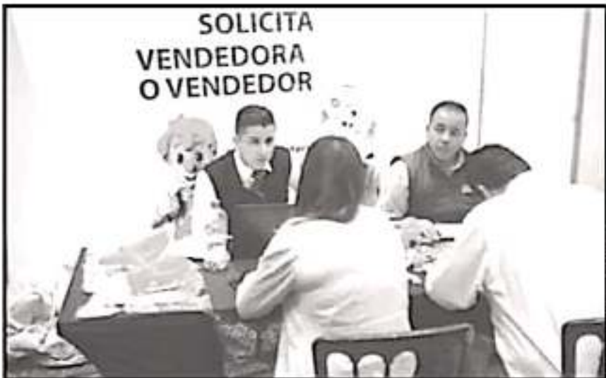
EL TITULAR DEL CEEM SEÑALA QUE LA SITUACIÓN DEL EMPLEO FORMAL EN MICHOACÁN ES PREOCUPANTE

En este sentido, comentó que, a nivel nacional, durante los primeros 7 meses del año, también se presentó una desaceleración en la materia, con una cifra de 234 mil 775 menos plazas laborales creadas, al pasar de 530 mil 789 a 306 mil 014 puestos laborales entre 2018 y 2019, una reducción del 42.3 por ciento. Ante ello, el