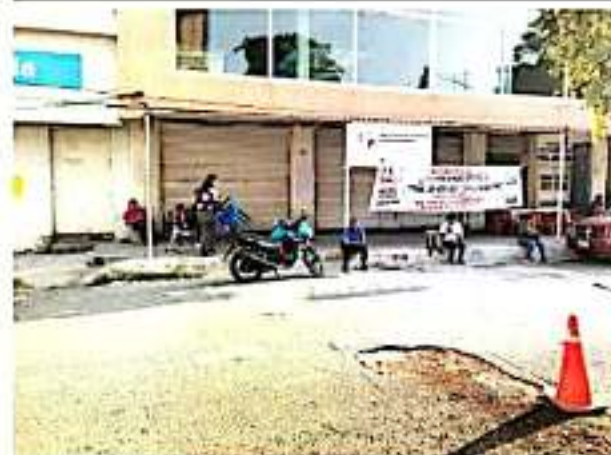
CD. LÁZARO CÁRDENAS, MICH.- Por tercer día consecutivo, los maestros de la CNTE mantienen la toma de las oficinas de Administración de Rentas así como de la Secretaría de Finanzas.

Asimismo, hacen mención que tampoco han sido notificados sobre si ya cuentan con fondos los cheques que le fueron girados para el pago de la última quincena de agosto.