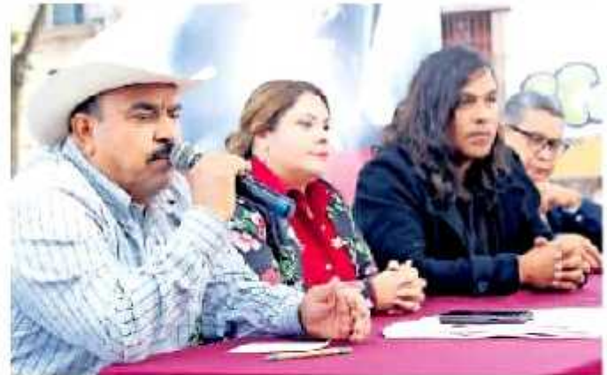
El alcalde dijo que va a ser "mandó construir una base militar".