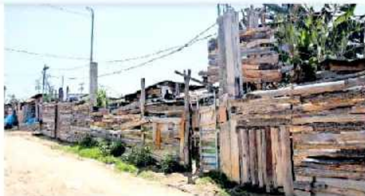
Inconformes acusaron a la asociación y a simpatizantes de ella. HERNÁNDEZ MALDONADO

"Nosotros con el supuesto dueño que se nos ha presentado tratamos de negociar y decir que se nos diera un precio fijo y que nos presentara una escritura donde se nos presentara que