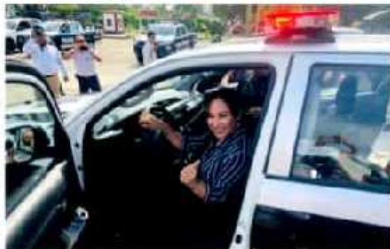
CD. LÁZARO CARDENAS, MICH.- Con recursos del Programa de Fortalecimiento para la Seguridad, que ascendieron a los tres millones 630 mil pesos, este lunes, fueron entregadas seis patrullas y tres motocicletas a la Dirección de Seguridad Pública Municipal.

Del mismo modo, dijo que para el próximo año se prevé aumentar el número de capacitaciones y recordó que a diferencia de las anteriores administraciones, se cumple en casi un 50 por ciento con los estándares de la Organización de las Naciones Unidas (ONU), en cuanto al despliegue de uniformados en la localidad se refiere.