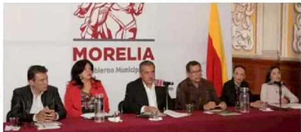
El edil aseguró que las medidas de austeridad se aplican en la mayoría de la administración municipal. COMUNIS