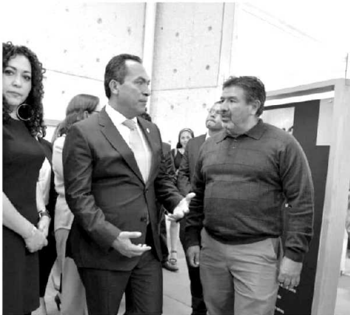
En compañía de diversas personalidades, el Fiscal General realizó la entrega de premios a los ganadores del Primer Concurso de Fotografía en materia de Trata.