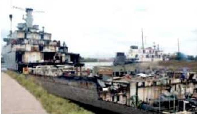
CD. LÁZARO CÁRDENAS, MICH.- La desmanteladora de barcos que dejó de operar como tal desde 2016, aún tiene la concesión para el desguazado de barco, señaló el director de la API, Raúl Correa Arenas, rechazando que pueda existir una segunda concesión para chatarrizadora de buques.

La empresa que construyó el astillero para la desmanteladora, argumentó cambio de giro a almacenadora de combustibles por falta de materia prima (barcos chatarra) para seguir la actividad, ofreciendo invertir en la nueva actividad más de 250 millones de pesos, aspirando arrancar operaciones en 2018, según la API, aún no opera como distribuidora de combustibles, porque no se ha liberado el permiso.