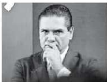
El gobernador estatal exige una postura firme por parte de AMI O.

Al descartar que derivado del tiroteo reportado en un centro comercial del estado de Texas haya habido alguna víctima de origen michoquense, el mandatario estatal informó que de acuerdo al último informe se hablaba de siete mexicanos fallecidos, oriundos principalmente de Chihuahua, y otros cinco heridos. Situación