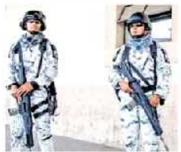
Con 100 policías, se considera que si se cumplen los indicadores.

Hasta el momento no se ha precisado el número de elementos federales que pudieran arribar a la localidad, pero estimó que entre agosto y septiembre ya se tenga la presencia