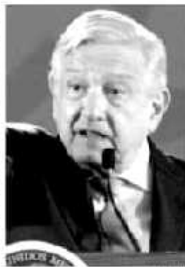
ANDRÉS MANUEL LÓPEZ OBRADOR, ESPDOL

En la quinta gira de trabajo por Michoacán como presidente de la República, Andrés Manuel López Obrador volvió a retomar el tema de la federalización de la educación básica en el estado, reafirmando su compromiso de que así será, solo que no hay un plazo determinado, aunque se agende el próximo mes de septiembre como una posibilidad. Lo importante es que no hay indicios de que se dé marcha atrás en el tema, veamos lo que dijo el mandatario federal este domingo en su paso por los municipios de Huétamo y Tuxpan, en donde recorrió clínicas rurales.