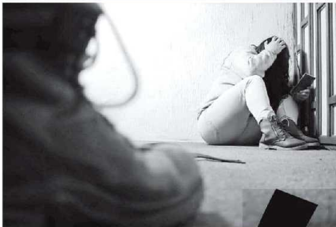
Se han denunciado cinco casos de delitos sexuales.