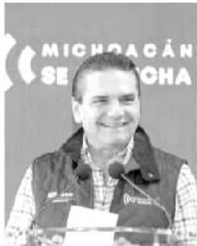
La entidad escala cinco posiciones en la medición de la pobreza, gracias a políticas públicas implementadas en el actual gobierno.

«Somos el primer estado de la República que más ha disminuido la pobreza en dos años, eso me llena de orgullo y satisfacción, porque de acuerdo a información de Coneval, del 2016 al 2018 pasamos de 55.3 por ciento a 46 por ciento», indicó Aureoles Conejo.