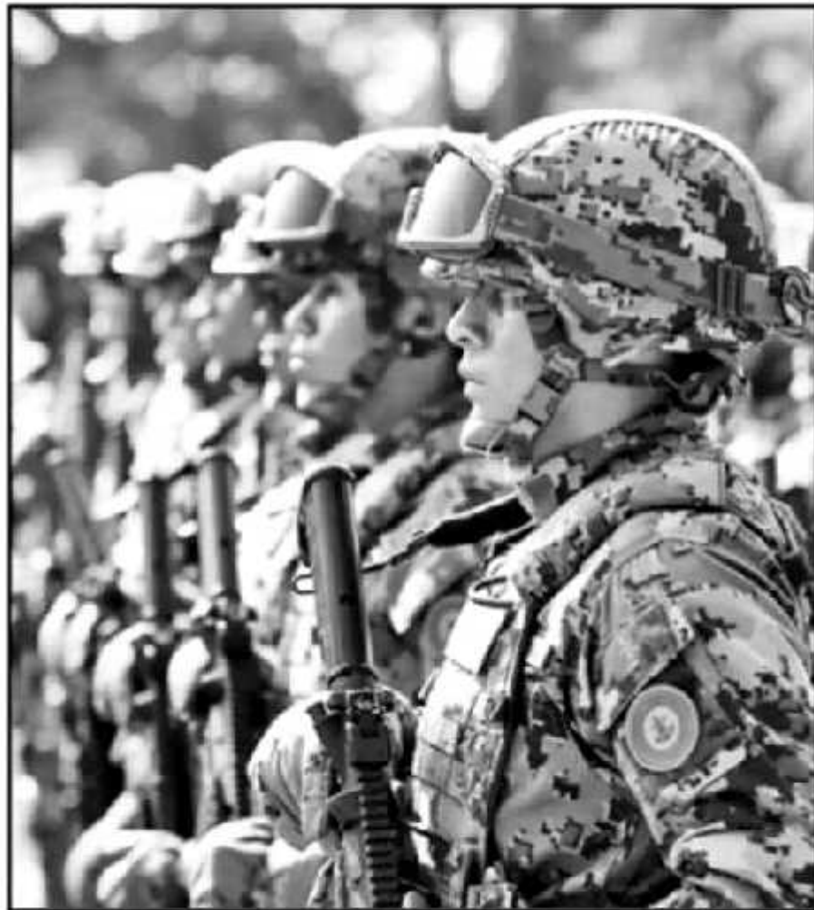
LA VISITADURÍA DE LA CEDH EN EL PUERTO DESTACÓ LA FORMA EN CÓMO SE CONDUCE LA SECRETARÍA DE MARINA.

Actualmente la dependencia que está repuntando en cuanto al número de quejas es la Secretaría de Educación por cuestiones de ingresos e inscripciones, aunque la lista la encabeza seguridad pú-