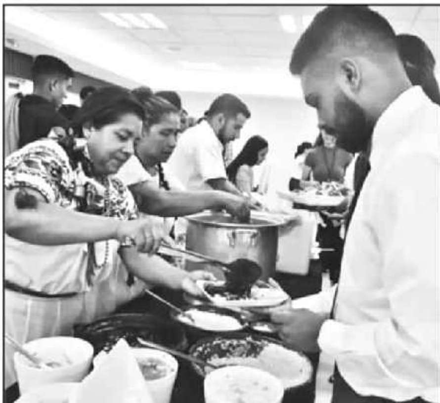
JÓVENES MEXICAMERICANOS FUERON AGASAJADOS CON GASTRONOMÍA REGIONAL DE LA TIERRA DE SUS PADRES

4.5 MILLONES población actual en Michoacán