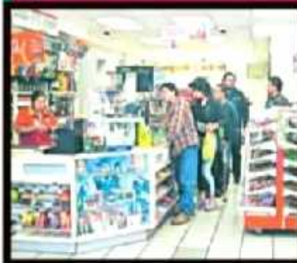
LA VOZ DE MICHOACÁN