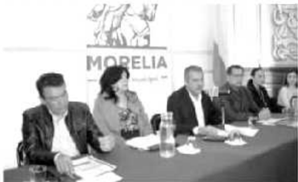
El gobierno municipal morelista dio a conocer que si se instauraron procedimientos administrativos y penales contra exfuncionarios que abusaron sus sus cargos.

«Si hay denuncias, hay hallazgos y serán las instancias jurisdiccionales las que determinarán su procedencia», insistió Morón Orozco.