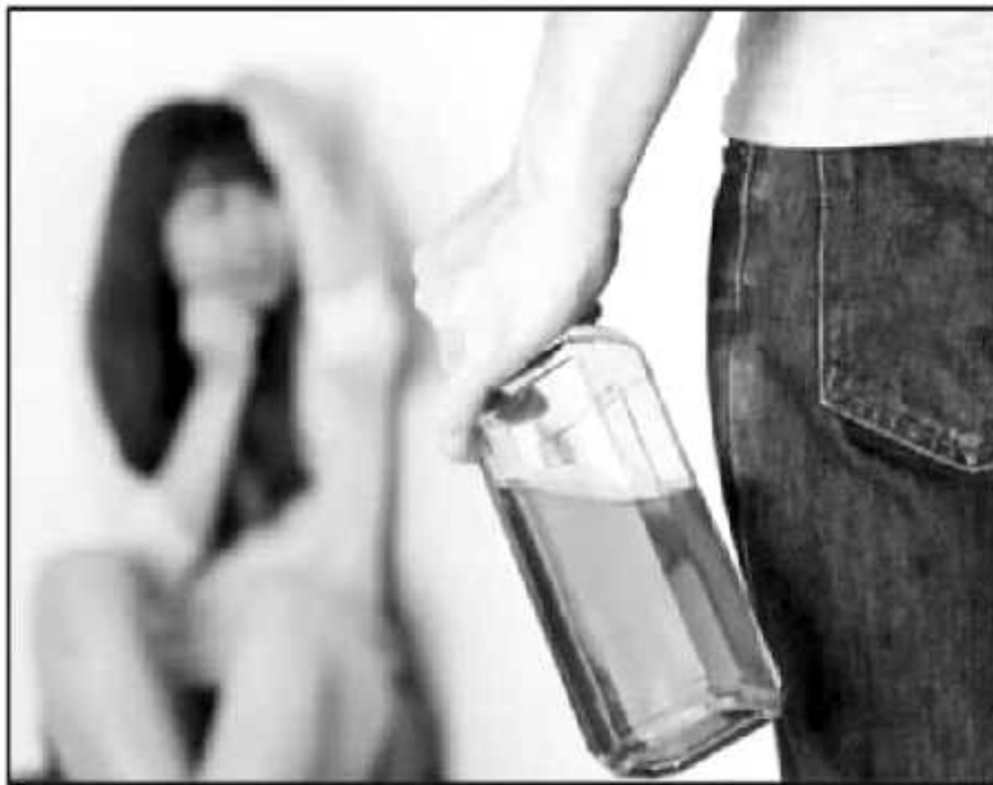
MUCHAS VECES, LAS ADICCIONES SON EL DETONANTE DE LAS AGRESIONES HACIA LAS MUJERES DENTRO DEL HOGAR

ese estado las mujeres han perdido la vida o son físicamente agredidas, etcétera".