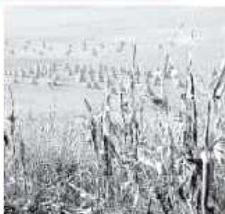
Se deben notificar las pérdidas para la cobertura de daños. /ARREBO

Es un dato preliminar, siempre y cuando pase el campo para hacer la verificación, siempre hay un ajuste en la superficie y el número de productores, lo que vanno a trabajar estas dos semanas de manera intensiva en la liberación de re-