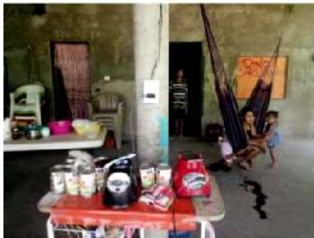
CD. LÁZARO CÁRDENAS, MICH.- La agrupación "Colonias Unidas de Guacamayas", suma más de 220 quejas en contra de CFE, mismas que habrán de ser expuestas este martes.

Luego de manifestarse en las oficinas de la CFE en Lázaro Cárdenas, la agrupación "Colonias Unidas de Guacamayas", suma más de 220 quejas contra esta dependencia, quienes este martes expondrán nuevos casos de abuso registrados en el cobro por el servicio de energía eléctrica.