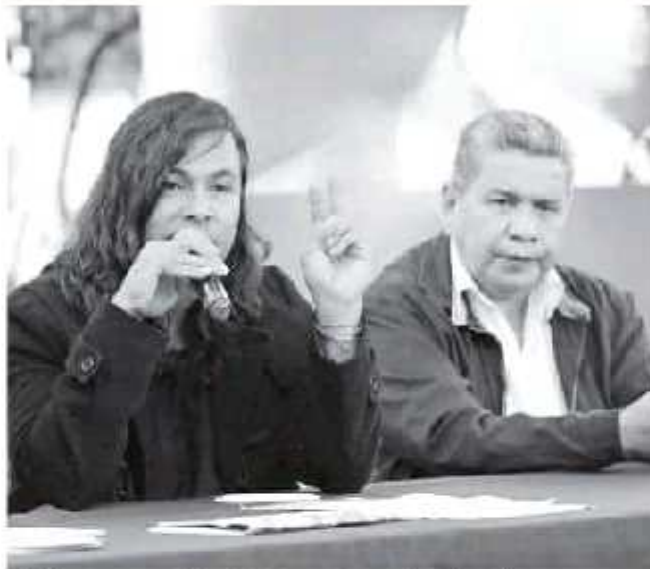
El dirigente estatal del partido destacó la negativa del Legislativo por transparentar este tema. RODRIGO LUNA

"Ya se ingresó a la ventanilla de acceso a la información pública para conocer los oficiales que