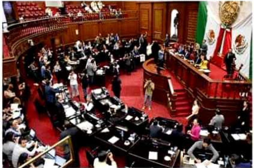
El pleno del Congreso del estado aprobó habilitar el teatro Juárez de Zitácuaro para la celebración de una sesión solemne el próximo 19 de agosto.

Cabe señalar que las patrullas y equipo recibidos, se adquirieron con recursos del Programa de Fortalecimiento para la Seguridad (Fortaseg), por un monto de tres millones 630 mil pesos, que sirvieron para adquirir seis patrullas y tres motocicletas.