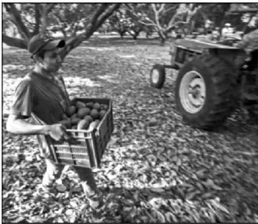
POR MEDIO DE LA VIOLENCIA, CARTELES DEL CRIMEN ORGANIZADO SE FUERON APODERANDO DE MUCHOS CULTIVOS

Y es que muchos aguacateros fueron asesinados por el crimen