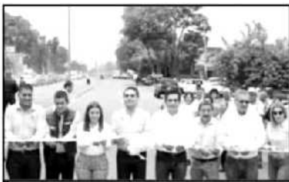
AUDICIONES DE AMBOS NIVELES TAMBIÉN INAUGURARON UN TRAMO VIAL