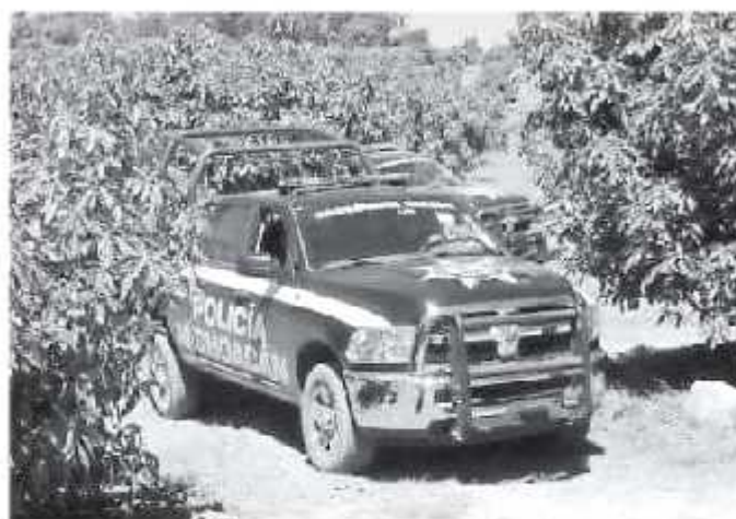
Se iniciará una revisión en conjunto con la Asociación de Productores y Empacadores de Aguacate y el Comité Estatal de Sanidad Vegetal.