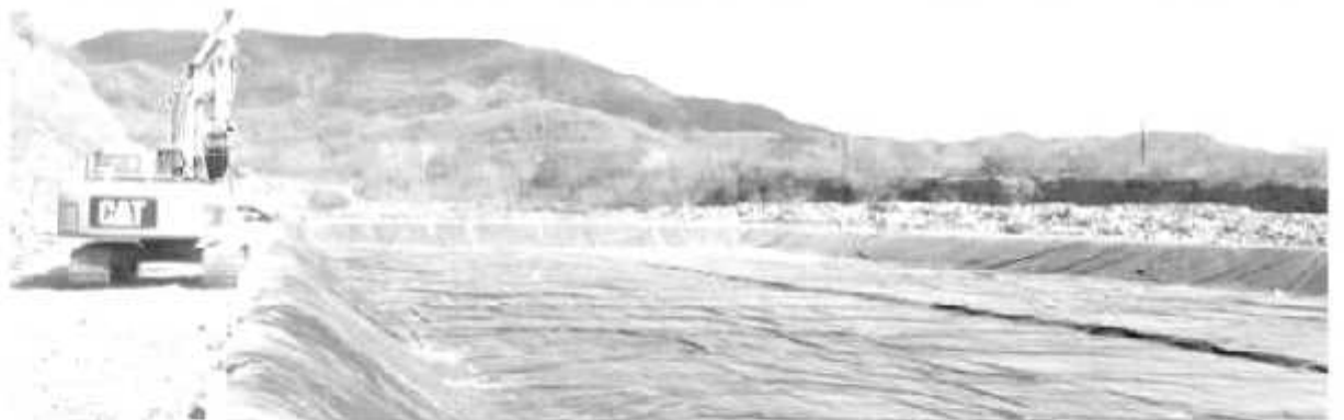
El adecuado tratamiento de los residuos sólidos incide en una mejor salud para las poblaciones y los ecosistemas.

Aureoles Conejo, a través de la Semaccdet, y procedente del Fondo para el Desarrollo Regional de Estados y Municipios Mineros (Fondo Minero), este año arrancó la creación de cuatro nuevos rellenos sanitarios para abatir la proporción de desechos que son depositados en sitios no aptos para ello. Así, en Coahuayana se llevó a cabo la edificación de un relleno sanitario con un costo de 4