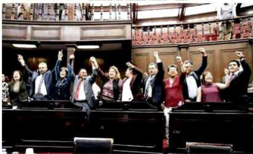
Contabilizan diputadas y diputados de Morena un total de 100 iniciativas.