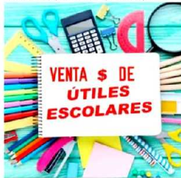
ZAMORA, MICH. - En la víspera del inicio del nuevo ciclo escolar 2019-2020, padres de familia buscan ofertas y otros mecanismos para reducir los gastos en la compra de uniformes, útiles, calzado y otros.

De ahí que los padres de familia comiencen la adquisición de los artículos que se pueden encontrar en algunos bazares familiares, ofertados en redes sociales o particulares que se dedican a vender artículos de papelería, uniformes y calzado a bajo costo.