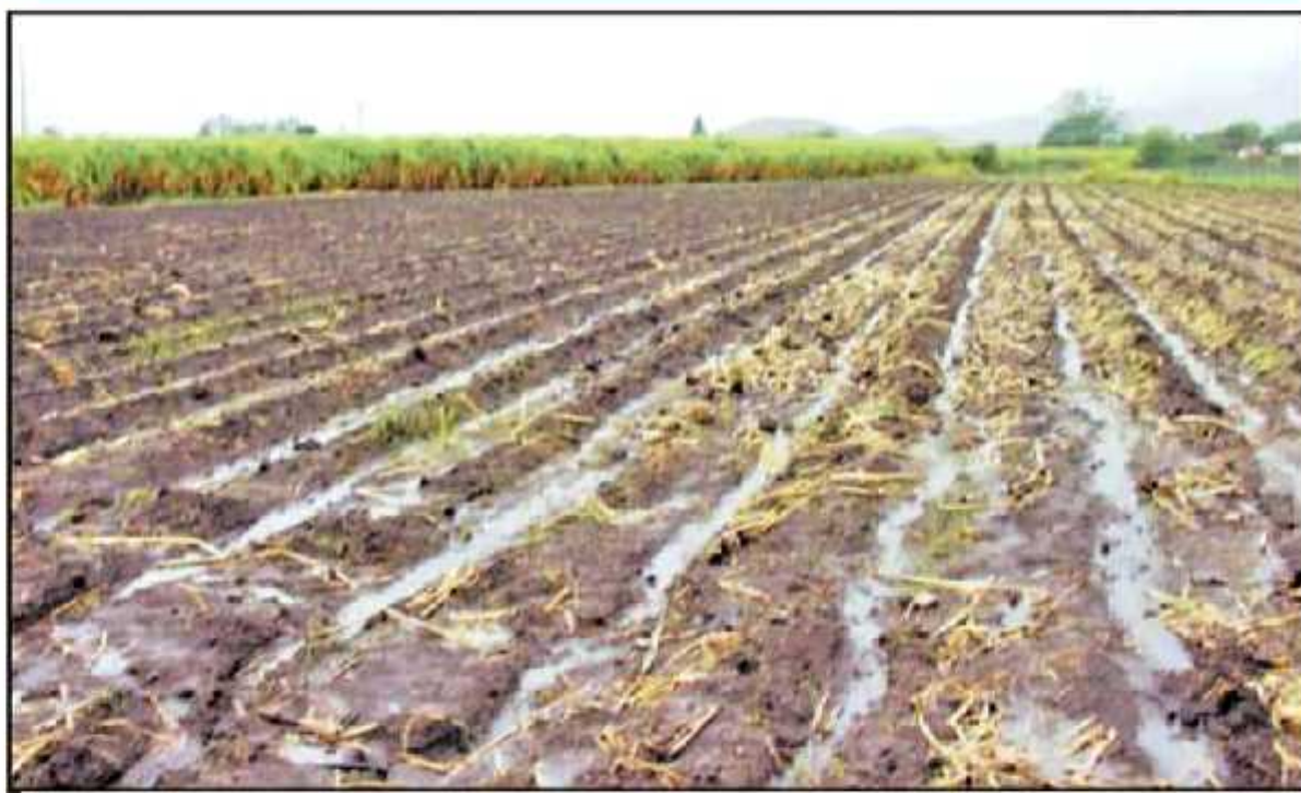
LA FALTA DE LLUVIAS O LAS FUERTES TORMENTAS PUEDEN AFECTAR A LOS CULTIVOS. GENERALMENTE LOS CULTIVOS DE TEMPORAL SON LOS MÁS PROPENSOS

"Hemos tenido el reporte de la región de Iquique por la tromba, sin embargo, en el área agrícola hay una situación menor, habíamos estimado 200 hectáreas afectadas, pero en las áreas de revisión tenemos prácticamente 50 hectáreas afectadas, en la región del Bajío se ha trabajado de manera preventiva y no hay reportes. Más bien lo que hemos tenido es la afectación por sequía, pero la infraestructura nos permite atender a los municipios", manifestó el funcionario estatal.