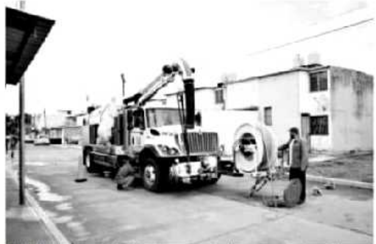
URUAPAN, MICH.- Capasu está trabajando de manera puntual y emergente en cada situación que se ha presentado, sin embargo, pidió la colaboración de la ciudadanía para que apoye en sus colonias y calles a revisar el estado de sus alcantarillas