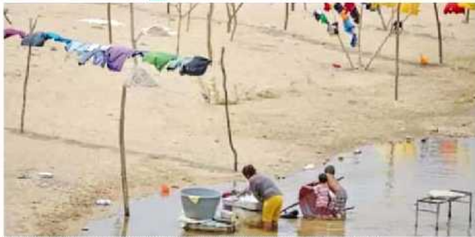
El mayor porcentaje de mexicanos en situación de pobreza se alza en el estado del país: Chiapas, Guerrero, Oaxaca y Veracruz.

El porcentaje de mexicanos en situación de pobreza pasó de 64.4% a 61.9% entre 2008 y 2018, según la última entrega del estudio nacional.