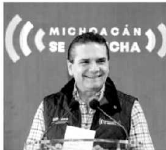
MORELIA, MICH.- Por décimo año consecutivo, Michoacán se mantiene en el primer lugar en valor de la producción agrícola, superando los 85 mil millones de pesos con una superficie sembrada de alrededor de un millón 150 mil hectáreas y 117 cultivos.

Además, el programa de Agricultura Sustentable, el cual promueve el uso de biofertilizantes y otras medidas en el cuidado al medio ambiente, y el Programa de Infraestructura Básica, con el que han atendido a 23 mil productores de 77 municipios michoacanos, en tareas como limpiar caminos, desatolvar, caminos saca cosechas, que permiten evitar inundaciones agrícolas. "La infraestructura que tenemos en la Secretaría nos está permitiendo atender puntualmente a todos los municipios del estado, cada uno con sus necesidades particulares y en todos los hábitos que requiere el campo", señaló el funcionario estatal.