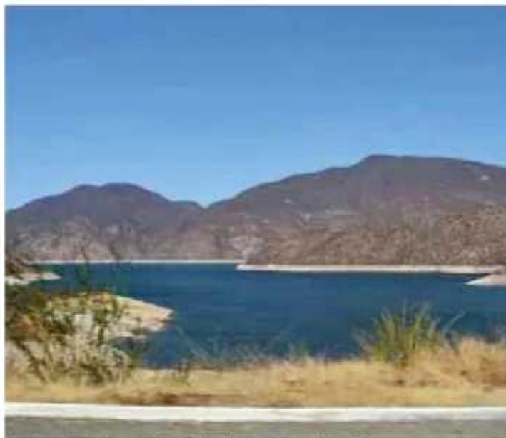
Este año no se ha realizado ningún desfogue en alguna de las presas de la entidad. [CONAGUA]

"Este año ha llovido relativamente poco; no podemos decir que ya no lloverá más, porque se viene agosto y septiembre, que son los