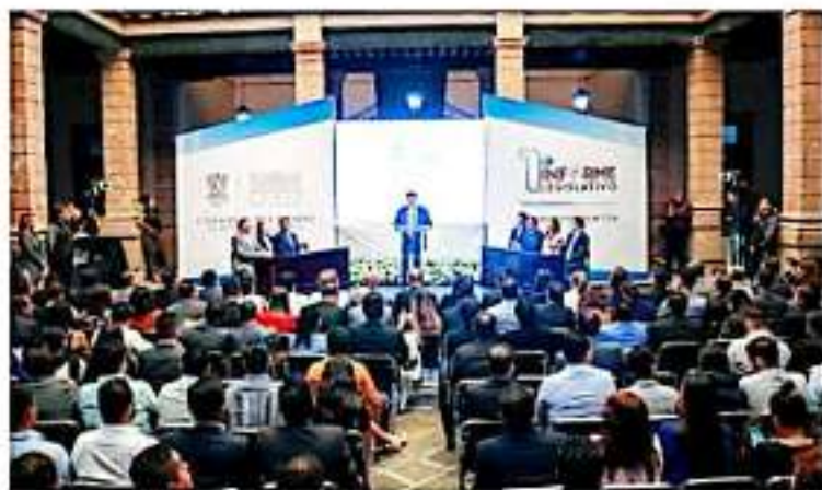
MORELIA, MICH.- Los ocho legisladores de Acción Nacional presentaron su Informe del Primer Año Legislativo.

"En el PAN nos manejamos con respeto, evidentemente yo respeto a todos mis diputados, el PAN se conservará unido hasta el final de esta Legislatura y estoy haciendo todo lo posible para que la paz regrese, esto es lo público y hay otras cuestiones que debemos dialogar y son temas muy internos que no quiero manifestar en los medios, no podemos pelearnos en un momento tan crítico", dijo.