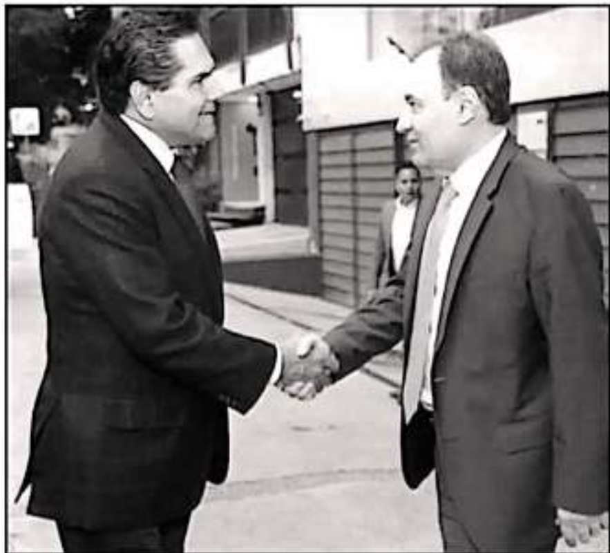
SILVANO AUREOLES Y ALFONSO DURAZO ACOORDARON NO PERMITIR GRUPOS CIVILES ARMADOS EN MICHOACÁN.

Aureoles y Durazo reforzaron su compromiso para no permitir la presencia de grupos criminales desorganizados de autodefensas, ni de civiles armados que operen al margen de la ley realizando labores que competen a las instituciones, por lo que reiteraron su compromiso de mantener el Estado de Derecho y no