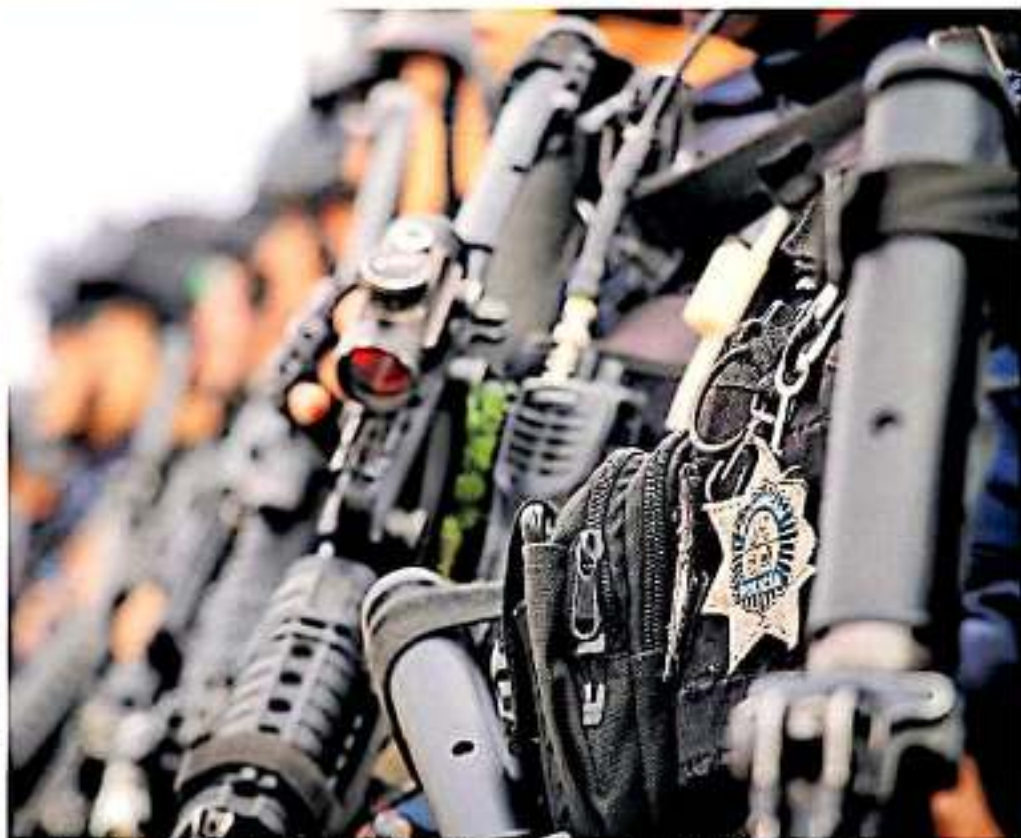
Se utiliza el fondo para la evaluación de control de confianza de los elementos de las Policías municipales.

Conforme al perfil oficial del organismo de seguridad pública, los montos destinados en una primera ministración gracias al Fondo Nacional de Fortalecimiento para la Seguridad, quedan de la siguiente manera: Apaxtzingán, 2 millones 708 mil 025 pesos; Hidalgo seis millones 08 mil 630 pesos; La Piedad, ocho millones 905 mil 139 pesos; Lázaro Cárdenas, nueve millones 890 mil 738 pesos; Morelia, 15 millones 50 mil 514 pesos; Tarímbaro cuatro millones 973 mil 443 pesos; Uruapan, 10 millones 229 mil 80 pesos; Zamora, 2 millones 342