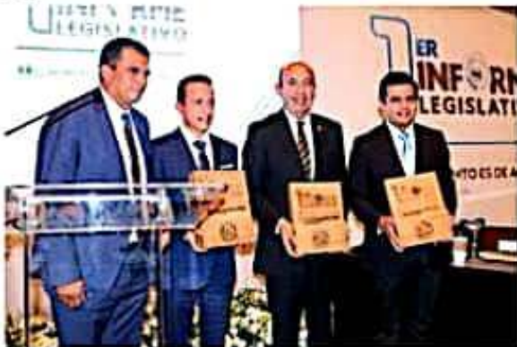
El líder estatal del blanquiazul partido celebró los resultados obtenidos durante el primer año legislativo del GPPAN.