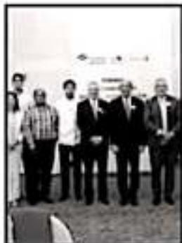
EL PROYECTO DE HOTEL-ESCUELA. INNOVADOR, DICEN