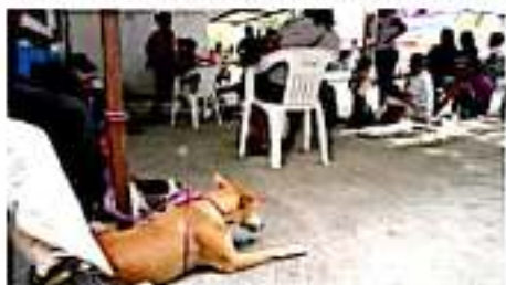
CD. LÁZARO CÁRDENAS, MICH.- Este fin de semana, en la tenencia de Playa Azul, se reactivará la campaña gratuita de esterilización de mascotas, que impulsa la administración municipal, a través de la cual se atenderán por día un total de 25 mascotas, solamente sábados y domingos.