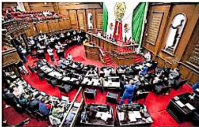
El incremento se calculó a partir de 100 trabajadores que serán basificados, la creación de una unidad de evaluación y el pago de ludes pendientes.