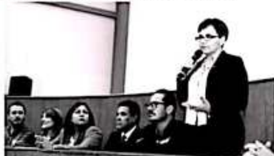
MORELIA, MICH.- Con el objetivo de establecer acciones coordinadas entre los tres órdenes de Gobierno, se llevó a cabo la reunión de trabajo de la Estrategia Nacional para la Prevención de Adicciones (ENPA).