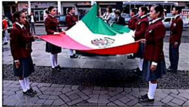
URUAPAN, MICH.- Alumnos de la escuela secundaria "Moisés Sáenz Garza", plantel que se ha distinguido por sus logros académicos, deportivos y culturales.

Resaltó que Uruapan está orgulloso de la escuela secundaria "Moisés Sáenz Garza", plantel que se ha distinguido por sus logros académicos, deportivos y culturales. Además de que la mayoría de sus egresados, han sido protagonistas del desarrollo de este municipio.