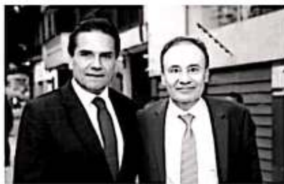
CUADRO DE MÉXICO.- El gobernador de Michoacán, Silvano Aureoles Conejo y el secretario de Seguridad y Protección Ciudadana, Alfonso Durazo Montaño.

"Hoy más que nunca es indispensable continuar con un trabajo coordinado para la atención inmediata y estratégica contra aquellos que buscan desestabilizar al estado y al país, por lo que la prioridad seguirá siendo la protección a la ciudadanía ante cualquier amenaza de grupos delictivos", puntualizó Aureoles Conejo.