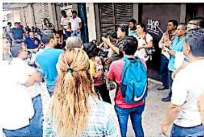
La toma de receptorías terminó ayer, hoy se concentran en Morelia. GEORGINA GASCA

Los puntos por los cuales saldrá la marcha precedida para este viernes serán cuando, así desde las 6 de la mañana y ahí estarán los contingentes del Sector IX, de los municipios Cosahuatana, Clénepa, La Piedad, Los Reyes, Zamora, Parícuti, Zacapu. Los que salen de la salida a Salamanca ven de los municipios de Morelia y Parícuti, los que saldrán por la salida