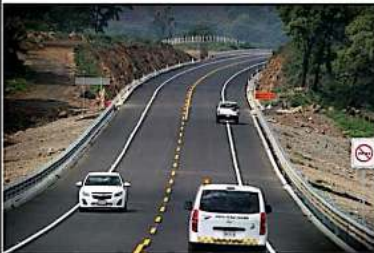
CD. LÁZARO CÁRDENAS, MICH.- El tramo carretero de Las Cañas tiene "vacíos" de comunicación celular que implican riesgos para los usuarios de la vía; ante esto, sectores portuarios están solicitando que se instale una antena que abra la cobertura telefónica en el lugar.

Otra zona sin contacto telefónico es la Costa michoacana dentro del municipio de Aquila, entre Pichiinguilloy La Placita.