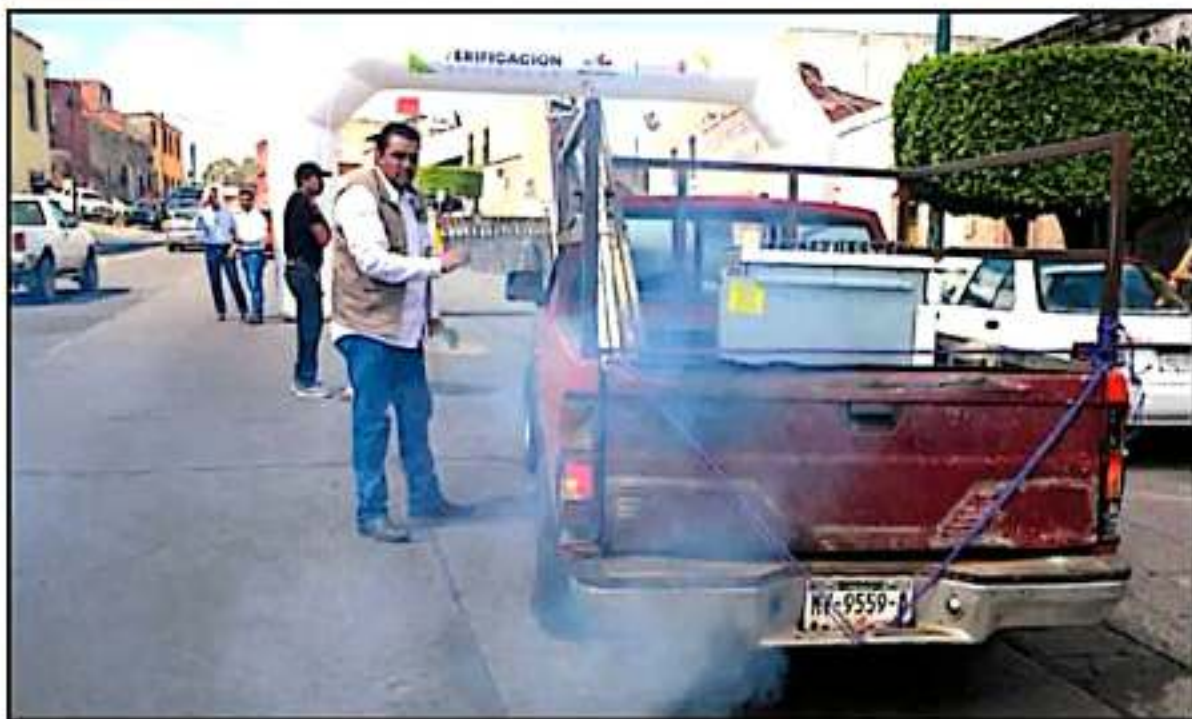
LA PROAM Y ELEMENTOS DE TRÁNSITO ESTATAL, HAN INSTALADO RETENES ALEATORIOS EN DISTINTOS PUNTOS DE MORELIA PARA REVISAR AUTOMÓVILES.

ración de años pasados, se han duplicado la cantidad de ciudadanos que han acudido a hacer el trámite.