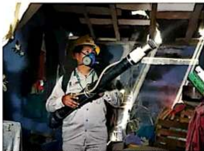
Atención del sector salud en materia de la lucha contra la propagación del mosquito transmisor. | COMEX

Recordó que actualmente la dependencia tiene identificados como focos rojos a los municipios de