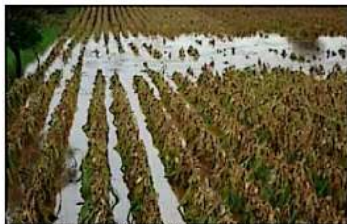
Para este año se tendrá una cobertura de 65 mil 430 hectáreas de cultivos agrícolas, como maíz, sorgo, ajonjolí, avena, chile, garbanzo, plátano, guisado, papaya y zarzamora; mientras que en la actividad acuícola se protegerán 72 mil 800 metros cuadrados

Añadió que con estos dos componentes se tendrá una