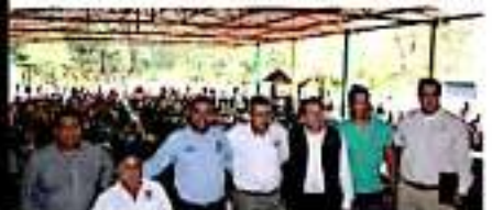
TOCUMBO, MICH.- Funcionarios federales, alcaldes de tres municipios y dirigentes campesinos encabezaron el arranque del Programa Producción para el Bienestar, en beneficio de más de 900 cañeros.

El edil anfitrión dio la bienvenida resaltando lo mucho que ha dado la caña a esta región "Hoy van a recibir un apoyo de suma importancia que, si bien no resuelve todas las necesidades, sí aligera la carga que tene-