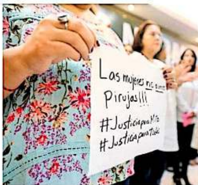
El feminicidio no es el único riesgo contra las mujeres; son víctimas de lesiones dolosas, privaciones de libertad, extorsiones, trata y delitos sexuales, entre otros.

Sin embargo, el feminicidio no es el único delito que afecta contra la integridad de las mujeres en la República Mexicana, también se presentan otros casos como lesiones dolosas, privación de la libertad, extorsiones, maltrato de mujeres y menores, violencia contra la mujer en los que se presentan incidentes como el abuso sexual, el acoso, hostigamiento y violación, pasando por llamados de emergencia relacionados a violencia familiar y violencia de pareja.