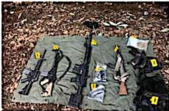
Las armas aseguradas a presuntos delincuentes en el municipio de Los Reyes.