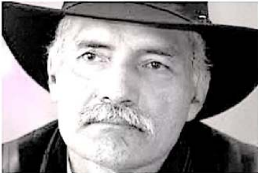
Exlíder de las autodefensas, causó controversia con declaraciones en torno a las concubinas de los derechohabientes del ISSSTE.

se hicieron virales en redes sociales y de inmediato iniciaron los reclamos para que el exautodefensa sea destituido.