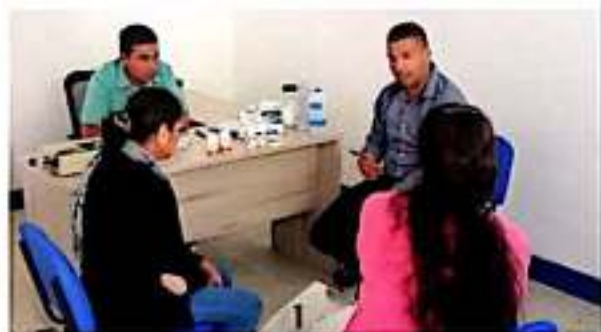
LOS REYES, MICH.- Se efectuó aquí una campaña de detección de osteoporosis.

Comentó que estas acciones de prevención se ven reflejadas en tratamientos oportunos y eficaces hacia los adultos que padecen o tienen riesgo de padecer esta enfermedad que tiene como consecuencia, mayor incidencia de fracturas. Al término de la jornada, fueron atendidas más de 50 personas.