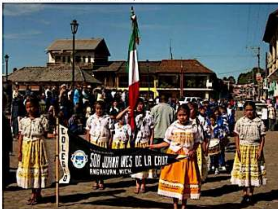
URUAPAN, MICH.- Alrededor de 13 millones de mujeres indígenas en México, aún son víctimas de discriminación racial, por motivos étnicos, de género, lengua, religión y otras condiciones, por ello urge aplicar políticas públicas efectivas para reivindicar el valor que ocupan ellas en la sociedad.

morir a la lengua nativa, no perder la identidad ni el orgullo de ser Purépecha.