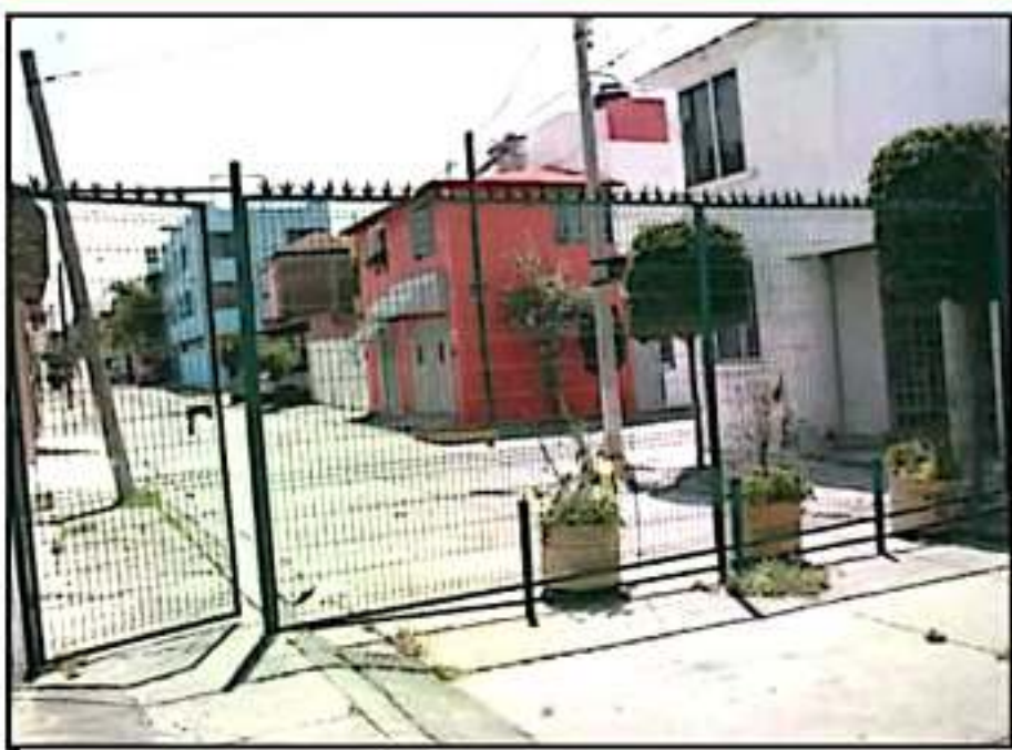
COLOCAR REJAS PERIMITRALES TAMBIÉN OBSTACULIZA LA ENTRADA Y SALIDA DE LOS VEHÍCULOS DE RESCATE.

125 ROBOS de vehículo en Morelia durante julio