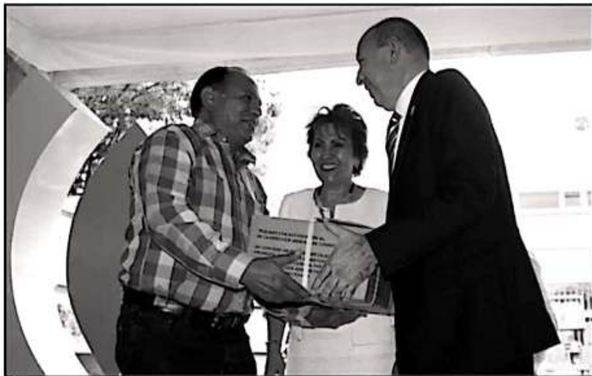
FUNCIONARIOS ESTATALES REALIZARON LA ENTREGA DE ACERVOS Y COLECCIONES DE LIBROS Y REVISTAS CIENTÍFICAS PARA BIBLIOTECAS MUNICIPALES