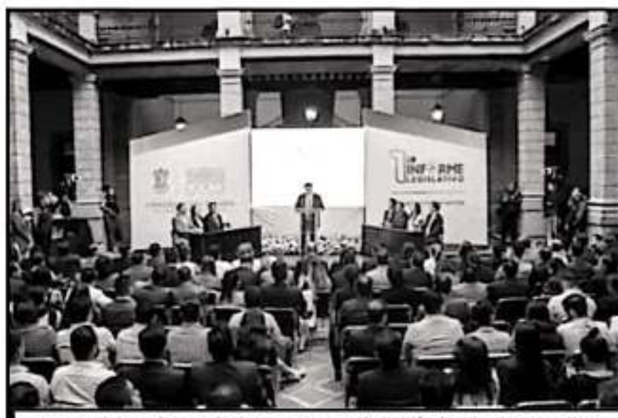
LA BANCADA DEL PAN EN EL CONGRESO DEL ESTADO DE MICHOACÁN OFRECIÓ EL PRIMER INFORME LEGISLATIVO.