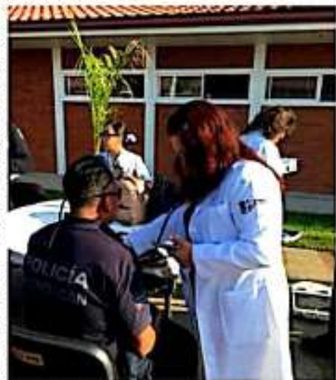
URUAPAN, MICH.- Personal de la Secretaría de Salud, otorga atención médica a elementos de la Policía Michoacán.

Durante los próximos días, el personal de la Secretaría de Salud continuarán con estas jornadas en Apatzingán (9 y 10 septiembre), Coalcomán (12 y 13 septiembre), Lázaro Cárdenas (18 y 19 septiembre), Zitácuaro (23 septiembre), La Piedad (25 y 26 septiembre), Jiquilpan (1 y 2 octubre), Zamora (7 y 8 octubre) y Morelia (15 al 17 octubre), lo que permitirá brindar al cuerpo de seguridad una vida saludable en beneficio de las y los michoacanos.