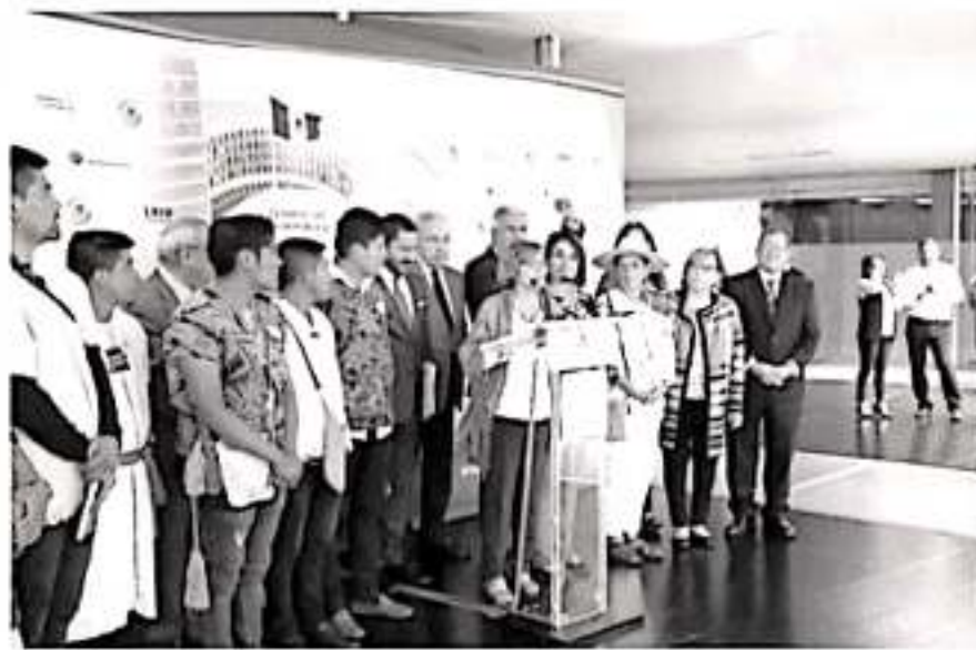
Blanca Piña Godiño, senadora de la República del grupo parlamentario de Morena.

Un conflicto local no puede estar por encima de lo que