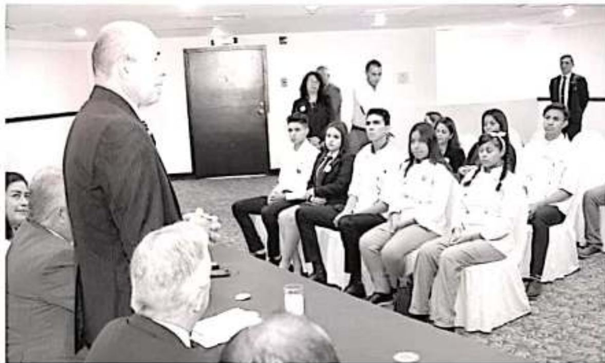
El Conalep y Best Western acordaron implementar el primer Hotel-Escuela de Michoacán.

La Mejora Regulatoria en Morelia trabaja para consolidar una plataforma en la que la sociedad tenga de manera clara, oportuna y accesible los trámites, responsabilidad de la Administración Municipal, así como actualizar eficientemente las normas, reglamentos, acuerdos, circulares e instrumentos para la gestión municipal. Con acciones como estas «Juntos transformamos Morelia».