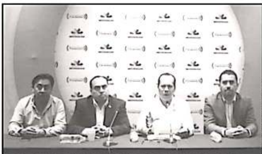
EL TITULAR DE SEDRUA ALERTA QUE EL AGRO EN EL ESTADO ESTÁ EXPUESTO A LAS SEQUÍAS QUE SE REGISTRAN

entre mil 500 a dos mil 500 pesos por hectárea, y aseguró que se priorizará a los pequeños cultivos.