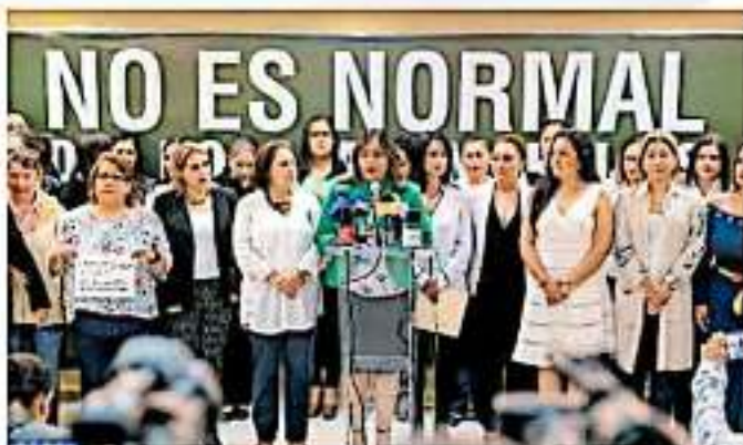
Mujeres en cargos públicos realizaron un posicionamiento; la invitación surgió de la Coordinación General de Comunicación Social del Gobierno estatal con un fin

Alfilar su postura en contra de los señalamientos vertidos por Mireles Valverde durante una visita al hospital del ISSSTE en Apaxtzingán, en donde llamó "pirujas" a las parejas de los derechohabientes de dicha institución, y además enunció palabras discriminatorias en contra de la comunidad LGBTIQ, repudiaron cualquier actitud o acción que atente contra las mujeres de Michoacán y el país, emplazando al presidente de la República, Andrés Manuel López Obrador, para que