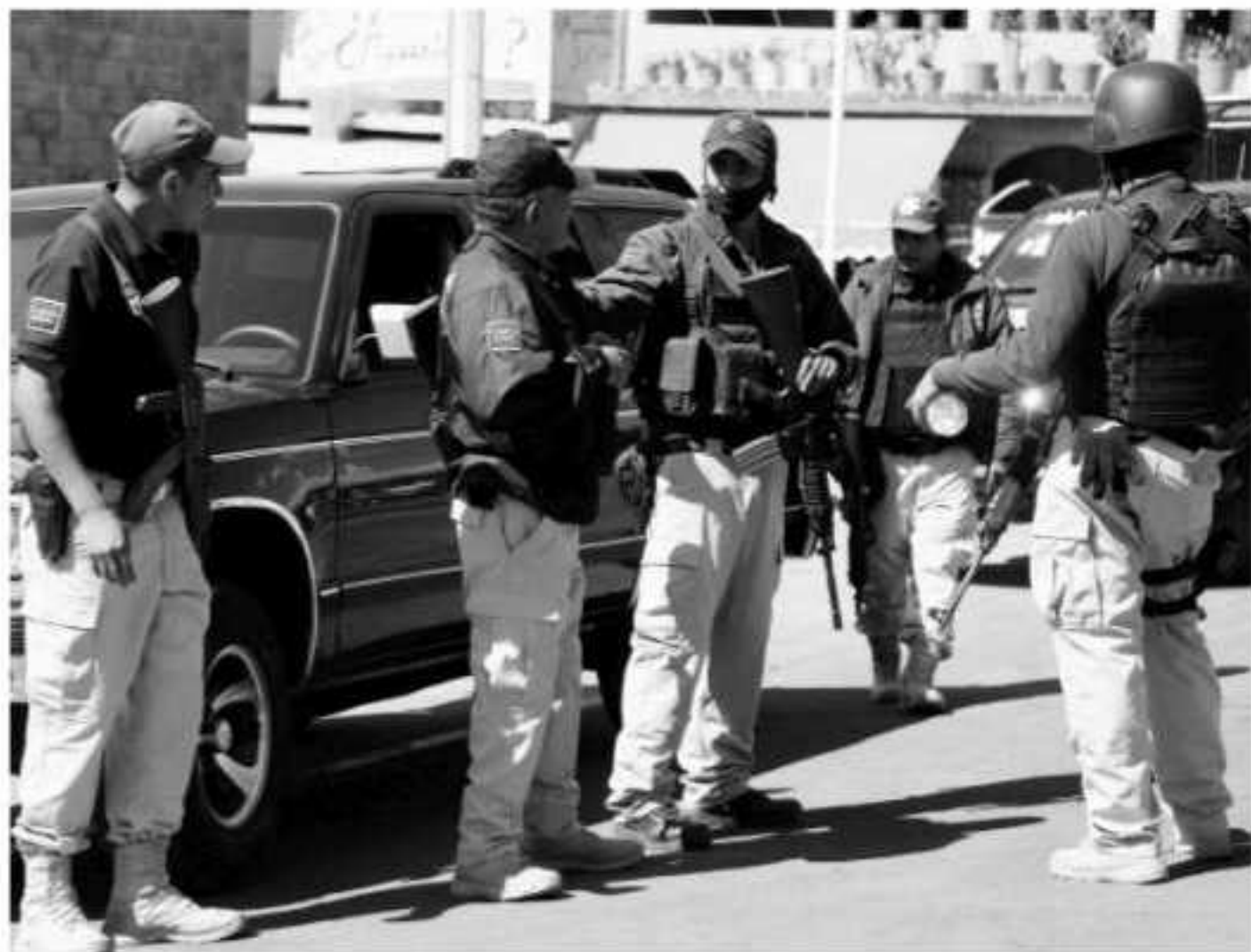
En la imagen Autodefensas.

2013, 20 mil e sabe do yo había utode- las ar-