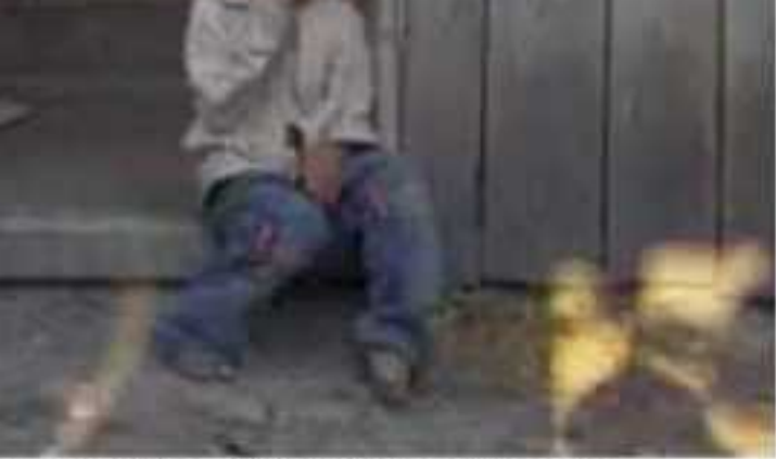
...tanto especialistas como el gobierno.