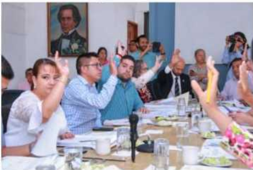
URUAPAN, MICH.- En Cabildo se aprobó que el presidente municipal firme un convenio de coordinación ante la CEAC, junto a la Capasu, para realización de varias acciones.

Asimismo, se aprobó que el presidente munici- pal firme un convenio de coordinación ante la Comisión Estatal de Aguas y Gestión de Cuencas (CEAC), junto a la Comisión de Agua Potable, Alcantarillado y Saneamiento de Uruapan (Capa- su), en donde el municipio aportará 1 millón 100 mil pesos y la Comisión Nacional del Agua (Cona- gua) otro monto igual para realización de varias acciones como la instalación de 2 mil 176 medi- dores de agua.