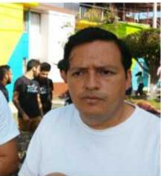
ción Civil "Yo Amo Uruapan", continúa con capacitación con los sectores vulnerables de la

Otras de las vertientes sobre las cuales trabajan de manera