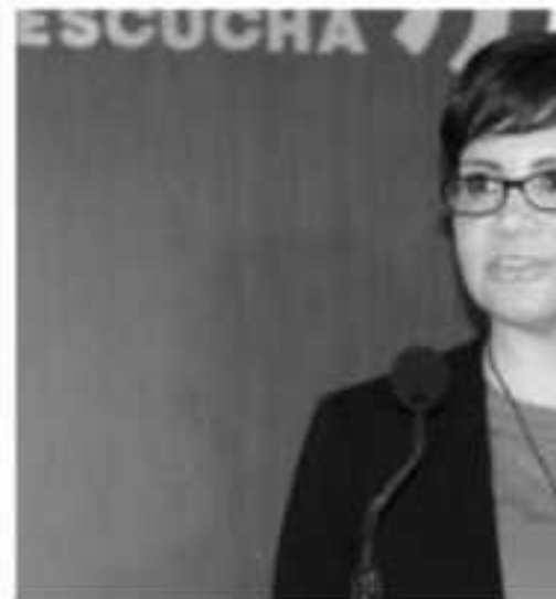
MORELIA, MICH.- En conferencia de prensa, el gobernador Silvano Aureoles, realizó un análisis de los esfuerzos realizados en el tema de salud.

Finalmente el gobernador Aureoles dijo que Michoacán avanza a pasos firmes en el mejoramiento de la salud de los michoacanos.