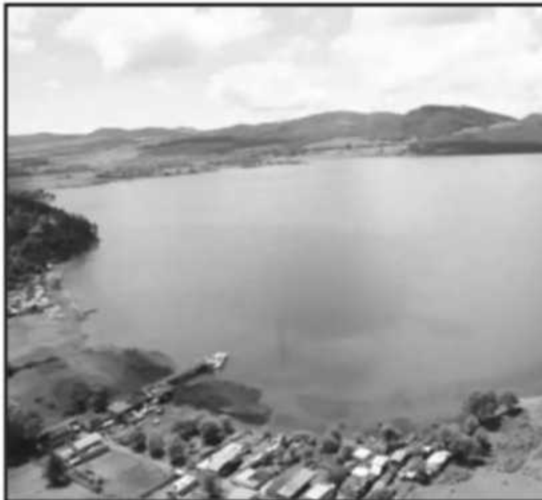
AUTORIDADES DE LOS TRES ÓRDENES DE GOBIERNO BUSCAN LA RUTA PARA FRENA

Dijo que no hay un presupuesto específico para el lago, no así para los dos proyectos que se están licitando en los temas de agua potable, drenajes, colectores