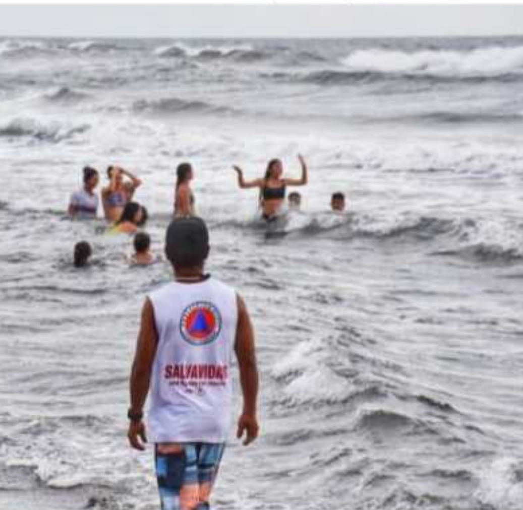
La unidad de Protección Civil Municipal exhortó a los vacacionistas y bañistas a seguir las instrucciones de los salvavidas al momento de ingresar al mar, a fin de prevenir accidentes.

momento los incidentes que los propios prestadores de conocimiento del arribo de las embarcaciones, por lo que aseguran s