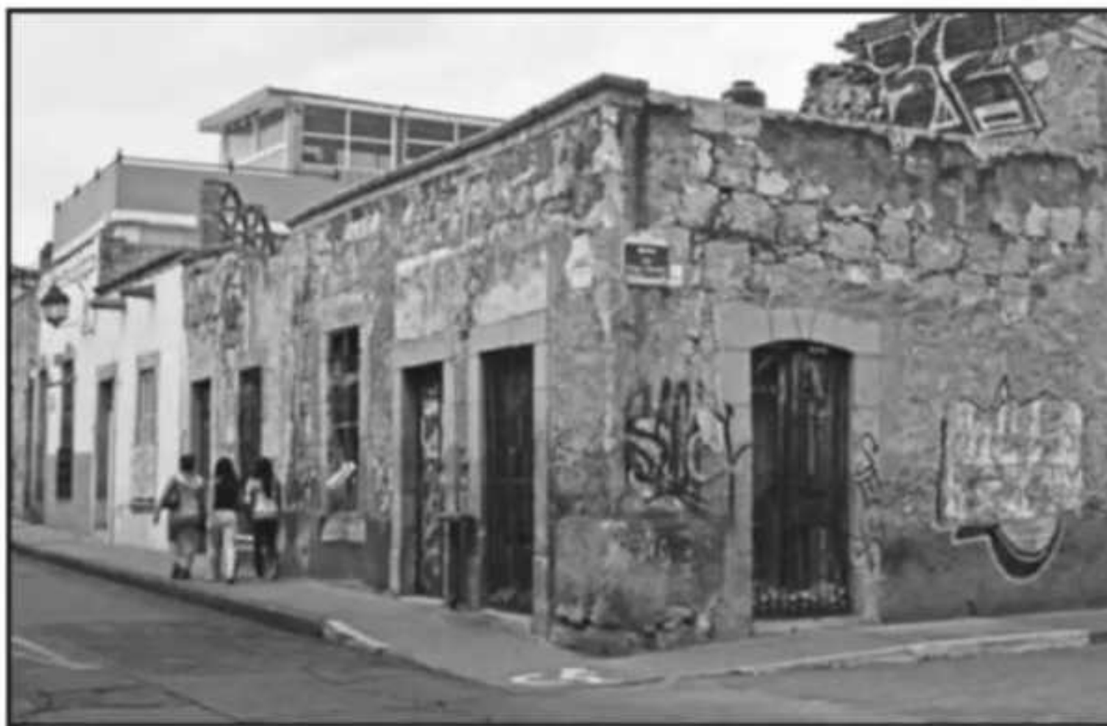
ALGUNOS INMUEBLES LLEVAN DÉCADAS ABANDONADOS Y PUEDEN CONSTITUIR UN PELIGRO PARA LA CIUDADANÍA SI SE O...

y claro que pueden generar daños a la ciudadanía. Le voy a pedir a la coordinadora del Centro Histórico que nos dé un diagnóstico completo y ayúdenos a hacer un llamado a los dueños, les diremos las