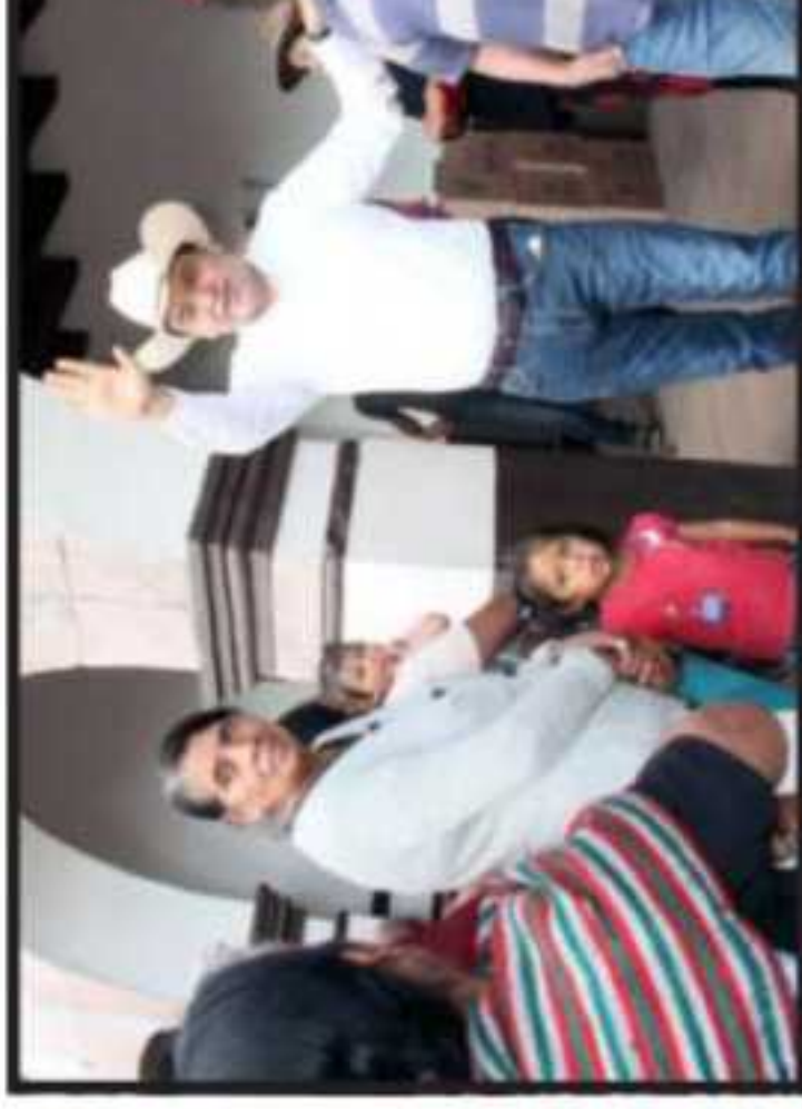
Con el propósito de concientizar a los padres de familia Maravatiense sobre el abuso y riesgos del trabajo infantil te invita al concurso de dibujo juvenil «Trabajo Infantil» 23 de Julio a las 10:00 am en la explanada del jardín

Subrayó que esta problemá- tica conlleva serias afectaciones para la salud, de manera tal que las estimaciones oficiales son de 50 muertes diarias en México por en-