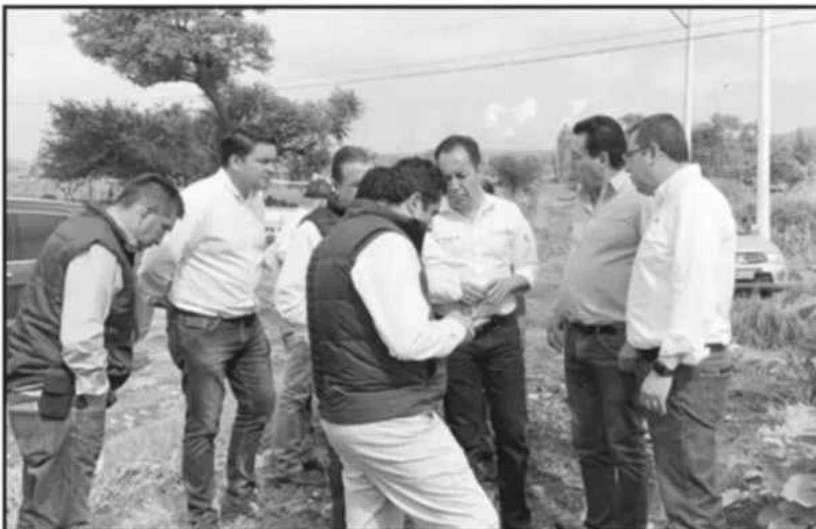
AUTORIDADES ESTATALES SUPERVISARON LA ZONA AFECTADA POR LAS LLUVIAS EN JIQUILPAN; SUGIEREN LA RENOVACIÓN IN

entidad se encuentra en un pe- riodo de lluvias importante, y re- gularmente la segunda quincena