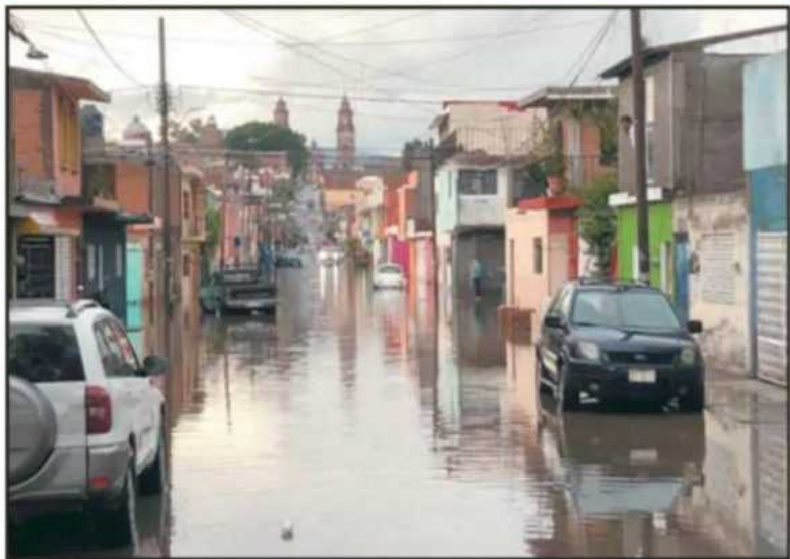
ESTE DOMINGO LAS LLUVIAS EN MORELIA YA SE DEJARON SENTIR; PREOCUPA EL NO PODER CONTAR CON EL FONDEN.

menos 5 colonias como en el caso de Prados Verdes, quedaron prác-