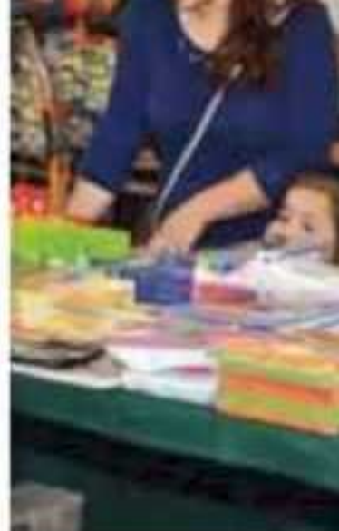
El sector espera que los padres de papelerías locales. |FACEBOOK

"Lo que hacemos es tratar de homologar un poco los precios y que el consumidor, en el momento de tener a la vista un precio, pueda ejer- cer su principal derecho, que es a la elección e informa- ción para ver dónde puede