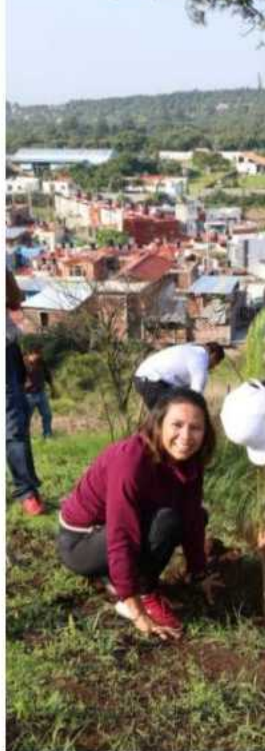
URUAPAN, MICH.- Se registra un 75 p municipal de reforestar 240 mil arbolito el secretario municipal de Medio Ambien