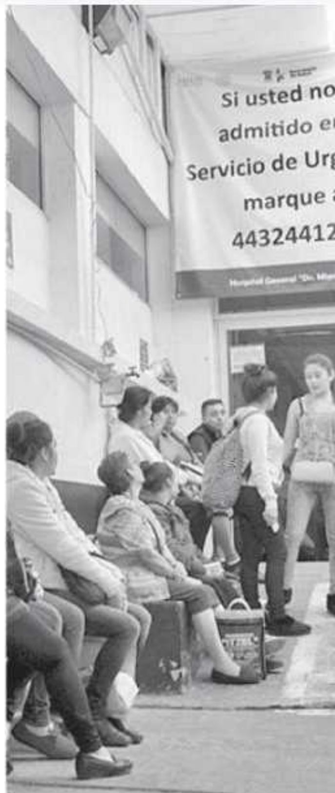
El mandatario estatal informó que se encuentra 90% para todos los centros de salud

Acompañada por el gobernador de Michoacán en su rueda de prensa semanal, la