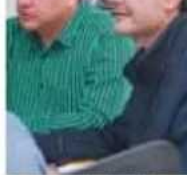
Durante la sesión de Cabildo se aprobaron cinco obras.

Antes, el 70% de dicho esquema –cuyo presupuesto para este año en Uruapan es de 105 millones de pesos– estaba limitado para realizar acciones de electrificación, agua potable y drenaje, en zonas muy específicas del municipio. Ahora se pueden programar trabajos de pavimentación, construcción de espacios educativos y de otra índole que solicita la población, con mayor cobertura de