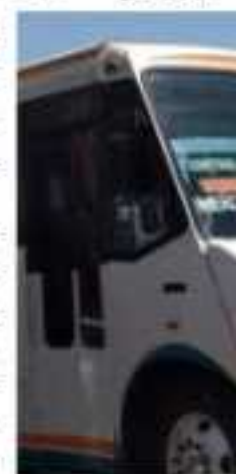
ZAMORA, MICH.- Transportistas de unidades de transporte público aseguran que son de las mejores que operan

Enm... realiza l... ses para... de llanta... sistema... pues de... los usua... cuenta... sector p... bemame... quisición... las que... 700 mil... pesos.