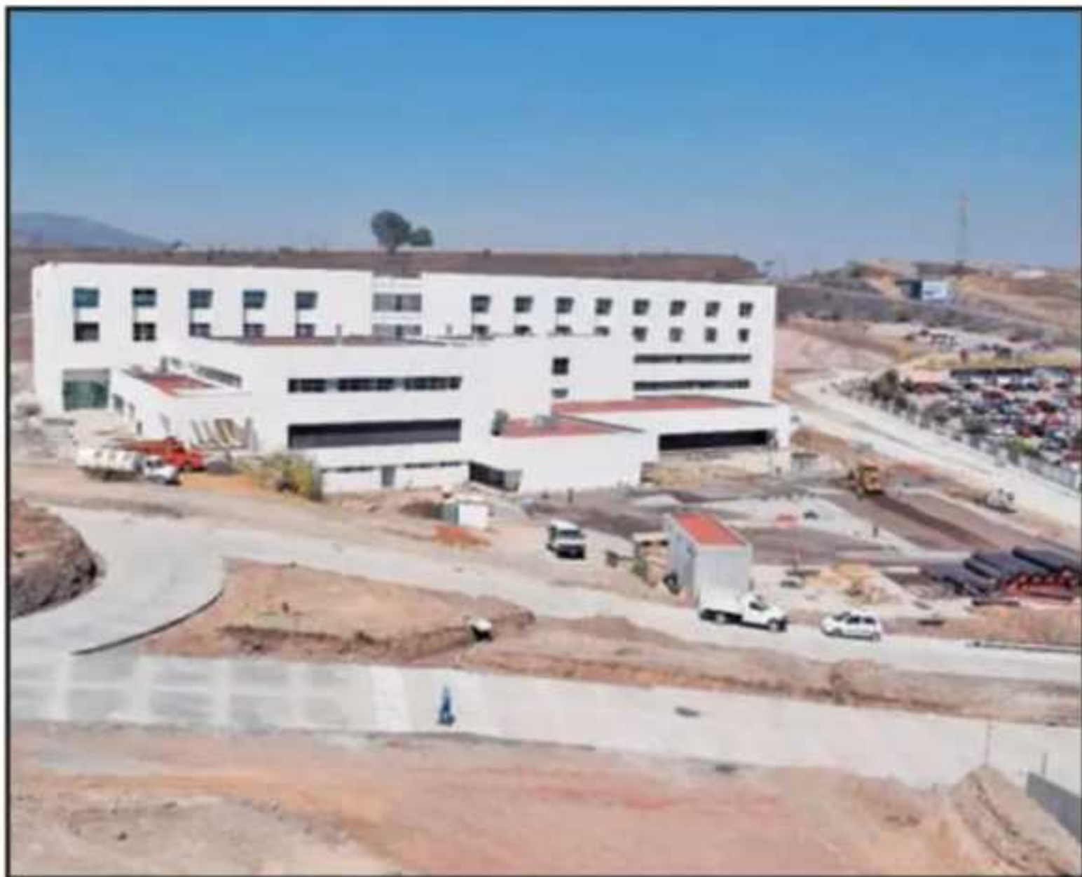
LOS TRABAJOS ESTÁN PRÁCTICAMENTE LISTOS EN LOS NUEVOS HOSPITALES INFANTIL Y CIVIL, DICE LA SSM.