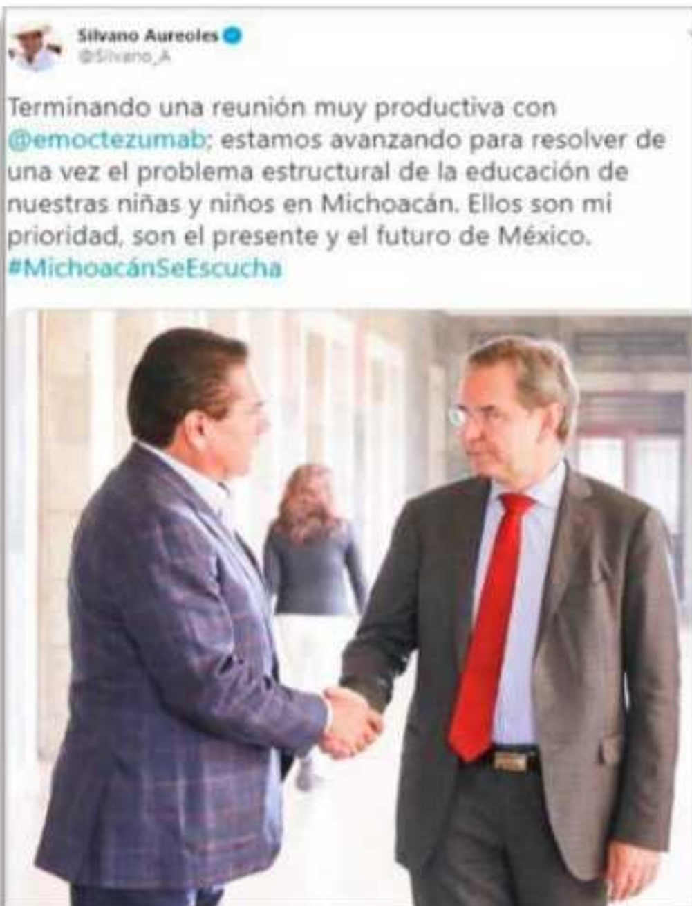
Tuit del Gobernador Silvano Aureoles.

Aureoles Conejo publicó e "Terminando una reunió emoctezumab; estamos av vez el problema estructu niñas y niños en Michoacán presente y el futuro de Méx un segundo tuit, en donde plenamente en la palabra y espero que la federalizac Michoacán pronto sea u bueno, estimados lectores esperamos que esto se crist en cuenta que cada vez est año tanto a la burocracia,