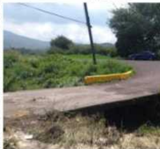
ZAMORA, MICH.- Colonos que pudieran exigen que la autoridad municipal cum mientos naturales.

A un lado de la c barranca que se buen desnivel p ciones; mientras previenen al sub entrada de sus viv con arena.