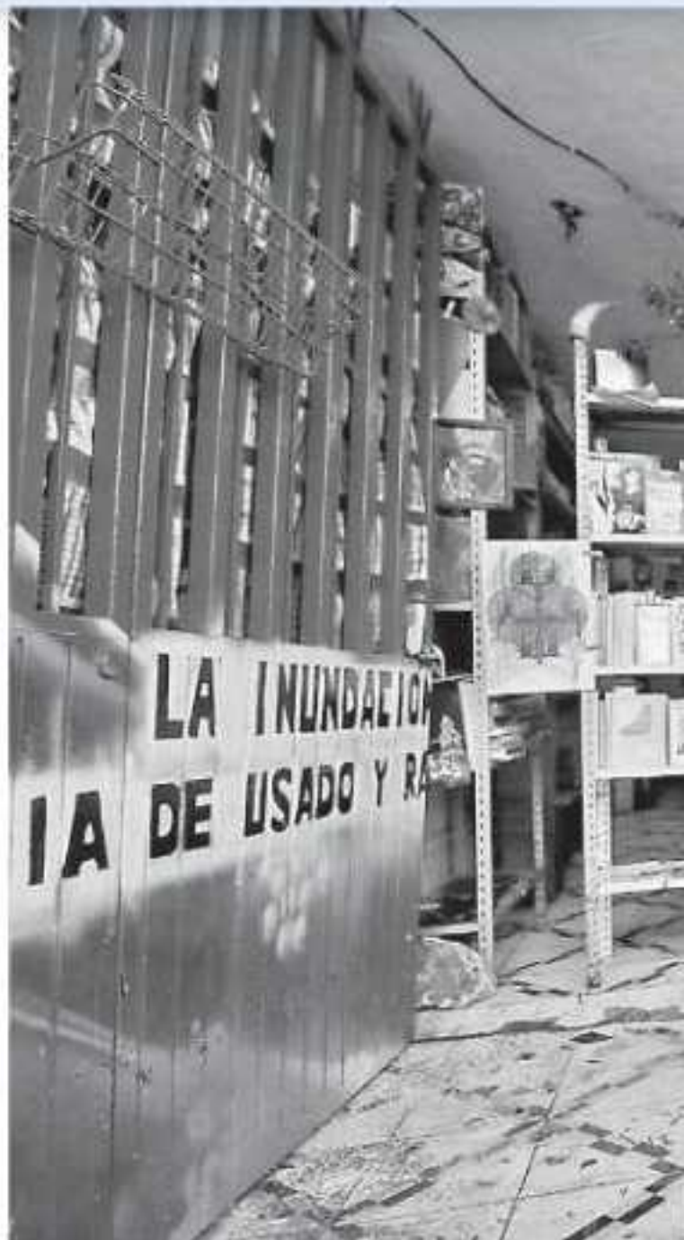
El agua subió casi un metro de altura en las inmediaciones del cruce Paseo del Roble y Paseo de Las Galeanas.

"De toda esa zona donde ahora está el Polifórum y los nuevos fraccionamientos se nos viene el agua, no creo que sea tanto el tema de la basura y las hojas porque desde hace unos ocho o diez años se ha venido agudizando el problema. No fue ni una hora la que llovió ayer y se nos metió