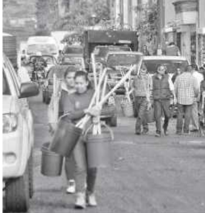
Vecinos ya están cansados de que "después de pozo"

"Les pedimos que arreglen, ingenieros hay y pueden resolverlo. Yo tengo un segundo piso, ¿pero las gentes que no? Además tenemos que estar comiendo en restaurantes por el tema de salubridad, y eso también significa un desembolso de dinero. Las cosas que me dieron en el año pasado corren el riesgo de perderse en una