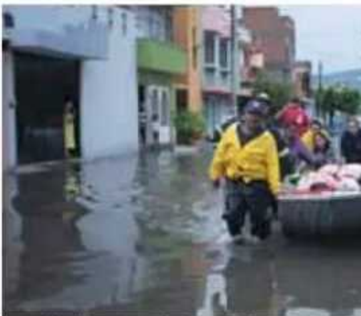
Personal de distintas dependencias municipales mantienen acciones

"Actuamos de inmediato y, por fortuna, logramos contener la mayor cantidad de daños posible; todavía esta mañana (lunes) desplegamos