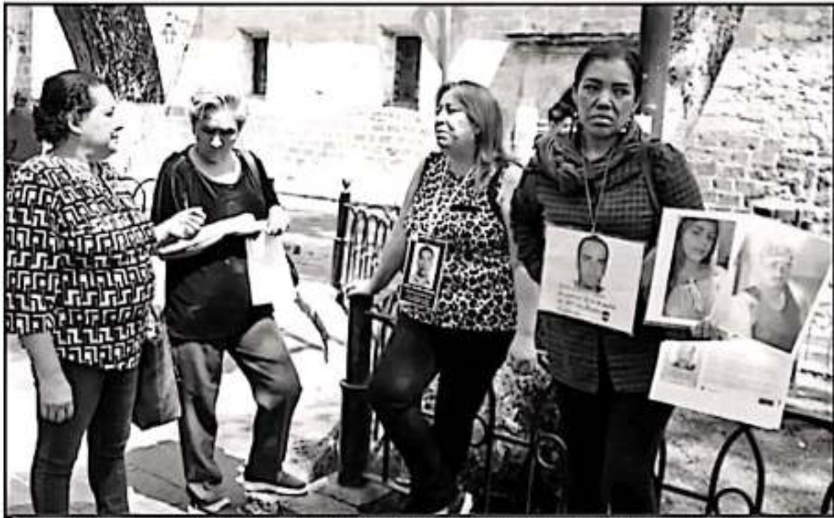
SON DIVERSOS COLECTIVOS LOS QUE RECEBEN CADA RINCÓN DE LOS MUNICIPIOS EN BUSCA DE SUS FAMILIARES. PIDEN AYUDA DE LAS AUTORIDADES.

"La acción que realizamos es social en pro de los familiares de desaparecidos, llamamos a la Fiscalía, Semefo, Comisión Estatal de Atención a Víctimas y se están realizando pruebas de ADN y se están pasando imágenes de cuerpos no identificados en la base de datos que tiene Semefo. Tenemos un dato alarmante por eso estamos haciendo