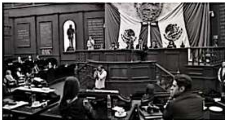
MORELIA, MICH.- En sesión ordinaria del Séptimo Parlamento Juvenil, los 40 jóvenes participantes, expusieron ante la Máxima Tribuna del Estado, diversos temas de relevancia social y con los cuales, aseguraron, buscan transformar el estado.

El Estado Mexicano está obligado a promover y proteger el ejercicio de los derechos humanos de la población, por lo que no se deben escatimar esfuerzos en garantizar un entorno seguro para todos y combatir la desaparición de personas. México no puede eludir más la responsabilidad que tiene en torno a los miles de desaparecidos que se han venido acumulando en número año con año, y sobre los que se carece de un padrón integral que permita dar seguimiento a los casos.