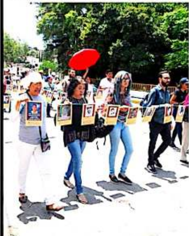
CHILPANCINGO, GRO.- Durante una marcha en el Día Internacional del Detenido-Desaparecido, se informó que en el estado de Guerrero suman unas 5 mil personas desaparecidas durante los últimos 5 años.

En la marcha participan más de 300 personas del Frente Guerrero por Nuestros Desaparecidos e integrantes de colectivos de Iguala, Chilpancingo y Acapulco.