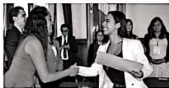
MORELIA, MICH.- "Vimos iniciativas y proyectos sociales muy buenos, de mucho interés y en beneficio de Michoacán y su gente, vemos ideas frescas e innovadoras en las que vamos a trabajar para sacarlas adelante".

en temas políticos, pues subrayó que si ellos no lo hacen, alguien más sí lo hará y tomará las decisiones de manera unánime. "Debemos contagiar a más jóvenes, contar nuestras experiencias para que más jóvenes participen de manera activa, por eso hago una llamada para que en próximas ediciones haya una mayor participación de las y los michoacanos en temas políticos y públicos, por último quiero agradecer al Comité Organizador, estos meses de arduo trabajo tuvieron resultados", finalizó.