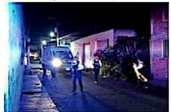
Ayer en Morelia, fueron dejados en diferentes puntos, los cuerpos desmembrados de dos hombres, a los que el CJNG les dejó sendos narco mensajes.

En relación a los narco mensajes se informó que están firmados por el CJNG dirigidos a los chapulines.