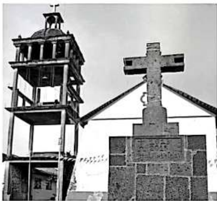
SAN FELIPE DE LOS HERREROS (CHARAPAN), MICH.- El deshilado de textil de algodón para guaneros, camisas, blusas, vestidos o rebocos que aquí elaboran las artesanas, es único en el mundo.