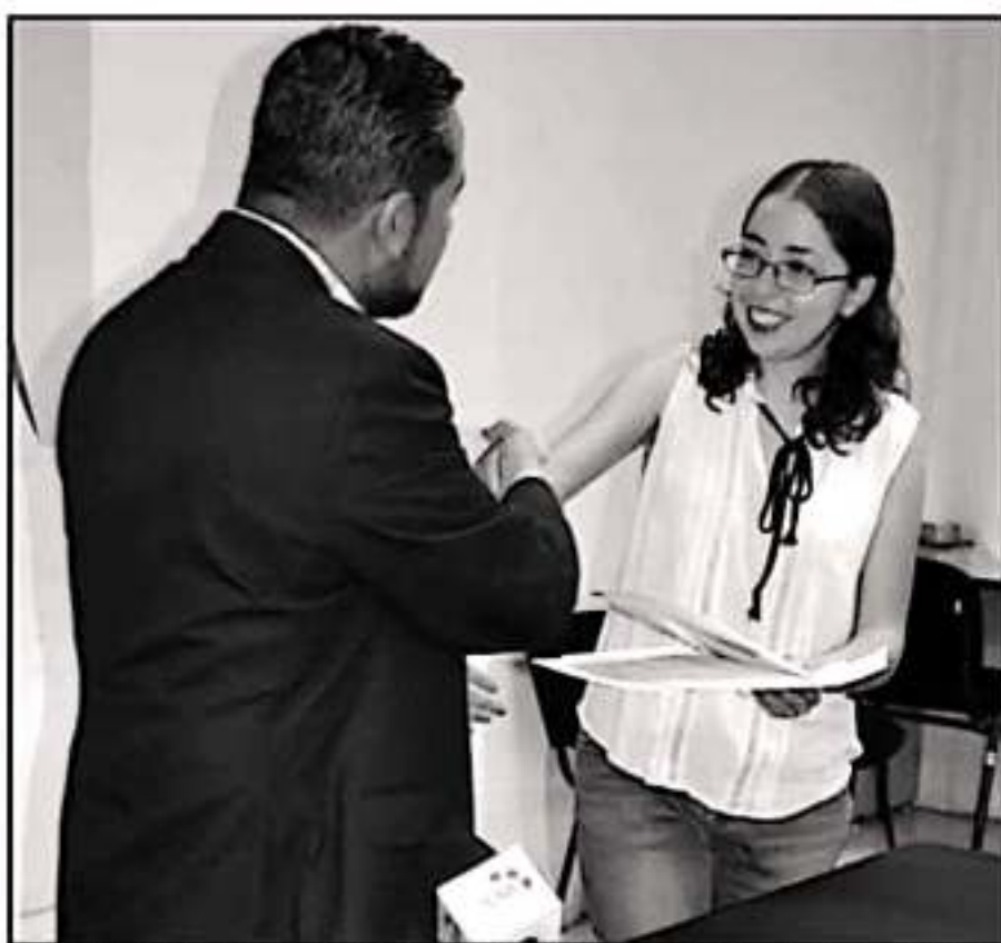
SON SIETE JÓVENES LOS QUE RECIBIERON BECAS POR PARTE DEL ICTI PARA REALIZAR POSGRADOS EN EL EXTRANJERO.

dente, a pesar de esta reducción, es Michoacán después de Jalisco el que ha tenido más beneficiados con becas para estudiar en el extranjero, lo que habla de la calidad de los jóvenes en su formación y la pertinencia de los proyectos.