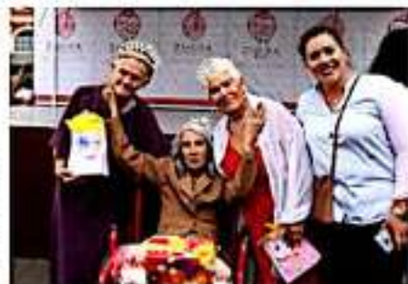
ZAMORA, MICH.- Como parte de los festejos por Día del Abuelo, se coronó a la ganadora del concurso Miss 60.