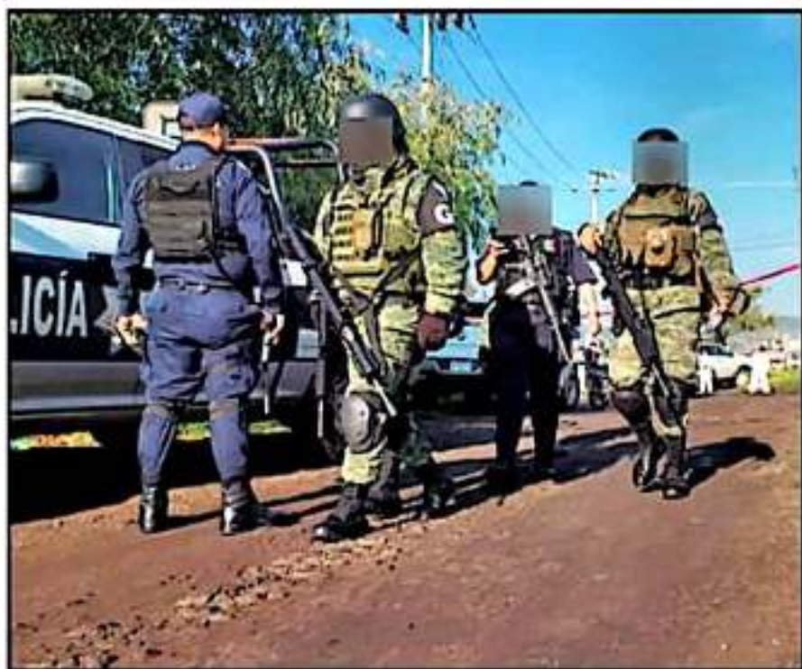
LA GUARDIA NACIONAL NO HA INGRESADO LOS DELITOS DE ALTO IMPACTO, NI EN MORELIA NI EN LOS OTROS MUNICIPIOS.

En paralelo a las declaraciones del alcalde de Morelia, en Tierra Caliente, en Tepic, atepex, se desarrolló uno de los más largos y cruentos enfrentamientos entre grupos delictivos. En este caso se atribuyó a los cabaleros del Cártel de Jalisco Nueva Generación y a células locales que siguen luchando por el control territorial.