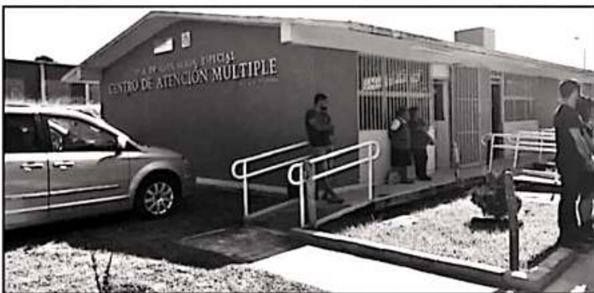
DE LOS 112 MENORES REGISTRADOS EN EL CAM, SÓLO ACUDEN REGULARMENTE 25 POR LAS DIFICULTADES QUE TIENEN PARA LLEGAR HASTA AHÍ

la lejanía del centro, eso impide que los jóvenes acudan.