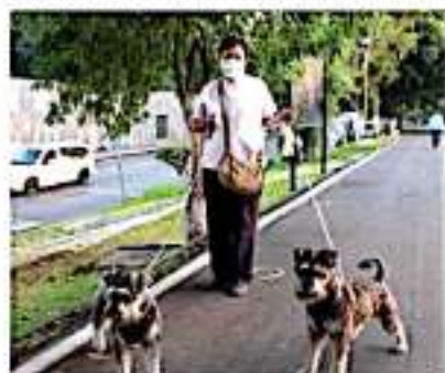
ZAMORA, MICH.- Agrupaciones civil vinculadas a la protección animal, con apoyo del municipio realizarán este día la Feria de Adopción de Mascotas.

Cabe recordar que de manera reciente el Cabildo y el presidente Martín Samaguey Cárdenas, aprobaron en lo general y en lo particular el Reglamento de Protección a los Animales, con lo que se dio un avance importante en el tema que tanto preocupa a las asociaciones dedicadas al cuidado animal.