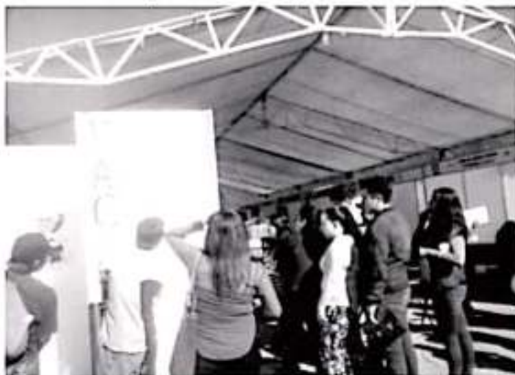
Se ofertaron 290 empleos con la participación de alrededor de 30 empresas, los niveles operarios fueron primaria, secundaria y preparatoria, muy pocas de nivel profesional.

Aumentó, quienes no logran colocarse en algunas de las vacantes que se ofertan este día, al registrarse durante la Feria del Empleo,