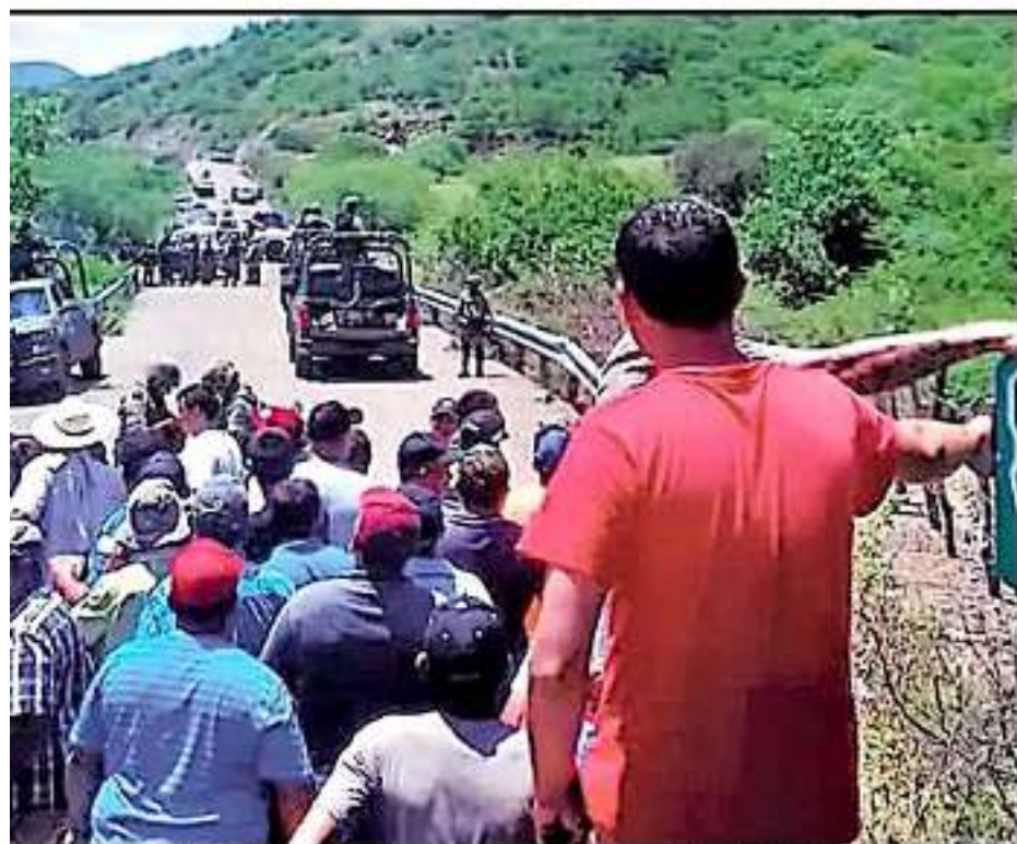
EL ELEMENTO DE LA SECRETARÍA DE SEGURIDAD PÚBLICA Y DE LA DEFENSA NACIONAL SE DESPLIEGAN EN LA ZONA.

acomán, Aguililla y Buenavista, en Michoacán. Todos estos municipios se levantaron en armas en contra del poder que construyeron Los Caballeros Templarios hasta antes de 2013, pero ahora la pugna aparentemente es entre el Cartel de Jalisco Nueva Generación, a quienes se les vinculó con el movimiento armado, y "los de Tepeque", cuyo grupo habría surgido de una escisión de esa es-