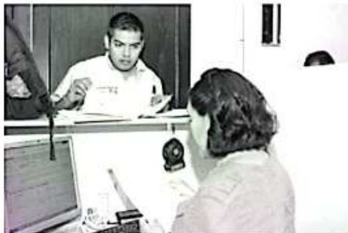
La SFA, conoca a la población a no dejarse engañar y denunciar los perfiles de redes sociales y/o negocios que ofrecen cobrar trámites vehiculares a menor costo que los publicados en el Periódico Oficial del Estado.

Para mayores informes, asesorías o denuncias, la ciudadanía puede llamar al 070 opción 2, o acudir a las oficinas de rentas en todo el estado, de igual manera, en las redes sociales oficiales de la dependencia, en Facebook, Secretaría de Finanzas y Administración de Michoacán y en Twitter en @FinanzasMich.