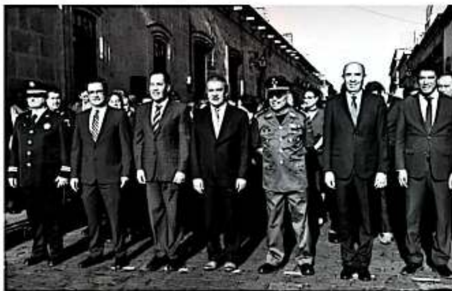
El tradicional recorrido en bando solemne se llevó con participación de todas las dependencias municipales en completo orden.