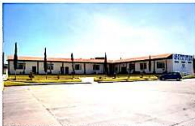
LOS REYES, MICH.- Inició el periodo de inscripciones a los cursos de la Casa de la Cultura.

Finalmente, está el curso de Orquesta Sinfónica (música), para menores de 6 años en adelante, quienes pueden aprender clases de violín, viola, chelo, contrabajo, flauta transversal, oboe, clarinete, fagot, trompeta, trombón, piano, solfeo y armonía. Las clases se imparten los días martes, miércoles y viernes de las 15 a las 20 horas y los sábados de las 10 a las 14 horas, finalizó Torres Ayala al reiterar la invitación a la población de Los Reyes a no dejar pasar la oportunidad de participar en estos cursos.