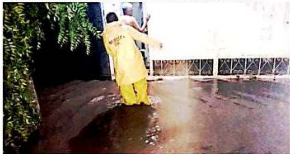
APATZINGÁN, MICH.- Tras la tromba registrada la madrugada de ayer, elementos de PC atendieron los llamados de auxilio en varias colonias por afectaciones materiales, pues no existen reportes de personas lesionadas.