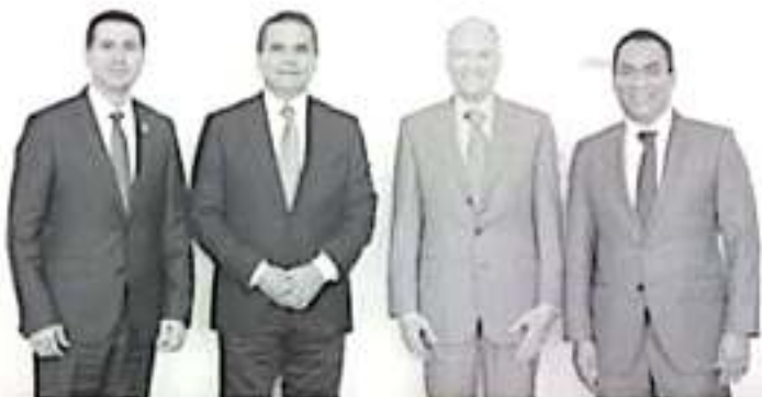
El Gobernador de Michoacán, Silvano Aureoles Conejo y el Fiscal General de la República, Alejandro Gertz Manero tomaron una reunión de trabajo.

"No se trata de federalizar este delito, sin embargo, es necesario reconocer que las investigaciones indican que detrás de estos