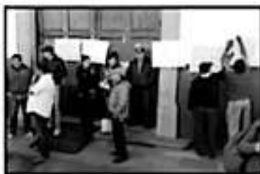
LOS MANIFESTANTES PEGARON DIVERSAS CARTULINAS CON MENSAJES EN LA ALCALDÍA