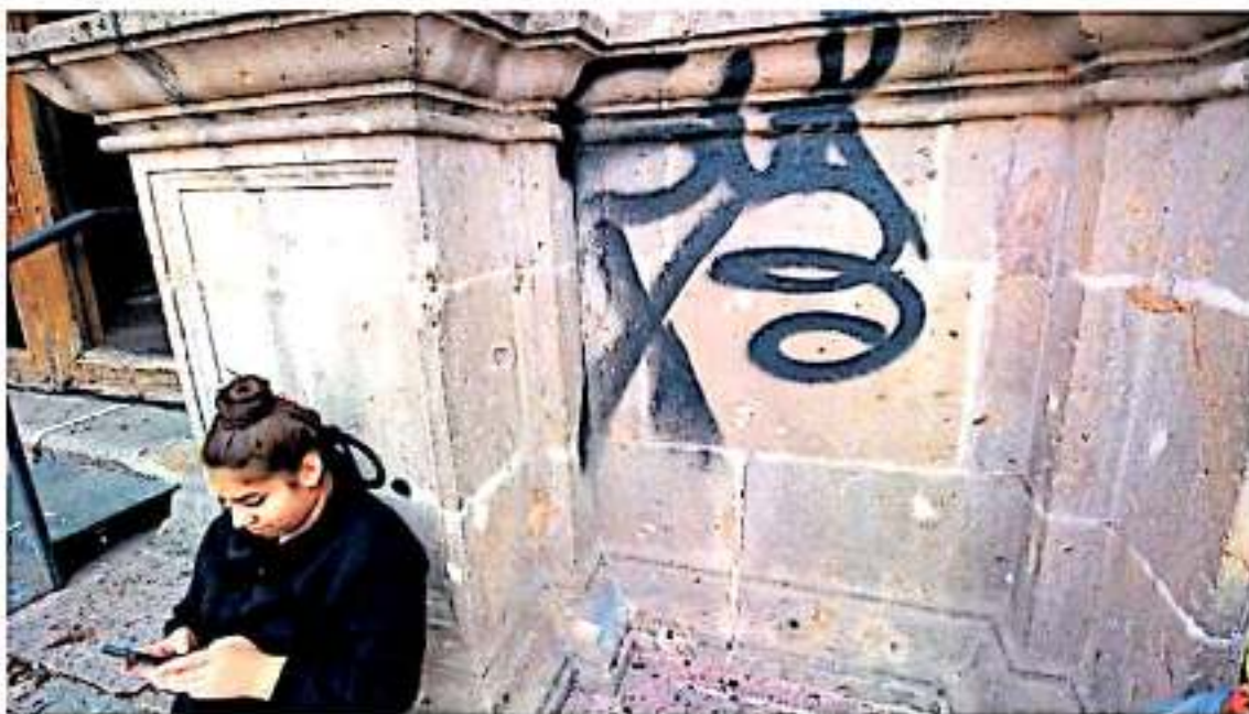
El Centro Histórico de la ciudad se ha visto afectado cientos de veces por la pinta de grafitis.