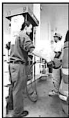
LA PREMIUM SIGUE SIN SUBSIDIO