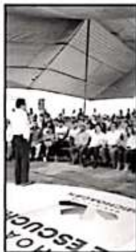
ANTE HABITANTES DE TURICATO SE DIO EL PUNTO A LA OBRA DE SALUD

Esta obra tendrá una inversión de más de 20 millones de pesos, de los cuales 16 millones son para construir áreas de acceso, vestíbulo, consulta externa, detección de control y riesgo, servicios generales, gobierno y área complementaria, y el resto se destinará para equipamiento.