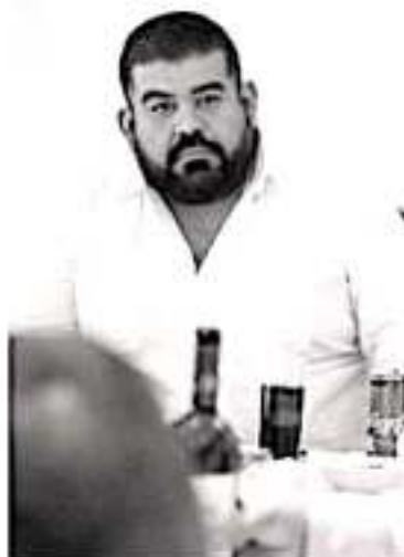
TEPALCATEPEC, MICH.- El diputado federal Paco Hualcuz Esquivel, pide que se fortalezca la presencia de la Guardia Nacional en el municipio, al mismo tiempo expresó su solidaridad y apoyo incondicional para lograr la paz.

Asimismo a la par de solicitar la intervención del Estado y la Federación, el Legislador ha expresado su solidaridad y apoyo incondicional para lograr la paz y la tranquilidad que la sociedad michoacana se merece.