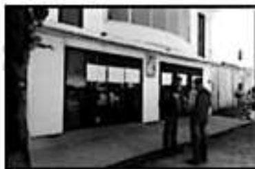
LAS OFICINAS DEL OOPAS FUERON CERRADAS POR PARTE DE LOS INTEGRANTES DEL SINDICATO

Al enterarse de la contratación de esta empresa denominada Operadora de Energía de Pátzcuaro S.A., decidieron manifestarse ya que violentan su contrato laboral, "esta empresa no