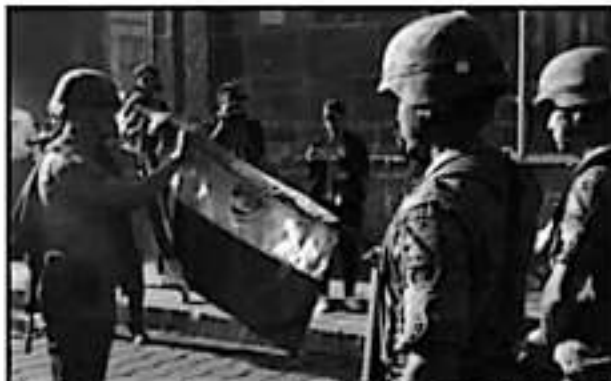
EL RECORRIDO POR EL CENTRO ESTUVO ENCABEZADO POR LA ESCOLTA Y LA BANDA DE GUERRA DE LA XXI ZONA MILITAR, AL TRATARSE DE UN ACTO SOLEMNE.