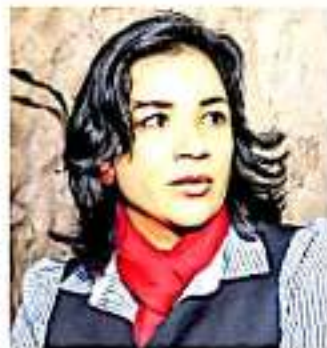
El resanar es una tarea constante, afirmó la fundacionista.

Basado en lo es de resaltar que la liberación de paredes planas tiene un costo bajo por limpieza, ya que sólo es necesaria la pintura y mano de obra propia de las de-