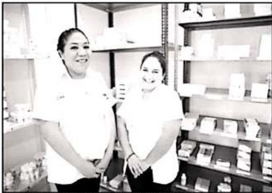
PERSONAL DEL CENTRO DE SALUD DE TANCÍTARO RECONOCIÓ LAS MEJoras QUE SE REALIZARON A ESTE ESPACIO.

"Hoy les presumo esta obra que había quedado inconclusa desde 2015, porque ya es un espacio digno para que el personal médico y sus auxiliares atiendan