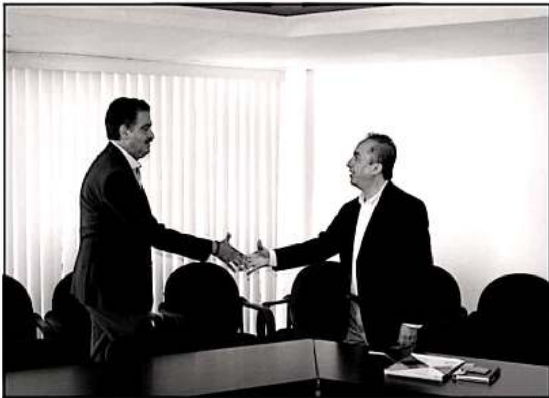
El sector refresquero de Michoacán, se sumó a la iniciativa del gobierno de Silvano Aureoles Conejo, para impulsar la erradicación del empleo de plásticos de un solo uso.

Expresó que la propuesta de la administración estatal, a diferencia de algunas leyes, normas y reglamentos en vigor en el país, no prevé una eliminación por decreto del uso de plásticos desechables, sino que establece lapsos para la adaptación de las industrias fabricantes de estos materiales, así como de aquellas que los requieren en sus