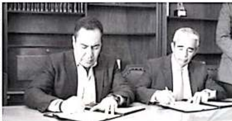
El secretario de Gobierno, señaló que durante los meses que dura esta estrategia, la tarifa de honorarios por concepto del trámite del testamento tendrá un descuento mayor al 50%.

"Las y los notarios públicos michoacanos, con sensibilidad social del cuidado de la