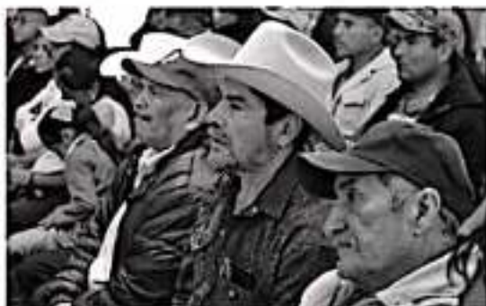
MORELIA, MICH.- Michoacán se ubica en el tercer lugar a nivel nacional de los estados con más casos de violencia intrafamiliar, de acuerdo con cifras de la Secretaría de Salud (SS).

El organismo defensor de los Derechos Humanos advierte que la violencia familiar genera crisis, enfermedades, depresión, indefensión, discapacidad e incluso muerte, y que las personas que la padecen suelen ver afectada su autoestima, desarrollo intelectual, creatividad y capacidad para relacionarse con los demás.