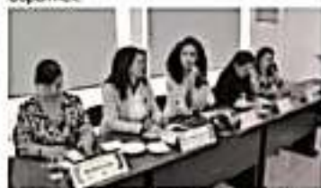
MORELIA, MICH.- El Conalep presentó la iniciativa "Mujeres trascendiendo por Michoacán" que trabajará en proyectos contra la violencia y la discriminación.