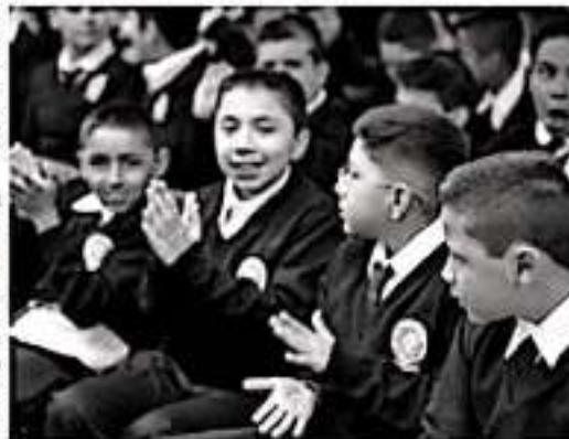
MORELIA, MICH.- Por primera vez y desde los últimos cuatro años, ha sido constante la disminución en los índices de reprobación y deserción escolar en los niveles de educación básica y medio superior.

La SSM, reitera su compromiso de mantener finanzas sanas que permitan el pago en tiempo y forma al personal que día a día trabaja por la salud de las y los michoacanos, y apela a que las instituciones bancarias den celeridad a los procesos que permitan seguir cumpliendo este compromiso.