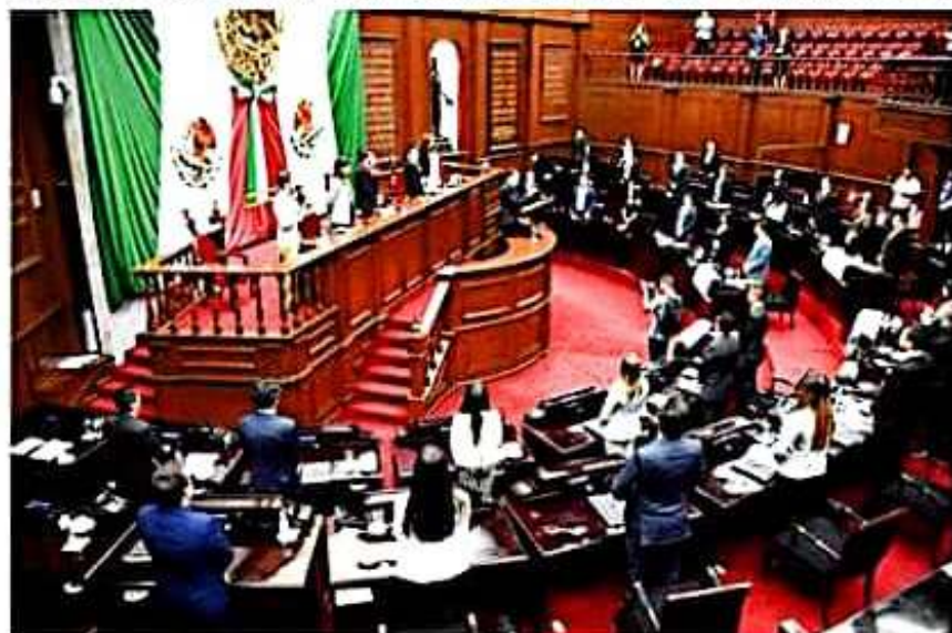
Aspecto del salón de plenas del Congreso del estado, donde ayer se desarrolló el 7º Parlamento Juvenil.

Morelia, Michoacán, 29 de agosto de 2019. En sesión ordinaria del Séptimo Parlamento Juvenil, los 40 jóvenes participantes, expusieron ante la Máxima Tribuna del Estado,