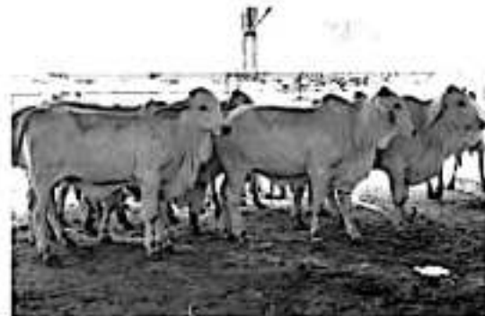
MORELIA, MICH.- Se entregaron este día 82 sementales a productores michoacanos como parte del programa Crédito a Ganadero a la Palabra.