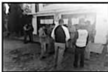
SEÑALAN QUE UNA EMPRESA AJENA VIOLARÁ EL CONTRATO COLECTIVO DE TRABAJO DEL GREMO