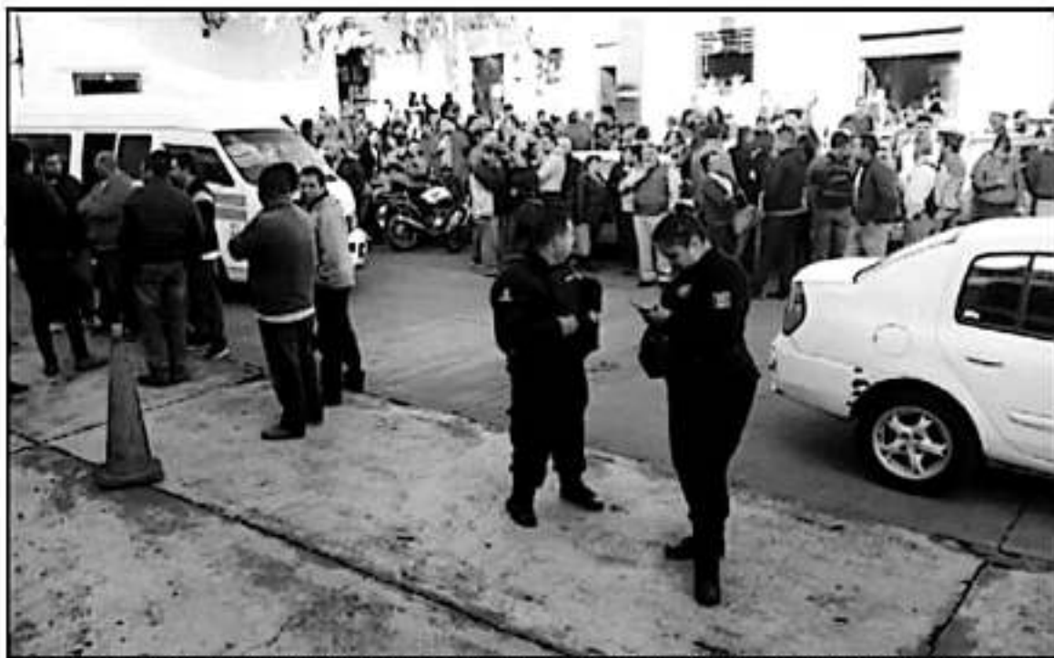
DECENAS DE PERSONAS, ENTRE SINDICALIZADOS DEL OOPAS, TAXISTAS Y DE ORGANIZACIONES DE COLONIAS, PROTESTARON EN LA PRESIDENCIA MUNICIPAL.

va a venir a trabajar gratis, van a cobrar, y bien, entonces no estamos de acuerdo porque hemos apoyado mucho y que ahora no se toma en cuenta al sindicato que sabemos hacer el trabajo, no voy por qué una empresa externa tenga que venir a meter la mano", aclaró