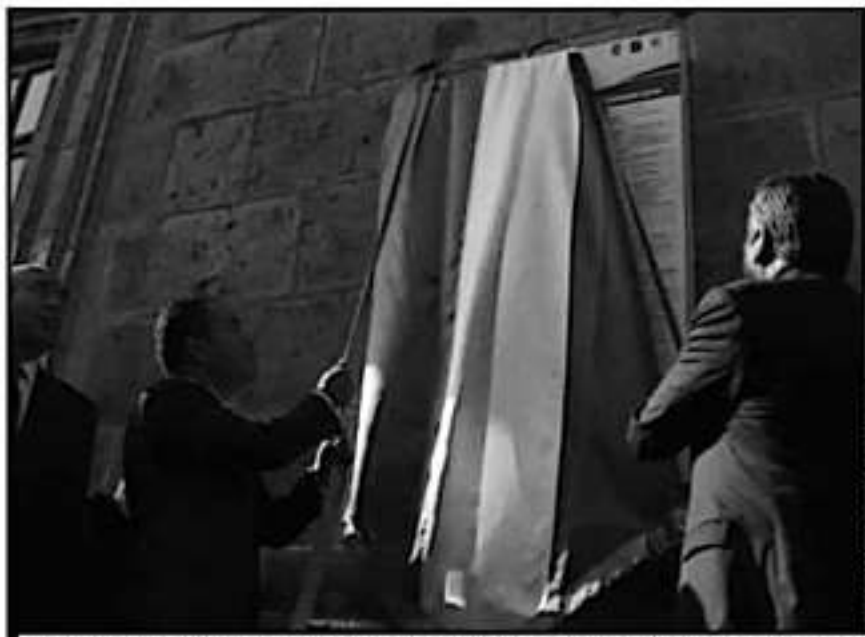
FUNCIONARIOS DE LOS TRES ÓRDENES DE GOBIERNO PARTICIPARON EN LA TRADICIONAL CEREMONIA DEL BANDO.