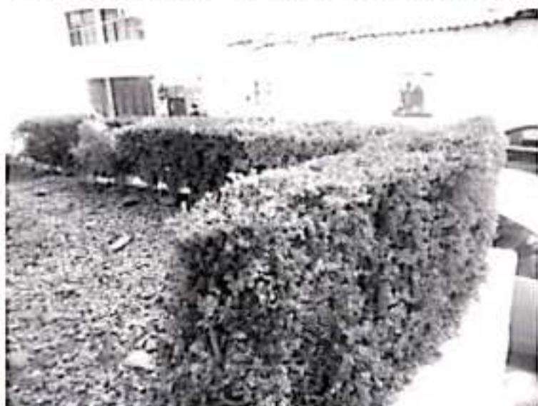
La meta es que a finales de septiembre se hayan mejorado las condiciones de los parques, los jardines, las áreas verdes y los bulevares; mínimo que estén en un 80%, con la lluvia.

Exhortó a la población a tener paciencia y que se den cuenta que si hay descuido en los parques y áreas verdes no es porque hayan dejado de trabajar, sino porque en ese momento era importante apoyar a las cientos de viviendas que sufrían la escasez del vital líquido.