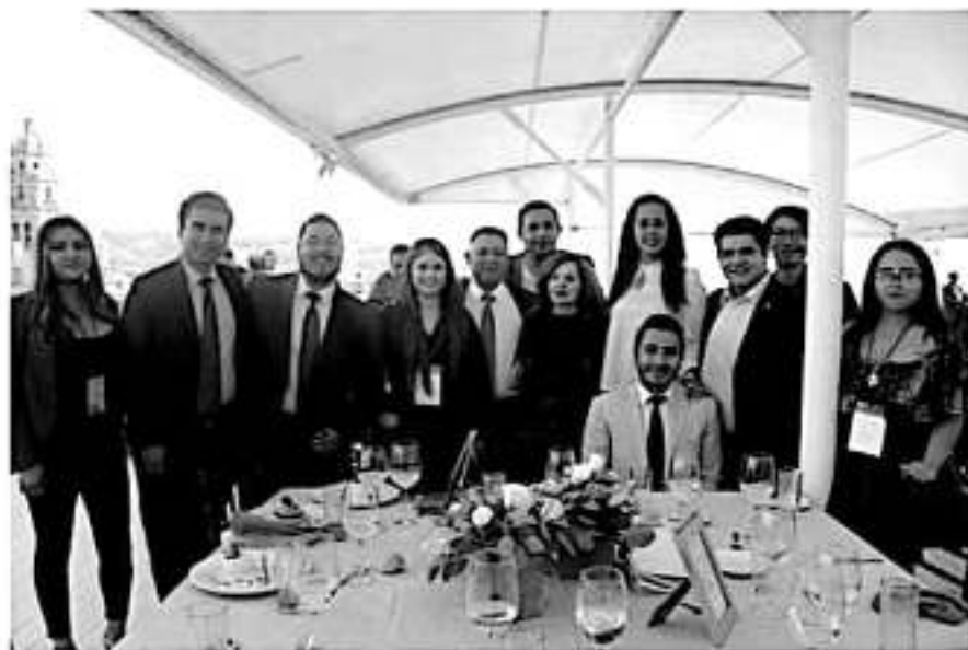
El titular de la Jucopo dijo que también se busca fomentar la democracia con base en la convivencia y debate constructivo.

En su carácter de presidente de la Junta de Coordinación Política (Jucopo) en el Congreso