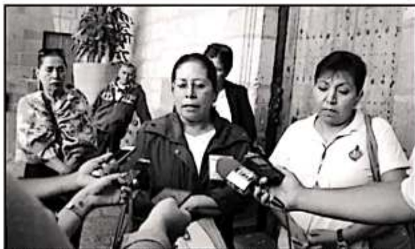
EL DOMINGO POR LA MAÑANA, UN GRUPO DE MUJERES DE LA PARROQUIA DEFENDIÓ EN MORELIA AL CURA.

personas la respuesta que exigen inmediatamente es que se cambie al sacerdote. No siempre es inmediata la respuesta. Crean que habrá que darle tiempo al señor obispo y él atenderá de la forma que lo crea oportuno".