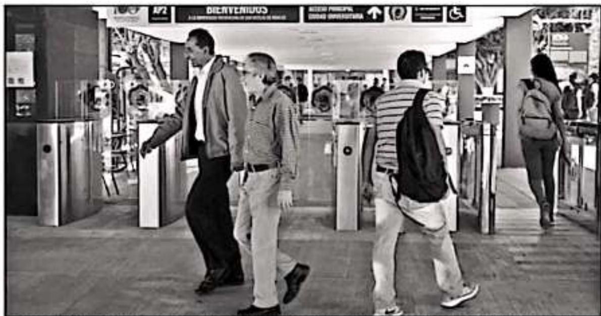
PIDE LA SECRETARÍA ACADÉMICA QUE SE INFORME DE LOS PROFESORES QUE NO ESTÁN PARTICIPANDO EN INVESTIGACIONES O ESTÉN EN ALGUNA COMISIÓN