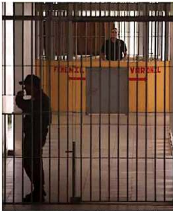
A pesar de las revisiones que realizan en los centros, no disminuye el ingreso de sustancias ilegales, narcóticos.

El funcionario reconoció que, de los 11 penales de la entidad, en el David Franco Rodríguez y en el de Delito de Alto Impacto número 1 sí hay "autogobierno", pues