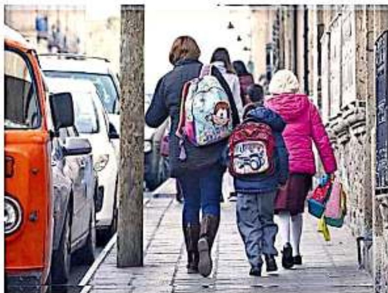
Se está pidiendo el apoyo de los padres de familia para que desde el hogar se revise el contenido de las mochilas. ARNOVO