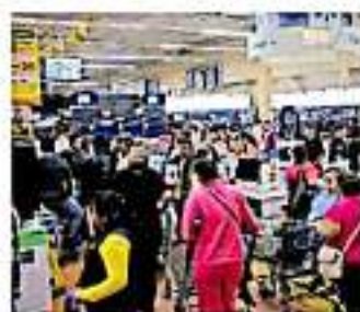
Ante alguna irregularidad, dan cinco días para corregirla / Cuernavaca