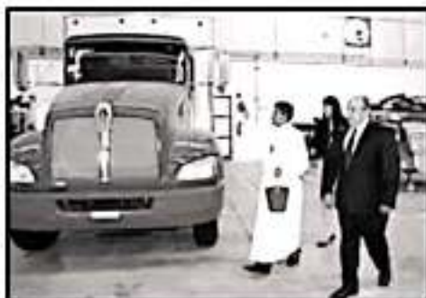
COMO PARTE DE LA CEREMONIA, UN CURA BENDIÓ EL LUGAR.

INAUGURACIÓN LA MARCA ES LÍDER EN EL ESTADO