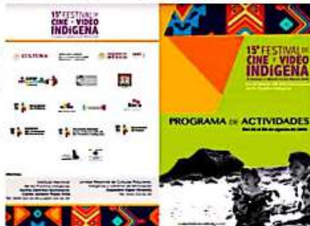
MORELIA, MICH.- Del 26 al 30 de agosto Casa Natal de Morelos alberga programación del 15 Festival de Cine y Video Indígena de Michoacán.

Sus últimos trabajos en la década de los 90's fueron "Funeral de Donato Vargas" (1994); "Primer Taller Orgánico del Grupo Mesófito" (1995); "Kujey" (1995); "Guía Toó" (1999), y fue acreedor al Premio a la Vida y Esperanza en el VI Festival de Cine y Video de los Pueblos Indígenas.