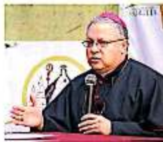
El prelado apuntó que la Iglesia ha estado apoyando a quienes violentan

En aras de mediar la situación, la autoridad eclesástica señaló que una vía para la resolución de los conflictos es el diálogo