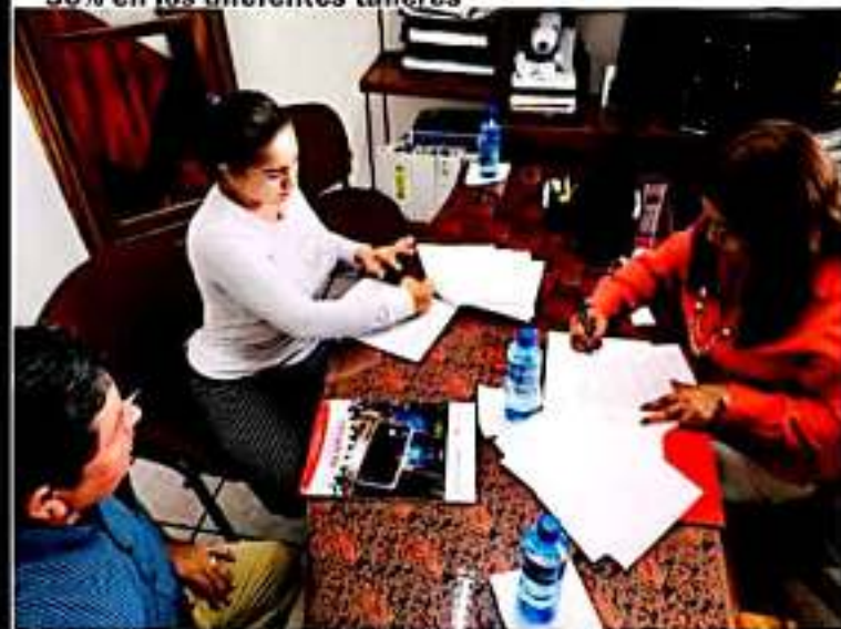
CD. LÁZARO CÁRDENAS, MICH.- La Unidad Regional de Servicios Educativos y el Cecati 70, firman un convenio de colaboración para el otorgamiento de descuentos del 50 por ciento.

■ Para el otorgamiento de descuentos del 50% en los diferentes talleres