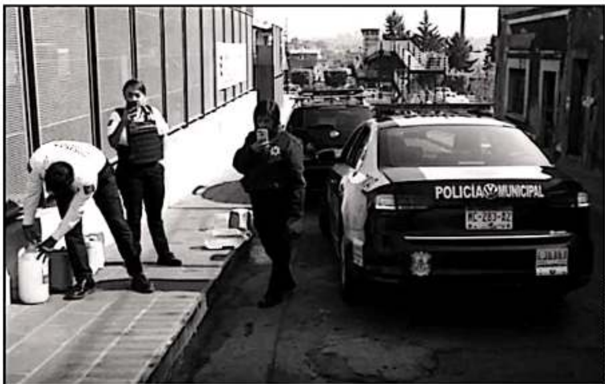
POLICIAS LOCALES. AL SENTIRSE OBSERVADOS O CUESTIONADOS, HAN LLEGADO A GRABAR A LOS CIUDADANOS E INCLUSO A AMENAZARLOS

cipal de Morelia se forma aparte, no se forma dentro del instituto de formación policial del estado (Instituto Estatal de Estudios Superiores en Seguridad y Profesionalización Policial - Michoacán, IEESSPP) y me parece que hay otros municipios, principalmente con gobierno de Morelia. El asunto ese ese, no es un asunto de un partido político. Me parece que es un asunto de una gravedad de una política pública que no existe, ese es el problema", añadió López Roldán.