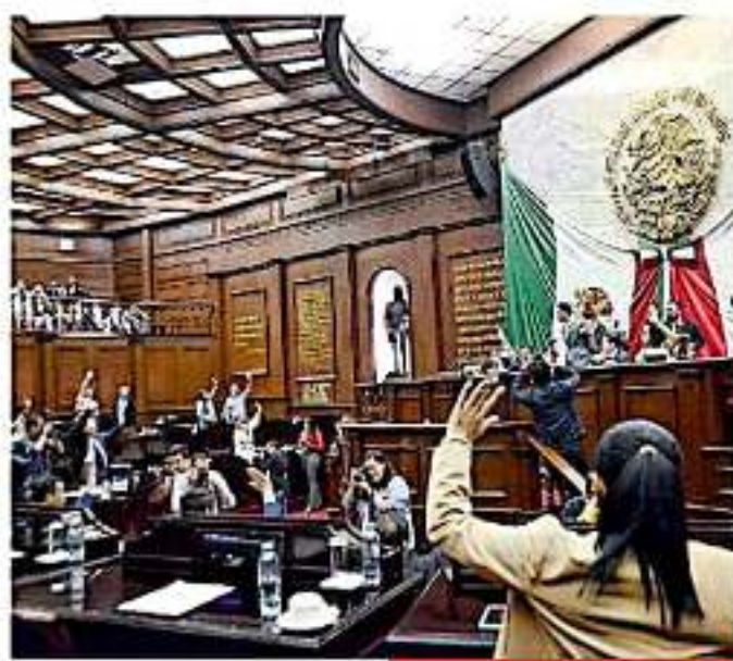
Para este año se presupuestaron 29 millones para este rubro. ANEO

Mencionó que el despido personal es "un error no defendible" ya que en cada legislatura se contrata gente y cuando concluye el periodo y se tienen que ir se debe buscar una justificación fundamentada porque de lo contrario van a continuar sumándose laudos.