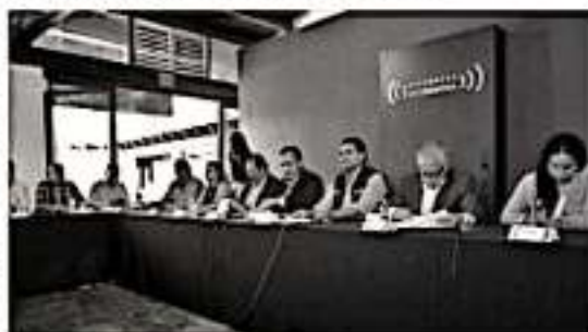
MORELIA, MICH.- El Gobernador de Michoacán, Silvano Aureoles Conejo, convocó a los diputados federales a realizar un trabajo coordinado y unir fuerzas como fracción política de Michoacán.

Entre otros temas, el gobernador destacó la creación de energías sustentables y el cuidado del agua, como asuntos de urgente atención, por lo que refirió que con el apoyo de los legisladores será posible hacer de Michoacán el primer estado en el uso energías limpias.