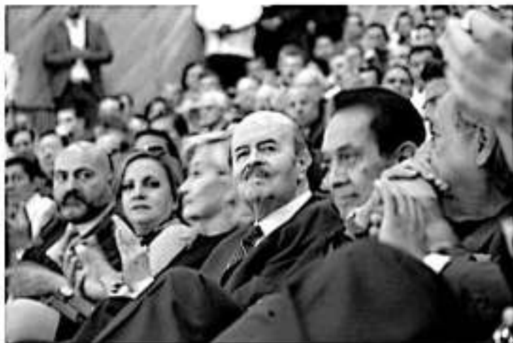
Ante un Teatro Morelos abarrotado, el senador de Morena rindió su informe legislativo.