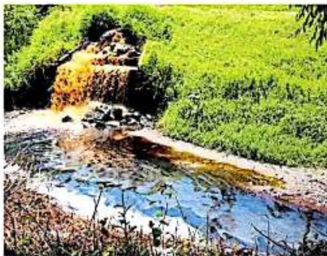
El arroyo de agua tiene una coloración negra que despiden un olor pestilente, que se puede percibir a kilómetros.