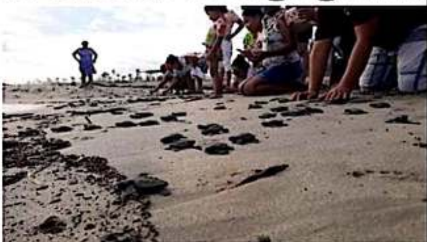
CD. LÁZARO CÁRDENAS, MICH.- Los trabajos de conservación y preservación de la tortuga marina van arrojando buenos resultados, lo que se refleja en la arribazón, el desove y liberación de crías en las playas de Lázaro Cárdenas.

Finalmente, añade que ya se muestra interés de las personas y autoridades por reconocer parte de las actividades que desempeñan estos campamentos tortugueros, ya que se ha registrado la visita de familias y servidores públicos, quienes han sido testigos de este fenómeno natural del arribo de la tortuga, esperando que en este regreso a clases el servicio que prestan para la visita de los planteles escolares para conocer de esta actividad, tenga un ligero repunte.