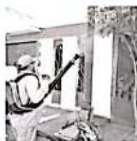
Acciones contra zika y dengue.

sido un éxito rotundo al permitir encontrar soluciones a las y los contribuyentes a problemas añejos, que en algunos casos han representado la venta de sus automotores.