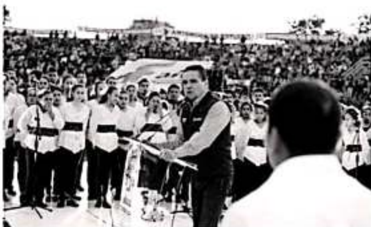
MORELIA, MICH.- Ante la circunstancia nacional, la situación de riesgo que vive la República se requiere la unidad del movimiento social, consideró el Gobernador, Silvano Aureoles.

Silvano Aureoles se declaró un admirador y respetuoso del Movimiento Antorchista Nacional y por eso aquí en Michoacán, hay una relación cercana y de respeto con el movimiento, porque coincide en que la tarea más apremiante es generar las condiciones de desarrollo para todos y para todos, buscando la equidad, la inclusión y mejorar las condiciones de vida de todos y de todos, pero siempre pensando en los más desfavorecidos, en los más necesitados. El Gobernador llamó a los antorchistas y a todo el movimiento social mexicano a dar la lucha para mejorar las condiciones de acceso a un mejor bienestar de las compañeras mujeres, de los jóvenes, más en tiempos difíciles tiempos adversos que sólo serán vencidos si somos capaces de unimos en la diversidad y demostrar que otro México es posible, que otro Michoacán es posible. "México es un gran país y ha costado mucho construirlo, lo que se ha construido ha costado mucho, ha costado sangre, ha costado sacrificio, no nacimos ayer y no estamos como país para los antojos, ni para las ocurrencias, ni para las improvisaciones", remató.