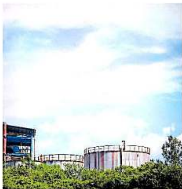
Rodeando el Área Natural Protegida se encuentra ubicada la fábrica papelería Kimberly Clark

JUAN CARLOS ARTEAGA MIEMBRO DE LA COMUNIDAD ECOLÓGICA JARDINES DE LA MINTZITA