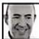
Silvano Aureoles, GOBERNADOR

“Sin contratiempos, el inicio del ciclo; las escuelas están listas, las capacitaciones se hicieron”