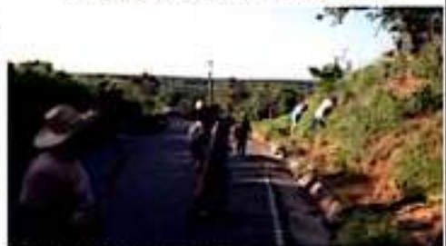
CD. LÁZARO CÁRDENAS, MICH.- Integrantes de la asociación civil Bejuco en Movimiento, encargados del orden y habitantes de diferentes comunidades llevaron a cabo la tercera etapa de reforestación, que en esta ocasión se realizó a borde de carretera, con el objetivo de sembrar 300 árboles.

Finalmente, hacen un llamado a la población en general, principalmente a los habitantes de estas comunidades y a quienes las visitan, para cuidar y preservar estos arbolitos que con mucho esfuerzo han sido sembrados desde La Mira hasta El Colomo, buscando que en un futuro formen parte de un nuevo ecosistema que beneficie al medio ambiente, que ha sido afectado por diversos factores y que requiere del apoyo y conservación de la sociedad.