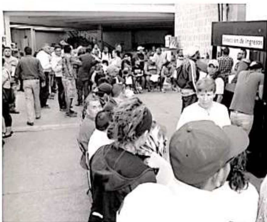
Los programas de apoyo implementados por la SFA, se han convertido en la oportunidad para que la ciudadanía dé solución a sus compromisos.

En este contexto, programas de apoyo a la economía de las familias como el Durrón y Cuenta Nueva, han significado un aliciente para que cada vez más personas se acerquen a las oficinas gubernamentales a ponerse al día, evitando así, que la omisión del pago