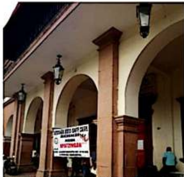
APATZINGÁN, MICH.- Maestros de la CNTE podrían liberar este día el palacio municipal.