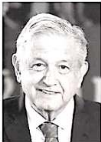
Andrés Manuel López Obrador.

Casos como éste, demuestran la ausencia de una normatividad precisa que limite la discrecionalidad e imponga obligaciones para evitar estos problemas o los señalados por la Auditoría Superior de la Federación y la Auditoría Superior de Michoacán respecto a la Cuenta Pública 2017 y que tienen relación con el uso tanto de recursos públicos como los propios, relacionados con el sostenimiento de los