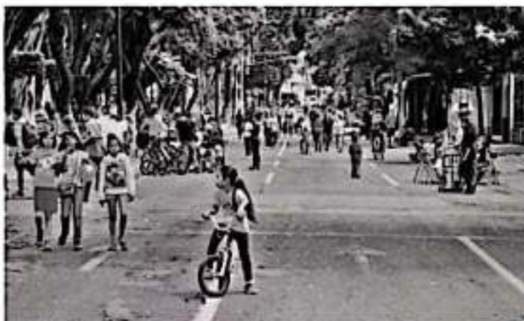
URUAPAN, MICH.- En esta ocasión se tuvo un rally para niños con costales, bolche, aros y más