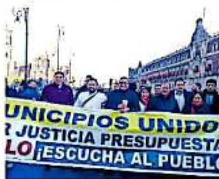
La minuta surgió a partir de la reunión de 25 ediles de Michoacán, y otros 40 más del país, contra

"Hemos estado entendiendo esa parte los municipios migrantes, no sólo se trataba de recursos económicos, se lograba que los migrantes hicieran algo por su comunidad. Lo dejamos claro que el gobierno federal ha olvidado estos programas", subrayó. Esde mencionar que al no haberse convo-