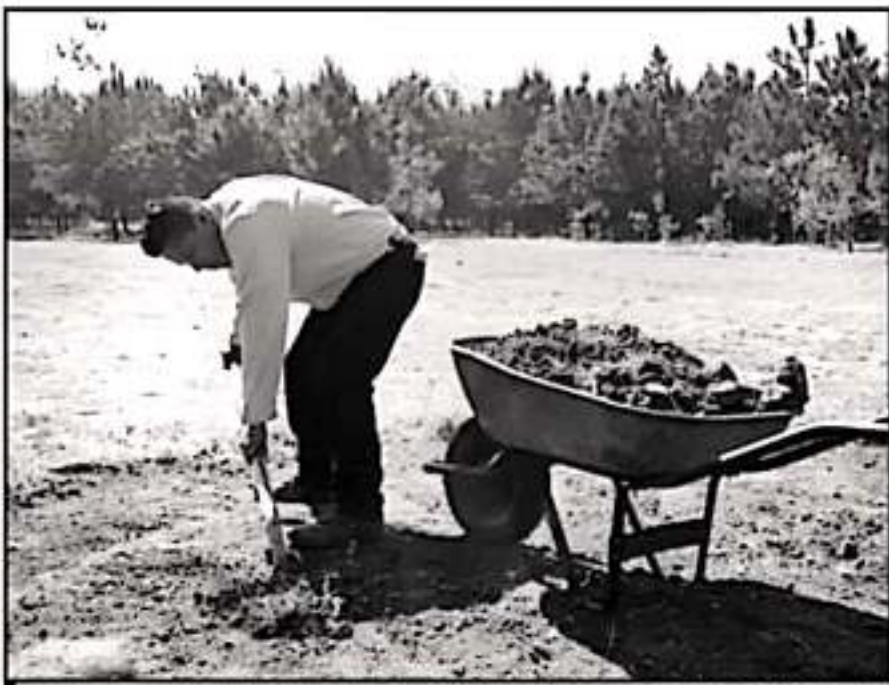
EL PARQUE ECOLÓGICO SALVADOR BERNAL ES UN OASIS FORESTAL DENTRO DE LA FRANJA DE CLETO DE AGUACATE.

cuenta que algunos de sus familiares posiblemente tienen necesidades. "El pensó en ese bienestar y no en sacar mayor riqueza, de eso hay que aprender, no solamente acumular propiedades o cosas materiales", señaló Magaña Madrigal.