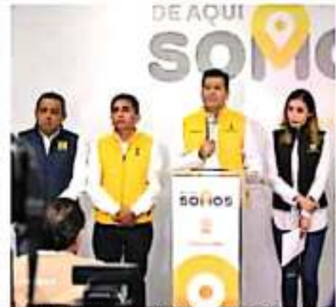
El sábado se llevó a cabo la primera asamblea de Futuro 21.

Por otro lado, retomó que "Futuro 21 es el nombre que se le dio momentáneamente a este movimiento donde coincidimos agrupaciones y personas de diversa índole, que estamos convencidos de que en México no puede haber una sola voz y, por el contrario, debemos fortalecer la pluralidad, respeto hacia los otros, las libertades, el conocimiento y la defensa de las instituciones".