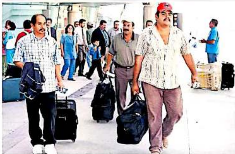
El mayor contacto se estableció a través del Aeropuerto Internacional de Morelia / Cuernavaca