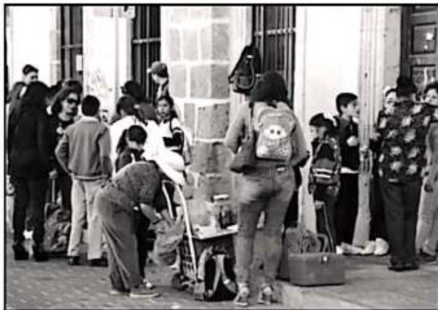
HOY INICIAN O REINICIAN CLASES ALUMNOS DE TODAS LAS EDADES, AUNQUE PRINCIPALMENTE DE NIVEL BÁSICO

tablezca lineamientos, diseño e implemente políticas públicas para garantizar el derecho a aprender. Espuso que las acciones de la autoridad deben estar en equilibrio con el respeto y dignidad que merecen los derechos profesionales de los docentes, “hay, en vilo”.