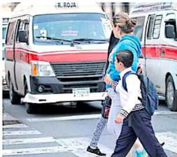
Más de 11 mil escuelas de nivel básico de la entidad se apegarán al calendario escolar de 190 días efectivos de clase. ARNOVO