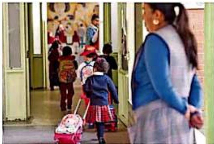
Una maestra recibe a los alumnos de educación básica y algunos de educación media superior.

La Nueva Escuela Mexicana, cuya capacitación comenzó la semana pasada, también ha traído inconformidades de los maestros, e integrantes de la sección 22 de la Coordinadora Nacional de Trabajadores de la Educación (CNTA) arrancaron el ciclo alternativo, sin la maestra de inglés.