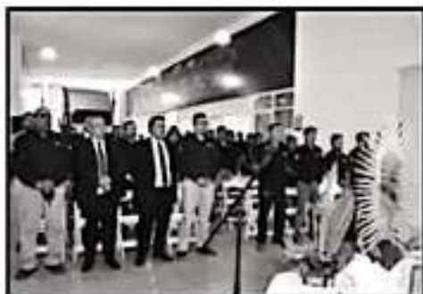
DIRECTIVOS, INVITADOS Y EMPLEADOS, DURANTE LA MISA.