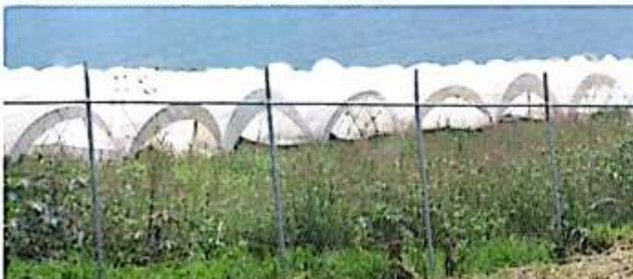
ZAMORA, MICH.- Panorama incierto para productores de fresa se mantiene ante crisis económicas de esta cadena productiva, aunado a la inseguridad de la que son blanco.

El alza en el costo de la planta madre fresa, se dijo, impactará el costo total del productor de frutilla, el que espera que el presente año sea mejor que el 2018, cuando las pérdidas que se generaron dejaron afectaciones millonarias que aun buscan subsanar.