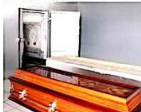
ZAMORA, MICH.- Tras invertir poco más de 127 mil pesos, se reactivó el servicio de cremaciones en el panteón municipal.

Otros servicios que tiene este inmueble municipal es la inhumación, donde se da sepultura y también está disponible al público en general, puesto que este panteón es una extensión del panteón principal, de tal manera que quienes no cuenten con lugar para sepultar a sus familiares fallecidos, aquí se cuenta con gaveta.