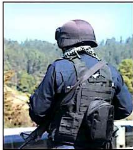
LAS AUTORIDADES MUNICIPALES DE TINGAMBATO PIDEN EL APOYO DEL GOBIERNO DEL ESTADO Y LA FEDERACIÓN PARA GARANTIZAR LA SEGURIDAD.

Sobre el acoso de los grupos criminales a las autoridades