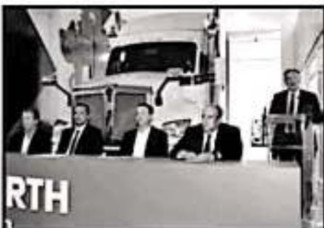
KENWORTH DESTACA 13 AÑOS DE PERMANENCIA EN EL ESTADO.