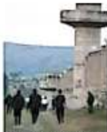
Destacan la importancia de invertir en infraestructura.

Según notas periodísticas de 2015, tuvo una inversión de cuatro mil millones de pesos. Aunque en el gobierno de Leonel Godoy Rangel se inauguró el penal de los Reyes, con una inversión de 213 millones de pesos, para albergar a 500 reclusos, no es reconocido por el Sistema Penitenciario del estado, debido a que existe un litigio por la posesión del terreno que no se ha podido deslindar para que entre en funciones.