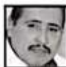
Héctor Astudillo, LÍDER DEL SNTE

“La CNTE lo ha dicho: no queremos la diferenciación en el pago entre trabajadores”