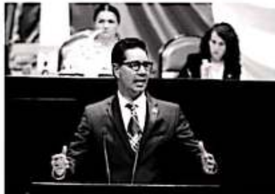
MORELIA, MICH.- Michoacán nos requiere a todos y nos quiere juntos, caminando en una sola ruta y con un solo objetivo: el bienestar de la gente.

Hizo un recuento de las reformas que ha impulsado Morena entre las que destacó la de justicia laboral y libertad sindical y la creación de la Guardia Nacional para las que pidió un voto de confianza porque apenas están empezando