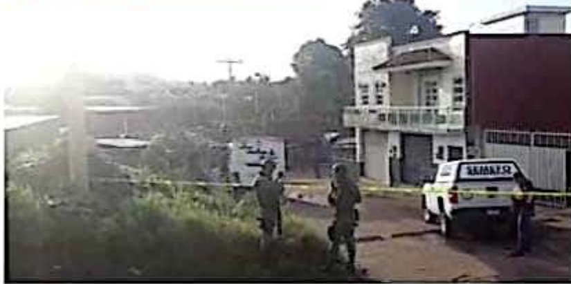
En otro hecho de sangre ocurrido ayer en Uruapan, un grupo armado ingresó a un domicilio para matar a belazos a una pareja.