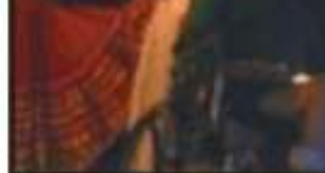
EL DESFILE DE CATRINAS BUSCA LA CIERA Y CIERA DE PERSONAS.

CE ■ SUPERAN LAS EXPECTATIVAS DE PARTICIPACIÓN