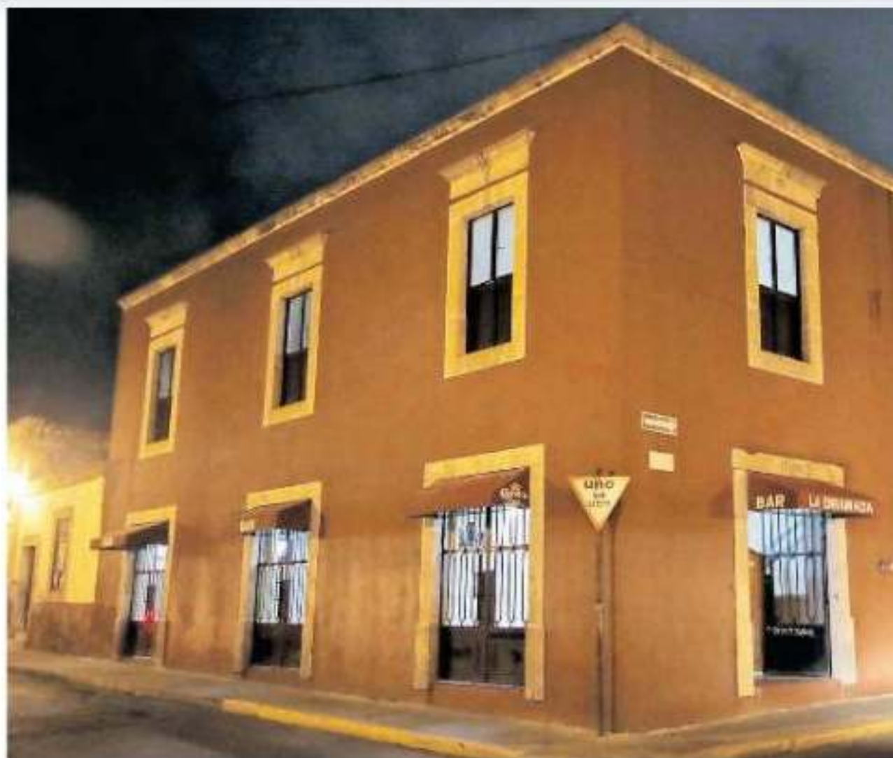
La cantina la "Enramada" ha tenido tres sedes, pero es en la calle 20 de noviembre donde por dos y ya sumar 36 años de estancia