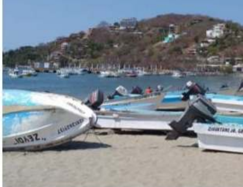
ZIHUATANEJO, GRO.- Pescadores confían en que en este 2019 se realice la Sustitución de Embarcaciones y Motores Fuera de Borda.

un beneficio importante de pescadores zihuatanejenses se ha dado a conocer desde mayo de 2019, cuando se abrió la lista de documentación. A la fecha, los pescadores ya han comenzado a conocer el nombre de los beneficiarios y de la forma de esta infraestructura.