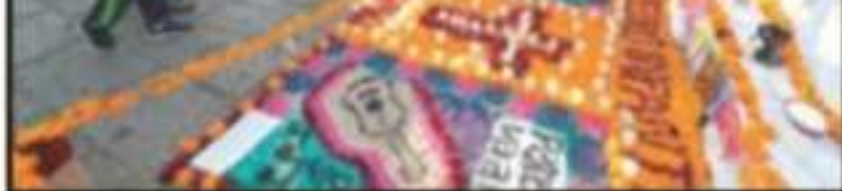
DESDE EL DÍA 1 DE NOVIEMBRE Y TEMPRANA HORA DEL DÍA 2, LAS CALLES DE LA CIUDAD SE VISTIERON DE COLORES.