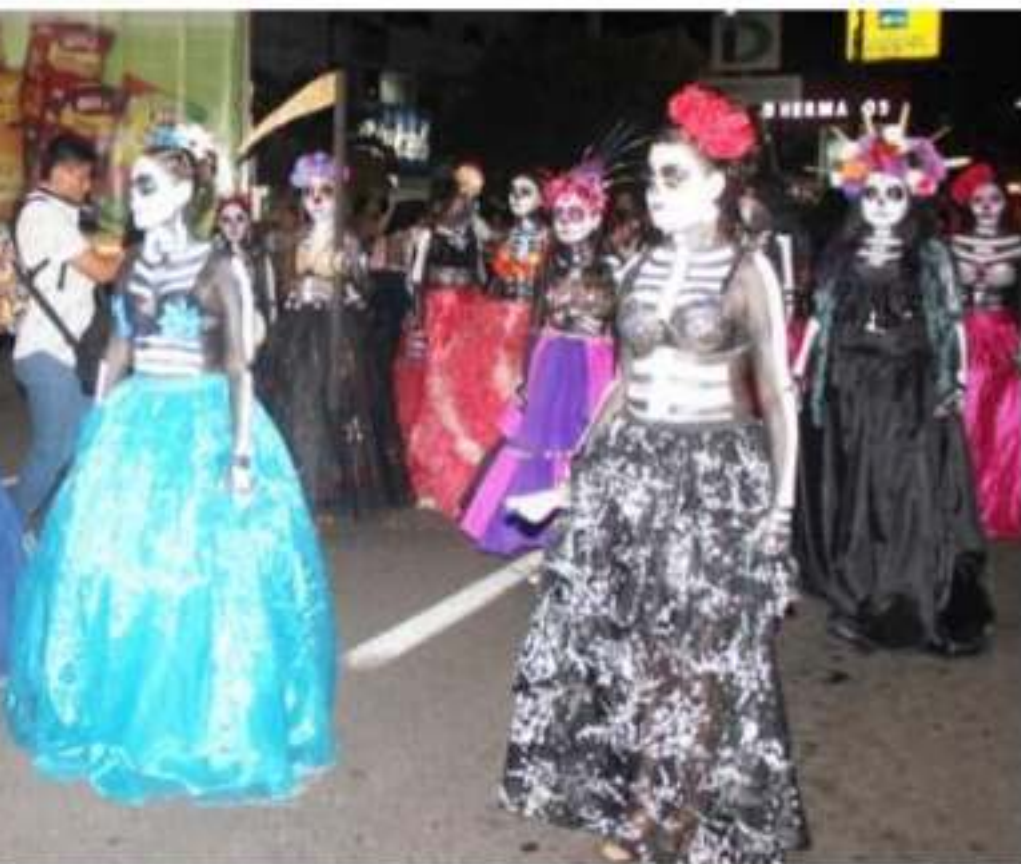
...on una positiva respuesta inició el Festival de "Día de Muertos", que además de ...tural, enmarcó la inauguración de la fuente danzante.

Entre l acompañar los regidore Margarito O Posadas; el Bejarano; Horacio Ra autoridades