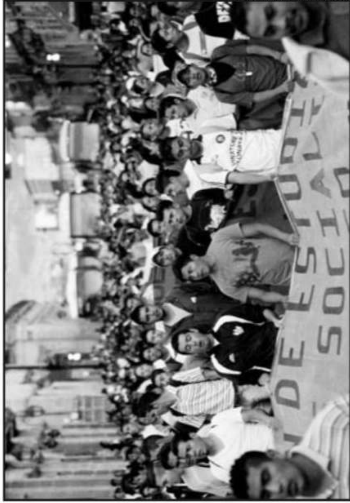
NORMALISTAS HAN SALIDO A LAS CALLES DE FORMA RECIENTE EN EXIGENCIA DE CAMBIOS EN ALGUNOS DIRECTIVOS.

Los estudiantes y los estudiantes semestralizados en el bloque de la Huerta y del tren. Las acciones de las comunidades de las vialidades