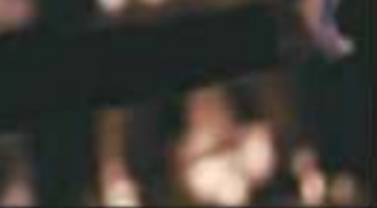
ORELIA FUE EL ESCENARIO DE LAS ACTIVIDADES POR LA FECHA.