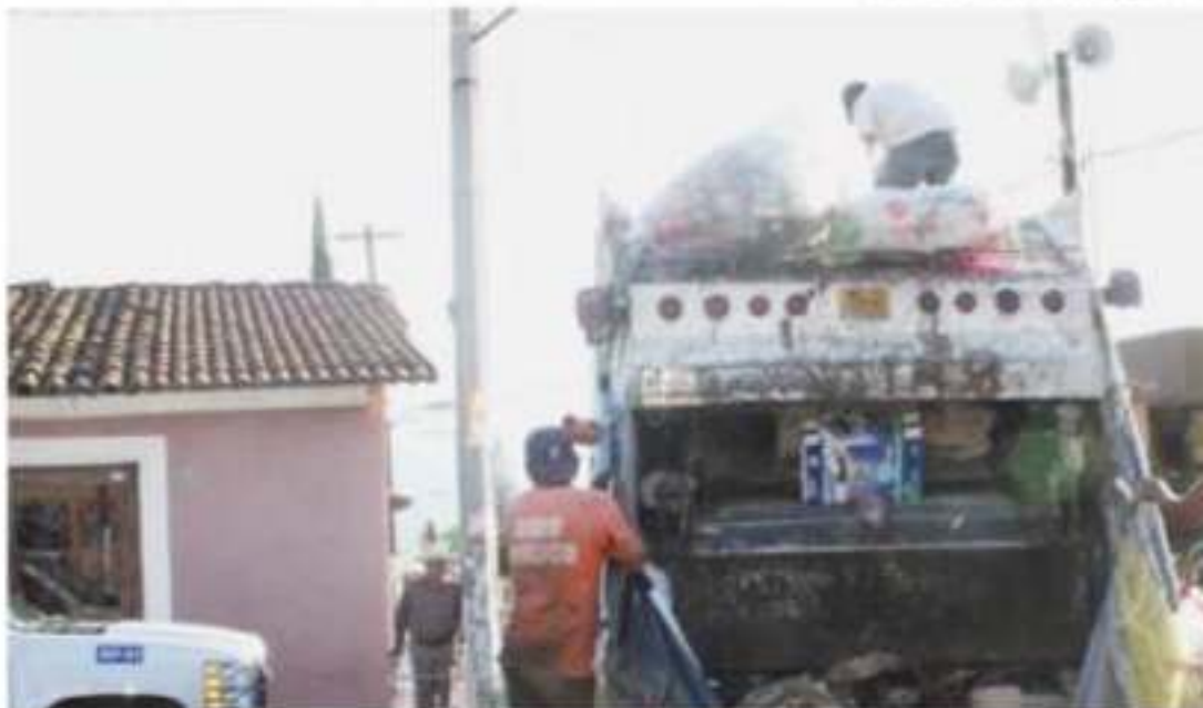
ZAMORA, MICH.- Personal del área de Aseo Público trabajará este día en las labores de recolección de basura como en un operativo especial en los panteones y plaza principal.

Finalmente señaló que el personal recolecta diariamente un promedio de 100 por ciento más, que es el volumen de basura los días de