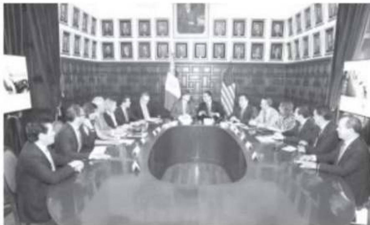
Nuestra gratitud por el interés de conocer un estado binacional y con estrecha cercanía hacia EUA, sostuvo el mandatario a nombre de las y los michoacanos.

bienvenida, el lezas en política plementado en del programa vés del cual se iles de familias n el vecino país