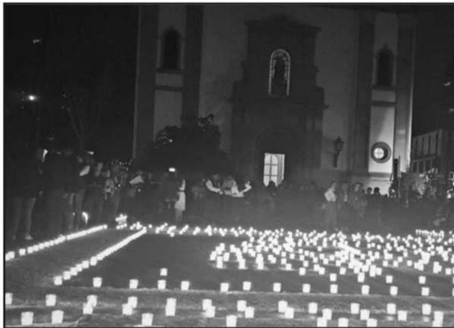
PLAZAS Y TEMPLOS FUERON ILUMINADOS POR MILES DE PEQUEÑAS CANDELAS, QUE BUSCAN GUIAR LAS ALMAS DE LOS FA

otras manifestaciones, que, de acuerdo con la mitología purépecha, es el ambiente adecuado para la breve visita de las ánimas.