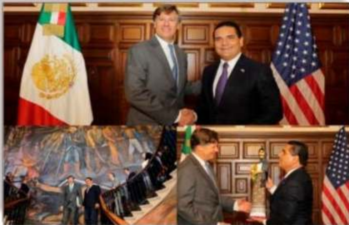
El Gobernador SAC, recibió al Embajador de EU, Christopher Landau.

más eventos que hay en todo el ENTRÁNDOLE al gobierno, es luego de que el gobernador Silv invitara recientemente a visitar llegó a Morelia el Embajador de Christopher Landau . ¿Quihubo al diplomático estadounidense en donde le dijo que "a nombre de expreso al Embajador nuestra cordialidad y el interés por cono estado binacional que tiene en riqueza en las manos y mentes de comento que en esta reunión Conejo le describió a Landau migratoria que se han implement por ejemplo el programa " Palon dado la oportunidad a miles "reencontrarse en el vecino p permitido fortalecer los lazos en igual manera, el mandatario estat todo el potencial que represen Cárdenas , así como su capaci además de que de igual mane agrícola que se tiene en Micho líderes en producción nacional y