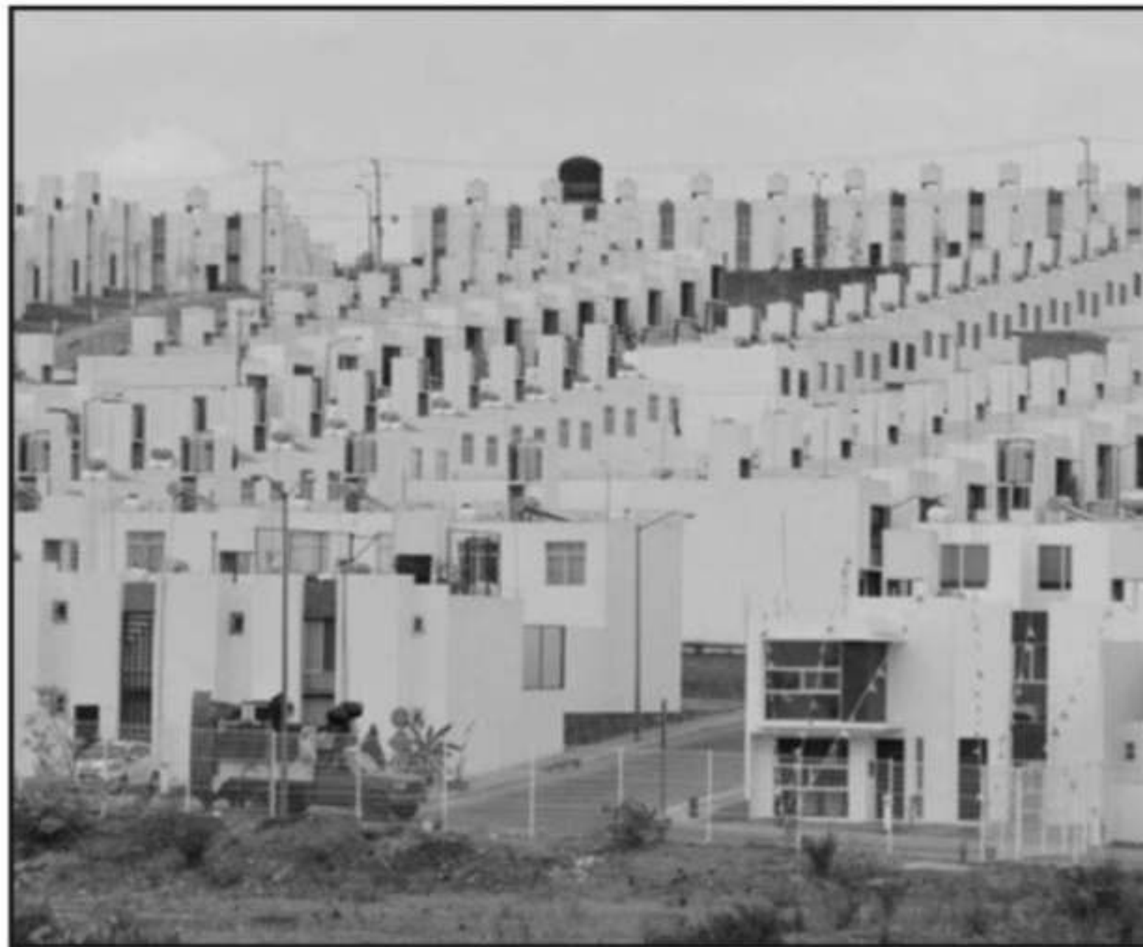
BUSCAN EVITAR MÁS CRECIMIENTO DESMEDIDO A LAS ORILLAS DE MORELIA; ES UNA POLÍTICA PARA MEDIANO Y LARGO P

miento del Centro Histórico; entre los principales.