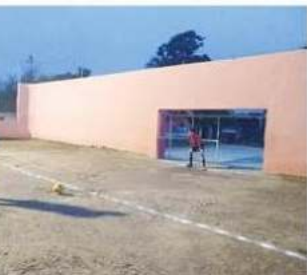
Lunes dará inicio aquí la Copa DIFutbol 2019 que congregará a niños de varios municipios de la entidad.

ando con la par- edad, divididos en diver- sion de 150 niños y sos equipos provenien- tes de 11 a 13 años de tes de Aquila, Buenavista,