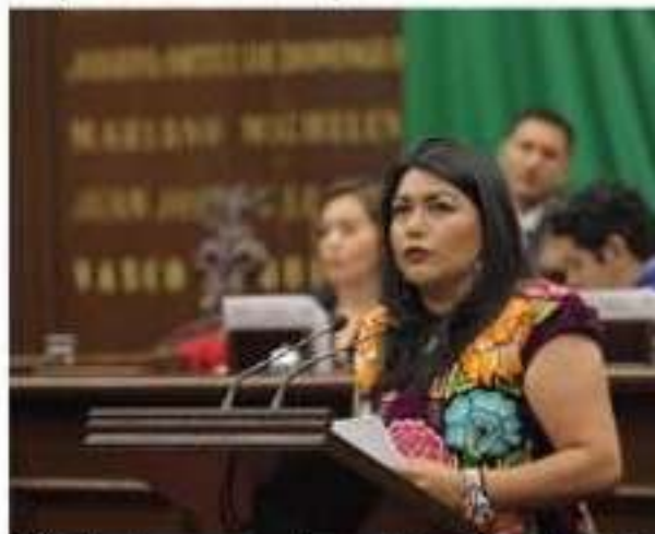
El PT refrenda su compromiso con la transformación pacífica de la vía de la educación.

Debe decirse que en Mé- xico, Lázaro Cárdenas es el único puerto que tiene Ter- minal Especializada en Au- tos, donde las líneas y firmas automotrices reciben servi- cios especiales, que empieza desde espacio adecuado para que atraquen los buques RoRo, que mueven automotores, además de disponer de línea de ferrocarril al centro del país y hasta más allá de la frontera de Estados Unidos.