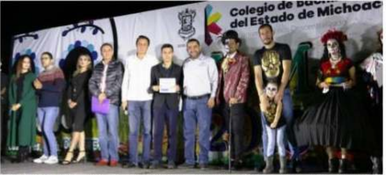
LOS REYES, MICH.- El Colegio de Bachilleres, plantel Los Reyes, llevó a cabo su tradicional evento con motivo del Día de Muertos.