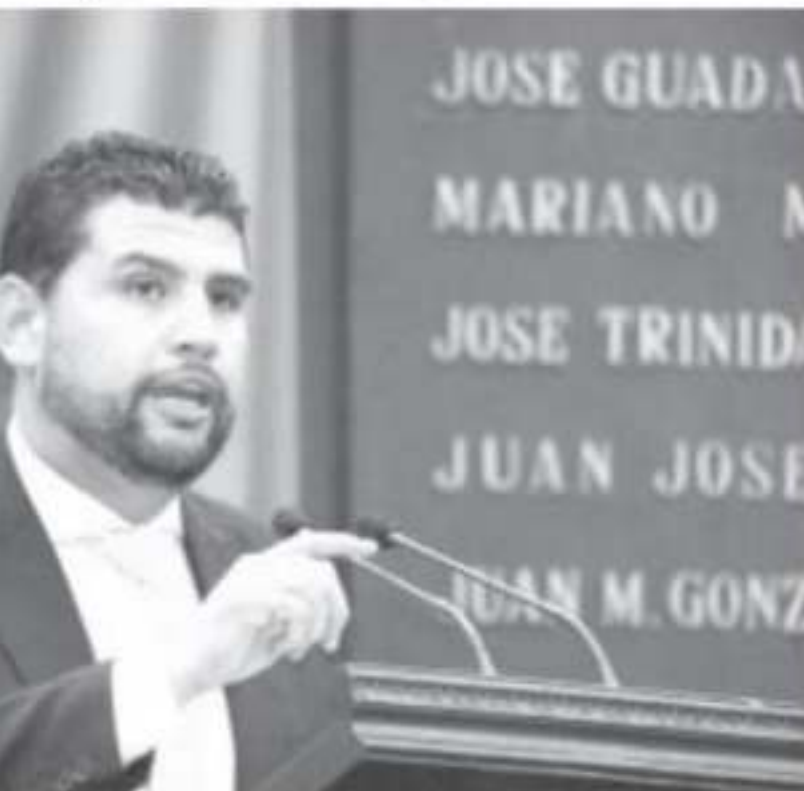
Estado y frente al Pleno Legislativo, el diputado presentó un los hechos ocurridos frente a Palacio Nacional el pasado 22 de

de 2019.-Existe de diferentes estados del país fueron