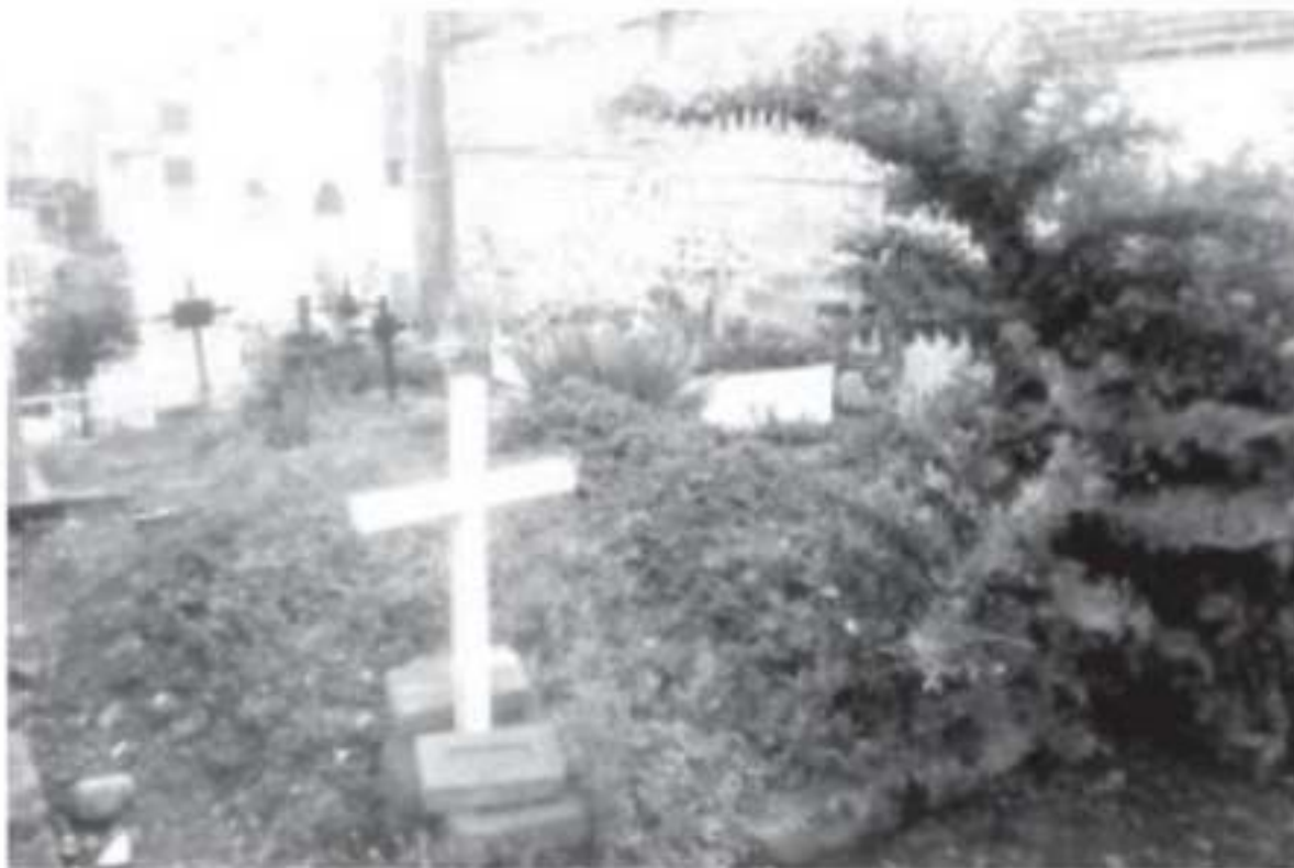
Hay quienes dicen que durante el día una niña recorre las tumbas y se sienta sobre una de ellas. Otros comentan que a lo lejos se escuchan voces que provienen del suelo.

En entrevista Región, señala encontrar desde por el dolor de vándalos que algunos de su encontrado oby brujería, princip