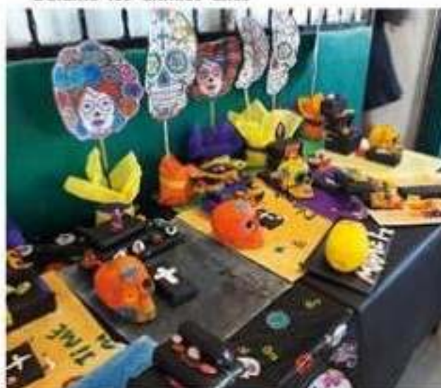
Uno de los altares elaborados en una institución educativa de Lázaro Cárdenas.

Enhorabuena a las escuelas, por seguir manteniendo viendo nuestras tradiciones.