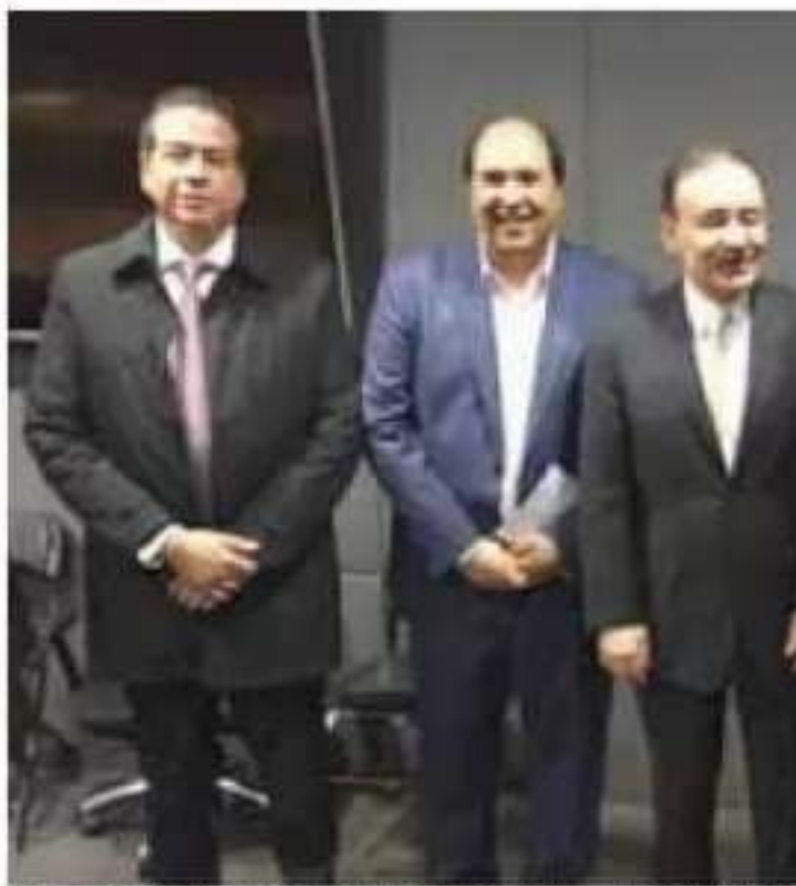
La reunión con funcionarios federales se realizó en Palacio Nacional

El alcalde, ocupado de brindar garantías de protección a los morelianos, buscó esta reunión con las más altas esferas de la seguridad en el país, y se mostró agradecido y satisfecho por la