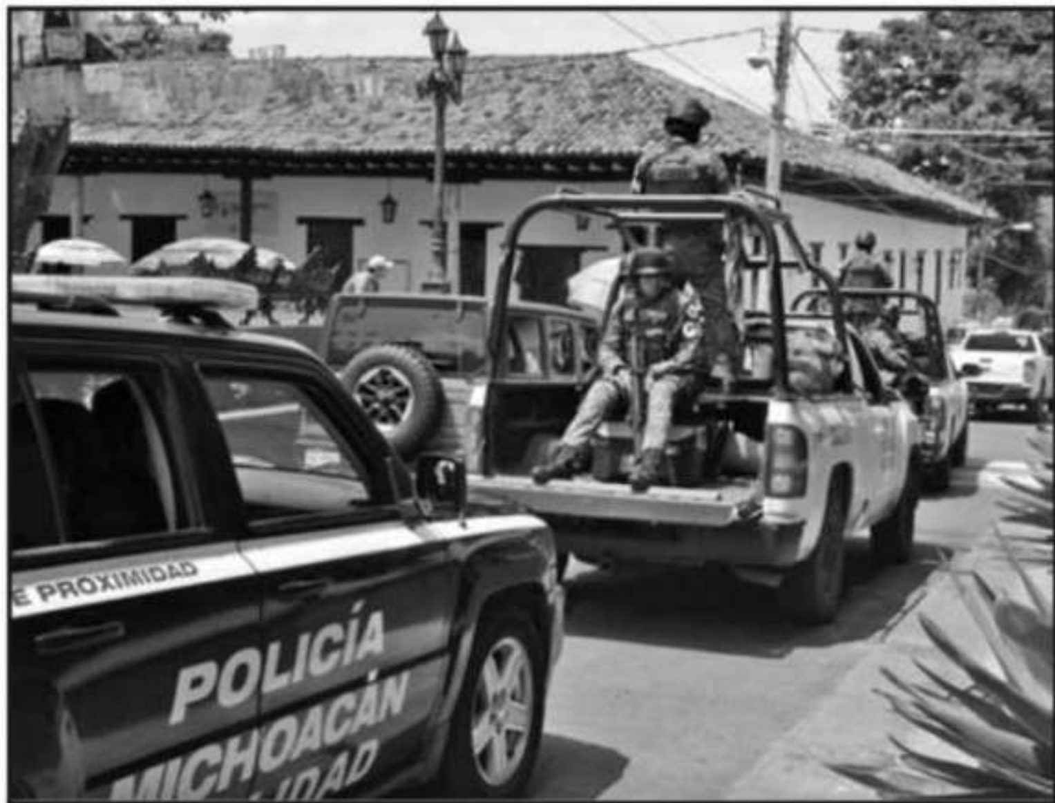
LA SEGUNDA ETAPA DEL OPERATIVO DE SEGURIDAD INICIÓ EN EL MUNICIPIO DE ZIRACUARETIRO. SEGÚN AUTORIDADES.

Silvano Aureoles Conejo, GOBERNADOR DE MICHOACÁN