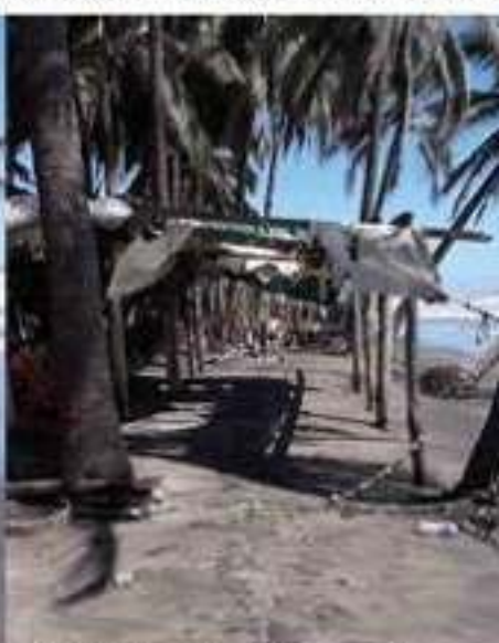
La lluvia y el fuerte oleaje, socavaron los sitios donde se ubican las enramadas.