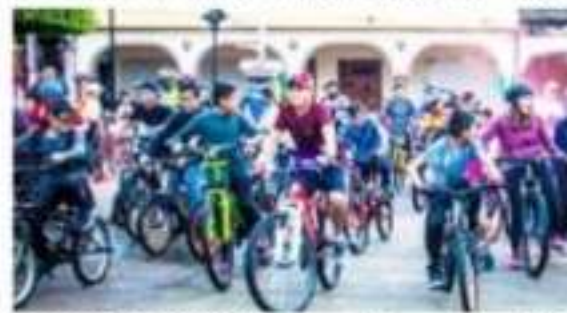
PERIBÁN, MICH.- Con éxito se efectuó la Rodada Tricolor.

Entrevistada al respecto, la alcaldesa peribanense señaló que el objetivo de estas actividades es promover la activación física entre los habitantes del municipio y que mejor forma de hacerlo es en familia; "Fue una dinámica muy divertida bajo la temática de los colores patrios, agradecer la excelente participación de niños, jóvenes y adultos, quienes hicieron que esta rodada fuera todo un éxito", comentó. Teniendo como punto de partida la plaza principal, el