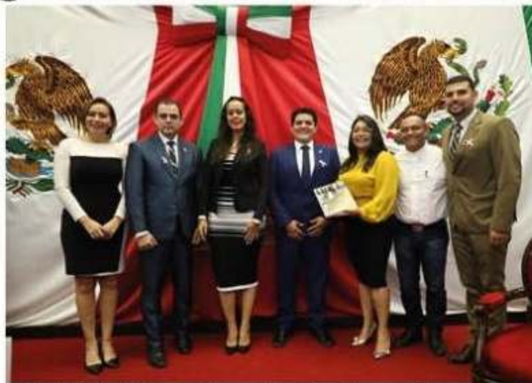
Los diputados locales del PT presentaron durante el Primer Año Legislativo un total de 69 asuntos en tribuna, con ello una de los grupos parlamentarios más productivos del legislativo michoacano.

Cabe recordar que la fracción del PT promovió durante el primer año de actividades legislativas un total de 69 asuntos, lo que representa un promedio de 17.25 asuntos por diputado petista. Este dato incluye uno de cada cinco