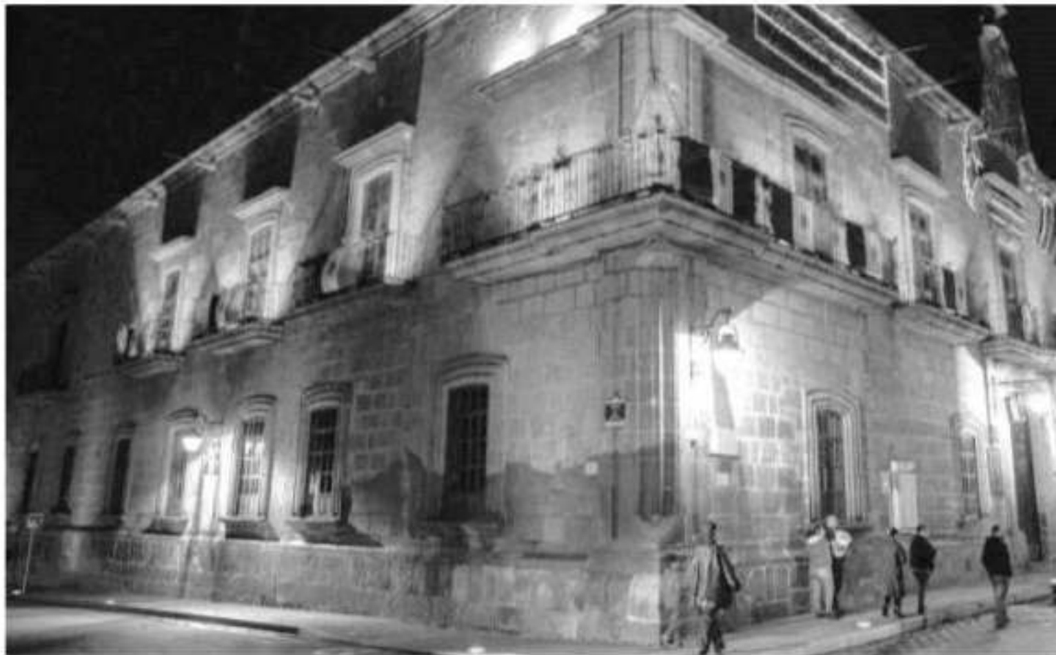
La sede del Ayuntamiento capitalino se iluminó de rosa como parte de las acciones de promoción a la lucha contra el cáncer de mama.

ficios l mes cipal, as, la stelas ofici- l edi-