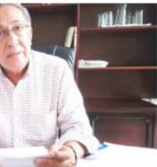
Medad en los cultivos -debido a pocas

por lo que se espera que lleguen a ser contratados por el gobierno Estatal y las actuaciones y se generen los trabajos para los afectados, donde también el se han visto afectados.