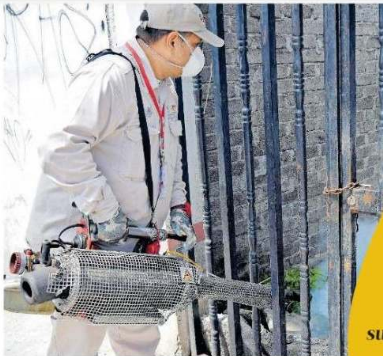
La funcionaria precisó que en Lázaro Cárdenas hay un centenar de personas destinadas sólo al trabajo de protección del dengue

cción rea- rcoles en do por lo ieron en- es mien- s labores enferme-