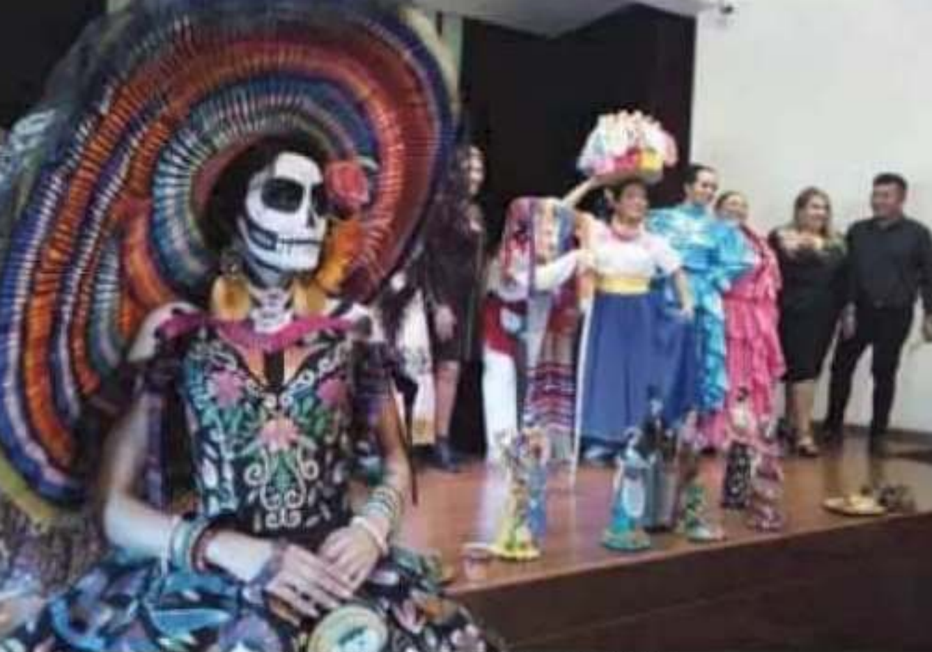
La Tercera Sfilata di Catrinas se realizará del 11 de octubre al 23 de noviembre.