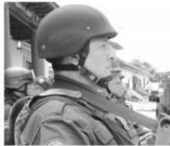
Michoacán cumplirá con estado de fuerza policia

Durante el arranque de la II Fase del Plan de Seguridad Más y Mejores Policías en el municipio de Ziracuaretiro, Aureoles Conejo afirmó que las tareas de su administración están enfocadas en garantizar la seguridad de todas y todos los michoacanos.