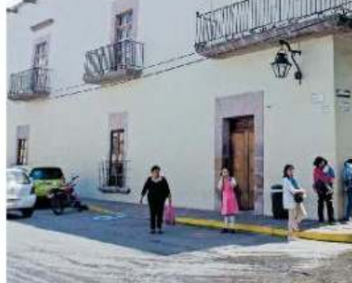
Desde 2004, el recinto ha tenido cuatro restauraciones / ADIG JIMÉNEZ

Cabe apuntar que desde 2004, el recinto museográfico ha tenido cuatro restauraciones, siendo la de 2016 la más tar-