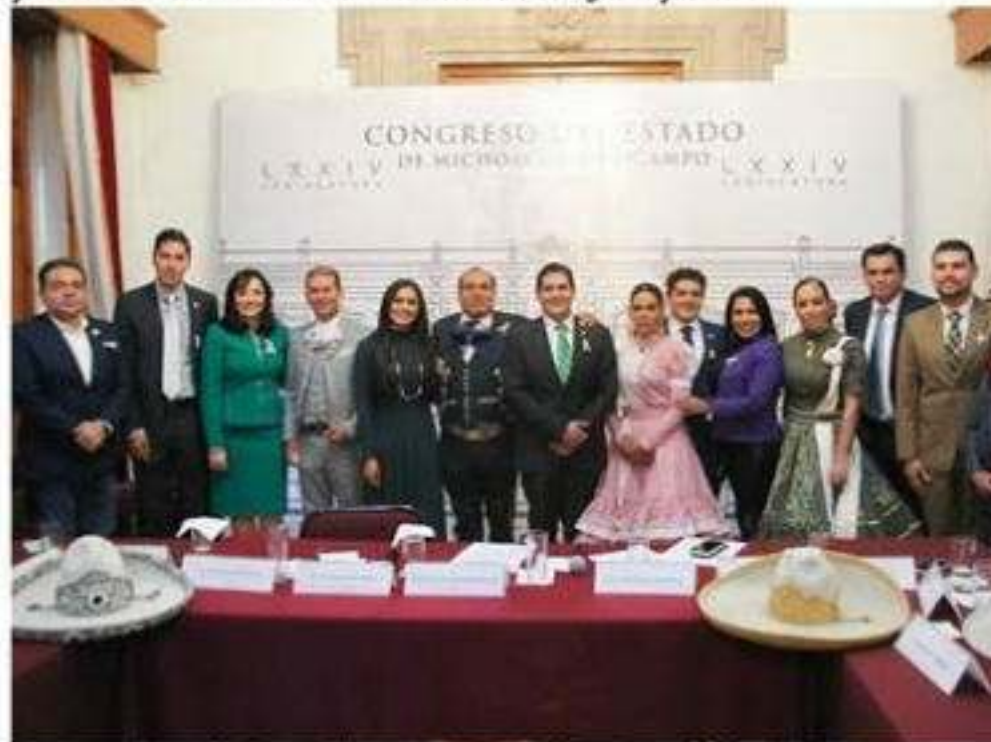
Miembros de la 74 Legislatura recibieron en el Salón de Recepciones del Palacio Legislativo a los organizadores del 75 Congreso y Campeonato Nacional Charro "Don José María Morelos y Pavón, Michoacán 2019".