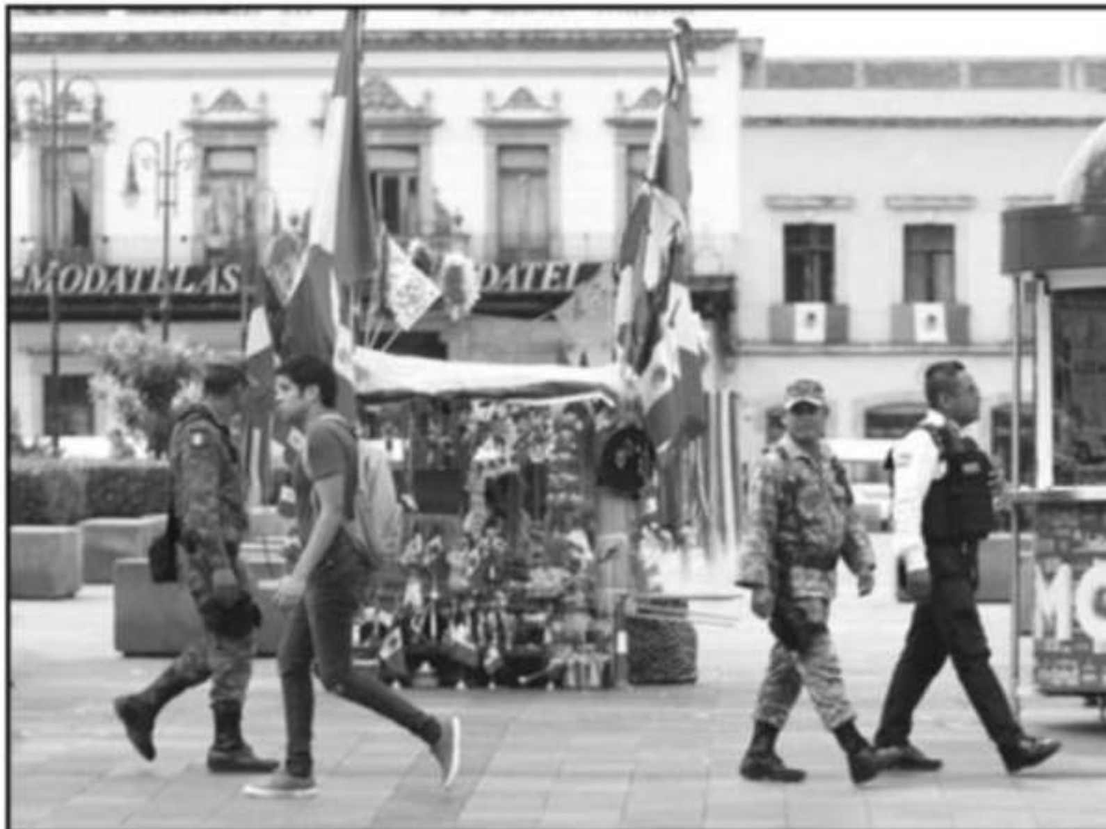
LA LLEGA DE ELEMENTOS DE LA GUARDIA NACIONAL AL ESTADO HA PASADO DE NOCHE, LOS ÍNDICES DELICTIVOS AUMENTAN