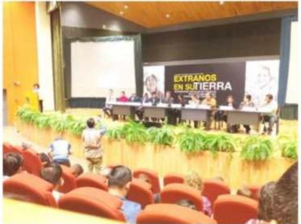
ZAMORA, MICH.- En el marco del XLI Coloquio de Antropología e Historias Regionales (Extraños en su tierra), investigadores del Colmich analizan a profundidad la situación del agro mexicano.