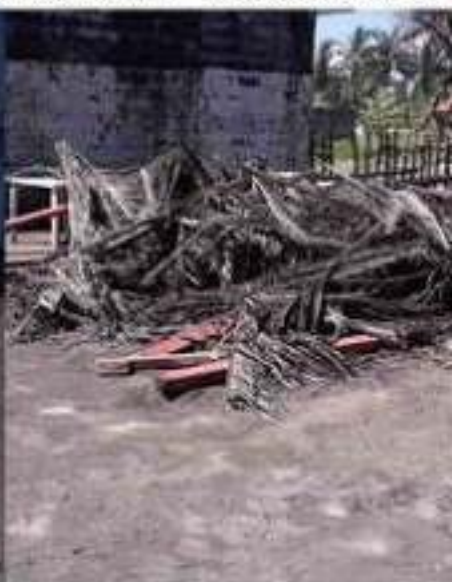
En el mobiliario, madera y palapas, son algunos de los daños que sufrieron las enramadas de playa