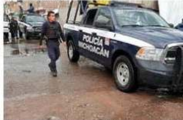
Policias acudieron al sitio donde un hombre fue asesinado a balazos en la colonia Jacona, en donde también una "bala perdida" lesionó a una niña de 5 años de edad.