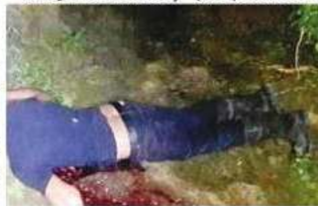
Luego de discutir con desconocidos, en la madrugada de ayer un hombre fue asesinado a balazos en Zitácuaro.

El crimen ya es investigado por el personal de la Fiscalía.