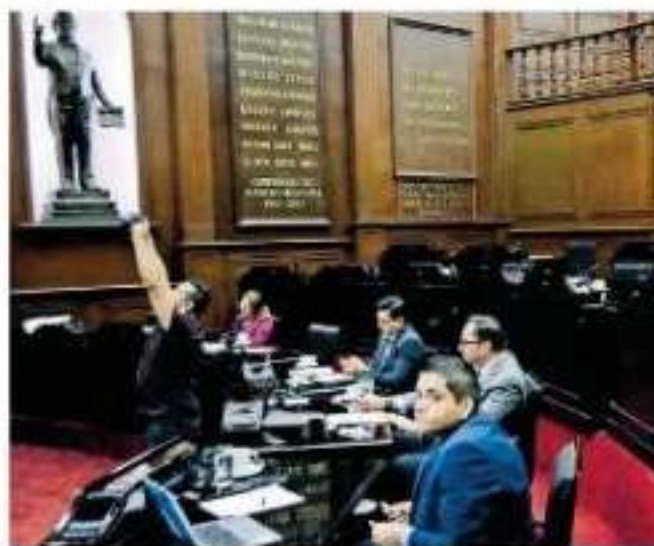
El salón principal del Palacio Legislativo fue abandonado para ocuparse de otros asuntos

Lo anterior luego de que el salón principal de Palacio Legislativo fue abandonado por los asambleístas para ocuparse de otros asuntos como ocurrió ayer con la visita de la Asociación de Charros de Morelia quienes se reunieron con diputados perredistas e integrantes de la Junta de Coordinación Política para promover el Congreso y Campeonato Nacional de Charros a realizarse próximamente en la capital del estado.