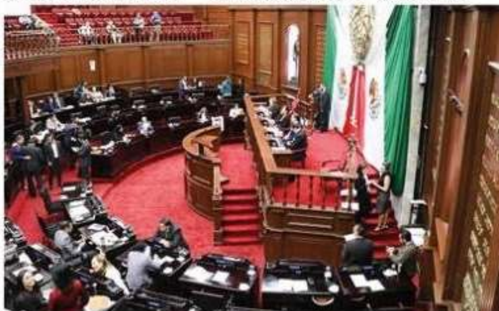
El pleno del Congreso local, avaló el retorno de documento original de la Constitución Política del Estado.

locales reconocieron la Constitución, es un acto de rango fundamental que da vida al sistema mexicano y forma particular de este Poder Legislativo por la cual, respalda la solicitud para tales fines.