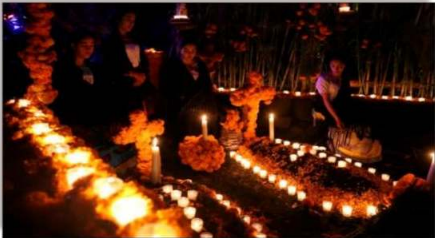
El misticismo de Día de Muertos se vivió en todo Michoacán.

que a el diga, elas, tico. los arca, ra, la algo, más, o de fue ente s los uesto tas y guros labor la omía n el por a la ia de ta y con e las han