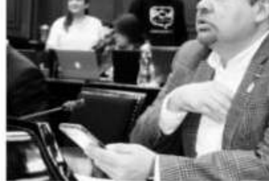
MORELIA, MICH.- Durante los nueve primeros meses del presente año, el Gobierno Federal dejó de suministrar a Michoacán 357 millones de pesos correspondientes a las participaciones previstas en este 2019.