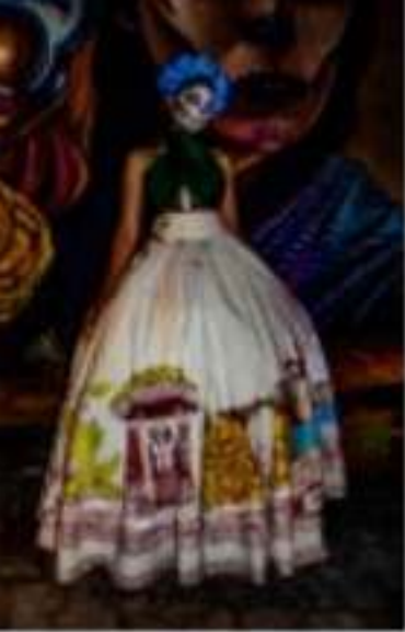
CIA PONCE ALFONSO ARCH