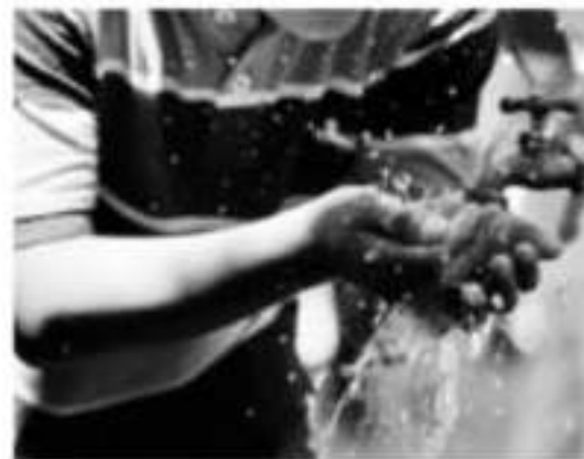
MORELIA, MICH.- Por no querer quedar mal con su público, el Congreso del Estado no permite que los ayuntamientos incrementen sus tarifas de agua, pese a la carencia de recursos que presentan los municipios, señaló el gobernador, Silvano Aureoles.

pagar el agua. "Los municipios pasan un tiempo muy ingrata, porque tienen que garantizar el suministro", dijo. El mandatario recorrió el estado en octubre, a Michoacán le faltan mil millones de pesos para cubrir los municipios que tienen la mayor debilidad financiera.