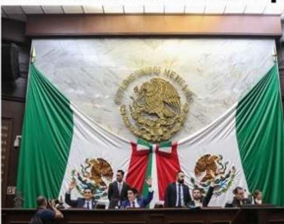
Diputados de la 74 Legislatura exhortó a la SEE a evitar el cobro de cuotas de inscripción o cooperación a los padres de familia.