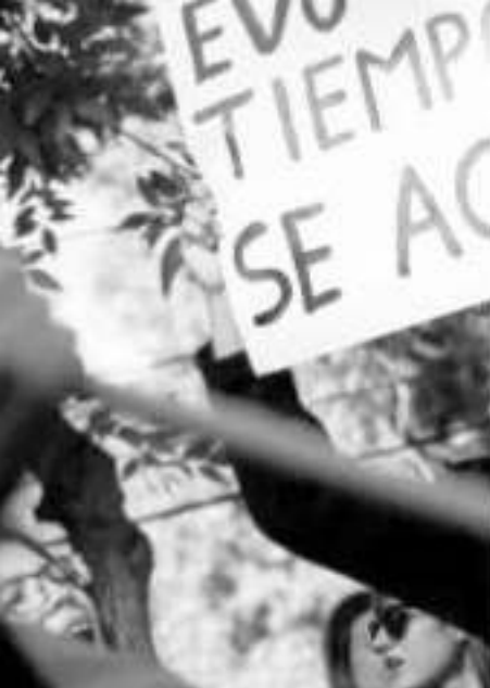
Amacho demandó la renuncia manifestantes opositores en n lugar en Bolivia tras las