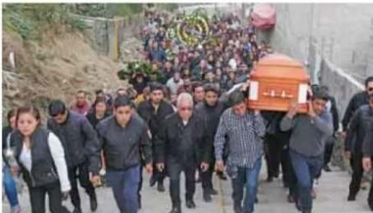
Los órganos del alcalde de Valle de Chalco, Francisco Tenorio Contreras, serán donados.