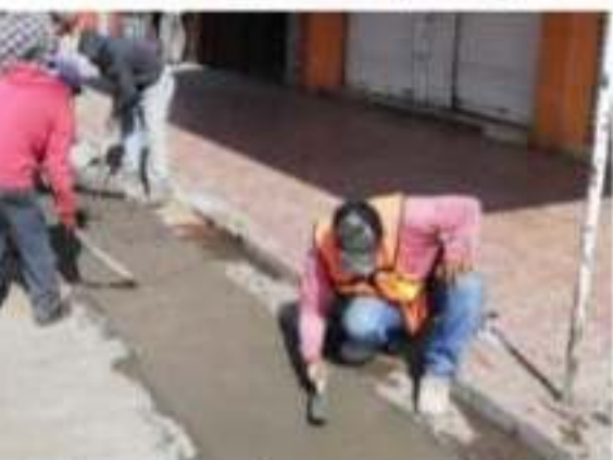
Ramírez, presentan un avance del 35 por ciento en la sustitución de las viejas tuberías de la red de agua potable.

La obra de sustitución de la red de agua potable en la colonia Ramírez, comprende la instalación de más de 2 mil metros lineales de tubería de distintos diámetros, así como 323 tomas domiciliarias, en el sector que comprende de Galeana a Méndez Plancarte y de Avenida Juárez a López Rayón.