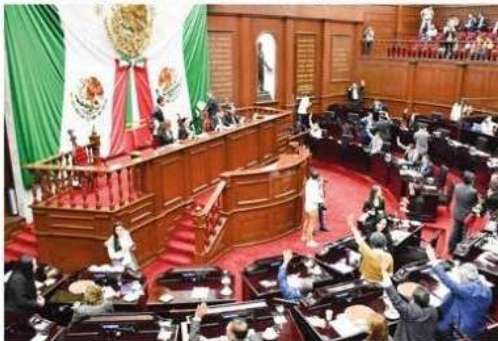
El presente exhorto es un llamado para cumplir con los fines y ejes contemplados a nivel internacional de la estrategia nacional.