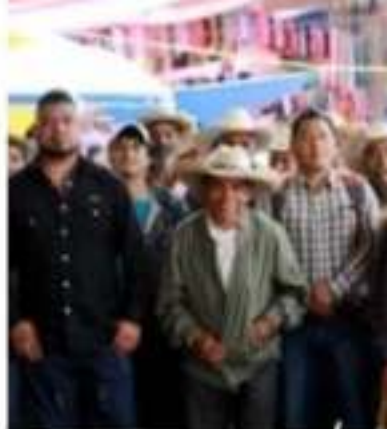
COMACHUÉN, MPIO. DE Concejo Comunal de Gobierno

Sobre ese punto, el nuevo Concejo de entrada negó que existiera dicha violación pues en repetidas ocasiones se le citó, pero no asistió, por lo que con la seguridad de que están en lo correcto, el 25 de octubre se reunieron con los