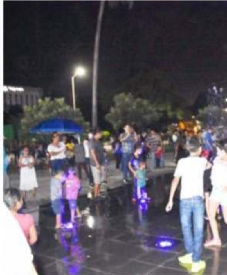
CD. LÁZARO CÁRDENAS, MICH.- El pasado viernes fue inaugurada la fuente danzante en la explanada municipal "Benito Juárez García", en esta ciudad.