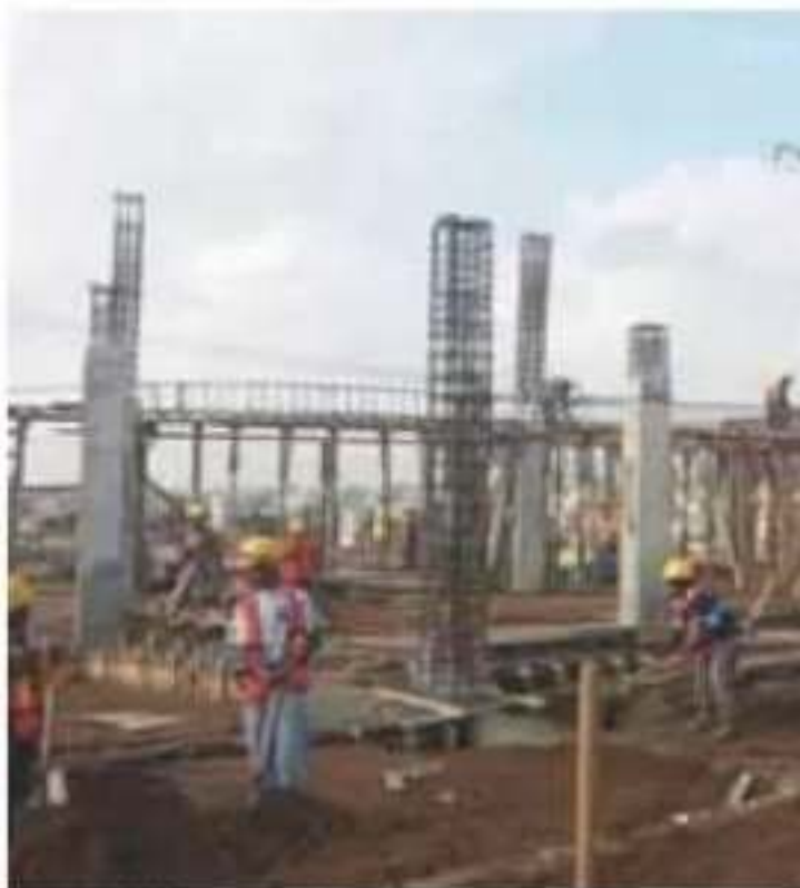
La UMF de Tarímbaro será inaugurada antes de que termine el año.

Por ello, expuso, las inversiones "fuertes" e importantes para Michoacán serán el próximo año, con la construcción de dos hospitales regionales que atenderán, en conjunto, a más de 500 mil michoacanos. El que se instalará en Zitácuaro ya tiene un avance con la donación del terreno por parte del Ayuntamiento, el cual se ubica en la carretera a México, cerca de la entrada a la comunidad Colo-