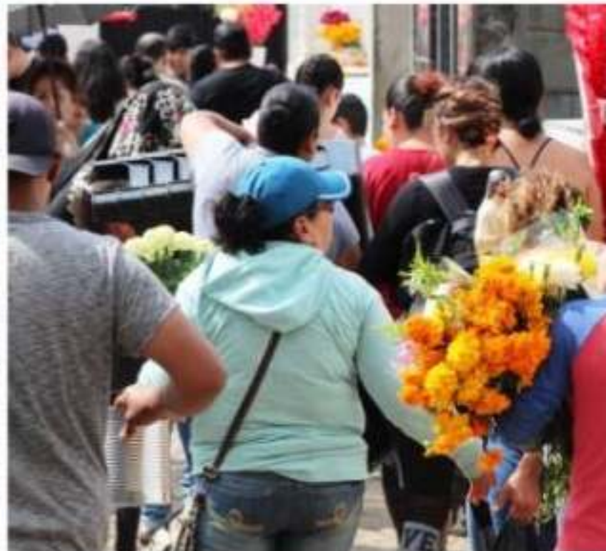
LOS REYES, MICH.- Entre 8 y 10 mil personas visitaron el panteón municipal.