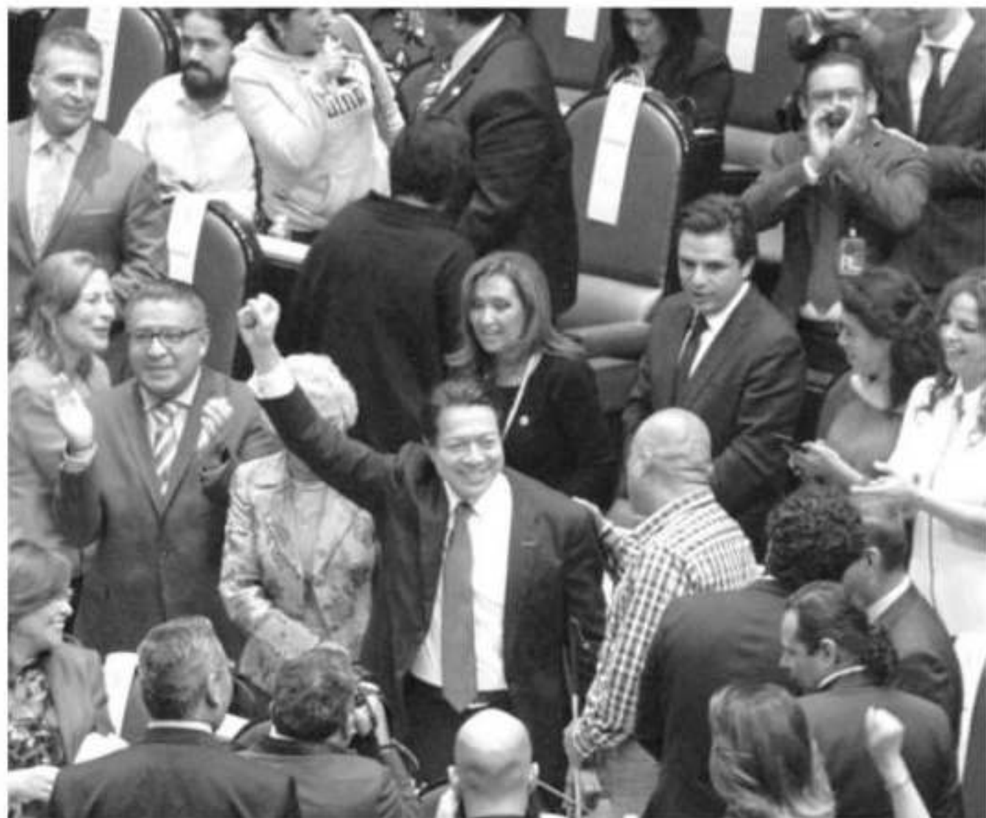
Los diputados federales de Morena, durante una sesión en San Lázaro.