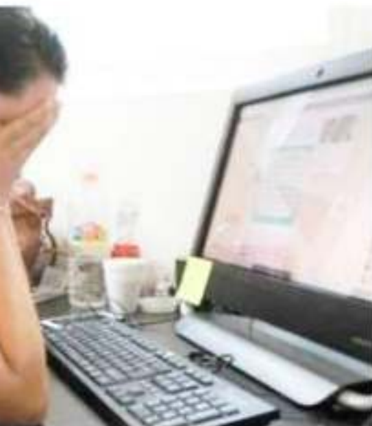
Michoacán se tienen detectados casos de... penal estatal aún contempla sanciones a... delitos.