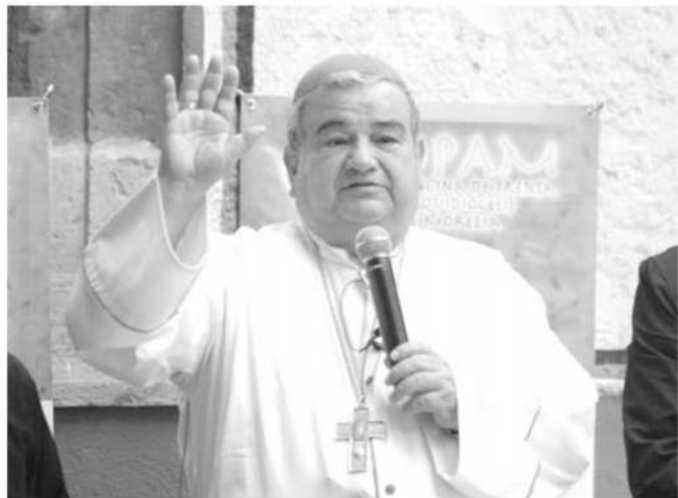
«Esperamos que los diputados tengan todos los elementos no estamos hablando solamente de criterio religioso... y ojalá que se puedan tomar las determinaciones puntuales», dijo el arzobispo de Morelia.

ia que religio- iciente una ini- ecordó errero, logra- yectos lo que ja ante una ley e a que uentan terrup-