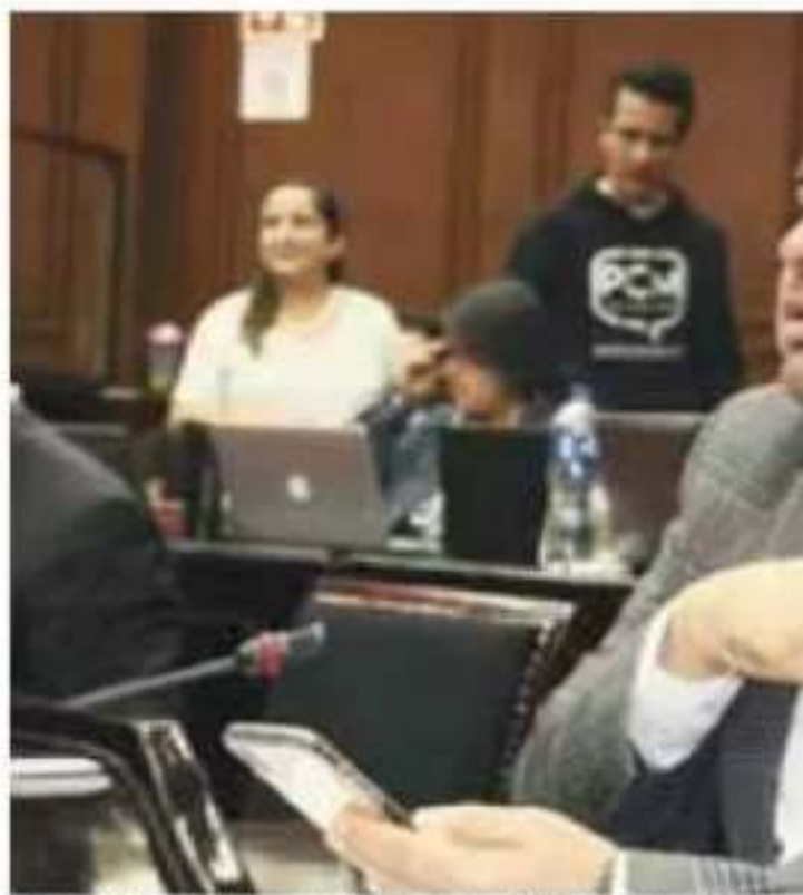
Por un lado se habla de voluntad para colaborar, y por otro, se le

El legislador del Partido de la Revolución Democrática señaló que en septiembre pasado, en el caso de Mi-