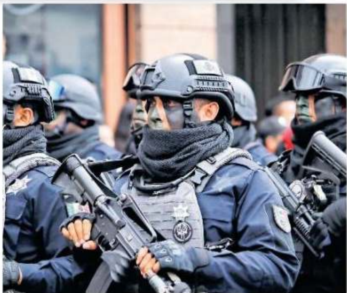
En 2018, la entidad tenía 11 mil 257 elementos policiales distribuidos en mil 395 en los centros de readaptación social

El gobierno del estado evengó poco más de pesos de los recursos ado al 31 de diciembre ue se pagaron el últi- el año en curso, por lo 5 mil pesos fueron secretaría de Finanzas 17 de enero del 2019 y ntregó a la Tesorería qués.