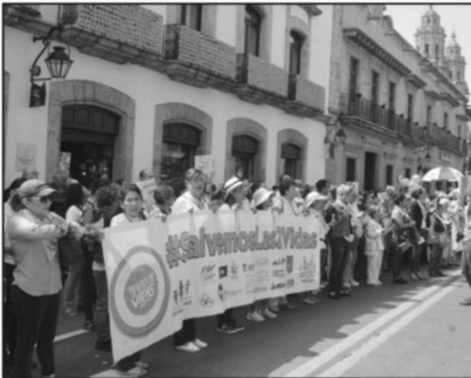
GRUPOS DE ACTIVISTAS LLAMADOS 'PRO VIDA' SE HAN MANIFESTADO A LAS AFUERAS DEL CONGRESO PARA EXIGIR QUE EL