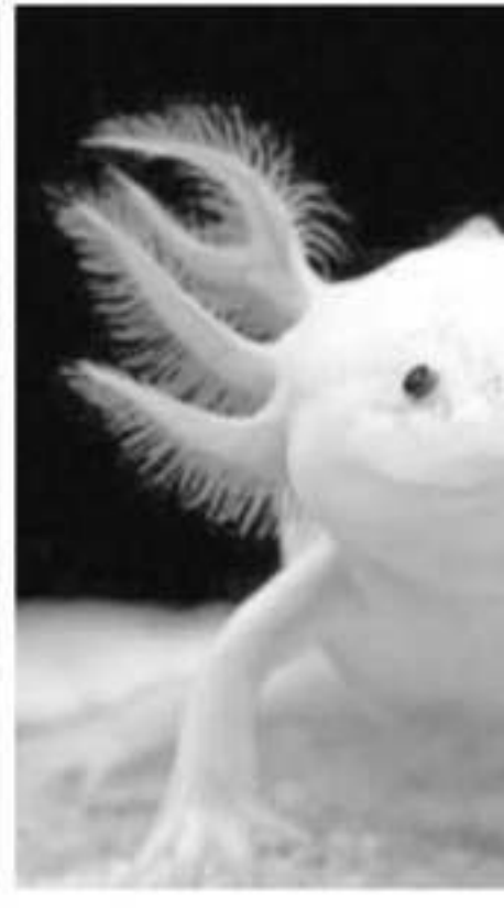
En México existen 17 especies de ajolotes y achoques, de las cuales cinco se encuentran en la entidad.

en las que vive el ajolote de arroyo de Mi- choacán.