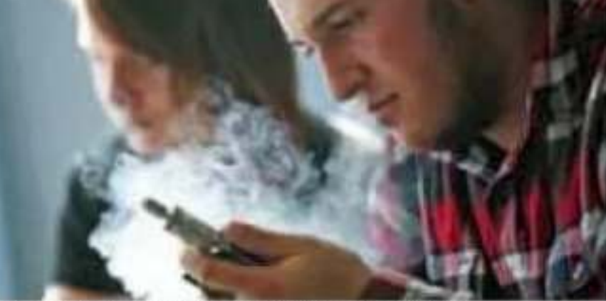
México existen casi 15 millones de fumadores.

son productos inofensivos que ayudan a dejar el tabaquismo, usan líquidos con cantidades de nicotina que podrían causar envenenamiento, alertó. Además, en Estados Unidos 10 personas murieron debido a que el dispositivo explotó en sus manos, expuso. NOTIMEX