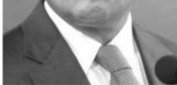
Silvano Aureoles Conejo.