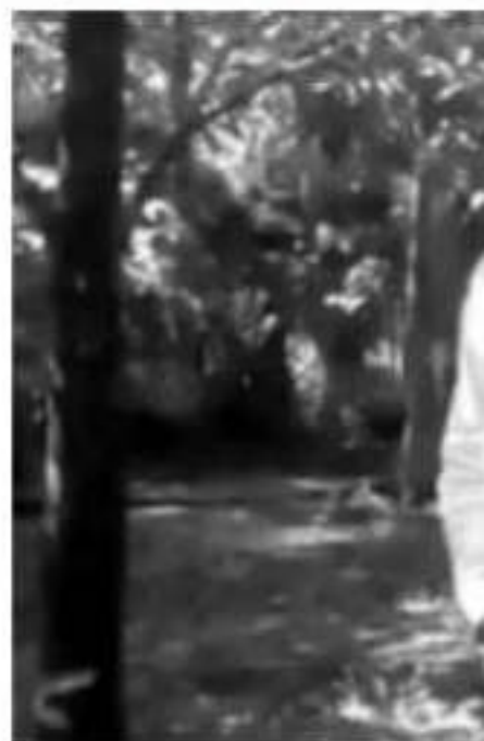
Su mensaje, enviado por m día después de que el mand asegurara que la transform respaldo de una mayoría lib legalidad que no permitirá con Madero FA.

Señaló que esto días de as flexionar sobre lo que está s mensaje, el Presidente de Mé co, a su residencia en Palacio