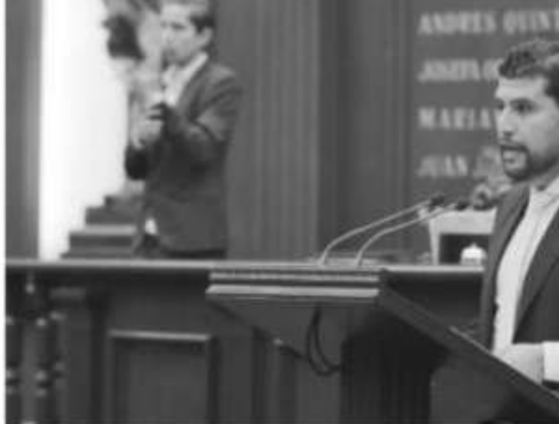
MORELIA, MICH.- El diputado por el Distrito de Huetamo refirió que una superficie autorizada de aprovechamiento forestal de 5.5 millones de hectáreas, genera un volumen de 140.1 millones de metros cúbicos en total.

Con acciones como estas se reafirma el compromiso con la educación ambien- tal, que promueve la administrar del Go- bernador Silvano Aureoles Conejo.