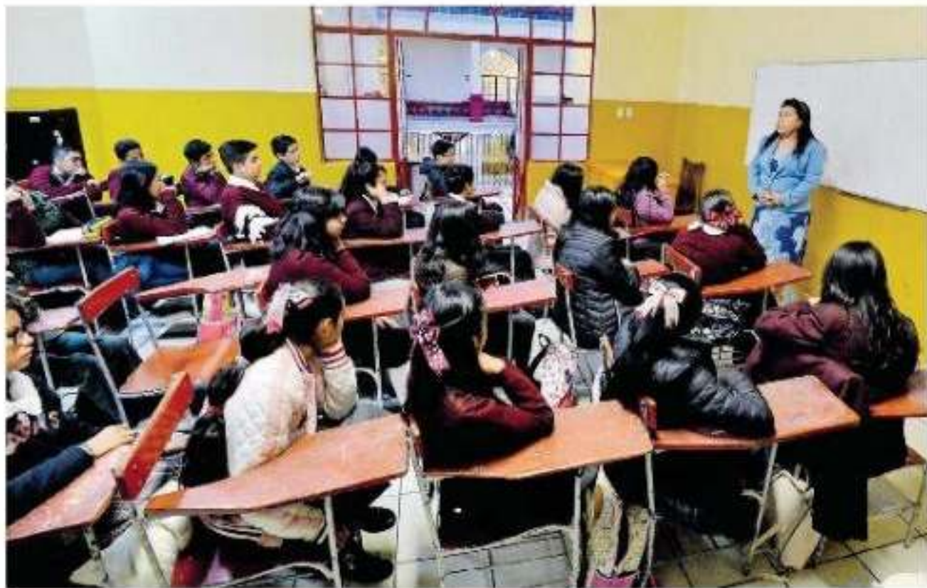
La falta de presupuestos es la razón principal que ha frenado el proceso

La Secretaría de Educación en el Estado no ha concluido con la conformación del proceso anual; lo que daría opción de contratar a egresados de las normales que buscan una plaza de trabajo