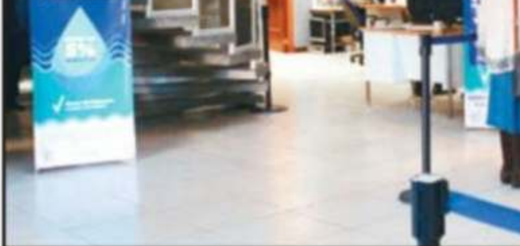
LA MEDIDA DE INCREMENTAR EL COSTO DE LA TARIFA DEL AGUA POTABLE ESTÁ

Cabe detallar que las comisiones sindicales son las licencias por las cuales un trabajador puede ausentarse de las labores para las que originalmente fue contratado, con el fin de cumplir acciones únicamente apegadas a su gremio. Es decir que, en este caso, se trata de una inversión de 3.5 millones de pesos para personal que no cumple con funciones de servicio a la ciudadanía, sino que está dedicada al Sindicato de Trabajadores del organismo (STAOOPAS).