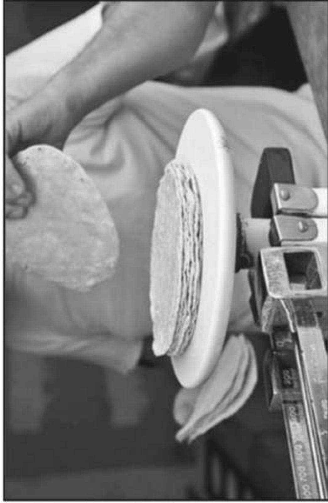
DESDE EL DÍA DE AYER, EL COSTO DEL KILO DE TORTILLAS ESTÁ ENTRE LOS 19 Y 21 PESOS EN EL MUNICIPIO DE JIQUILPAN.

ento de que a aportar su el rescate del os tortilleros un cobro