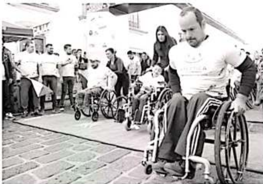
Las niñas, niños, adolescentes y jóvenes, representan el sector prioritario.

La Secretaría de Bienestar, Delegación Michoacán, pone a disposición la siguiente dirección y teléfonos de contacto para mayor información y dadas acerca del programa: Santos Degollado #262, colonia Nueva Chapultepec Sur, C.P. 58260, Morelia, Michoacán. Teléfono: 01 (443) 3149488 ext. 41410 Correo electrónico: azorra.miranda@bienestar.gob.mx