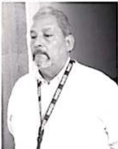
A nivel local se desplegarán alrededor de 700 entrevistadores, todos estarán debidamente uniformados, con chaleco, gorra y mochila azul, así como con una credencial.

«Todas las familias debemos estar confiadas, es importante que colaboren, que proporcionen todos sus datos sin ningún problema, toda la información que se les va a pedir es para fines estadísticos nada más», expresó el funcionario.