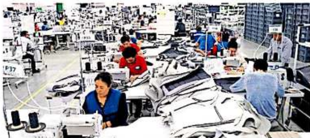
16 fábricas en el primer cuadro de Ciudad Industrial no cuentan con las regulaciones necesarias para operar.

Este operativo de inspección continúa en proceso luego de que en el mes de agosto pasado, dos fábricas de plásticos en Ciudad Industrial se incendiarán sin