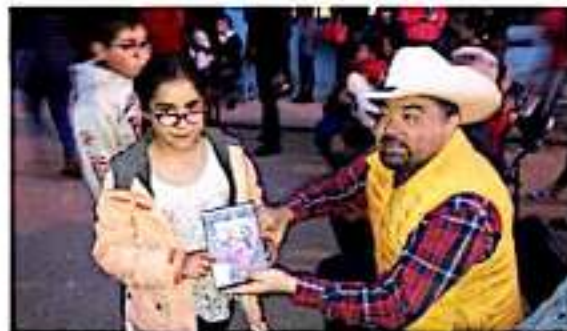
pueden pasar un rato agradable. "Decidimos traer y acercar el cine hasta las comunidades del Distrito