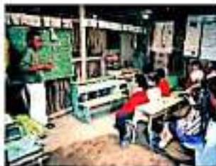
274 plazas se les ofertaron pero "con reglas del juego".

Preñó que tanto el adeudo como los recursos que profieren existieran en una siguiente etapa de jubilación con incentivos, han sido ya gestionados ante la Secretaría de Hacienda de Crédito Público (SHCIP) toda vez que en el estado hay cinco mil trabajadores, entre estatales y federales que son susceptibles de jubila-