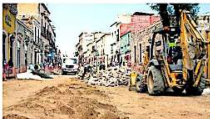
Se plantearán algunos ajustes en busca de destinar más recursos para la infraestructura municipal. ANED AYALA

"En un par de semanas está ya listo y presentado a los diputados locales (...) lo