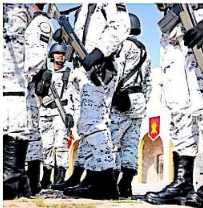
En algunos estados se ha reforzado el despliegue de las fuerzas militares. FERNÁNDO VALDERRAMÓN

De ahí que reconoció que, en los municipios michoacanos colindantes con entidades vecinas como Jalisco, Guerrero, Estado de México y recientemente en Guanajuato, es donde más se ha reforzado