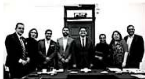
MORELIA, MICH.- Las Comisiones Unidas de Programación, Presupuesto y Cuenta Pública y de Hacienda y Deuda Pública, instalaron sesión permanente para la revisión de todas las iniciativas que les fueron turnadas por el Pleno legislativo.

De lo anterior, acordaron que a partir de esta semana se trabajará de manera permanente, con la disposición de avanzar en la discusión y el análisis puntual sobre los rubros que requieren mayor respaldo, procurando así una distribución equitativa y suficiente del censo público para el próximo año.