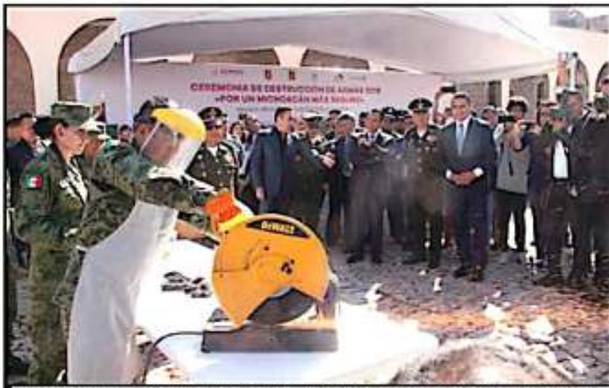
EL GOBERNADOR DEL ESTADO, SELVANO ARIALES CONEJO, EN CABEZA LA DESTRUCCIÓN DE ARSENAL EN LA XXI ZONA MILITAR.