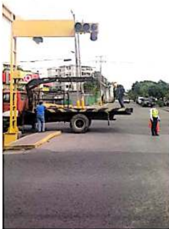
CD. LAZARO CÁRDENAS, MICH.- Desde el inicio de la semana y para mantenerlos en óptimo estado, personal de Tránsito del Estado realiza el mantenimiento de los semáforos de la ciudad.

En lo que resta de esta semana los demás semáforos que se encuentran en diversos puntos de la ciudad serán reparados por dichos elementos de vialidad.