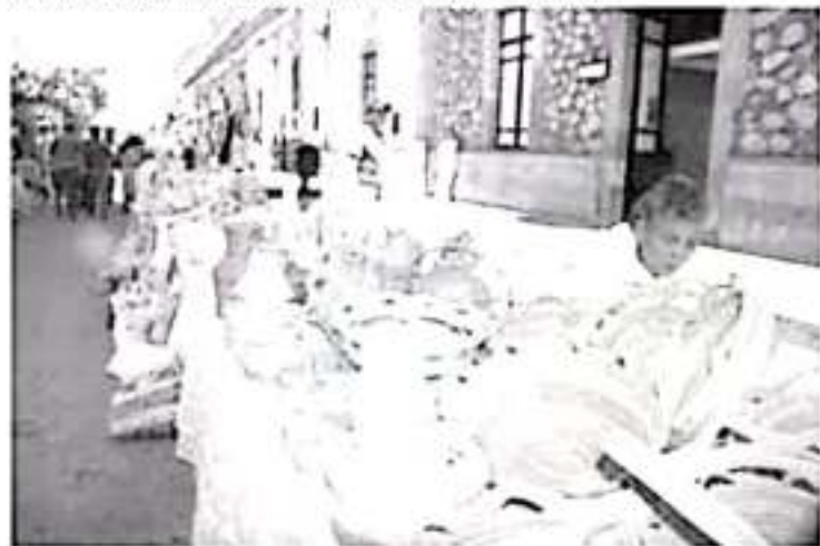
Convocan a la autoridad a reconsiderar dicha decisión, y darles la oportunidad de tener un espacio donde vender, sus familias de esta manera.

Convocó a la autoridad a reconsiderar dicha decisión, y darles la oportunidad de tener un espacio donde vender, sobre todo porque las fiestas de fin de año son la mejor temporada para ellos, ya que muchas personas visitan esta parte de Michoacán.