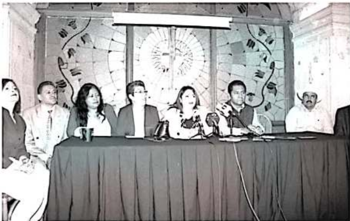
Alcaldes de Morena y del Partido del Trabajo exigen al gobierno estatal el pago de adeudos del Fondo de Aportaciones Estatales para la Infraestructura de los Servicios Públicos Municipales del ejercicio fiscal 2019.