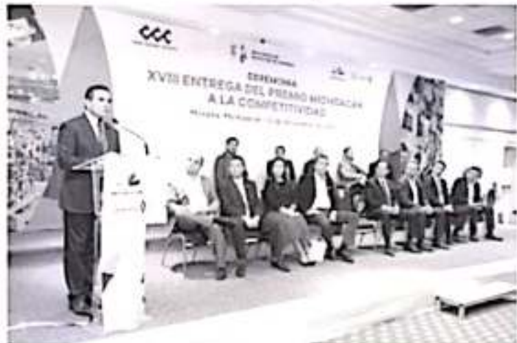
Aureoles Conejo garantizó que durante su gobierno los emprendedores, pequeños, medianos y grandes empresarios tendrán todo el respaldo para volver competitivas sus empresas.