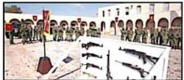
TODO TIPO DE ARMAMENTO ES EL QUE SE DECOMISA AL CRIMEN ORGANIZADO.