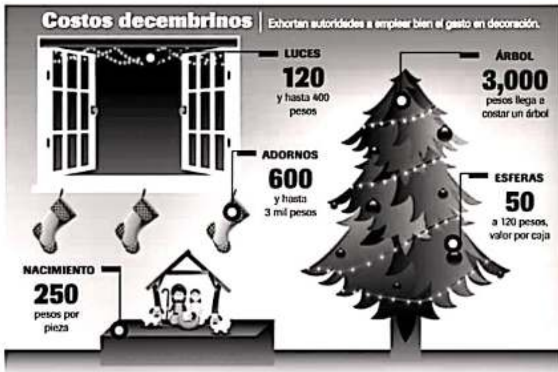
ILUSTRACIÓN: INI UMA UN-SULLA VOZ DE TROKUCAN