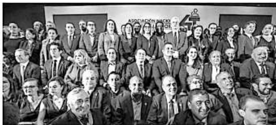
Esta asociación permitirá generar una agenda legislativa con objetivos comunes orientado al bienestar de las mexicanas y los mexicanos.

Esta asociación tiene por objetivo implementar las políticas impulsadas por la cuarta transfor-