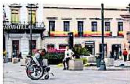
El 59 por ciento de las personas con discapacidad en Michoacán han sido discriminadas.

Asimismo, a severo que éste es un tema de derechos humanos que debería ser prioridad en las agendas de los tres niveles de gobierno, sin embargo existe una cultura de indiferencia de parte de las instituciones, la cual indicó "se ve reflejada en los presupuestos que se están por