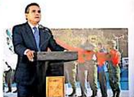
Michoacán es el noveno lugar de la escala nacional en incidencia delictiva e inseguridad. FERNÁNDO VALDERRAMÓN

No obstante, y aunque el mandatario estatal argumentó que si se levanta temprano todos los días, reconoció que no siempre tiene tiempo de acudir a las reuniones programadas con autoridades federales, toda vez que cuestionó la efectividad de ésta en la materia, pues este año ha crecido la inseguridad, se dijo. Incluso aseguró que en Michoacán se reúnen cada