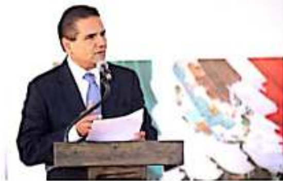
MORELIA, MICH.- Encabeza gobernador Ceremonia de Destrucción de Armas 2019, "Por un Michoacán Más Seguro".