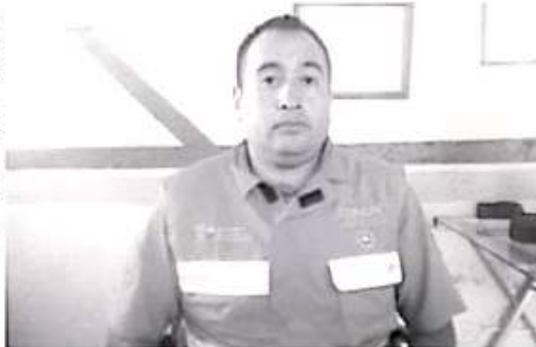
Las zonas más frías en las comunidades del municipio de Zitácuaro son: Lomas de Aparicio, Crescencio Morales, Francisco Serrate, Nicolás Romero, por ser áreas boscosas.

Por el momento y para precisar las acciones a seguir, añadió que con apoyo de los municipios se levantan censos de la localización de las comunidades en riesgo así como el número de familias para comenzar con la etapa de monitoreo y gestionar recursos para en caso de que se requiera.