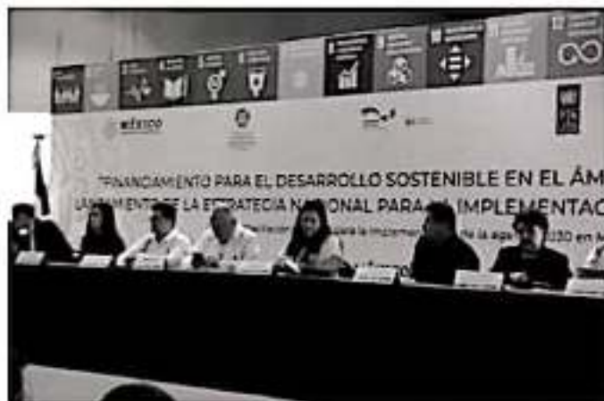
VILLAHERMOSA, TAB.- Michoacán participa en la IV sesión de capacitación "Financiamiento de la Agenda 2030 en el ámbito subnacional", que se celebra en Villahermosa, Tabasco.