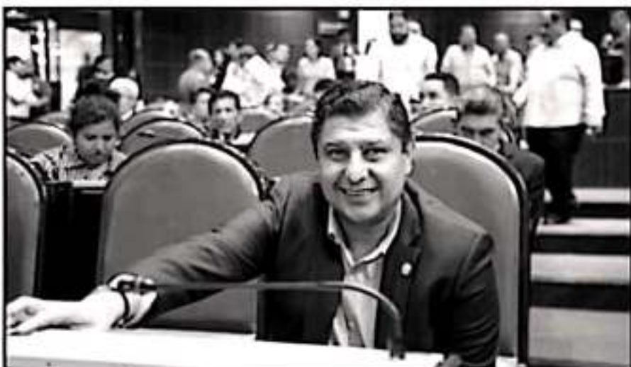
EL DIPUTADO FEDERAL IGNACIO CAMPOS, SEÑALÓ QUE SE INVERTIRÁN MILLONES DE PESOS EN OBRAS EN EL ESTADO.