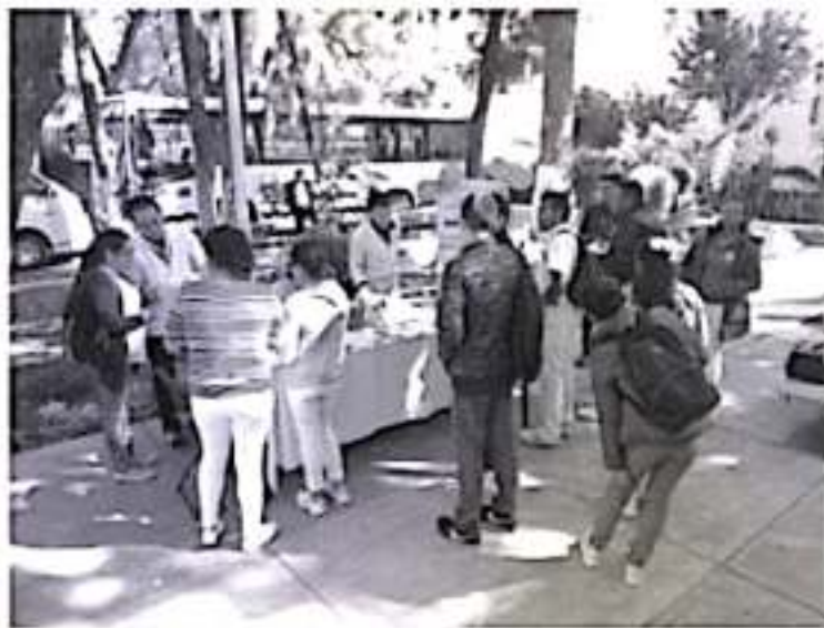
El Gobierno de Michoacán, a través de la SSM, trabaja en coordinación con la federación para garantizar su tratamiento, cuidado y seguimiento, y que esa atención se brinde de corazón y con calidad.

La SSM, exhorta a las y los michoacanos a que ayuden a realizarse la prueba rápida, a efecto de detectar el padecimiento de manera oportuna y garantizar así una mejor calidad de vida.