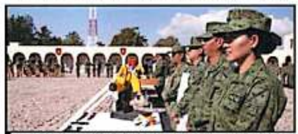
EN UNA CEREMONIA, SE REALIZÓ LA DESTRUCCIÓN DE ARMAS CONFISCADAS.