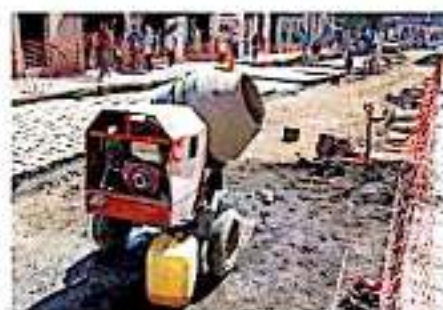
Sólo les había entregado entre 30 y 40 por ciento del total de las aportaciones (CÉSAR ABREGO)

Sin embargo, Herrera Tello argumentó que dicha situación no obedece a falta de atención del gobierno estatal sino a que el mismo gobierno federal pudo no haber cumplido con la meta de recaudación planteada, el incremento en el precio del dólar o disminución del petróleo y, por ende, destinó menos recursos a las entidades, impactando a los municipios.