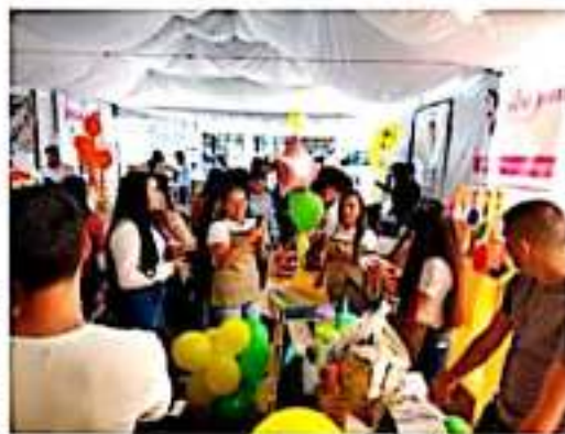
URUAPAN, MICH.- Desarrollo del VII Tianguis de Agromarketing, que tuvo sede en las instalaciones de la Facultad de Agrobiología "Presidente Juárez".

Resultado de este evento, comentó por último la académica, diversas empresas locales se acercaron para ofrecer puntos de venta en sus establecimientos y una certificadora orgánica mostró interés en apoyar el proceso de certificación de varias propuestas.