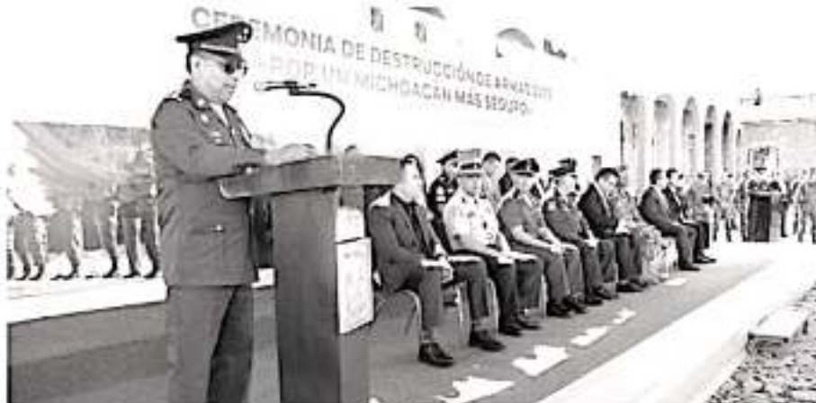
Con un llamado a erradicar el paso a la violencia y a los instrumentos que generan afición a ella, el Gobernador de Michoacán, Silvano Aureoles Conejo encabezó la Ceremonia de Destrucción de Armas 2019, "Por un Michoacán Más Seguro".

Indicó que la posesión y tráfico de armas son temas preocupantes que requieren atención integral y participación de los más altos niveles de gobierno, para evitar que grupos delincuenciales tengan mayor capacidad de fuego y cometan delitos.