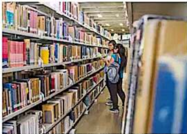
Dentro de las conclusiones de la prueba se destaca que 15% de los estudiantes mexicanos alcanzaron aprendizaje suficiente en lectura, 44% en matemáticas y 52% en ciencias.

Y es que en el estudio, que evalúa las competencias de los estudiantes en lectura, matemáticas y ciencias, se revela que los siete mil 299 estudiantes que participaron, de 286 escuelas en las 32 entidades, obtuvieron un ren-