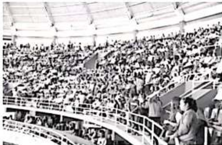
La organización que se ha tenido en Michoacán en el marco de este Campeonato Nacional en donde se han abierto las puertas para todas las familias charras del país y de Estados Unidos.

Finalmente, destacó que durante este 75 Congreso y Campeonato Nacional, es donde más reconocimientos se han entregado a personalidades que de verdad se lo merecen, "personas que realmente hicieron y nos han dado nombre a la charra, y que nos han heredado un legado", concluyó.