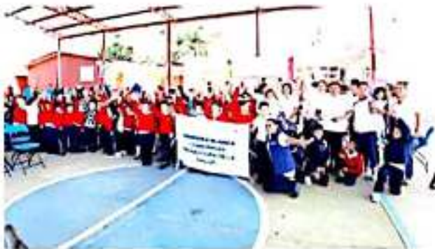
XHÁNIRO, MPIO. DE TINGÜINDÍN, MICH.- Esta localidad fue certificada como Comunidad Promotora de la Salud.

Por su parte, el alcalde destacó el interés de su administración municipal