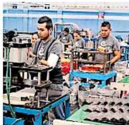
Los impuestos ecológicos no compensarán el daño o equilibrio ecológico, señalan expertos.

medo Castillo. Detallaron que de aprobarse la ley de ingresos para el ejercicio fiscal del próximo año 2020, habrá dos momentos en que el ciudadano o contribuyente podrá recurrir al amparo: en los primeros 30 días en que entre en vigor el decreto aprobado y 15 días después de la aplicación de la ley.