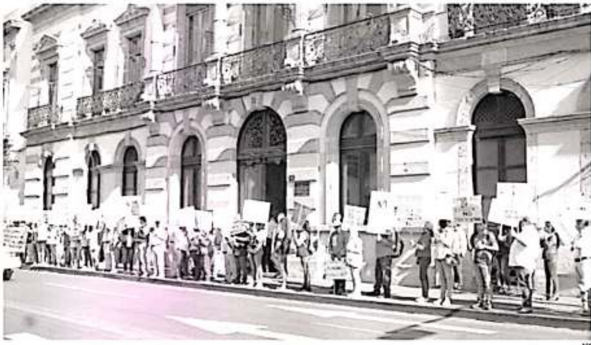
La extinción de la Junta de Caminos deja desamparadas a 400 familias, dijo la coordinadora parlamentaria de Morena.

cionalidad se requiere el respaldo de catorce de los diputados locales. Morena tiene doce y se sumará el Partido del Trabajo que tiene cuatro, por lo que hay confianza en que este procedimiento avanzará sin problemas.