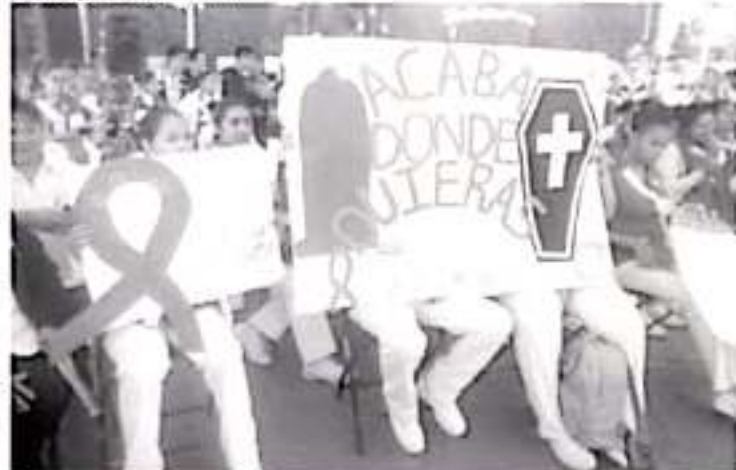
Las principales formas de contagio son mediante el contacto sexual, al compartir jeringas, y perinatal, es decir de la mamá a su bebé cuando está embarazada.

La prueba para la detección del VIH SIDA está disponible en todos los Centros de Salud y es completamente gratuita, se la deben realizar aquellas personas que se consideran en riesgo al tener más de una pareja, también las mujeres que están embarazadas porque pueden contagiar al bebé que viene en camino.