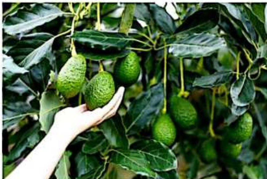
URUAPAN, MICH.- El Congreso Nacional Sistema Producto Aguacate, inicia hoy y concluirá el 6 de diciembre.