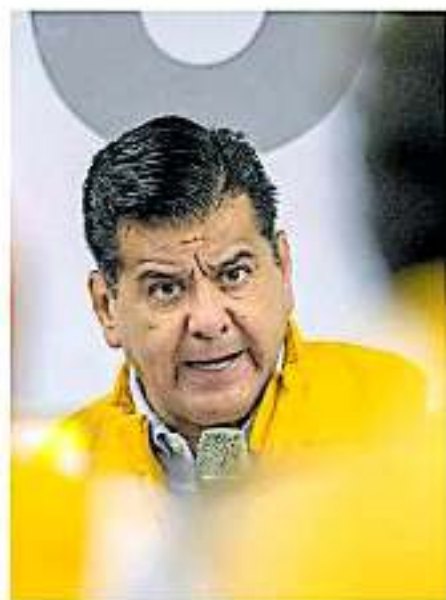
Sobre la militancia del PRD en Michoacán, el líder estatal afirmó que “han crecido” asoman

“En afiliados hemos crecido, en los últimos meses el PRD ha marcado agenda, ha estado en los temas políticos importantes del estado, tenemos que ser muy