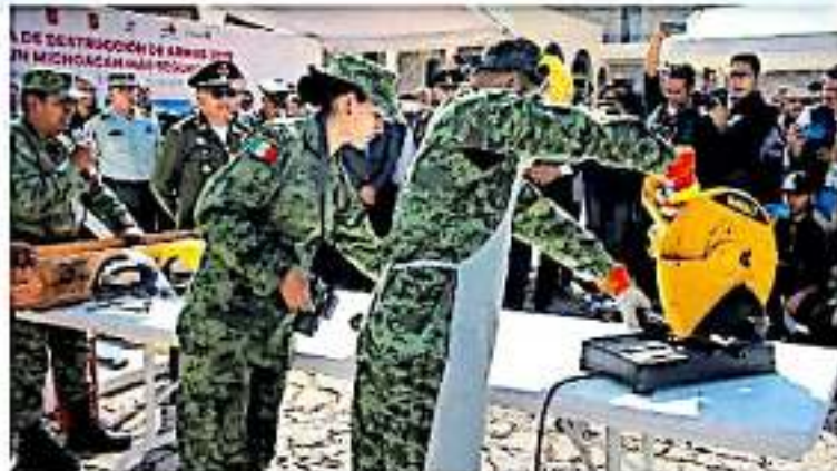
Se destruyeron alrededor de mil 72 armas de fuego donadas y decomisadas por la Secretaría

Esta situación permite que lleguen miles de armas que muchas de la mayoría acaban en manos de grupos delincuenciales, no sólo quien tiene acceso por estas o la familia que quiere tenerlas en su casa para la defensa, sino