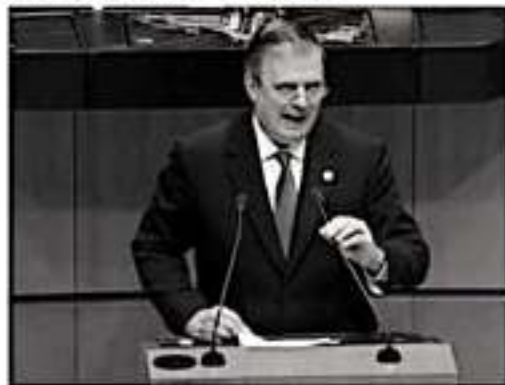
El canciller Marcelo Ebrard en el Senado.

El titular de la SRE recibió el permiso para asistir ante el Senado mexicano el pasado 1 de octubre, pero su comparecencia se pospuso debido a la hospitalización y fallecimiento de su padre.