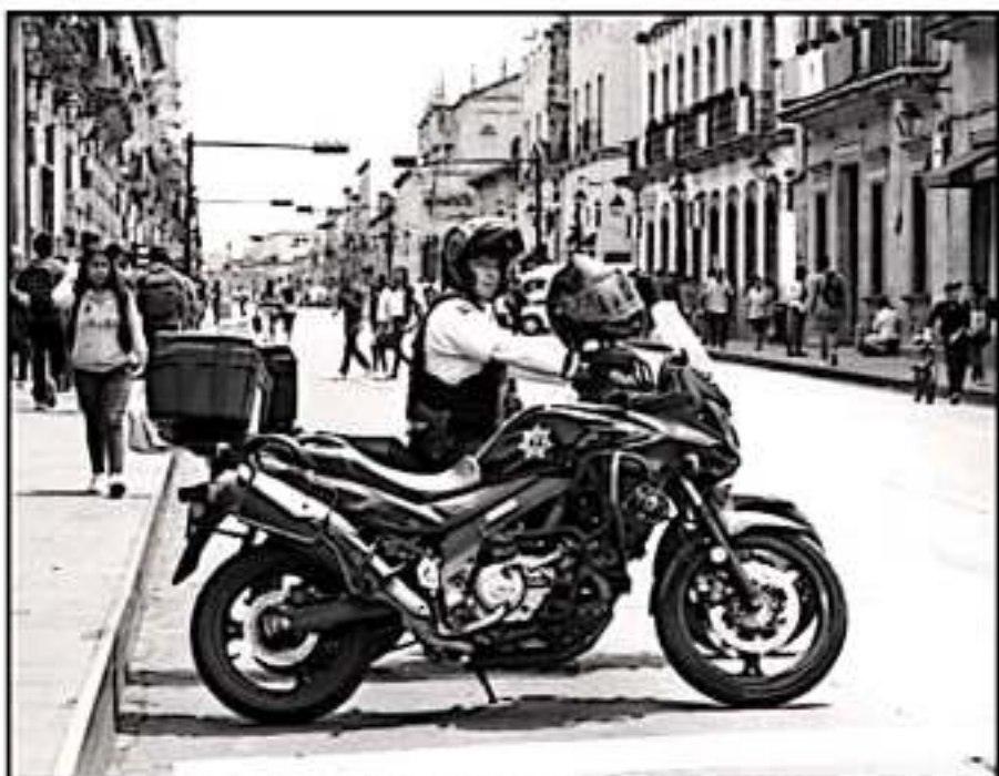
LA POLICÍA MUNICIPAL TENDRÁ MAYOR RESPALDO PARA ENFRENTAR LA ELEVADA TASA DE VIOLENCIA EN MORELIA.

Al ser cuestionada por medios de comunicación sobre si se estaría dejando de lado al Gobierno Estatal e instancias de