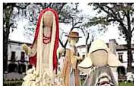
Por cuarto año se celebra el Nacimiento en la plaza Vasco de Quiroga. (COMPRO)