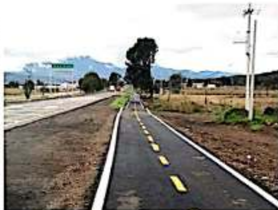
MORELIA, MICH.- La ciclopista Morelia-Pátzcuaro, entre las localidades de Uruapilla y Santiago Undameo, registra un 95 por ciento de avance en su construcción.

A inicios de 2018, el mandatario Aureoles Conejo entregó a la ciudadanía la primera etapa de esta vía exclusiva para ciclistas, que construyó con 23.8 millones de pesos entre la capital michoacana y Uruapilla, paralelamente a la antigua carretera libre Morelia-Pátzcuaro, interviniendo una distancia de 9.8 kilómetros.