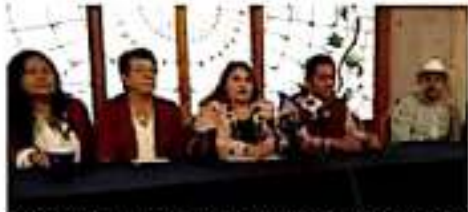
Los ediles aseguran que los recursos se piden a fin de ser entregados antes del 31 de diciembre. JOSEFINA MORALES

Los municipios afectados son Aporo, Buenavista,