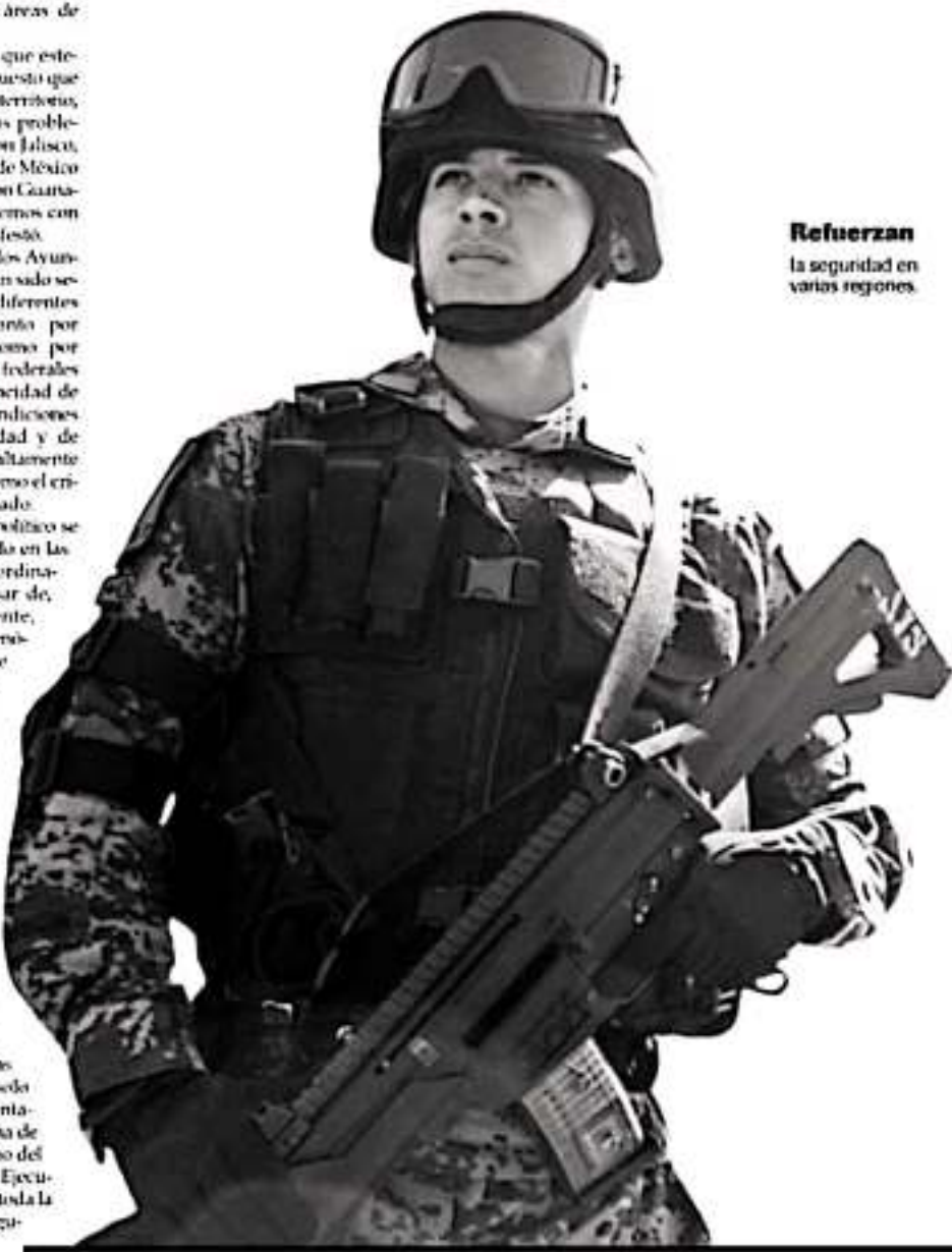
Refuerzan la seguridad en varias regiones.

75% MICHOACANOS dice sentirse inseguro hoy día