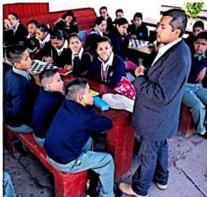
Se trata de un sistema de pago de salarios similar al que se maneja a nivel federal.

Dijo que el hecho de que no todo el personal aparezca en la foto no significa que habrá quienes quedarán fuera de revisión