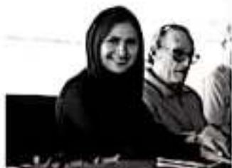
MORELIA, MICH.- La coordinadora del Grupo Parlamentario del Partido de la Revolución Democrática (PRD), Araceli Saucedo Reyes, presentará una iniciativa en la que propone la creación del Parlamento de Mujeres del Estado de Michoacán.

La líder de la bancada perredista, dijo, en el PRD estamos comprometidos con las causas de la gente, bienvenidas sean las propuestas ciudadanas que busquen mejorar las condiciones de vida de nosotras las mujeres.