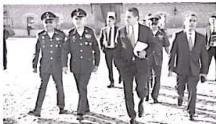
En estos cuatro años hemos logrado avances importantes, como el abatimiento de delitos de alto impacto, el fortalecimiento de la infraestructura y del Estado de Fuerza.