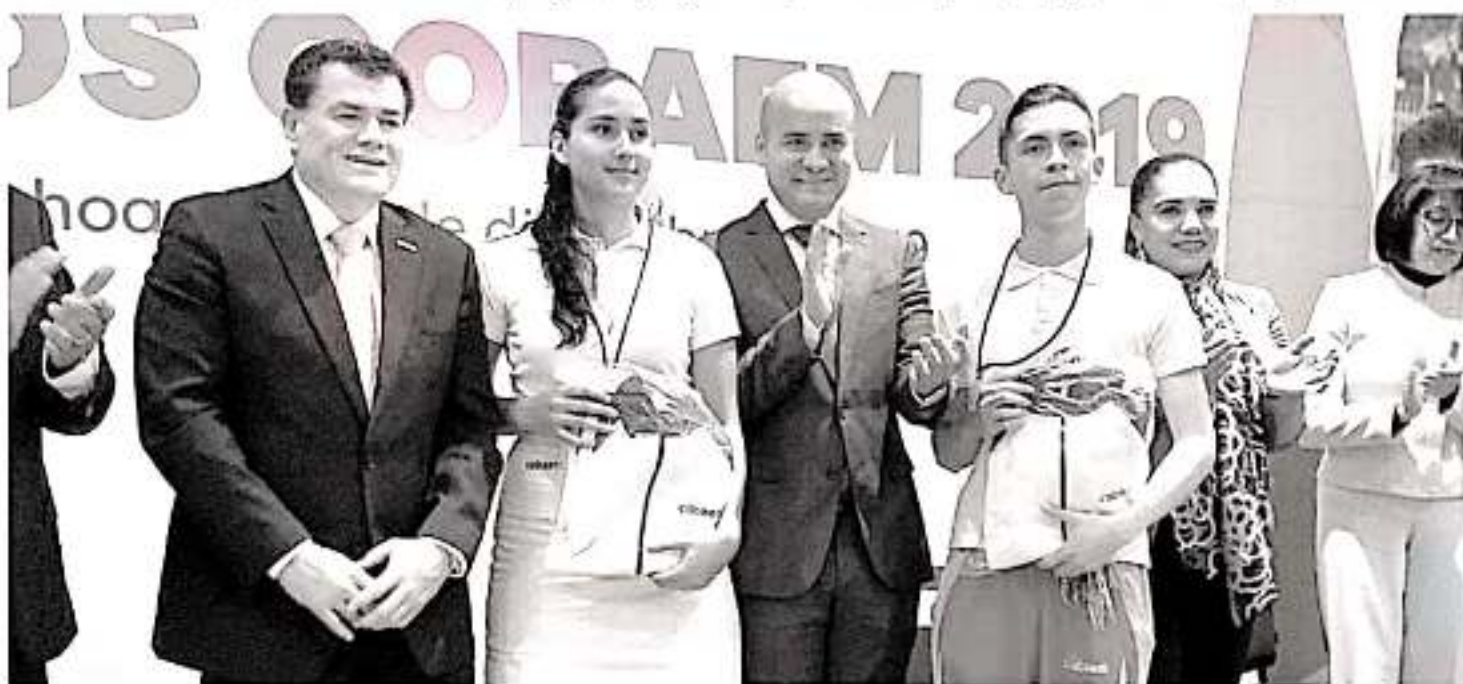
Se hizo entrega de apoyos e incentivos a 200 estudiantes con alto nivel de aprovechamiento, así como a ganadores de competencias nacionales e internacionales.

Es de señalar que a esta fiesta cívica se convocó a quienes obtuvieron calificación de 10 en la generación 2016-2019, distinguidos con la preseña Morelos Bachiller; así como a las y los 140 alumnos de mayor promedio de los 98 planteles, al estudiante condecorado con medalla de bronce en la olimpiada nacional de matemáticas, a quienes destacaron a nivel estatal en prototipos; así como a ganadores estatales en deportes y al equipo «Ciclo Verde», del plantel Tacámbaro, campeones internacionales de Emprendedores y Empresarios quienes ganaron sobre once países en Punta Cana, República Dominicana.