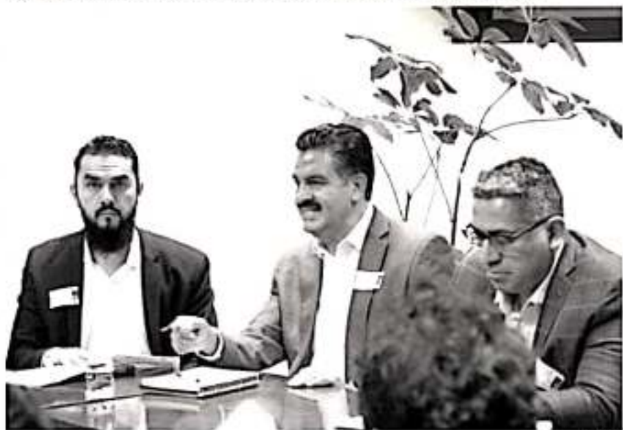
Gestiona gobierno de Michoacán más de 842 millones 537 mil pesos para infraestructura vial en Morelia con lo que se busca mejorar la movilidad intraurbana, lo que se traduce en beneficios para las poblaciones humanas y el medio ambiente: Semacdet.