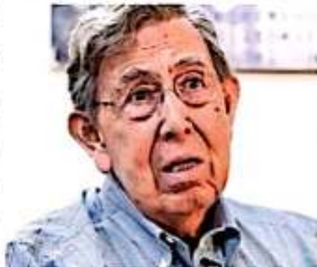
Ciudad de México.- El exgobernador de Michoacán, Cuahtémoc Cárdenas Solórzano, en entrevista, dio su punto de vista sobre la situación actual del país.

R. Si en Chile o en Colombia se están dando estos estallidos de carácter social por las desigualdades, por la falta de oportunidades, quiero pensar que en México la gente está expectante, todavía con la esperanza de que se den los cambios que no se han dado. Espero que no tengamos que llegar al estallido social para ello. Como se suele decir, si ves las barbas del vecino cortar, pon las tuyas a remojar.