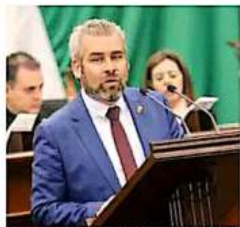
El diputado señaló que 11 estados que no cuentan con ello organizan...

El gobierno estatal decretó la creación de la Comisión de Búsqueda de Personas como un órgano desconcentrado de la Secretaría de Gobierno, con autonomía técnica,