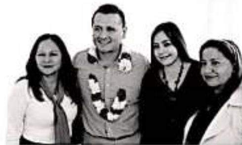
CIUDAD DE MÉXICO. Este martes, el pleno de la Cámara de Diputados aprobó por unanimidad la reforma para cerrar la brecha salarial entre mujeres y hombres en México.