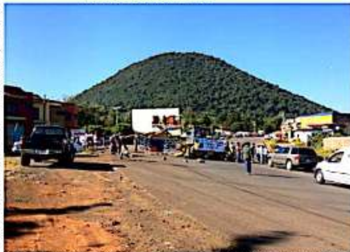
SANTIAGO TANGANMANDAPIO, MICH.- La Cantera, demanda a las autoridades municipales, 13 mdp para obras y acciones a favor de los vecinos.

aquí tenemos un convenio, en el cual él se comprometería a entregarnos ese recurso, para nosotros administrarlo, lógicamente sabemos las dificultades que serían para administrarlo, pero lo vamos a ejercer bajos las reglas de operación que deben de ser".