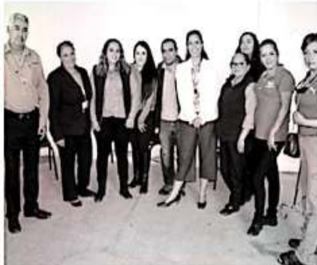
URUAPAN, MICH.- En las instalaciones de la SSPTYVM, personal de la Dirección de Prevención Social y Participación Social recibieron taller de capacitación sobre Violencia de Género