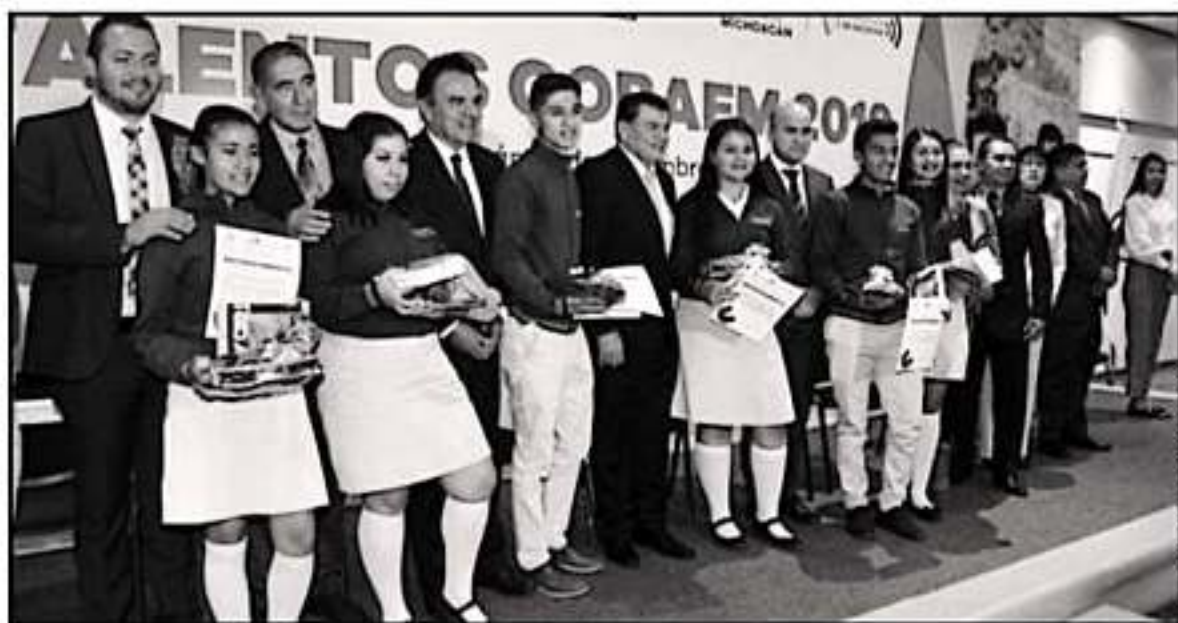
AUTORIDADES EDUCATIVAS Y DIRECTIVOS DEL COBAEM EXHIBIERON A LOS JÓVENES GALARDONADOS A MANTENER SU COMPROMISO CON LOS ESTUDIOS.

EFICIENCIA terminal, la meta para el año 2021