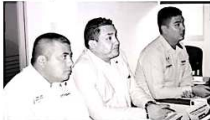
URUAPAN, MICH.- Tras la aprobación del Programa Operativo Anual (POA), se estableció el gran compromiso de mejorar el servicio que Capasu brinda a la ciudadanía y asegurar el abastecimiento del vital líquido en este municipio.

La Junta de Gobierno habrá de solicitar al Cabildo, autorización para su publicación en el Diario Oficial del Estado.