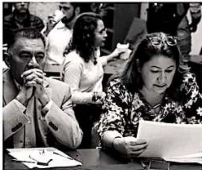
MORELIA, MICH. Ha quedado aprobada en comisiones la convocatoria para elegir al Comisionado del Instituto Michoacano de Transparencia.

Portillo Ayala concluyó diciendo que la convocatoria prevé un período de recepción de solicitudes de aspirantes del 8 al 11 de diciembre en la Secretaría de Servicios Parlamentarios del Congreso del Estado y señaló que el procedimiento será estricto epego a los principios legales de equidad y transparencia. "Fortaleceremos a este Instituto desde la designación de su nuevo comisionado", subrayó.