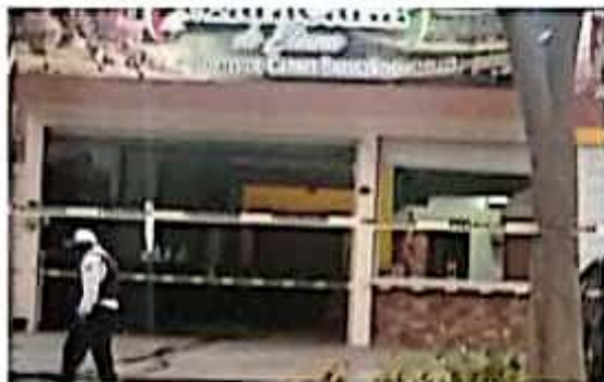
Por la tarde de ayer en Uruapan, civiles armados ingresaron al restaurante Maracaná y ejecutaron a balazos a su propietario.

Más tarde acudió el personal de la Fiscalía que se ha encargado de realizar las investigaciones en relación al crimen de la víctima y trasladaron su cadáver al Semefo local.