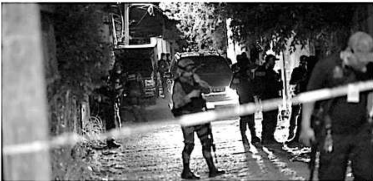
Al momento todas las víctimas se encuentran en calidad de desconocidas.

Previamente, una pareja fue asesinada y una mujer apareció sin vida en la colonia Quinceo.