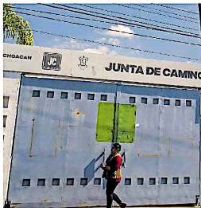
Son alrededor de 33 millones de pesos los que se adeudan a los empleados de la JC.