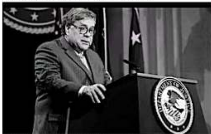
El fiscal general estadounidense William Barr.

hasta el momento se han hecho 52 aseguramientos en transporte de carga, a los que les hicieron modificaciones para poder meter las armas y el dinero ahí. Detalló que el presidente López Obrador les instruyó a cambiar los puestos de revisión, de sur a norte, para que, sin dejar de vigilar que la droga no salga, se verifique que no entren armas, y afirmó que han tenido más resultados.