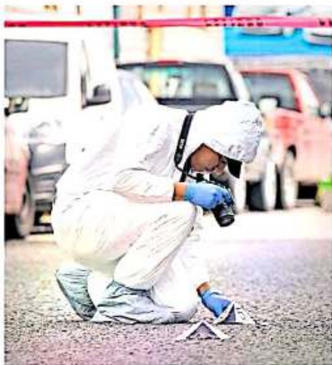
Durante las primeras horas de ayer, un hombre fue atacado a balazos por sujetos que conducían un vehículo marca Nissan arrojado