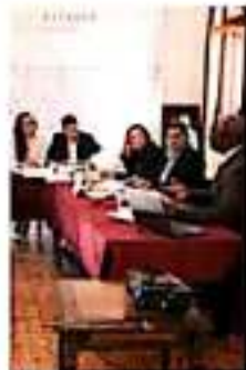
Al momento, 21 perfiles comparecieron ante los diputados. CORTINA

Aún no hay fecha para definir y votar la terna. Al concluir las comparecencias, la presidenta de la Comisión de Derechos Humanos,