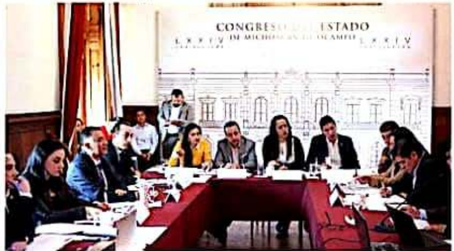
El día de ayer ante las comisiones unidas de Derechos Humanos y de Justicia del Congreso del estado, comparecieron los aspirantes a ocupar la presidencia de la CEDH.