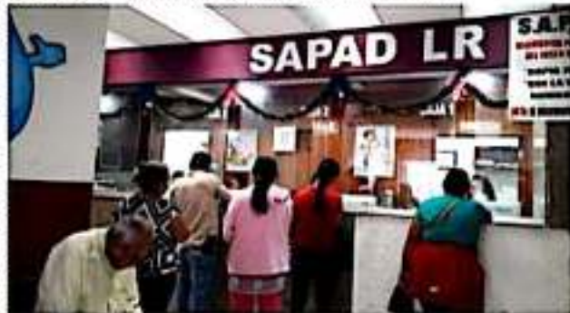
LOS REYES, MICH.- El Sapad condonará multas y recargos hasta en un 100 por ciento, durante diciembre.

Finalmente el director del Sapad invitó a la ciudadanía a reportar cualquier fuga o desperfecto: "así iremos avanzando para un mejor control y cuidado del agua, emprenderemos una gran campaña para cuidar el vital líquido de cara a la temporada de estaje, pero también es importante que reporten por teléfono o directamente en la oficina para poder atender con prontitud, estamos de las 9 a las 3 de la tarde en la oficina y de las 8 a las 3 en el Centro de Trabajo, pueden acudir directamente o llamarnos al teléfono 542 57 00", concluyó.