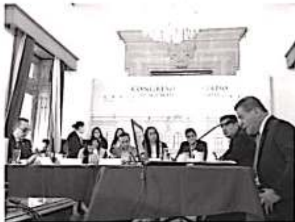
Aspecto de una de las comparencias de los aspirantes a presidir la Comisión Estatal de Derechos Humanos.

a ocupar el cargo se registraron a la contienda 27 candidatos, de los cuales 21 comparecieron el día de ayer ante la Comisión Unida de Derechos Humanos y de Justicia del Congreso del Estado de Michoacán. De estos postulantes, tres serán elegidos para conformar la terna de los aspirantes al cargo que serán votados en el pleno del Congreso del Estado para culminar así con este proceso de elección del nuevo Ombudsman Michoacano.