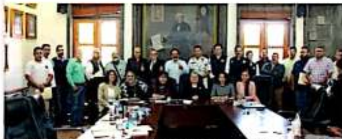
ZAMORA, MICH.- En sala de Cabildo fue conformado el Comité de Apoyo al Censo de Población y Vivienda 2020 región Zamora, del Instituto Nacional de Estadística y Geografía (Inegi).

El censo presentará 2 formatos de entrevista, uno de 38 preguntas que es el básico, y uno extendido al que se suman 65 cuestionamientos, mismo que en Zamora será realizado por 285 encuestadores perfectamente bien identificados, con gorro, chaleco y gafete, quienes llegarán a 88 mil inmuebles; y a una población aproximada de 196 mil personas; la convocatoria de reclutamiento para los encuestadores será presentada en los próximos días.