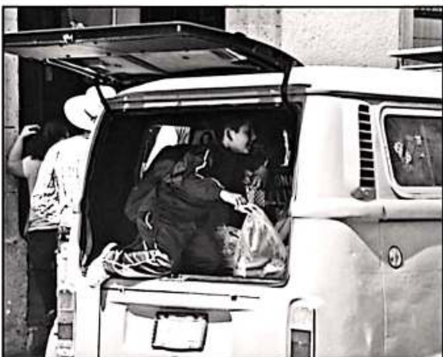
HAY UNIDADES QUE NO TIENEN LAS CONDICIONES NECESARIAS PARA LLEVAR ESTUDIANTES O NO RESPETAN NORMAS

3 INFANTES llegan a ir en el asiento de copiloto