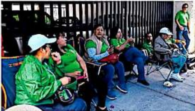
En próximas fechas nuevamente se reunirán con el gobierno estatal