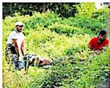
Se acordó llevar a cabo una nueva estrategia de seguridad con mayor efectividad en esa

En coordinación con diferentes mandos de seguridad se busca identificar posibles causas de seguridad, a manera para el tráfico de drogas y de armas, así como sedes de grupos delincuenciales que tengan intenciones de instalarse en la ciudad de Morelia.