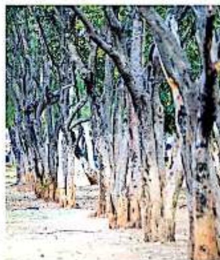
Se busca resarcir el daño a través de la capacitación a la ciudadanía en la plantación de árboles. Van Arvizu

SE HA corroborado que únicamente 180 de 302 colonias en Morelia cuentan con árboles de cualquier tipo