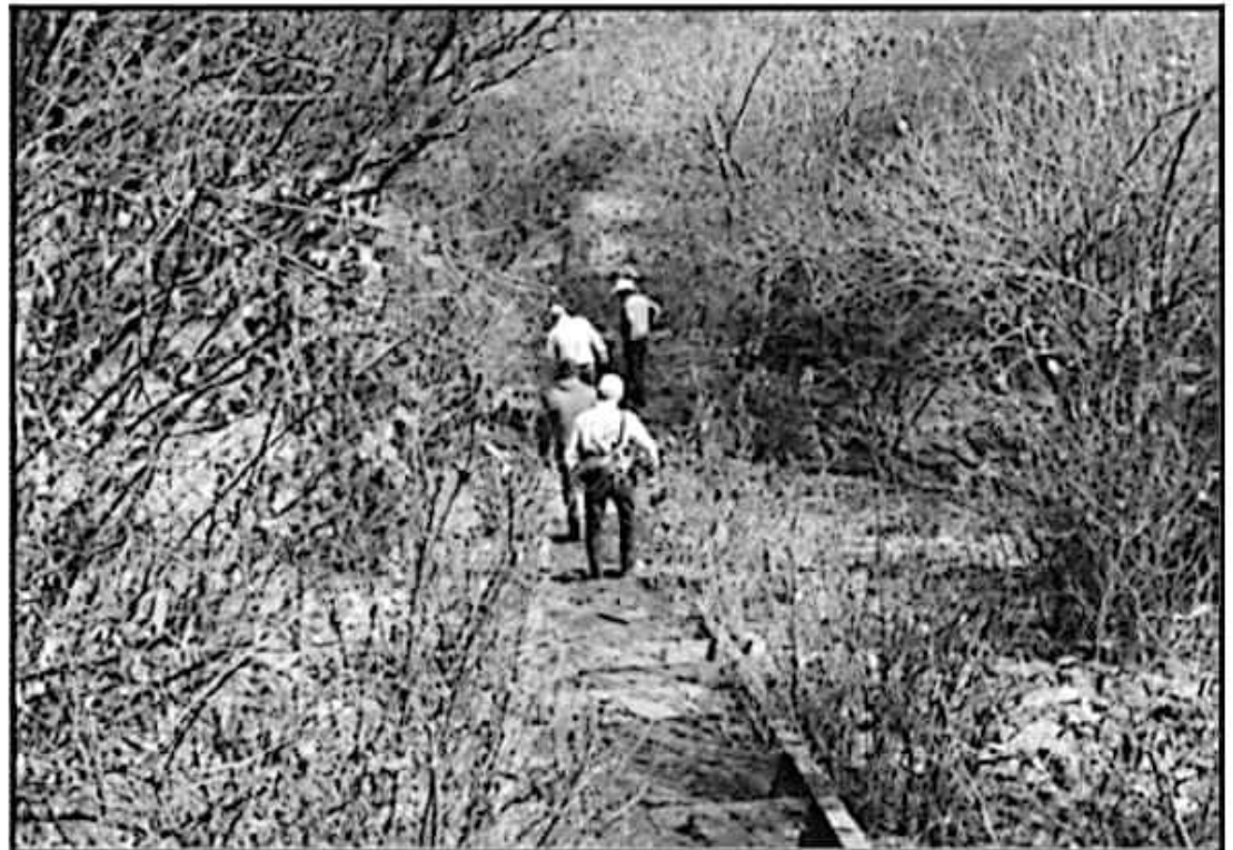
CON APOYO MUNICIPAL, EL AGUA DE LAS PRESAS PODRÁ SER UTILIZADO PARA EL RIEGO DE DECENAS DE HECTÁREAS.

Sin embargo, ante el panorama actual por la sequía registrada este año, productores agrícolas de ambas comunidades, apoyados por el gobierno municipal a través de Fomento Agropecuario obtuvieron la autorización de la Comisión Nacional del Agua (Conagua), para la utilización del agua de las presas para uso agrícola.