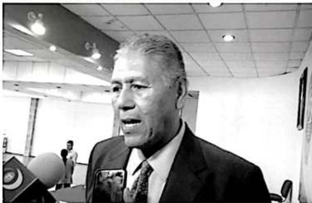
«Hemos detectado que en los últimos meses en un camino de Chiquimitío se estaba dando un fuerte problema con abandono de cuerpos que no eran de la capital michoacana, pero venían a dejarlos para generar confusión y polémica», dijo el secretario del Ayuntamiento de Morelia.

Por último, consideró que la sociedad no debe alarmarse pero tampoco debe verse eso como algo normal por lo que pidió a la población un voto de confianza al gobierno moreliano para generar las estrategias necesarias y alcanzar la tranquilidad que demanda la ciudadanía.