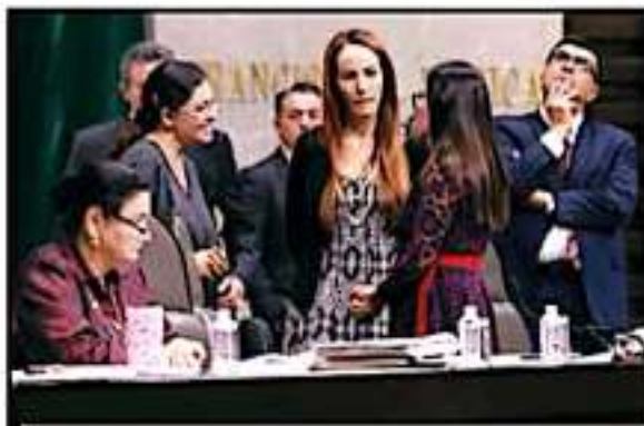
LA PELEMICA LEY DE AMNISTIA SERA DISCUTIDA HOY EN SAN LAZARO.

El dictamen de esta ley, del cual este medio tiene copia, plantea el otorgamiento del perdón por delitos como la interrupción del embarazo (que incluye a la mujer, familiares y médicos practicantes), así como delitos contra la salud cometidos por personas pobres, en extrema vulnerabilidad, que hayan sido excluidas y discrimi-