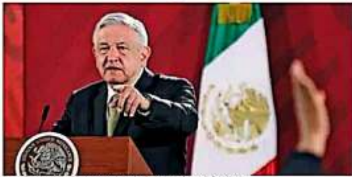
El presidente López Obrador aseguró que ya no hay "acuerdos en lo oscuro".

"Respetamos la decisión que tomó la Suprema Corte de Justicia el día de ayer (miércoles), el Tribunal Electoral, declarando inconstitucional la reforma que se hizo en el Congreso local de Baja California. Respetamos ese punto de vista y ya esto deja de manifiesto que no somos iguales", dijo en rueda de prensa desde Palacio Nacional.