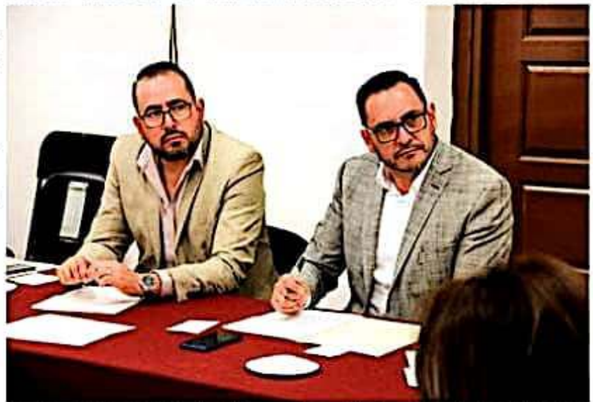
La comisión de Fortalecimiento Municipal del Congreso local, aprobó reformas a la Ley Orgánica de División Territorial del Estado de Michoacán.

EL OFERTÓN del Dr. Simi 3x2 De martes a domingo.