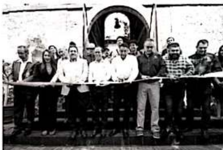
URUAPAN, MICH.- El Gobierno Municipal de Uruapan trabaja para detonar el desarrollo económico dando impulso a la agroindustria con una visión de cuidado del medio ambiente y recursos naturales