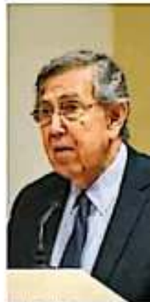
Cuadernero Cárdenas espera que este no sea un suceso preñado.

Cuadernero, Cárdenas Solórzano, fundador del PRD.