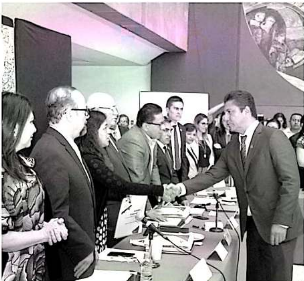
En representación de las universidades de la Región Centro Occidente del país y ante legisladores federales, el rector nicolaíta destacó el papel que juegan las universidades públicas en el desarrollo de la sociedad.

Destacó que la mayor parte de las universidades públicas del país han implementado programas de austeridad del gasto con el que se da cuenta de un ejercicio muy eficiente de los recursos públicos, en el caso específico de la UMSNH, se cubrieron «con el mismo recurso que en 2018» 2.5 quincenas más en 2019.