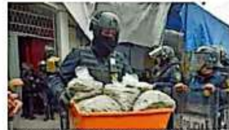
Se trata de cuentas de los cárteles de Jalisco, Sonora, Unión de Tepito y Los Zetas. | EL UNIVERSAL

Santiago Nieto precisó que es necesario que se hagan reformas a la ley, pues hay cuentas bloqueadas que son abundantes. Recordó que se tienen identificadas dos cuentas del CJNG por dos millones de dólares y 24 millones