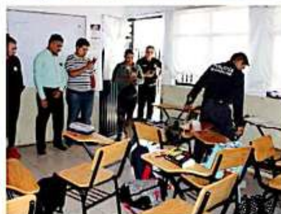
En el marco del programa "Escuela Modelo"