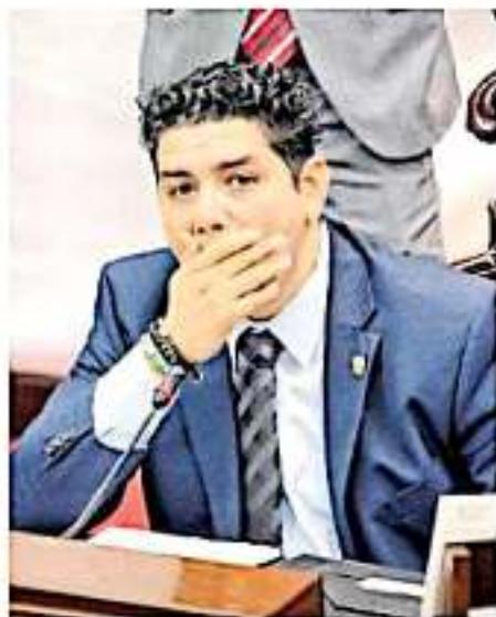
Hasta la próxima semana, el Pleno local votará el dictamen de Madriz Estrada. JEREMÍAS HERNÁNDEZ