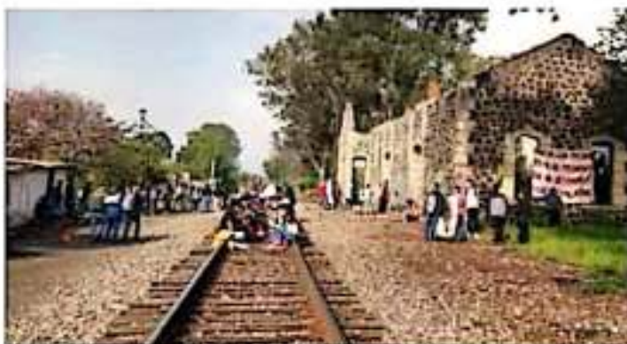
Seguimiento empresarial. Se piden de pesos se piden por vía de bloques. UNIMICH

Ante esta situación, hizo un llamado urgente para que la federación inter venga para retirar los bloques, ya que las empresas están preocupadas; incluso, algunas podrían cambiar y usar el puerto de