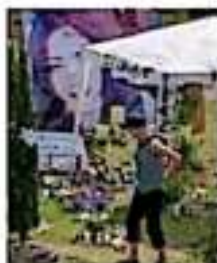
La imagen es el sup esta municipio del país con mayor población. | GABRIELINO

El índice con mayor representación de la calificación general fue el correspondiente a la calidad de vida.