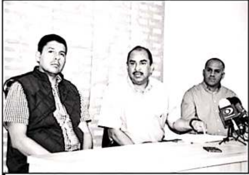
DIRIGENCIA DE LA DELEGACIÓN ADMINISTRATIVA OFRECÓ UNA NUEVA RUEDA DE PRENSA ESTE DÍA JUEVES