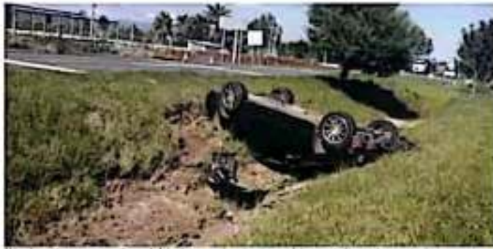
Miles de accidentes son causados por la falta de preparación de cultura vial de automovilistas y de peatones.

Los legisladores solicitaron a las autoridades que, desde el ámbito de sus respectivas competencias, expliquen o actualicen sus reglamentos de tránsito y vialidad para que se actualicen los programas y planes de educación vial, establezcan las acciones prohibidas con sus respectivas sanciones, y generen incentivos para fomentar el uso del transporte público, al igual que de los ve-