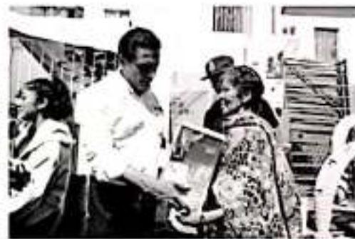
ZITÁCUARO, MICH.- El Gobernador Silvano Aureoles Conejo recorrió este jueves las zonas afectadas por las lluvias recientes en el municipio de Zitácuaro, donde refrendó a damnificados todo el apoyo del Gobierno del Estado

En el Fraccionamiento Circuito Revolución Mexicana, donde resultaron dañadas 17 viviendas, el gobernador hizo entrega de enseres domésticos para cubrir las necesidades primarias de las familias afectadas.