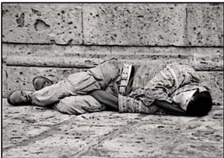
DECENAS DE PERSONAS EN SITUACIÓN DE CALLE CORREN RIESGO ANTE LAS BAJAS TEMPERATURAS DE LA TEMPORADA.

municipales afirmaron que realizaban un censo para confirmar esta situación y tener un panorama preciso de la situación de indigencia en Morelia, e incluso en marzo adelantaron que se habían identificado a 42 personas en esta situación en el centro de la ciudad, con una fluctuación de 25 hasta 80 años de edad. No obstante, para octubre pasado afir-