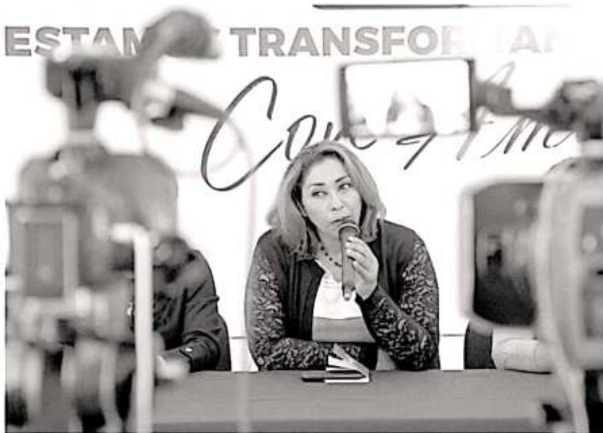
Más de 40 actividades se llevarán a cabo en Uruapan, los días 15 y 16 de noviembre, para impulsar la competitividad de las empresas e industrias michoacanas en el cuidado de la naturaleza. CAMBIO

16:30 horas, esperando que se sumen desde la sociedad civil escuelas y empresas que así lo deseen.