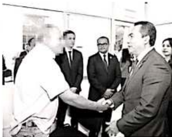
El Fiscal General del Estado, Adrián López Solís, durante un recorrido de supervisión en las instalaciones de la dependencia regional Morelia, donde se implementa el programa piloto del Nuevo Modelo de Atención Inmediata a Víctimas.

El Fiscal General, resaltó la importancia de que se hayan ha-