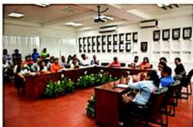
CD. LÁZARO CÁRDENAS, MICH.- Se llevó a cabo una reunión de trabajo entre representantes de instituciones educativas y autoridades municipales con el fin de ultimar detalles para el desfile cívico-militar del 20 de Noviembre.

El desfile por motivo de la Revolución Mexicana se celebrará el día miércoles 20 de noviembre, por lo que a partir de las 6:00 horas de ese día se hará un cierre a la circulación vial de la avenida Lázaro Cárdenas, partiendo desde la avenida Heroica Escuela Naval Militar hasta la avenida Reforma.