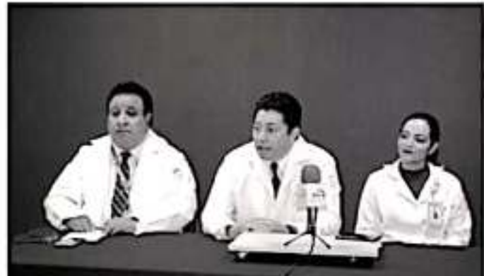
MORELIA, MICH.- El Instituto Mexicano del Seguro Social (IMSS) en Michoacán anunció su jornada anual de vasectomía sin bisturí.

Urecho, Tancitaro, Nueva Italia, Apaxzingán, Tepalcatepec y Lázaro Cárdenas. En la jornada anterior, la delegación estatal del IMSS realizó 268 métodos definitivos de planificación familiar principalmente en pacientes de entre 25 y 40 años. En ninguna de ellas se presentó ninguna complicación médica.