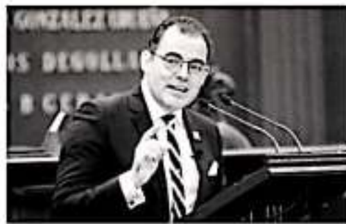
MORELIA, MICH.- El diputado local Baltazar Gaona García, presentó una iniciativa con Proyecto de Decreto por el cual se reforma el artículo 35 Bis de la Ley de Coordinación Fiscal del Estado de Michoacán ante el Pleno del Congreso del Estado.

El legislador michoacano afirmó que este tipo de inversiones en infraestructura para el mejoramiento del medio ambiente,