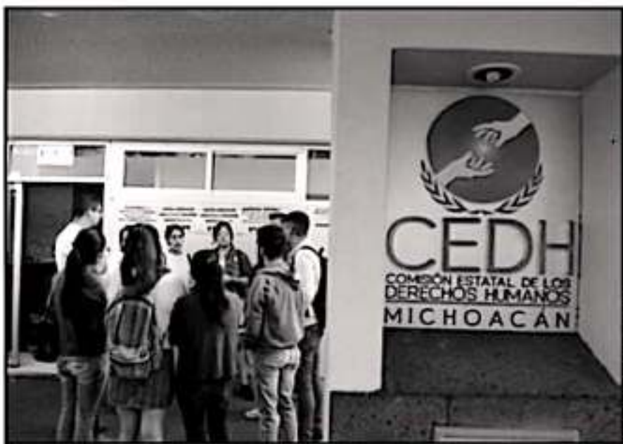
LA NECESIDAD DE AMPLIAR EL ALCANCE Y VESTIDURAS DE LA CEDH SON PARTE DE LOS RETOS QUE TIENE LA COMISIÓN

Y es que, en el Congreso de Michoacán, los procesos de selección para cargos de alta prioridad como en el caso del auditor