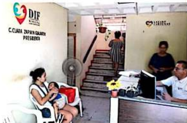
CD. LÁZARO CÁRDENAS, MICH.- Los Sistemas DIF estatal y municipal invitan a todas las familias de escasos recursos y que cuenten con un menor de 6 meses a 5 años de edad, a inscribirse a un padrón a fin de conformar un programa alimentario.