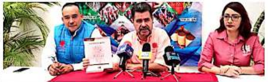
ZAMORA, MICH.- Este evento se realizará en el Centro Regional y de las Artes del Estado de Michoacán (CRAM).

Intermediarios son quienes se quedan con sus ganancias por ello, es que esta clase de tianguis permite que ellos se lleven las ganancias en su totalidad, al impulsar a los artesanos que son los creadores de las piezas, y que esto permita que salgan de su área de venta.