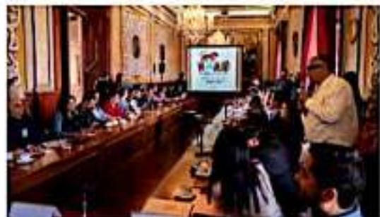
MORELIA, MICH.- Cámaras empresariales, universidades, representantes de festivales y el Gobierno de Morelia, trabajarán unidos en el objetivo de consolidar de forma permanente a la ciudad como la sede Latinoamericana de Womad.

El comité se reunirá de nueva cuenta la siguiente semana para integrar las comisiones necesarias para la correcta organización, como lo es la de producción y logística, patrocinio y financiamiento, finanzas y administración, así como de promoción y mercadotecnia.