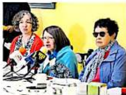
Se hizo el llamado para que la dirigencia estatal de Morena ponga verdadera atención

Finalmente, la académica de la Universidad Michoacana de San Nicolás de