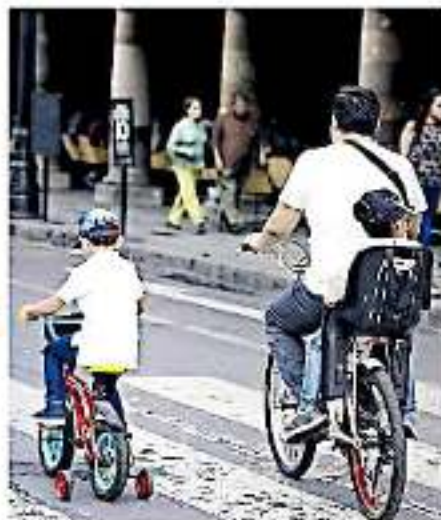
Se trata del único método de planificación familiar definitivo para varones adultos

Se trata del único método de planificación familiar definitivo para varones y consiste en obstruir y ligar los conductos que transportan los espermatozoides hasta el pene, sin afectar ni disminuir el desempeño sexual del hombre que continúa con sensaciones de placer y satisfacción sin contraindicaciones, aunque puede llegar a