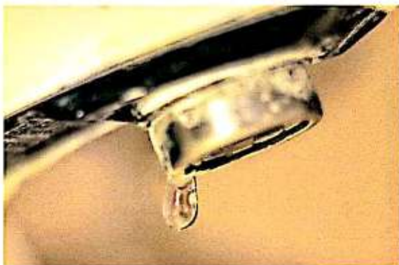
El OOPAS arrastra un déficit financiero que debe pagar a trabajadores y otras instancias

El OOPAS arrastra un déficit financiero que debe pagar a trabajadores y otras instancias por 340 millones de pesos