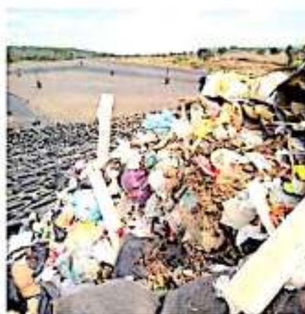
Para cinco municipios de la región de La Ciénega es el proyecto. ANED AYALA

"Yo no he sido notificado, al no ser notificado desconozco el proceso cómo va y en qué etapa va, espero que el Ayuntamiento de Morelia ya se deje de ablandar y en vez de desquitarse, se ponga a trabajar por Jesús del Monte", sentenció