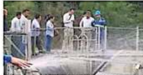
Beneficia el municipio el estado que más agua sanea. |COMTUA

Añadió que también se tiene el proyecto de la ampliación de la planta tratadora de aguas residuales de Apatzaco, que es algo que están trabajando con dos equipos que presentarán sus propuestas, con el propósito de que traigan todas las aguas