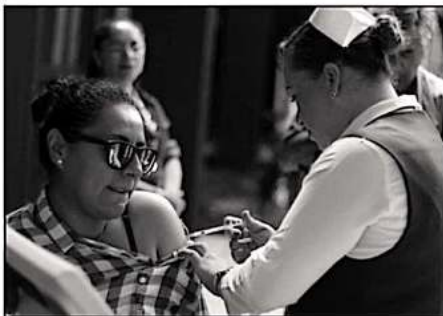
LA VACUNA CONTRA LA INFLUENZA ES PRIMORDIAL. INVITAN A ACERCARSE A LOS CENTROS DE SALUD POR ELLA.

debe aplicarse antes de que finalice el año