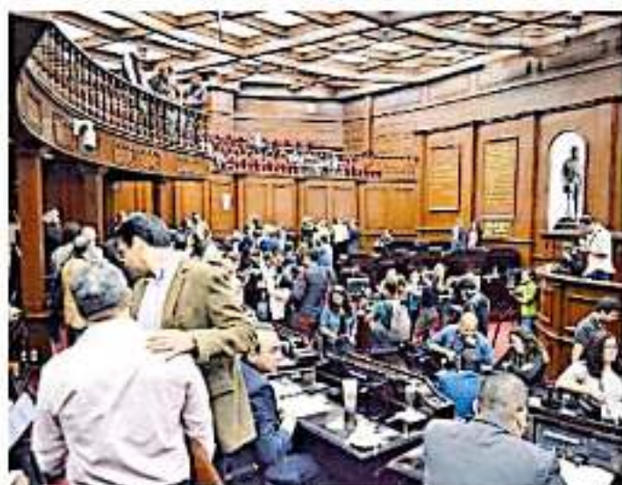
Únicamente 21 de 40 legisladores asistieron a la reunión.