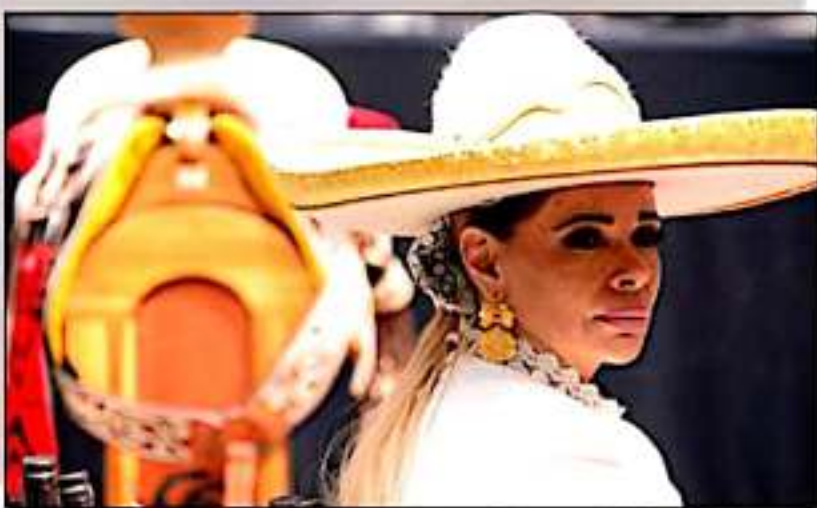
Con buenos augurios inicia este viernes el Congreso Nacional Charro.