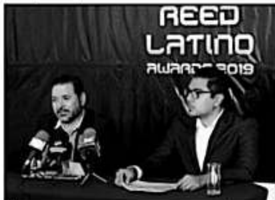
EL MUNICIPIO DE JACÓN A FUE NOMINADO EN 5 CATEGORÍAS EN LA EDICIÓN 2019 DE ESTOS PREMIOS QUE DESTACAN A NIVEL INTERNACIONAL.

Finalmente se dio a conocer que el evento se llevará a cabo en la Ciudad de Cancún, Quintana Roo los días 22 y 23 de noviembre del presente año, donde se galardonará a los mejores proyectos de Latinoamérica y que Jacóna se destaque con alguna de sus nominaciones.