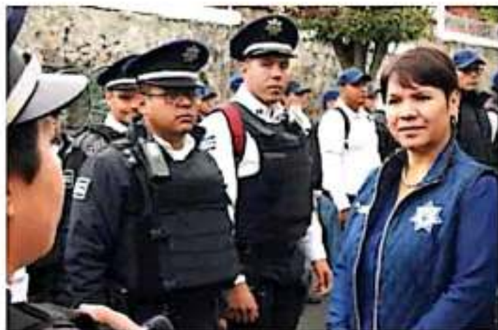
La policía de Morelia fue beneficiada por primera vez con bolsa concursable del Fortaseg.