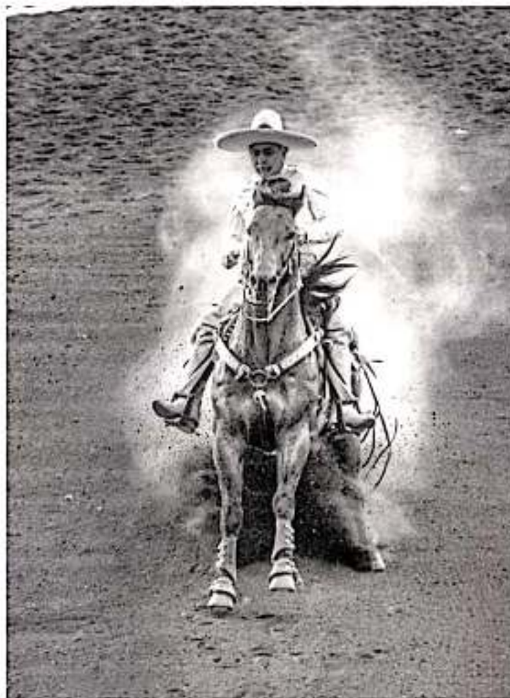
Las actividades del Congreso Nacional Charro engalinarán monumentos históricos de la ciudad.

Charro Michoacán 2019, tiene una capacidad de graderío para recibir a 7 mil 500 personas. Además, el estacionamiento del Pabellón está considerado para mil 400 automóviles; cuenta con 450 caballerizas, corrales para ganado beuto, una zona de exposición para 200 stands, y se habilitó un restaurante interno y dos en externos, una zona cultural y una capilla.