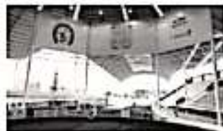
CRIT Michoacán, la Asamblea Nacional de Jueces Charros, la Copa Charra de Golf en "Tres Marias", la Asamblea Nacional del Congreso y la Competencia Nacional Charro "José Ma. Morelos y Pavón".

Además del Pabellón, los escenarios del Congreso Nacional serán en las instalaciones del Palacio Clavijero y el Centro Cultural Universitario, donde se desarrollarán las actividades alternas, entre las que destacan: la Asamblea Nacional de Locutores, una charreada especial en favor del