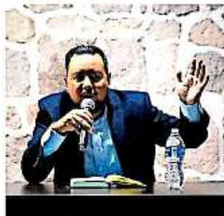
Su propuesta de gobierno comunal ha sido adoptada en otros estados mexicanos.

En ese sentido, subrayó que en Cherán se establecieron medidas como la ronda comunitaria, un esquema de seguridad que permite atender los problemas pues considera que "el Plan Mérida, el Mando