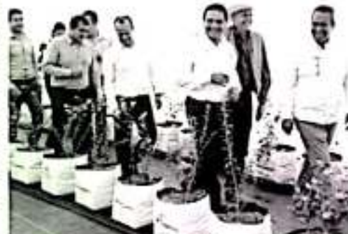
ZITÁCUARO, MICH.- El gobernador del estado, Silvano Aureoles Conejo, inauguró el Agroparque "Piedras de Lumbre", para el cultivo y producción de blueberry.

Finalmente, el gobernador del estado, Silvano Aureoles Conejo, acompañado por autoridades estatales y directivos de la empresa, realizó un recorrido por las instalaciones del Agroparque para conocer su funcionamiento y operación.