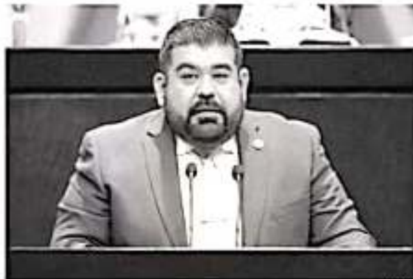
Francisco Huacús Esquivel, diputado federal.

Así lo explicó el diputado federal Francisco Huacús Esquivel, esto en el contexto de la discusión del Paquete Económico del Presupuesto de Egresos de la Federación del 2020, que se libra actualmente en la Cámara de Diputados