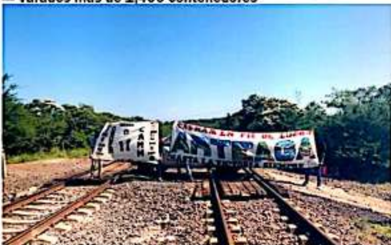
CD. LÁZARO CÁRDENAS, MICH.- El CREN se solidarizó con los cientos de exalumnos de la Escuela Normal 'Vasco de Quiroga' que mantienen un bloqueo de las vías ferroviarias, esto en la exigencia de plazas automáticas de maestros.