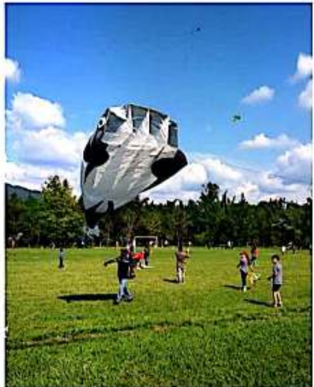
LOS REYES, MICH.- Este domingo se llevará a cabo la vigésima edición de "El Vuelo del Papalote".

Finalmente, el edil tocumbense reafirmó su compromiso de seguir trabajando para dignificar las diferentes instituciones educativas de Tocumbo, al señalar que es prioridad la educación para la administración municipal.