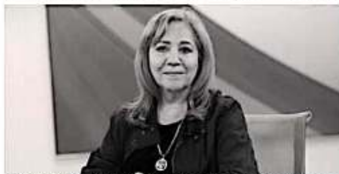
CIUDAD DE MEXICO.- Rosario Piedra Ibarra fue ayer elegida por el Senado como nueva titular de la Comisión Nacional de los Derechos Humanos (CNDH) para los próximos 5 años.

Ha trabajado por los derechos humanos de personas con alguna discapacidad, y rechazaba que su cercanía con el presidente Andrés Manuel López Obrador la convirtiera en una "candidata a modo".