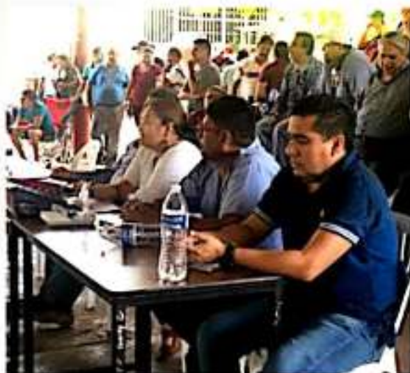
CD. LÁZARO CÁRDENAS, MICH.- La CNTE se prepara para la convocatoria de renovación de su Comité Ejecutivo Seccional.