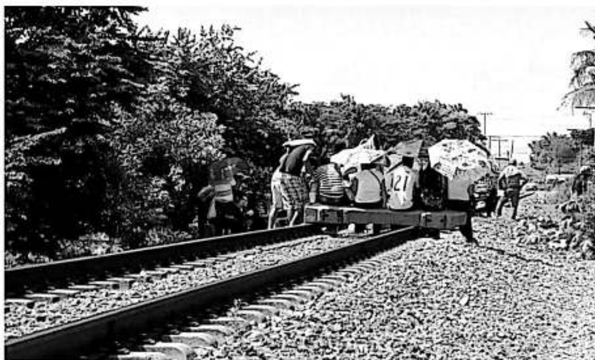
Normalistas siguen realizando bloqueos a las vías del tren, por lo que ayer fueron denunciados.

El representante industrial manifestó que al momento los sectores con mayor afectación por esta situación son la industria acerera, la industria automotriz, el propio Puerto Lázaro Cárdenas; tiendas de autoservicio y departamentales; empresas del ramo agro industrial y el traslado de combustóleo a la refinería de Pemex de Tula, Hidalgo.