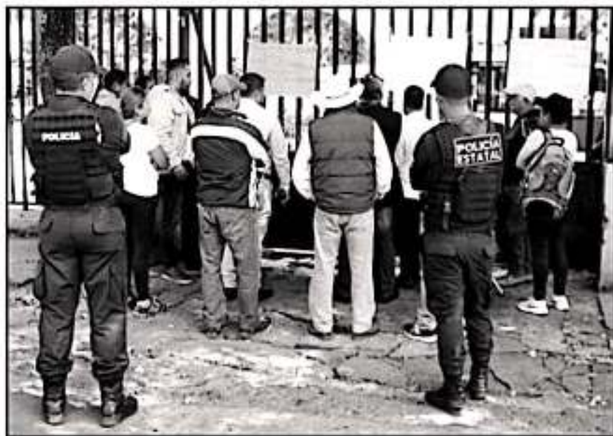
COMUNEROS PROTESTARON PARA EXIGIR QUE NO SE ENTREGLEN MÁS RECURSOS, HASTA SOLUCIONAR EL CONFLICTO.

En entrevista para La Voz de Michoacán, destacaron que desde el pasado 17 de octubre ganaron la consulta ciudadana para la renovación de los integrantes del consejo, situación que al igual que en otras comunidades, los organismos se niegan a reconocer. Al respecto, denunciaron la intrusión de Consejo Supremo In-