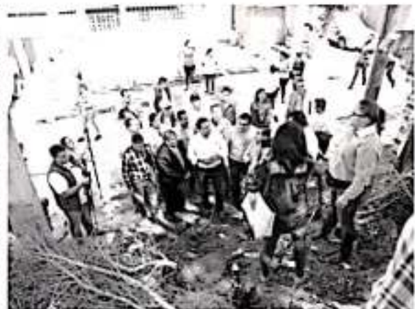
Silvano Aureoles entrega enseres e instruye la reparación de viviendas para las familias afectadas por una tromba en Zitácuaro.

En el Fraccionamiento Circuito Revolución Mexicana, donde resultaron dañadas 17 viviendas, el gobernador hizo entrega de enseres domésticos para cubrir las necesidades primarias de las familias afectadas.