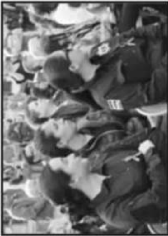
REFLEXIONAN EN EL DÍA INTERNACIONAL DE LA MUJER.

"Todos los días luchamos por la igualdad de género en Pátzcuaro"