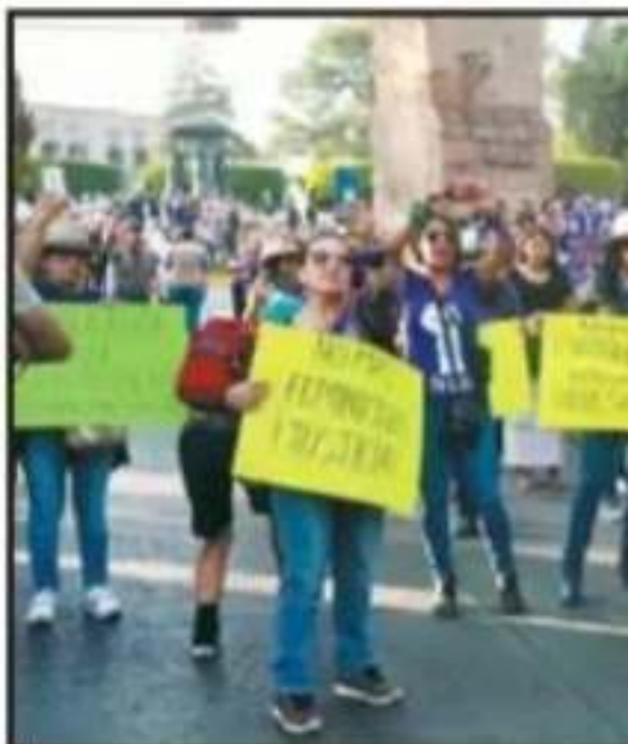
NO SÓLO FUERON JÓVENES, MUJERES DETO