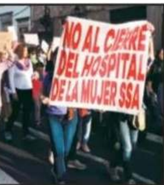
NO SE CERRARAN ESPACIOS DE SALUD.