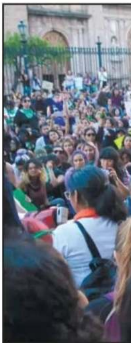
ABARRATODA LUCIÓ LA AVENIDA MADE

Desde la Plaza Morelos hasta la Fuente de las Tarascas, mujeres de todo el espectro sociopolítico y feministas acudieron a la cita para solidarizarse, para reunir como nunca antes en la capital michoacana en un contingente que hizo cimbrar el Centro entre las batucadas, los aplausos y las multisonoras protestas.