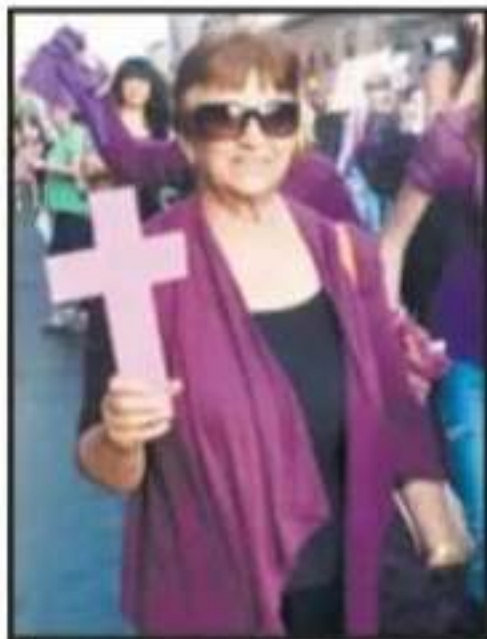
EXIGEN, NI UNA MUJER MENOS.