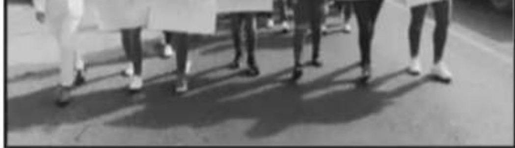
Grupos de estudiantes se manifestaron por las calles de Santa Clara.