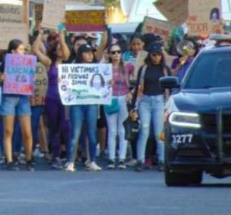
Poco más de 200 mujeres, en su mayoría jóvenes, participaron en la primera marcha feminista de la región. Partiendo del parque "Jesús Romero Flores", recorrieron las avenidas Melchor Ocampo y Lázaro Cárdenas.

competición para niños de un kilómetro. Posteriormente, a las cuatro de la tarde, poco más de 200 mujeres, en su mayoría jóvenes, participaron en la primera marcha feminista de la región. Partiendo del parque "Jesús Romero Flores", el colectivo recorrió las avenidas Melchor Ocampo y Lázaro Cárdenas.