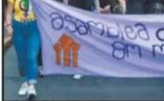
LA MARCHA COMENZÓ DE LAS 5:00 DE LA