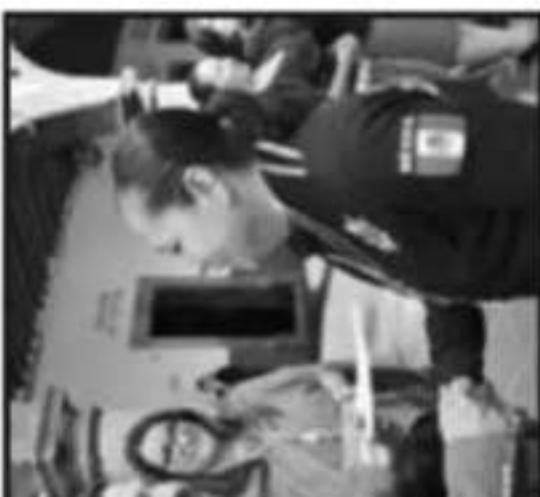
CONOCE A LAS MUJERES POLICÍAS.