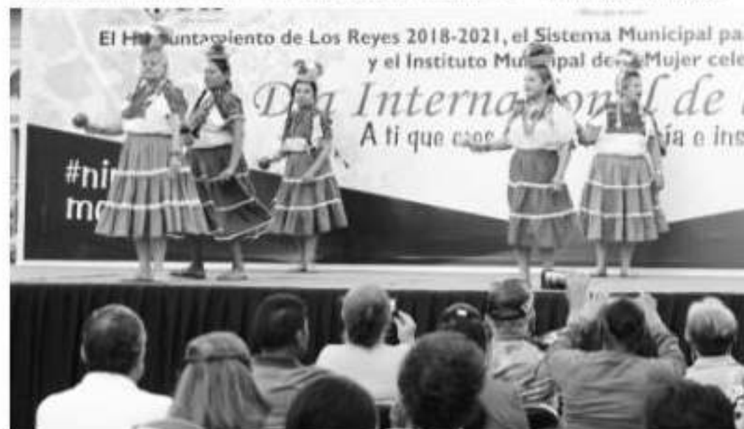
LOS REYES, MICH.- Se conmemoró aquí el Día Internacional de la Mujer.

Cabe mencionar que se han venido realizando en los últimos días, tales como con donaciones de actividades socioculturales en San Andrés crédito del programa de beneficio de un grupo de mujeres en la conferencia "Emprendimiento" impartida el viernes por el Instituto de Seguridad Social del Estado de Michoacán, por Ramírez Sánchez.