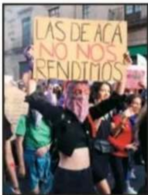
LA MAYORÍA PORTABA PANCARTAS.