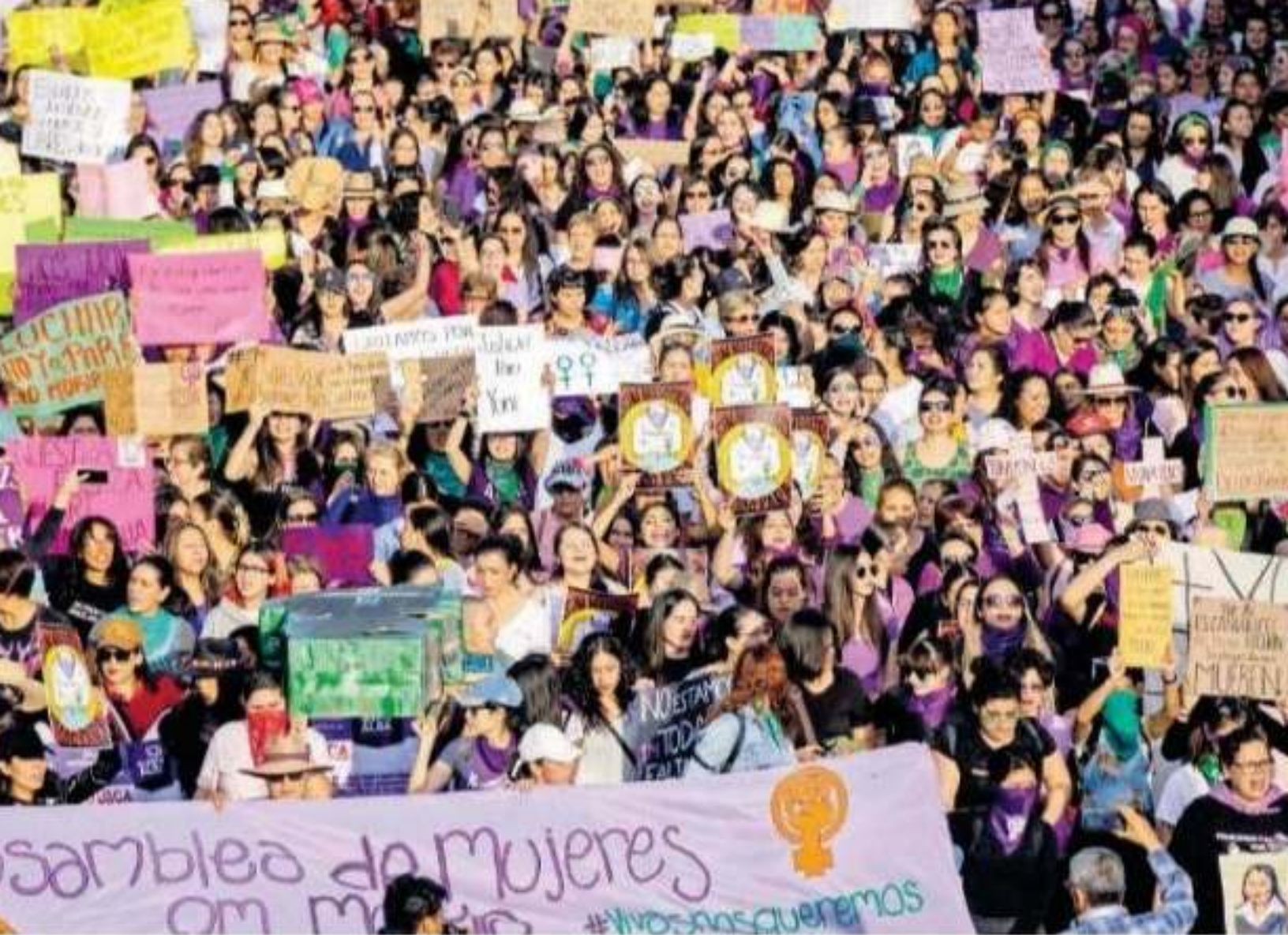
...ales participaron en la Marcha conmemorativa del Día Internacional de la Mujer

UNA PARTICIPACIÓN MASIVA EN "UN DÍA SIN NOSOTRAS"