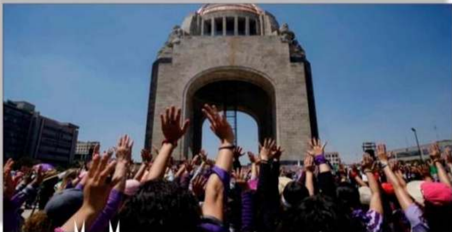
La Mujer Mexicana salió a manifestarse y mostró su poderío.

buzones virtuales para de y bullying en las escuelas de campañas “Yo por Ellas”, “Denuncia” y “No es amor los mecanismos institucionales de las víctimas de violencia. 8.- R. decreto de la Presea Erc. preferentemente a las muj derecho a una vida libre de colectivos de feministas p. definir los criterios del n. simbólica del daño de la género mediante acciones. Capacitación permanente de Género para todos los f. Gobierno. 11.- A partir del la modificación al Código y los servidores públicos de sanciones administrativas. hostigamiento por razones. Estatal para Prevenir la sesionará una vez al mes de extraordinaria cuantas veces el cumplimiento de las acci