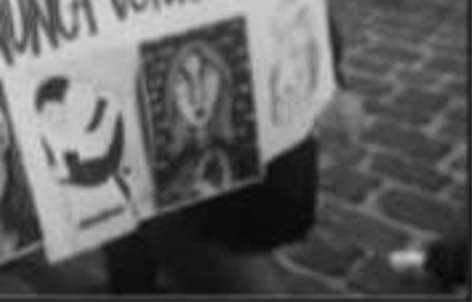
por las calles del centro de Pátzcuaro.