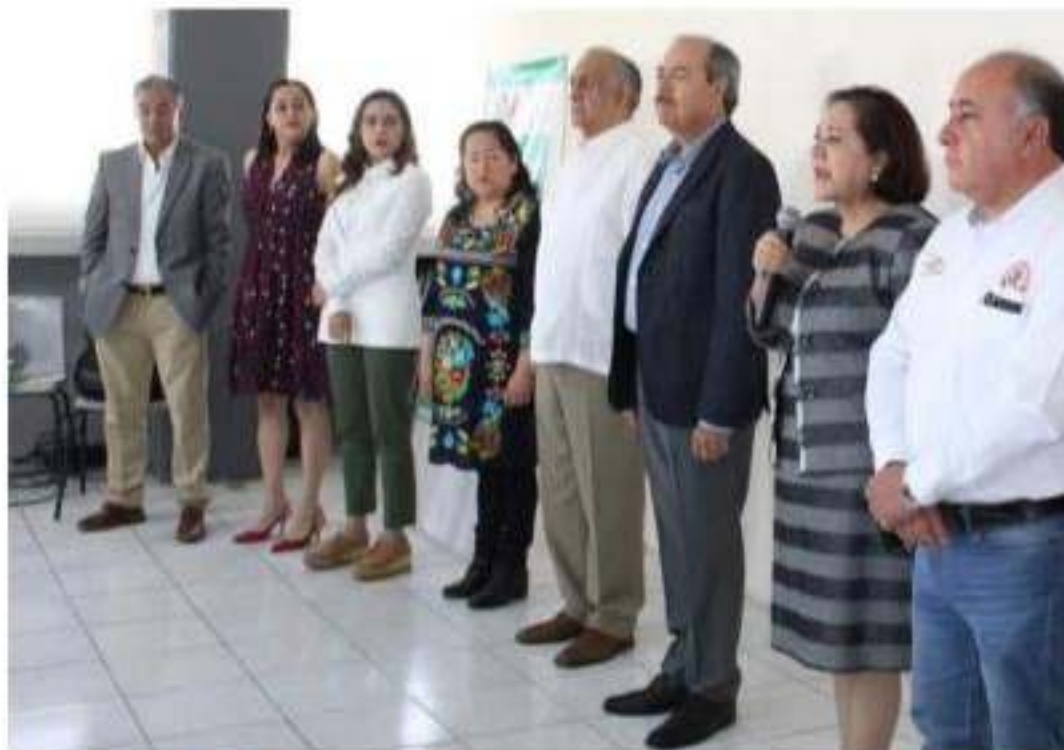
MORELIA, MICH.- Con un curso-taller sobre empoderamiento y liderazgo en el Día Internacional de la Mujer.