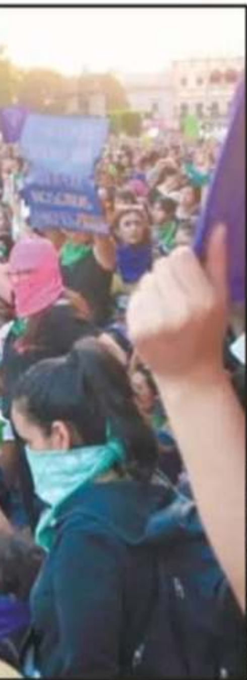
ORMALIZAR LA VIOLENCIA EN SU CONTRA.