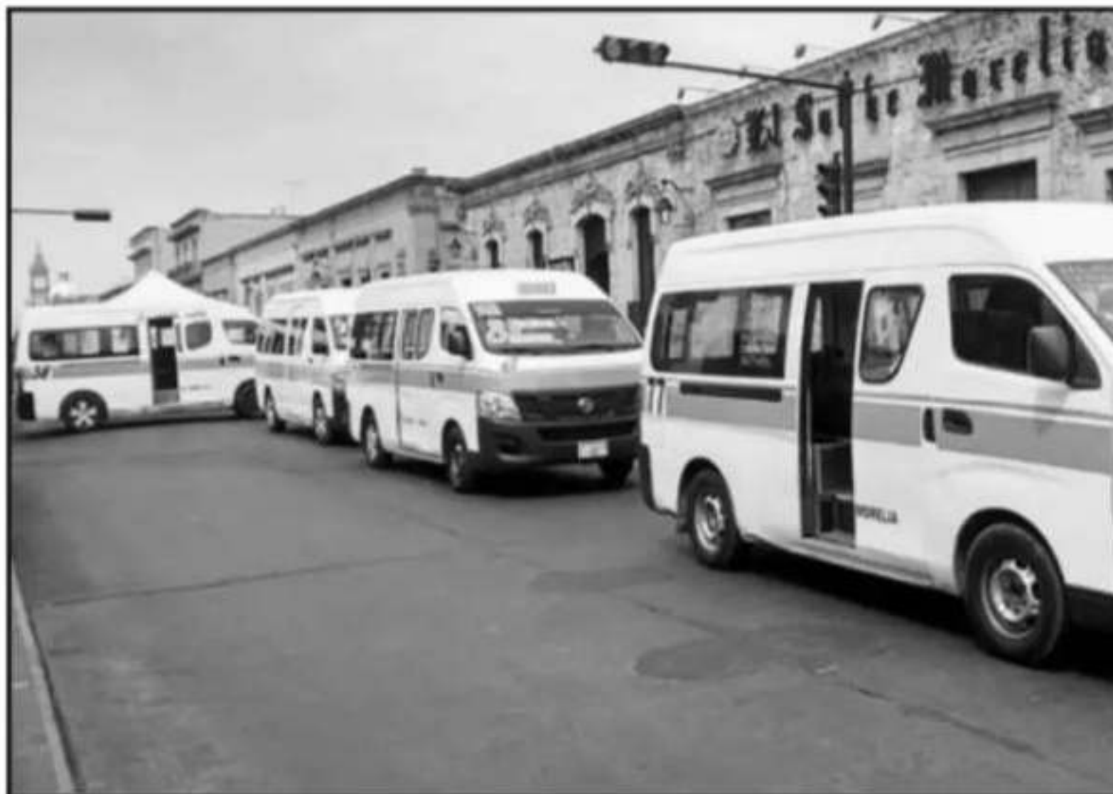
HASTA EN CINCO OCASIONES, LOS TRANSPORTISTAS HAN BLOQUEADO LA CICLOVÍA EN LA AVENIDA MADERO, PORQUE