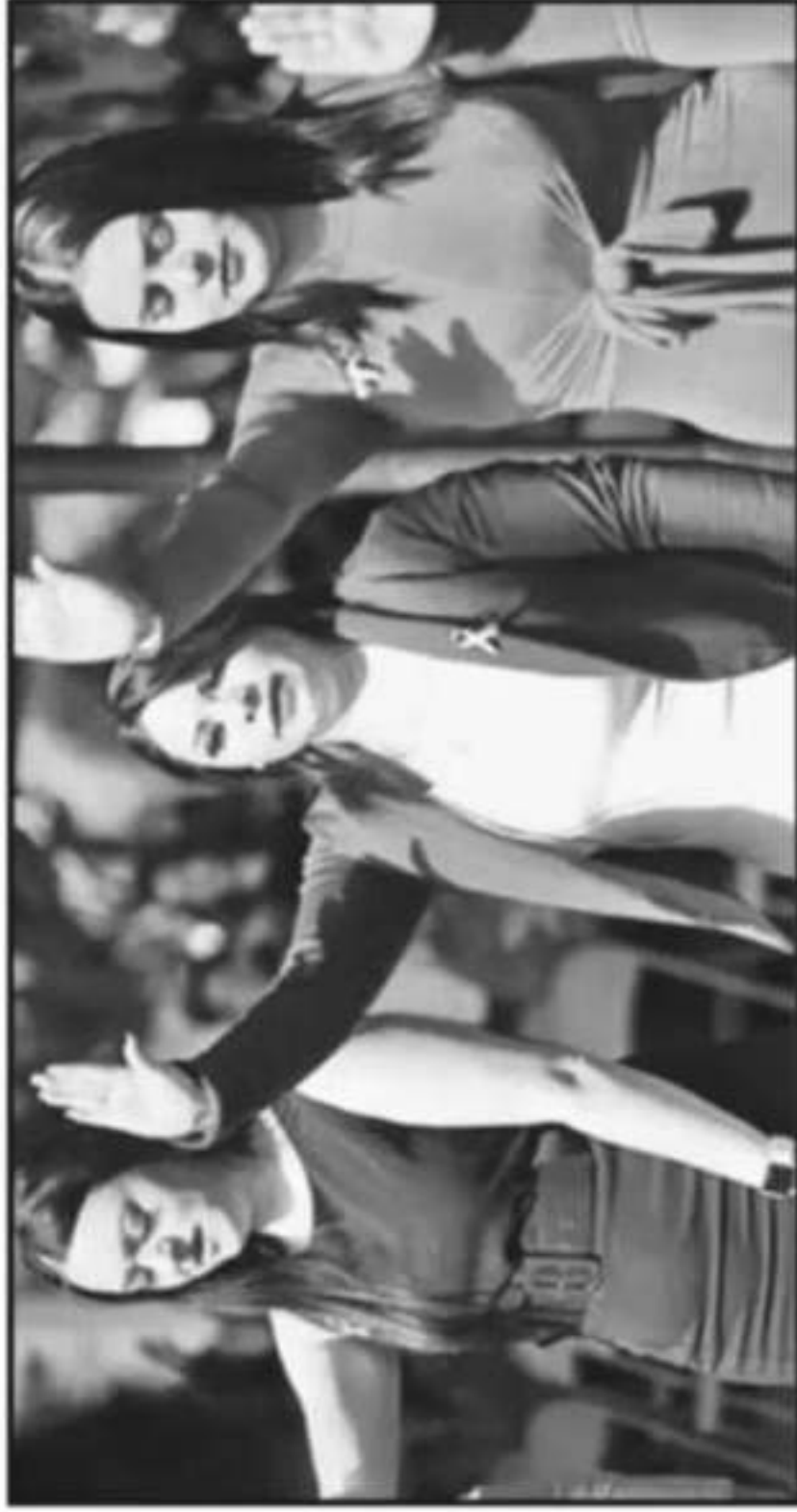
LA ALCALDESA DE COPÁN URGEN A FRENAR LA ACTUALIDAD YA NO SE PUEDE TOLERAR UNA SOCIEDAD DESIGUAL

h.- "Para una en el contexto de Michoacán y especialmente en un momento de crisis política natural, aparte de acceder a los espacios de participación popular, la condición general es imperfecta, ya que las condiciones de igualdad no se cumplen en un país como el nuestro, ya no digamos en el trabajo o la vida pública, donde se ven expuestas a