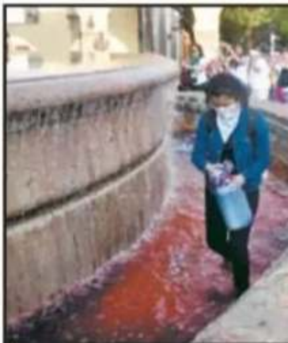
EN PROTESTA POR LOS FEMINICIDIOS, TIÑERO