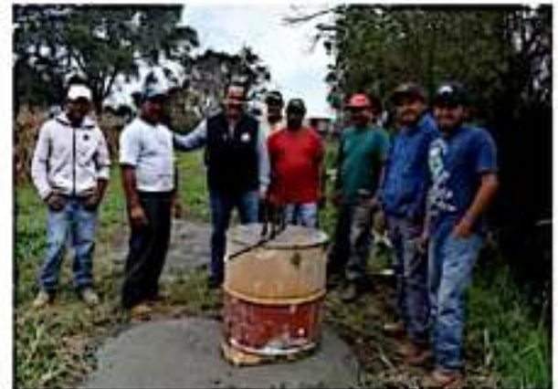
En el arranque de la obra del tanque elevado con los trabajadores de la obra.