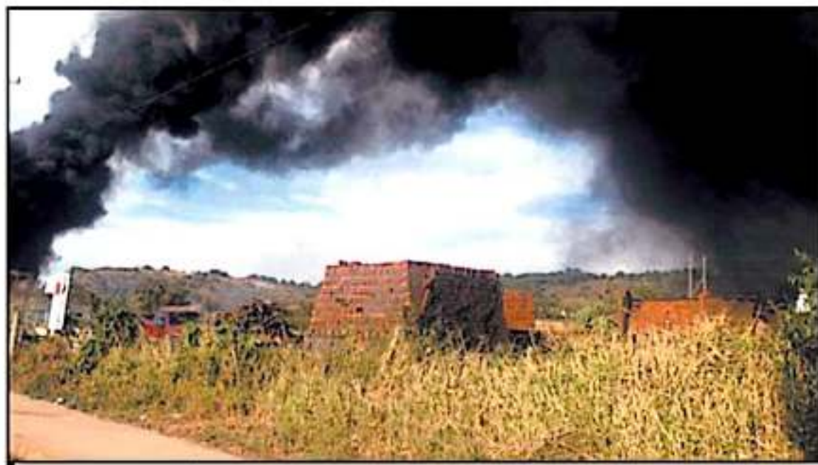
GRANDES COLUMNAS DE HUMO TÓXICO SE DESPRENDEN DE LOS HORNOS DE LAS LADRILLERAS, PONIENDO EN RIESGO LA SALUD DE MILES DE PERSONAS.