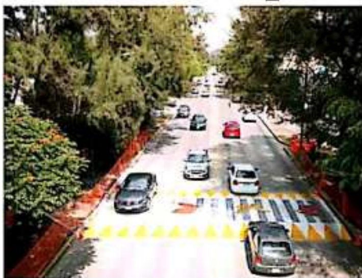
Desde la inauguración, en agosto pasado, dos personas han perdido la vida en ese lugar. | CORREDA

Si bien las autoridades no hicieron un diagnóstico correcto y más profundo sobre la colocación de este paso peatonal, García Espinosa también consideró que, en gran medida, hoy una responsabilidad de los funcionarios del IMSS Camelinas,