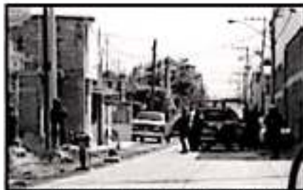
LA CLAVE NO ES ARMAR A LAS POLICÍAS, SINO FORTALECER LOS PROCESOS DE IMPARTICIÓN DE JUSTICIA.