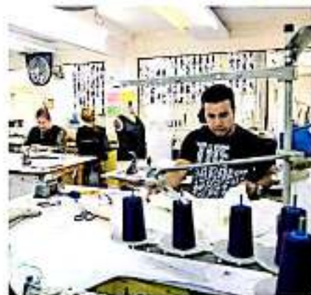
Michoacán es de los estados que genera ingresos muy bajos (archivo)

"Está bien que se cobren más impuestos, pero que esos impuestos realmente tengan un uso de carácter productivo, porque lo que estamos viendo son reducciones al gasto en infraestructura que tiene impacto sobre las empresas, quiere decir que para el gobierno no está siendo prioritaria la actividad económica", expresó.