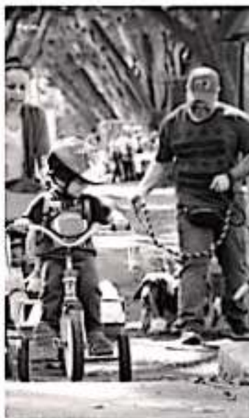
URUAPAN, MICH.- Las risas en los rostros de los pequeños, saltos, paseo en bicicleta y el gran ánimo que transmiten contagiaron a los presentes.