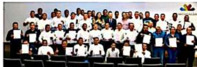
MORELIA, MICH.- Cien elementos de la SSP conforman la primera generación de la Escuela de Hombres para Prevenir y Erradicar la Violencia de género.

Cabe precisar, que la Escuela de Hombres para Prevenir y Erradicar la Violencia contra las Mujeres, estará funcionando a partir del siguiente año de manera permanente en las oficinas de la Seimujer.