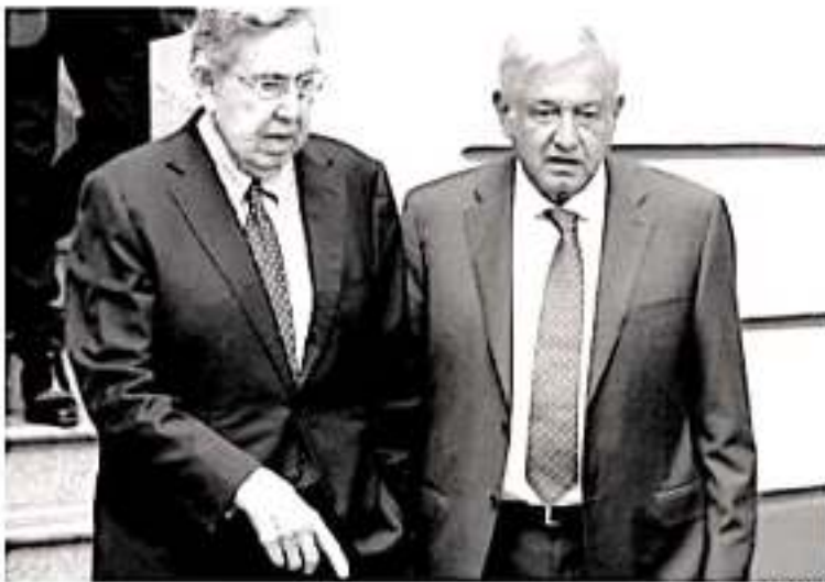
Cuauhtémoc Cárdenas Solórzano aceptó conceder una entrevista exclusiva para responder a temas como la conducción del país por parte de Morena.

7. Lo que yo llamaría cardenismo sería una lucha permanente por el rescate, ampliación y ejercicio efectivo de la soberanía del país, por la elevación de los niveles de vida de la gente, por una política internacional que buscase la equidad en las relaciones. No lo veo. No veo que nadie esté al mismo nivel que los personajes que aparece en el emblema de Morena: Hidalgo, Morelos, Juárez y Lázaro Cárdenas.