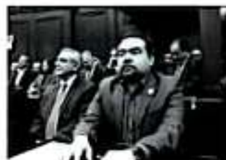
MORELIA, MICH.- El Poder Legislativo buscará generar viabilidad financiera para Michoacán en el 2020

El diputado por el Distrito de Hidalgo, recalco que en las semanas venideras el trabajo en la revisión del paquete económico será intenso en el Congreso del Estado, y que los michoacanos deben estar ciertos que el Poder Legislativo buscará que este banco llamado Michoacán, siga a flote y fortalecido.