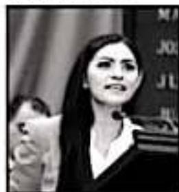
SAUCEDO REFLEXIONÓ POR EL DÍA CONTRA CORRUPCIÓN.

La diputada por el Distrito de Patzcuaro recordó que de acuerdo con datos de la organización Mexicanos contra la Corrupción señalan que junto con la inseguridad la corrupción es de los dos grandes problemas que más preocupan a los mexicanos desde hace, al menos, 4 años, y que aunque se considera al gobierno como principal responsable del combate, no es el único sector que se considera protagonista en este mal, advierte.