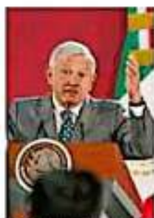
En 2014 se sancionó así a seis mil 988 funcionarios públicos por actos relacionados con la corrupción. (COMPROBADO)

Actos graves y no graves Durante 2014 se sancionó a un total de seis mil 988 servidores públicos en 27 entidades federativas, 70% de los cuales se concentraron en cinco entidades; nuevamente CDMX encabeza la lista, seguida del Estado de México, Chihuahua, Coahuila y So-