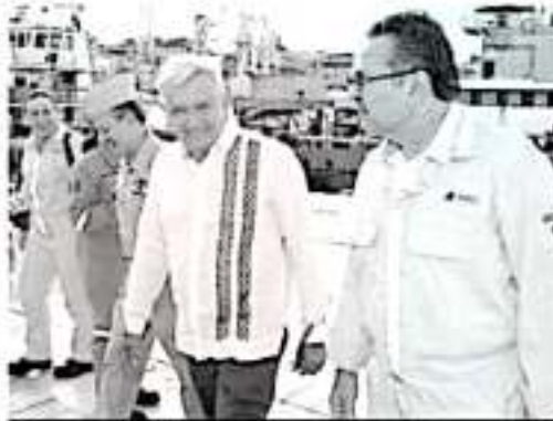
El presidente Andrés Manuel López Obrador recorrió ayer una plataforma petrolera dentro del campo Xikin, en Tabasco.