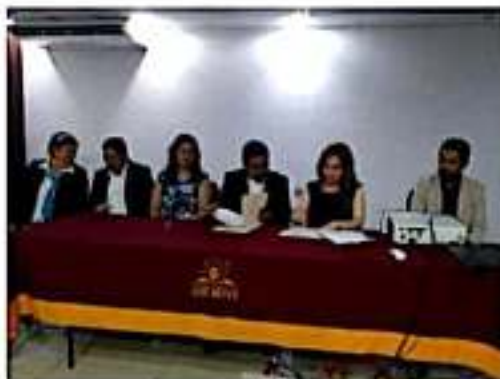
LOS REYES, MICH.- El Tec Los Reyes y el Colegio de Abogados firman un convenio de colaboración.