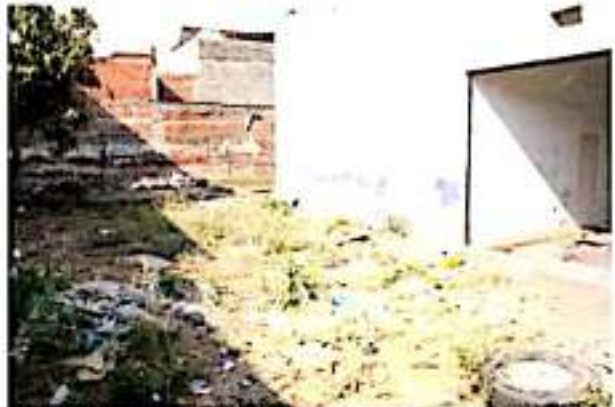
ZAMORA, MICH.- Fue entregado el inmueble donde se construirá el albergue para los adultos mayores y personas que viven en abandono.