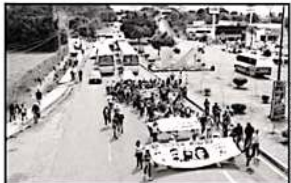
MICHOACÁN: LA VOZ DE MICHOACÁN

LO QUE SE BUSCA ES IMPEDIR QUE LAS MANIFESTACIONES SECUESTREN LAS VIALIDADES Y ATENTEN DE SOBREMANERA CONTRA EL LIBRE TRÁNSITO.