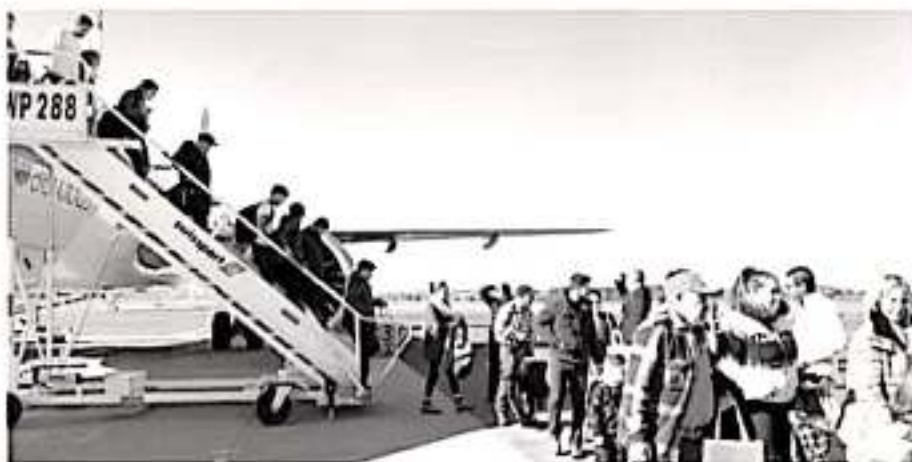
La nueva ruta se abrirá por la temporada invernal.

> En el primer viaje llegaron 169 visitantes de aquella ciudad estadounidense; el avión, al 91% de su capacidad