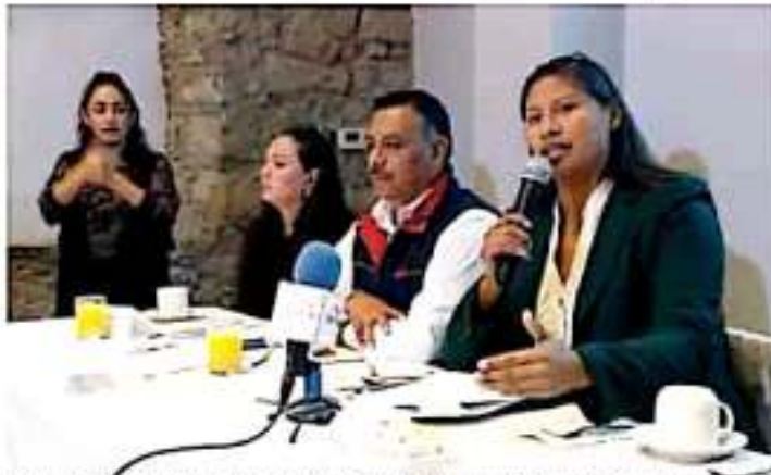
La cartera de inversión federal 2020 contempla obras de infraestructura en Lázaro Cárdenas, señaló la diputada. | WWW.PUBLICMETRO.COM.MX

En el Instituto Mexicano del Seguro Social (IMSS): - Implementación de la