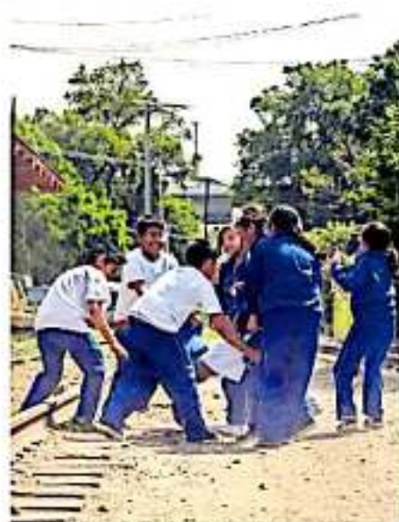
Se ha manifestado que es en el hogar donde primero experimentan la violencia.

Al que también se propone la abrogación de la Ley de Responsabilidades y Patrimonio de los Servidores Públicos del estado y sus municipios.