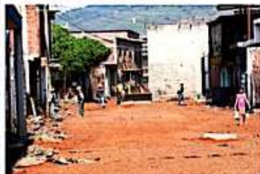
LOS REYES, MICH.- Por concluir se encuentra la obra de sustitución de redes y pavimentación de la calle Moctezuma, de la colonia La Loma.