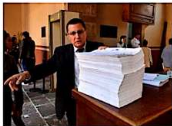
El expediente que consta de poco más de 2 mil 300 fojas.

El procedimiento se deriva de una obra que se pactó durante 2011 y que consiste en la ampliación de la Avenida Lázaro Cárdenas