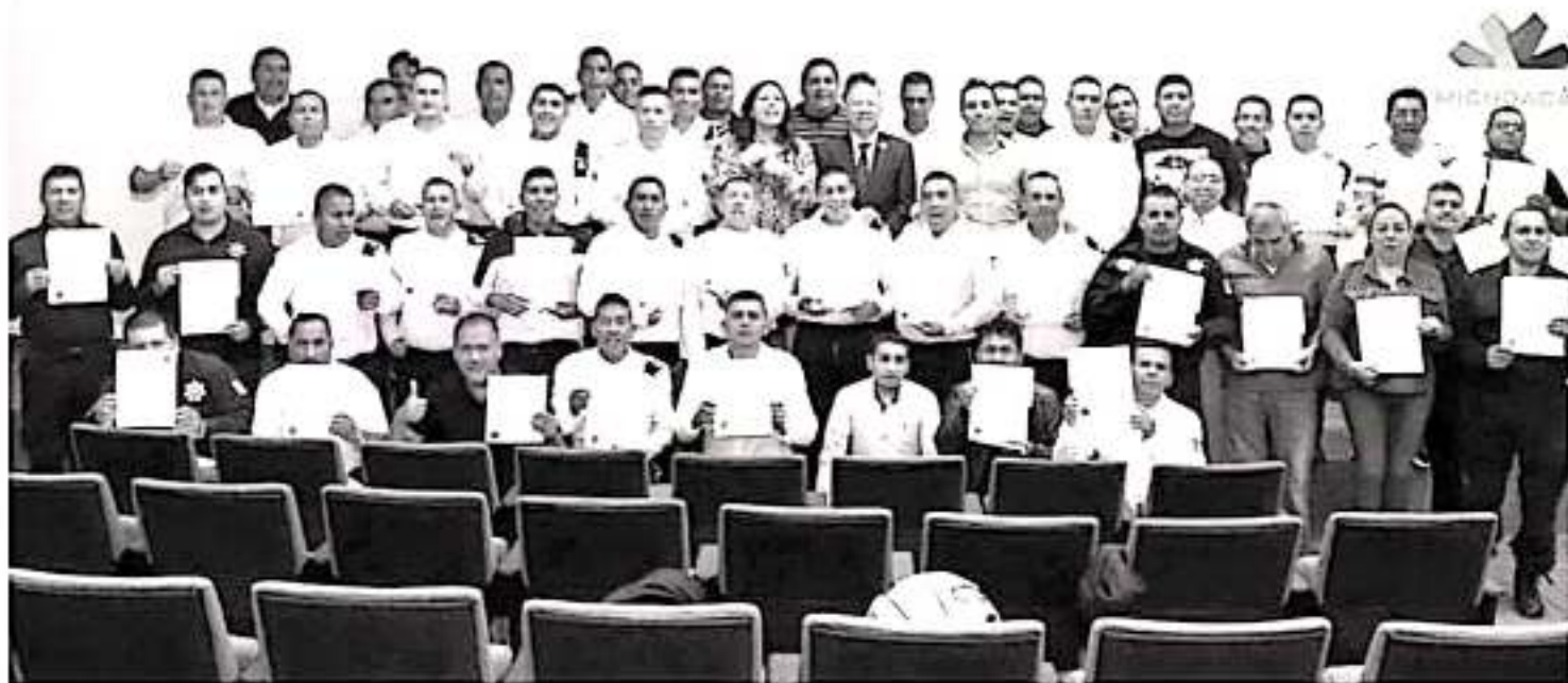
Participaron más de 100 elementos de la Secretaría de Seguridad Pública.

Cabe precisar, que la Escuela de Hombres para Prevenir y Erradicar la Violencia contra las Mujeres, estará funcionando a partir del siguiente año de manera permanente en las oficinas de la Seimujer.