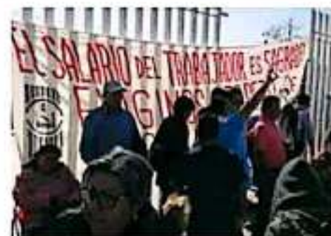
La UNTE señala que se desconoce el número de aviadores. | WWW.PUBLICMETRO.COM.MX

El ex secretario de la SEE Alberto Frits Solís aseguró en su momento que ya no existen los "aviadores" en oficinas centrales, tras la regulación de plazas laborales. Incluso, informó sobre que 700 trabajadores fueron reubicados en sus centros de trabajo. WWW.PUBLICMETRO.COM.MX