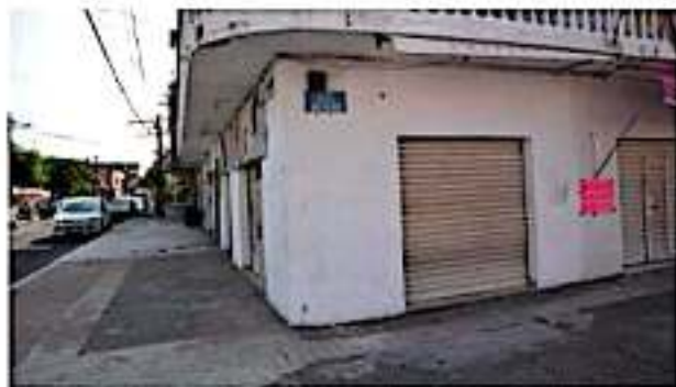
CD. LÁZARO CÁRDENAS, MICH.- El centro de la ciudad atraviesa hoy día por el cierre de espacios comerciales, contrastando con la época dorada en la que en el fondo legal no había espacio para instalar nuevos comercios, hoy día sobran locales que ya no se rentan.