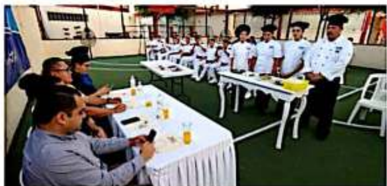
CD. LÁZARO CÁRDENAS, MICH.- La Universidad Vasco de Quiroga culminó con éxito y satisfacción su Concurso "Cocina Mexicana de Autor".