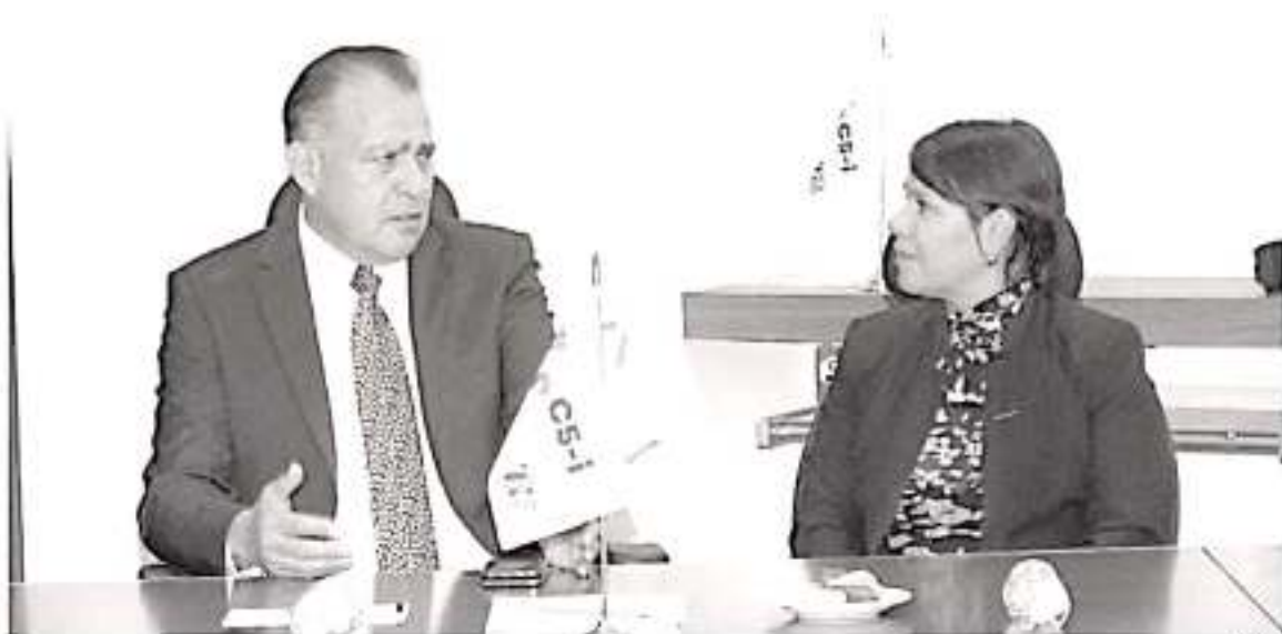
Establece Policía Morelia y SSP estrategia de seguridad diciembre.

cidentes automovilísticos con fatales consecuencias a causa de conductores en estado de ebriedad, por lo cual se prevé operativos de alcoholímetro en diversas punas