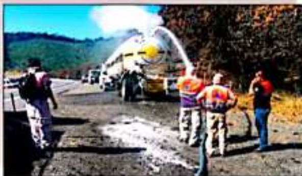
Bajo control derrame de amonico en la Siglo XXI: PC.