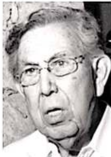
Cuauhtémoc Cárdenas Solórzano.