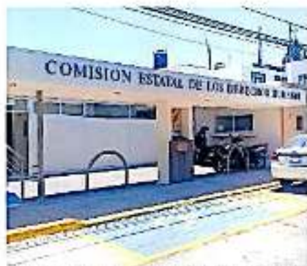
Aún no se tiene fecha para construir la terna que habrá de turnarse al Pleno del Legislativo ANED

"El tema es que los ánimos se han prendido por la falta de respeto entre los propios aspirantes y hacia los diputados" a lo que comentó se les llama o envía mensajes a sus celulares para presionar con respecto a la elección de perfiles para