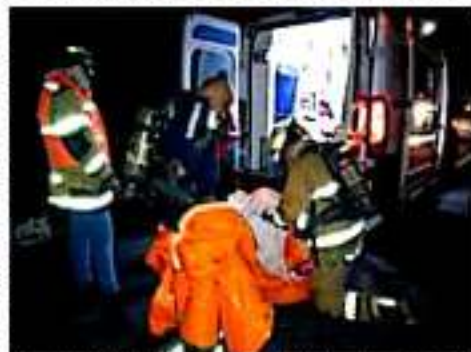
CD. LÁZARO CÁRDENAS, MICH.- El área de Comunicación Social del IMSS, salió a desmentir las acusaciones de usarlos con respecto a que en el IMSS de Lázaro Cárdenas no apoyó a los intoxicados durante el accidente de una pipa que transportaba amoníaco.

Cabe hacer mención que otro de los puntos débiles que dejaron ver durante la contingencia del derrame de amoníaco fue sobre los protocolos de identificación, tanto de las personas fallecidas como de las personas intoxicadas, ya que las redes sociales fueron invadidas por quienes que buscaban lazos familiares que pudieron estar involucrados en dicho acontecimiento, sin embargo, instituciones como el hospital general, no conocían la identidad de algunos afectados, haciendo uso de la misma red social para localizar a los familiares.