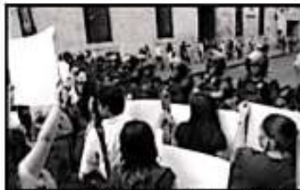
LAS MANIFESTACIONES CONTRA LA VIOLENCIA DE GÉNERO SON CADA VEZ MÁS COMUNES Y NUMEROSAS.

Según se detalló en el informe en el 2016 se cometieron mil 046 homicidios dolosos, en el 2018 fueron mil 125 y en lo que