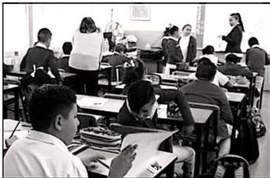
DE ACUERDO CON LA CNTE, SE ESTÁ TRABAJANDO PARA REUBICAR CORRECTAMENTE A LOS PADRES Y A LOS DOCENTES.

Detalló que si bien habían dicho las autoridades que el 6 de diciembre terminaba, consideró