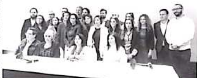
La coalición, integrada por 17 organizaciones internacionales, tachó de irresponsable y peligrosa las descalificaciones hacia la prensa por parte del presidente de la República.

De diciembre a la fecha el presidente ha atacado en al menos 30 ocasiones de manera directa a la prensa durante las conferencias matutinas con frases como "le muerden la mano a quien les quitó el bozal", luego de ser cuestionado sobre el operativo en Cubaán el