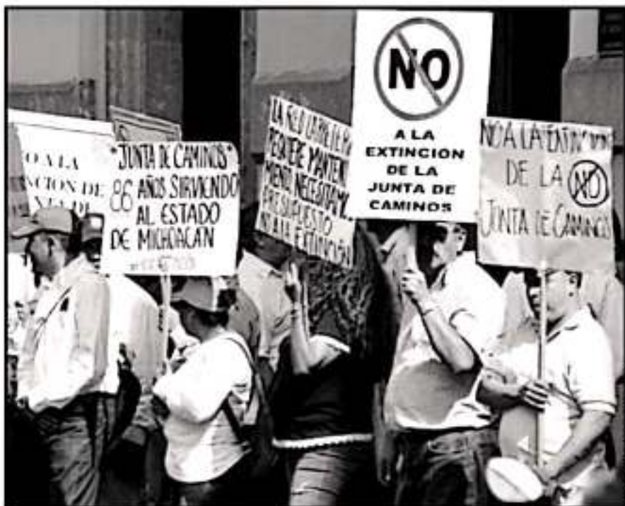
ESTÁ EN DUDA EL FUTURO LABORAL Y EL ADEUDO DE SALARIOS A TRABAJADORES DE LA JUNTA DE CAMINOS

ramos que coadyuven a buscar la ruta y tener una solución que beneficie a todas las partes”.