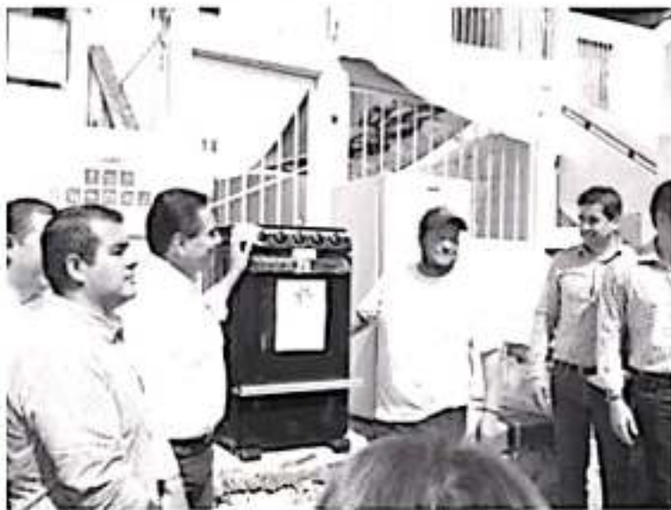
La mayor parte de pérdidas fueron en muebles y enseres de cocina, Aureoles Consejo entregó apoyos a tres familias camas, estufas, refrigeradores, lavadoras y otros electrodomésticos.

H. Zitácuaro Michoacán, 07 de noviembre de 2019.- Por: Guadalupe Solache Rebollo. A casi una semana de la contingencia que se vivió en Zitácuaro, mediante una gira de trabajo por el municipio, el Gobernador del Estado, Silvano Aureoles Conejo recorrió viviendas y sitios afectados por la lluvia atípica del pasado fin de semana.