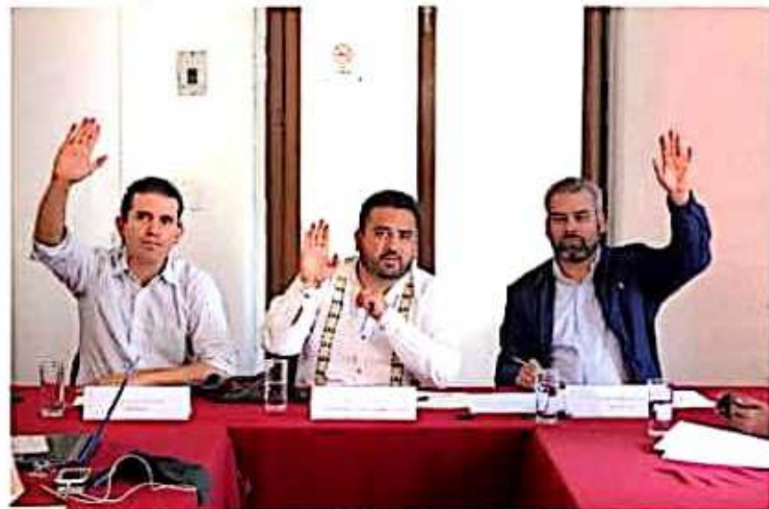
Integrantes de la comisión de Puntos Constitucionales en el Congreso local.

El dictamen aprobado por la Comisión de Puntos Constitucionales, que avala la revocación de mandato y la consulta popular, será sometido a votación del pleno del Congreso del Estado.