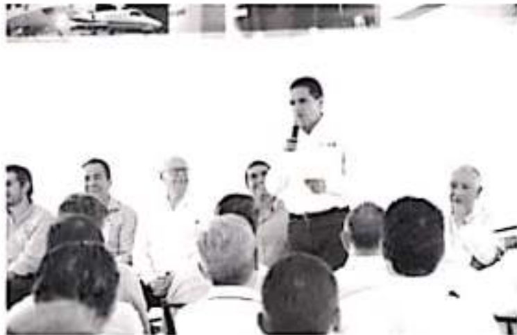
La puesta en marcha de este Agroparque, es el punto de partida en la región para la inversión y exportación de productos michoacanos.

• Es el punto de partida para generar inversión en la región de Zitácuaro, señala