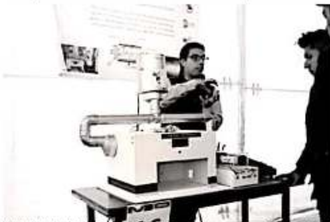
LOS REYES, MICH.- El municipio de Los Reyes se alista para arrancar la primera fase del Noveno Encuentro Estatal de Robótica y Prototipos de Desarrollo Tecnológico 2019-2020