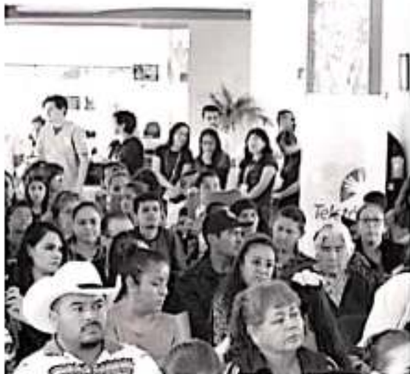
El alcalde capitalino entregó al CRIT Morelia apoyos económicos para que continúe con su labor a este sector vulnerable.

te municipal de Morelia dijo que apoyará siempre a las familias y personas que así lo necesiten por motivo de discapacidad y por ello es que donó al Centro de Rehabilitación Teletón (CRIT) Morelia, cien mil pesos para que continúen con sus actividades en beneficio de 500 menores de edad que asisten diariamente para ser atendidos en dicho espacio.