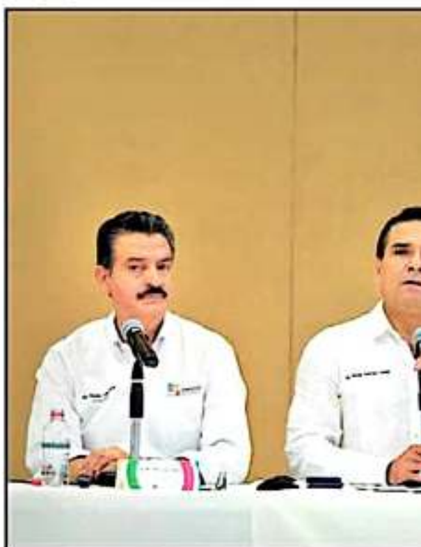
EL GOBERNADOR ENCABEZÓ LA PRESENTACIÓN Y FIRMA DE CONVENIO DEL PROGI

"Vamos a buscar la sustentabilidad de los recursos naturales, debemos seguir siendo un estado mega diverso; sin embargo, hay que reconocer que hay un dete-