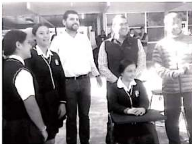
Los alumnos de la Secundaria Federal No. 1, cuentan con 100 butacas nuevas en sus aulas, de forma aleatoria fueron sorteadas entre todos los grupos y los beneficiados fueron los 3º B y E.

H. Zitácuaro Michoacán, 08 de noviembre de 2019. Por: Guadalupe Solache Rebollo. A partir de hoy, los alumnos de la Escuela Secundaria Federal No. 1 Nicolás Romero, cuentan con 100 butacas nuevas en sus aulas, de forma