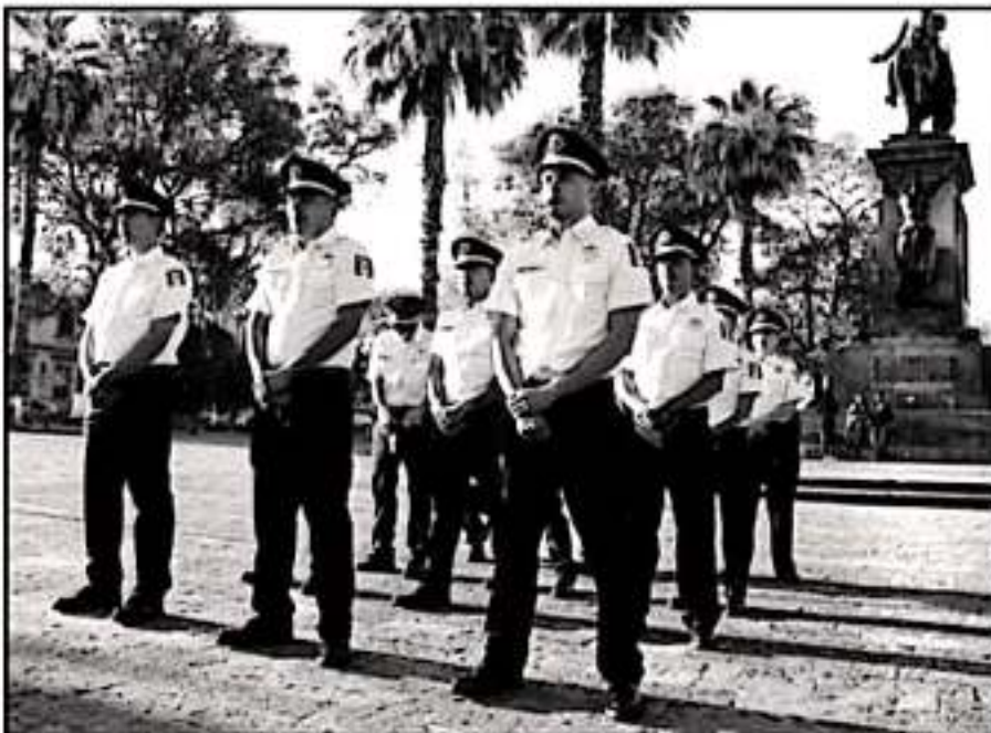
LOS RECORTES AL PRESUPUESTO HAN FRENADO LA INCORPORACIÓN DE ELEMENTOS A LA POLICÍA MUNICIPAL.

curso del Fortaseg para Morelia, una de las políticas de la actual administración federal es la de premiar a quienes cumplen con los lineamientos en el gasto del recurso y disminuir a las demarcaciones que no