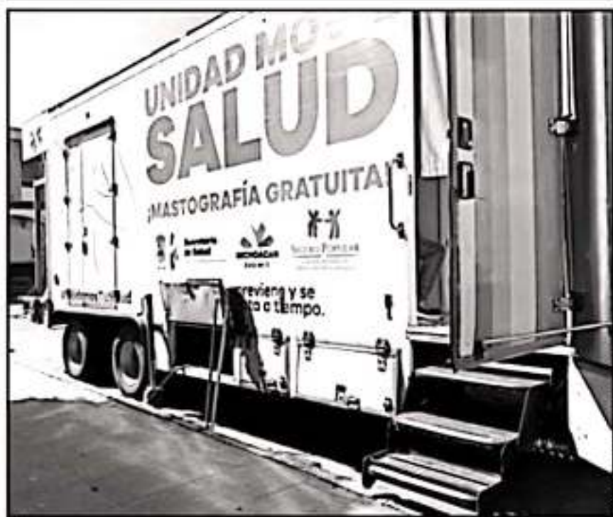
PIDEN A AUTORIDADES DE SALUD PROMOVER CAMPAÑAS EN LA REGIÓN ZAMORA PARA HACERSE MASTOGRAFÍAS

que, técnicamente pone al sector salud en posibilidad de realizar hasta 500 estudios diariamente; de hecho a través de su página oficial, la Secretaría de Salud del Estado, publica de manera periódica los calendarios con las ubicaciones de estas unidades móviles para que quienes deseen asistir puedan hacerlo.