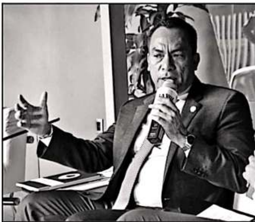
EL FISCAL DE MICHOACÁN ADRIÁN LÓPEZ, DIO QUE HAY MEJORAS EN LA INVESTIGACIÓN DE DELITOS CONTRA MUJERES.

30% CARPETAS de investigación han sido judicializadas