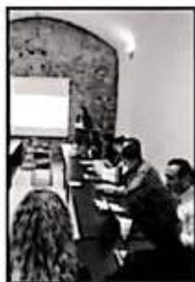
EN LA PIEDAD BUSCAN MEJORAR CONDICIÓN DE PRESAS DEL CERESO