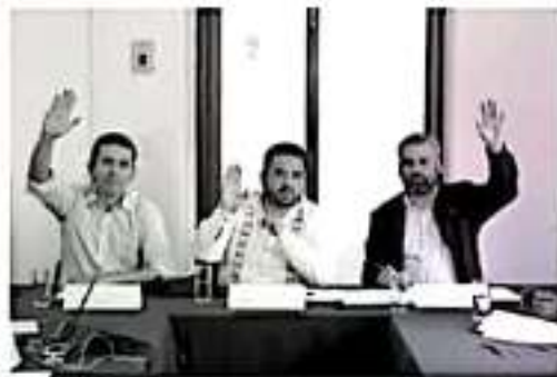
MORELIA, MICH.- La Comisión de Puntos Constitucionales propondrá al pleno de la LXXIV Legislatura un dictamen a favor de la reforma en materia de revocación de mandato y consultas populares.

Estamos en la antesala de un cambio trascendente, ya que de ser promulgada esta reforma, nuestra vida democrática no termina cuando se deposita el voto en la urna, el ciudadano conquista el derecho de sancionar el mal desempeño de los gobernantes, y de hacer valer su opi-