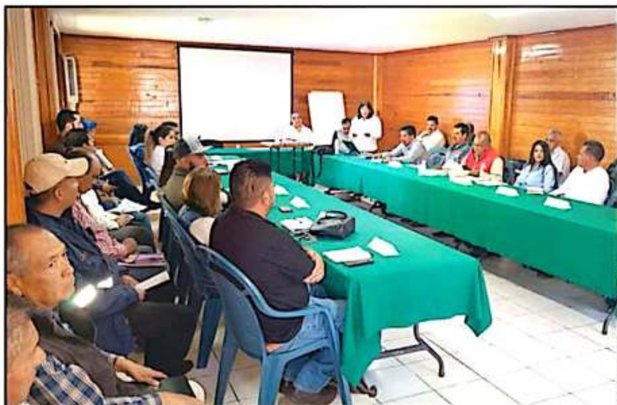
EL CONSEJO REGIONAL FORESTAL DE LA MESA PURÉPECHA ACORDÓ LA RENOVACIÓN DE LOS NUEVE INTEGRANTES DE ESTE ORGANISMO AUXILIAR

Cada consejo representa a un determinado sector de la población, así como de los gobier-