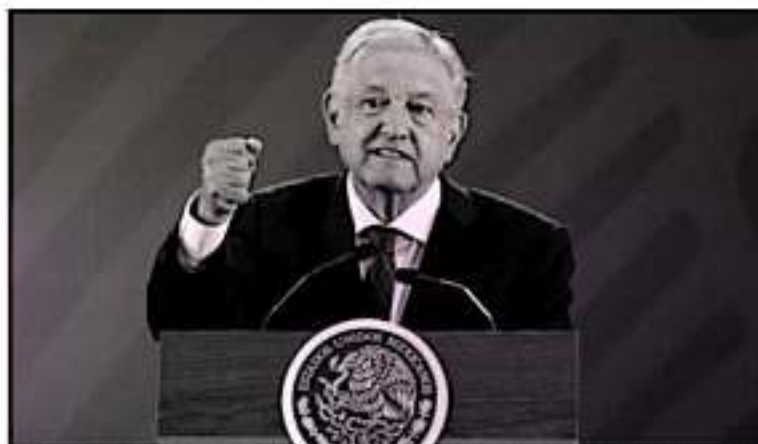
CDMX.- El presidente Andrés Manuel López Obrador confió que con la llegada de Rosario Piedra Ibarra se profundizará en las investigaciones, se acabará con la impunidad y se dará una respuesta a los familiares y a las víctimas.

Añadió que "es normal que los conservadores no quieran que esto suceda quisieran tener a gente disciplinada a modo como ha sucedido en todo el periodo neoliberal, puro especialista doctores graduados en universidades famosas de México y el extranjero, que se distinguen por cobrar bastante por su sinceridad, profesionalismo, tenían que recibir buenos sueldos pero al mismo tiempo siempre guardaban un silencio cómplice enojarían, nada se sabía, a nadie se castigaba ya hemos hablado del tema de que no iba a haber opacidad, ese término tan usual".