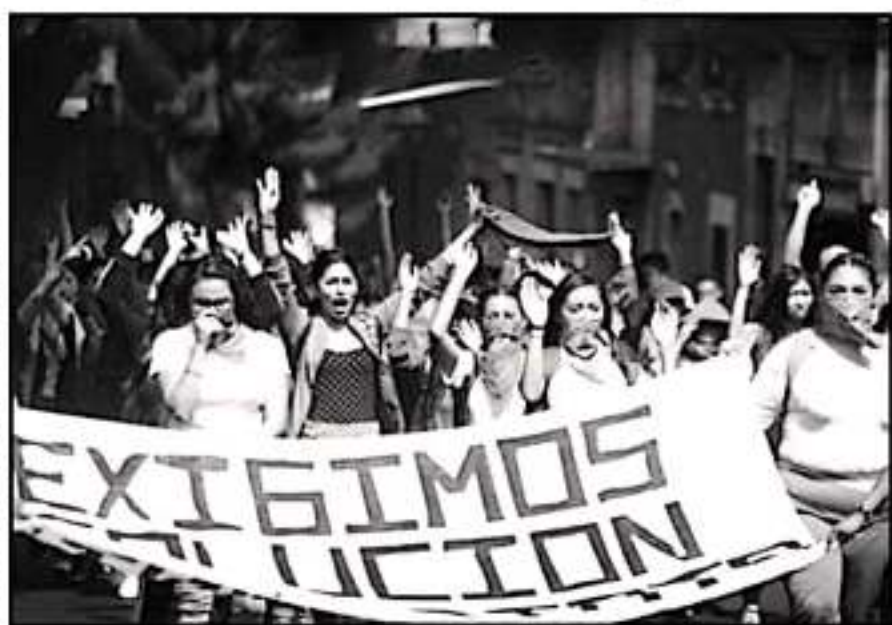
DOCENTES DE TIRIPETIO ACUSAN QUE NORMALISTAS CON USADOS PARA EJERCER PRESION A FAVOR DE OTROS MAESTROS

Agregó que son 16 maestros que definieron salir de la institución temporalmente, para evitar el hostigamiento y pedir la