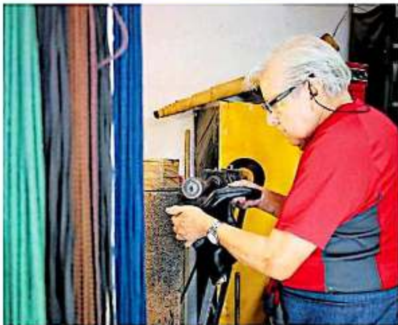
El oficio de zapatero no es nada sencillo: hay que aprender a manejar algunas máquinas

El espacio es pequeño y de casi todas partes cuelgan decenas de agujetas de todos los colores. También hay un letrero con la advertencia de "¡No se fía, mañana tampoco!", cosa que no siempre es cierta, pues tienen tantos clientes a sídus que algunos le pagan después, cuando les cae la quincena. Nada más que, en números, nada que ver con otras épocas. "Es que los zapatos de ahora ya todos son chinos, son sintéticos, desechables, no tienen remedio, no se pueden arreglar". El oficio de zapatero no es nada sencillo. Hay que