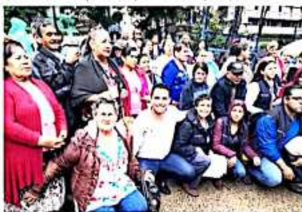
LOS REYES, MICH.- Mañana domingo se llevará a cabo una importante reunión previo al viaje de las "palomas mensajeras" al vecino país del norte.

El funcionario reiteró el agradecimiento al presidente municipal por el decidido respaldo brindado al programa, así como a las propias "palomitas" por la confianza y la espera.