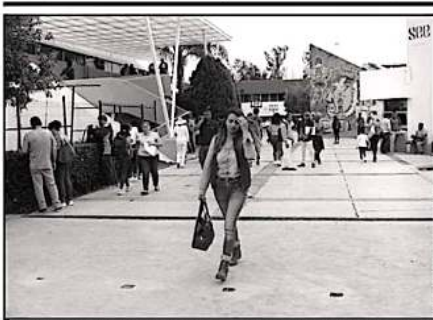
EXHORTAN A LA NUEVA AUTORIDAD EDUCATIVA DEL ESTADO A ESCUCHAR LAS DEMANDAS DE LOS TRABAJADORES

centrales ya se han enfrentado a múltiples diagnósticos desde hace mucho tiempo, a revisiones de la auditoría Superior, tanto federal como estatal, asimismo se les han aplicado medidas a muchos trabajadores que, aunque tenían una irregularidad, como el caso de trabajadores con claves de director realizaron funciones administrativas, estas no son responsabilidad de ellos y en cambio, sí de la autoridad.