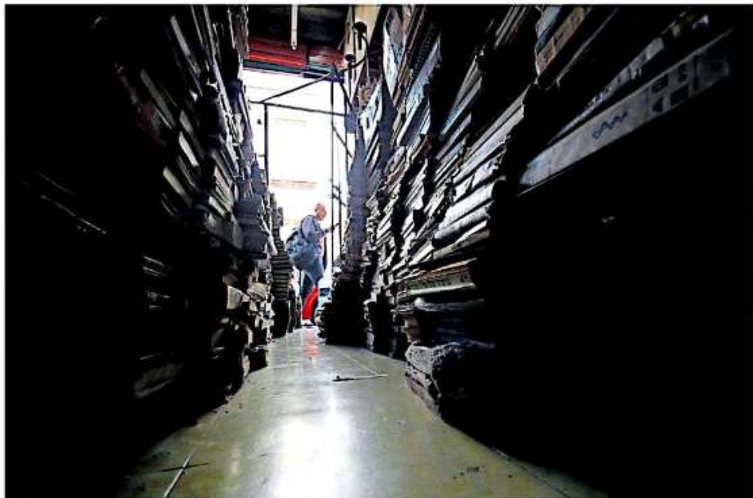
En más de 15 secciones o áreas se encuentran distribuidos los miles de libros.