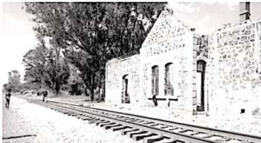
Derivado de la coordinación entre los Gobiernos Estatal y Federal, se trazo una ruta de trabajo con egresados de las diferentes normales.

A pregunta expresa sobre la situación que persiste en Michoacán por esta situación, el presidente descartó se pudiera desalojar a los manifestantes pero dejó en claro que es necesario que actúen de ma-