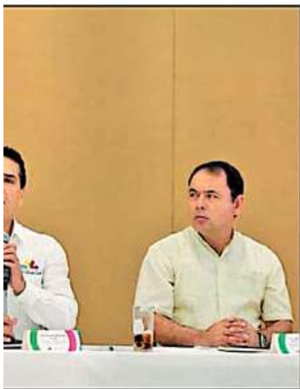
GRAMA DE ORDENAMIENTO ECOLÓGICO TERRITORIAL, EN LÁZARO CÁRDENAS.

mas, en donde todas las voces fueron escuchadas.