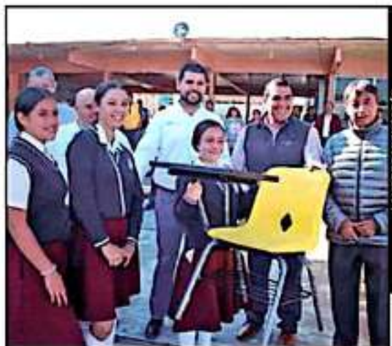
LA VOZ DE MICHOACÁN