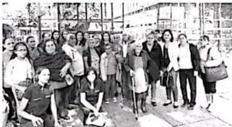
El Gobierno de Silvano Aureoles Conejo, a través de la Secretaría del Migrante (Semigrante), ha realizado este programa en favor de los habitantes de pueblos originarios.