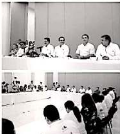
LÁZARO CÁRDENAS, MICH.- En un hecho sin precedentes, el gobernador de Michoacán, Silvano Aureoles Conejo, entregó el Programa de Ordenamiento Ecológico Territorial Regional de Sierra Costa y Local de Lázaro Cárdenas.

El Programa que ha sido respaldado por prestigiosas instituciones de educación como la Universidad Michoacana de San Nicolás de Hidalgo (UMSNH) y que forma parte del Plan de Desarrollo Integral del Estado de Michoacán 2015-2021, tendrá la finalidad de dar solución a los conflictos ambientales; con el propósito de definir y orientar acciones que hagan posible un uso racional del territorio.