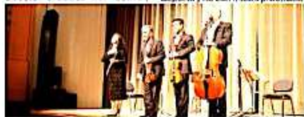
ZAMORA, MICH.- Con magníficas interpretaciones a través de extraordinarios músicos, se realizó el Festival de Música de Zamora en el teatro Obrero.

Ahora enfrentan el reto de mantener este nivel para el próximo festival, el cual será cada año, con el fin de poder crear un público que comience a ver las artes como algo indispensable para sus vidas, es la mejor manera para que la sociedad sane, a través de las artes y el deporte y no con malas prácticas.