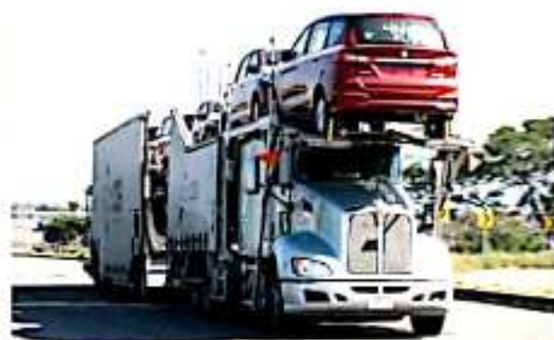
CD. LÁZARO CÁRDENAS, MICH.- La tarde de este viernes se reactivó la logística en el puerto de Lázaro Cárdenas de manera paulatina tras levantamiento de bloqueos a las vías férreas.

estabilidad laboral", manifestó en la grabación. Fue así que, desde las dos de la tarde, en el recinto portuario michoacano se observó el movimiento de los contenedores que, según datos de la Asociación de Industriales del Estado de Michoacán (Aiemac), superaban los 2,200 varados. Así también, retomaron sus corridas habituales las unidades de autoc transporte, dado que por los bloqueos intensificaron sus actividades. Se espera que durante este fin de semana, la veintena de trenes parados con punto de partida y de destino el puerto de Lázaro Cárdenas, puedan mover los materiales e insumos necesarios para distintas actividades productivas. De estas, destaca el suministro de productos a las tiendas de autoservicio y el abastecimiento de combustibles pesado a la refinería de Tula, Hidalgo, por ejemplo.