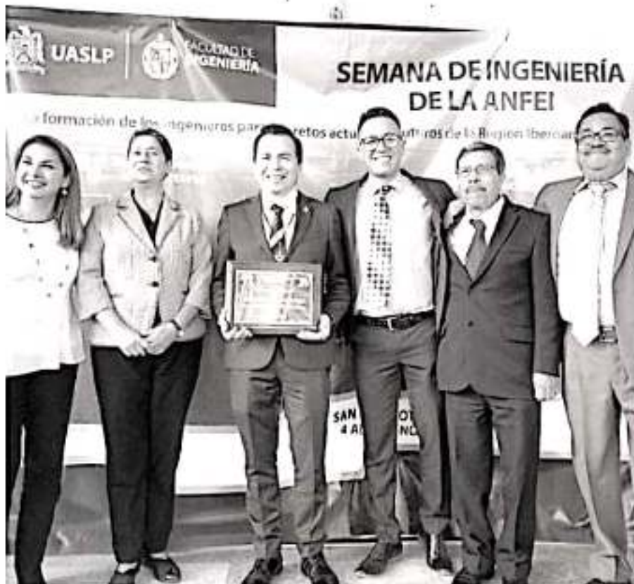
El ITM se convirtió en el primer tecnológico público del país que recibe la distinción de la ANFEI.

La matrícula actual es de 5 mil 957 alumnos entre licenciatura y posgrado, atendidos por un total de 481 trabajadores de base entre docentes y administrativos. El 100 por ciento de los programas acreditables están acreditados por organismos externos en el ámbito nacional y 3 carreras tienen la acreditación en el marco internacional por parte de CACEI. Cabe precisar que en abril de 2018, el ITM obtuvo la recertificación del Sistema de Gestión Integral que lo integran las Normas ISO 9001:2015 e ISO 14001:2015 y en abril del año en curso recibió la auditoría de la casa certificadora.