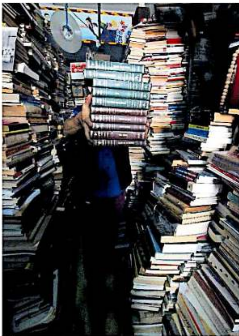
El libro con mayor antigüedad que se encuentra en el recinto data de 1780

"Libros usados: compra y venta" es el desgastado letrero que te da la bienvenida