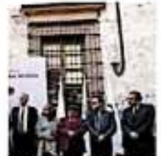
En una primera etapa se restan un millón de pesos, pero cuando se reple. | GORMA

En ese sentido, indicó que mientras en 2018 el gobierno del estado recaudó el 6.9% de su presupuesto global, en 2019 se advierte una recaudación del 6.1%.