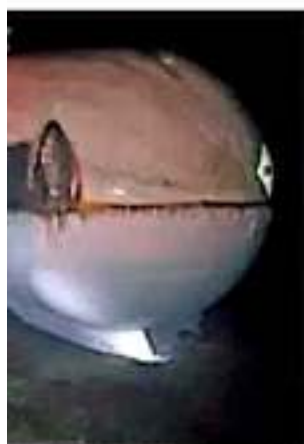
ELLEVARA AMONIACO, FUERON EXCUSA A LA PRESA DE INTERMEDIO.