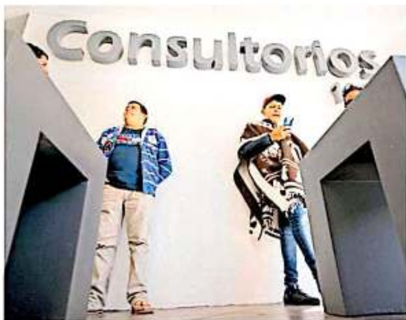
Familiares de personas afectadas por la volcadura de una pipa con amoníaco denuncian que la empresa aseguradora les ha dado largas para atender sus casos.

Conforme a los reportes oficiales, sobre la referida vía de pago, entre las casetas "Las Cañas" hasta la de Felicitano, se registró la volcadura de dicha unidad de carga, la cual de primer momento dejó a cuatro personas fallecidas, y al momento suman 12 personas heridas, las cuales fac-