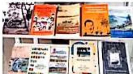
CD. LÁZARO CÁRDENAS, MICH.- La administración municipal implementa el programa "Historia de tu región", el cual tiene como objetivo promover la historia tanto del municipio como de la comunidad, a fin de crear una identidad entre la ciudadanía.

Peraldí Sotelo invitó por último a la población a acudir a las bibliotecas para que puedan conocer la historia del municipio y de su comunidad, así como a donar libros de autores locales y de historia de la región.