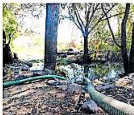
En 1983, el plan de desarrollo urbano marcaba 25 mil hectáreas de reserva ecológica.