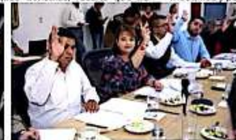
URUAPAN, MICH.- Obras importantes para el desarrollo urbano del municipio, fueron aprobadas en sesión de cabildo.