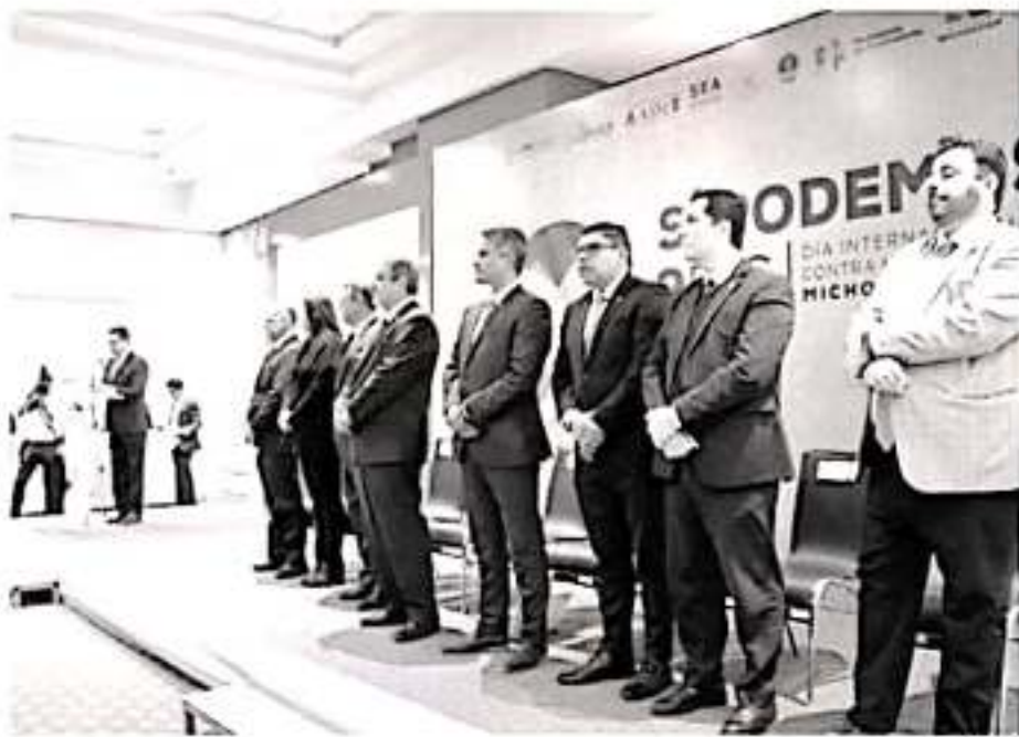
Al inaugurar la Jornada del Día Internacional Contra la Corrupción, Silvano Aureoles pidió a funcionarios presentes fortalecer las herramientas y mecanismos para combatir de manera integral la corrupción.

Al inaugurar la Jornada del Día Internacional Contra la Corrupción, Silvano Aureoles pidió