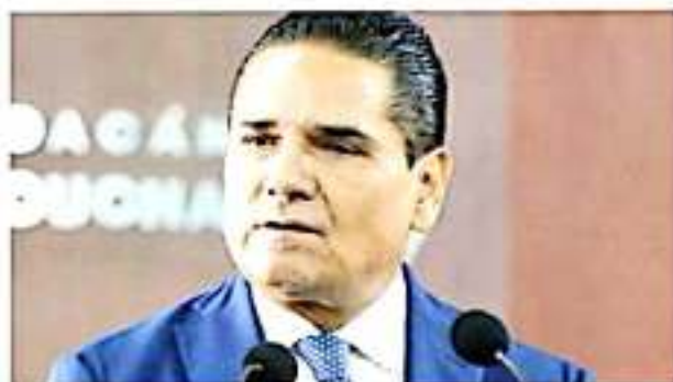
MORELIA, MICH.- Cifras del INEGI reflejan una reducción del 10% en la tasa de incidencia de corrupción en el estado, dijo el gobernador Silvano Aureoles Conejo.