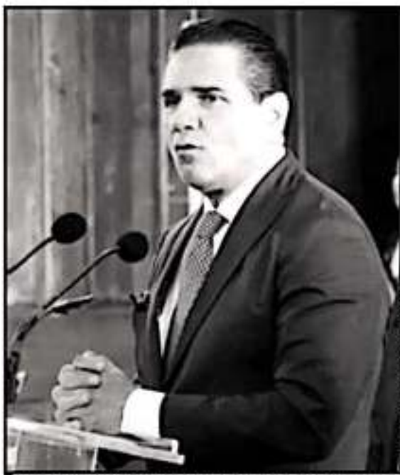
EL GOBERNADOR SEÑALÓ QUE EN LO QUE VA DEL AÑO SE HA INHABILITADO A 487 EXFUNCIONARIOS POR POSIBLES ACTOS DE CORRUPCIÓN.

Además, se modificaron cinco leyes para la creación e instalación del Sistema Estatal Anticorrupción