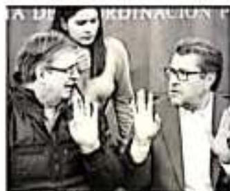
El secretario de Relaciones Exteriores, Marcelo Ebrard Casaubon, y el coordinador de Morena en el Senado, Ricardo Monreal Ávila, entre otros, tras la reunión sobre las negociaciones del T-MEC.

En una reunión en el Senado, Ebrard Casaubon destacó que se trató de la primera vez que la Cancillería realiza una consulta con legisladores para un tratado de la dimensión del T-MEC, y se hizo, dijo, porque "estamos en las horas decisivas" y porque se pidió conocer los detalles. El líder de los senadores de Morena, Ricardo Monreal, dijo por su parte: "Nos llena de optimismo, no desbordado, pero sí razonado", aunque el negociador del T-MEC, Jesús Seade, expresó "detalles de dificultad en la negociación".