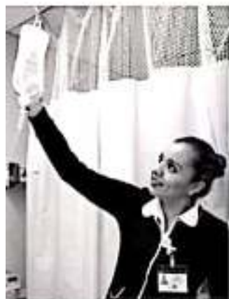
□ Catorce pacientes ya fueron dados de alta; hoy ocho más en hospitales