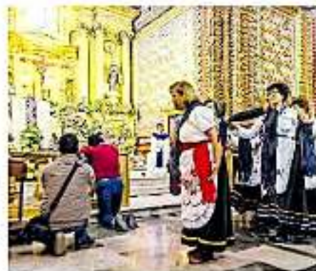
Algunos devotos visitan con trajes de manta y arrendos típicos de las comunidades indígenas.