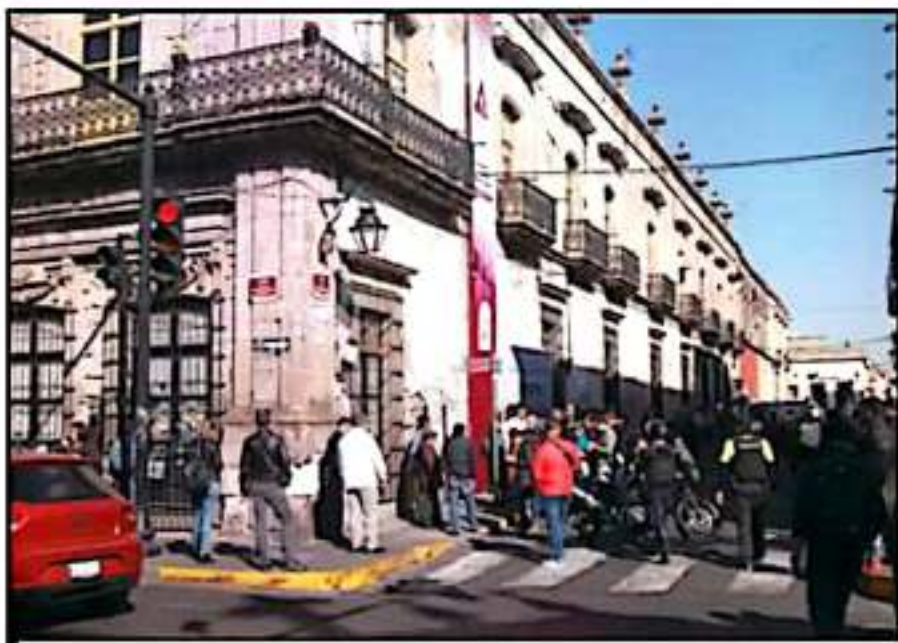
LA FACHADA DEL EDIFICIO, QUE ES SEDE DE OFICINAS DEL MAGISTERIO EDUCATIVO, YA ESTÁ SEVERAMENTE DAÑADA.

edificio, sobre el cual se aplicará una inversión millonaria, sale de las competencias directas del Ayuntamiento de Morelia.