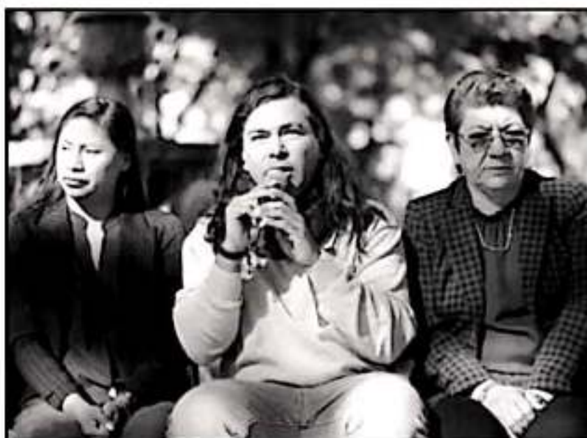
INTEGRANTES DE MORENA ASEGURAN QUE SE ACABARON LOS MOCHES Y MINIMIZAN RECORTES FEDERALES DE LA FT

maestras: en economía, sociología y derecho fiscal, así como con doctorado en gestión estratégica.