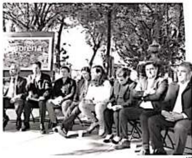
Rueda de prensa de legisladores de la coalición Juntos Haremos Historia.

Los diputados federales aseveran que el Presupuesto de Egresos de la Federación 2020 fue aprobado de manera responsable; destacan que la entidad recibirá dos mil 149 millones de pesos más respecto al 2019