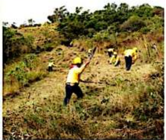
URUAPAN, MICH.- Una temporada de estiaje complicada se espera, por lo que las acciones preventivas deben iniciarse lo antes posible.

Con ello darán cumplimiento a una de las celebraciones más difundidas en nuestro país.