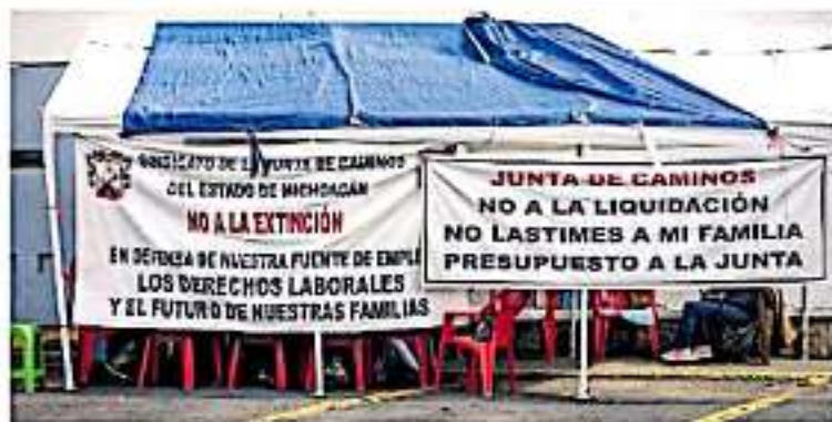
La extinción de dicha dependencia se llevó a cabo por el Ejecutivo estatal. Arriaga

En el tradicional encuentro con los medios de comunicación de cada lunes el gobernador aseguró que todos los trabajadores afectados con la eliminación de áreas han sido reubicados y en el caso de la Junta de Caminos de Michoacán dijo: “Los derechos de los trabajadores están a salvo, pero el tema que no tiene mayor