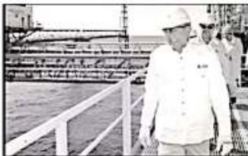
El presidente Andrés Manuel López Obrador durante su último recorrido en campos petroleros de Campeche.

Romero Oropeza dijo que la zona en el litoral Campeche produce un millón de barriles de petróleo diario, por eso su importancia.