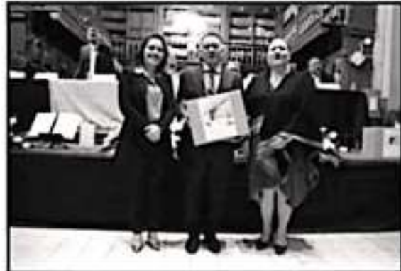
DIPLUTADOS COINCIDEN EN QUE LA DISCAPACIDAD VISUAL NO DEBE SER UNA LIMITANTE PARA HACER VALER LOS DERECHOS DE LA CIUDADANÍA.

"Las personas con discapacidad visual, entre las que me incluyo, se enfrentan a complicaciones al momento de hacer valer sus derechos; por ello es importante que trabajemos en su inclusión, donde no se descarte la utilización del sistema braille para ampliar el espectro de interpretación de nuestro marco constitucional", enfatizó el diputado emanado de Morena.