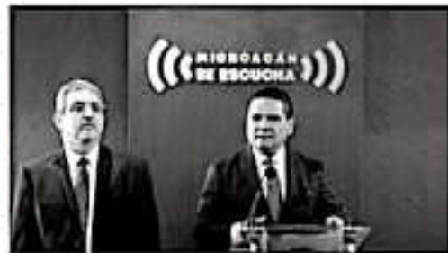
MORELIA, MICH.- El gobernador del estado, Silvano Aureoles Conejo, y el titular de la Secretaría de Contraloría del Estado de Michoacán (Secoem), Francisco Huergo Maurín.

tema Estatal Anticorrupción y se simplificaron trámites que alentaban a proceso y daban margen a actos de corrupción, rubro en el que el estado pasó del lugar 30 al 17 en el ranking nacional. Aureoles Conejo refirió que hoy Michoacán es de los estados más auditados por la federación y que ese conjunto de medidas y resultados han contribuido a que la entidad mejore su posición en el Semáforo del Sistema de Alertas de la Secretaría de Hacienda y Crédito Público, así como ante calificadores internacionales.