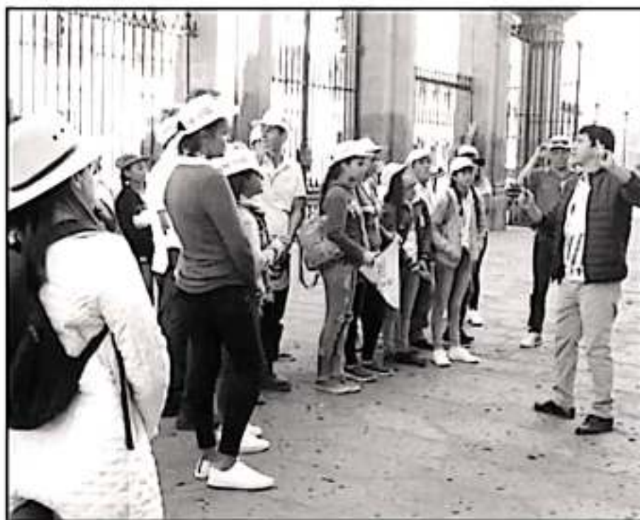
ALUMNOS DEL CEBA EN LA MIRA, LÁZARO CÁRDENAS, VISITARON MORELIA CON APOYO DE LA FUNDACIÓN MERZA.

"La misión es atender el rezago educativo, alfabetización, primaria y secundaria; nuestra