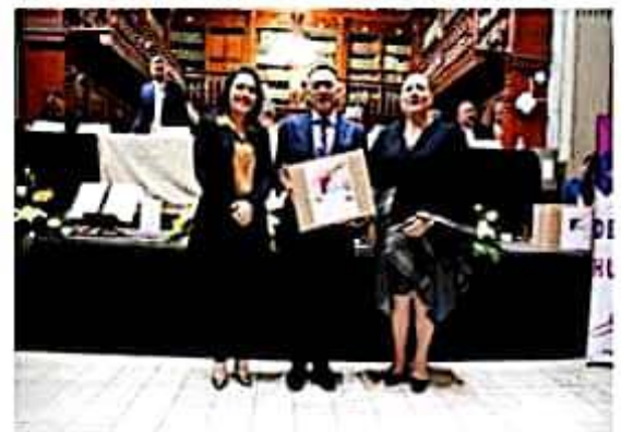
Recibe Congreso Ley de Transparencia, Acceso a la Información Pública y Protección de Datos Personales del Estado, en sistema braille.

Apuntó que México y en particular Michoacán ya no pueden permitirse determinaciones que partan del calzador o la improvisación, pues ha quedado demostrado en caso como el de la designación de la presidenta de la Comisión Nacional de Derechos Humanos, que éstas sólo laceran y vulneran la fortaleza institucional, cosa que en nuestro estado no se puede permitir.