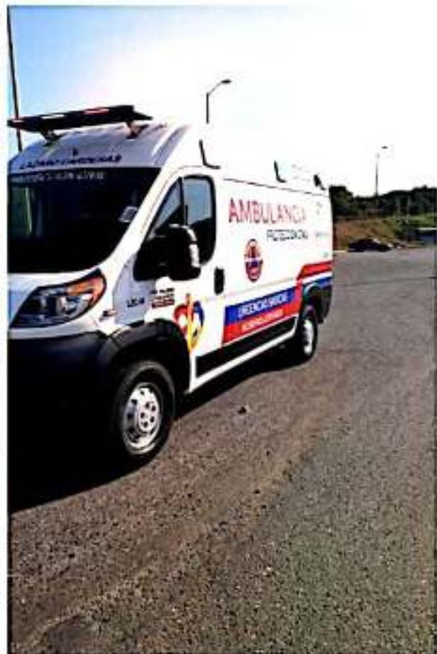
CD. LÁZARO CÁRDENAS, MICH.- Elementos de Protección Civil Municipal trasladaron ayer por la tarde a Morelia dos de las personas intoxicadas por la fuga de amoníaco.