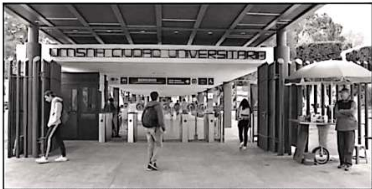
RECTORÍA PRETENDE EL APOYO DE SINDICATOS PARA ACCEDER A RECURSO Y QUE NO PELIGRE EL CICLO ESCOLAR, YA DIALOGAN CON DIRIGENCIA DEL SPUM

a nivel nacional con problemas financieros