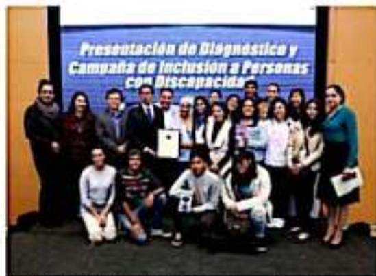
URUAPAN, MICH.- La Secretaría de Perspectiva de Género e Inclusión, presentó el Diagnóstico y la Campaña de Inclusión "Somos un mismo Corazón", trabajo realizado en colaboración por la Universidad Don Vasco (UDV) y la Universidad Latina de América (UNLA).