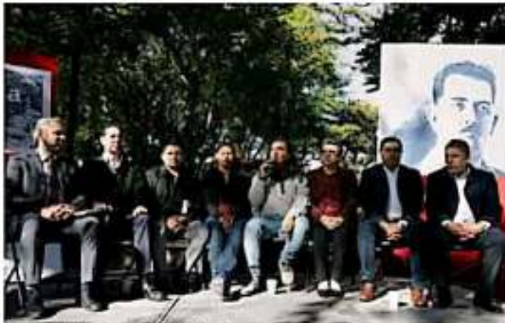
Asesores que desde su llegada han buscado la forma de traer más recursos.