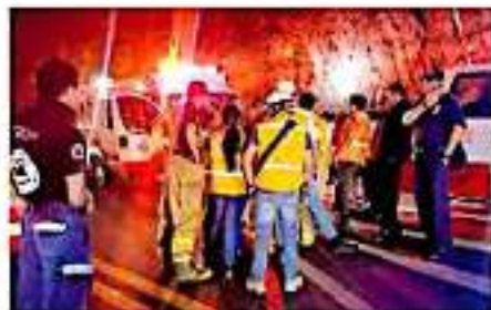
Todavía hay varias personas hospitalizadas.

A través de un comunicado, la Secretaría de Salud de Michoacán (SSM) informó que de las 21 personas expuestas al amoníaco por el derrame que se presentó el viernes sobre la autopista Siglo XXI, la mayoría da-