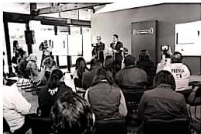
MORELIA, MICH.- Aureoles Conejo refirió que hoy, Michoacán es de los estados más auditados por la federación y que ese conjunto de medidas y resultados han contribuido a que la entidad mejore.

Aureoles Conejo refirió que hoy, Michoacán es de los estados más auditados por la federación y que ese conjunto de medidas y resultados han contribuido a que la entidad mejore su posición en el Semáforo del Sistema de Alertas de la Secretaría de Hacienda y Crédito Público, así como ante calificadoras internacionales.