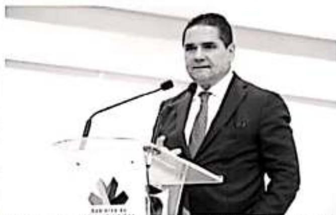
MORELIA, MICH.- El Gobernador de Michoacán, Silvano Aureoles Conejo, refrendó su compromiso y apoyo a las instituciones y sus mecanismos para seguir frenando el problema de la corrupción.