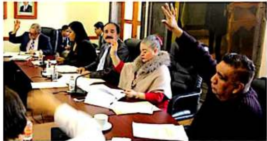
ZAMORA, MICH.- El alcalde explicó que en la elaboración inicial de este plan se vislumbraba una perspectiva distinta, de mayores recursos.