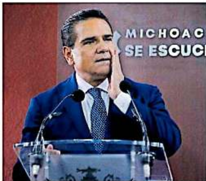
El gobernador aseguró que Michoacán pasó del último al lugar 17 del ranking nacional por simplificación administrativa.