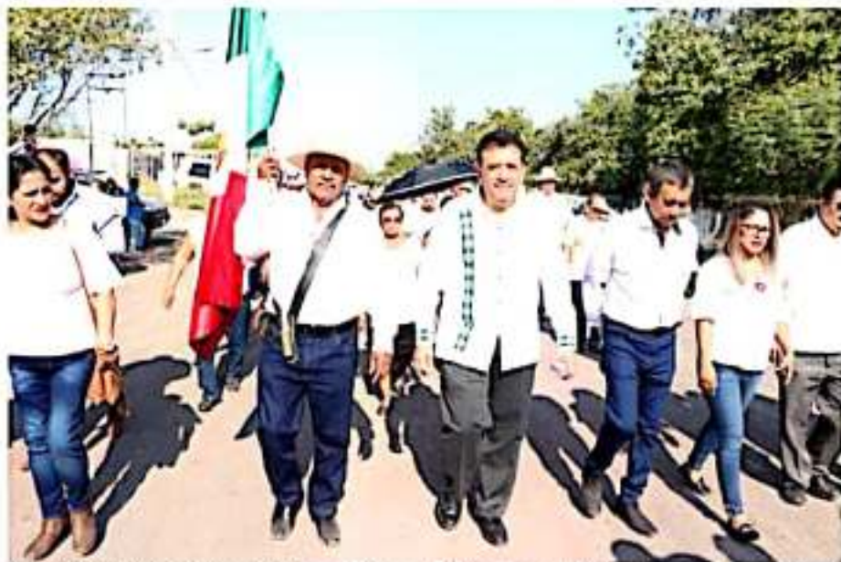
APATZINGÁN, MICH.- Ante los estudiantes, maestros y ejidatarios, expuso que la Secretaría de Comunicaciones y Transportes (SCT) ya autorizó la segunda etapa de la obra.

Cabe destacar que al término del acto protocolario, el presidente encabezó el desfile por la comunidad, en el que participaron varias instituciones de nivel preescolar, primaria, secundaria y telebachillerato.