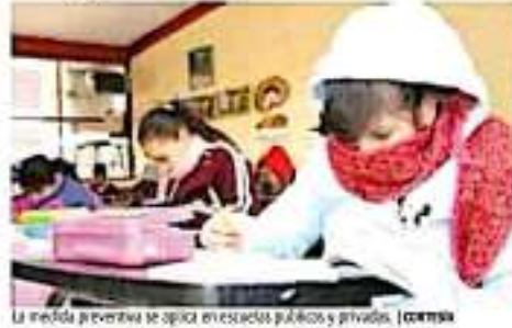
La medida preventiva se aplica en escuelas públicas y privadas. | GORMA

Además, en la circular girada a los planteles educativos se pide reactivar la instalación de filtros escolares, consistentes en cuidar que los estudiantes que presentan síntomas de enfermedad respiratoria acudan al médico y no entren en contacto con otros estudiantes para evitar el riesgo de contagio y disminuir la morbilidad por las infecciones respiratorias agudas. | GORMA