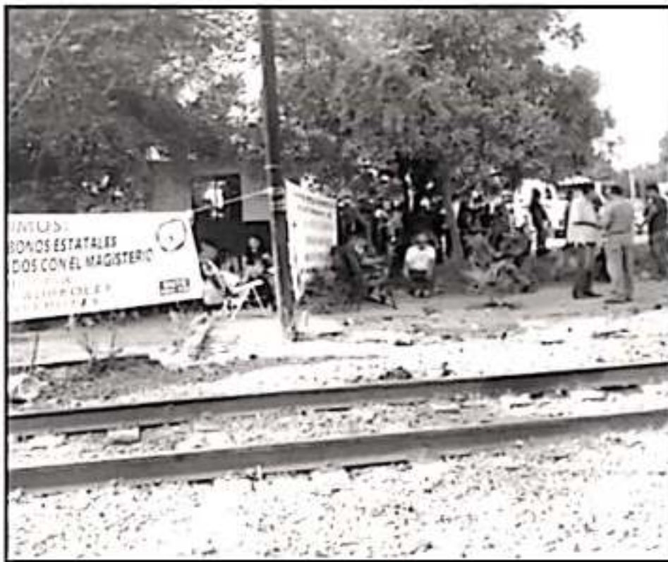
LAS VÍAS DEL TREN CONSTANTEMENTE SON TOMADAS PARA EJERCER PRESIÓN A LAS AUTORIDADES EDUCATIVAS.