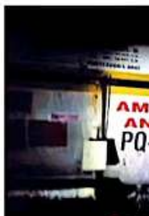
ASEGURAN AUTORIDADES DE MICHOACÁN QUE TRANSPORTABA EL MATERIAL PELIGROSO

el pasado viernes, a las 7:00 de la tarde, en la Autopista Siglo XXI, cuando una pipa que transportaba amoníaco se volcó y dejó expuesta a una unidad que trasladaba pacientes con dirección a Michoacán. En el acto, 4 personas murieron y otras 22 quedaron heridas debido a intoxicación. En el transcurso de las primeras 72 horas falleció otra menor que se había reportado como estable y dos personas más, sumando al inicio de la semana un total de 7 fallecidos en el trágico accidente.