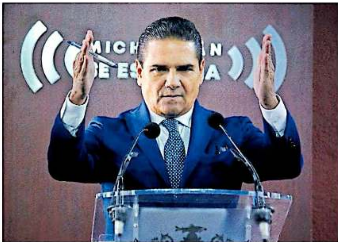
Los estados subestiman los ingresos y la administración pública estatal gasta más de lo etiquetado.