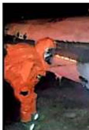
TRAS LA VOLCADURA DE LA PIPA QUE DEJÓ LAS TRES COMUNIDADES ALEDAÑAS

La lista de fallecidos sigue creciendo con el paso de los días. Fue