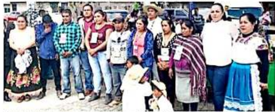
LOS REYES, MICH.- Se integraron comités del programa "La Escuela Es Nuestra", en instituciones educativas de diferentes comunidades del municipio.

El programa educativo "La Escuela es Nuestra", coordinado por la Secretaría de Educación Pública promueve la participación de la comunidad escolar guardando los valores éticos del pueblo mexicano, sus capacidades y habilidades para dignificar los espacios escolares en los que los niños, niñas y jóvenes reciben educación.