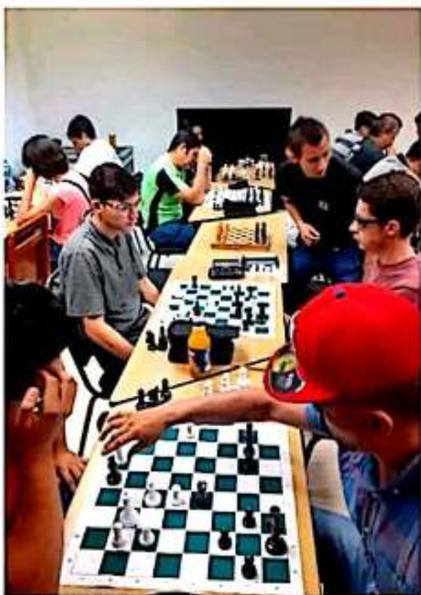
CD. LAZARO CÁRDENAS, MICH.- El pasado fin de semana se llevó a cabo el torneo "Ajedrez en tu Biblioteca", el cual contó con la participación de 50