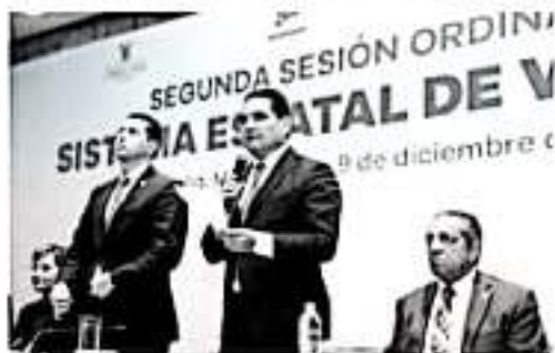
MORELIA, MICH.- El Gobernador de Michoacán, Silvano Aureoles Conejo celebró la construcción de una base institucional sólida y con capacidad para la atención y la protección de las víctimas en el estado.

"Necesitamos más ciudadanos participando cerca del Sistema Estatal Anticorrupción, más instituciones académicas que estudien el fenómeno, más autonomía, para sancionar a los responsables, este debe ser un día para ocuparnos y generar energías", concluyó.