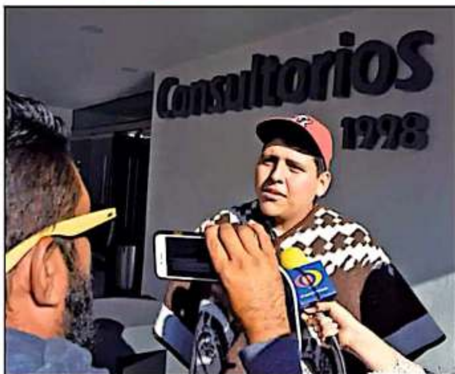
DE LAS TRES ASEGURADORAS NO SE HACE UNA; ADICION FAMILIARES DE HERIDOS Y ENGEN QUE CUBRAN GASTOS MÉDICOS

familiares de las víctimas contra las empresas aseguradoras.