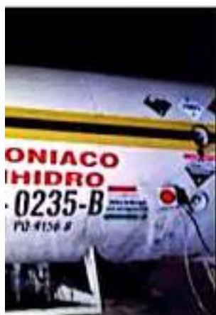
CÓMO VAN A BUSCAR A LA EMPRESA GRUPO EN TORRÓN, COAHUILA.