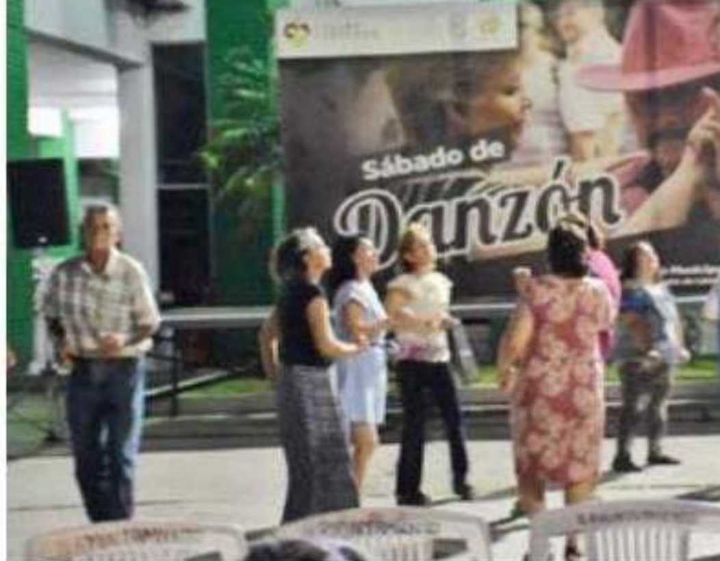
Este día en la explanada municipal se reanudan los Sábados de Danzón.

Recordó la funcionaria que, debido a las fiestas decembrinas, se suspendió este evento que en cada edición cuenta con la asistencia de un gran número de parejas que muestran sus mejores pasos de baile.