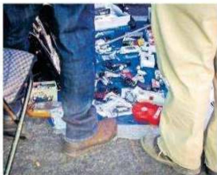
Cada domingo las uniones realizan el reparto de espacios hasta las 8:00 horas