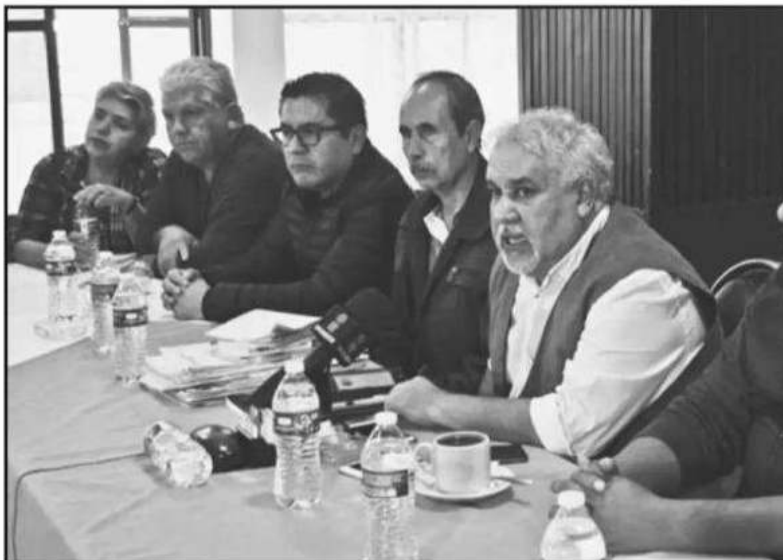
EL LÍDER DEL SUEUM ANUNCIÓ QUE SE REUNIRÁ CON EL SUBSECRETARIO DE EDUCACIÓN, AUNQUE MANTIENE LA NEGATIVA A

Considero injusto que los trabajadores padezcan la falta de sus pagos por la cerrazón del liderazgo del SUEUM y que de igual forma respetaba las decisiones de dicho sindicato, pero el ir a huelga no resolverá nada de lo que es un problema