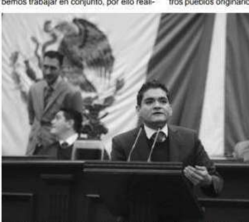
MORELIA, MICH.- El vicecoordinador del grupo parlamentario de Acción Nacional, quien dijo que la creación de la Ley será en conjunto con las comunidades indígenas y que cuenta sus puntos de vista

Finalizó al recordar que por ésta y algu- nas otras irregularidades más que se de- tectaron en las leyes de Ingresos y Egresos de Michoacán, la bancada de Morena está por promover una acción de inconstitucionalidad para ponerle freno a los impuestos y deuda que se le aproba- ron al Ejecutivo estatal para este ejerci- cio fiscal de 2020.