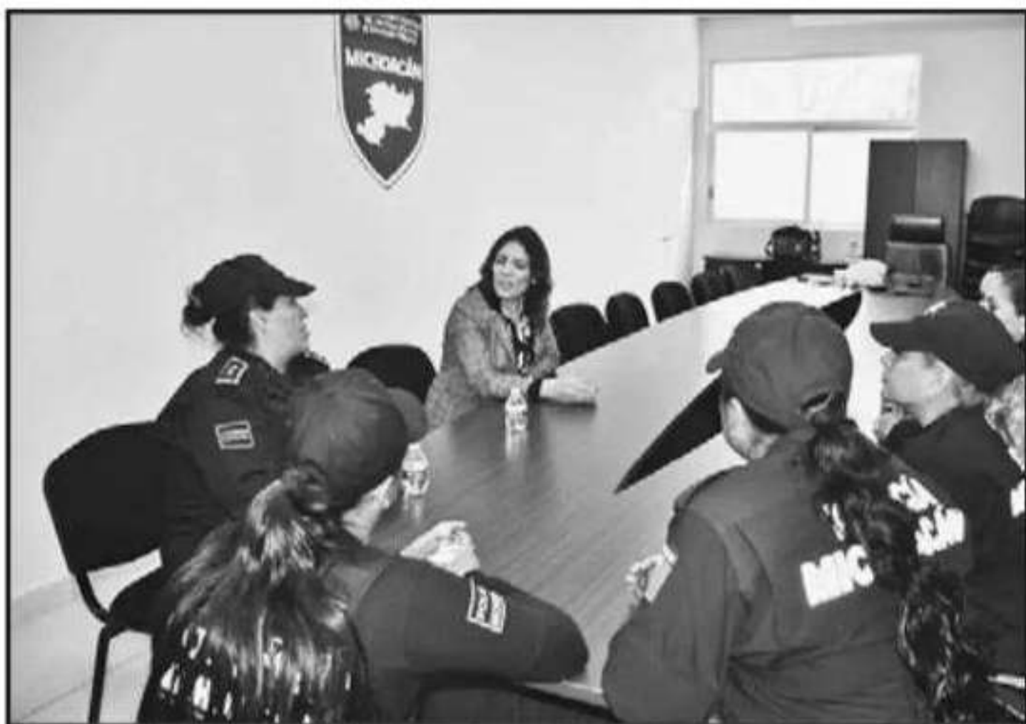
A TRAVÉS DE LA CONCIENTIZACIÓN, INVITAN A MUJERES POLICÍAS A REALIZARSE ESTUDIOS DE PREVENCIÓN.

nas de pacientes que asisten día con día a realizarse estudios para detección del cáncer.