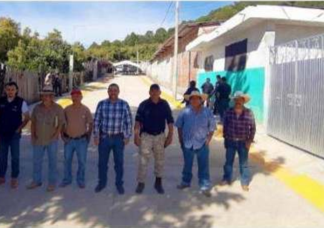
MICH.- Se inauguró la pavimentación de la calle Rosendo Madrigal de esta