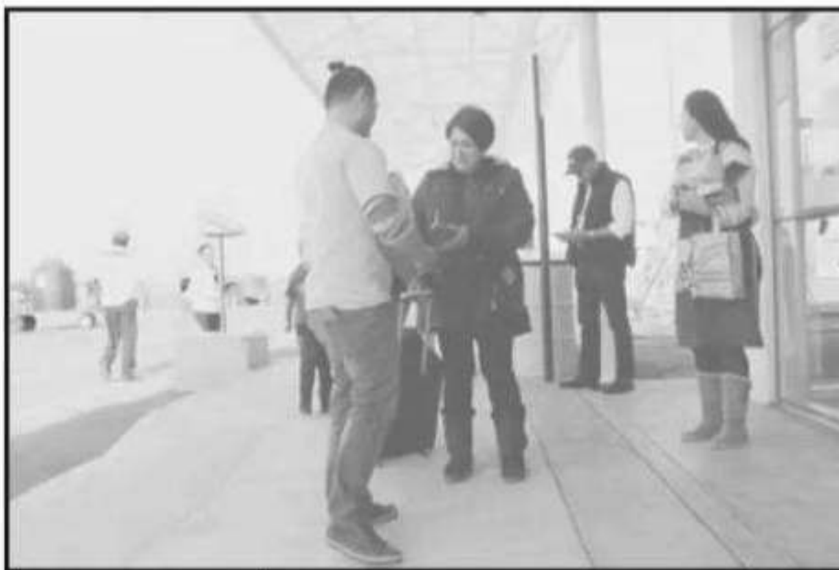
EN EL 2019 SE INCREMENTÓ EL ARRIBO DE LOS TURISTAS NACIONALES Y EXTRANJEROS AL AIM.

el año pasado de entre las catorce terminales de este tipo que administra de forma concesionada, incluyendo las de Montego Bay y Kingston, en Jamaica.