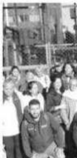
CIUDAD DE MEXICO. integrantes del programa "Palomas Mensajeras" los lineamientos que les permitirá viajar a Carolina del Norte a reencontrarse con sus seres queridos.

En los próximos 15 días, las 136 personas recibirán el documento que les permitirá viajar, a 124 de ellos, a California y a 14 a Carolina del Norte, donde se