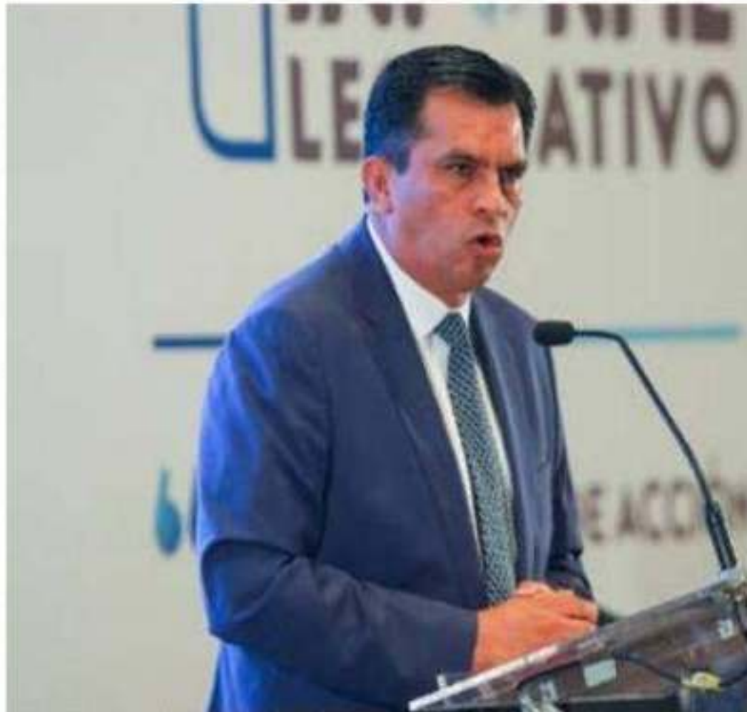
Es necesario corregir el rumbo de la política fiscal federal para reactivar econo

"Acción Nacional, desde el sexenio pasado, fijó su postura en contra de la reforma fiscal del 2013, la cual persiste vigente en el gobierno del presidente López Obrador. Es urgente terminar con el alto