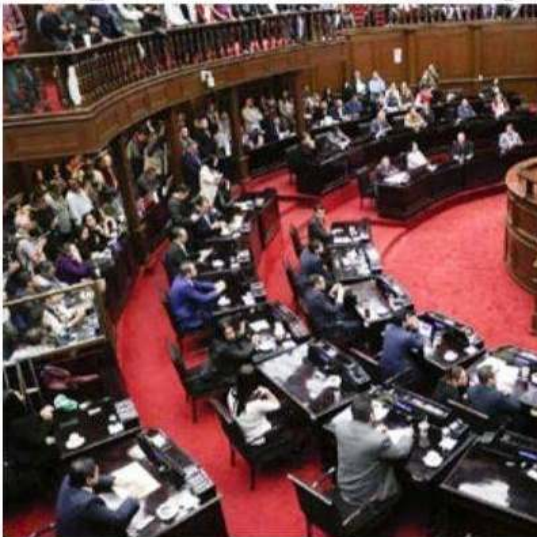
La 74 legislatura de Michoacán comprometida con la legalidad y el respeto