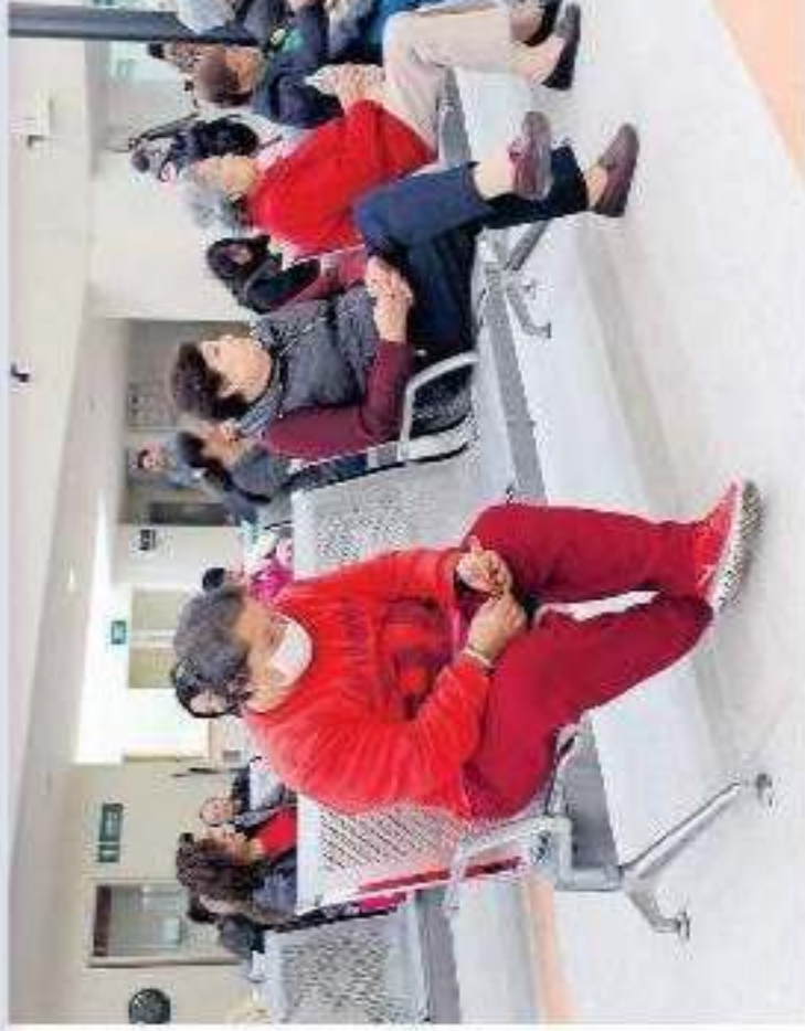
El grupo poblacional con mayor incidencia es a partir de los 40 años de edad.

La nutrióloga Paredes Nata reconoció que, tras el aumento de peso que se refleja después de estas tradicionales ce-