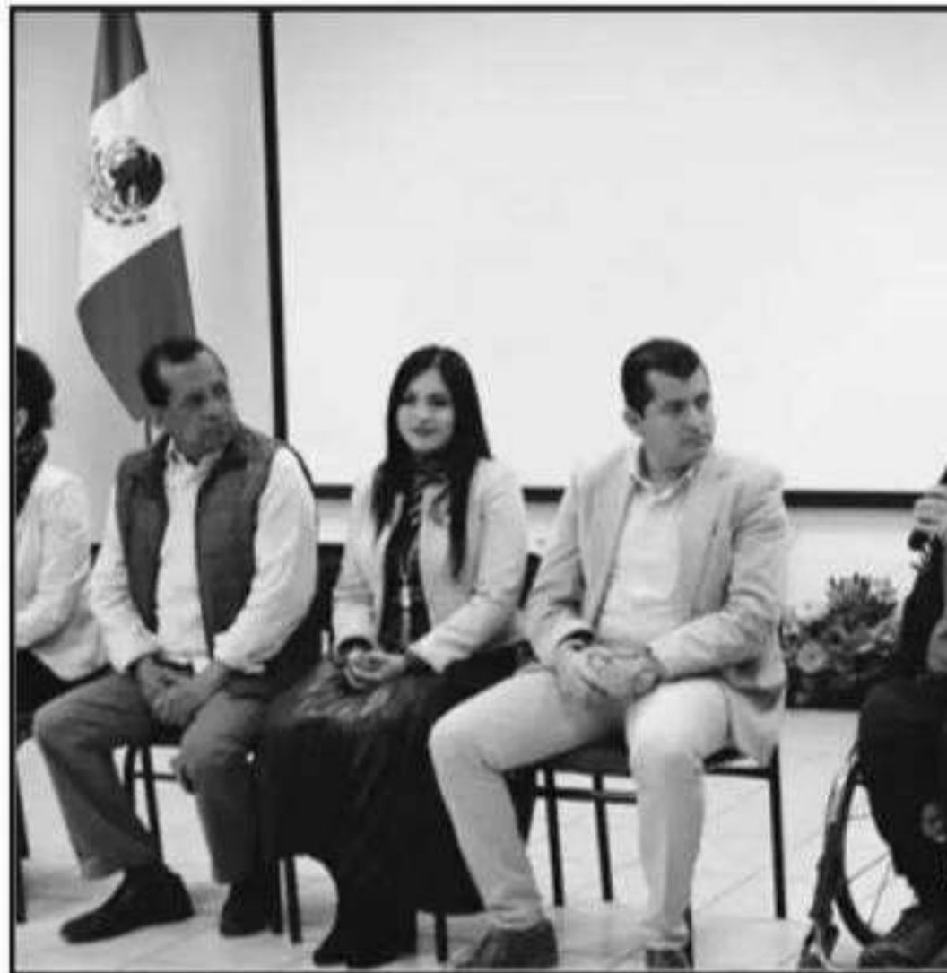
LOS BENEFICIADOS AGRADECIERON Y RECONOCIERON EL TRABAJO DE LAS AUTORIDADES

De igual manera hizo una in- vitación a los diferentes sectores de la sociedad civil y privada para participar y buscar la igual- dad de oportunidades para jun- tos hacer cosas extraordinarias en favor de quien así lo requiera.