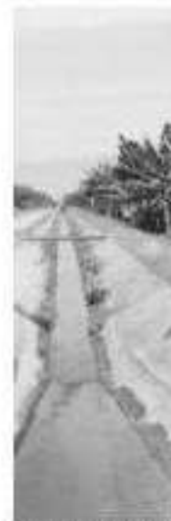
NUEVA ITALIA zación y tecn Cupatitzio Ca ció el diputa Anguiano.