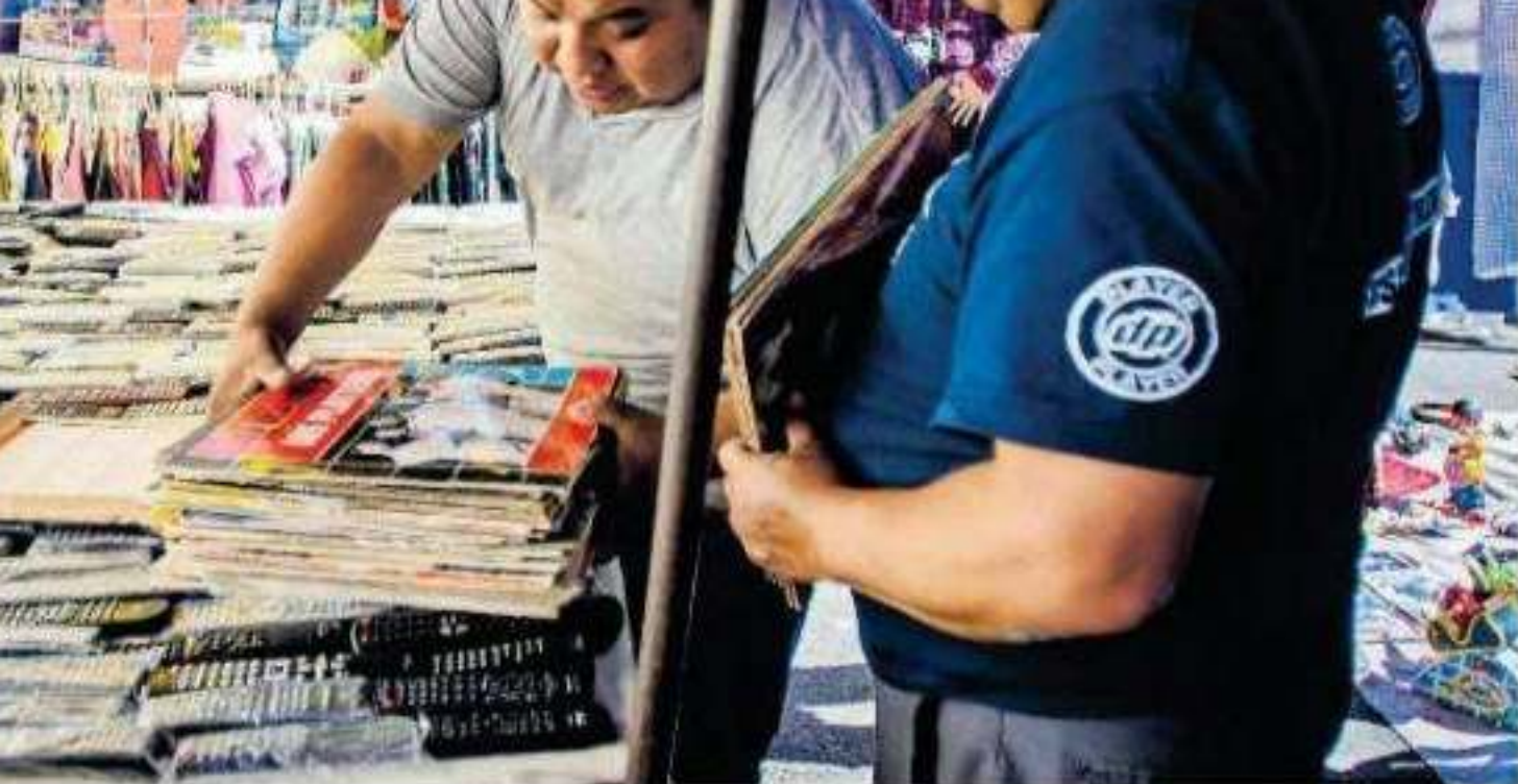
adados en los llamados LP's, también se pueden hallar en sus locales