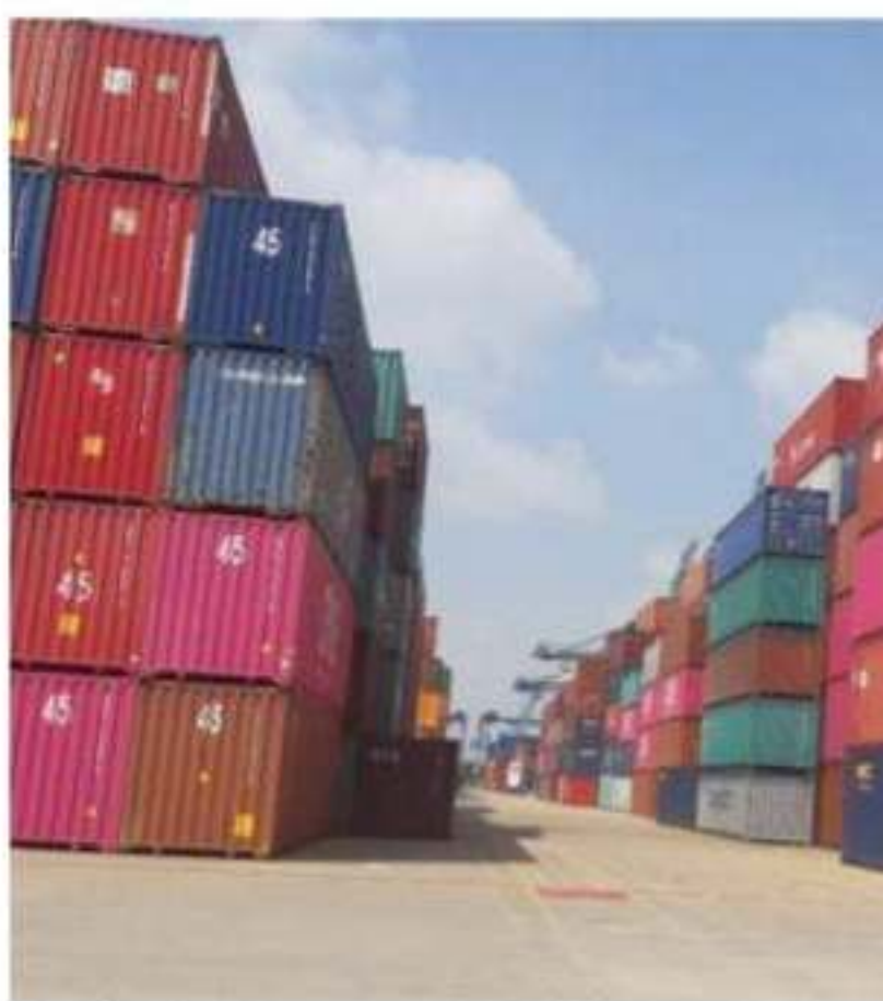
CD. LÁZARO CÁRDENAS, MICH.- Más impulso a las micro, reforzar la simplificación de trámites y servicios y consolidar como plataforma logística, prioridades del Plan 20-21.