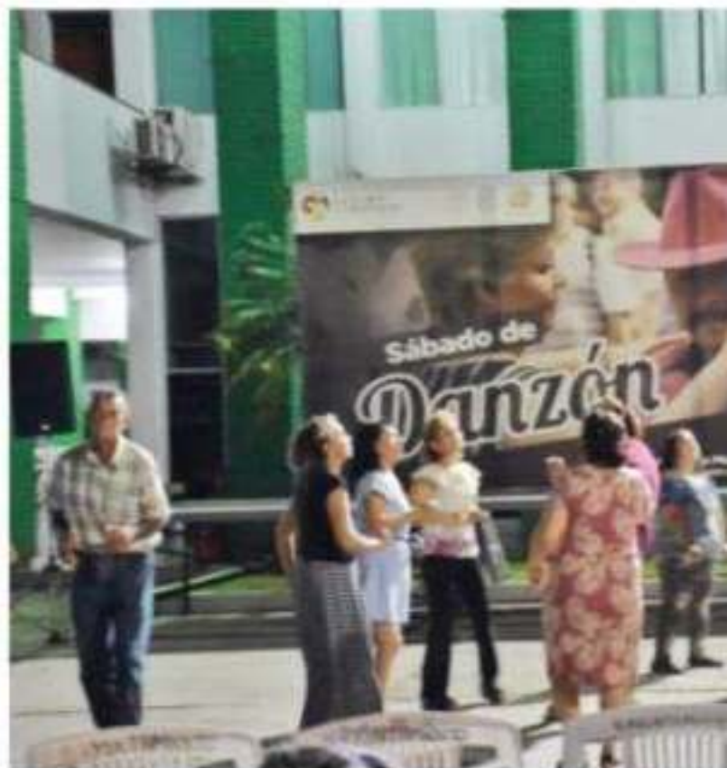
CD. LÁZARO CÁRDENAS, MICH.- La Casa de la Cultura "José población a los Sábados de Danzón, que se reactivarán a pa

cultural que ana, es el sanales que año en las