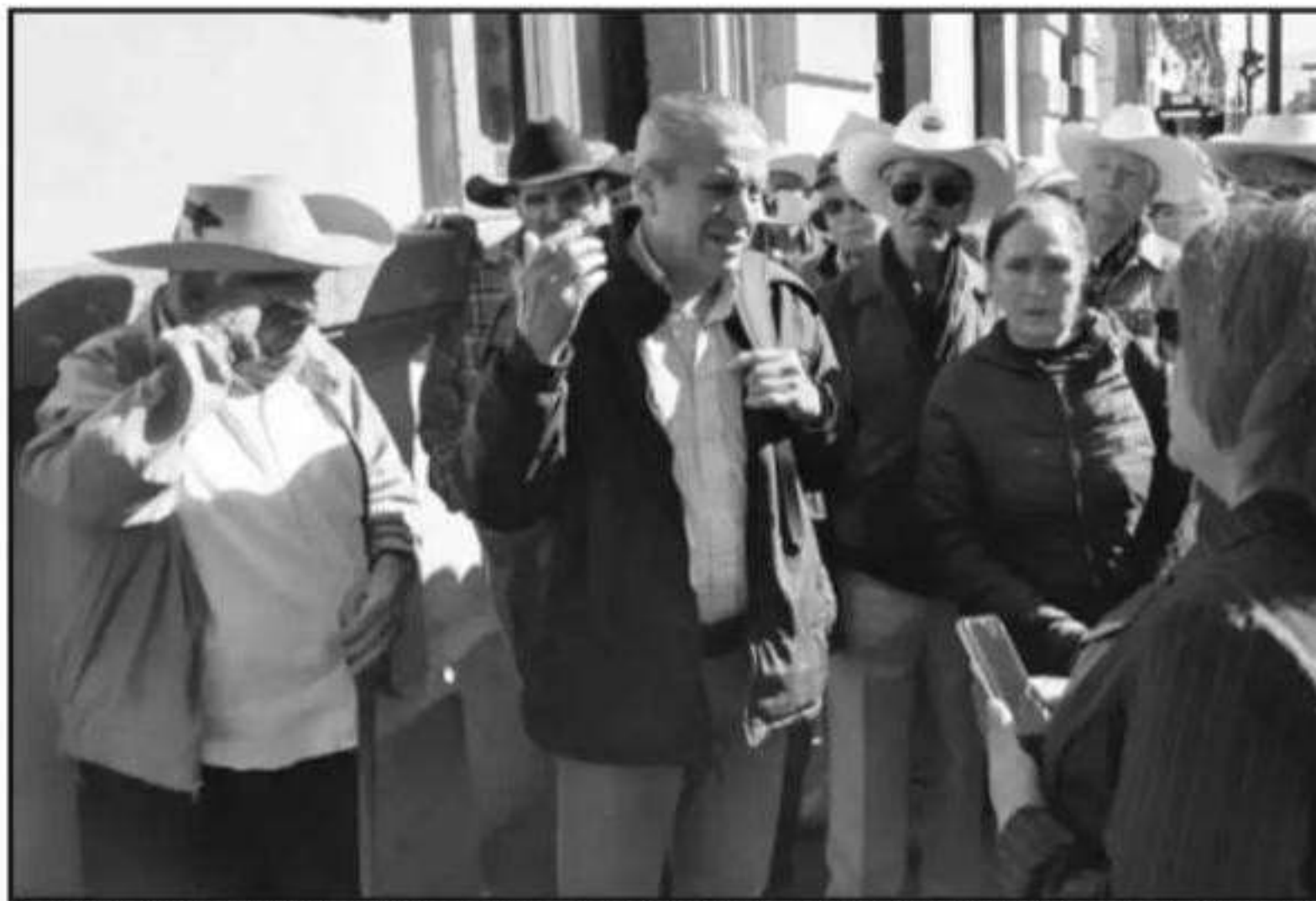
EXBRACEROS SE MANIFESTARON EN EL CONGRESO ESTATAL Y ANUNCIARON UNA MARCHA NACIONAL HASTA EL RANCHO DEL