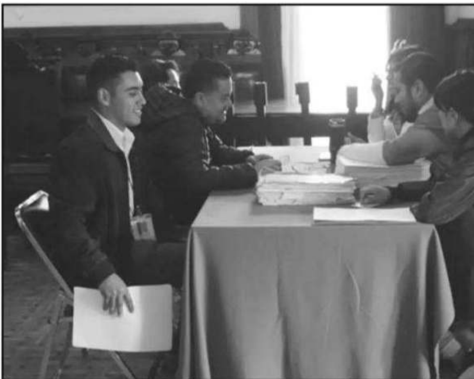
LA COMISIÓN LEGAL DEL CONGRESO BUSCA LLEGAR A UN ACUERDO CON ABOGADO DE DOS EMPLEADAS QUE EXIGEN SA

Desde julio de 2019 los tribunales dieron el fallo a favor de dos mujeres para que se les reinstale en sus puestos de trabajo y les paguen los salarios de 7 años