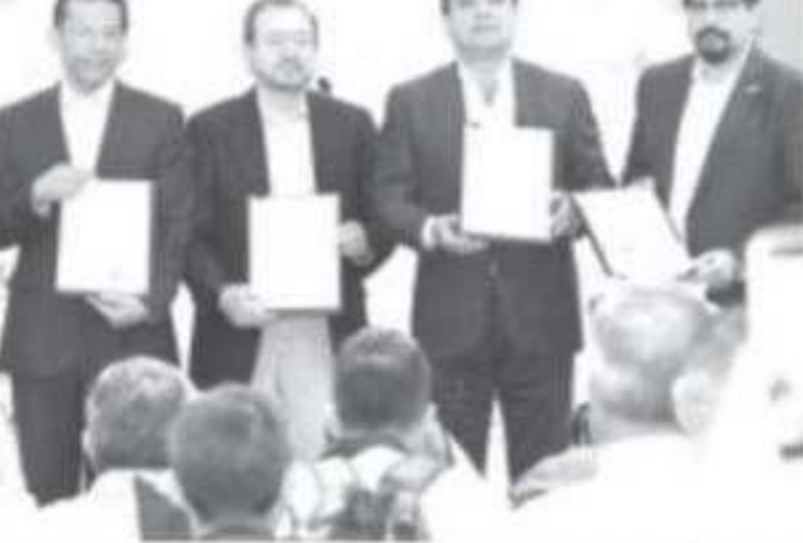
sumó esfuerzos con FIRA para impulsar más de 100 proyectos, con financiamientos superiores a 318 mdp.

2020.- En apoyo a la actividad productiva en el campo, la administración del Gobernador Silvano Aureoles Conejo sumó esfuerzos con FIRA para impulsar más de 100 proyectos, con financiamientos superiores a 318 millones de pesos.