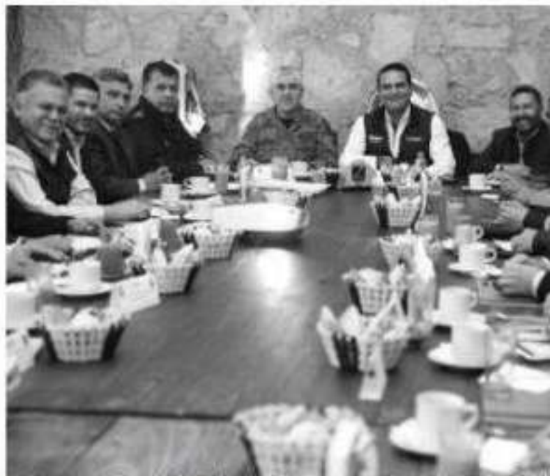
MORELIA, MICH.- En la reunión se conocieron los avances que registra las bases o cuarteles de la Guardia Nacional en el territorio estatal, que 85 por ciento.