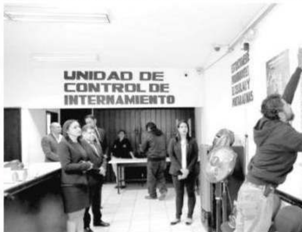
Atiende FGE lineamientos del Mecanismo Nacional de Prevención de la Tortura .