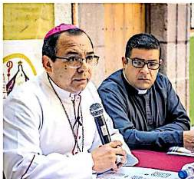
El representante de la Iglesia católica lamentó que los egresados de las escuelas normales se manifiestan de esta manera. (CARLOS HERNÁNDEZ)

Después de la reciente actualización a la alerta emitida por el gobierno de Es-