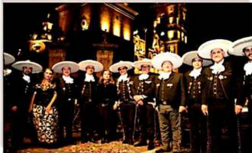
Jala los reflectores el Congreso y Campeonato Nacional Charro.