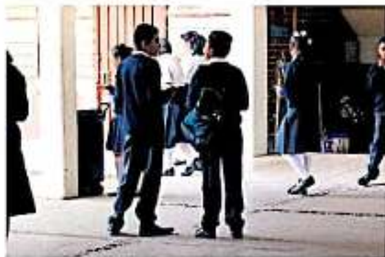
El IFEEM incumplió con la meta de atender la totalidad de centros de trabajo.

El primero y segundo informe que entregó el órgano fiscalizador al Congreso de la Unión con respecto a los avances de la revisión de la cuenta pública 2018 de Michoacán, refieren irregularidades en recursos transferidos del Fondo de Aportaciones Múltiples (FAM) para programas de asistencia social del DF Michoacán y obra educativa básica, medio superior y superior del Instituto de la Infraestructura Física Educativa del Estado de Michoacán (IFEEM).