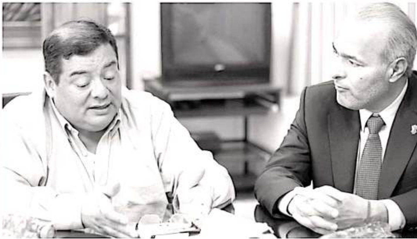
A través del trabajo interinstitucional entre estado y Federación, el INEA y Semigrante buscarán fortalecer el programa de Educación sin Fronteras.

Con el trabajo coordinado de ambas instituciones, se realizará la cuantificación de metas establecidas, promoción e inscripción a los servicios de educación en las fomadas de Servicios Integrales para los migrantes y sus familias, así como el seguimiento del avance educativo para la entrega de certificados.