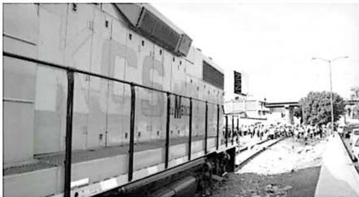
Derivado de la coordinación entre los Gobiernos Estatal y Federal, se trazó una ruta de trabajo con egresados de las diferentes normales.

Durante las últimas tres semanas, los normalistas han realizado tres bloqueos, el más reciente tuvo lugar del martes al viernes pasado y generó retrasos en más de una veintena de trenes.