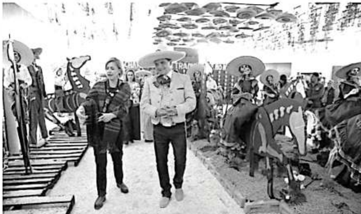
El gobernador Silvano Aureoles realizó un recorrido por el Pabellón Don Vasco, sede de la fiesta charra mexicana e inauguran el Museo de la Charrería, que tendrá acceso gratuito.

Durante un recorrido por el Pabellón, el Gobernador también conoció el trabajo de las y los jueces de este Campeonato, quienes le compartieron los detalles a calificar en cada una de las suertes que se llevan a