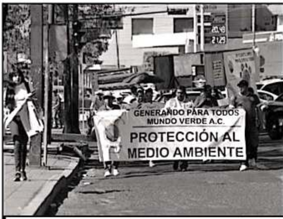
EN MORELIA Y MICHOACÁN DIVERSAS ORGANIZACIONES CIVILES SE HAN MANIFESTADO A FAVOR DE LA CUIDADO AMBIENTAL.

"Se establecerá la eliminación gradual de los plásticos y productos derivados del poliestireno de un solo uso, con el propósito de reducir la utilización de bolsas, envases, empaques o empaques que se proporcionan en establecimientos mercantiles".