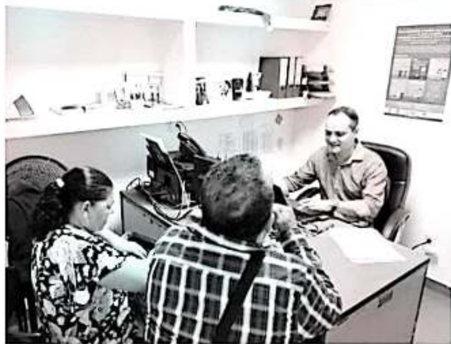
Trabajan Gobierno del Estado y Embajada de Estados Unidos, en pro de migrantes michoacanos.