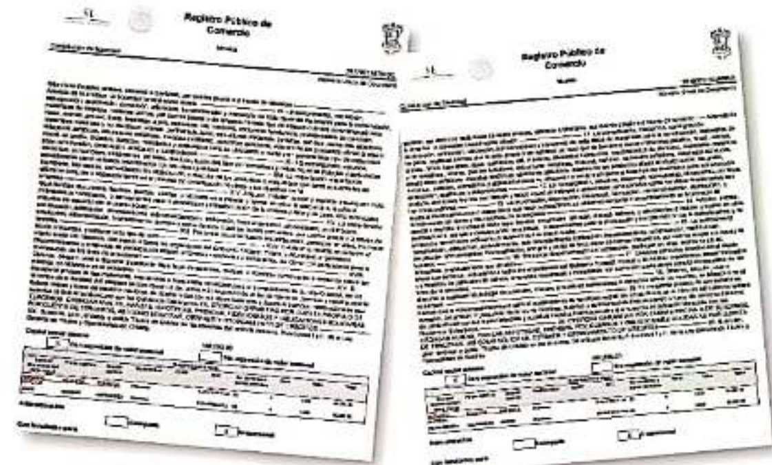
Los documentos donde se da cuenta de los contratos referidos son públicos fuente: registro público de comercio