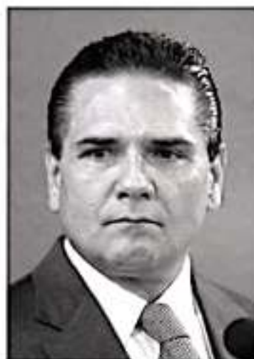
Silvano Aureoles Conejo.