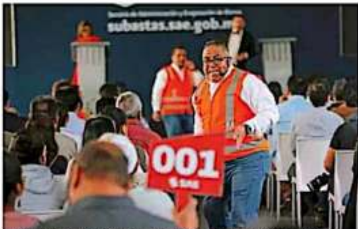
Con esta quinta subasta, el estado Oax. ha logrado recaudar más de 225 millones de pesos que se han destinado a diversos causas sociales; entre ellas, apoyar a niños mexicanos y a los municipios más pobres del país.