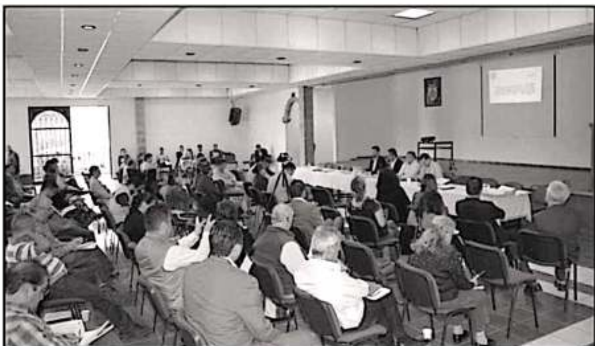
SIGUE HACIENDO QUEJAS EN CUANTO A LA DECISIÓN DE LA DIRIGENCIA SINDICAL DEL SPUM DE NEGOCIAR LA REFORMA DE JUBILACIONES CON LA UMSNH

49mil ALUMNOS tiene la Universidad Michoacana