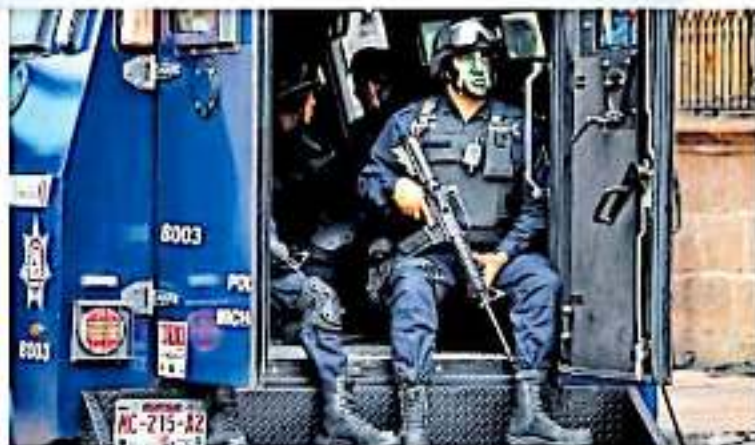
Están vigentes en control y confianza, cerca de tres mil elementos estatales. ABREGO

Las evaluaciones de control y confianza sirven para verificar que el personal de seguridad activo actúe dentro del marco de conducta que dicta la normatividad institucional.