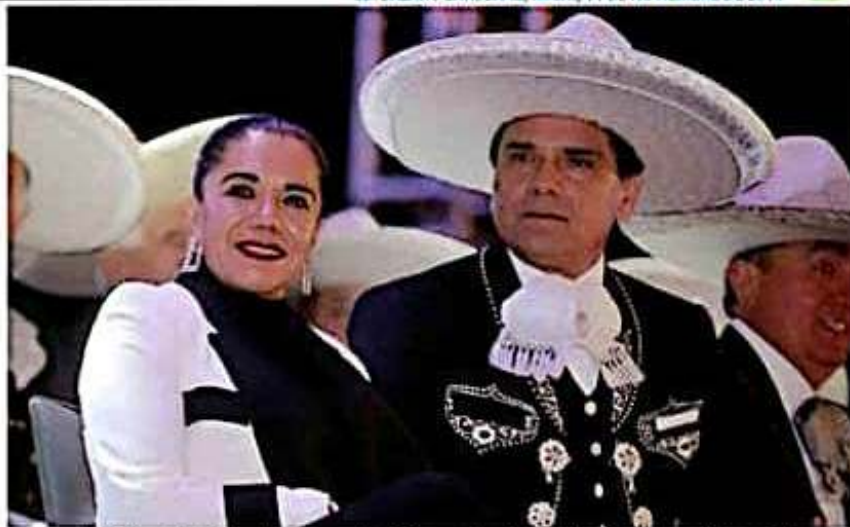
Diputada Wilma Zavala Ramírez, representó al Congreso Local en el inicio del Congreso Nacional Charro.

La legisladora hizo un llamado a los michoacanos a acercarse y conocer más del denominado "Deporte Nacional por excelencia", mismo que tiene su origen en los estados de Hidalgo y Jalisco.