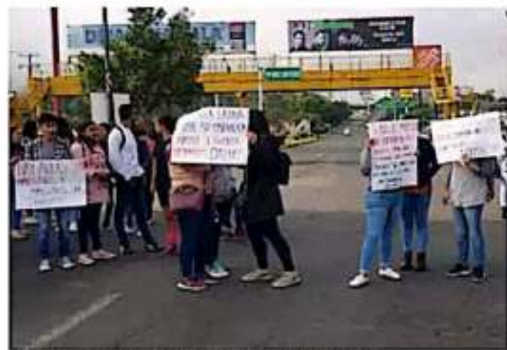
Los jóvenes exigen con cartones las renovaciones durante los siguientes días. @DNT15M

Los profesores, que tienen más de 30 años de servicio en dicha institución, dijeron sentirse "ningunados", "atropados" y "desamparados" por las autoridades de la Secretaría de Educación (SEE), pues desde hace más de dos semanas se pide su intervención mediante un oficio, pero la respuesta fue negativa, lo cual "empusó" aún más a los estudiantes para no asistir a clases, intervenciones en las reuniones de los académicos,