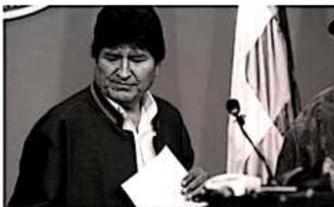
El mandatario Evo Morales, quien estuvo al frente de su país casi 14 años, hizo el anuncio a través de televisión de su renuncia

El líder indígena hizo el anuncio luego de divulgarse un informe preliminar de la Organización de Estados Americanos que encontró "un millón de irregularidades" en los comicios del 20 octubre y dijo que deberían celebrarse nuevas elecciones.