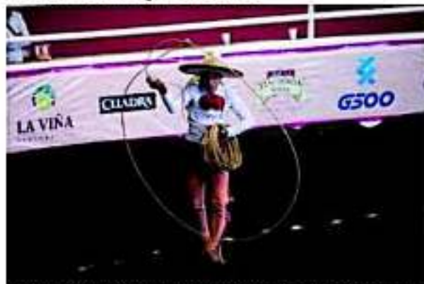
MORELIA, MICH.-Escaramuzas y hombres charros, de sangre michoacana, mostrarán su talento y habilidades acrósticas en el ruedo durante la jornada de competencias que se desarrollará este lunes en el Pabellón Don Vasco

El costo es de 100 pesos por persona para que puedan disfrutar de tres charreadas al día, así como de actividades culturales, artísticas, además de visitar el museo Charro y probar la exquisita comida tradicional michoacana.