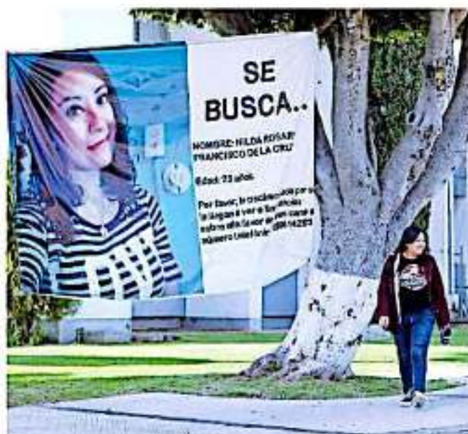
La autoridad reconoce la desaparición voluntaria en algunos casos. (ARREOLA/USA)

Informó que aun cuando ya trabajan de manera coordinada con otras instituciones como la Fiscalía General del Estado (FGE), la Cruz Roja, el Hospital Civil Psiquiátrico, la Terminal de Autobuses de Morelia (TAM), aerolíneas, clínicas privadas, centros de atención a personas con adicciones, por mencionar algunos, continúan en el diseño del mecanismo a través de grupos en aplicaciones de mensajería instantánea para acelerar los procedi-