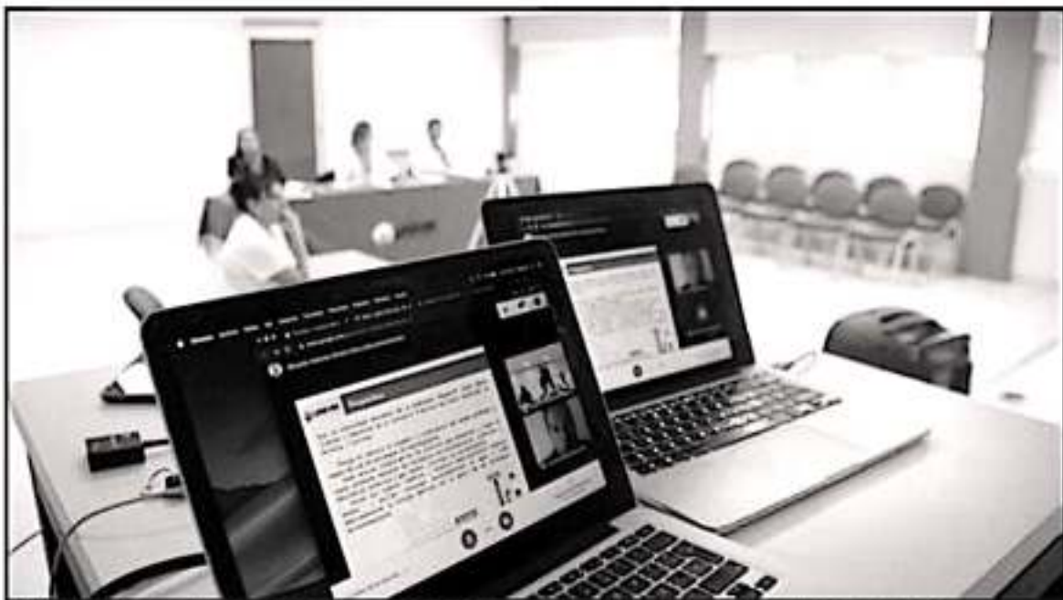
LA UNIVIM HA LOGRADO BUENOS RESULTADOS EN SU POCO TIEMPO DE VIDA Y BIEN VA CON VARIOS PROGRAMAS INCLUIDO DE POSGRADO

Manifestó que también esto ha permitido que se consolide la matrícula de la institución, como es el caso de los programas académicos fijos, con mil 200 estudiantes y mil 200 estudiantes en educación continua. "Cabe decir que también en el marco de la reforma curricular de las Escuelas Normales se desarrollaron diseños de programas para las Normales del país, tema que también ha contribuido a con-