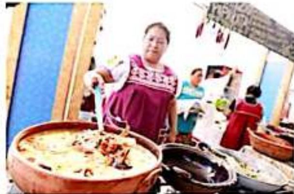
MORELIA, MICH.- La gastronomía y las artesanías michoacanas, otro atractivo más en el Congreso y Campeonato Nacional Charro.