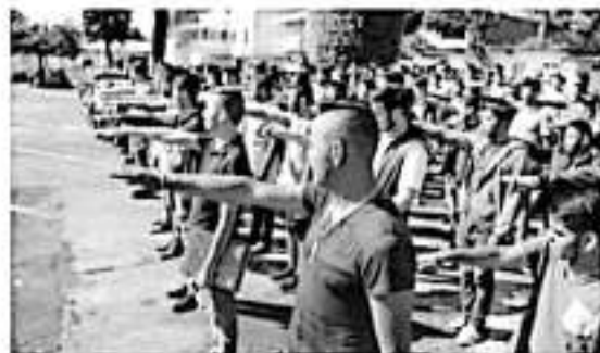
En esta ocasión correspondió a la clase 2001, anticipados y remisos

Mencionó que en esta ocasión correspondió a la clase 2001, anticipados y remisos, a quienes indicó que en un escenario cada vez más complejo tienen la responsabilidad de dirigir el rumbo de México.