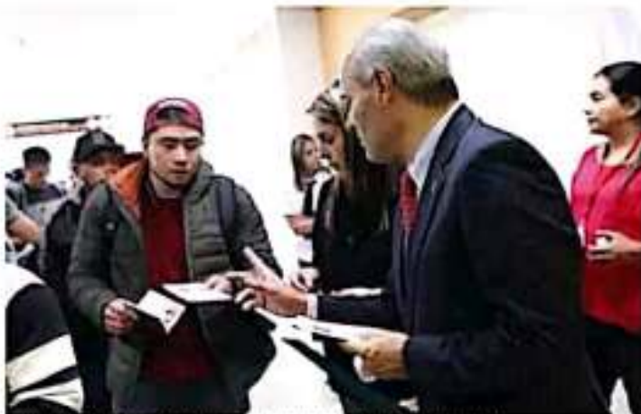
El secretario del Migrante conversa que respaldó la percepción que se tiene del estado. QUINTANA