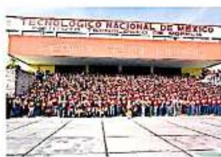
La matrícula actual del ITM es de cinco mil 957 alumnos, entre licenciatura y posgrado. (ARREOLA)

La matrícula actual del Instituto Tecnológico de Morelia es de cinco mil 957 alumnos, entre licenciatura y posgrado, atendidos por un total de 490 trabajadores de base entre docentes y administrativos, donde el 80 por ciento de los programas acreditados están acreditados por organismos externos en el ámbito nacional y tres carreras tienen la acreditación en el marco internacional por parte de CACEI.