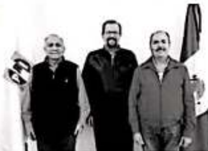
MORELIA, MICH.- Coincidiendo en un mismo objetivo: consolidar un partido político renovado y fuerte; escuchando a toda la militancia de Michoacán.