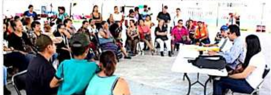
LOS REYES, MICH. - Se llevó a cabo una reunión para afinar detalles del próximo viaje de las "Palomas Mensajeras" a Estados Unidos.