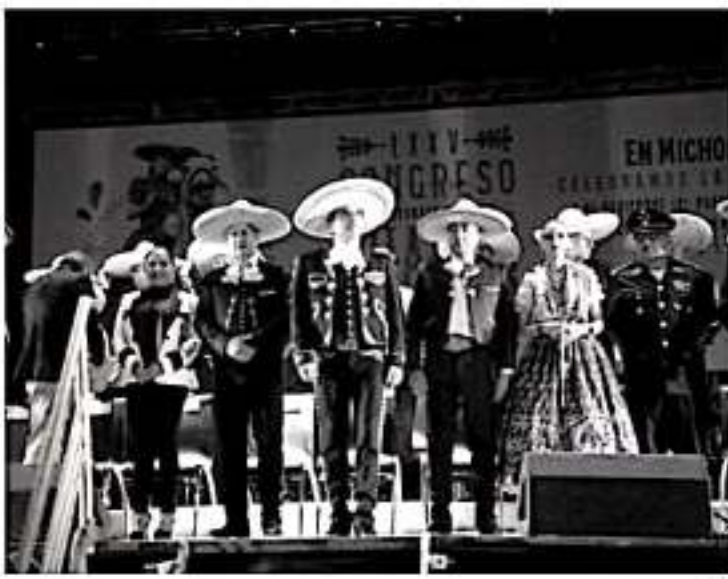
El gobernador Silvano Aureoles Conejo vistió de charro para el evento de apertura del Congreso y Campeonato Nacional Charro.

No dudemos que los cambios alcancen a los órganos electorales locales, tanto al