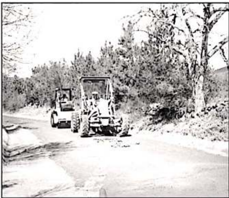
LA CÁMARA DE LA INDUSTRIA DE LA CONSTRUCCIÓN VE EN MAL ESTADO LA MAYORÍA DE CARRETERAS MICHOACANAS

El gobernador hizo la promesa de que, si se lograba la federalización, con ese recurso que se estaría ahorrando, se podrían invertir en la reconstrucción de la red carretera