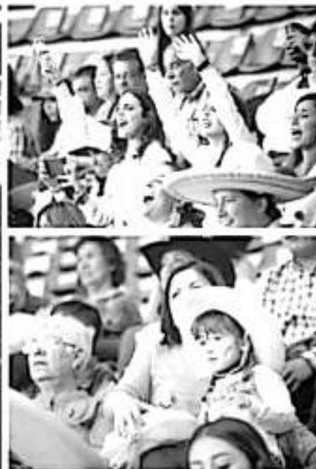
En un ambiente de fiesta y tradición, porras, emoción, suspenso y triunfo en la tribuna, se han vivido cada una de las competencias charras de este domingo en el Pabellón Don Vasco, en Morelia, como parte del Campeonato Nacional del deporte por excelencia.