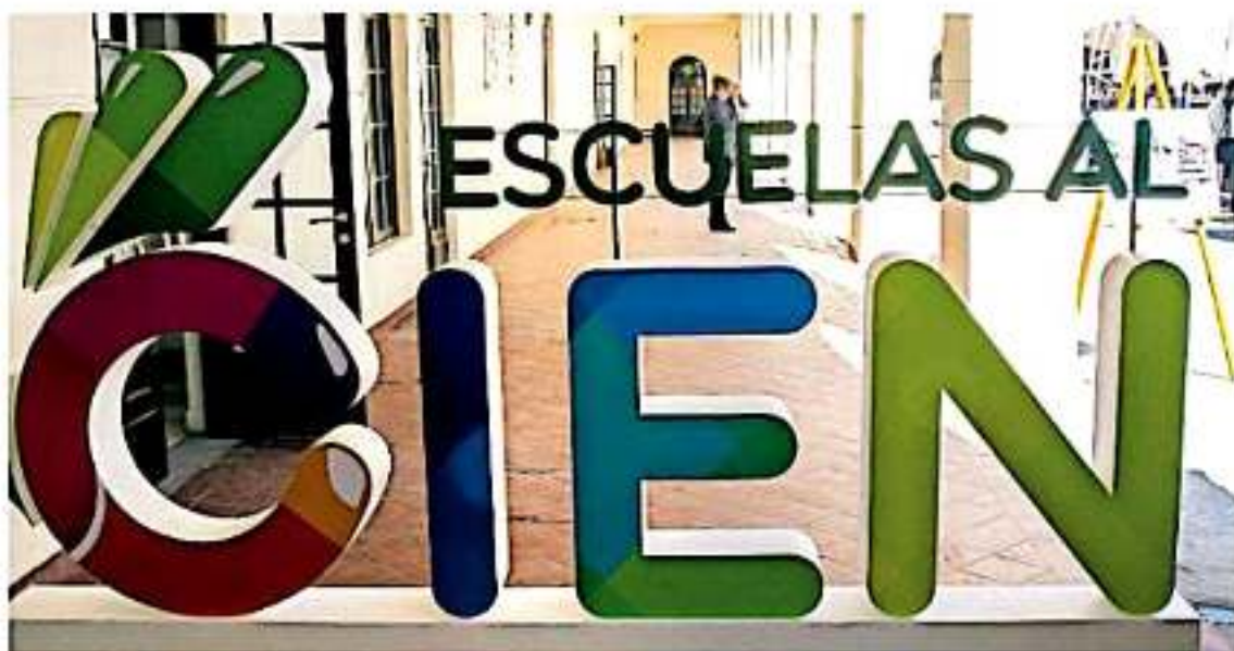
En 313 centros de trabajo las obras se encontraron en proceso de ejecución. ANEXO