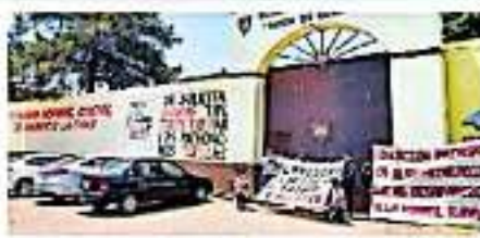
Se denunciaron irregularidades en el proceso de asignación de directivos.