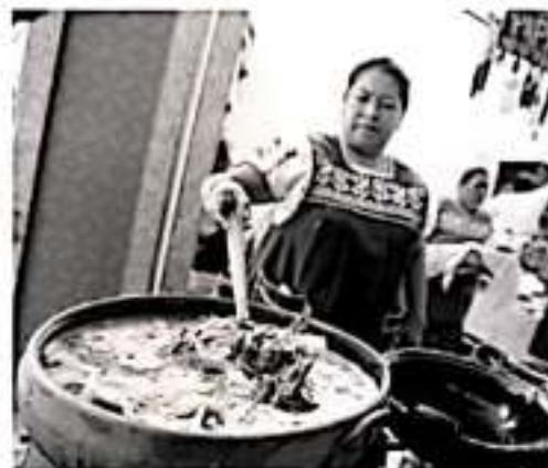
MORELIA, MICH.- Sabores de tierras michoacanas y artesanías creadas por manos inigualables, suman un atractivo más a la fiesta que se vive por el Congreso y Campeonato Nacional Charro 2019.

Artesanías de la rama textil, maque, madera, cobre, alfarería, joyería, perfileado en oro, fibra vegetal, entre otras, podrán adquirir los visitantes quienes también pueden obtener información de cada uno de los lugares turísticos del estado así como de sus patrimonios naturales. A partir de hoy y hasta el próximo 1 de diciembre las familias charras, las michoacanas, aquellas provenientes del resto del país y de Estados Unidos, podrán disfrutar de toda una celebración con el toque michoacano en su sabor y artesanías.