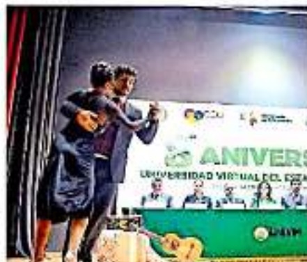
Se buscarán crear programas que trasciendan más allá de los cambios de gobierno, asevera

Otra de las medidas implementadas es crear programas de profesionalización y de educación continua acorde a las necesi-