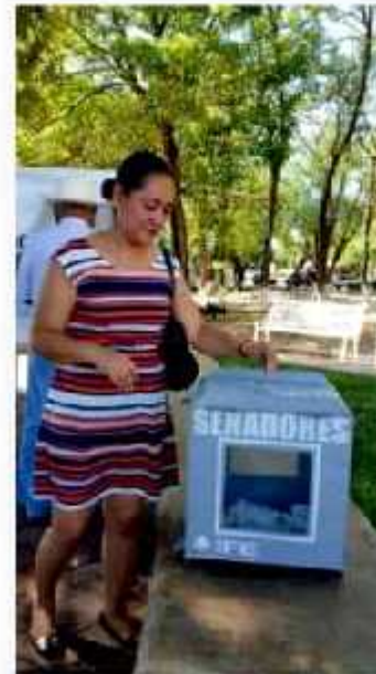
CD. LÁZARO CÁRDENAS, MICH.- Sin incidentes se llevó a cabo el proceso de elección interna del PRI, para la renovación de la dirigencia nacional.

No obstante, a nivel Nacional aún continúa el conteo de la votación, por lo que será en el transcurso de este lunes cuando se pueda estar dando a conocer los resultados oficiales de la contienda.