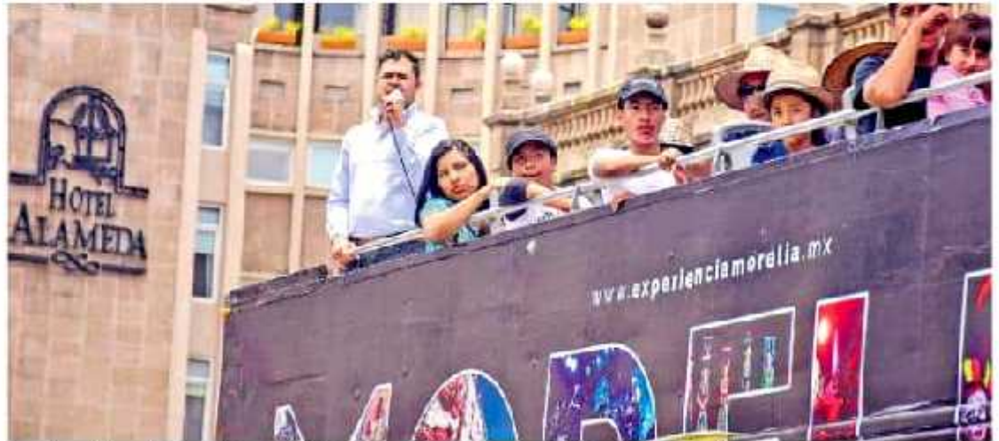
Se estima la llegada de un millón 200 mil visitantes y una derrama económica de casi dos mil millones de pesos. CLAUDIA CHÁVEZ LÓPEZ