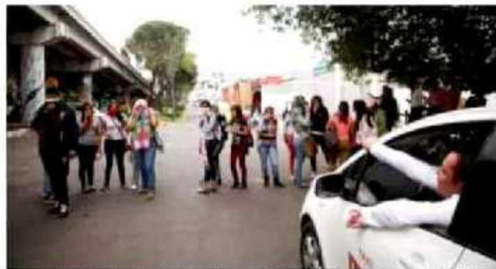
La toma de fotografías y el chequeo de documentos de los aspirantes, así como el inicio de la inscripción de los aspirantes.

Por otro lado, aseguró que a pesar de la exigencia de las organizaciones de docentes nor-