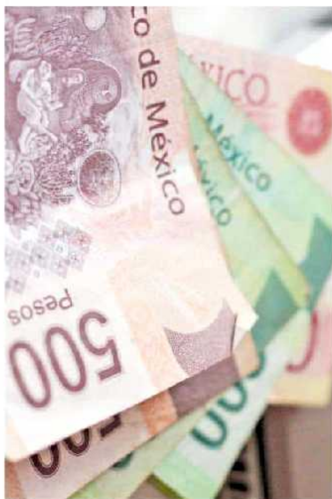
Titulares de dependencias perciben un salario bruto superior a los 100 mil pesos

Sin embargo, y conforme a la consulta, se encontró que, pese a las atribuciones que tiene la Contraloría del Estado de revisar, fiscalizar y vigilar el correcto uso de los recursos públicos, así como de dar cuenta de la rendición de cuentas de tal agente público en el apartado relativo a las remuneraciones de las percepciones