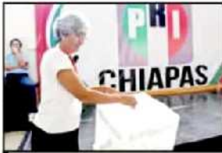
PRIISTAS DE TODO EL PAÍS AGUDIERON A LAS URNAS.