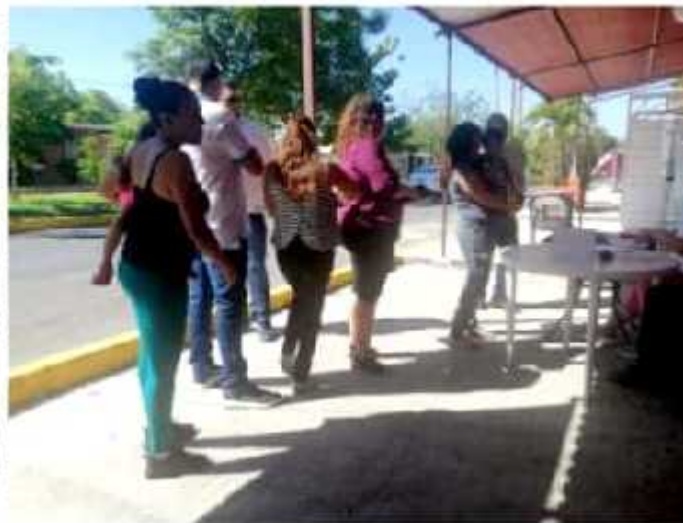
APATZINGÁN, MICH.- Sin novedad se realizaron las votaciones internas del PRI por renovación de su dirigencia nacional.