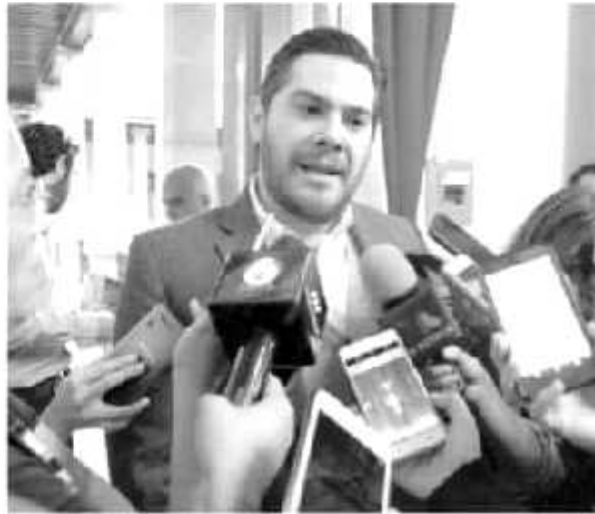
El diputado local, Eduardo Orihuela Estefan ante los medios de comunicación.

Ante la elección interna que realiza el Partido de la Revolucionario Institucional (PRI) en todo el país, en Michoacán el diputado Eduardo Orihuela Estefan manifestó que cualquiera de los tres candidatos que llegue al frente del partido será un perfil que logre unificar al partido, para así construir una alianza que se pretende para lle-