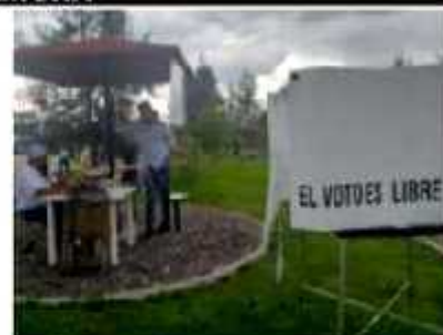
ZAMORA, MICH.- Con algunos contratiempos menores se desarrollaron este domingo en Zamora las elecciones internas del PRI.

A través de internet algunos de los militantes confirmaron que no aparecían en la consulta de la lista de afiliados en revisión y actualización, por lo que acudieron a las