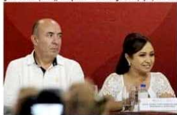
Durante la lectura de su primer informe de gobierno, la alcaldesa abordó cinco ejes en que se englobaron las diversas acciones realizadas a lo largo de este primer año de su administración.