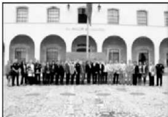
COORDINADORES E INTEGRANTES DE 9 MESAS DE SEGURIDAD REGIONALES PARTICIPARON EN EL RECORRIDO CON LAS ASOCIACIONES CIVILES.