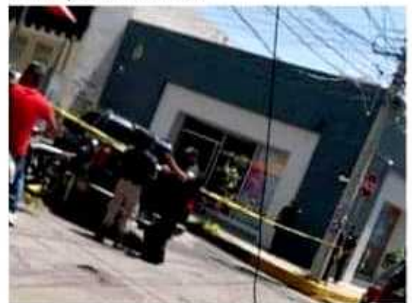
Un empresario de grupos musicales, fue asesinado a balazos ayer en Sahuayo.

Añadió que el gobierno estatal recibe los documentos a través de Segob y no llega respuesta alguna, "hemos exhortado al gobernador que les pague a los maestros a los trabajadores de la salud y no hemos tenido respuesta. No hay buena relación, por lo menos con la bancada de Morena".