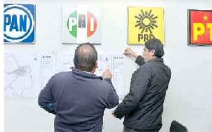
Se deben retomar temas como la regulación a las coaliciones partidistas (ANEO)

En entrevista, el citado funcionario consideró que se deben retomar temas como la regulación a las coaliciones partidistas, a la integridad de candidaturas comunes, a la distribución de tiempos pa-