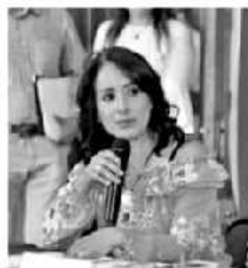
MORELIA, MICH.- La diputada Lucila Martínez Manríquez, integrante de la LXXIV Legislatura del Congreso del Estado, recalzó que un Estado democrático debe pugnar por la igualdad de todos, de manera que las personas puedan gozar por ejemplo, de los servicios que proporcionan las instituciones por igual.

"La eliminación de la discriminación y la violencia, esto un reclamo de justicia de la población, y todo intento de una sociedad democrática por avanzar en la defensa de derechos fundamentales, por lo general, está precedido de una lucha ardua para garantizar el respeto a la diferencia".