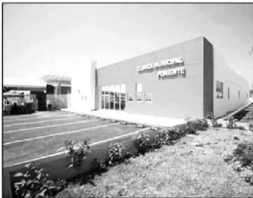
LA CLÍNICA MUNICIPAL PONIENTE ESTÁ UBICADA A UNOS METROS DE LA SALIDA A QUIROGA, CERCA DE EL RELICARIO.