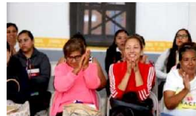
MORELIA, MICH.- El curso que será gratuito está dirigido a las y los profesionistas que trabajan con mujeres con discapacidad auditiva, que viven violencia de género.

Y así, recordó que desde el próximo martes se realizarán los operativos de la verificación en los puntos de más tránsito de la ciudad, y aclaró que no serán multados los vehículos pero sí serán tomados sus datos y emitida una boleta de apercibimiento, que al final permitirá que el gobierno tenga estadísticas de los automóviles que circulan la capital.