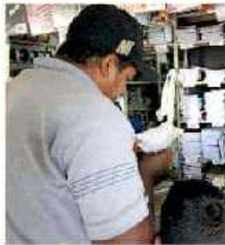
La compra de útiles representa una erogación importante. (ARANDA/LEÓN)