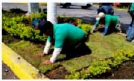
ZAMORA, MICH.- Como alternativa para mejorar la imagen urbana, se mantiene el programa de atención a las zonas verdes del municipio.

Abundó que otros trabajos que se pactaron con los residentes del lugar fueron el balizamiento y la pinta de los troncos de los árboles, para dar uniformidad a la vista y embellecer de manera sustancial las áreas de uso común.