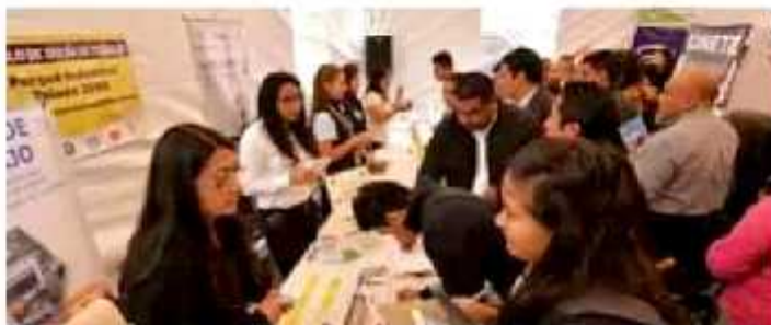
El mayor número de desempleados, perteneciente al género masculino, de acuerdo con datos del Inegi. J. CARLOS OLIVERO

En tanto, la Encuesta Nacional de Ocupación y Empleo