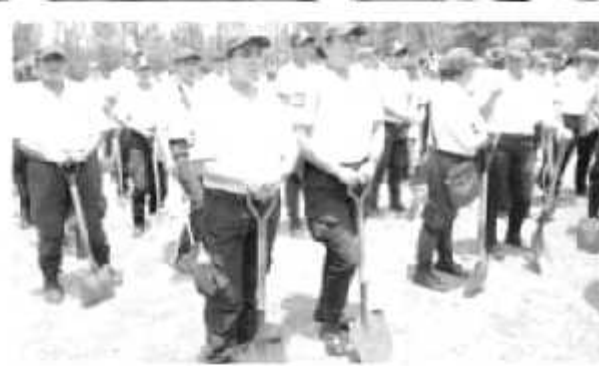
Cantantes, deportistas, celebridades y organizaciones sociales, encabezados por la Fundación Biopaz y respaldados por el gobierno de Silvano Aureoles Conejo, impulsaron la jornada de inicio, en Morelia.

que yo, que soy un tipo que siempre estoy golpeando algunas decisiones del gobierno mexicano, en general, no tengo partido ni color, hoy pueda decirles que hay una muy buena palomita aquí, en el Gobierno de Michoacán, por haber puesto esta lana e impulsado estos trabajos», expresó Arturo Islas.