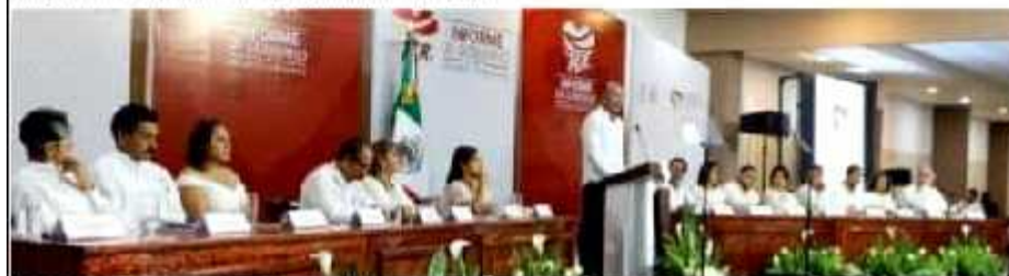
CD. LÁZARO CÁRDENAS, MICH.- El Gobierno del Estado, que encabeza Silvano Aureoles Conejo, presume avances en la región de Lázaro Cárdenas, tanto en materia educativa, como en el campo y salud a 4 años de gobierno.