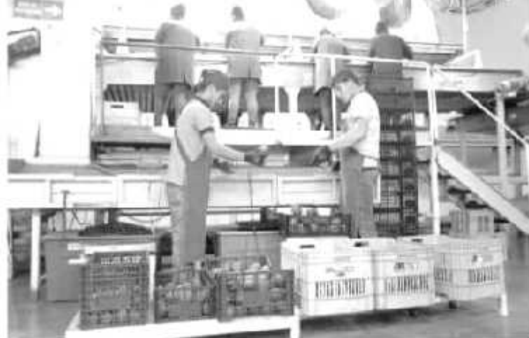
Michoacán se mantiene en el primer lugar en valor de la producción agrícola a nivel nacional.

sin considerar a las universidades, una apuesta federal por un sistema de nuevas universidades, al menos 100 del Sistema Benito Juárez, tal vez una especializada en medicina y enfermería, para combatir déficit en sector Salud.