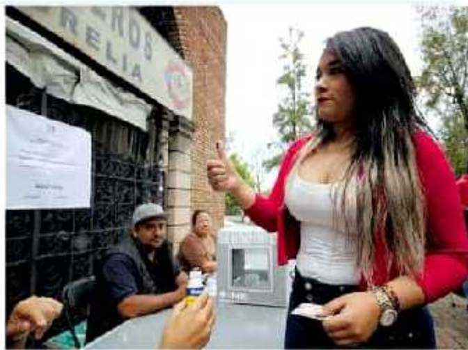
La jornada de inicio a las 9:00 horas y concluyó sin contratiempos en el estado. MORELIA, JUEVES

Agregó que pese a las dudas que le impidieron emitir su votación, "se espera que el resultado de elección no sea cuestionable, que el PRI afirme sus objetivos y se ponga mayor atención a los compromisos que realiza el propio partido. Todos los gobernadores (Alejandro Moreno e Ivonne Ortega) tienen la capacidad para dirigir al partido".