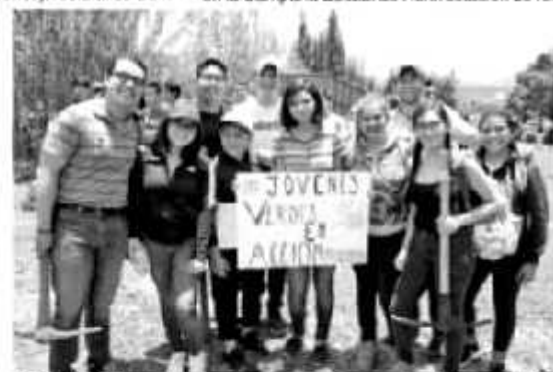
MORELIA, MICH.- En una intensa jornada dominical, nutrida con el calor humano, Michoacán fue ejemplo nacional, tras congregarse a miles de personas en torno al arranque de la cruzada "Reverdeciendo a México".

nicipios, como Zitacuaro, Zamora, Uruapan y Lázaro Cárdenas, con prioridad para los espacios que han experimentado deterioro por incendios forestales, talia clandestina y otros fenómenos. Explicó que de forma periódica, el Gobierno de Michoacán emitirá un informe de avance de la reforestación del millón de árboles comprometidos con la iniciativa Verdeciendo a México, que serán adicionales a los 18 millones de ejemplares establecidos como meta en la Campaña Estatal de Reforestación 2019.