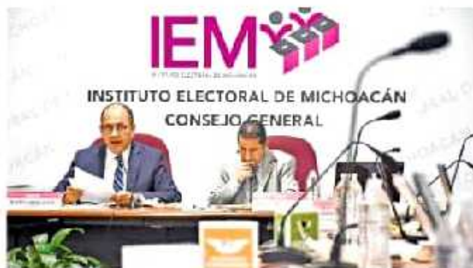
El apartado de gastos está disponible en el portal electrónico transparencia

El gasto, correspondiente al Capítulo 2000, relativo a materiales y suministros, representa un subejercicio de 925 mil