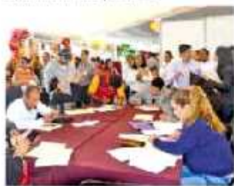
Se han realizado 15 ferias del empleo

Este año se pretende realizar 50 ferias del empleo, a través de que se proyecta colocar hasta 10 mil personas.