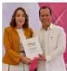
Agradado a las diferentes "líneas de gobierno" por el apoyo a favor de la cohesión