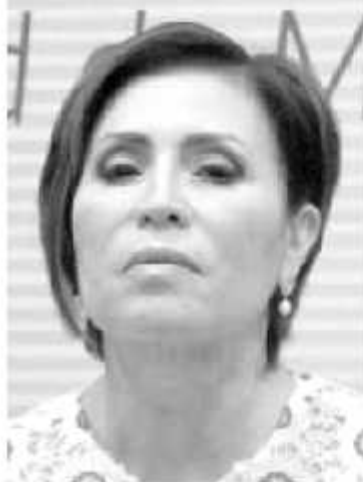
Rosario Robles Berlanga.