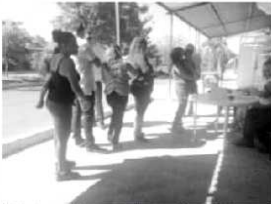
Sin incidentes, el día de ayer, la militancia del PRI, acudió a las urnas a votar para la renovación de la dirigencia del Tricolor Nacional.

APATZINGÁN, MICH. Sin que se registraran incidentes de ninguna naturaleza y de acuerdo a lo programado, a partir de las nueve de la mañana de este domingo los dirigentes del PRI y funcionarios de las casillas receptoras de los votos para designar a la nueva dirigencia nacional del Partido Revolucionario Institucional instalaron las siete urnas en los lugares estratégicos establecidos