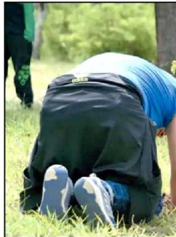
MÁS DE CINCU MIL ASISTENTES FUERO AL EVENTO, SIN EMBARGO, VARIOS DE ELLOS

Pese al disgusto que se manifestó en varios de los fans, la actividad en cuanto a reforestación fue un éxito y se vivió un ambiente de cooperación entre quienes se que darán a continuar la labor a pesar