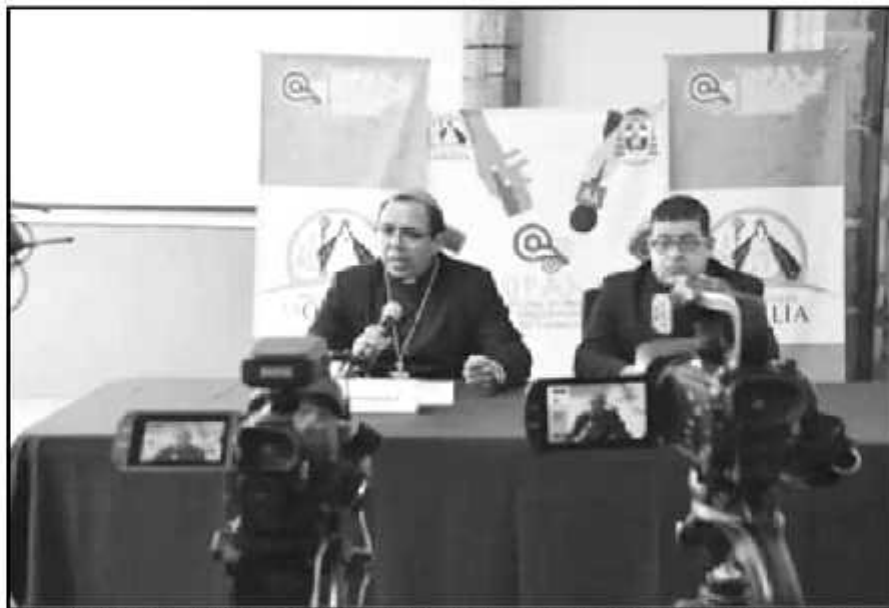
EN LA TRADICIONAL RUEDA DE PREGUNTAS, LA ARQUIDIOCESIS DE MORELIA HIZO UN LLAMADO A FORTALECER LA PAZ.

Tras los hechos ocurridos el pasado jueves, algunas voces, incluido