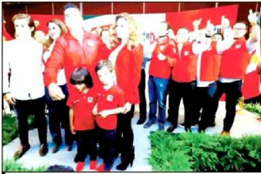
TRAS CONOCER LOS PRIMEROS RESULTADOS DE LA ELECCIÓN DEL PRI, ALEJANDRO MORENO SE PROCLAMÓ GANADOR.

una queja ante la Comisión de Justicia Partidaria, sobre este tema, no se procederán las sanciones, pues “para nosotros lo que cuentan son las pruebas, no cuentan los pronunciamientos ni las impugnaciones mediáticas o en redes sociales. Los números son los que nos van a decir quién ganó y a quién le entregaremos la constancia”.