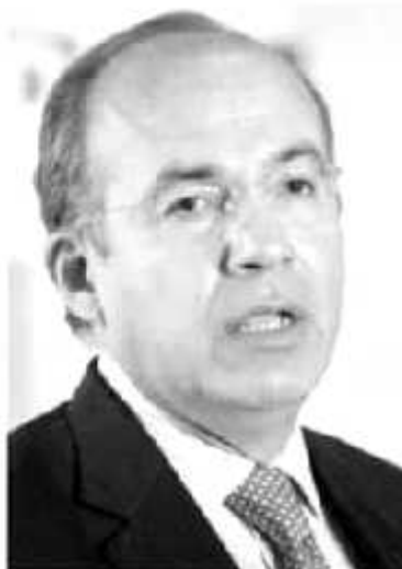
Felipe Calderón Hinojosa.

Tal vez todo lo anterior, llevó al Gobierno Federal a realizar una estrategia