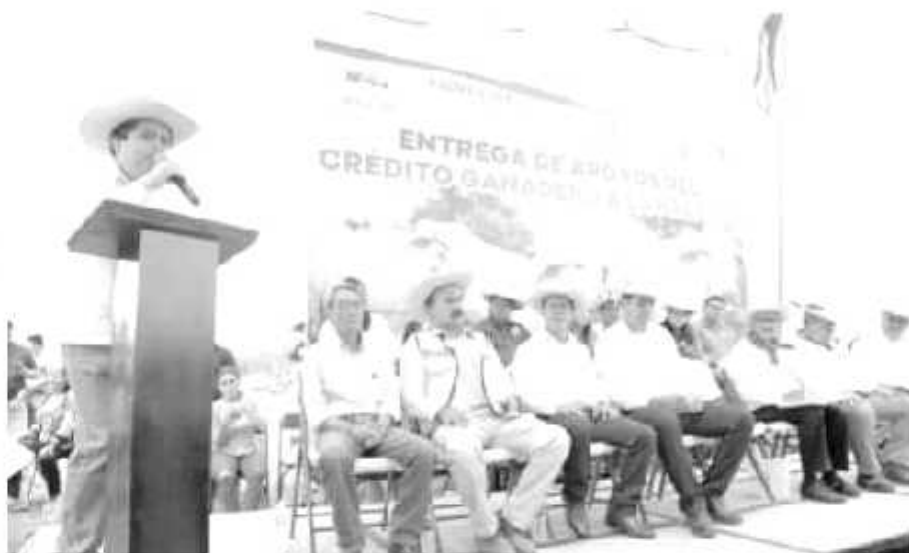
Se entregarán a productores de seis municipios.

En Michoacán se producen anualmente más de 8.5 millones de toneladas de productos lácteos, entre los que destacan los quesos «cotija» y «oaxaca», además del panela, ranchero, fresco, enchilado y adobera, y productos como crema, yogur, mantequilla, jocoque, panela y requesón, para su elaboración se destinan más de 80 millones de litros de leche