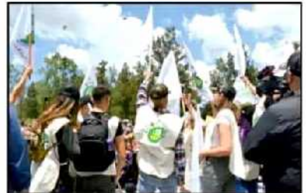
BUEN AMBIENTE SE VIÓ AL INICIO DEL EVENTO, PERO A DUE POR PROTOCOLO, LOS FAMOSOS FUERON LLEVADOS A REFORSTAR SEPARADO DE LOS ASISTENTES

de no poder convivir, como pretendían, con los invitados.