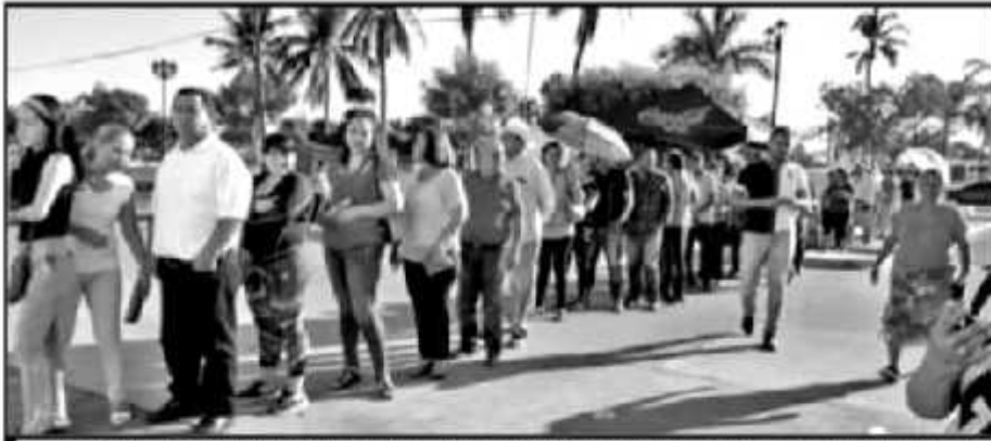
EN EL ESTADO, LOS AFILIADOS MÁS RECIENTES AL PARTIDO ACUDIERON DE MANERA COPIOSA A EMITIR SU SUFRAGIO

LA VOTACIÓN PARA RENOVAR DIRIGENCIA NACIONAL NO TUVO INCIDENCIAS, DICEN