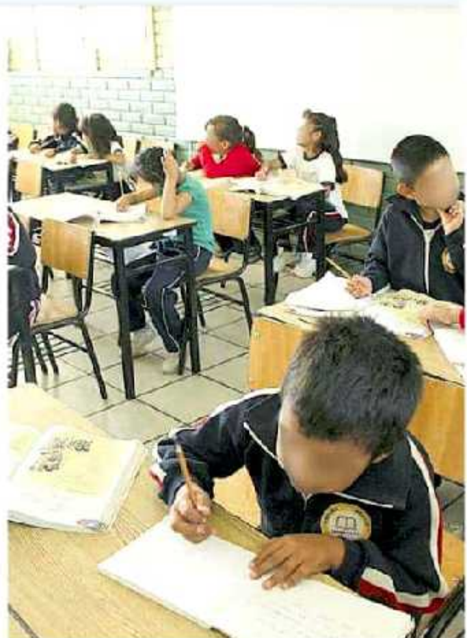
La educación inicial será al nivel de básica y por ende con carácter de obligatoria. (ARANDA)

El cambio en los métodos de enseñanza, que tendrán un enfoque más activo que