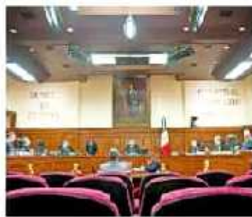
Pide que la SCN declare inaválida la "Ley Bonilla", en caso de aprobarse. VIDEORRÁFICO

Por el magistrado en materia electoral, no es posible la reelección de un gobernador en México "y nada se puede", toda vez que los mandatos deben realizarse estrictamente las reformas pertinentes al Código Electoral para revertir lo relativo a la reelección de senadores, di-