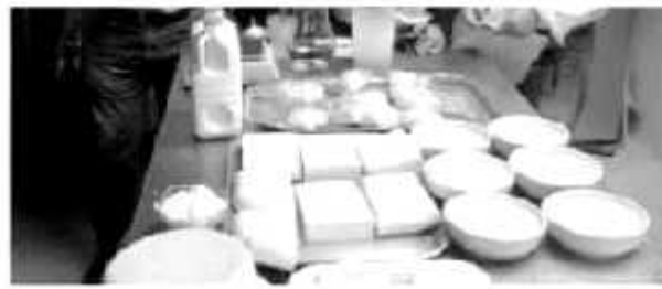
Sedestiman más de 80 millones de litros de leche para productos como: quesos oaxaca, cotija, panela, adobera y ranchero, además de jocoque, crema, mantequilla y yogur.