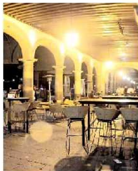
No se precisó cuántos comercios con venta de alcohol han sido cerrados de manera definitiva.

La inspección a comercios continuará en compañía de la Policía de Morelia, esto en aras de evitar que vuelvan a ocurrir situaciones de este índole