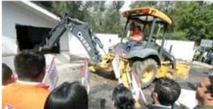
Se inicia que la estación quede lista y operativa en 2013.

"No existe problema con el inicio de esta obra en el municipio, por fin vamos a tener de nuevo cuenta esta estación activa con dormitorios, comedor, gimnasio y áreas de