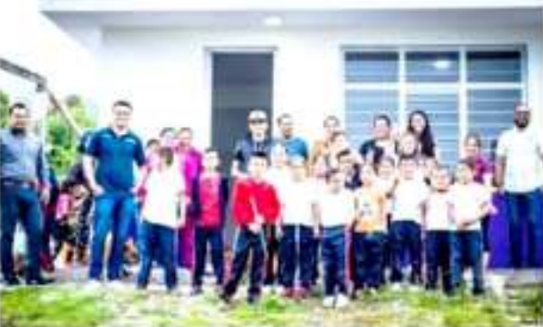
PERIBÁN, MICH.- Fue inaugurada una aula en la escuela primaria "Vicente Guerrero", de la comunidad de Parástaco.