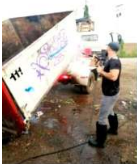
CD. LAZARO CÁRDENAS, MICH.- El departamento de Aseo Público inició con el lavado y desinfectado de los 170 contenedores que se encuentran distribuidos en diversos puntos del municipio.

De igual formas, pidió evitar arrojar colillas de cigarro encendidas o a su vez, prenderle fuego a los contenedores.