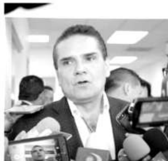
Silvano Aureoles Conejo.

vo morenista importante al ir tejendo en forma gradual acciones de interlocución con otras fuerzas políticas, y a esta altura parece alcanzar una madurez política.