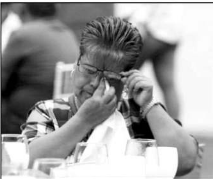
EL DOLOR PERMANECE, LO QUE QUEDÓ RETRAZADO EN EL CONVIVIO CON SOBREVIVIENTES Y FAMILIARES DE VÍCTIMAS

mandatario, e insistió en que a pesar de más de una década de distancia su administración buscará todas las opciones posibles para seguir en el caso y que éste no quede en la impunidad.