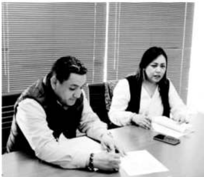
URUAPAN, MICH. - El alcalde refrendó el compromiso para atender la Alerta de Género en Uruapan, al recalcar que es el único municipio de Michoacán que cuenta con una Secretaría de Perspectiva de Género