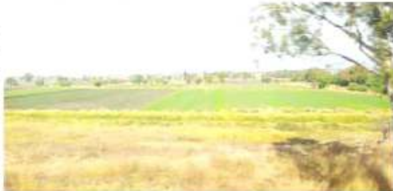
ZAMORA, MICH.- Los programas y acciones en materia de fitosanidad, mantienen replegadas a las plagas y enfermedades de los cultivos en el Valle.

Señaló que se busca generar un control de plagas a base de métodos que disminuyan el uso de químicos que a futuro puedan generar un riesgo a la población, de ahí que también se apele al cuidado de algunos animales como los halconillos, quienes cazan y consumen los ratones de campo, con lo que se da el control natural de dicha plaga.