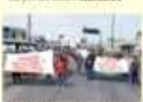
Normalistas, causaron problemas en la capital. REDACCIÓN

Los docentes manifestaron la protesta, pues así fue acordado por las bases. REDACCIÓN