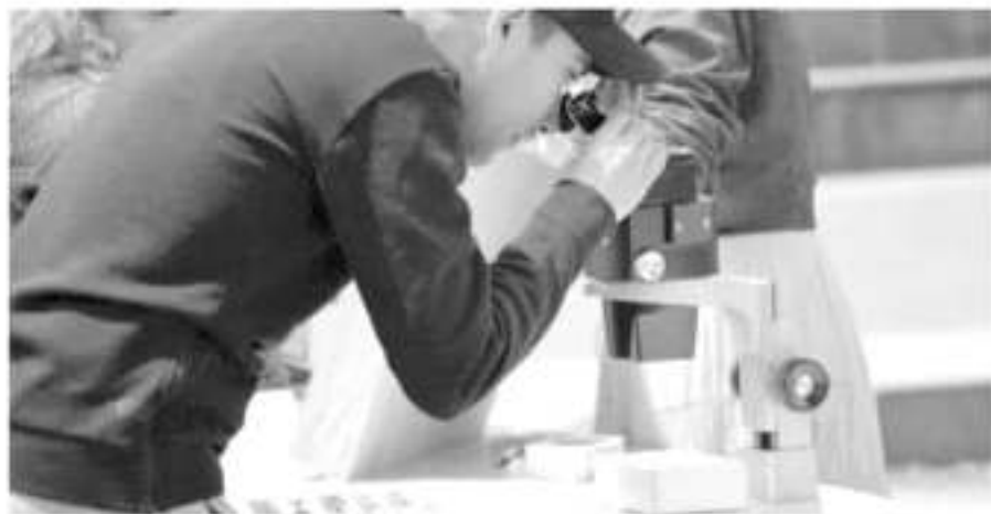
Se busca concientizar sobre la importancia de este fenómeno biológico y fomentar de esta forma el respeto sobre la producción de polinizadores.

Al respecto, este miércoles se reunieron directores de las diversas escuelas del municipio con el alcalde y directores de algunas áreas, con el fin de invitar al sector educativo a que se sume a este programa de los polinizadores, con el fin de que los alumnos comprendan su importancia hacia la naturaleza y hacia la población mundial. Autoridades manifestaron que se acordará colocar este tipo de siembra de polinizadores en las escuelas que acepten el acuerdo, aunque en un lugar apartado de las aulas, ante el riesgo que existe por la presencia de abejas.