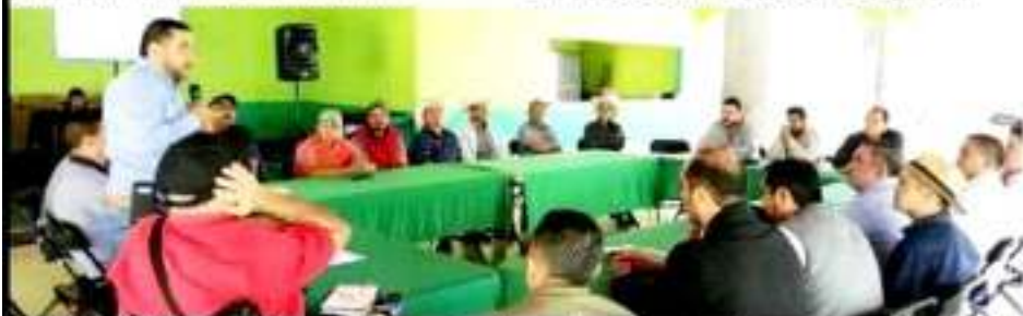
TOCUMBO, MICH.- Los alcaldes de Los Reyes y Tocumbo encabezaron una reunión con personal de enlace del Senado.