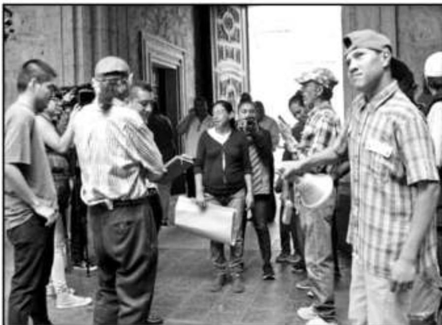
MANIFESTANTES SE DIERON DESPLAZADOS, A PESAR DE QUE ACTUALMENTE NO CUENTAN CON UNA CONCESIÓN.

precisó que en Morelia existen 10 concesiones para el servicio de recolección de basura y 57 personas por el representadas fueron desplazadas de esta fuente de trabajo que, según dijo, no genera grandes ingresos, pero es suficiente para mantener a las familias de los tres o cuatro trabajadores que suelen operar cada unidad de recolección.