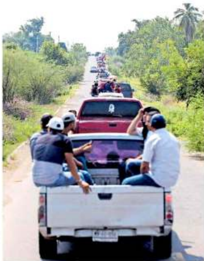
La violencia en la disturbancia en el municipio ubicado en Tierra Caliente.

Posterior a ello, el gobernador de Michoacán, Silvano Aureoles Campos, informó