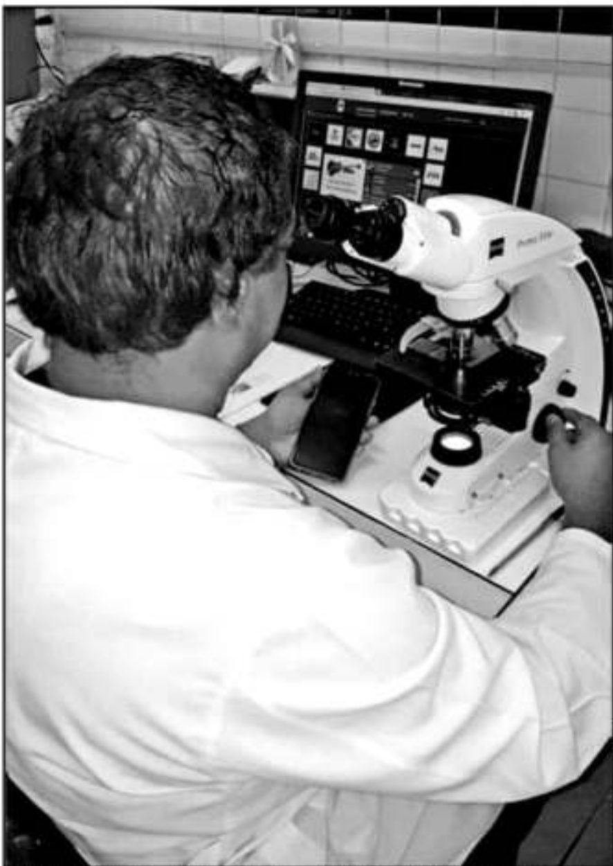
UNA BRIGADA MÉDICA DEL CENTRO DE SALUD REALIZÓ PRUEBAS, EN LAS CUALES SE DETECTARON VARIOS CASOS.