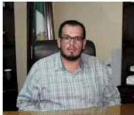
Foto de la cámara y fotografía: 3033231 con el alcalde. OPINIONES

El alcalde de Buenavista, Tomarías Guadalupe Zepeda Chávez, anunció este miércoles que los festejos patrios han sido cancelados, a pesar de que las autoridades estatales aseguraron días atrás que los festejos se llevarán a cabo en todos los municipios, incluidos los de la Tierra Caliente.