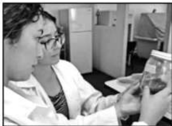
ALUMNOS DEL ITM INNOVAN EN BIOFERTILIZANTES CON MORINGA

"En México se han utilizado biofertilizantes desde los años 70, sin embargo, no se ha registrado que dentro de sus componentes se