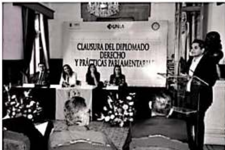
MORELIA, MICH.- El Congreso de Michoacán y diversas instituciones académicas, la mañana de este miércoles, se entregaron constancias por su terminación, a los estudiantes del Diplomado en Derecho y Prácticas Parlamentarias, impartido por la Universidad Latina de América