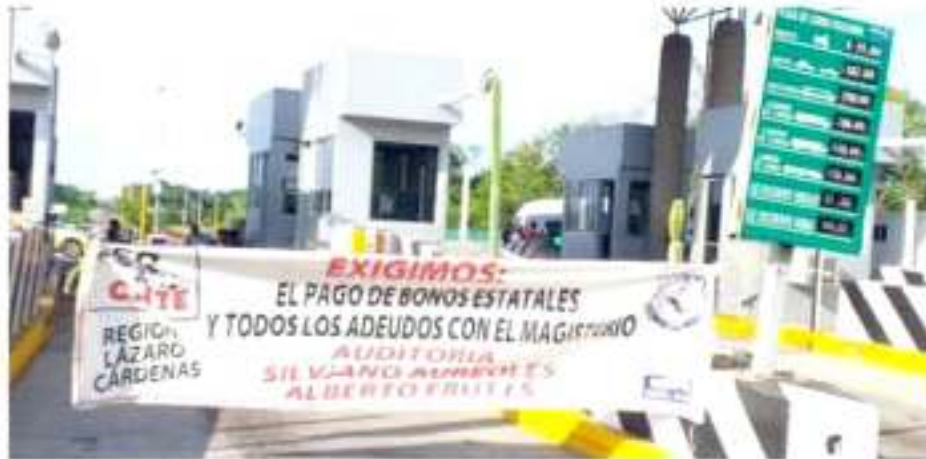
CD. LÁZARO CÁRDENAS, MICH. - Por segundo día, maestros de la CNTE toman casetas de Michoacán y se extienden a oficinas estatales y alcaldías.

Del mismo modo, señalan que se mantuvo un diálogo con todos los niveles de los gobiernos estatales y federales para facilitar una resolución lo antes posible, al tiempo de que también ya se había iniciado una serie de acciones legales permitidas por la ley.