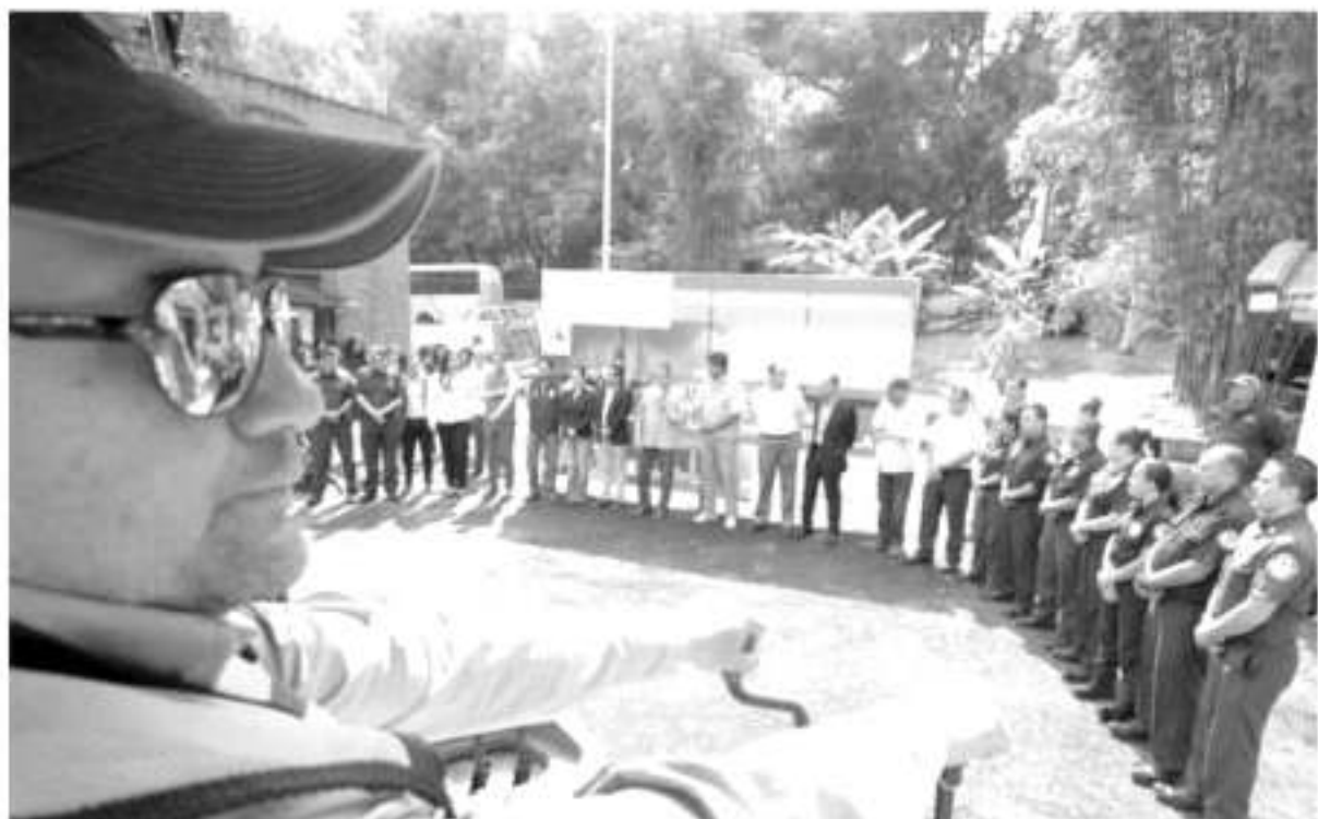
El alcalde capitalino, Raúl Morón Orozco puso en marcha la construcción de la nueva Estación de Bomberos Sur.

La obra consistirá en la demolición del edificio anterior, la construcción de uno nuevo que cuente con los servicios y acabados necesarios para su funcionamiento, además de equipo hidráulico para la atención de siniestros.