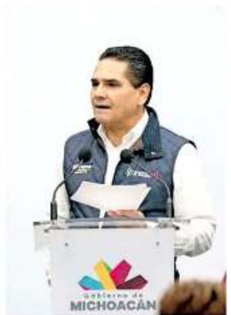
Silvano Aureoles Conejo expresó que los grupos delictivos buscan "cancha libre" para operar.

Y finalmente, el reciente homicidio de Casillas Garibay cometeó el pasado