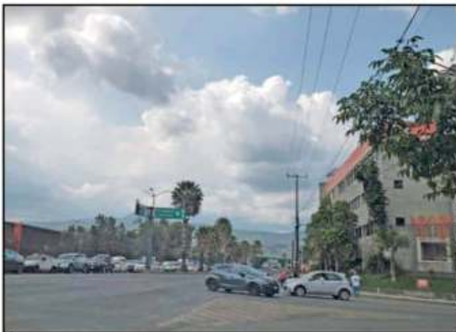
DEBIDO AL TREN, UNA ENORME FILA DE AUTOS SE FORMÓ EN TODO EL LIBRAMIENTO SUR, HASTA LA SALIDA A QUIROGA

El alcalde Raúl Morón ha señalado que el proyecto del puente en Siervo de la Nación se retomará en breve ante las constantes problemáticas que ocasiona el tren.