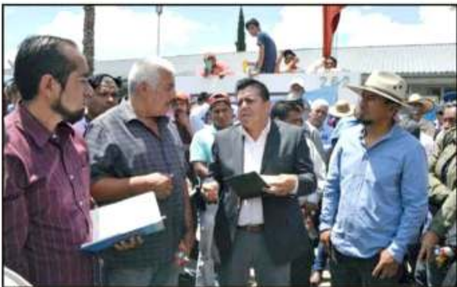
ANTERIORMENTE, LAS COMUNIDADES INDÍGENAS FUERON ATENDIDAS POR EL DELEGADO DEL GOBIERNO FEDERAL.

Señalan que el titular del INPI cobra en dos instituciones públicas