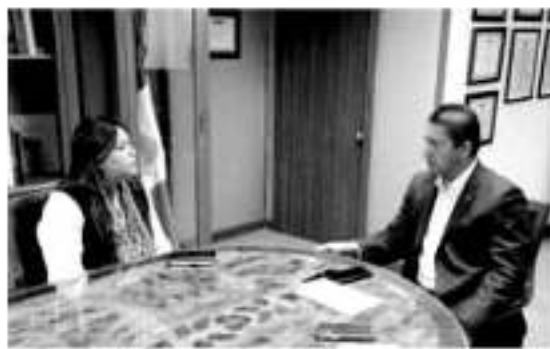
MORELIA, MICH.- La Secretaría de Igualdad Sustantiva y Desarrollo de las Mujeres (Seimujer), y la Rectoría de la Casa de Hidalgo, acordaron realizar acciones que visibilicen la violencia por razones de género.

"En la Universidad Michoacana, rechazamos todas las formas de violencia en contra de nuestras alumnas, por ello trabajamos desde el momento que se identifican los casos para seguir el debido proceso y sancionarlos", externó.