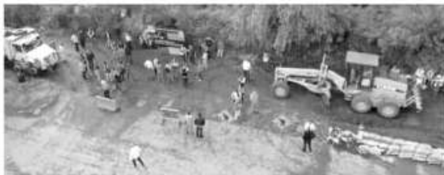
«Transformaremos Morelia con más de 200 obras, acciones y programas»: Raúl Morón.

Consciente del reto que representa hacer 200 obras en el