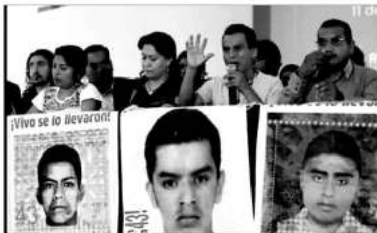
Tras su reunión con el mandatario Andrés Manuel López Obrador, familiares de las víctimas también externaron su preocupación porque otras dependencias están rezagadas en la investigación.

De acuerdo con organizaciones de derechos humanos, policías de Tamaulipas cometieron una ejecución extrajudicial en contra de cinco hombres y tres mujeres, presuntos integrantes de un cártel de la región.