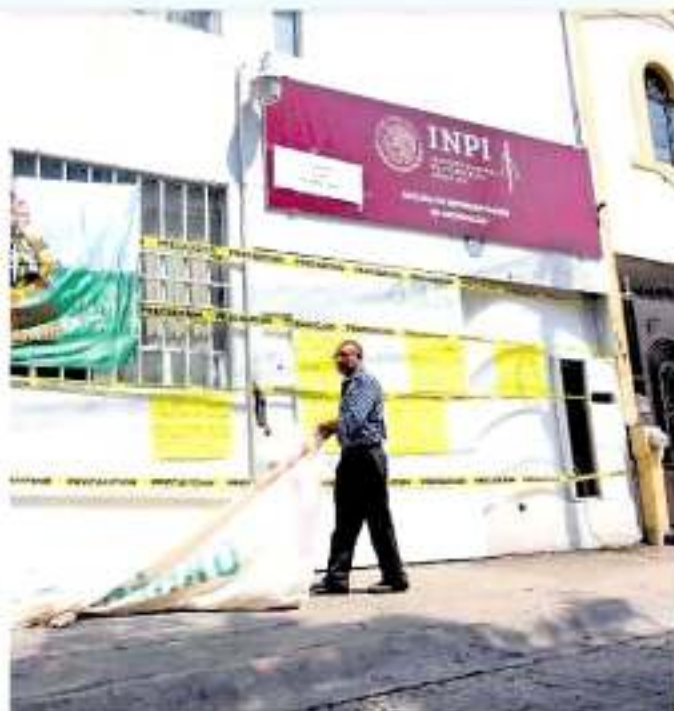
Los integrantes del Consejo Supremo Indígena de Michoacán soldaron las cerraduras de las puertas e instalaron un grupo de guardia en Morelia.

Acompañado por autoridades de varias comunidades indígenas de Michoacán, el representante legal del CSIM advirtió que el cierre de las oficinas del INPI en los tres municipios es sólo una primera acción.