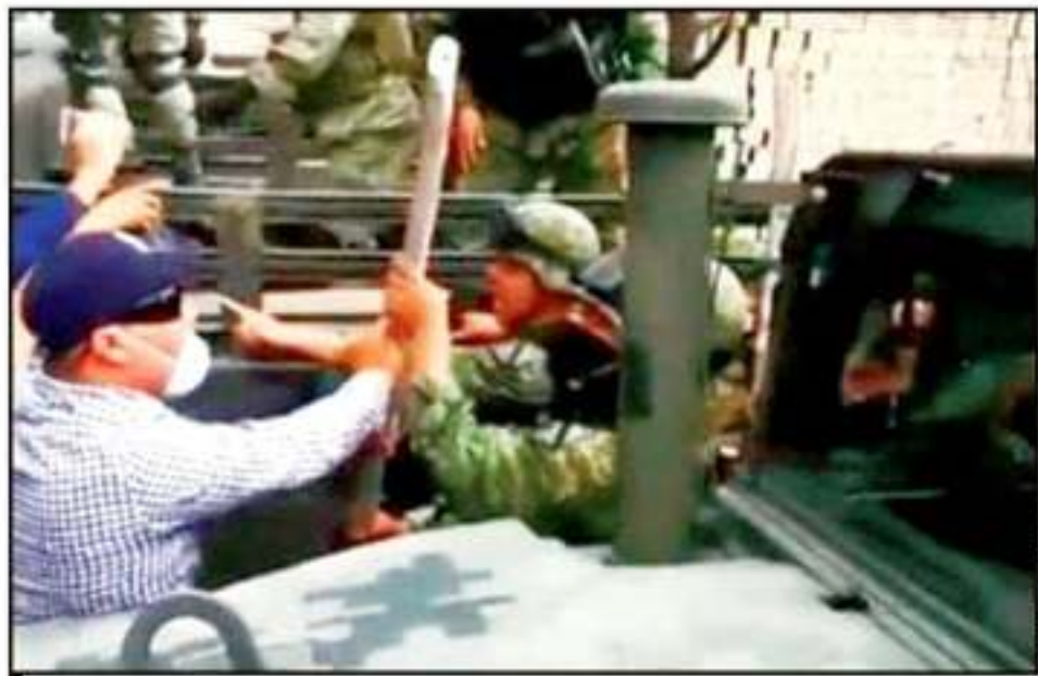
TRAS LAS AGRESIONES QUE SUFRIERON MILITARES POR PARTE DE HUACHICOLEROS, AMLO PERMITE USAR LA FUERZA.

Un total de 15 vehículos fueron asegurados en una bodega del municipio poblano de Acajete, donde el pasado lunes fueron