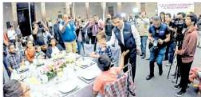
Familiares de víctimas de los atentados del 15 de septiembre de 2008 convivieron con autoridades del gobierno del estado.

A casi 11 años de los granadazos registrados la noche del 15 de septiembre del año 2008 en Morelia, cuyo atentado dejó a más de 100 personas fallecidas y más de 130 heridas, se cerró la tercera etapa de viviendas para las víctimas de tan fatal incidente. Luego de que la actual administración comprometiera apoyar a las personas que directa e indirectamente resultaron afectadas, la inversión fue de un total de dos millones 400 mil pesos en sesenta pies de casa entregados a mismo número de víctimas, además que otras 14 fueron favorecidas con proyectos productivos por parte de la Secretaría de Desarrollo Económico, toda vez que los compromisos de apoyo por parte de la actual administración estatal