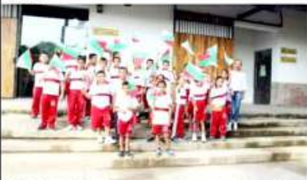
APATZINGÁN, MICH.- Niños de las escuelas primarias Jean Piaget, Emiliano Zapata, José María Calleja y Francisco I. Madero, participaron en el taller interactivo titulado "Tricolor... es".

Las instituciones que participaron fueron las primarias Jean Piaget, Emiliano Zapata, José María Calleja y Francisco I. Madero.