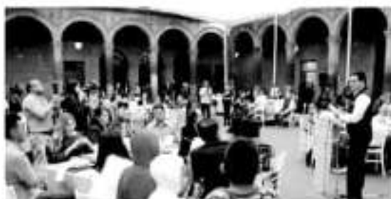
MORELIA, MICH.- Tras varios años de abandono, alumnas y autoridades del emblemático internado femenino "La Huerta" vivieron hoy un día histórico: la entrega oficial de sus nuevas instalaciones.