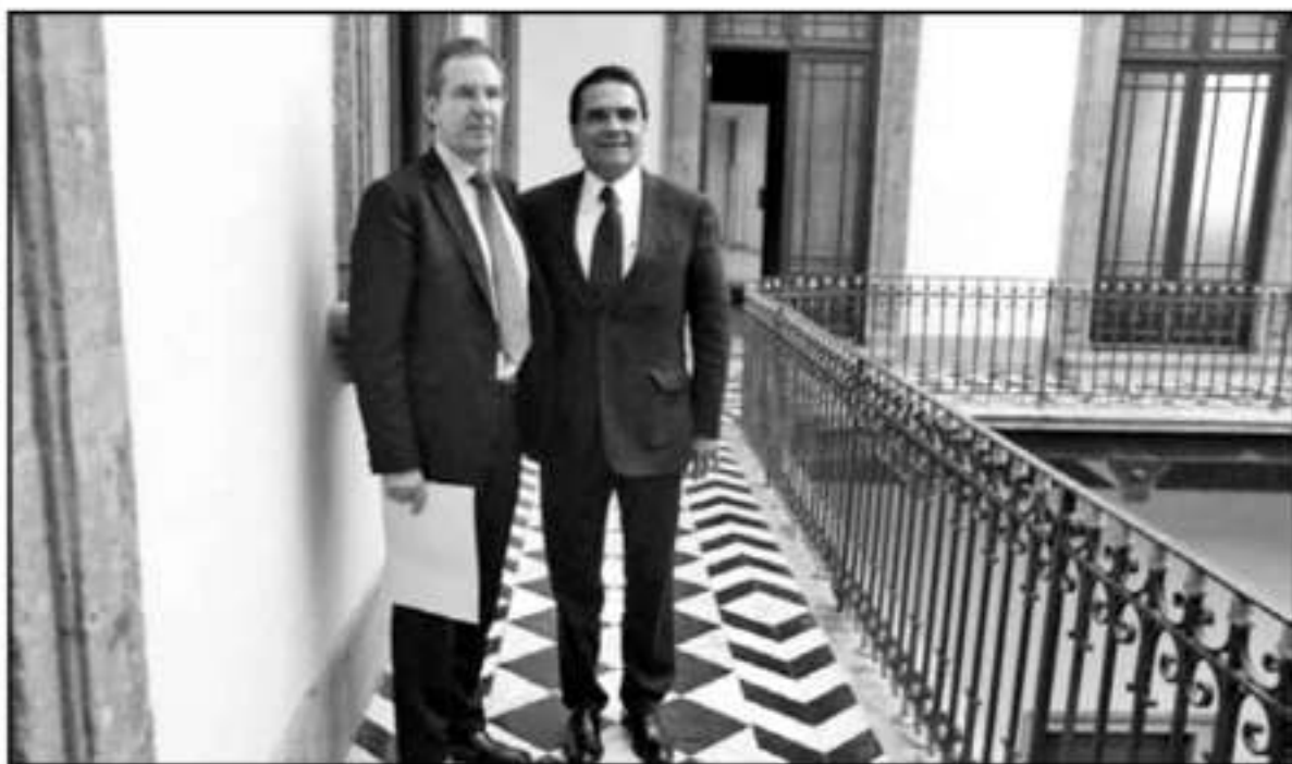
EL SECRETARIO DE EDUCACIÓN Y EL GOBERNADOR MANTIENEN CONSTANTES REUNIONES PARA CONCRETAR EL PROCESO DE FEDERALIZACIÓN DE LA NÓMINA

centralización, no es como cuando se reformó la ley y se creó el Fondo de Aportaciones para la Nómina Educativa y el Gasto Operativo".