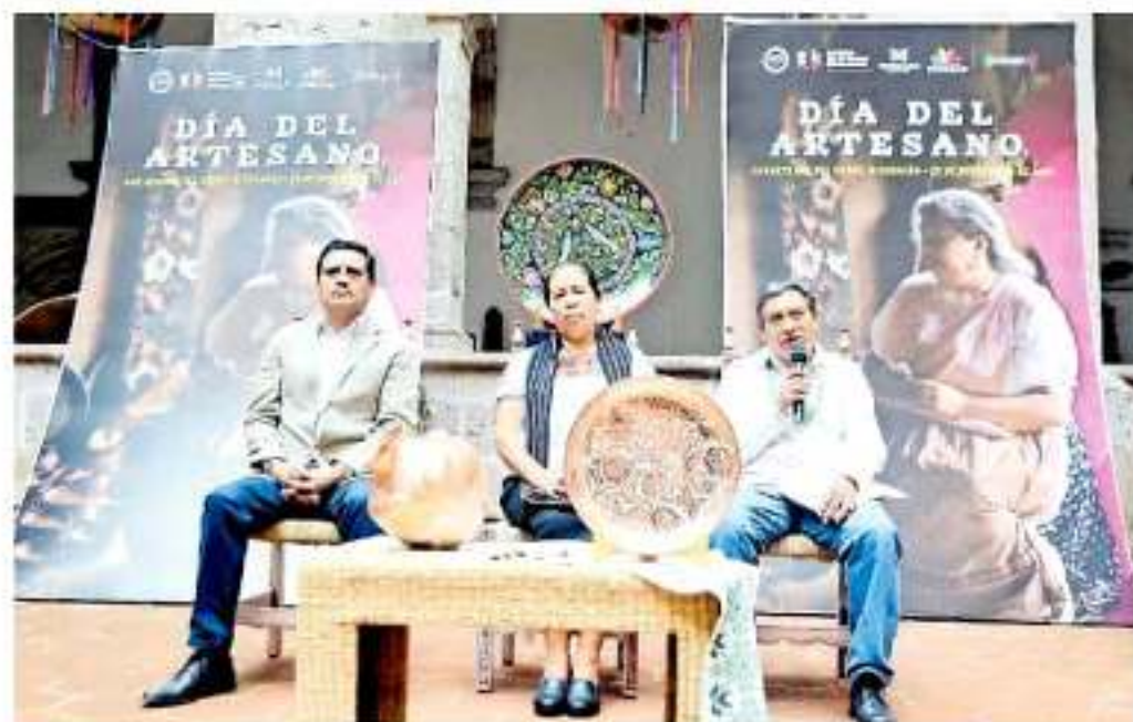
Dentro de las actividades que se realizarán se anunció un desayuno, una misa, un desfile y la convivencia. SILVIA HERNÁNDEZ