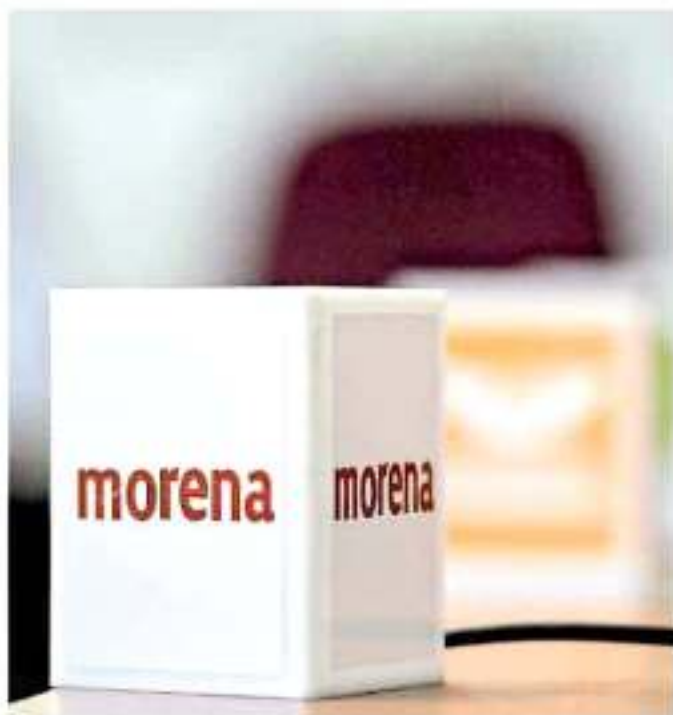
Para el 10 de noviembre el Consejo Estatal elegirá a nuevos integrantes. (A-10-19)