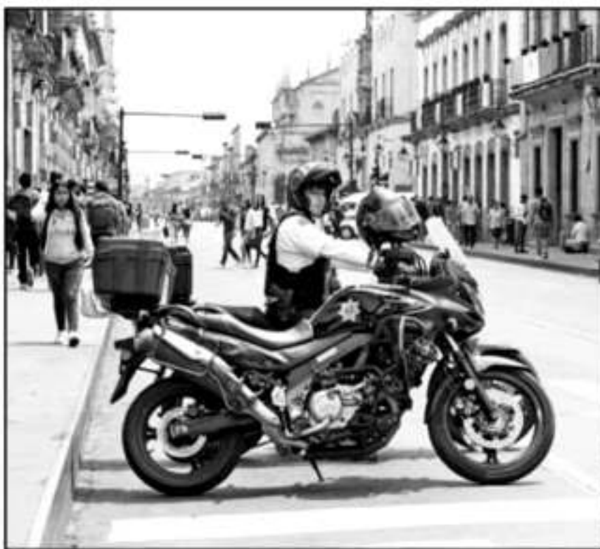
AGENTES DE LA POLICÍA MUNICIPAL PODRÁN CONTAR CON APOYO TECNOLÓGICO DE LA AUTORIDAD NAVAL.

El fenómeno que el propio Raúl Morón Orozco denominó "oleada de violencia" cobró la