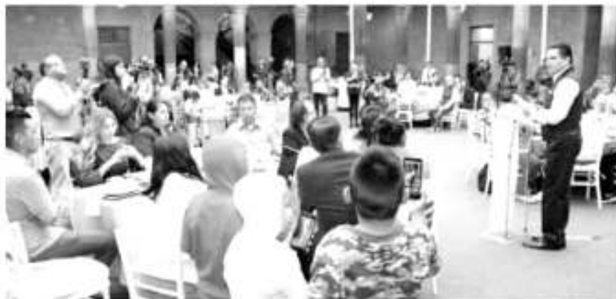
Entregan viviendas a víctimas de granadazos del 2008.

Al hacer uso de la palabra, Aureoles dijo que todos con-