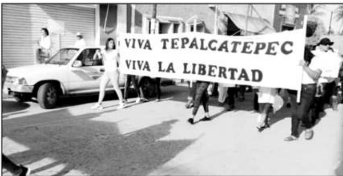
EN DIVERSOS MUNICIPIOS DE TIERRA CALIENTE, HABITANTES HAN SALIDO A LAS CALLES PARA EXIGIR PAZ Y SEGURIDAD ANTE LA OLA DE VIOLENCIA.

cieron esperar. Ante los cuestionamientos de la prensa, el gobernador Silvano Aureoles Conejo refirió que al igual que en el caso de Tepalcatepec se sentarán las mesas para revisar las condiciones en las que se encuentra la demarcación.