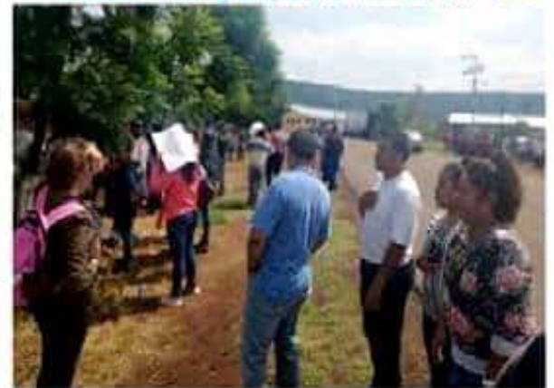
Maestros de la CNTE con pancartas donde hacían ver sus protestas e inconformidad, esperaban ayer al gobernador en el municipio de Puruándiro, en donde finalmente el mandatario no acudió.