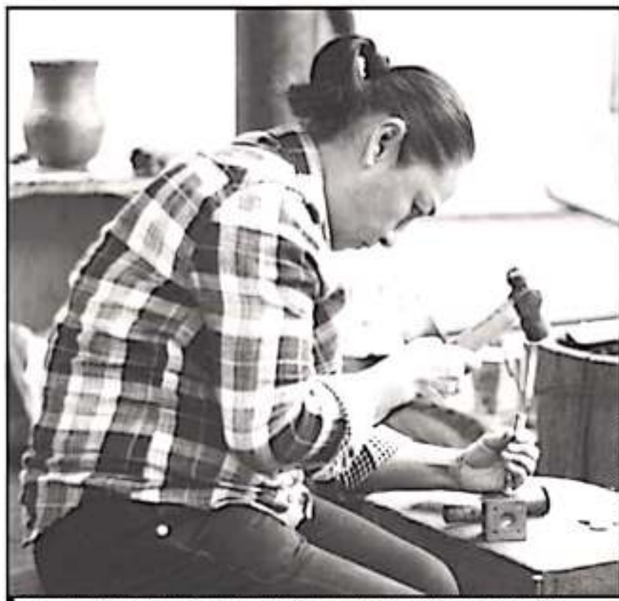
AUTORIDADES DANÁN DIVERSOS RECONOCIMIENTOS A ARTÍFICES DE DIVERSAS RAMAS DE LA ARTESANÍA

Alfarería, textiles, lutería, martillado, juguete popular, talabartería, vidrio soplado, cerámica y cantera son algunas de las ramas artesanales más repre-