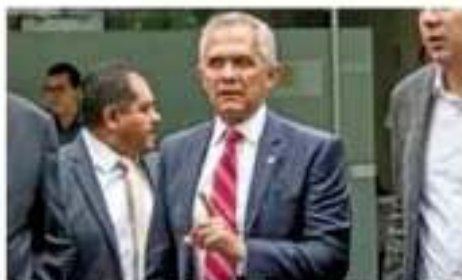
El senador Miguel Ángel Mancera, integrante del grupo parlamentario de la oposición en la Cámara de Diputados, al anunciar que el proyecto de ley de reforma a la Ley del Impuesto sobre el Valor Agregado, se encuentra en el Senado.

Ángel Mancera alertó que las leyes deben estar dirigidas a quienes se dedican a fabricar, vender y exportar facturas falsas, no hacia todos los contribuyentes, como se delimita en la modificación al artículo 3 de la Ley de Seguridad Nacional, donde dice que todos los delitos fiscales serán considerados al mismo nivel del terrorismo o la tracción a la guerra.