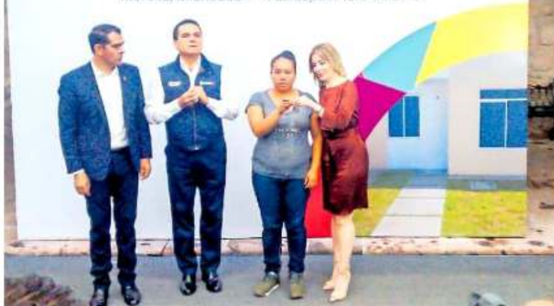
El evento protocolario estuvo encabezado por el gobernador de Michoacán, Silvano Aureoles Cabeza.

Morelia, Michoacán - 11 de septiembre de 2019.