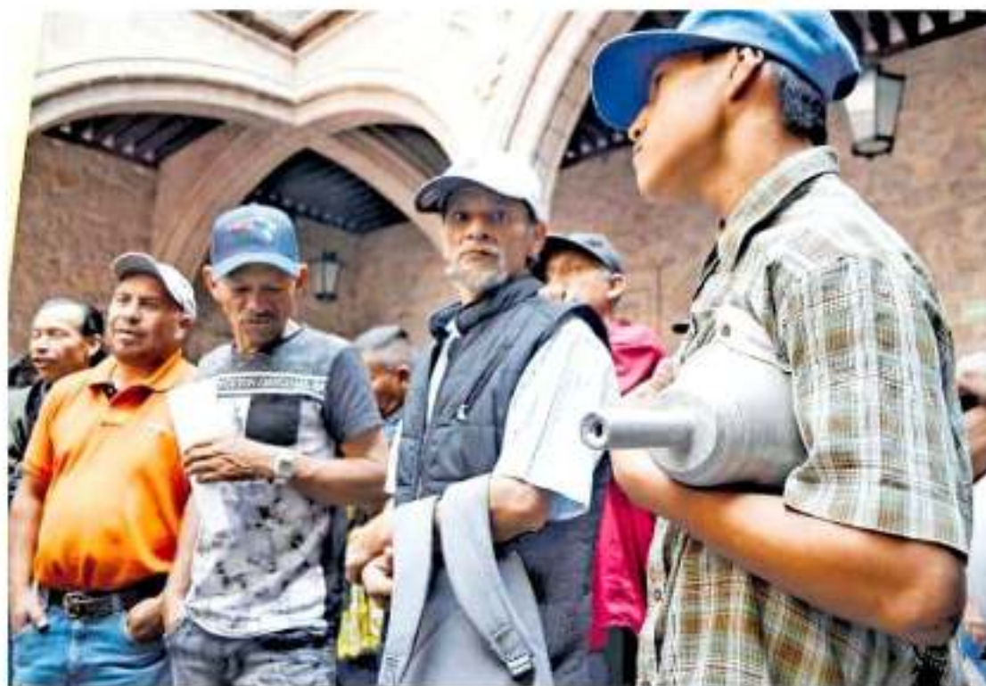
Los agraviados señalan que en la administración pasada se le otorgó su zona de trabajo a una empresa homoclima.