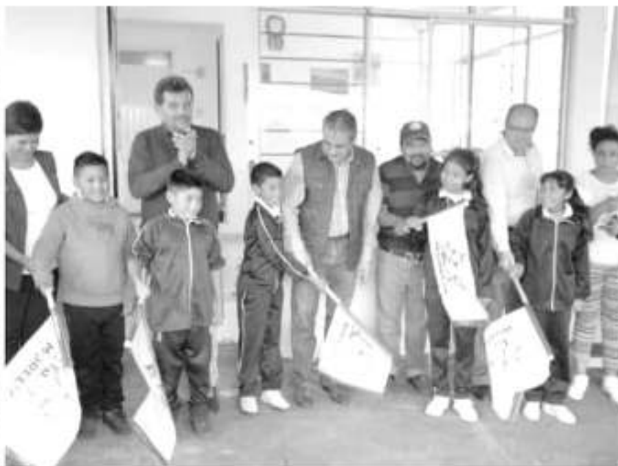
Brindará gobierno de Morelia mejoramiento a 13 unidades médicas, en las que se ofrecerán servicios de medicina general, nutrición y psicología.

Dicha acción iniciará en la Unidad Médica Municipal de San José de las Torres, con una inversión dos millones novecientos sesenta mil pesos, se verá beneficiada con un cerco perimetral ade-