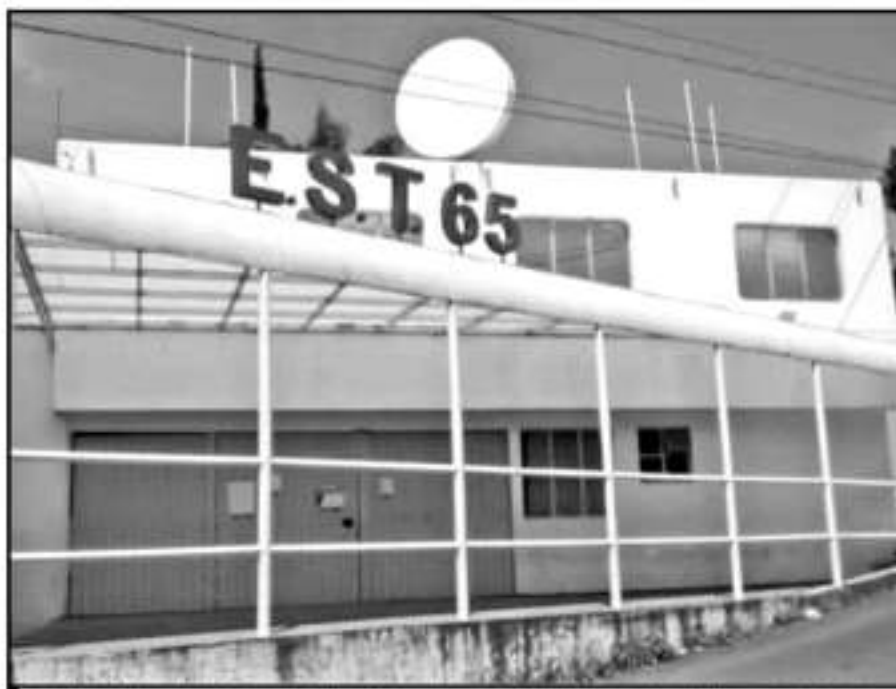
PADRES DE FAMILIA HAN DENUNCIADO DIVERSAS IRREGULARIDADES EN LAS CUOTAS QUE PIDEN EN LA ESCUELA.

programa federal, estatal o municipal. “Hasta la fecha la sociedad de padres de familia no ha rendido un informe detallado sobre todos los recursos que haya recibido durante el ciclo escolar, mucho menos el monto y destino que se le haya dado, es decir, no ha habido transparencia en el manejo de los recursos”, dijo.