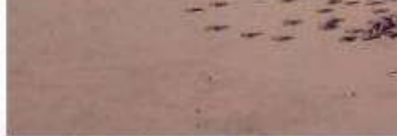
CD. LÁZARO CÁRDENAS, MICH.- En un lapso de tiempo, el Tortuguero de Solera de Agua ha liberado un porcentaje superando así la meta establecida en un inicio, d

Cabe recordar que la última gran liberación de tortugas tuvo lugar el pasado siete de enero, en la que se contaron 1,522 tortugas.