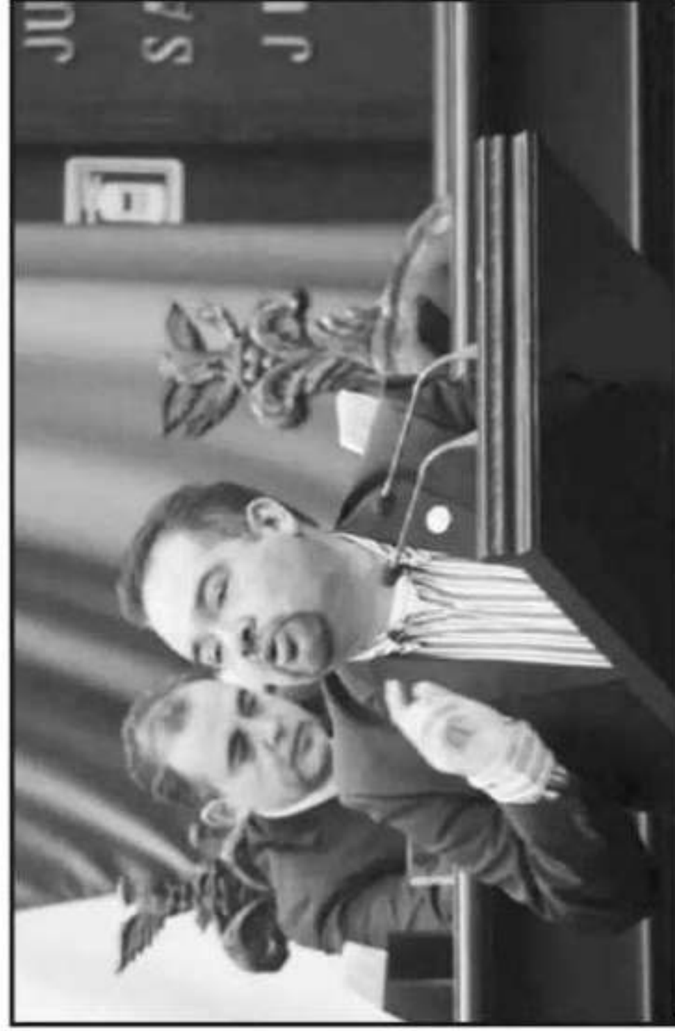
EL DIPUTADO NORBERTO ANTONIO MARTÍNEZ SEÑALA QUE BUSCARÁN COADYUVAR EN EL TEMA DESDE EL CONGRESO.

citado por el Distrito de unió que la estadística señala que en los últimos años, más del 90 por ciento de las variedades de cultivos han desaparecido de los campos agrícolas, mientras que la diversidad de las razas de animales ya no existen, y las principales zonas de pesca están siendo explotadas sin límites sostenibles.