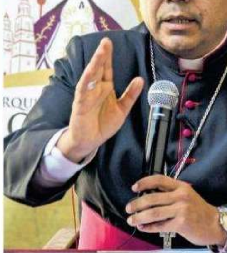
El obispo moreliano también hizo referencia del menor de 11 años que asesinó a su maestra en una escuela en Torreón, Coahuila /c

tenor de cada persona. Durante las primeras horas del pasado seis de enero, en una vivienda del fraccionamiento Villas del Pedregal de Morelia, una mujer de 29 años privó de la vida a su hija menor y lesionó a otro de sus hijos con un objeto punzocortante, esto, según declaraciones de la misma acusada como parte de un plan fallido de homicidio y suicidio por depresión, infidelidades y violencia al interior del seno familiar.