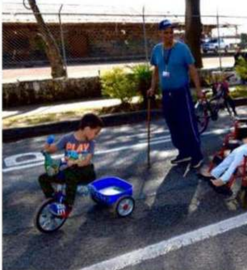
URUAPAN, MICH.- Miles de personas, sobre todo niñas y niños, disfrutaron de las actividades del "Domingo Familiar".