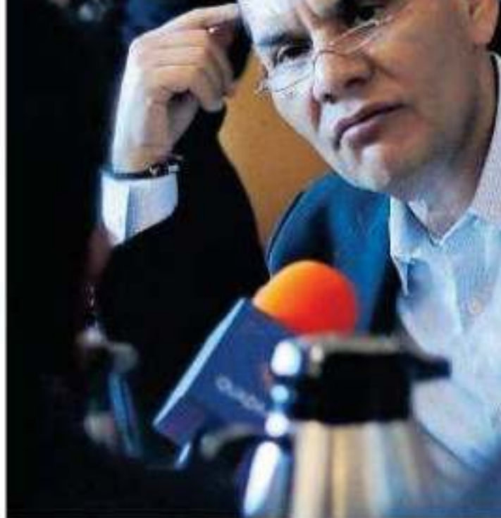
La obra fue construida durante los gobiernos de Leónel Godoy Rangel, recordó el funcionario

Revelando a su vez que incluso la misma ASF cuenta junto con el Ministerio Público y la Fiscalía General de la República (FGR) algunas denuncias en contra de ex