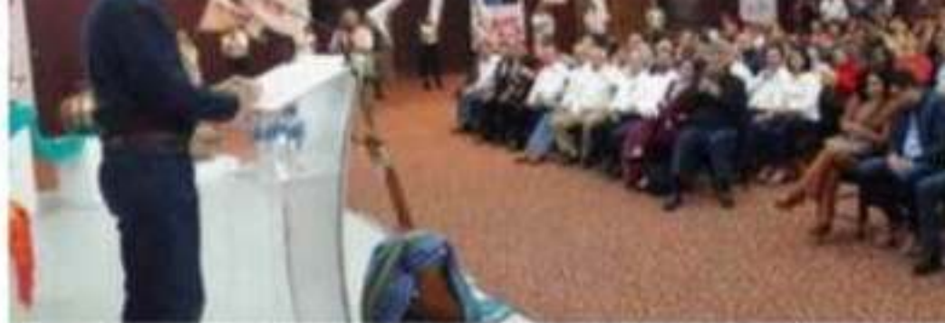
El Senador Cristóbal Arias Salís, durante la Primera Asamblea Estatal de sus Casas de la Unión Ciudadana.

El fondo del asunto en el amparo promovido era que fueron actos ilegales el que el Poder Ejecutivo en su propuesta de Ley de Egresos le asignó un presupuesto a la Junta de Caminos de Michoacán un monto de 0.00 pesos y así lo hizo llegar al Poder Legislativo.