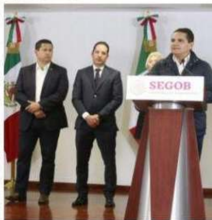
MORELIA, MICH.- Silvano Aureoles Conejo, en Comisión de Seguridad y Justicia de la Conago de seguridad del presente año para hoy lunes, e

Cabe destacar que, la ubican a Michoacán e general de delitos y en impacto, como homicidio de vehículo, consideran los estados con mayor in