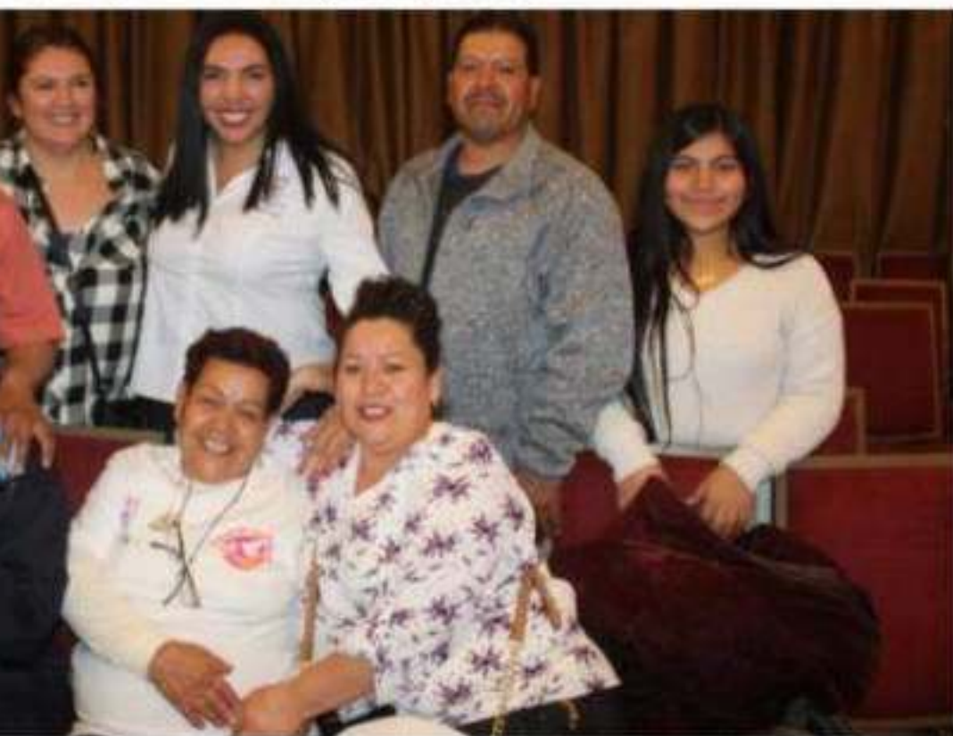
Las "Palomas Mensajeras", de Jacona, viajaron a la unión americana a visitar a sus familiares. Después de décadas, habían estado separados.

En el evento las familias pudieron reunirse, volverse a ver y compartir esta alegría con más personas, además de contar con un evento para que las personas pudieran tener su bienvenida, finalmente cada uno de ellos pudo irse a los hogares de sus seres queridos y disfrutar antes de regresar a México.