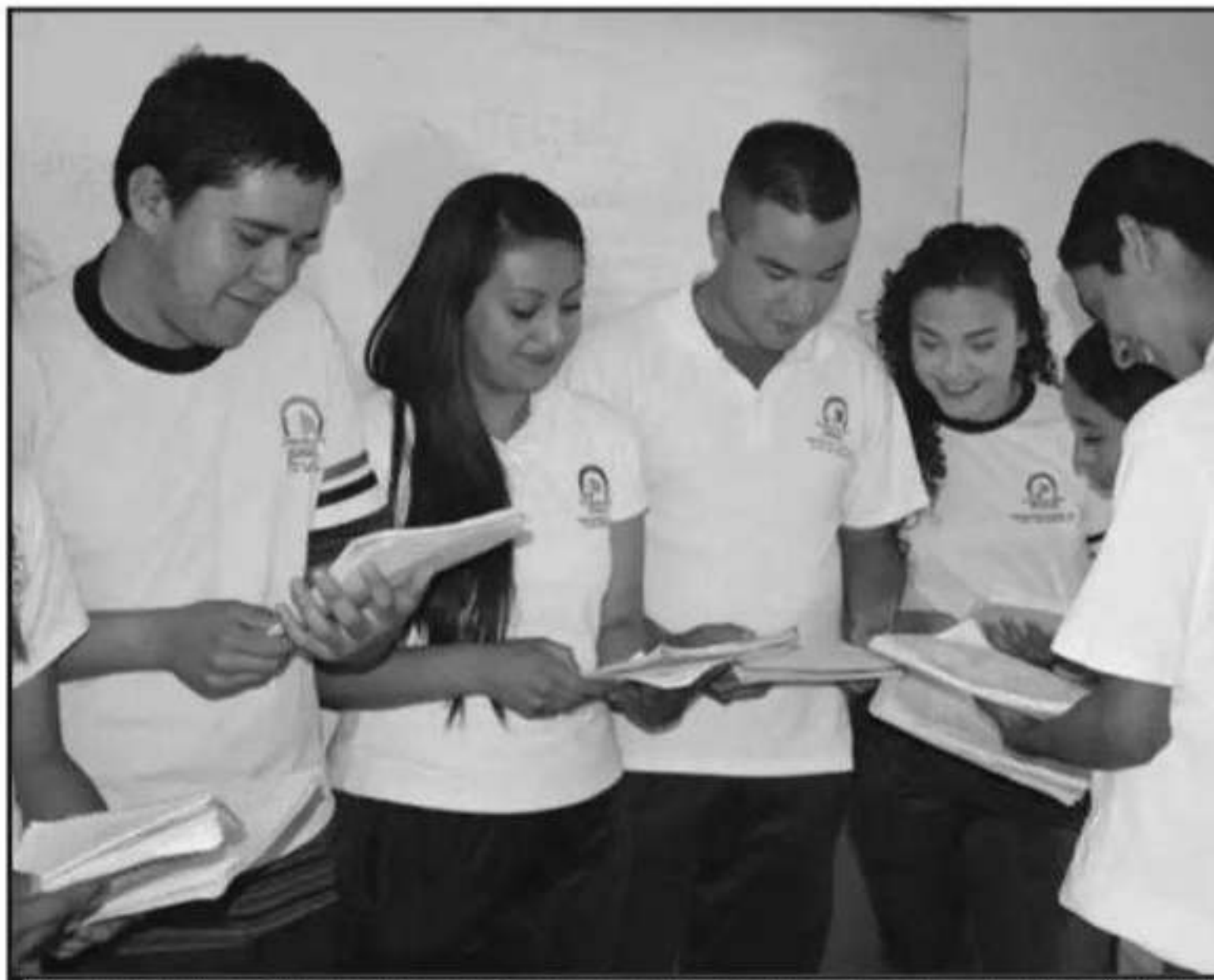
EN EL TELEBACHILLERATO ESTÁ BECADO EL 93 POR CIENTO DE SUS ALUMNOS; SIN EMBARGO, LA DIRECCIÓN SEÑALÓ QUE H