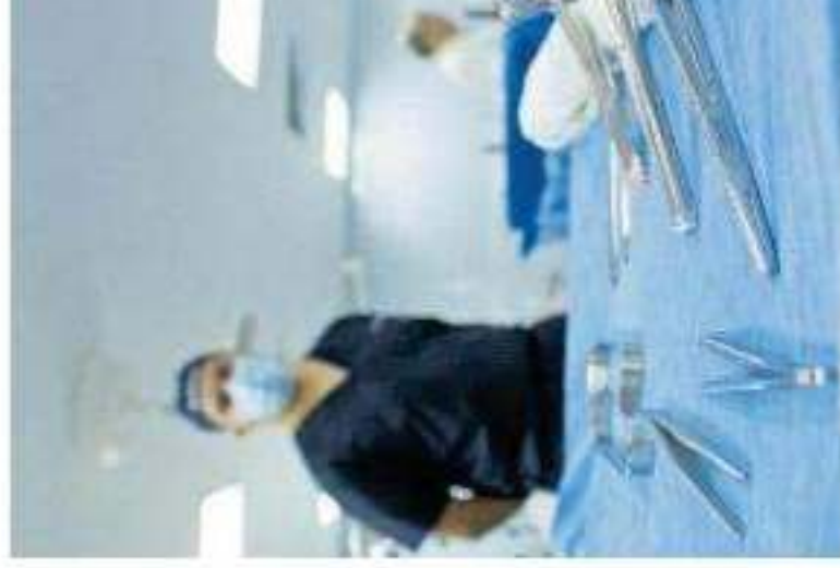
En 2019 fueron 48 mil 296 pasantes que acreditaron las evaluaciones

los Médicos de Michoacán (Colmemac) detectó en el 2019 más de 400 usurpadores especialistas que servicios de cirugía plástica, radiología y anestesiología y además, a pesar de que no especialidad en las áreas de medicina general o continúo el fenómeno entre este sector del médico se define como el