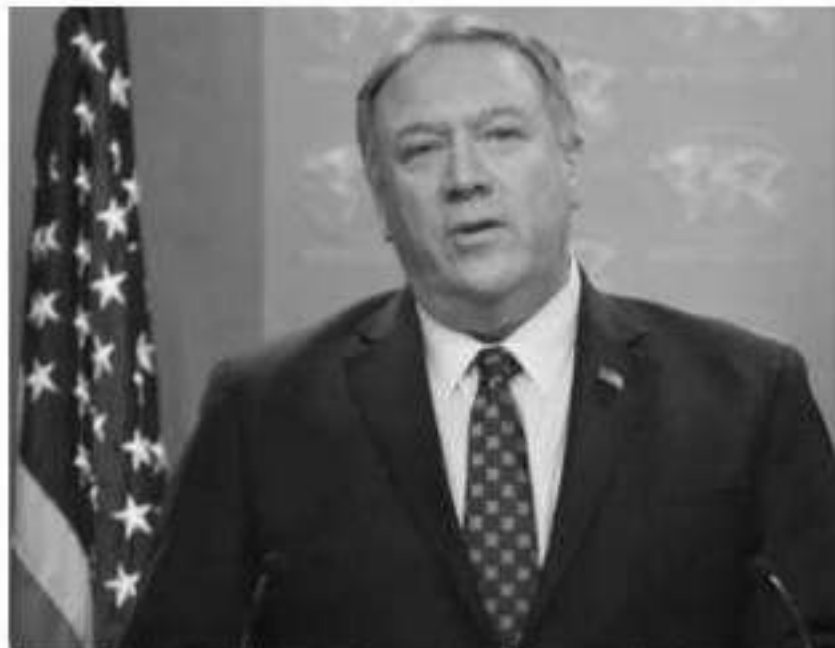
El secretario de Estado de Estados Unidos, Mike Pompeo, en un momento de su discurso en un archivo.

Sin embargo, fuentes de seguridad especularon en declaraciones a Efe con que al menos parte de las fuerzas extranjeras allí desplegadas habrían abandonado la base tras los recientes ataques cruzados entre Washington y Teherán en territorio iraquí. Ataque con misiles Este es el tercer ataque con proyectiles contra esta base en los últimos días, después de que el pasado jueves cayera un cohete en sus inmediaciones sin causar víctimas y de que hace una semana su parte meridional fue atacada, causando daños materiales en unos almacenes de armas del Ejército iraquí.