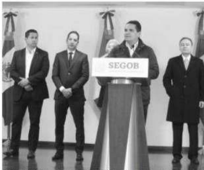
MORELIA, MICH.- El Gobernador de Michoacán, Silvano Aureoles Conejo, como el coordinador de la Comisión de Seguridad y Justicia de la Conferencia Nacional de Gobernadores (Conago) convocó a la primera reunión de seguridad del presente año, el lunes, en la Ciudad de México

Cabe destacar que, las estadísticas del Sistema de Información del Sistema de Estadística del Poder Judicial Federal ubican a Michoacán en el lugar 23 en incidencia general de delitos, en el lugar 19 en delitos de alto impacto como el homicidio, secuestro, extorsión y robo de vehículo, considerando que en primer lugar están los estados de México y la incidencia de delitos.