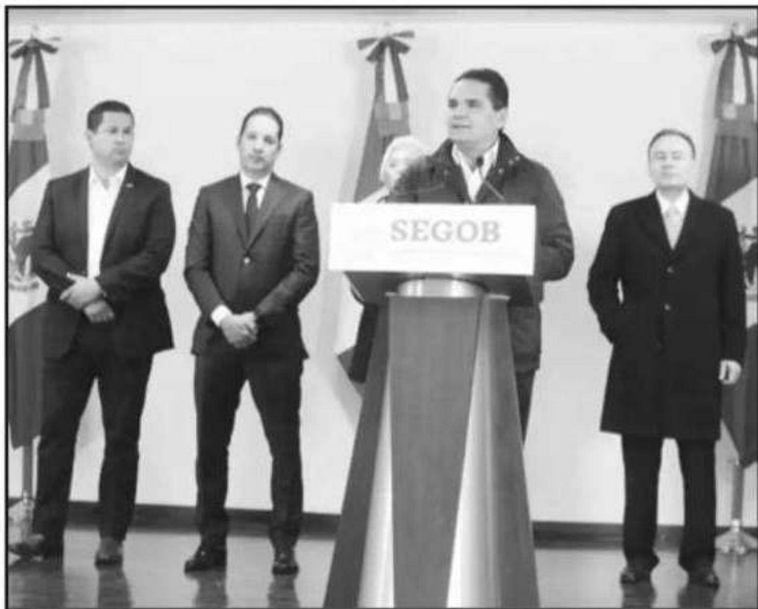
EL GOBERNADOR ANUNCIÓ LA PRIMERA REUNIÓN DE LA CONAGO EN MATERIA DE SEGURIDAD, PARA ESTE DÍA.

de Seguridad, presidi das por los alcaldes