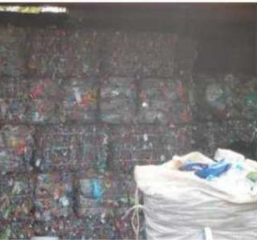
Solo la participación de sociedad y gobierno por el impulso del la total prohibición del uso de bolsas de plástico.