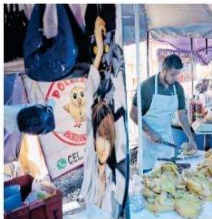
El monto de pago varía por la zona en la que ofrecen sus mercancías.