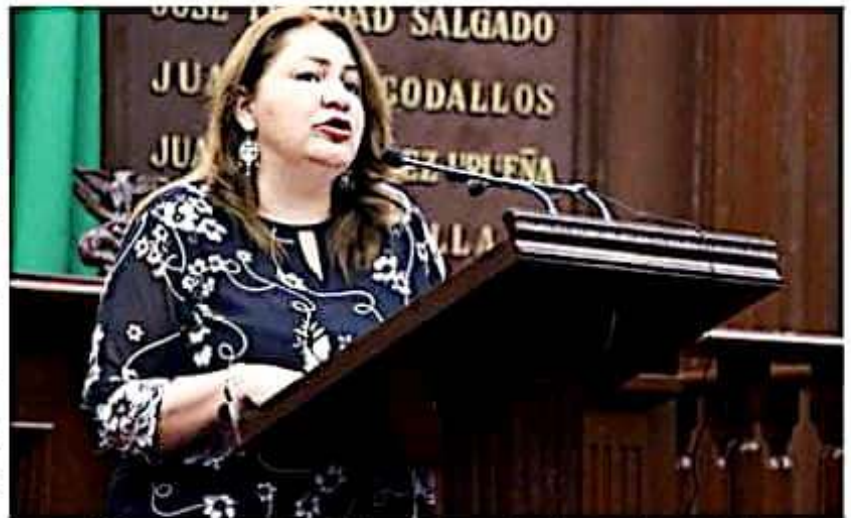
Cristina Portillo Ayala, integrante del grupo parlamentario de Morena en el Congreso local.