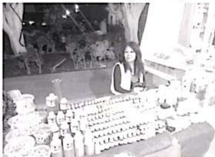
El Departamento de Turismo Municipal realizará un padrón incluyente de artesanos, cocineras y productores tradicionales.

Según la convocatoria, América representará al 03 distrito en la Cámara de Diputados y Senadores en el mes de abril de 2020, junto con los demás niños ganadores de los diferentes distritos del país.