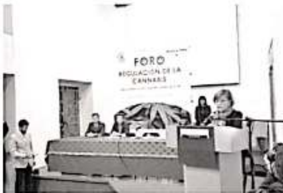
La senadora Blanca Piña Gudiño encabezó el Foro: Regulación de la Cannabis.

especialistas y ciudadanos, recordó que la escalada de violencia en el país se generó por estrategias fallidas de anteriores administraciones federales que, en el intento de erradicar la ven-