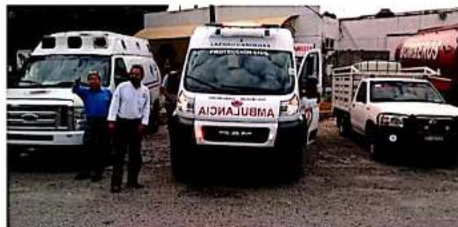
CD. LÁZARO CÁRDENAS, MICH.- PCM hizo un llamado a la población para que durante esta temporada decembrina eviten accidentes por el mal manejo de fuegos pirotécnicos e incendios de viviendas, por cortos eléctricos.