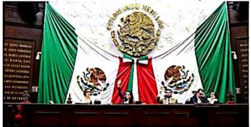
Con 14 solicitudes ante el Congreso del estado, concluyó la etapa de registro de aspirantes a Comisionado del Instituto Michoacano de Transparencia, Acceso a la Información y Protección de Datos Personales.

Finalmente dijo que desde el Congreso estarán vigilantes de que las asignaciones presupuestales correspondan a las prioridades de la población, entre ellas la educación. "No vamos a permitir presupuestos ausentes de las preocupaciones de la población, pero tampoco que estos se desvíen, una vez aprobados, a otras partidas que no son las que está representación popular haya determinado. Esa es una facultad del legislativo, que sin duda ejerceremos".