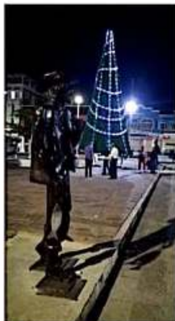
CD. LÁZARO CÁRDENAS, MICH.- La asociación civil Ciudadanos Unidos LZC, anunció que este domingo 15 de diciembre encenderán por primera vez en su historia un gigantesco árbol navideño en la Plaza Melchor Ocampo.

Destacaron que, gracias a la aportación económica de integrantes de CU LZC, de comerciantes establecidos y de personas provenientes de otros sitios de la ciudad se lograron reunir fondos para la instalación del árbol navideño, para la colocación de pasacalles, la compra de piñatas, premios para los concursos de canto, pastorelas, vendimia, noche bohemia, exposiciones de pintura, entre otras que se llevan a cabo semana con semana, como son los Jueves y sábados de danzón y otros ritmos bailables de la música popular.