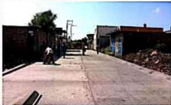
LOS REYES, MICH.-Avanza la pavimentación de la calle Valle de Guayangareo, en la colonia Verde Valle.

Finalmente señaló que la obra se ejecuta sin ningún costo para los vecinos beneficiarios de la calle Valle de Guayangareo y agregó que en solo algunos casos los usuarios del Sistema de Agua Potable y Alcantarillado Descentralizado (Sapad) tuvieron que regularizar su pago en el servicio de agua potable.