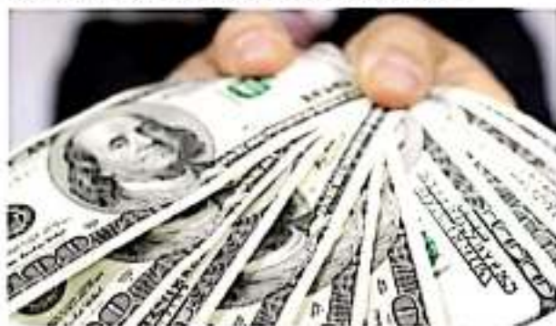
URUAPAN, MICH.- Michoacán se coloca como líder nacional en la captación de remesas provenientes de los Estados Unidos, con una cifra superior a los 3 mil 600 millones de dólares.

Mencionó que no se tiene un dato preciso de cuántos migrantes se encuentran en Chicago y el resto de Estados Unidos, porque como latinos cada 10 años no quieren inscribirse al censo, por lo que se ha dejado de contabilizar por miedo, situación que complica aún más el poder tener políticas que los protejan en dicho país en materia de salud pública, educación y asegurar su representación en todos los