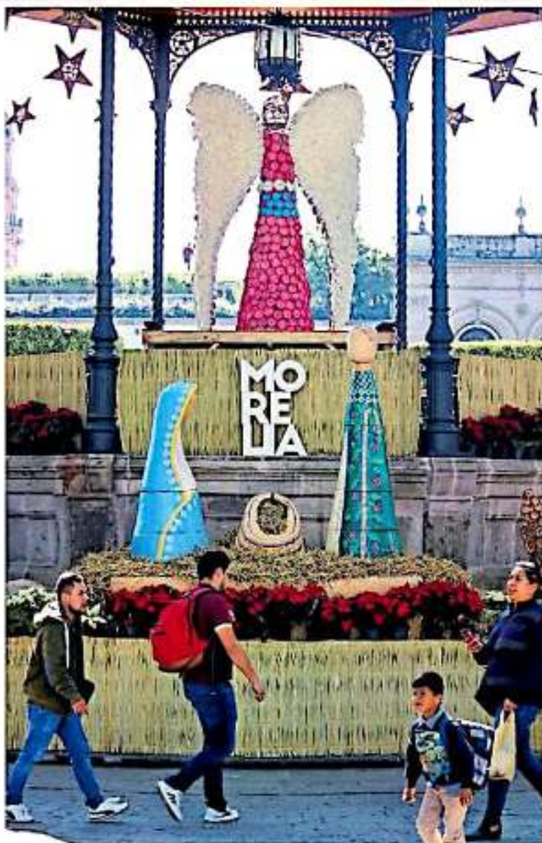
Un enorme nacimiento capulense decorará la capital michoacana.

Es de señalar que, únicamente en Capula existen 610 talleres de artesanos,