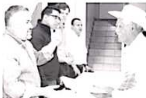
El H. Ayuntamiento promueve el programa, y apoya en todo en trámite a los adultos mayores que desean participar y en el cual resultaron beneficiados 24 personas.

Finalmente, las personas de la tercera edad que fueron beneficiadas con este programa, agradecieron al presidente municipal, quienes emocionados reconocieron el esfuerzo que realizan tanto el Ayuntamiento como la Oficina de Atención al Migrante, al recibir de sus manos las visas que serán el pase para que se vuelvan a reunir con sus seres queridos después de más de 10 años de no verse.