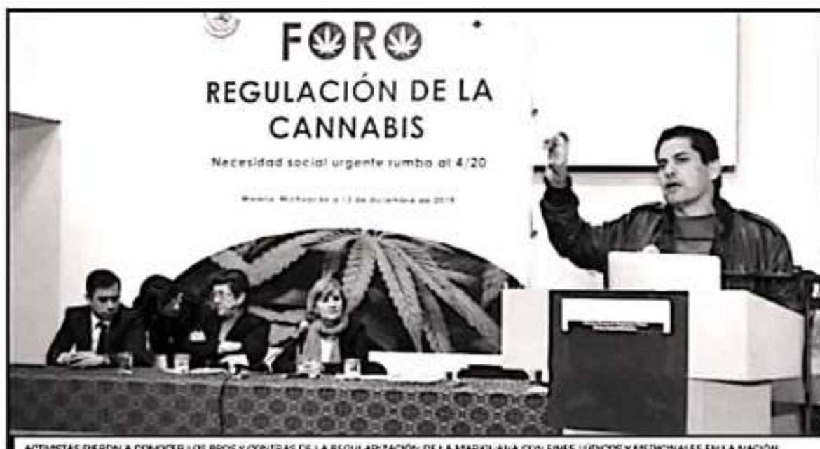
ACTIVISTAS DIERON A CONOCER LOS PROS Y CONTRAS DE LA REGULARIZACIÓN DE LA MARIJUANA CON FINES LÚDICOS Y MEDICINALES EN LA NACIÓN.

"Hay personas que llegan y nos dicen quiero sembrar 200 hectáreas, pero es un tema que tenemos que revisar en torno a las necesidades que existen", dijo.