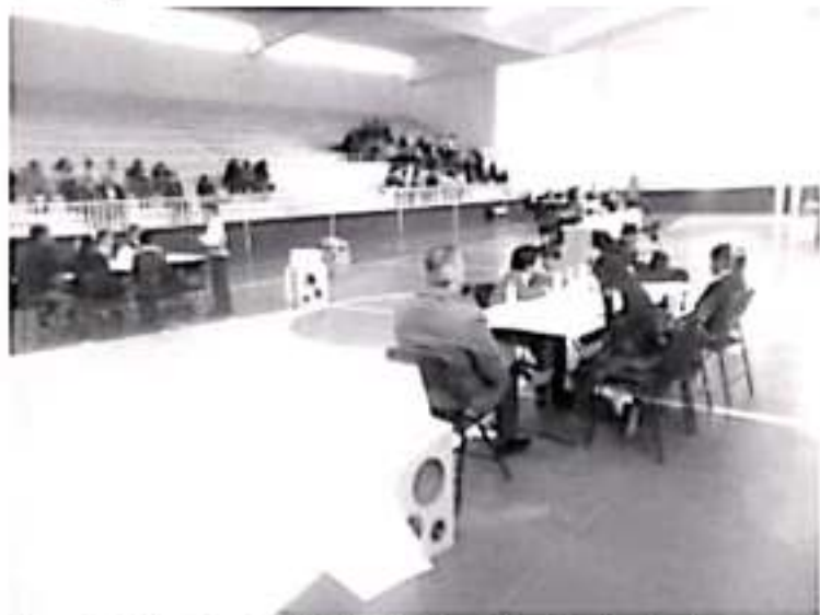
El tema relacionado a la erradicación de la violencia y los derechos de los niños, fue presentado por los niños y niñas del distrito 03, que corresponde al INE, organizador del evento.

Recalcó que el trabajo en el tema del turismo será permanente, sobre todo porque Zitácuaro posee riquezas en varios aspectos, naturales, históricas, y gastronómicas.