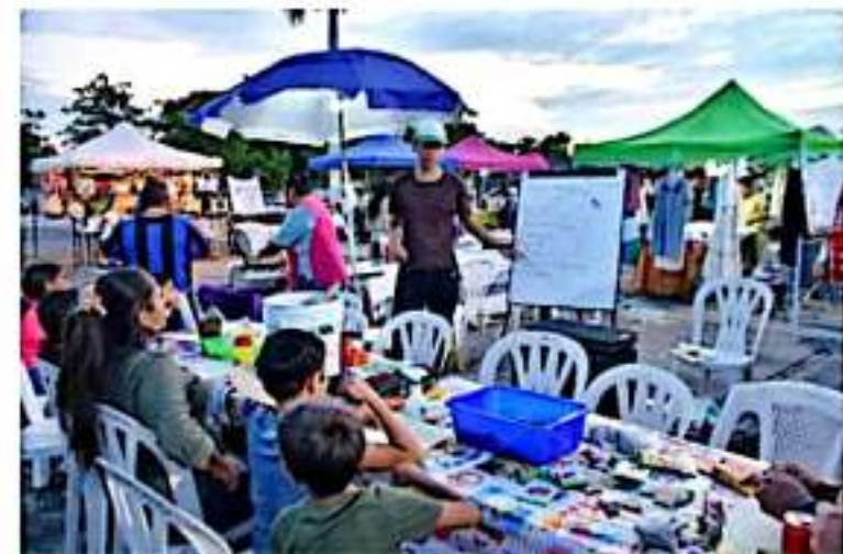
CD. LÁZARO CÁRDENAS, MICH.- Hoy se realizará una nueva edición del Emprende Fest LZC en la explanada municipal.