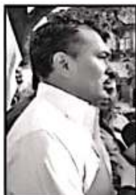
EL LÍDER SINDICAL INSISTE EN LOS ADEUDOS SALARIALES QUE HAY