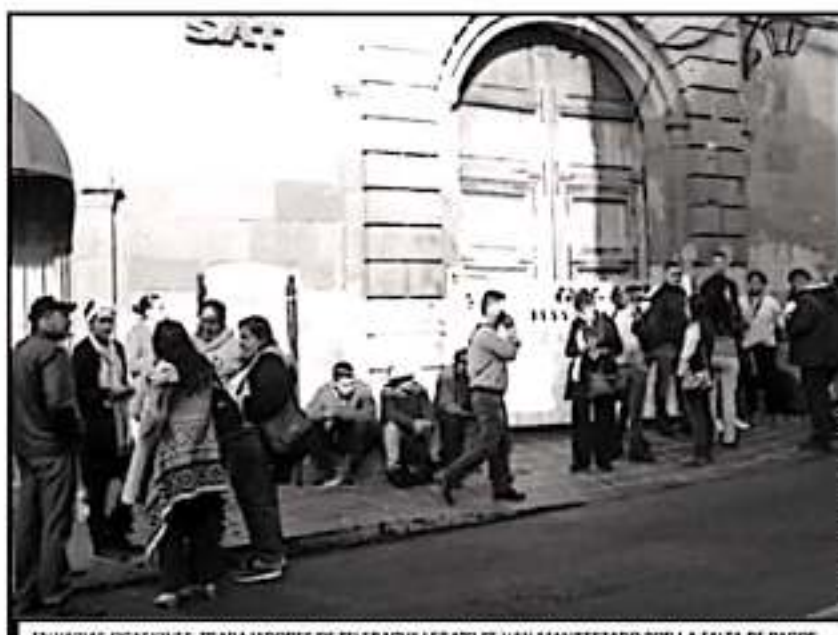
EN VARIAS OCAIONES, TRABAJADORES DE TELEBACHILLERATO SE HAN MANIFESTADO POR LA FALTA DE PAGOS

de pesos al Telebachillerato. Incluso según datos de la cuenta pública 2018, dicha partida se elevó a 136 millones de pesos, pero solo se pagaron 139 millones. Desde entonces los trabajadores empezaron a sufrir