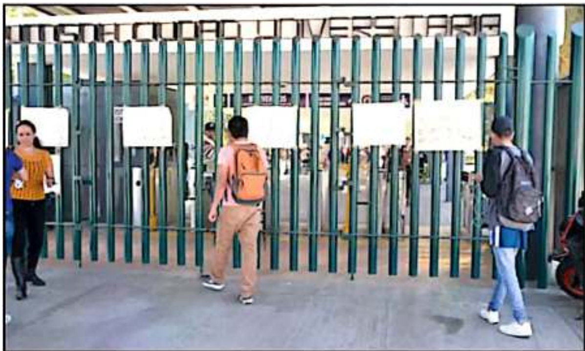
EL SINDICATO DE EMPLEADOS REALIZÓ UN PARO DE 12 HORAS PARA EXIGIR LOS PAGOS PENDIENTES Y EN PRETISTA A LA PROPUESTA DE REFORMA DE PENSIONES.

La postura de la Casa de Hidalgo y de la federación ha sido irreductible en términos de señalar que se ve imposibilitada a gestionar más recursos extraordinarios, en tanto no se cumpla con la quinta cláusula del Convenio de Apoyo Financiero de Recursos Públicos Federales Extraordinarios no Regularizables, firmado el 21 de diciembre del 2018 entre la Universidad, el Estado de Michoacán y el Gobierno Federal, a través de la Subsecretaría de Educación Media Superior de la SEP.