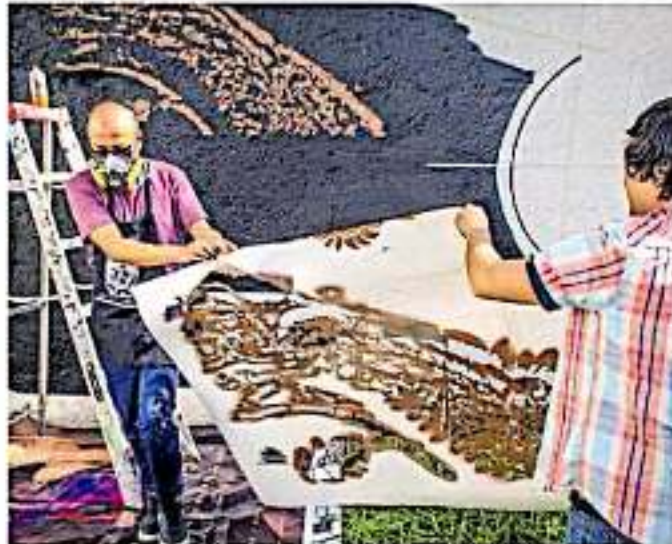
Dress Aguilar no le gusta la etiqueta de artista urbano, sólo un activista que toma las calles, las bardas y los edificios. FERNANDO MALDONADO

En ese rincón del centro de la ciudad capital ha encontrado un pequeño espacio para pintar el rostro de una mujer. Ins- tenta en cuyo fondo se asoma la sila de luz. Como muchos de sus otros momen- tos, sembró los primeros ramos con graffis callejeros en su época de secunda- ria. "me salta en la madrugada a rayar las calles, andaba metido en ese rollo de las pandillas, de las crews", pero con el tie- po se abrió de un ambiente que a corto plazo dejó como consecuencia mu- chos muertos, encarcelados o atropados en alguna adicción.