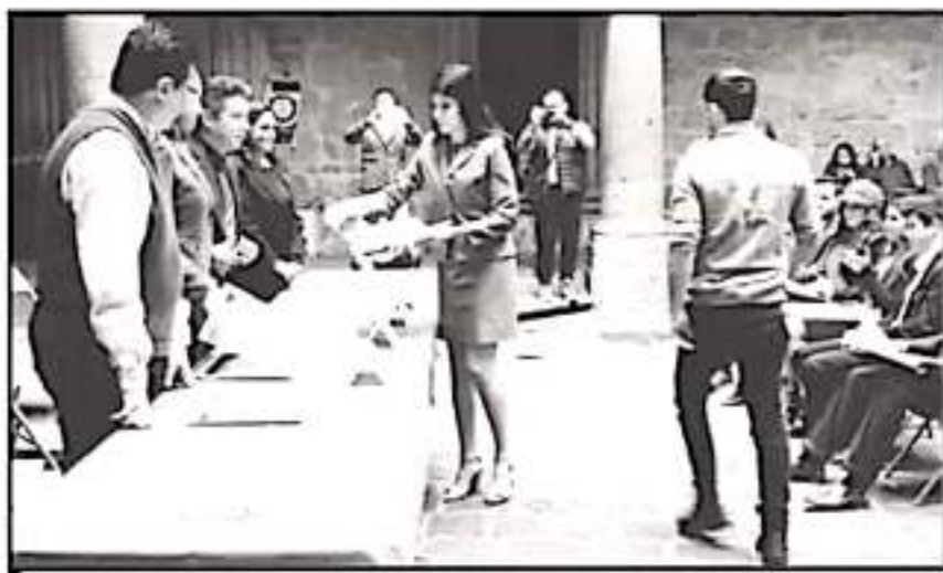
EL TEC DE MORELIA LOGRA APOYO FINANCIERO PARA 13 PROYECTOS POR MEDIO DE LA INCUBACIÓN DE EMPRESAS

Bajo este orden de ideas, la funcionaria municipal destacó que se buscó beneficiar e impulsar a las empresas "al tiempo de buscar opciones productivas con enfoque solidario y cooperativo". Recordó que, pese a estar comúnmente fuera del radar, "la