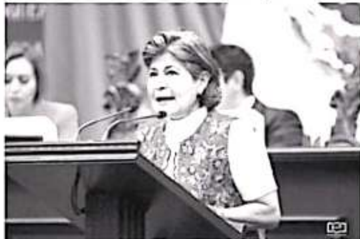
Eradicando la venta de alimentos chatarra y propiciando una cultura deportiva en las escuelas, se ayudara a que los niños y adolescentes tengan una mayor calidad de vida.

Por último, señaló que es alarmante que México sea el primer lugar a nivel mundial en obesidad, por lo que desde el Congreso, deben surgir iniciativas que trasciendan hacia la sociedad y procuren bienestar para las y los michoacanos.