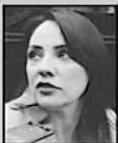
HERNÁNDEZ VE DERECHOS DE LOS ADULTOS MAYORES

dictamen ante el Pleno, con la tarea de aspirantes para ocupar el cargo de Comisionado del IMAIP, resultará electo quien obtenga el voto de las dos terceras partes de los diputados presentes. La persona que resultó electa, renudará protesta de Ley ante el Pleno.