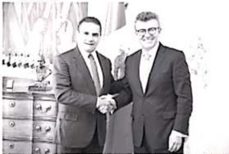
El Gobernador del Estado, Silvano Aureoles Conejo, se reunió esta tarde con Enrique Pérezveza, presidente y CEO de Microsoft México, así como autoridades de la Secretaría de Educación en el Estado.

Al ser los jóvenes una prioridad en el Gobierno del Estado, Aureoles Conejo manifestó su interés y apertura para que instituciones de educación superior sean parte de la iniciativa que encabeza Microsoft a nivel nacional, por lo que, a través de la SEE, puso a disposición del proyecto la infraestructura, equipo y capital humano, que posibilite a las y los jóvenes a acceder al mercado laboral, con el reconocimiento de una de las empresas tecnológicas más importantes del mundo.