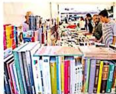
La feria continuará hasta el 22 de diciembre.

Pero donde más afluencia se ve en los pasillos debajo de una gran carpa, donde se han instalado mesas con miles de libros nuevos y usados cuya oferta, dicen el día a día, no se puede resistir. Libros de autores mexicanos como Octavio Paz, José Revueltas, Xavier Velasco, Elena Poniatowska, Pedro Ángel Palou o Jorge G. Castañeda se pueden conseguir en 50 pesos, lo mismo que de figuras internacionales de los libros tales como Philip Roth, Anne Ri-