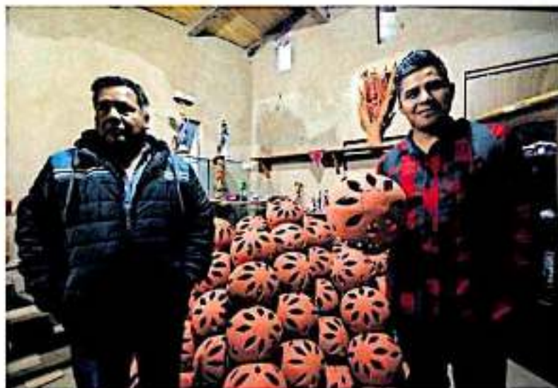
En esta población existen 640 talleres de artesanos