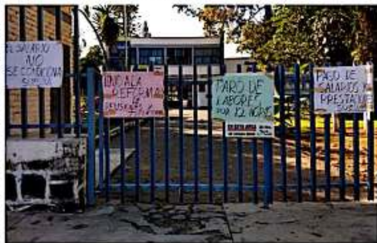
URUAPAN, MICH.- Trabajadores sindicalizados de la Umsnh en paro de labores, por falta de sus pagos salariales.

además de cumplir con sus actividades académicas, acudieron a recibir el pago de 4 meses de la beca federal "Benito Juárez".