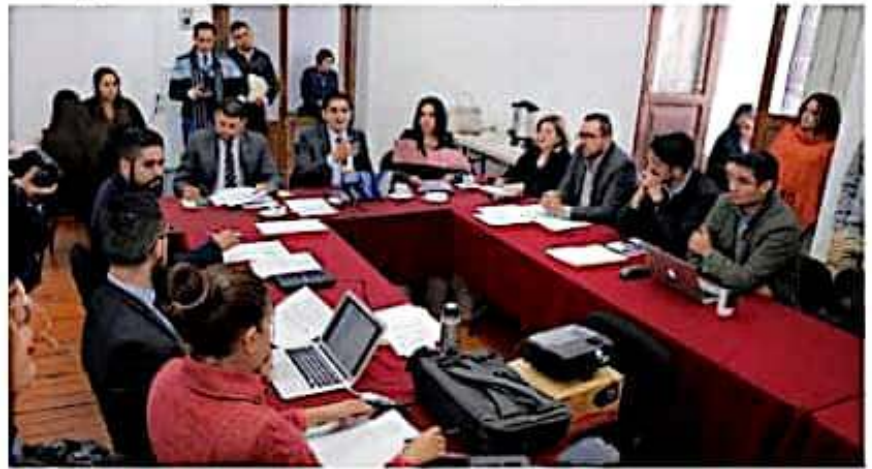
Las Comisiones de Hacienda y Deuda Pública, así como de Desarrollo Urbano, Obra Pública y Vivienda, aprobaron la iniciativa de desincorporación, la cual habrá de someterse ante el Pleno del Congreso para su aprobación o no. BUSCA APILAC.

Cabe señalar que en la exposición de motivos, se muestra que el importe del valor total de los diez predios asciende a $631, 740, 765.90 (seiscientos treinta y un millones setecientos cuarenta mil setecientos sesenta y cinco pesos), a lo cual, se acordó la redacción de un artículo transitorio para notificarle al Ejecutivo del Estado que deberá entregar un Informe en un plazo no mayor a diez días, sobre el monto y el destino de los recursos generados por la venta de dichos bienes.