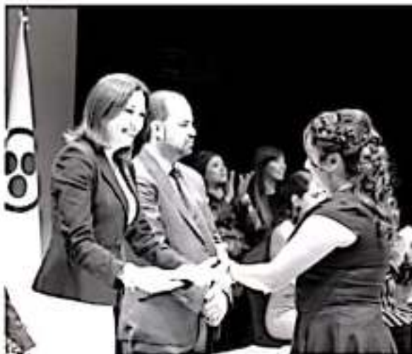
Egresaron 116 estudiantes de licenciatura escolarizada, 17 del sistema Ejecutivo y 16 de Maestría.

La funcionaria educativa finalizó con la frase: «Recuerden siempre que su destino está hasta donde alcanzan a ver sus ojos, su destino está hasta donde ven en sus sueños».