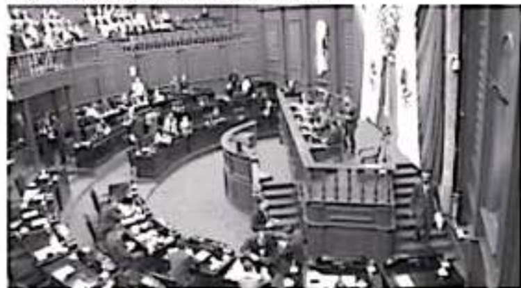
La norma determina las profesiones que requieren título, la forma de su registro, el procedimiento para expedir licencias a los prácticos, y en general, reglamenta todo lo relativo al ejercicio de las profesiones.

referenciación y la conciencia del cambio climático