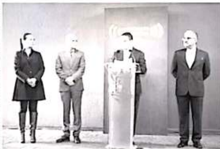
La dispersión de pagos iniciará esta misma semana, mediante un calendario con fechas, montos y conceptos específicos establecidos con la SEP y la Sección 18 de la CNTE.

"Hoy caminamos en un sólo sentido para resolver un tema que es de los más importantes para el gobierno que yo encabezo, porque se logra con esto el saneamiento de adeudos magisteriales y con ello una confrontación permanente con las y