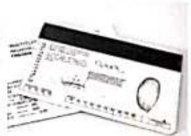
Las oficinas del INE laborarán hasta el día 21 de diciembre con motivo de fin de año y reanudará sus funciones hasta el 2 de enero de 2020.

Añadió que este lugar cuenta con 5 estaciones de trabajo y personal capacitado para brindar la atención a quien lo demande, el tiempo máximo que puede llegar a durar un trámite es de 5 minutos.