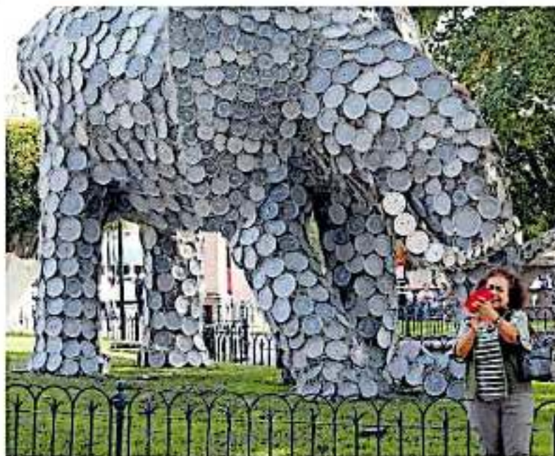
Los habitantes de la tenencia esperan ansiosos se aumente el flujo de turistas y visitantes a la tenencia