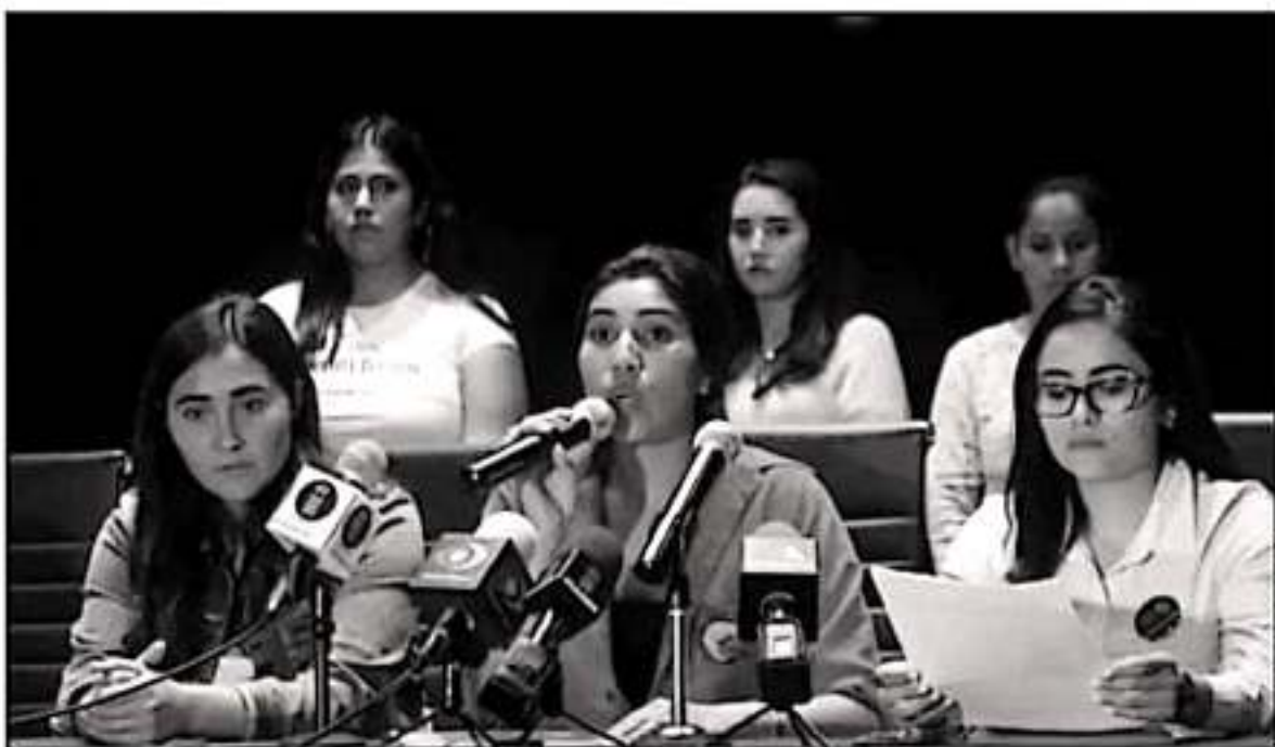
GRACIAS AL PROTOCOLO QUE SE TIENE EN LA UMSNH, SE HAN LOGRADO RESULTADOS TRAS LAS DENUNCIAS HECHAS CONTRA ALGUNOS PROFESORES.

Las universidades privadas creen que están como en una isla y sólo tienen que medio responder, porque se rigen con otros códigos