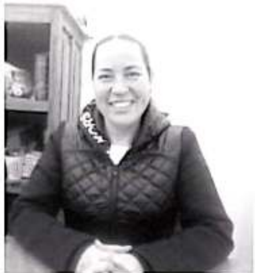
Estamos esperando que venga mucha gente, hay que tomar en cuenta que también muchos migrantes visitan a sus familias durante estas fechas, indicó la delegada de Turismo.