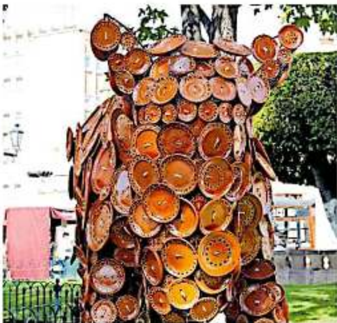
Las piezas fueron elaboradas por las hábiles manos de estos artesanos JAVIER LUNA