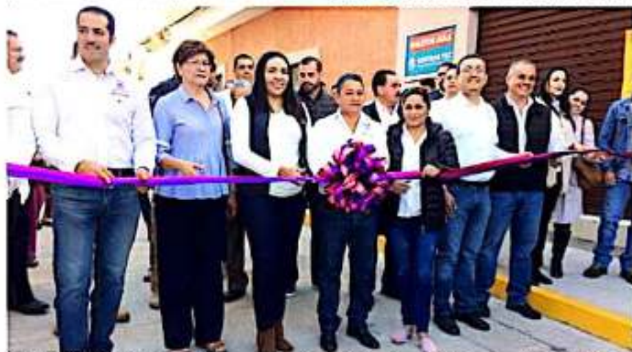
JACONA, MICH.- Autoridades municipales, encabezadas por Adriana Campos Huirache, durante el corte del listón inaugural del pavimento de un tramo de la calle Abasolo, en la colonia Centro.

Acompañada de regidores, funcionarios y ciudadanía, la alcaldesa Adriana Campos encabezó el corte oficial del listón inaugural, con el compromiso de la administración 2018-2021, para seguir trabajando en beneficio de los jaconenses.