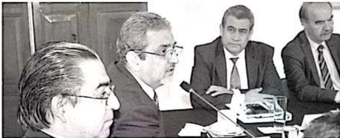
La administración del Gobernador Silvano Aureoles Conejo, ha bajado de 2 mil 600 mdp observados anualmente, a 48 millones de pesos notificados en el 2018. (AM93)

por lo que se ha trabajado con firmeza para encabezar el Gobierno más transparente de la historia de Michoacán, con base a la mejora de sus procesos y a efficientar su labor.