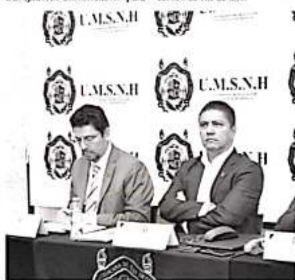
No obstante la crisis financiera la Casa de Hidalgo instruyó dispersar el último recurso perteneciente al presupuesto del 2019 con el que contaba, cumpliendo el pago del 50 por ciento de la segunda quincena de noviembre. (CAMBIO)

caminar juntos en la gestión de los recursos extraordinarios que se necesitan para concluir el ejercicio 2019. El recurso extraordinario es primordial para pagar las quincenas restantes de diciembre así como las prestaciones de fin de año.