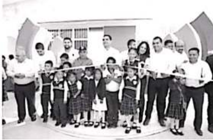
Hay los entregamos un espacio digno con mobiliaria y lo suficientemente bonita para los niños y niñas de Zirahuato, expuso Silvano Aureoles

* Luego de tomar clases en la Jefatura de tenencia, finalmente los niños y niñas cuentan con una escuela digna, señala Silvano Aureoles * Viene una nueva era para Michoacán en tema educativo, con las mejores condiciones para nuestras niñas y niños, maestras y maestros, destaca