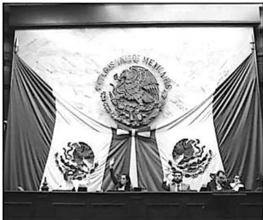
LAS COMISIONES UNIDAS DE GOBERNACIÓN Y DERECHOS HUMANOS ANALIZARÁN LOS PERFILES PARA EL IMAIP

Cabe señalar que, de conformidad a lo establecido en la Convocatoria, si algún aspirante