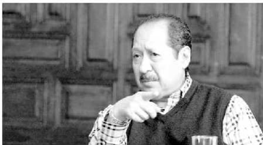
El exmandatario michoacano, Leonel Godoy Rangel dijo que todas las observaciones financieras a su gobierno, fueron solventadas.

Durante la entrevista puntualizó que la única diferencia que sostiene con el actual gobernador, Silvano Aureoles es de índole política, pero cuestionó el por qué cuando hace señalamientos solo lo menciona a él y al actual asesor de la presidencia, Lázaro Cárdenas Batel.