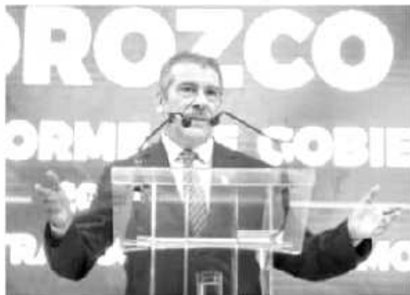
El presidente municipal de Morelia, rindió su primer informe.

Por lo anterior, es que comenzó su gobierno con acciones que