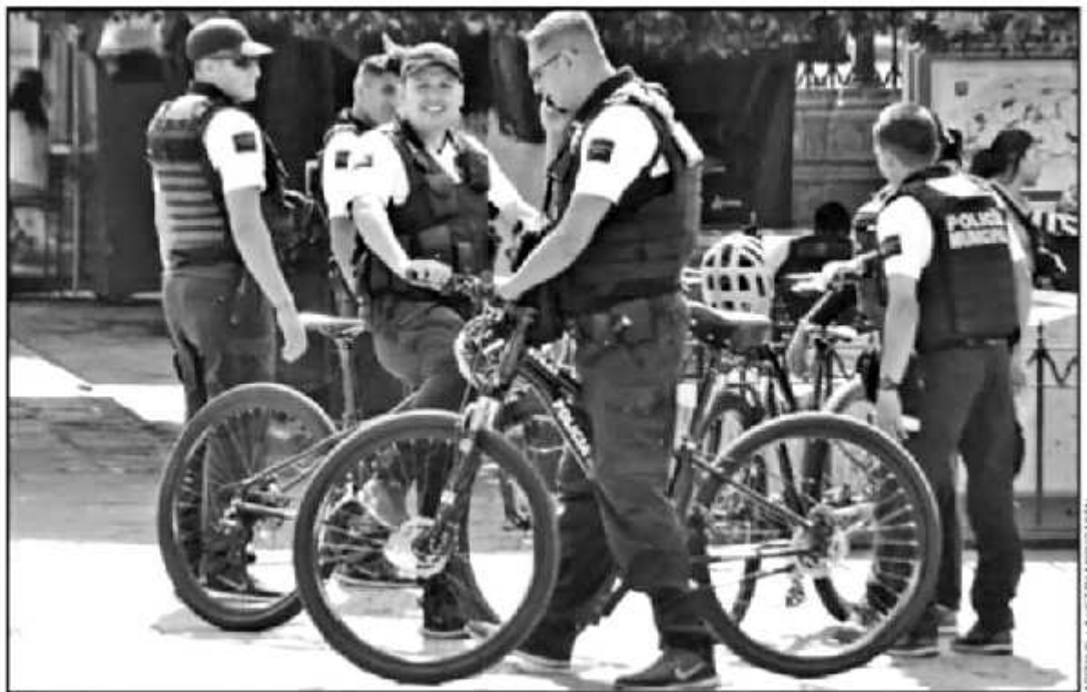
LA DE POR SI AUNTERA POLICIA DE MORELIA, VERA MAS 'ALISTES AL CINTURÓN' DEBIDO A LOS RECORTES PRESUPUESTALES DEL PROGRAMA FORTASEG

1,000 MDP de recorte al Fortaseg para Morelia