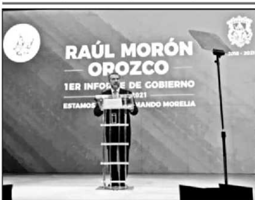
EL ALCALDE DE MORELIA RECONOCIÓ QUE LA OLA DE INSEGURIDAD SE MANTIENE COMO EL PENDIENTE PRINCIPAL.

No consentiré ningún acto de corrupción, quien lo cometa no tan solo será separado inmediatamente de su cargo sino que lo pondremos a disposición de las autoridades