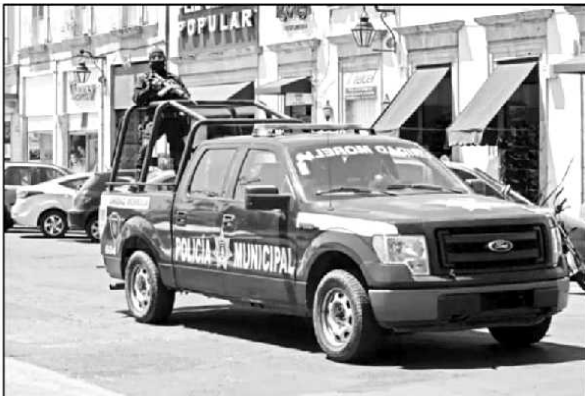
PARA LOS REGIDORES, Y PARA LA MAYORÍA DE LA CIUDADANÍA, LA ESTRATEGIA DE SEGURIDAD MUNICIPAL NO HA TENIDO IMPACTO EN MEJORAR LA SEGURIDAD.