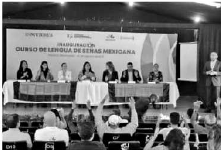
MORELIA, MICH.- Con el firme compromiso de lograr que Michoacán se consolide como un estado de inclusión y respeto, el Gobierno del Estado puso en marcha el primer taller sobre lengua de señas para atender a mujeres en situación de violencia.

"Hay que ser conscientes que los humedales nos protegen de los huracanes y del cambio climático, pues son un almacén de carbono y dan cobijo a diversas especies acuáticas de flora y fauna, por ello debemos actuar en consecuencia para su preservación, de lo contrario estamos negando un futuro viable para todas y todos".