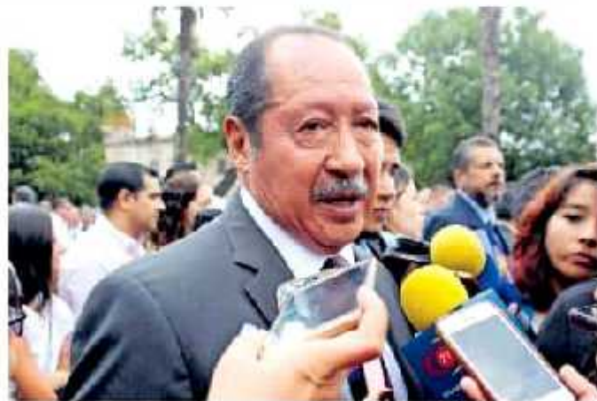
Afirmó que su administración no dejó pendientes acciones

A lo que incluso el ahora secretario de organización de Movimiento Regenera-