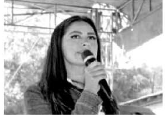
URUAPAN, MICH.- Es necesario ahondar la cultura de la prevención en México para evitar los decesos por cáncer, ya que este representa la tercera causa de muerte en nuestro país.