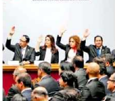
Algunos regidores señalan un retroceso en las políticas públicas.