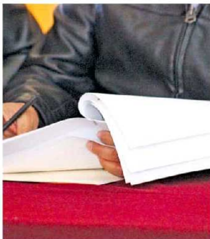
Existen tres denuncias penales contra exfuncionarios.

Así como esto, el presidente municipal de la capital michoacana aseguró que existen tres denuncias penales contra exfuncionarios del Ayuntamiento capitalino por encubrimiento, falsificación de documentos, fraude al fisco del servicio público y uso ilícito de atribuciones y facultades, esto sin poder especificar el nombre de los inculcados, pues mencionó que si evidenciara podría entregar las carpetas de investigación.