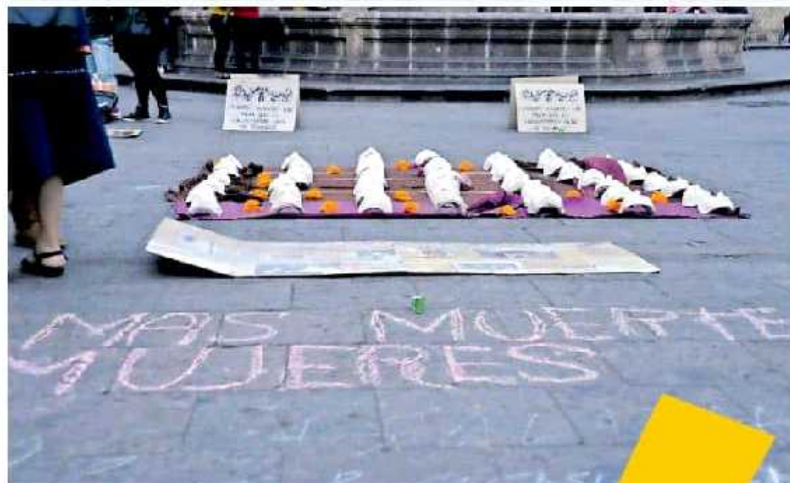
Con los años se ha incrementado gradualmente el número de víctimas que atiende el organismo sin violencia.