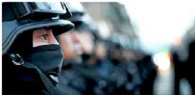
La imagen que se pretende dar a la sociedad del nuevo policía, es la de un funcionario profesionalizado.

Al apelar a la buena voluntad y disposición por parte de los actuales políticos con