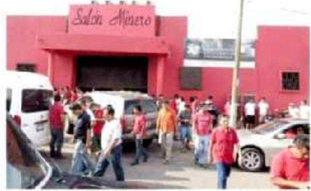
CD. LÁZARO CÁRDENAS, MICH.- Los trabajadores de la Sección 271 del Sindicato Minero, conjuraron la huelga en ArcelorMittal.

A final de las pláticas, ni perdió la empresa ni los trabajadores, "aquí ganamos todos; hubo buena disposición", y se espera mantenerla para el año próximo negociar nuevas plazas para una planta de coquizadora y el laminador que se construye, cerró.