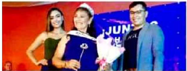
ECUANDUREO, MICH.- En medio de un ambiente de armonía, bajo el auspicio del municipio, fue electa la reina de los adultos mayores.