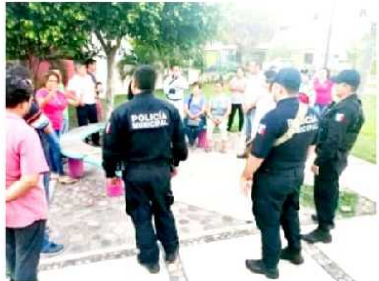
CD. LÁZARO CÁRDENAS, MICH.- Como parte de las acciones de prevención del Delito, la Dirección de Seguridad Pública Municipal (DSPM), por medio del departamento de Prevención Social y Participación Ciudadana, visitó el Fraccionamiento Puerto Pacifico en donde se reunieron con un grupo de colonos.

Cabe señalar que de manera periódica, la Dirección de Seguridad Pública recorre diversas colonias del municipio, principalmente las más alejadas, con el objeto de implementar con los vecinos una serie de medidas de prevención del delito.