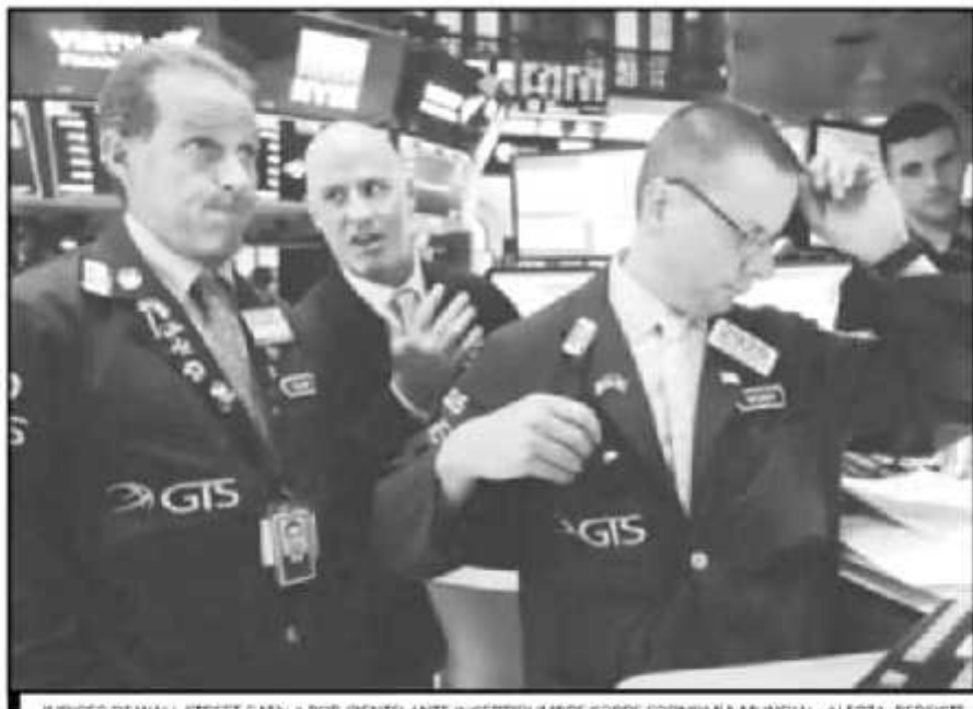
INDICES DE WALL STREET CAEN 1 POR CIENTO ANTE INCERTIDUMBRE SOBRE ECONOMÍA MUNDIAL; ALERTA, PERSISTE

El índice de precios y cotizaciones a medio día reportaba una caída de 1.62 por ciento para ubicarse en los 38 mil 809.83 unidades, su menor valor desde marzo