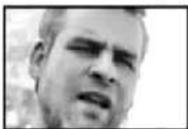
Arturo Escobar, PRESIDENTE DEL PAN

"El Ayuntamiento ha logrado reducir en 173 millones de pesos el gasto operativo del gobierno"