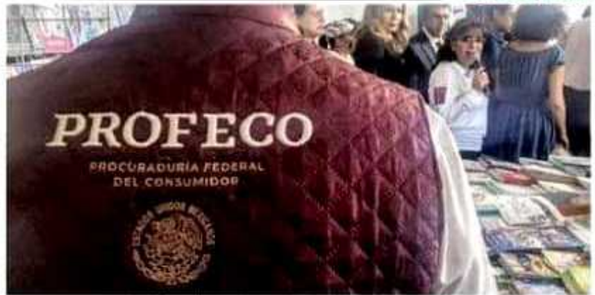
La profeco realiza monitoreos de comercios en este regreso a clases.

Viene de la Pág. 3 tante del Congreso del Estado expresó la apertura del poder Legislativo a trabajar en conjunto con las administraciones municipales, con el propósito de fortalecer el andamiaje jurídico que robustezca su ejercicio de gobierno.