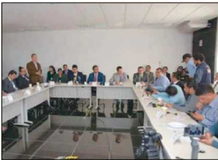
ESTE MIÉRCOLES EL RECTOR DIO A CONOCER LA INICIATIVA DE REFORMA DE JUBILACIONES Y PENSIONES EN LA UMSNH.

El rector subrayó que por ello apuesta al diálogo y a informar a la comunidad universitaria.