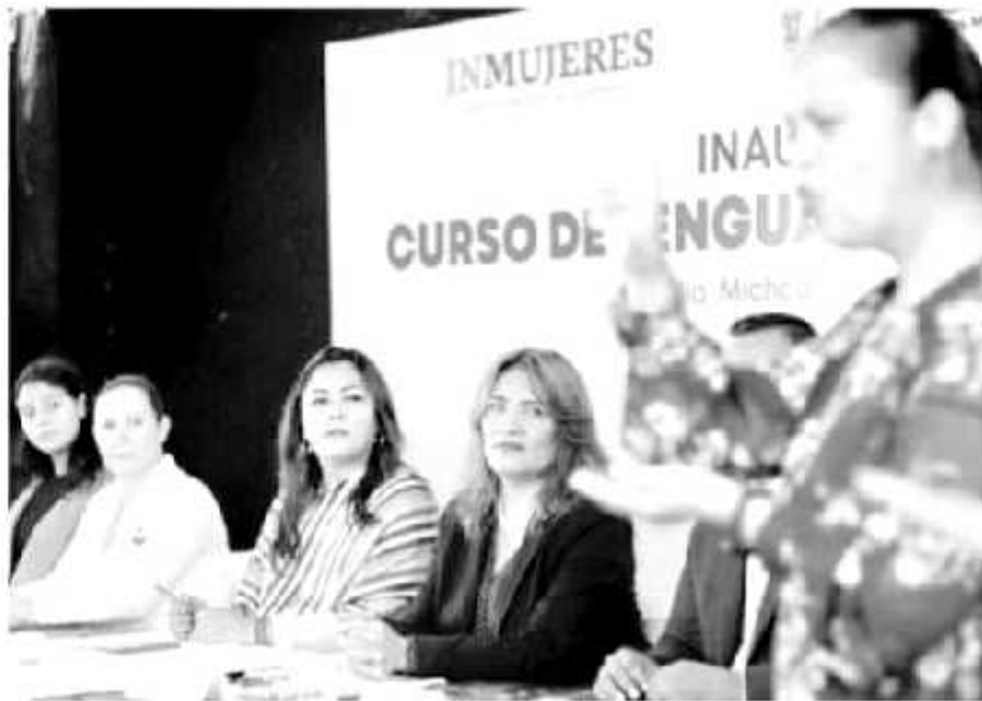
Este taller tiene como objetivo contribuir en el acceso a la justicia y la defensa de los derechos humanos de niñas y adultas, y más cuando se trata de temas de violencia de género.

El taller, que se va a desarrollar en 12 sesiones tuvo un récord de inscripción con 280 personas entre funcionarias y funcionarios públicos y profesionistas dedicados al tema de atención de las mujeres, 120 personas que participarán de manera presencial y 160 en línea.