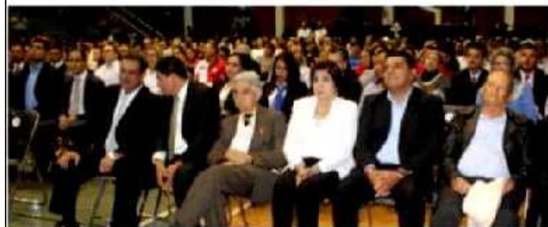
LOS REYES, MICH.- Siete de los ocho expresidentes municipales que asistieron al evento republicano.