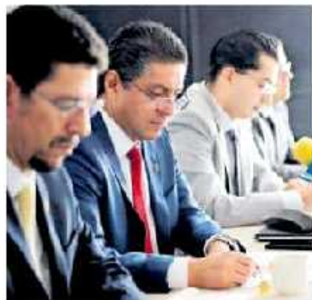
En este momento no tenemos claridad con respecto a cumplir al 100%, mencionó el rector de la UMSNH. MARIBEL LUNA

La creación de un fondo de participación impartida en el que los trabajadores aporten un 2% de su salario integrado a partir de 2020, el cual irá en aumento hasta llegar a un 10% en el año 2024 y se mantendrá en los años subsiguientes. La Universidad y el gobierno estatal aportarán otro 8% y la Federación uno porcentual.