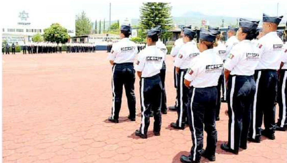
Con la certificación, el IEESPP tendría otros beneficios de capacitación y una atractiva bolsa de incentivos económicos. (MICH/OA/DA)