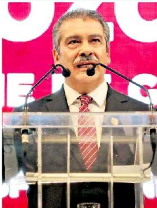
Se mostró feliz y orgulloso de sus logros y referencias, como en su momento.

El edil denunció las irregularidades que presentaba la administración, con una huelga sindical en el acceso al agua potable que cuestionó tener financiamiento una serie de juicios y demandas laborales