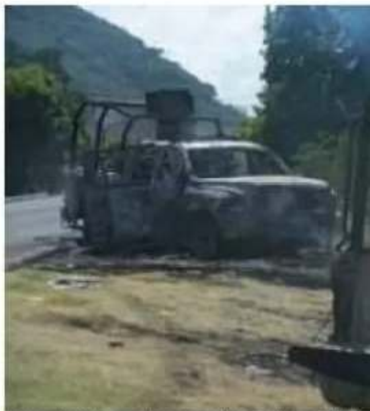
Apenas el pasado lunes fueron asesinados 13 policías en Aguililla

Según la investigación realizada por la organización Causa en Común, Michoacán es el segundo estado con más policías asesinados en lo que va de este año, con un total de 37; mien-