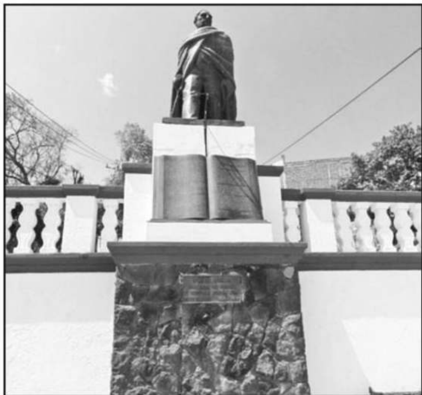
EN LA CIUDAD DE JIQUILPAN HAY UNA ESTATUA QUE LÁZARO CÁRDENAS MANDÓ CONSTRUIR EN HONOR A JUÁREZ.

de esta población: "Lázaro Cárdenas en vida honró en la palabra, con la pluma y con diversas acciones la memoria de Benito Juárez. En Jiquilpan hizo construir la estatua del Benemérito que hoy engalana la ciudad. Nada le hubiera disgustado tanto como el que impusieran su nombre a su tierra retirándole el de Juárez. Con todo respeto y agradeciendo en lo personal tu adhesión a la memoria