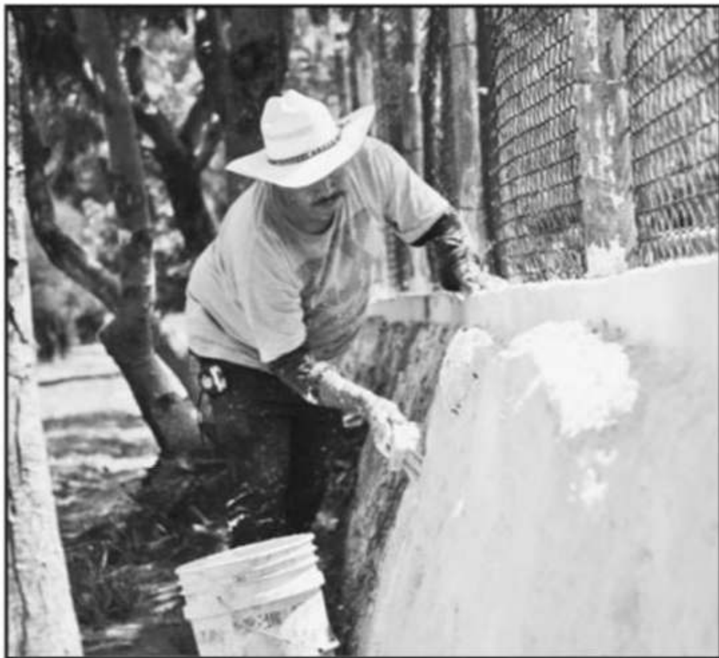
TRABAJOS DE LIMPIA, EXTRACCIÓN DE MALEZA Y ACONDICIONAMIENTO HAN HECHO EN LOS PANTEONES.

formadora y un trascabo, pues colocaron tezontle y tepetate sobre todo en las bajadas donde producto de las lluvias se formaron unas zanjas.