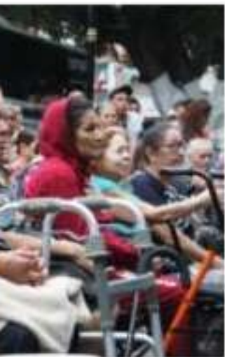
Adultos mayores esperan obtener visas para viajar a Estados Unidos con sus familias en Estados Unidos.