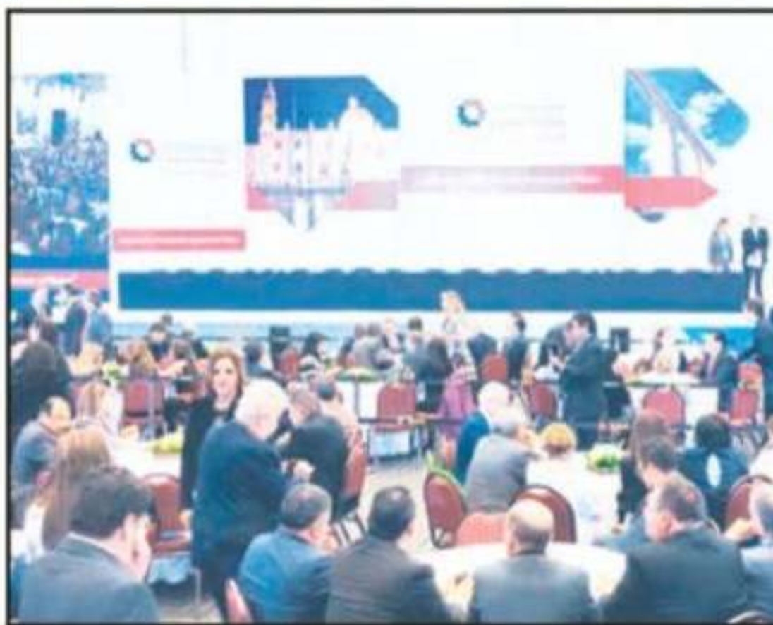
MORELIA ES LA SEDE DE LA CONVENCION DE LA CANACINTRA QUE REUNE A UNOS

Así lo dio a conocer el funcionario durante la presentación de la Convención Nacional de la Cámara Nacional de la Industria de la Transformación (Canacintra), que dio inicio este 16 de octubre con una cena de gala en Palacio Municipal de Morelia. Durante hoy y mañana los más de 600 empresarios que se darán cita en la capital del estado podrán asistir a conferencias magistrales sobre las condiciones en las que se encuentra el país en materia industrial, así como las oportunidades de negocios que se avecinan y, sumado a ello, también se