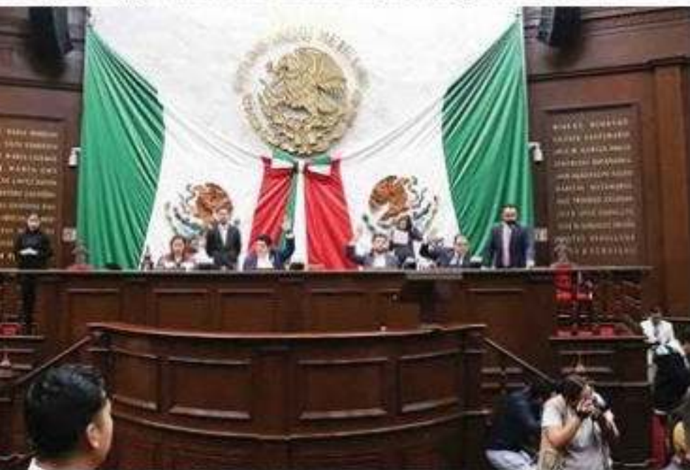
La Legislatura aprobó impropiciamente la iniciativa para reformar la Ley de Pensiones Civiles del estado.