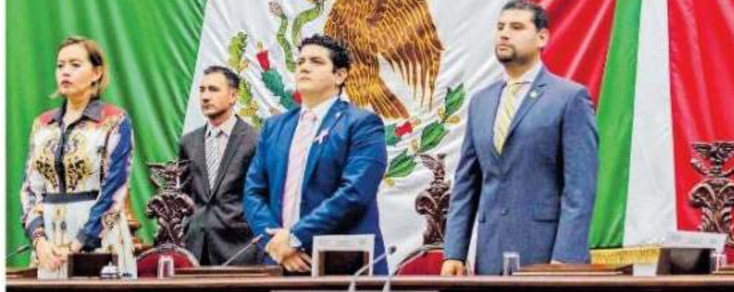
Los diputados integrantes de la Comisión de Seguridad y Protección Civil coincidieron en señalar que continúa la coordinación del Ejecutivo federal con el estatal

lta de una r parte del nsó varios nde exigía tema, y se política en dente, An-