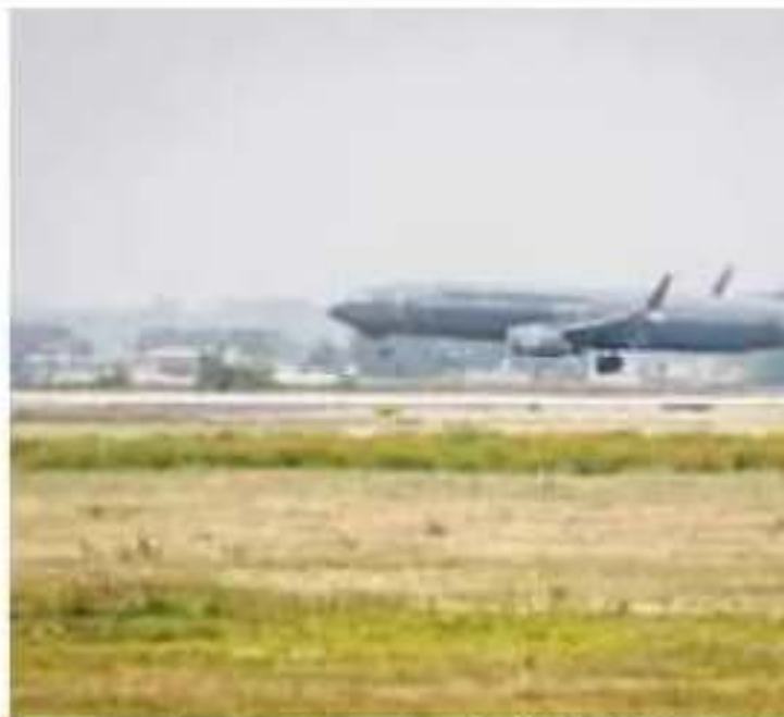
Aseguró que el aeropuerto se entregará en junio de 2021. | CUAR