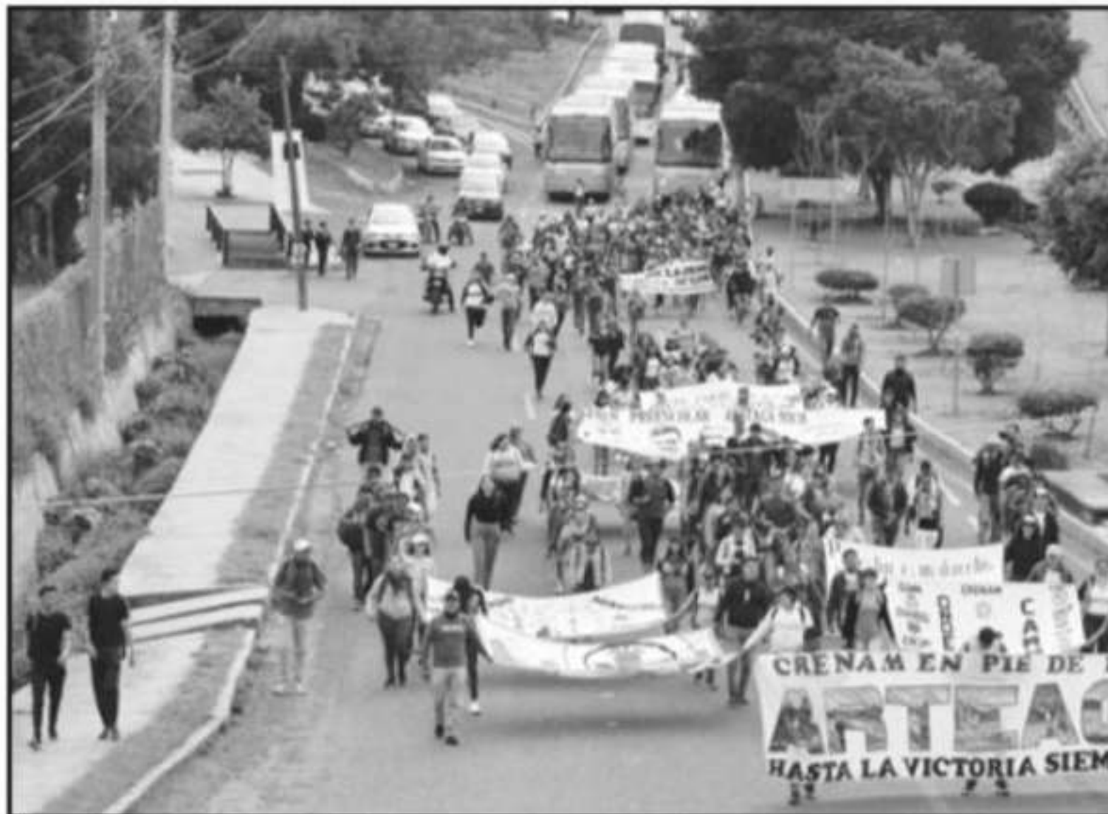
CON MARCHAS, MANIFESTACIONES Y RETENCIÓN DE VEHÍCULOS, NORMALISTAS EXIGEN QUE DIRECTIVOS DE DIVERSOS PLAN

remover, “queremos que se cambie el cuerpo directivo del