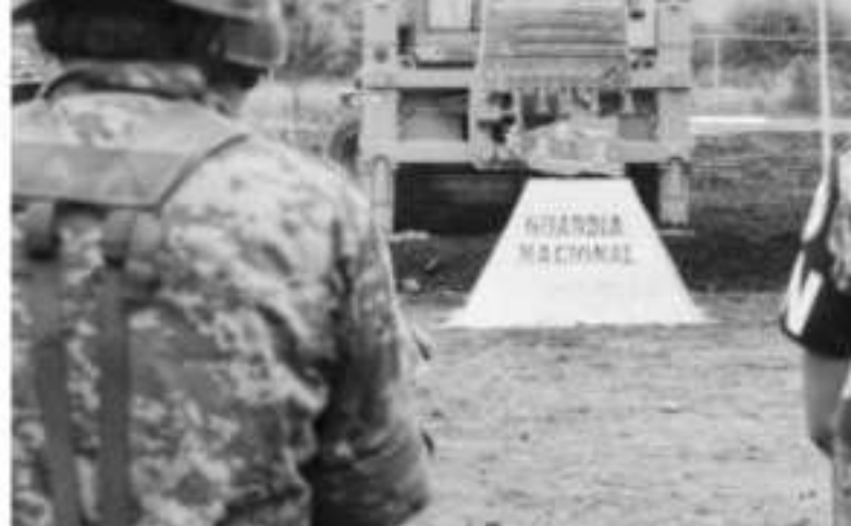
PARACHO, MICH.-Durante la ceremonia de colocación de la primera piedra del cuartel regional de la Guardia Nacional