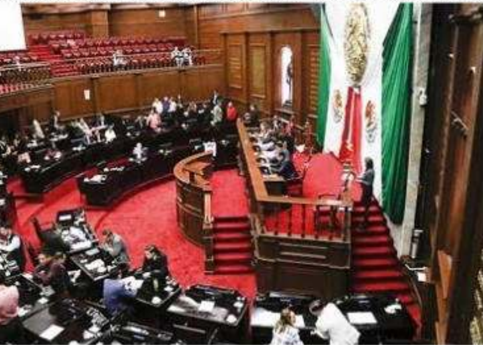
El Congreso local, aprobó la creación de una Comisión para investigar acoso sexual en la UMSNH.