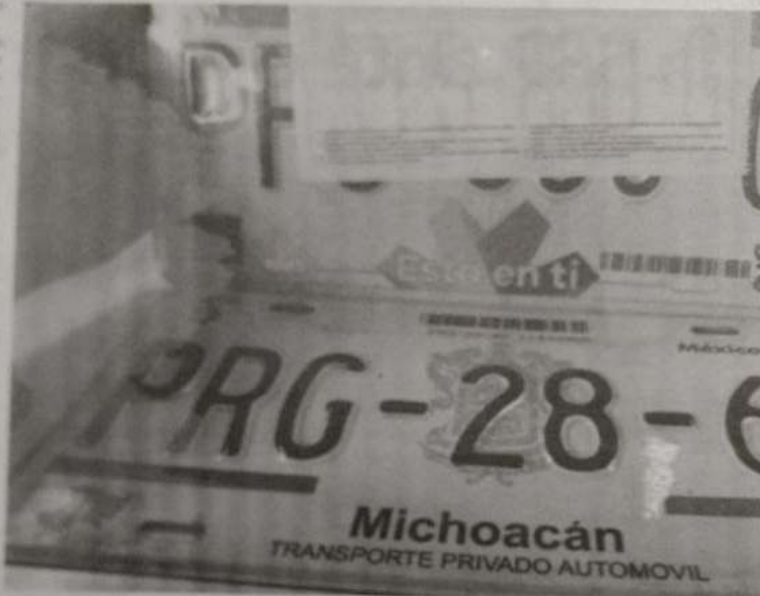
La Secretaría de Finanzas y Administración inició la segunda fase del programa de apoyo a deudores; Borrón y Cuenta Nueva.

2018 y 2019. La publicación puede consultarse a cualquiera de las oficinas de zonas de la SFA, ubi-