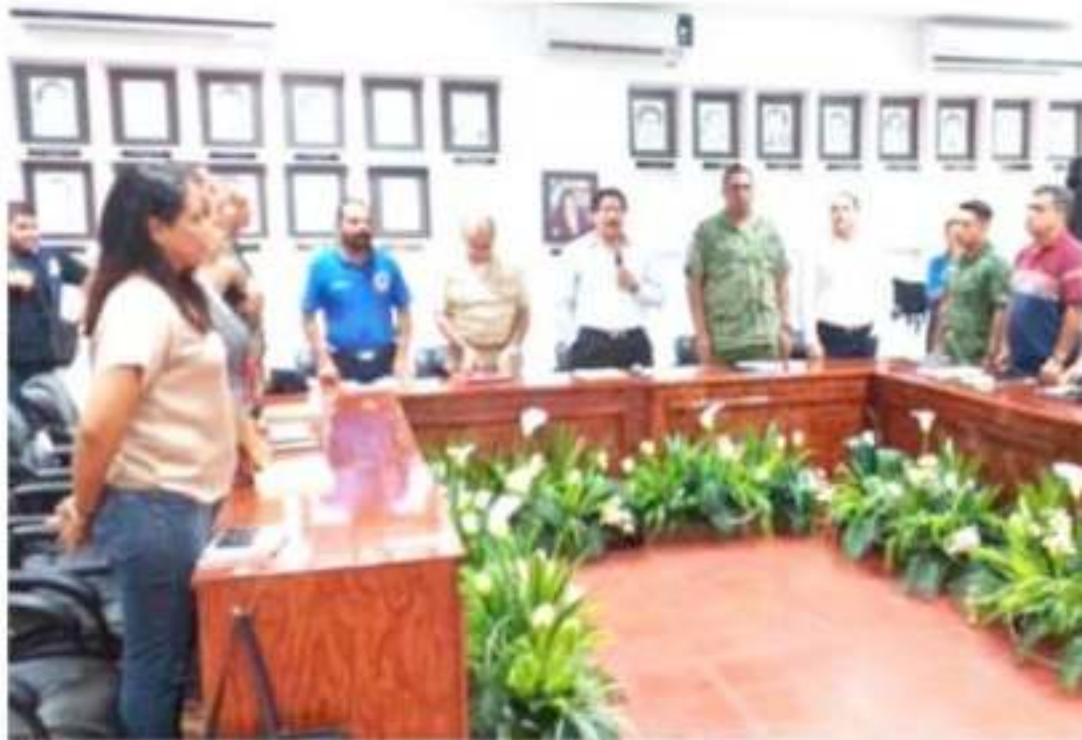
CD. LÁZARO CÁRDENAS, MICH.- El Consejo Municipal de Protección Civil informó por ciento los albergues para en caso de cualquier situación de emergencia que se