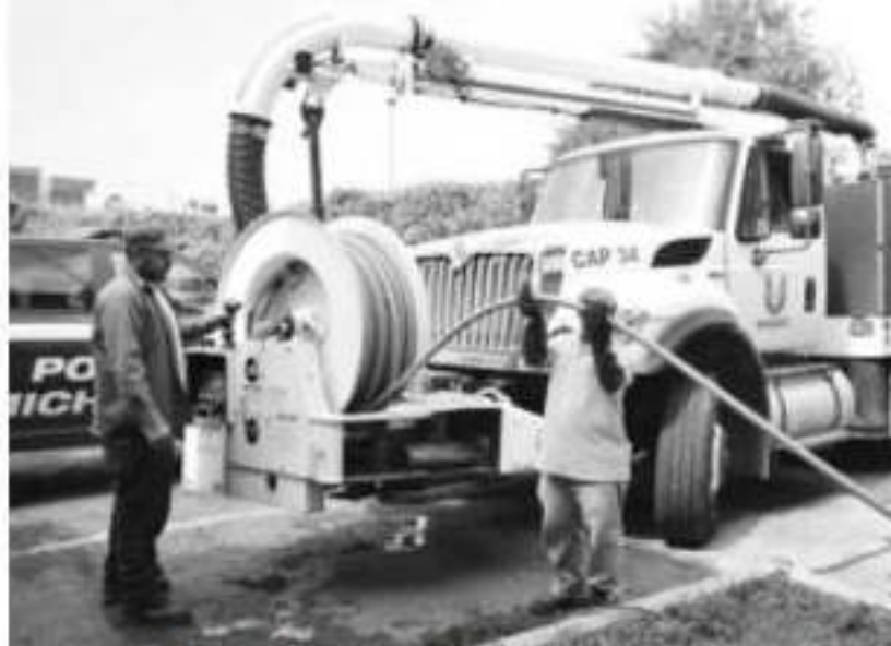
URUAPAN, MICH.- Un total de 268 metros de azolve y basura son retirados por la Comisión del Agua y Saneamiento de Uruapan (Capasu)

Mediante este ejercicio, además de generar la proximidad social con el ciudadano, se buscó a su vez dar atención al protocolo para la atención a vícti-