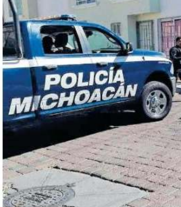
La percepción de inseguridad de la ciudadanía de la entidad aumentó en un 2.5 por ciento

Un caso similar se divisa en la efectividad de la Policía de Morelia, donde sólo el