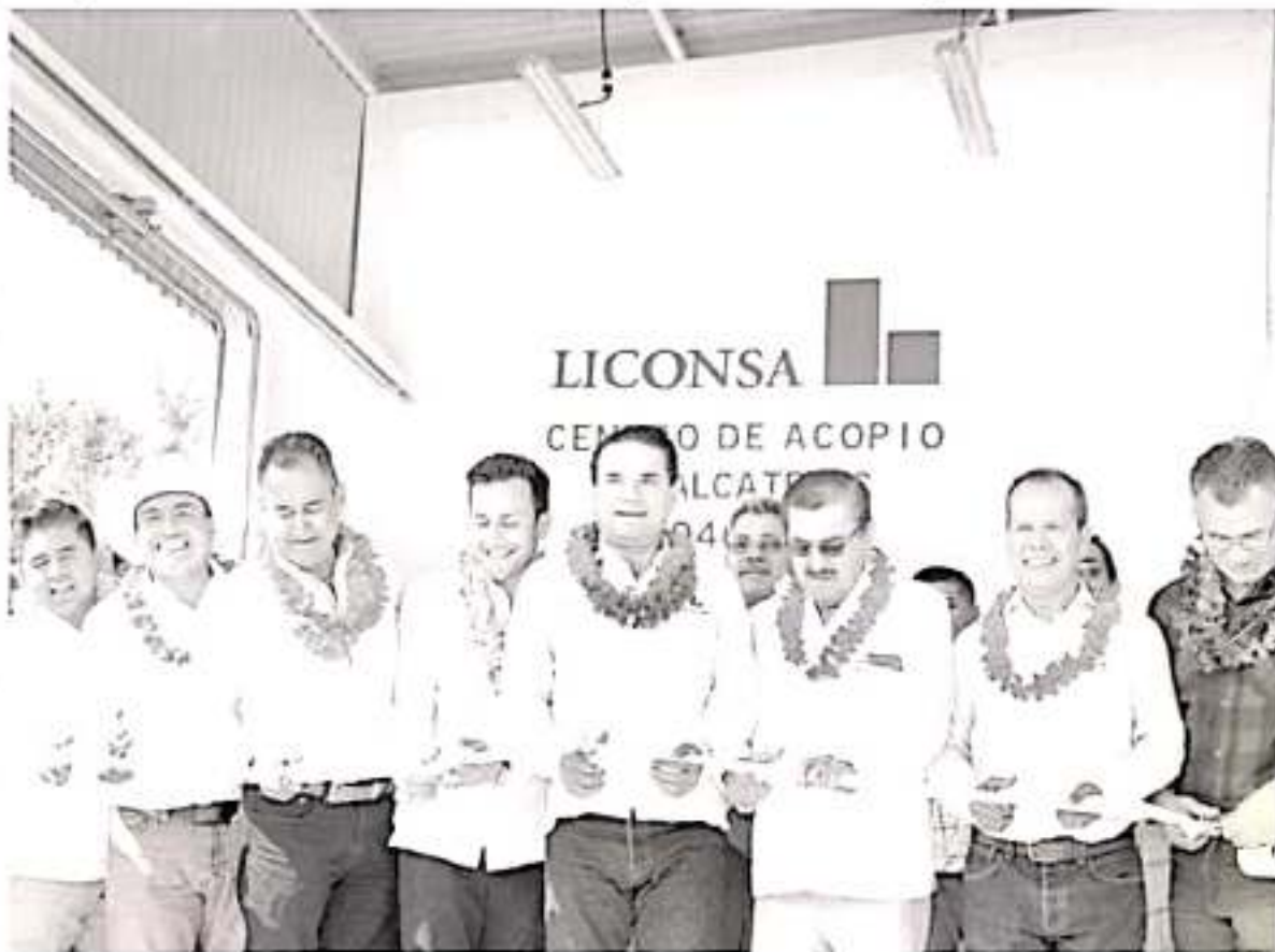
Se fortalecerán los ingresos de las familias de más de mil 800 ganaderos de la región al contar con precios garantizados todo el año, señala Silvano Aureoles.