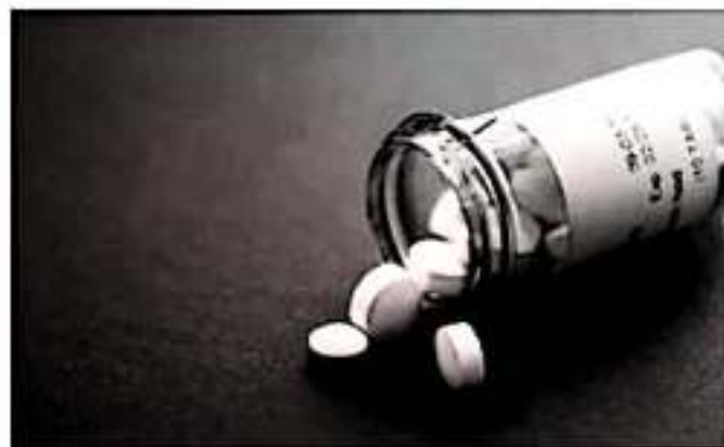
CUADRU DE MÉXICO.- La Segunda Sala de la Suprema Corte de Justicia de la Nación (SCJN), determinó este martes que el Estado mexicano está obligado a proteger, con la misma intensidad y bajo las mismas condiciones, el derecho a la salud de personas con padecimientos tanto físicos como mentales.