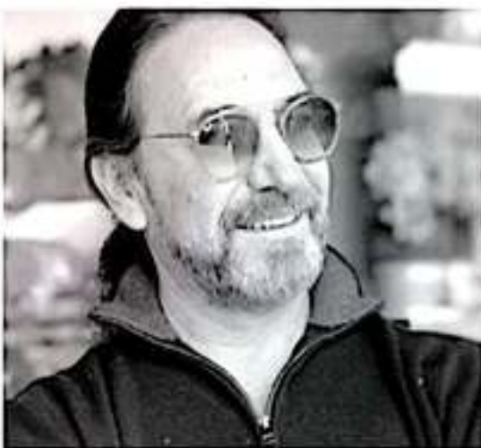
Marco Antonio Solís El Buki.

Lo anterior, guardando las proporciones posibles, como en su momento lo fue Lázaro Cárdenas Batel, forzado a ser diputado federal, senador y gobernador, y cuyo controvertido paso todavía tiene secuelas y no exactamente positivas en el estado.