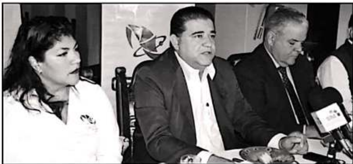
TITULARES DEL FRENTE ESTATAL DE SINDICATOS DE EDUCACIÓN MEDIA SUPERIOR Y SUPERIOR VALDRÁN HACER PRESIÓN PARA RECIBIR SUS PRESTACIONES.

Detalló que, también una de las demandas es la salida de la rectora de la Universidad Tecnológica de Morelia (UTM) debido al nivel de adeudo que se tiene en dicha insti-