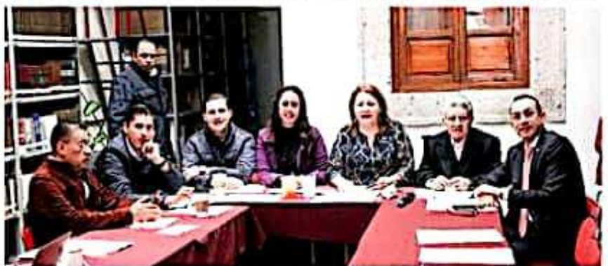
Diputados integrantes de las Comisiones Unidas de Gobernación y Derechos Humanos del Congreso local.