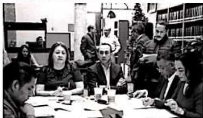
MORELIA, MICH.- Reunión de Comisiones Unidas de Gobernación y Derechos Humanos celebrada en la Biblioteca del Congreso del Estado.