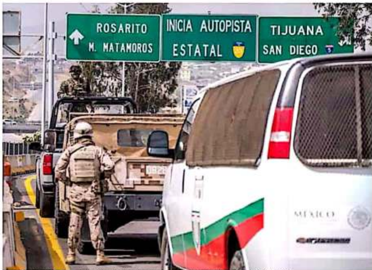
Los puntos migratorios de Estados Unidos, así como los accesorios del gobierno de México, han reducido el flujo migratorio hacia el vecino país del norte. (Colmex)

El especialista habló del nuevo rumbo que ha tomado la migración en Michoacán a raíz de la dinámica tan cambiante en los procesos sociales, políticos y culturales de Estados Unidos y recordó los grandes carencias, ignoradas principalmente por adultos mayores o jóvenes sin estudios, que salían de