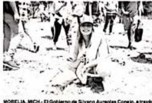
MORELIA, MICH.- El Gobierno de Silvano Aureoles Conejo, a través de la Secretaría de Medio Ambiente, Cambio Climático y Desarrollo Territorial (Semaccdet), en coordinación con organizaciones civiles, realizó en 2019 la reforestación social de 290 mil 206 árboles en 257 hectáreas.

con la participación de instancias gubernamentales, como la Comisión Forestal de Michoacán (Cofom), el Parque Zoológico Benito Juárez, la Secretaría de Educación en el Estado (SEE), la Secretaría de Desarrollo Social y Humano (Sodesoh), la Comisión Nacional Forestal (Conafor). Además, organizaciones sociales como el Consejo Estatal de Ecología (Coeco), Equipo Mosquito TAM, y Separán, entidades de la iniciativa privada, como la Asociación Mexicana de la Industria de la Construcción (Amiac), socios del Club Campestre y empresas, instituciones educativas, como la Universidad Tecnológica de Morelia (UTM) y la Universidad Latina de América (Ula), ayuntamientos, y vecinos de los espacios intervenidos. El titular de la Semaccdet destacó que la participación de los distintos sectores de la sociedad fue fundamental para impulsar la recuperación de la cobertura arborea en el estado, y preservar los servicios ambientales que prestan los ecosistemas boscosos. Con estas acciones, juntas, sociedad y gobierno, contribuyen a la recuperación de la naturaleza y la lucha contra el cambio climático, para mejorar la calidad de vida y el desarrollo sustentable de las poblaciones y los ecosistemas, en beneficio de las presentes y futuras generaciones.