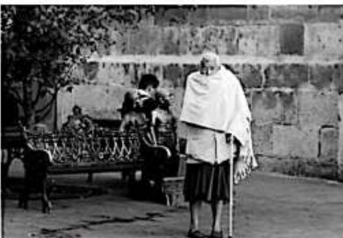
MORELIA, MICH.- Los adultos mayores de 60 años, son uno de los grupos más vulnerables durante la temporada invernal

En caso de presentarse fiebre, dolor de cuerpo, tos o gripe se debe acudir de inmediato a su unidad médica más cercana y evitar la automedicación.