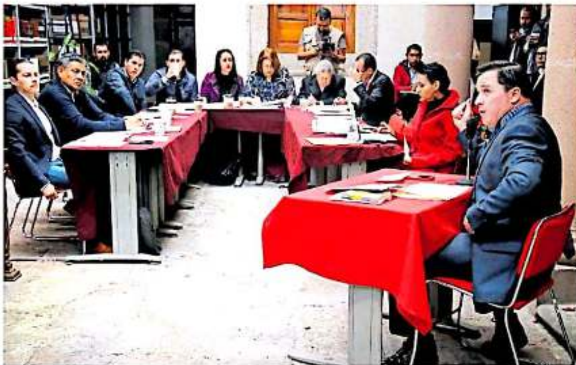
Las comparecencias se hicieron ante integrantes de las comisiones unidas de Gobernación y Derechos Humanos. FERNANDO BALBUENA