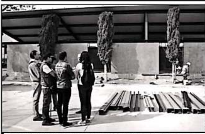
CON MÁS DE TRES MILLONES DE PESOS SE REALIZARON CAMBIOS DE FONDO EN EL TEATRO STELLA INDA DEL IMSS.

señalización de acero inoxidable con identificación en rojo. Pintamos todo lo que fue la herrería y la cancelería. De los más importante es que modificamos el sistema de sonido del teatro, antes teníamos un sonido obsoleto y ahora ya contamos con un amplificador", añadió Patiño Navarro.