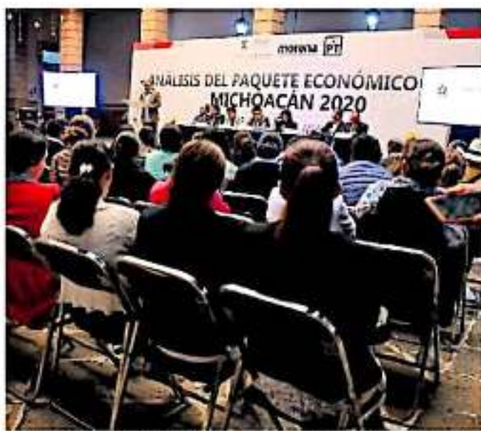
Desde 2014 a la fecha se ha observado una baja en la capacidad para captar impuestos.

De ahí que, por cuanto al presupuesto de egresos del estado, concluyó es solo de carácter administrativo, toda vez que