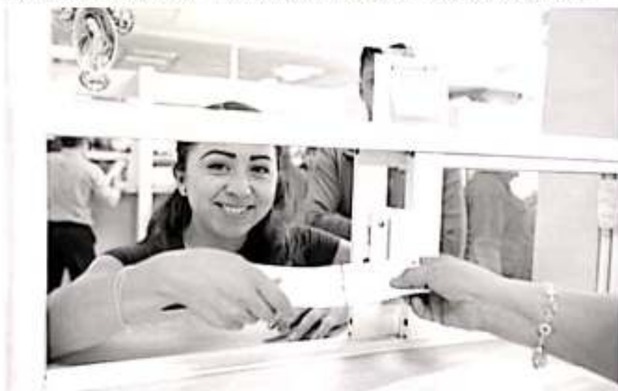
Continúa SEE cumplimiento de calendario de pagos en sector educativo.

estado, puntualizando que cuentan con resultados inmediatos que derivan del buen ejercicio de la función pública como son los ahorros por 600 millones de pesos que ahora son ejercidos en obras públicas «fue gracias a la eliminación de los moches y diezmos en la asignación de obras públicas» sentenció.