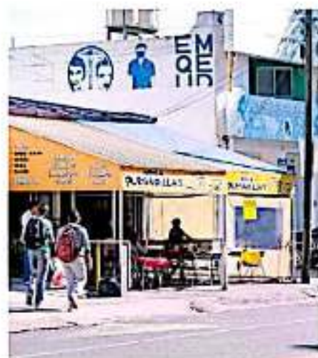
Los 17 comercios y restaurantes tendrán hasta enero para retirar cualquier tipo de extensión.

Las prácticas deshonestas que se realizaban con anterioridad responden un mal ejemplo del ex presidentes municipales y sus gabinetes, refirió el edil