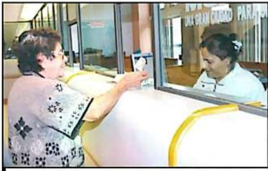
UN MONTO DE 99 MILLONES DE PESOS FUE DISPUESTO POR EL AYUNTAMIENTO DE MORELIA PARA AGUINALDOS.