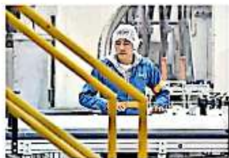
El representante de los industriales se pronunció por continuar los diálogos con el gobierno estatal.

En el evento se contó con la participación de representantes del Consejo Coordinador Empresarial, la Cámara Mexicana de la Industria de la Construcción, Industriales del Estado y los colegios de Contadores y Economistas de la entidad.