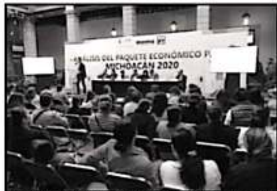
DIPUTADOS DE MORENA-PT, E INICIATIVA PRIVADA, RECHAZARON QUE INTENTEN REINSTAURAR LOS IMPUESTOS ECOLÓGICOS PARA EL PRÓXIMO AÑO.

Según la encuesta, los michoacanos están mejor que hace 4 años en términos de bienestar personal y sentirse satisfechos con la vida.