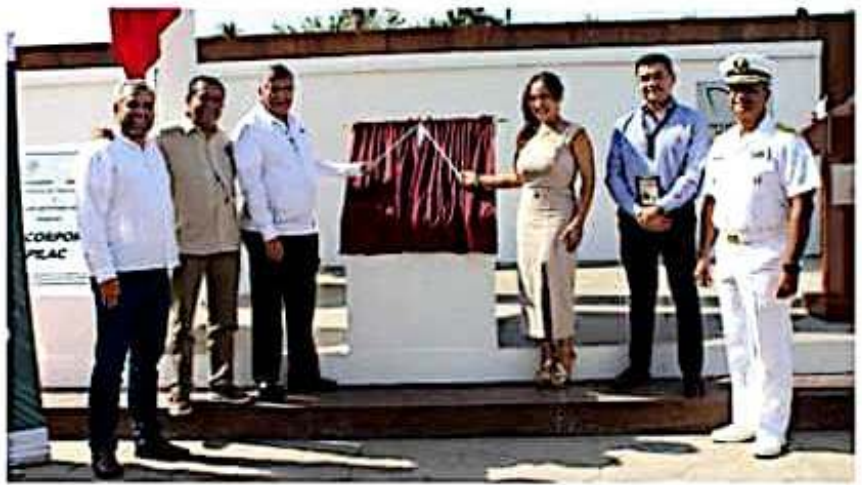
Los trabajos de la obra del Distribuidor Vial, cuya inversión es de 439 millones de pesos, tendrán una duración de un año.

Hicieron lo propio representantes de la Cámara Mexicana de la Industria de la Construcción (CMIC), de la Asociación Mexicana de la Industria de la Construcción (AMIC), del Consejo Coordinador Empresarial de Lázaro Cárdenas (CCE), de la Cámara Nacional de Comercio (Canaco), del Colegio de Ingenieros, entre otras personalidades.