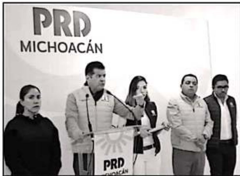
EL DIRIGENTE DEL PRD ASEGURÓ QUE EL BUKI TIENE LAS PUERTAS ABIERTAS SI QUISIERA SER POR LA GUBERNATURA.

Según la administración estatal, la diputación michoacana de la Cámara Baja del Congreso de la Unión no defendió el gasto local.