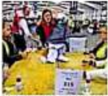
En 2014, Escocia celebró uno con alta vinculación. (Javier Ovando)

La ministra principal de Escocia, la nacionalista Nicola Sturgeon, afirmó que "a finales de esta semana" presentará la "propuesta democrática" para solicitar formalmente al gobierno británico la celebración de un segundo referéndum de independencia en Escocia. En un discurso ante el Parlamento escocés, Sturgeon señaló que es resultado de las elecciones del 12 de diciembre, en las que los conservadores ganaron con mayoría absoluta, y su formación, el Partido Nacionalista Escocés (SNP), obtuvo la mayoría de apoyos en Escocia, demuestra que "el futuro" que desean los escoceses "es muy diferente al de gran parte del resto del