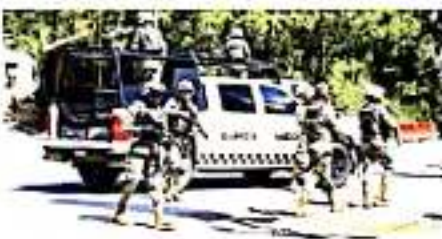
IRAPUATO, GTO.- Tras un choque a balazos entre elementos de la GN y un grupo de pistoleros, un uniformado pereció al igual que 5 civiles y dos civiles aparentemente ajenos a los hechos.

Según datos de la organización Causa Común, con la muerte del elemento de la Guardia Nacional suman ya 66 policías asesinados en Guanajuato, dos más que en 2018, y 419 en todo el país.