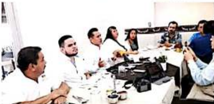
CD. LÁZARO CÁRDENAS, MICH.- El diputado federal Carlos Torres Piña aseguró que el periodo legislativo ha servido para sentar bases para la 4T en el país.

Finalmente, el legislador mantuvo una reunión de acercamiento con un nutrido grupo de líderes sociales y políticos del municipio, a quienes explicó el resultado de las tareas legislativas emprendidas este año y a quienes señaló la importancia de trabajar en unidad por el municipio y el estado que se necesita, y a la vez mantuvo un diálogo de acercamiento con ellos.