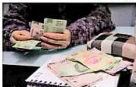
Las negociaciones con los dueños serán más fáciles para ya pagar más en cada empresa. UNICO CRUZ

Detalló que el acuerdo alcanzado por la Comisión Na-