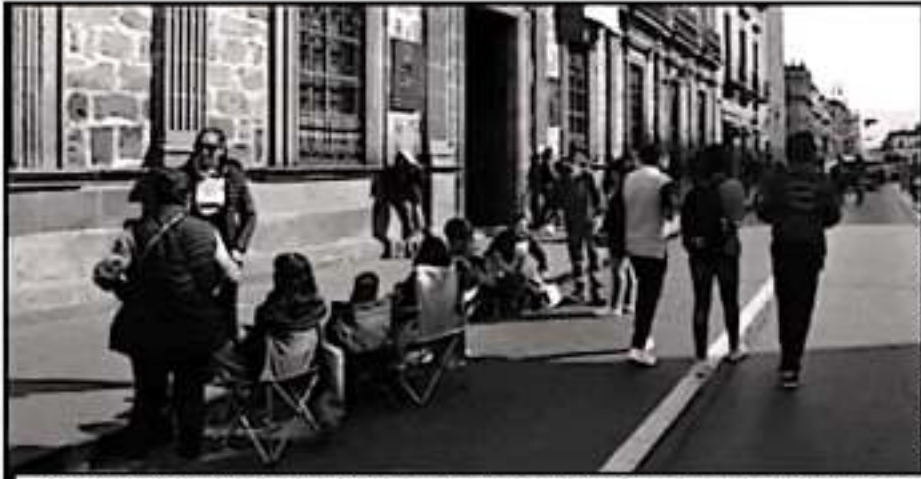
EMPLEADOS DE LA UNIVERSIDAD MICHOACANA SE NEGAN A FIRMAR UN ACUERDO DE LA REFORMA PENSIONARIA.

Reiteró que no romperán el diálogo con la autoridad como mandato del Consejo General y no necesariamente tiene que ser en los tiempos que ellos marcan; argumentó "el SPUM cayó en la trampa de que se acepte este cambio que, al depositar en la Junta Local de Conciliación y Arbitraje, aceptar la actualización puede derivar en la Reforma a la Ley Orgánica".