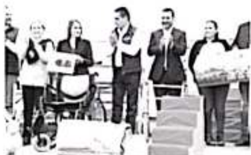
Estos apoyos son parte de la estrategia implementada por el gobierno estatal, que busca construir un modelo de atención a niñas, niños y jóvenes en cada municipio.