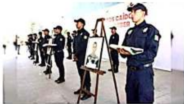
CIUDAD DE MÉXICO.- El estado de Michoacán es la segunda entidad de México donde han matado más policías en este 2019.

El estado donde menos se cometen homicidios dolosos en general, Yucatán, paga a sus policías 12 mil 358 pesos al mes, apenas por debajo del promedio nacional.