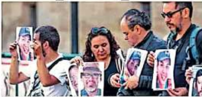
Del año 2000 a la fecha, 251 periodistas han sido asesinados en México. (Javier Ovando)

Este año han sido asesinados 49 periodistas en el mundo, lo que significa 47% menos que en 2012 y la cifra más baja desde hace 16 años, según reporteros sin fronteras (RSF), que señala a Latinoamérica como un punto negro con 14 muertos, la mayor parte en México. En su informe anual, RSF destaca que México es el país del mundo con más cuestionados (10), junto con Siria (10), que tiene la particularidad de que está en guerra desde hace más de ocho años. Además, la probabilidad de que los autores intelectuales de los asesinatos de periodistas en México sean juzgados "es casi nula", teniendo en cuenta que