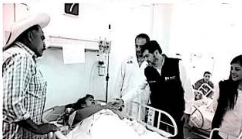
TACÁMBARO, MICH.- La cirugía laparoscópica es un procedimiento de mínima invasión para tratar varios problemas de salud, servicio que acerca la Secretaría de Salud de Michoacán (SSM)

El asunto resulta particularmente relevante porque permite evidenciar la vulnerabilidad y desprotección de los pacientes que suelen ser atendidos en el sistema de salud mental.