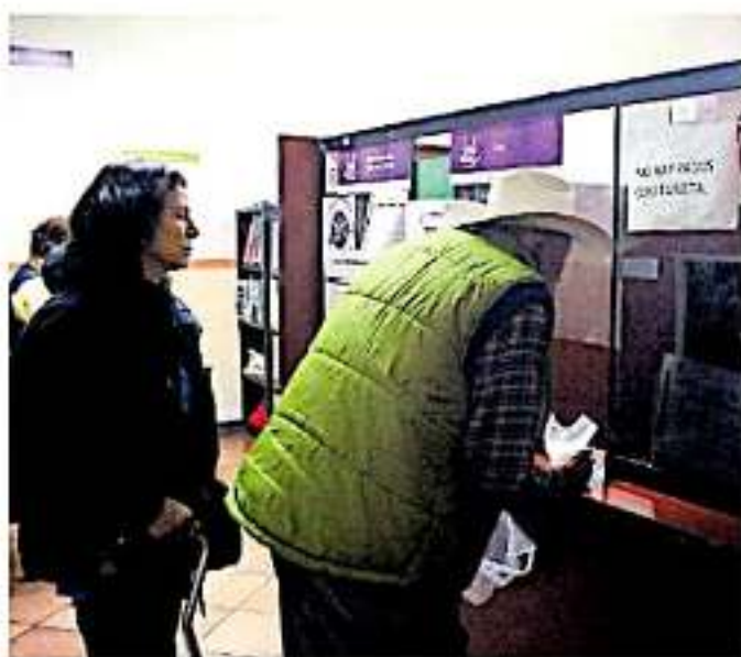
El alcalde aseguró que esta "limpieza" a la nómina de trabajadores y el dejar de pagar por "moches" la ha traído ahorros al municipio. (ARQUIVO)

Además de ellos, consideró como ahorros, la contención del personal innecesario de la administración, los gastos en operatividad como gasolina e insumos varios, los cuales según lo dicho han sido aplicados en la realización de cerca de 200 obras en lo que va de este año.