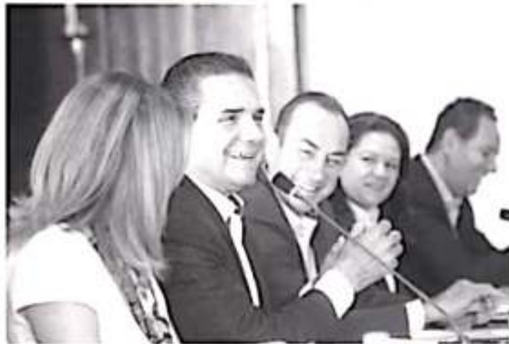
El sector turístico representa un área de oportunidad de desarrollo y equidad, ya que genera empleo principalmente para mujeres y jóvenes.

-Recibió la entidad alrededor de un millón de visitantes y turistas, gracias a los diferentes eventos y el atractivo de sus destinos Encabeza Gobernador reunión del Consejo Consultivo de Turismo de Michoacán