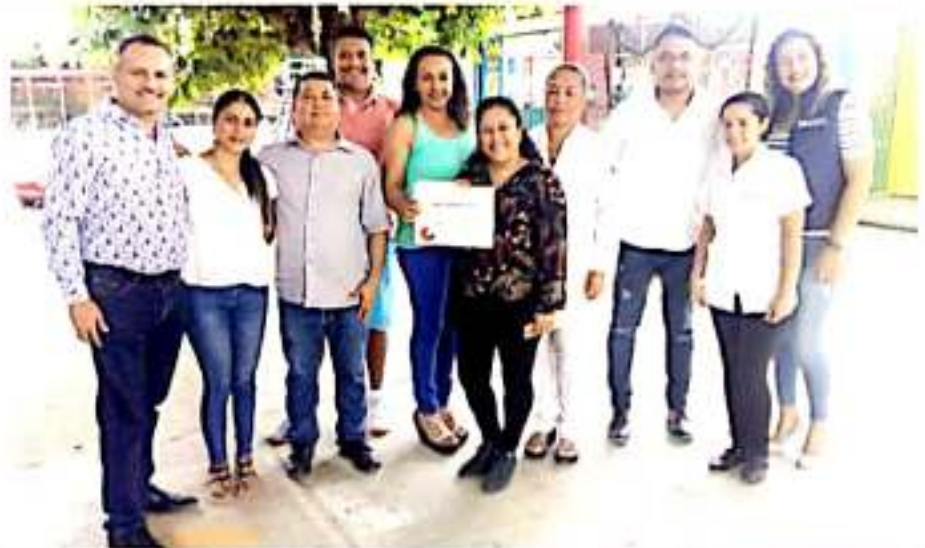
CD. LÁZARO CÁRDENAS, MICH.- El jardín de niños José Verdi de Acalpican ha sido reconocida como escuela promotora de la salud.

Por lo que ve a los sindicalizados burócratas, además de la toma de la oficina recaudadora, volentearon para informar los motivos de su acción, que podría repetirse el próximo viernes, de no ver resueltas sus demandas.