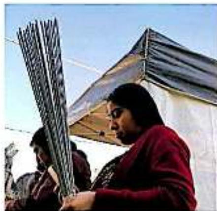
Se han detectado 35 establecimientos en mercados y sobre las calles.

Al momento se han detectado 35 establecimientos en mercados y sobre las calles que comercializan este tipo de ítems,