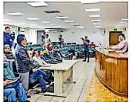
El encuentro se realizó en el edificio de Rectoría en Ciudad Universitaria (CUBA) en Morelia.

Incluso aseveró que el SPUM ha caído en "una trampa" en la que el SUEUM no entrará, pues una vez que la aceptación de la propuesta se presente ante la Junta Local de Conciliación y Arbitraje, como lo demanda la Federación, quedarán sin efecto las cláusulas del CCT que establecen los mecanismos de jubilación, ya que la normativa señala que los convenios y cláusulas firmadas fuera de ese contrato firman parte del mismo. Y aunque dijo que pese a que el SPUM ya firmó la modificación