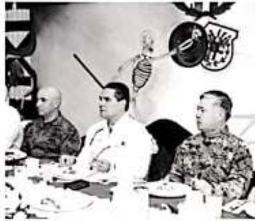
APATZINGÁN, MICH.- En gira de trabajo por Tierra Caliente, el gobernador de Michoacán, Silvano Aureoles Conejo, encabezó la reunión del Grupo de Coordinación para la Seguridad de Apatzingán.

tado de derecho, que luego de estas acciones focalizadas, han dado resultado. El Grupo de Coordinación Estatal ha llevado a cabo 206 sesiones en el mismo periodo de 2015 a noviembre de 2019, en las cuales se han tomado 402 acuerdos en materia de combate a la delincuencia, con un nivel de cumplimiento del 100 por ciento. En cuanto a los Grupos de Coordinación Local, se registran mil 186 reuniones en los municipios de Morelia, Uruapan, Zamora, Lázaro Cárdenas, Apatzingán, Zitácuaro, La Piedad y Sahuayo.