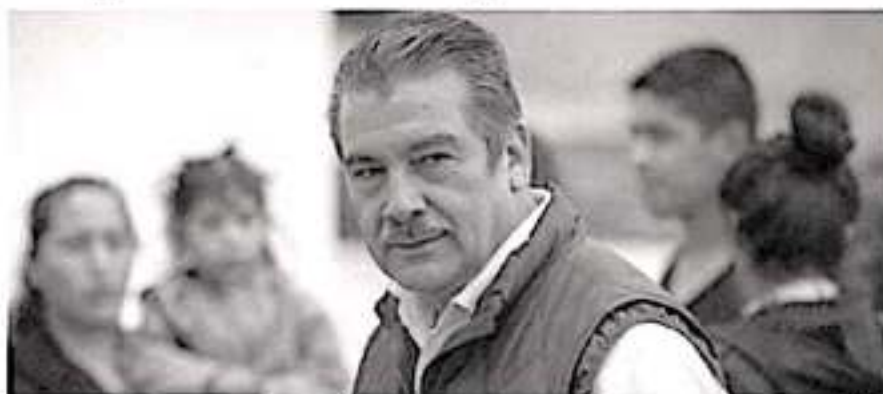
El alcalde Raúl Morón, aseguró que en su gobierno se combate la corrupción.

Reiteró que su gobierno tiene el compromiso de laboral con total transparencia ya que de esta manera generará la eficiencia laboral que demanda la capital del