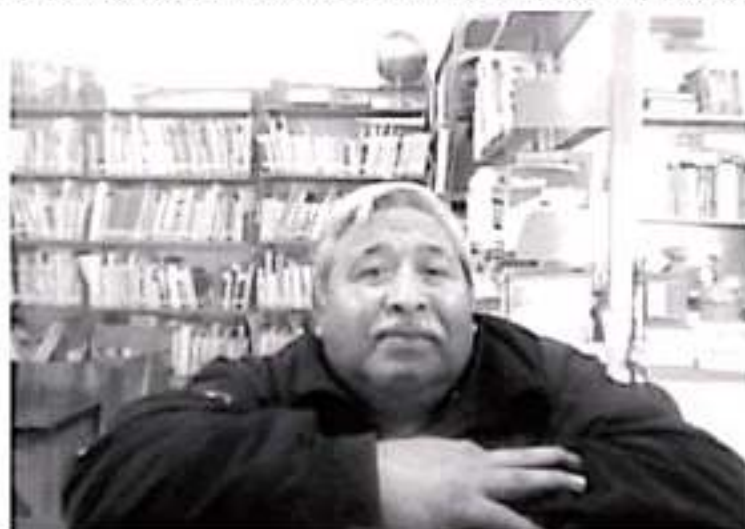
La Biblioteca Melchor Ocampo cumplirá 67 años de su fundación y este año logró que 34 mil usuarios solicitaran los servicios que presta.

pues a pesar de que toda la información se puede consultar en el internet, nada se supera con tanta y leer un buen libro para contar, imaginar o visitar lugares en el mundo. Esto