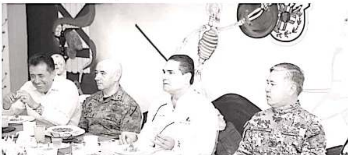
En gira de trabajo por Tierra Caliente, el gobernador de Michoacán, Silvano Aureoles Cerezo, encabezó la reunión del Grupo de Coordinación para la Seguridad de Apaxtzingán, por lo que sumó mil 393 reuniones presididas por el mandatario estatal desde octubre de 2015.

El presidente mencionó durante la rueda de prensa mañane-