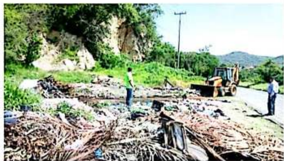
CD. LÁZARO CÁRDENAS, MICH.- El municipio de Lázaro Cárdenas carece de la aplicación de un reglamento ambiental, pues a pesar de su difusión, este no se aplica como se debe.

Por lo anterior, consideró que para el próximo 2020, se tocarán puertas con las autoridades competentes, a fin de promover que se implementen sanciones fuertes para que la educación ambiental se establezca en el municipio y así ir acabando gradualmente con el grave problema ambiental que se tiene en la región.