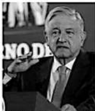
El presidente López Obrador dijo que su administración inició de cero por falta de elementos profesionales y que no estuvieran corrompidos o en contubernio con los criminales.

A la conferencia matutina del presidente asistieron la secretaria de Gobernación, Olga Sánchez Cordero; el Secretario de Seguridad, Alfonso Durazo; el Secretario de la Defensa, general Luis Crescencio Sandoval; de Marina, almirante José Rael Ojeda y el comandante de la Guardia Nacional, general en retiro Luis Rodríguez Bucio, quienes oírán un informe sobre los resultados en materia de seguridad.