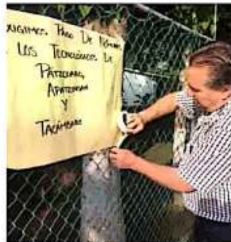
Los docentes desfilan este miércoles su protesta en el paro. (CONTINUA)

Mientras que las quincenas no se han pagado a los tecnológicos de Patzcuaro, el de Apaxtzingán y de Tacámbaro, ni a la Universidad Intercultural Indígena de Michoacán.