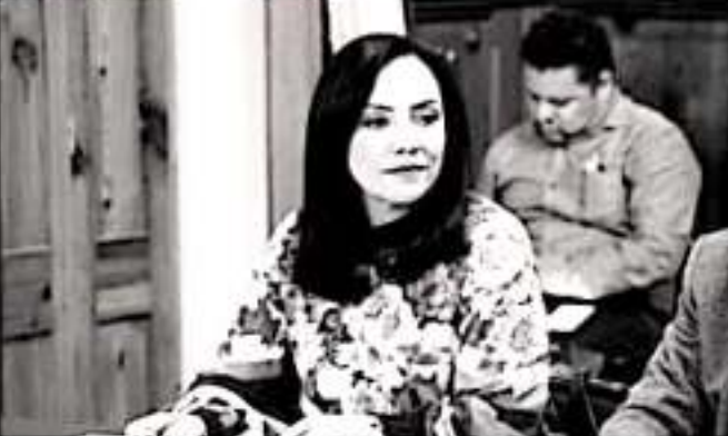
MORELIA, MICH.- "Es de reconocer todo el esfuerzo y trabajo que hacen de manera interna en el Poder Judicial para la selección de magistrados."