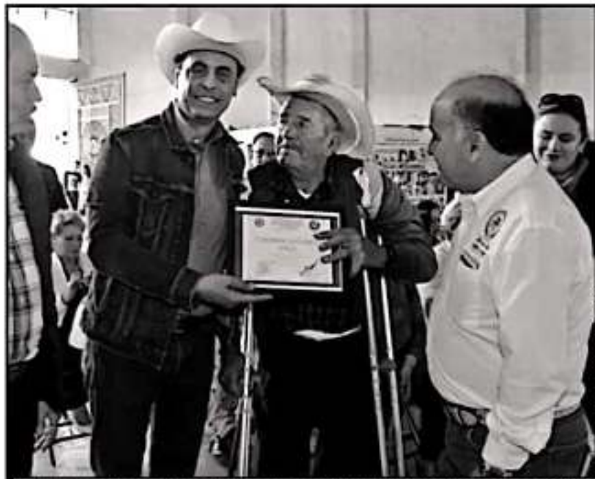
PRODUCTORES CAMPESINOS SOSTUVIERON UN EVENTO DONDE DIERON A CONOCER RETOS SOBRE EL CICLO AGRÍCOLA.

"El año pasado fue por agua y ahora es por sequía. Estamos platicando con el Gobierno del Estado, pero nos preocupa, porque no se ha terminado de pagar