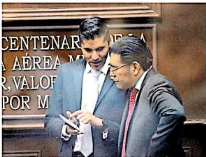
Se retomará este miércoles en el Congreso para repetir la votación (arriba)