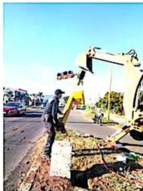
LOS REYES, MICH.- Se reinstaló el semáforo que había sido derribado en el Libramiento de Los Reyes.

La importancia de dicho semáforo radica en que la calle Lázaro Cárdenas es una de las principales salidas de la ciudad al libramiento y hacia la zona de los fraccionamientos San José, Quinta Real, Las Fuentes y Aguablanca, además de que es paso obligado de la comunidad estudiantil de la mencionada institución educativa ya sea en automóvil, motocicleta o caminando. De hecho, es tal la circulación por la zona que en hora de entrada y salida de clases se hace necesaria la presencia de elementos de vialidad.