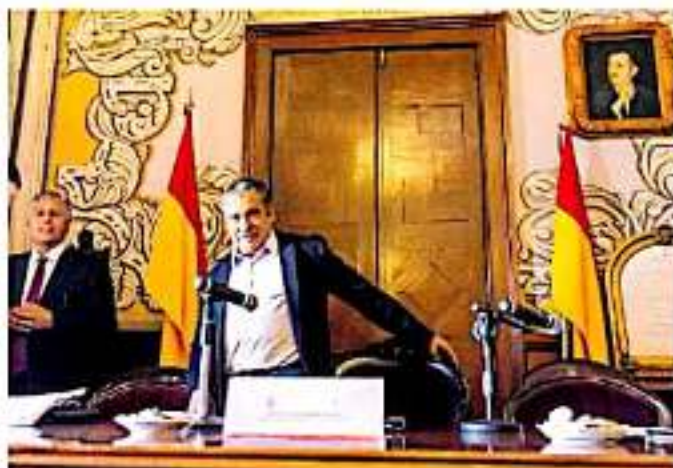
El alcalde moreliano señaló que son ocho los inspectores mercantiles, los que fueron retirados de su labor y otros dos inspectores de obra de la SUOP. (ARQUIVO)