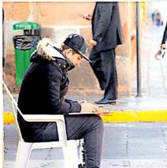
Cada año, este tipo de padecimientos representan un crecimiento del 10 al 15 por ciento. (MATEO ALUNA)

El funcionario estatal del departamento de Epidemiología dio a conocer que a la semana epidemiológica número 48 se reportó un acumulado de 680 mil 728 casos de infecciones respiratorias agudas en la entidad; mientras que al mismo período del año anterior se reportaron 656 mil 552 personas enfermas.