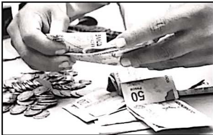
EL CEEM RECONOCE QUE ESTE INCREMENTO ES HISTÓRICO, POR LO MENOS EN LOS ÚLTIMOS 44 AÑOS.

suelo alcanzaba apenas para adquirir el 38% de los bienes y servicios de la llamada "canasta recomendable", mientras que para 2020 se elevará al 46 por ciento.