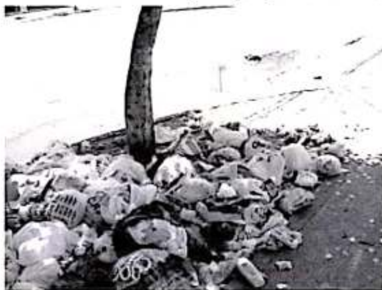
En temporada normal, se recogen en toda el municipio un promedio de 100 toneladas, esta cantidad se incrementa hasta a 200 durante estas fiestas.

Con base en las observaciones y testimonios, el 24 de diciembre se darán a conocer los resultados, habrá premiación en efectivos para la posada ganadora y además el reconocimiento como la calle, la cuadra o el fraccionamiento que no usa plástico y cuida el medio ambiente.