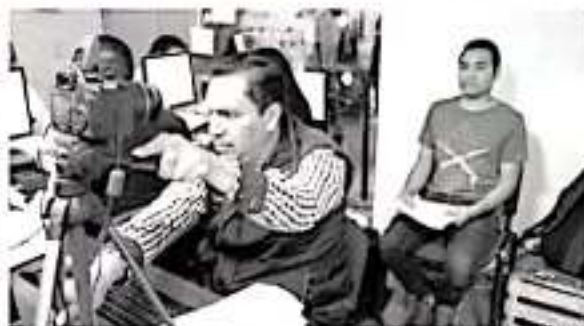
Expedición de licencias y condonación de multas.

Los costos y requisitos pueden revisarse en la página oficial de la SFA, www.sefinanzas.michoacan.gob.mx , menú trámites vehiculares en la opción correspondiente al trámite de su interés.