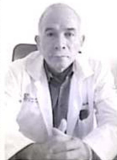
La obra quedará terminada el 31 de marzo, y a partir de ese momento, tendrá la función de atender a toda la población abierta que no tenga seguridad social.