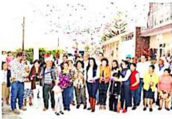
JACONA, MICH.- El área pavimentada contempla 888.9 metros cuadrados de concreto hidráulico, entre la calle Lázaro Cárdenas y la calle Constituyentes.

Guerrero Barrera aseveró que este presupuesto viene libre, podrá ser invertido en lo que desee el presidente municipal, en emergencias que se tengan o donde considere que le hace falta. Aseguró que mostrará los documentos para dar a conocer las cantidades reales que se asignaron para Michoacán y sus municipios, en el sector salud, educativo y de qué manera se va a trabajar.