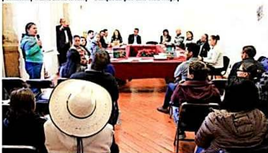
En el marco del Día Internacional del Migrante, el presidente de la Comisión de Migración realizó un conversatorio con la finalidad de intercambiar experiencias para mejorar las condiciones de los migrantes.

De lo anterior, hizo una narrativa sobre el trabajo legislativo que se impulsa desde la Comisión de Migración y sus integrantes, quienes con este tipo de foros, fortalecen el trabajo mutuo y buscan a través del intercambio de experiencias, hacer mayor conciencia sobre sus necesidades, así como de medidas que procuren mejoras en las condiciones económicas y sociales de ellos y sus familias tanto en su lugar de residencia como en el de origen.