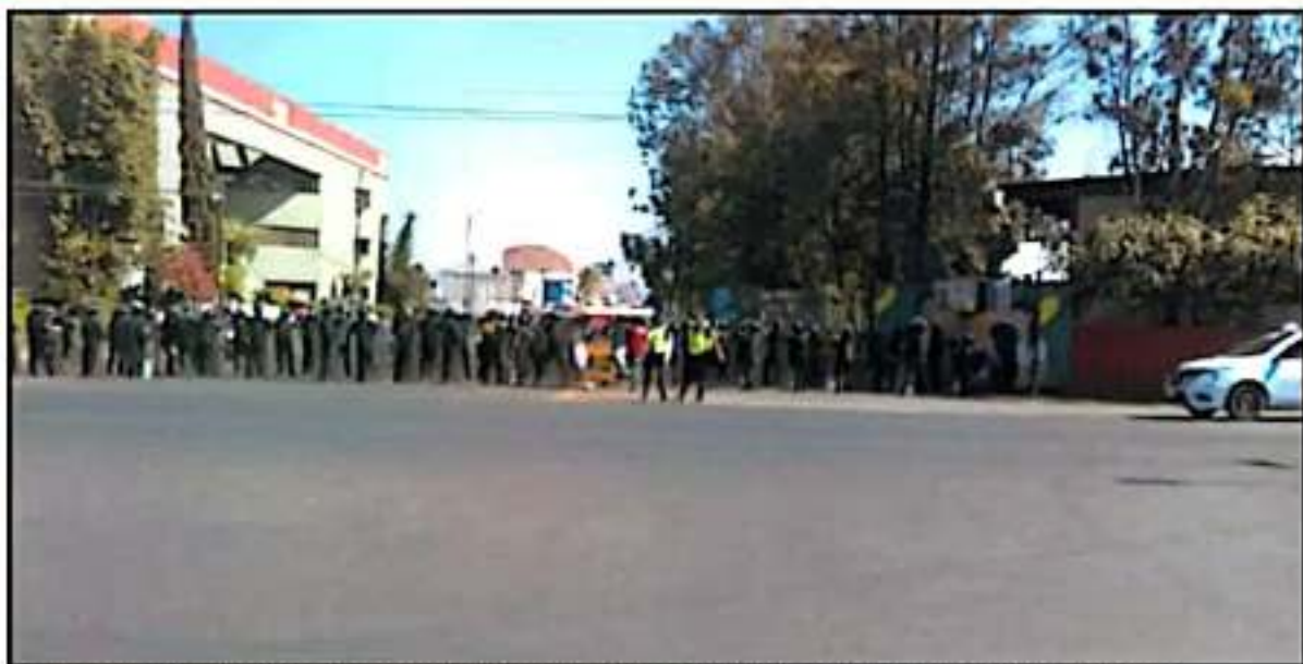
GRUPOS POLICIAOS RESGUARDARON LA AVENIDA SERVO DE LA NACIÓN TRAS LA MANIFESTACIÓN DE CIENTOS DE ESTUDIANTES NORMALISTAS

cobertura en su totalidad, "queremos la calendarización que dé garantía del proceso a llevar como generación", lo que significa, que la autoridad se comprometa a que tan rápido puede convencer a casi mil profesores en activo a retirarse para darle su plaza a los normalistas.