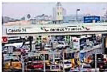
La cifra a superar este año es de los 89 mil pasajeros. JUAN ESCOBAR

A decir del funcionario la apertura de sus alas de vuelo que coexisten al estado con el vecino país del norte como el vuelo directo de