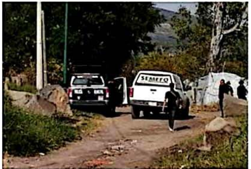
Cerca de las instalaciones de la planta de Pemex en Uruapan, fue localizado el cuerpo de un hombre, que fue asesinado a balazos dentro del vehículo que conducía.

Al sitio llegó el personal de la Fiscalía, que realizó el levantamiento del cadáver del hombre no identificado y lo trasladó al Semeño local.