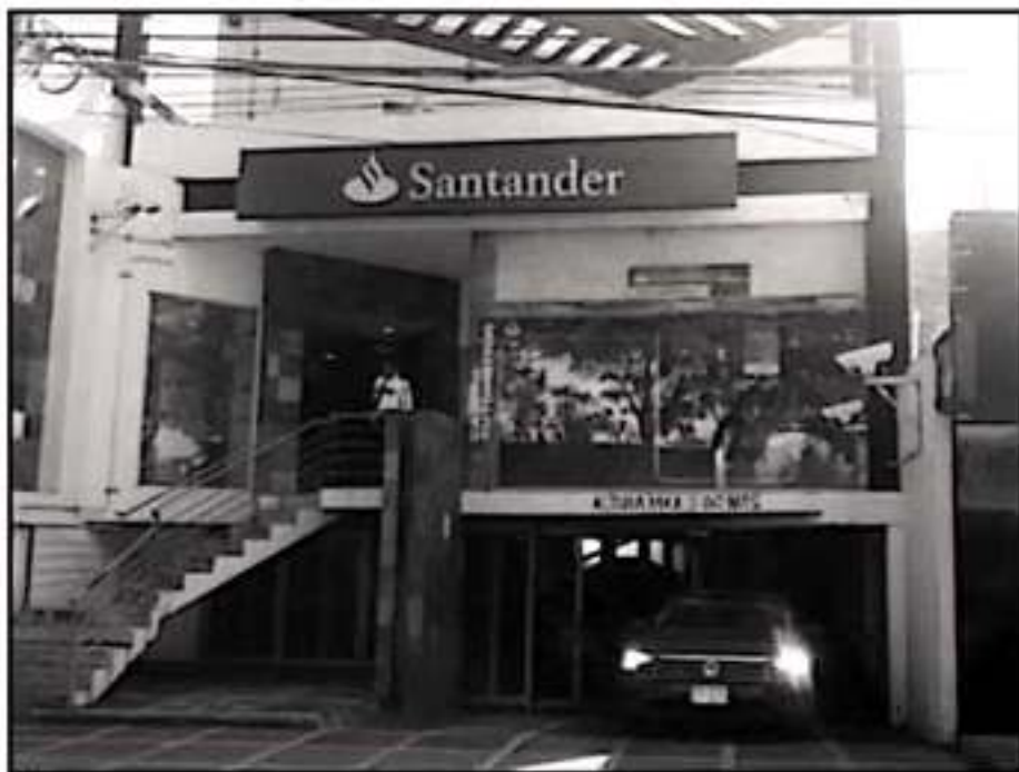
UN SOLITARIO SUJETO APROVECHÓ LA FALTA DE VIGILANCIA EN EL BANCO SANTANDER PARA COMETER EL ATRACO

"En los próximos días me reuniré con ellos para revisar estrategias y la coordinación para evitar estos casos. Los bancos tienen una alarma, la encienden y de inmediato estamos nosotros ahí, gracias a ello la vez pasada pudo haber detenidos, pero ahora no nos llamaron hasta pasados va-