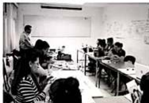
MORELIA, MICH.- Será ofrecido el diplomado "Contextos escolares inclusivos con perspectiva de género".

El diplomado tendrá lugar en modalidad sabatina, de 15:00 a 21:00 hrs. del 18 de enero al 11 de julio 2020. La fecha límite de inscripción fue establecida para el 15 de enero de 2020 en el departamento de Servicios Escolares del IMCED con los requisitos completos. El cupo es limitado y los interesados en participar deberán cubrir una cuota de recuperación de 2 mil 500 pesos. La duración del curso es de 150 horas presenciales con puntaje otorgado por la Secretaría de Educación en el Estado. Los requisitos de ingreso son copia de acta de nacimiento, copia de certificado máximo de estudios, dos fotografías tamaño credencial ovaladas b/n, comprobante de pago en caja del IMCED o depósito en cuenta BBVA0448972915. Para mayores informes, podrán acudir a calzada Juárez 1600, colonia Villa Universidad, en el área de Diplomados, teléfono 3 1675 15 extensión 222.