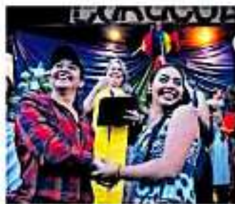
Acusaron que la discriminación se agudiza. JUAN ESCOBAR