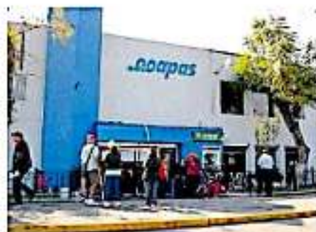
El ODAPAS, comenzó el 2019 con déficit financiero

DENUNCIAS ya fueron presentadas al inicio de este año