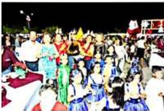
CD. LÁZARO CÁRDENAS, MICH.- Con la participación de 120 niños de nueve CAIC's, se llevó a cabo la tarde del pasado lunes el Concurso de Villancicos Navideños.

El segundo y tercer puesto fueron para los CAIC's 21 de Mayo y La Estrella, quienes además obtuvieron paquetes de material educativo grupal.