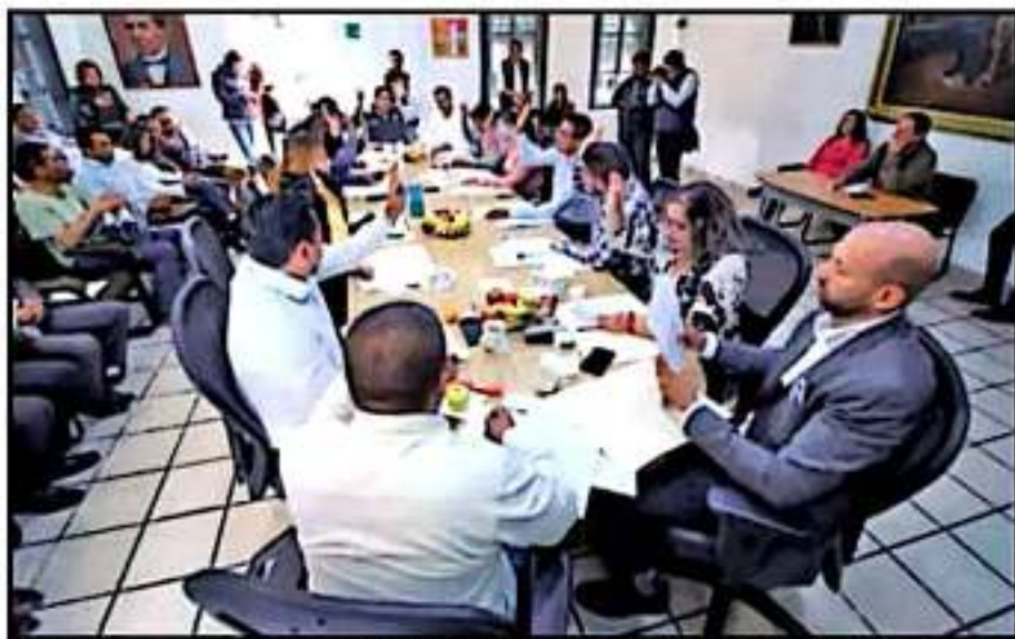
EL CABILDO APROBÓ EN ESTA LÍNEA NUEVA CONVOCATORIA PARA CONCESIONAR EL RELLENO SANITARIO DE URUAPAN

Martínez Carranza añadió que, en la actualidad, el trabajo operativo en el relleno sanitario lo ejecutan integrantes del ejido Jucatacabo, ello por disposición del municipio al ser ese núcleo agrario el poseedor del terreno de casi 15 hectáreas y el cual rentan al ayuntamiento para esta función a razón de casi 100 mil pesos mensuales, quienes además participan en la aportación de pruebas