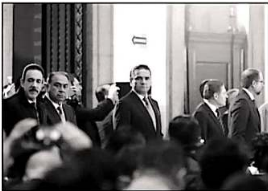
EL GOBERNADOR DE MICHOACÁN ASISTIÓ POR LA MAÑANA A LA SESIÓN DEL CONSEJO DE SEGURIDAD PÚBLICA.

resultados en el combate al crimen. Dentro de las propuestas planteadas por los gobernadores, destacó la revisión del funcionamiento de las mesas diarias de seguridad, de modo que sea el Consejo Nacional donde cada dos meses se revise la estrategia con los mandatarios estatales.