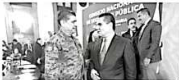
Realizan un llamado a cerrar filas por la seguridad y dejar de lado filias o fobias políticas.

«Reconocemos que estas Mesas diarias son un elemento central de la estrategia del Go-