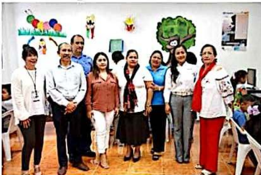
La empresa ArcelorMittal hizo donación de equipo de cómputo para la Biblioteca Municipal de la tenencia de Guacamayas y para la escuela secundaria Educación y Patria de la tenencia de La Mira.