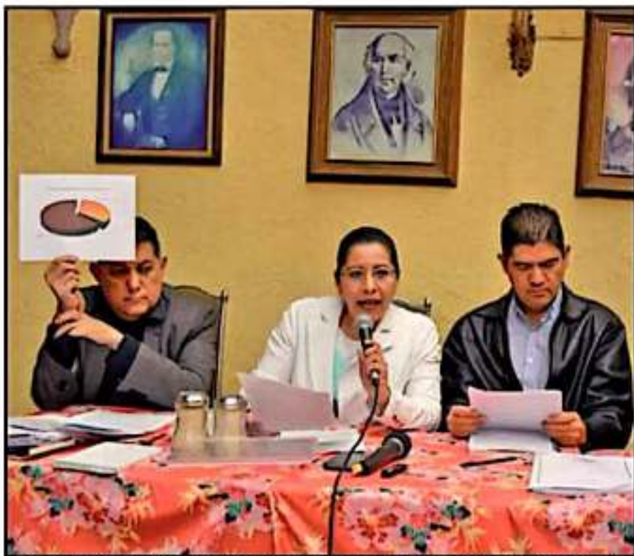
EN RUEDA DE PRENSA, INTEGRANTES DE GRUPOS DISIDENTES DEL SPUM INSISTEN EN QUE HAY IRREGULARIDADES

La académica indicó que de todos los participantes, el