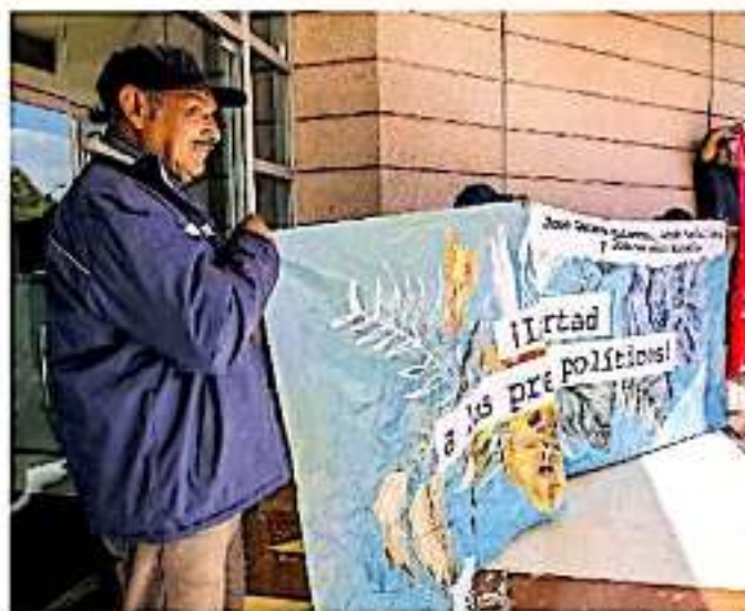
La sentencia inicial fue de 7 años de prisión y la Fiscalía estatal ofreció quitar el resto de delitos.