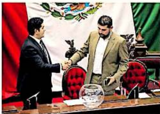
Retornar el proceso a las comisiones para la definición de una nueva terna fueron desestimadas por Madrid Estrada

Al retomarse la sesión extraordinaria que quedó inconclusa el pasado domingo tras resultar "embarranzada" la una en la que se da la segunda ronda de votación para elegir al próximo ombudsperson de Michoacán y el zafarrancho ocasionado por la tema de la tribuna por legisladores