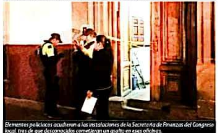
Elementos policíacos acudieron a las instalaciones de la Secretaría de Finanzas del Congreso local, tras de que desconocidos cometieran un asalto en esas oficinas.