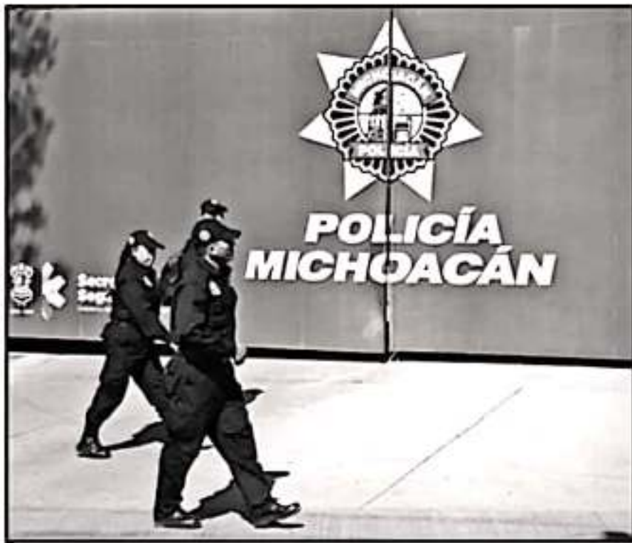
ACTUALMENTE, MICHOACÁN NO CUENTA NI CON LA MITAD DE LOS ELEMENTOS POLICIALES QUE RECOMIENDA LA ONU.

"Los retos son bastante arduos", reconoció el director del IESSPP, y "no basta únicamente con formar policías de manera ex-