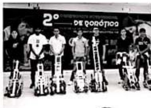
MORELIA, MICH.- Estudiantes de los planteles de Epitacio Huerta y Tangancicuaro, del Colegio de Estudios Científicos y Tecnológicos del Estado de Michoacán (CECyTEM), participaron en el 2º Campeonato Internacional de Robótica 2019.

alumnos procedentes de El Paso, Texas y Nueva York, y de diferentes estados de la República Mexicana, el objetivo del evento es promover la ciencia y la innovación en la robótica. El director general del CECyTEM Michoacán, felicitó a los ganadores y reconoció el trabajo y acompañamiento que realizan los docentes con el estudiantado, refirió que ellos son sus guías para que los estudiantes realicen excelente trabajo en las competencias.