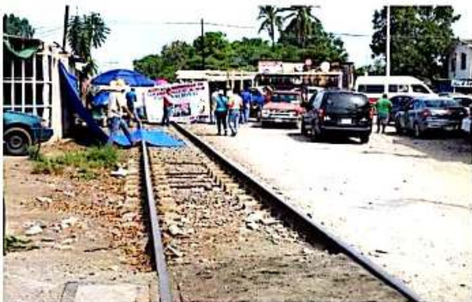
CD. LÁZARO CÁRDENAS, MICH.- La Coordinadora Nacional de Trabajadores de la Educación acordó no retomar, de momento, su bloqueo a las vías ferroviarias.

Cabe recordar que el gobierno del estado, en días pasados anunció una calendarización de pagos que, de manera total, ascienden a los dos mil 14 millones de pesos. En este recurso, explicó el mandatario en aquella ocasión, se cubrirán bonos y salarios correspondientes a los años 2018 y 2019.