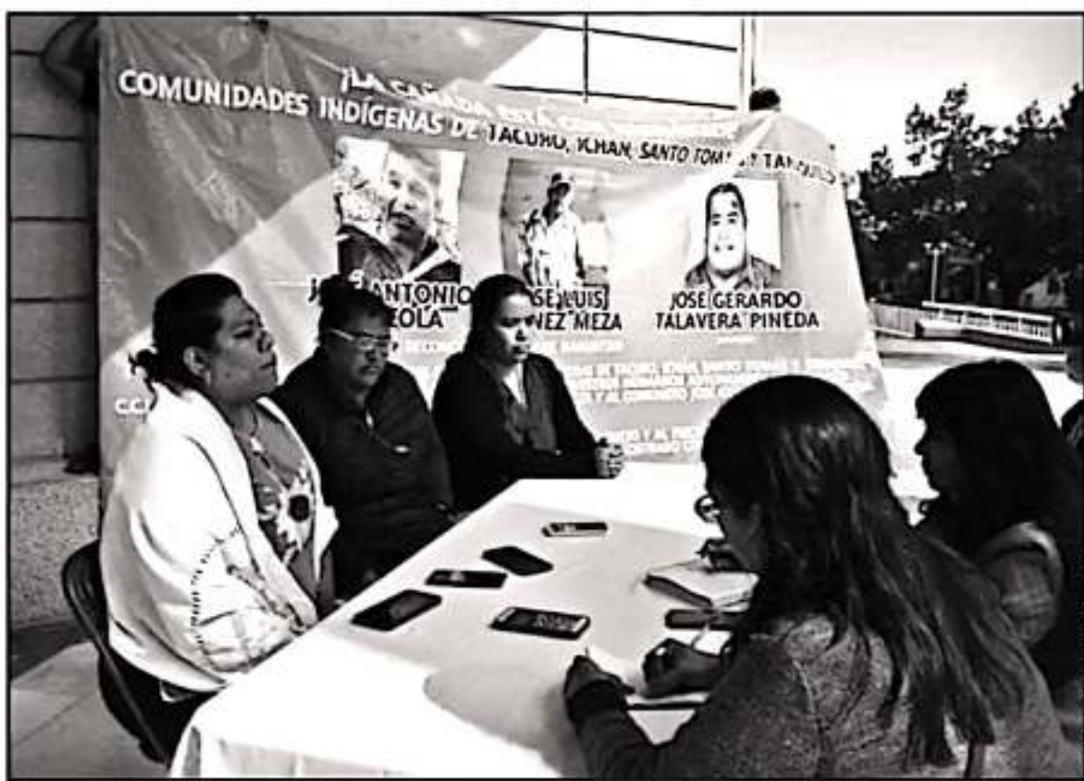
UNA COMISIÓN LEGISLATIVA ATENDIÓ AL GRUPO DE INCONFORMES DE NAHUATZEN Y PROMETIÓ DAR SEGUIMIENTO A LA DEMANDA DE LIBERAR A CONSEJEROS.

cerrar completamente los juzgados, así como la avenida Calzada la Huerta.