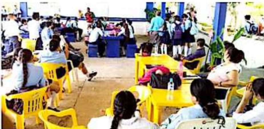
CD. LÁZARO CÁRDENAS, MICH.- PCM impartió un curso de prevención de accidentes en la Escuela Secundaria Técnica 68, de Caleta de Campos, contando con una asistencia de 200 personas, entre alumnos, maestros y padres de familia.