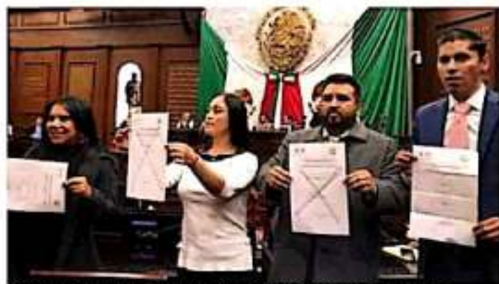
Durante la sesión de este miércoles los legisladores no lograron elegir al nuevo presidente de la CEDH. PERUMETA

Esta vez el procedimiento fue distinto, cada uno de los parlamentarios fue llamado