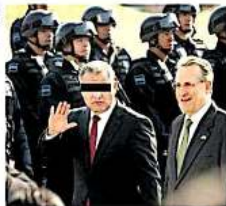
El titular de la UFI reveló que se están investigando a cinco servidores cercanos a García Luna

"No puedo dar detalles en virtud del deber del sigilo de las investigaciones. Se trata de un desvío de dos mil millones hacia una empresa y de esa empresa se desvió una cantidad menor perteneciente a la familia García Luna. Estamos presentando la denuncia esta semana", insistió