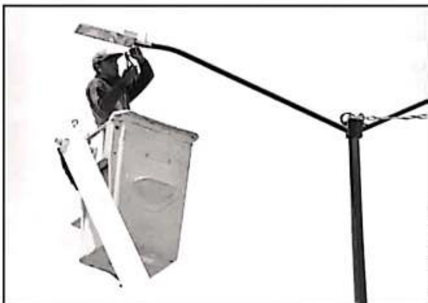
EL CAMBIO DE LUMINARIAS LLEVARÁ UN 95 POR CIENTO DE AVANCE, SEGÚN LOS CÁLCULOS DEL AYUNTAMIENTO.

creo que no se va a terminar y quedará únicamente pendiente dependiendo del centro histórico", añadió el funcionario municipal, en tanto a la fecha de conclusión.