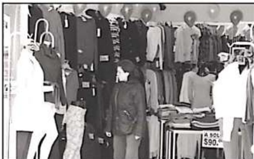
ALMULE COMCHÉ PREVE CERRAR EL AÑO CON BUENOS RESULTADOS, HA HABIDO NEGOCIOS QUE HAN CERRADO.