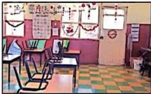
VARIAS ESCUELAS DEL SECTOR PÚBLICO ADELANTARON VACACIONES

De acuerdo al contrato de la empresa Comerspro del Pacífico que data del año 2014 con vigencia hasta el 2024, estaba obligada a cumplir con los procesos técnicos para el manejo integral de los residuos sólidos, desde el establecimiento de una separadora de residuos, hasta una línea, entre otros accesorios, los cuales, quedó establecido no operaban, luego de la auditoría que realizó la Secretaría del Medio Ambiente.