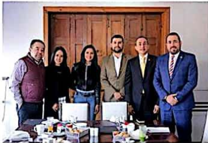
La apuesta de la y los diputados perredistas será en torno al diálogo, al contraste de ideas y al debate propositivo

Por ello, recalcaron que la apuesta de la y los diputados perredistas será en torno al diálogo, al contraste de ideas, al debate propositivo y a la confluen-