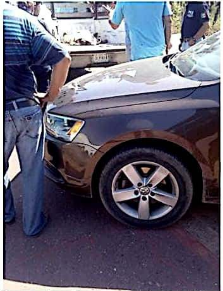
Ayer a la altura del puente de Barra de Santana, un hombre de 80 años de edad, falleció a bordo de esta camioneta en que sus hijos lo trasladaban de Acalpican de Morelos a LC, para que recibiera atención médica, tras ser atacado por un enjambre de abejas.

El Congreso del Estado de Michoacán reprueba tajantemente los hechos ocurridos y hace votos para que pronto se restablezca la paz social en el Estado.