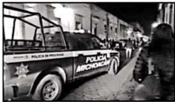
ASALTO A OFICINAS DE FINANZAS DEL CONGRESO CAUSÓ GRAN MUEBLIZACIÓN