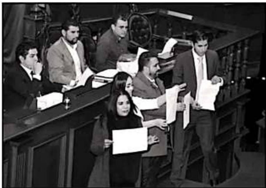
DIPUTADOS SE MOSTRARON INCONTINENTES Y DECIDIERON ANULAR SU VOTO. SE TENDRÁ QUE ELEGIR OTRA TERNA.

Igual como ocurrió durante la trifulca dominical, múltiples