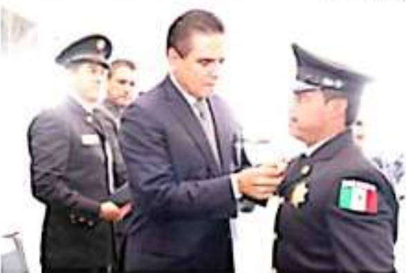
MORELIA, MICH.- En un acto sin precedente, reciben 99 elementos reconocimientos al mérito policial, al valor y a la perseverancia.

Por su parte, el secretario de Seguridad Pública, Israel Patrón Reyes, destacó que la vocación de hombres y mujeres policías ha permitido avanzar en Michoacán, entidad que se ubica entre los 10 estados con menos delitos.