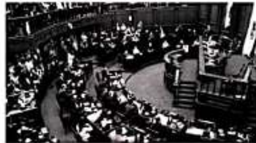
MORELIA, MICH.- Con estricto apego a lo que establece la Ley, el dictamen que contiene la terna para la elección del próximo presidente de la Comisión Estatal de Derechos Humanos (CEDH) se devolvió a las Comisiones Unidas de Derechos Humanos.