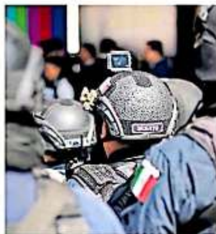
Hay un rezago de 36 seguros de vida que no se han pagado a los dueños.

"Nosotros vivimos en la vida hemos atentado contra ellos, hemos repetido agresiones. Todos los heridos de bala que hemos tenido han sido de nuestro lado, no del de ellos, si hay armas, no es acá, es de aquel lado".