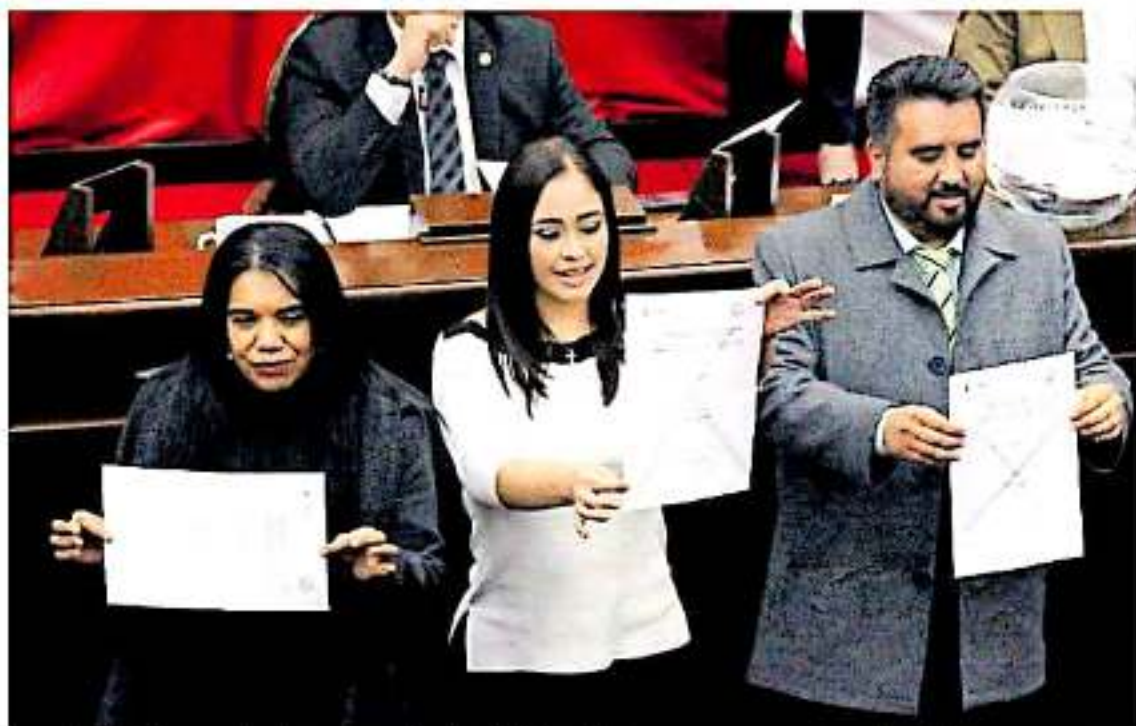
Ayer miércoles 19 votos nulos se impusieron sobre el resultado final y la tema propuesta tuvo que ser desechada. JMW/ALUNA