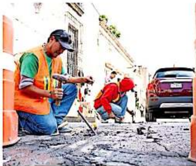
Las denuncias son por contratos firmados sin presupuesto para la realización de obras (FGE)

Es de precisar que, la Contraloría no cuenta con capacidades de castigar a