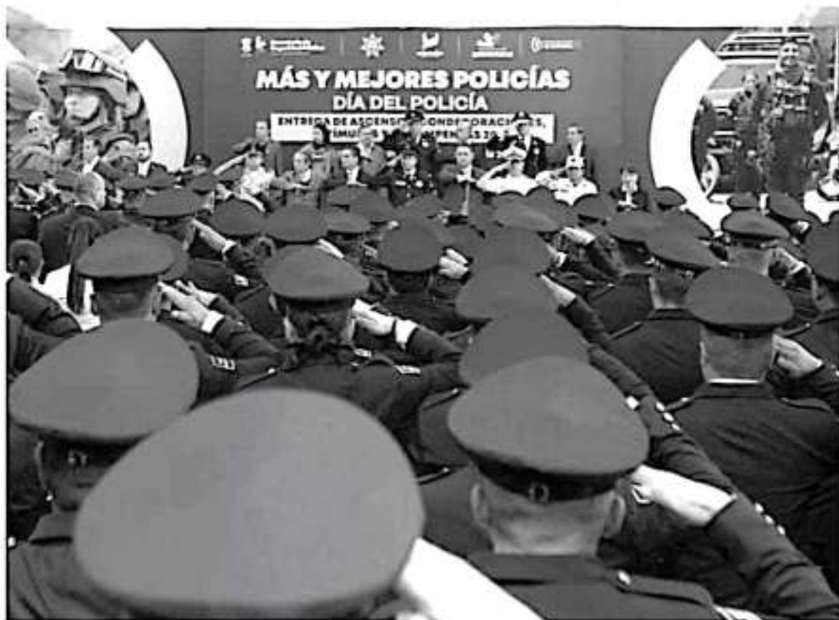
Michoacán cuenta con un total de 5 mil 600 elementos policíacos, es decir 4 mil 200 más que en el 2014.

Con lo que toca a infraestructura mencionó que actualmente el estado cuenta con más de 6 mil cámaras, 55 arcs carreteros y ocho cuarteles.