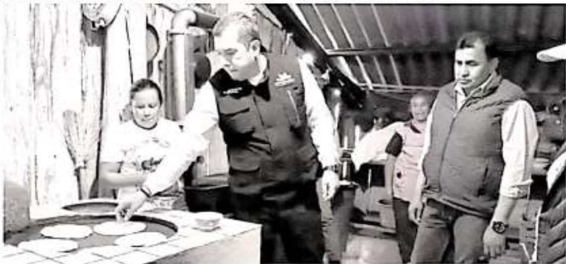
La construcción de estufas con leña y arena continuará en la comunidad de El Laurelito, perteneciente a la tenencia de Jesús del Monte Morelia.

La construcción de estufas con leña y arena continuará en la comunidad de El Laurelito, perteneciente a la tenencia de Jesús del Monte Morelia, en Morelia, donde se tiene prospectado beneficiar a un total de 20 familias, las cuales utilizan leña como principal combustible al preparar sus alimentos.