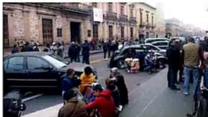
Integrantes del SUEUM se manifiestan por el pago de sus salarios por el rezago.

Aureoles Conejo dijo que pese al avance con los académicos nicolaitas luego de la aprobación de la propuesta final de la rectoría aún hay "resistencia" de los integrantes del Sindicato Único de Empleados de la Universidad Michoacana (SUEUM), por ello pidió al líder del gremio