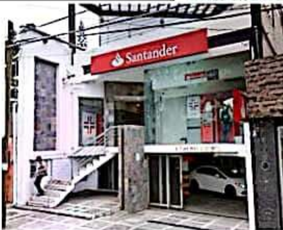
Ayer en Morelia un solitario sujeto asaltó al cajero de esta sucursal bancaria ubicada en Bosques Camelinas.

Posteriormente los encargados del banco activaron la alarma y se registró una fuerte movilización de policía municipal, que al llegar confirmaron el atraco.