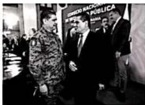
CIUDAD DE MÉXICO.- El Gobernador de Michoacán, Silvano Aureoles Conejo, asistió a la XLV Sesión Ordinaria del Consejo Nacional de Seguridad Pública (CNSP).

"Reconocemos que estas Mesas diarias son un elemento central de la estrategia del Gobierno Federal, sin embargo, desde hace tiempo los gobernadores señalamos nuestra preocupación por su funcionamiento estratégico y operativo. Por ello, considero fundamental fortalecer la actividad de este Consejo Nacional proponiendo que los encuentros en el Consejo sean de carácter bimes-