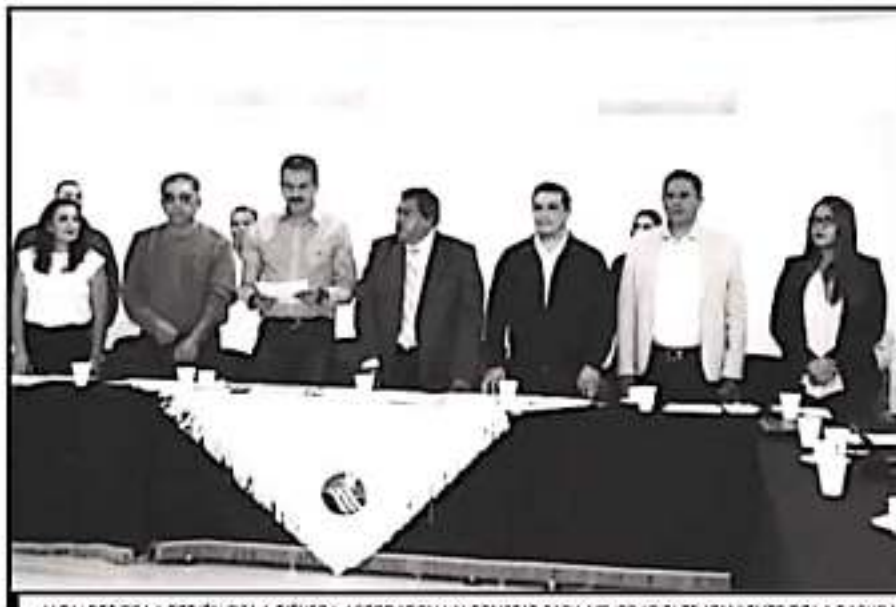
ALCALDES DE LA REGIÓN DE LA CIÉNEGA ACORDARON UN CONSEJO PARA MEJORAR EL TRATAMIENTO DE LA BASURA