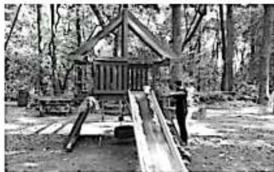
URUAPAN, MICH.- El mantenimiento preventivo y correctivo en el área de juegos es parte de las tareas que se realizan constantemente para garantizar la tranquilidad a los miles de visitantes.

Cabe destacar que se trabaja en 8 módulos de juegos múltiples, 3 resbaladías, dos columpios y el tobogán grande, mismos que el día de hoy estarán en buenas condiciones para su uso.