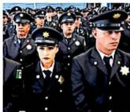
Se otorgaron 99 reconocimientos a personal de la Policía Michoacán.

En dicha ceremonia en la que también se otorgaron 99 reconocimientos a personal de la Policía Michoacán, 32 en la categoría de perseverancia, 63 al valor, uno por mérito y tres reconocimientos especiales a quienes pertenecen a la Unidad Gantra, el mandatario aseguró que a la