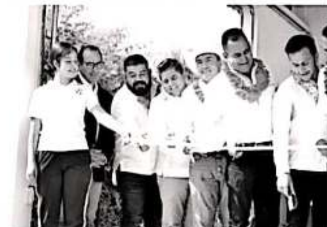
TEPALCATEPEC, MICH.- El Gobierno de México, a través de la Seguridad Alimentaria Mexicana (SEGALMEX), inauguró el Centro de Acopio Lechero en el municipio de Tepalcatepec.