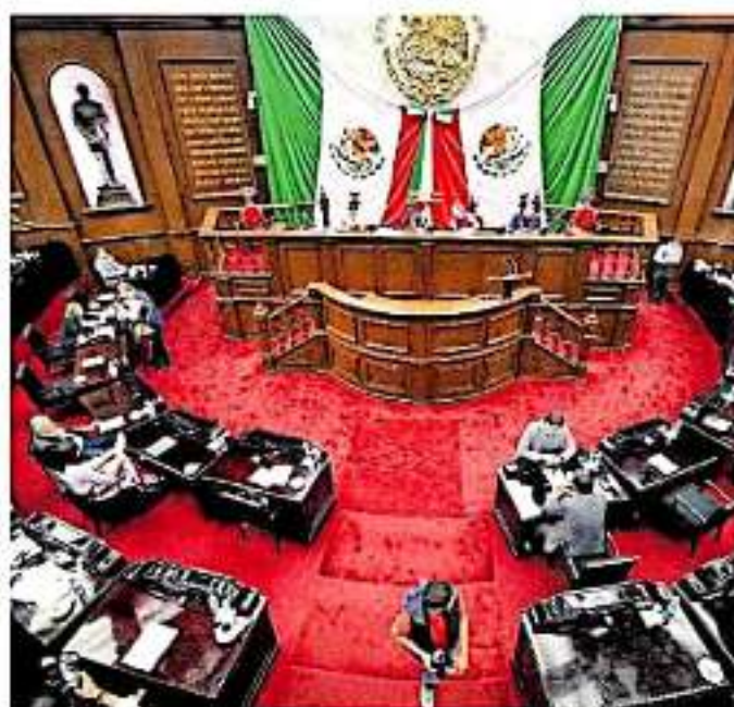
El Congreso del Estado tiene pendiente la sindicalización de 100 trabajadores ya basificados.

"Se le ha dado hasta diez días hábiles al secretario para que entregue la documentación solicitada por el comité, pero después hace una solicitud de prórroga y se le