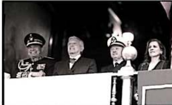
General Luis Crescencio Sandoval, presidente López Obrador, almirante José Rafael Ojeda y Beatriz Gutiérrez Millán