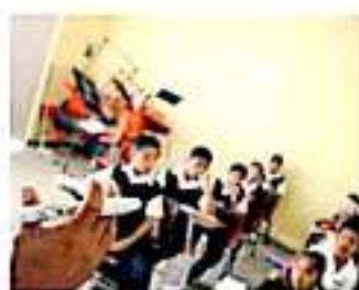
Será antes del cierre del año cuando esté listo el proceso.

El también encargado de despacho de la SEE aseguró que ya se tiene garantizado el pago de quincenas y aguinaldos para el cierre del año, y aunque no precisó el monto que se destinará, mencionó que el recurso será cubierto en un 80 por ciento por la Federación.