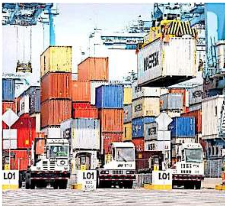
Para los empresarios del Puerto LC se esfumó la esperanza de crear más empleos.

Tras considerar que el primer mandato federal "no escuchar" y "le vale" todo