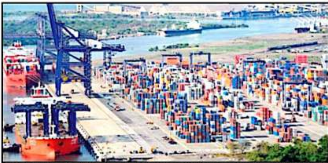
MICHOACÁN, LA VIZCAIN