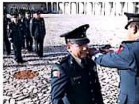
El General de Brigada Espinaldo de la Unidad Militar del Estado de México, coronel de la 21ª Zona Militar, preside la "Tercera Sesión de Inauguración por Ascensos al Grado de Coronel a Superior", donde se impusieron las insignias correspondientes a cinco jefes y cinco oficiales, a quienes eligen a cumplir su servicio con la convicción de seguir por la integridad de nuestro país. @correa