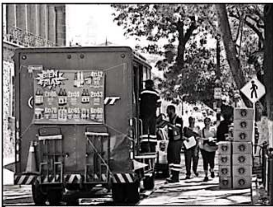
EL AYUNTAMIENTO PLANTEA MULTAR POR VOMITAR EN LA VÍA PÚBLICA O EL USO DE RÓTULOS EN NEGOCIOS

De acuerdo con reportes, entre los puntos que los legisladores estatales letraron, se encontraban el intento por reactivar el impuesto a lotes baldíos, así como también el de estandarizar los cobros a especímenes y aumentar en más de cien