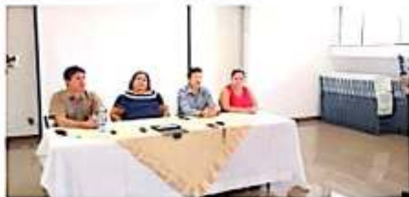
CD. LÁZARO CÁRDENAS, MICH.- La empresa ArcelorMittal y ejidatarios de Playa Azul dejaron atrás sus diferencias tras firmar un convenio por 10 años.

Por lo menos en lo que va a la renta de territorio, finalmente quedó en mil como lo planteaba la empresa, nada se dijo sobre la rehabilitación de las áreas ya explotadas, salvo que es competencia de Semamat, quien cada tres meses tendría un reporte de las áreas en explotación, nada se dijo de las ya explotadas. Y que los ejidatarios en su momento denunciaran ante los medios el abandono en que se encuentran.