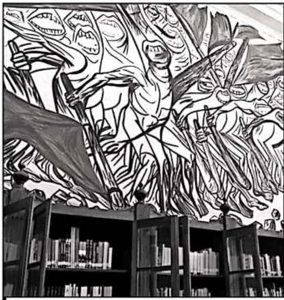
EL LEGADO DE LA REVOLUCIÓN MEXICANA QUEDÓ PLASMADO EN LOS MURALES DE LA BIBLIOTECA DE JIQUILPAN

Como en todos los movimientos armados en el planeta, la carne de cañón fue puesta por las clases más humildes, mientras que las capitancias fueron asumidas por rancheros de medio pelo y caciques regionales; en el caso concreto de México, el progreso había dejado a la vera del camino a los campesinos y peones de haciendas que en ese entonces eran el 15 por ciento de la población total.