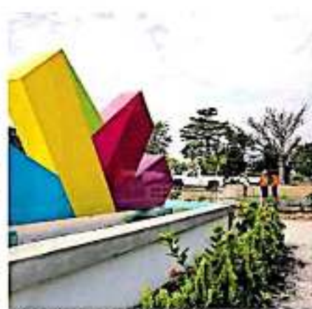
En la Sedatru se desconocen pormenores del recurso para la obra en Huetamo.

En días pasados el propio secretario de Desarrollo Agrario, Territorial y Urbano comentó en entrevista con medios de comunicación que se apoya a las entidades y municipios que tienen proyectos de Ciudad Mujer para que las administraciones públicas las instancias que adminis-