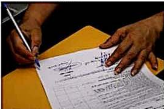
Con 27 solicitudes, cerró el registro de aspirantes a dirigir la CEDH.

Es importante mencionar que el periodo del próximo presidente de la CEDH será de 4 años en los que su principal obligación será la de velar por los derechos humanos de las y los michoacanos sin distinción alguna.