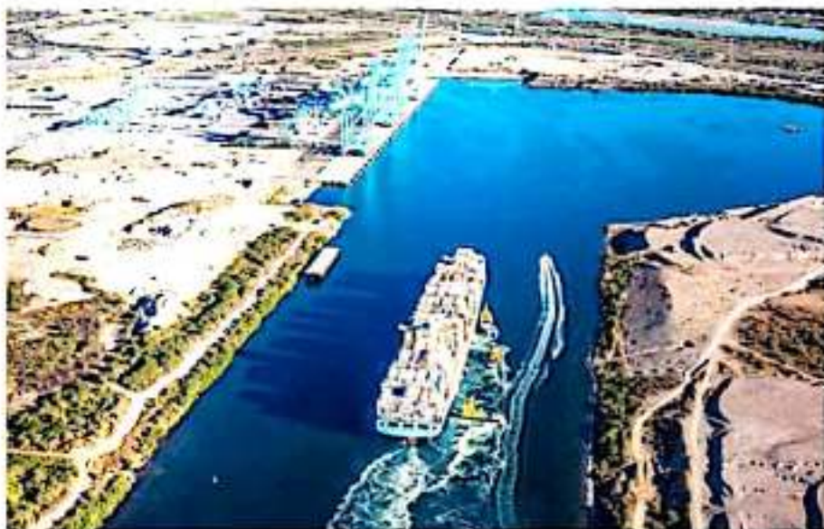
CD. LÁZARO CÁRDENAS, MICH.- El Cceem lamentó la cancelación definitiva del proyecto de Zonas Económicas Especiales, lo cual afirmaron que representa una pérdida de 1,300 millones de pesos en la zona que comprende a Michoacán y Guerrero.

"Llamamos al Gobierno de la República a no ser omiso ante las necesidades del sector empresarial; quienes somos los principales generadores de empleo, inversiones y desarrollo tanto económico y social para las familias mexicanas", concluye el escrito.