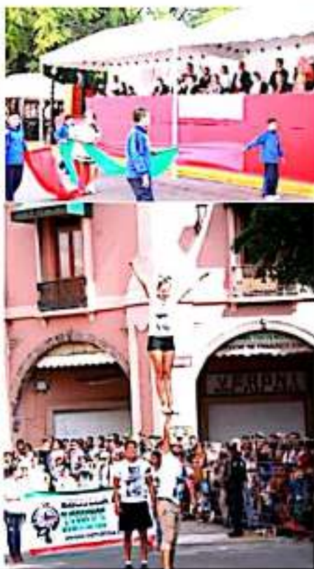
ZAMORA, MICH.- Autoridades locales encabezaron las actividades de este miércoles con motivo del aniversario 109 del inicio de la revolución Mexicana, destacando el tradicional desfile por céntricas calles.