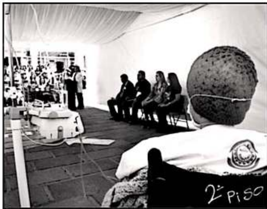
PERSONAS CON CÁNCER SE SIGUIRÁN CON SU TRATAMIENTO, Pese a la sustitución del Seguro Popular por el Insabi

Cuestionada sobre si, ante esta situación, el estado de Michoacán pueda comprar dicho medicamento de manera independiente a la Federación, respondió que si se requiere de la gestión del gobierno central, ya que, de 800 millones que se invierten para medicamentos especializados, solamente 50 millones son aportados por el estado. "El dinero del abasto se quedará centralizado para la compra de medicamentos", finalizó.