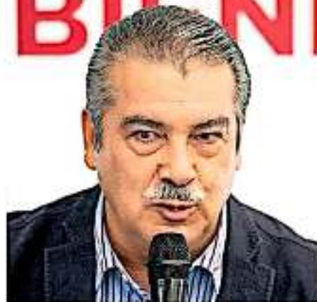
El alcalde dijo desconocer cómo afectará la disminución de ingresos a las arcas municipales / Paola Mendosa