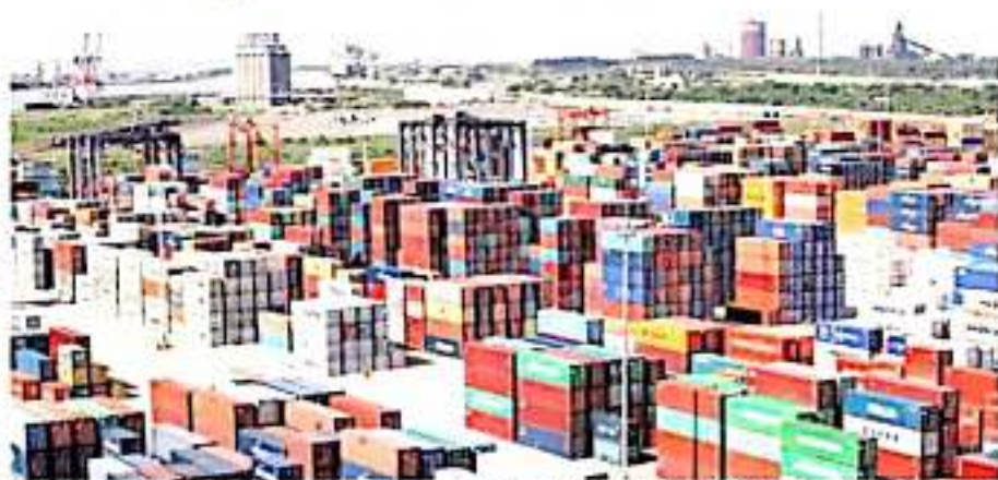
CD. LÁZARO CÁRDENAS, MICH.- Por decisión del presidente Andrés Manuel López Obrador, por decreto publicado en el DOF, hace oficial la desaparición de las Zonas Económicas Especiales.

Las bandadas para las empresas y personas físicas con actividad empresarial que inviertan en las Zonas Económicas Especiales (ZEE), exentarán al 100 por ciento en el pago del Impuesto Sobre la Renta (ISR) durante 10 años o así como créditos fiscales del 50 por ciento en