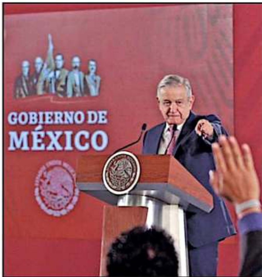
SÍMBOLOS HISTÓRICOS EN EL LOGO DEL GOBIERNO TIENE QUE VER CON EL ACERCAMIENTO A BASES SOCIALES, SEÑALAN

Explicó que como ya lo han señalado especialistas, al estallido de la Revolución Michoacán militarmente no tuvo