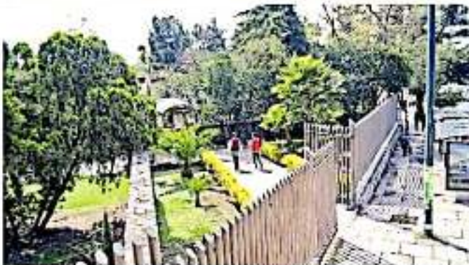
No se logró el compromiso de pago parcial referente a los tres bonos pendientes desde el año 2018.

Pese a las mesas de negociación con autoridades estatales, no se logró el compromiso de pago parcial referente a los