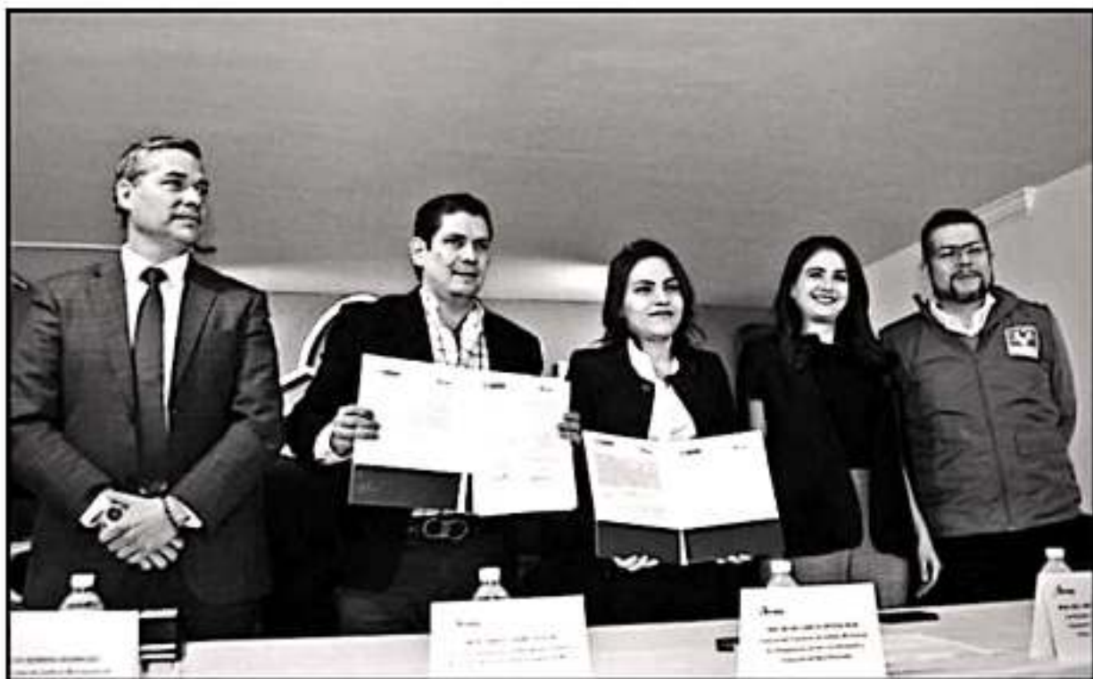
EL INSTITUTO MICHOACANO DE ACCESO A LA INFORMACIÓN Y EL PARTIDO VERDE ECOLÓGICO DE MÉXICO FIRMARON UN CONVENIO EN MATERIA DE CAPACITACIÓN.

"Va más allá de la transparencia, tiene que ver con la democracia, que por algún tema son sujetos obligados. Es darle a conocer a la ciudadanía del tema de transparencia; de los 7 partidos te-