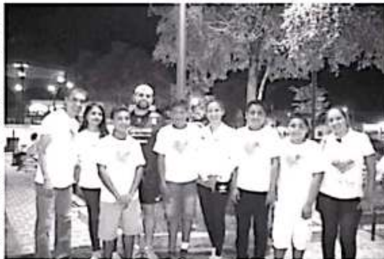
No se debe hablar de austeridad ni escatimar los recursos en los medicamentos para salvar la vida de las y los niños con cáncer como ha estado sucediendo lamentablemente en nuestro país.

Octavio Ocampo recordó que comprometido con la lucha contra el cáncer, hace unos días presentó un punto de acuerdo para exhortar al Gobierno Federal en que se