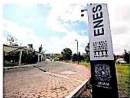
Se piden también cursos con perspectiva de género para docentes y administrativos. (RODRIGO LEÓN)

Por ese medio también se comentó que la directora hizo entrega de un documento