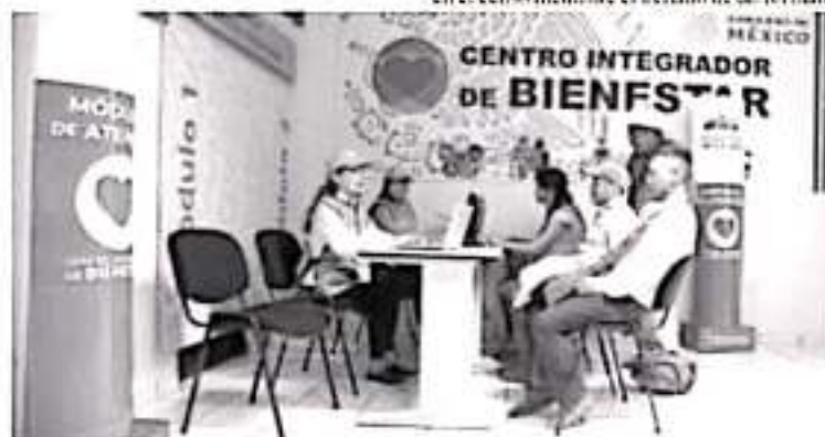
La principal percepción es que falta mucho por difundir en cuanto a las reglas de operación, pues la gente desconoce requerimientos y también que solo pueden recibir un programa.

Rivera Camacho, expuso que cualquier ciudadano que quiera conocer más de los programas puede acudir a los centros, ahí se está tratando de complementar lo que se hizo en el censo mediante el llenado de un formato