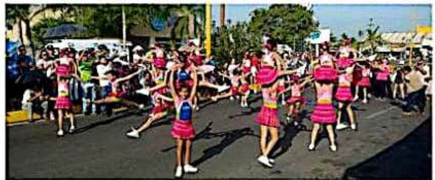
Tras el acto cívico, se dio paso al tradicional desfile en el que se contó con la participación de escuelas de nivel primaria, secundaria, medio superior y superior.

No obstante, dijo que una vez concretada la paz, y con la Constitución como norma, el régimen de la Revolución restituyó el dominio directo de la nación sobre sus recursos naturales, repartió la tierra, estableció las garantías sociales, nacionali- ➤ 6