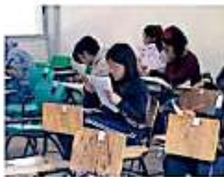
Al momento no hay viabilidad financiera para cubrir adeudos.

Transcurrido que, si bien el bono venía siendo cubierto por el estado, actualmente está dentro del sistema financiero que se encuentra en análisis de la federación,