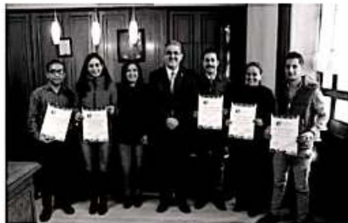
MORELIA, MICH.- La Secretaría de Contraloría de Michoacán (Secoem), avanza con pasos firmes en la profesionalización de su personal encargado de las auditorías.