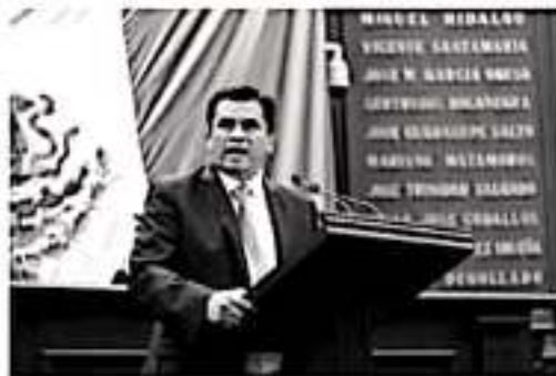
MORELIA, MICH.- El diputado Javier Estrada Cárdenas advirtió que el gobierno de Andrés Manuel López Obrador le ha dado la espalda a los michoacanos.

les, continuarán representando a los mexicanos como una oposición responsable, buscando siempre el bien común de todos los ciudadanos y sectores sociales.