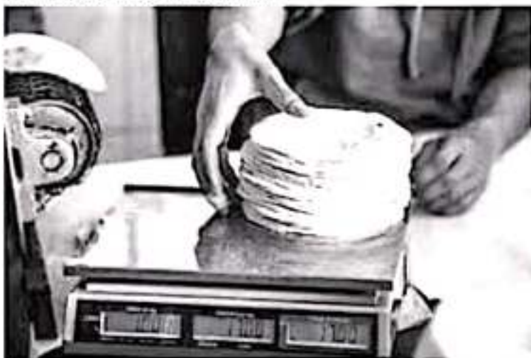
Aquellos industriales que le cargan la mano a los consumidores, es porque no revisan sus costos de producción, ni buscan la manera de cómo ahorrar para tener un mayor porcentaje de utilidad.

En este sentido, convenció a los que se dedican a esta actividad a ser sensibles y responsables de que los principales consumidores de este alimento son las personas de escasos recursos, y no se debe incrementar el costo sin analizar la situación, por el momento no hay riesgo de incremento, eso se vería ya a principios del año.