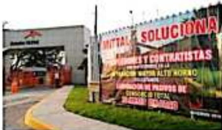
CD. LÁZARO CÁRDENAS, MICH.- Un grupo de proveedores se manifestaron la mañana de este miércoles en las afueras de empresa ArcelorMittal, en protesta al adeudo de al menos 30 millones de pesos.

Por lo anterior piden a la empresa ArcelorMittal, que en futuros proyectos que lleven a cabo, y que vengan empresas de fuera, que se apliquen cláusulas en sus contratos donde se consideren fondos para finiquitar adeudos, descartando así este tipo de problemática con proveedores y prestadores de servicios.