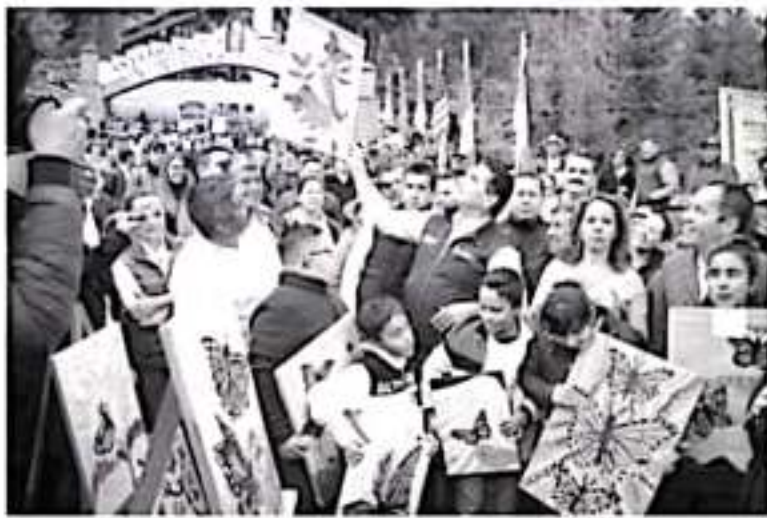
La Mariposa Monarca es un atractivo extraordinario para atraer turistas, aunque los atributos de esta zona del estado son muchos más y vamos a seguir trabajando para que la afluencia turística no sea sólo estacional”, comentó el Gobernador.

Las acciones que emprende el Gobierno de Michoacán en esta zona, contemplan también el cuidado ambiental, el abatimiento de la tala clandestina, la capacitación del capital humano y la puesta en marcha de la Policía Turística, explicó el mandatario estatal, quien hizo entrega de uniformes a esta corporación encargada de vigilar y promover la hospitalidad de los michoacanos a miles de turistas que arriban a disfrutar del espectáculo natural que ofrece la Monarca.