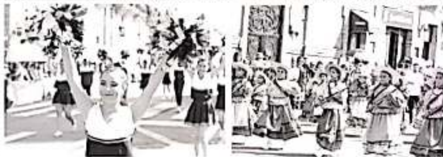
Con magna fiesta deportiva celebra Michoacán 109 aniversario de la Revolución Mexicana.

El talento, disciplina y habilidad deportiva de las y los michoacanos fueron los protagonistas del Desfile Cívico-Deportivo conmemorativo al 109 aniversario del inicio de la Revolución Mexicana, que se realizó, sin incidencias, en la capital de Michoacán.