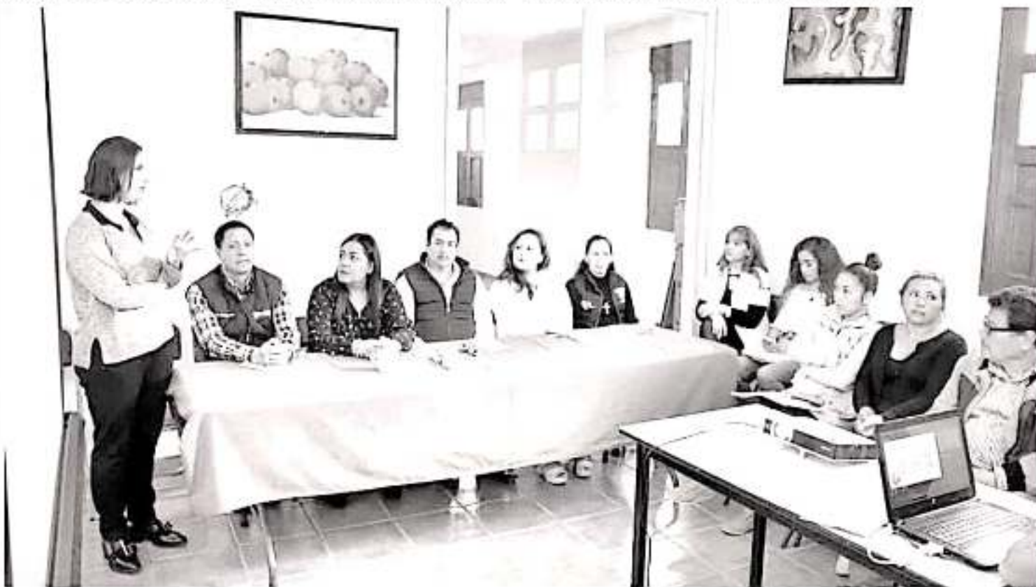
Las IMM, son espacios donde se cuenta con personal especializado que trabaja en la prevención y atención de violencia de género

Las IMM, son espacios donde se cuenta con personal especializado que trabaja en la prevención y atención de violencia de género, además son un vínculo con la Seimujer para que puedan acceder a los programas de empoderamiento económico y de capacitación en el trabajo.