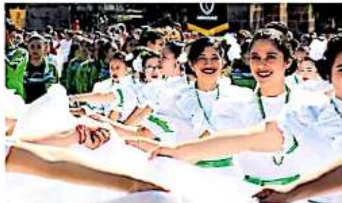
El recorrido del total de contingentes duró dos horas

"Vayanse a dar la vuelta hasta allá, por aquí no pasa nadie a menos que tengan acreditación", señalaban los futuros policías a los peatones que intentaban ingresar al Centro Histórico por la calle Benito Juárez que se abrió a un costado de Palacio de Gobierno. Altanería, insultos de ida y vuelta, reclamos, argumentos ciudadanos,