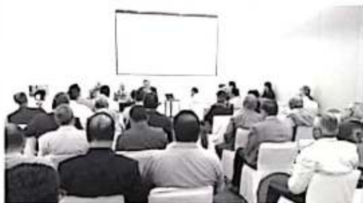
Los jueces como la pieza clave para las competencias de charrería fue el principal tema que se abordó en el Simposio Nacional de Jueces Charros en el marco del LXXV Congreso y Campeonato Nacional Charro.

En el marco de este encuentro, los jueces determinaron que el próximo Seminario Nacional de Jueces, se lleve a cabo los días 21 y 22 de enero en La Piedad, Michoacán, donde el tema central será la importancia del examen médico, tanto para competidores como para jueces.