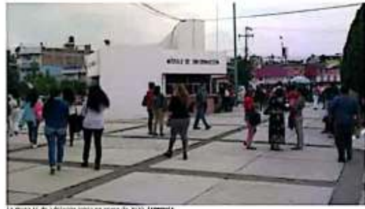
La etapa 15 de jubilación inicia en enero de 2020. MINORÍA