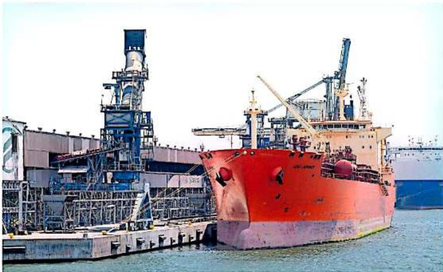
Para el mes de diciembre se prepara la presentación de un plan de acción conjunto de lo que será la plataforma portuaria Asia-Pacífico más importante de México.