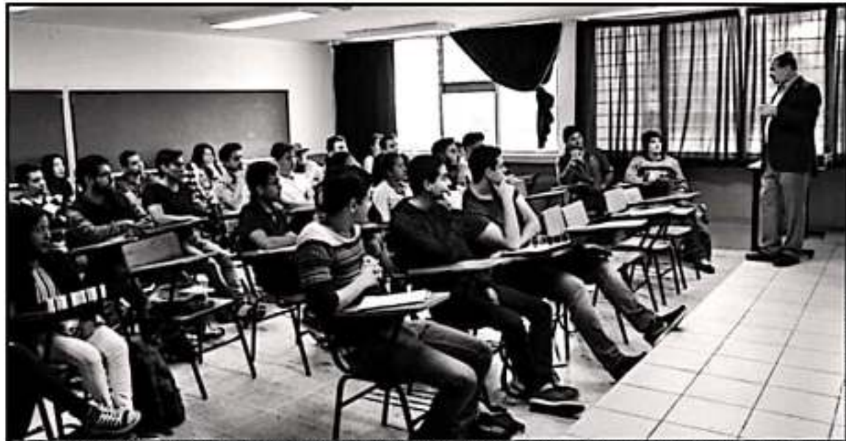
LA CONSTANTE CRISIS FINANCIERA QUE VIVE LA UNIVERSIDAD MICHOACANA GENERA DUDAS EN EL PAGO DE LA PENSIÓN PARA LOS PROFESORES QUE SE RETIRAN.

A pesar de la falta de pago, dijo que no se tiene que paralizar la Universidad Michoacana, "señalamos que se tiene que estar trabajando y tenerla de puertas abiertas, es el balance que tenemos desde hace varios años, ya que consideramos que