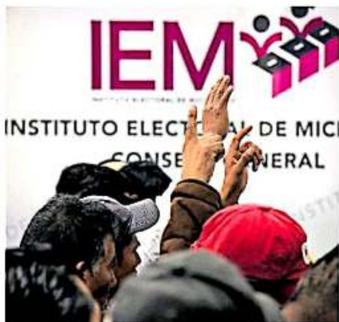
De acuerdo con información del INE se seleccionó a los perfiles que obtuvieron una puntuación igual o mayor a seis.