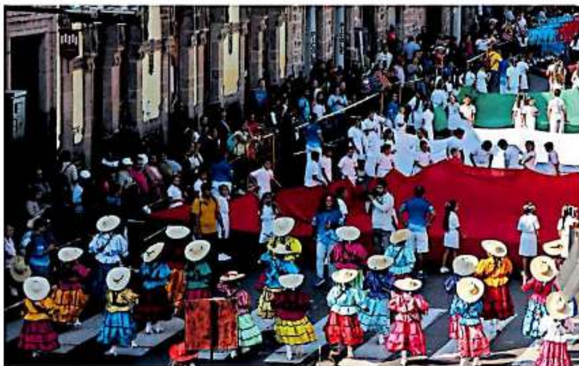
El desfile significó dos horas de cotarida y exhibición de bailables revolucionarios