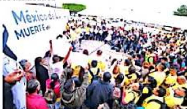
MORELIA, MICH.- Ante el abelisco al general Lázaro Cárdenas del Río, los presidentes municipales emanados del PRD de Michoacán, protestaron en contra de la política económica federal.