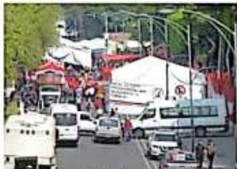
Los bloqueos han impedido que los diputados dejen el Presupuesto de Egresos de la Federación.

La Mesa Directiva de la Cámara de Senadores autorizó a los diputados federales para que suspendan sus sesiones ordinarias por más de tres días.