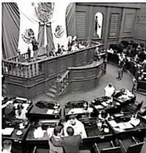
Aspecto de una sesión en el Congreso del Estado.

«Los tiempos han cambiado, quizá antes no pasaba nada, han cambiado las cosas, hoy vemos que se está actuando por parte de