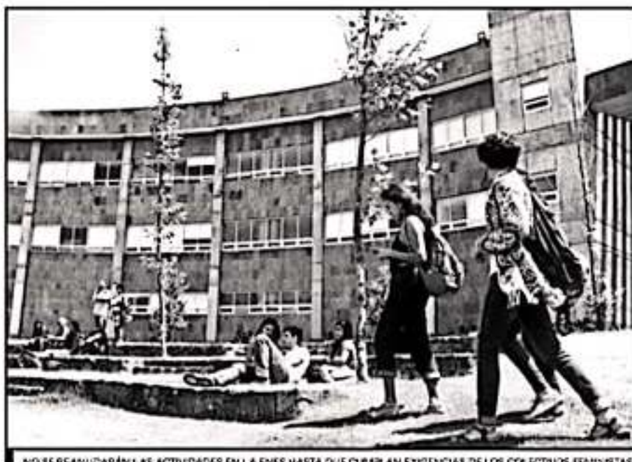
NO SE REANUDARÁN LAS ACTIVIDADES EN LA ENES HASTA QUE CUMPLAN EXIGENCIAS DE LOS COLECTIVOS FEMINISTAS.

tras la toma, debe haber la reposición del tiempo de cursos e investigaciones activas, siendo equivalente a la duración del paro y enfatizan que "el tiempo académico perdido será debido a la incompetencia de la institución al cumplimiento de necesidades".