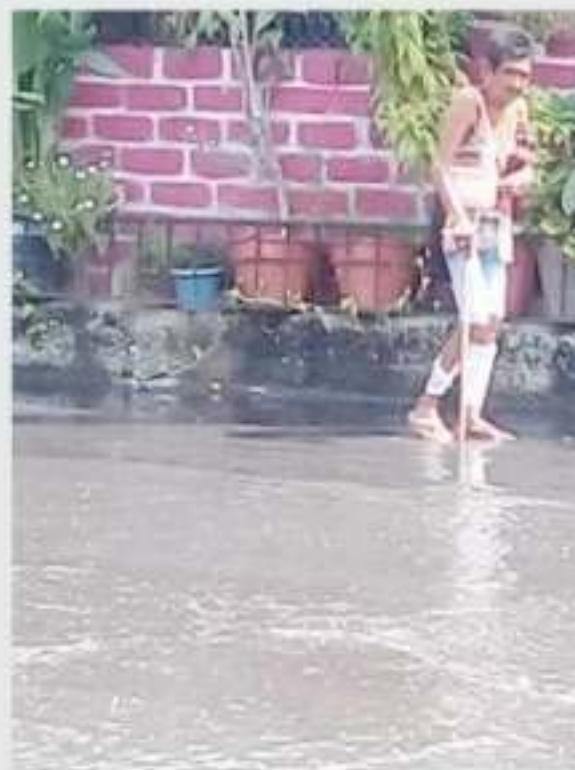
CD. LÁZARO CÁRDENAS, MICH. - Habitante de la zona afectada por la epidemia tropical "Priscilla", denuncia una fuga de aguas negras sobre la avenida Naval Militar, con la cual se ha formado una laguna que provoca la proliferación del mosquito que transmite dengue, zika y chikungunya.

Cabe destacar que problemas como éste, se tienen en diferentes puntos de la ciudad, pues la red sanitaria de todo el municipio ya es obsoleta, y no resistió las fuertes cantidades de agua que se acumularon por las torrenciales lluvias de las tormentas tropicales que azotaron al municipio, y por lo que es necesario que la autoridad municipal tome cartas en esta problemática.