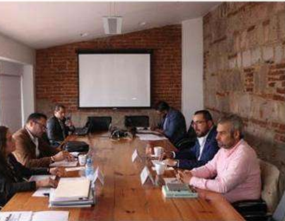
Reunión de la Comisión de Seguridad Pública y Protección Civil del Congreso del Estado con la titular del Ejecutivo del Sistema Estatal de Seguridad Pública.