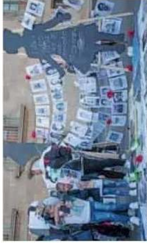
La CNDH ha detectado graves violaciones a los derechos humanos que deben ser atendidas para evitar que se repitan.

En específico, sobre las recomendaciones por violaciones