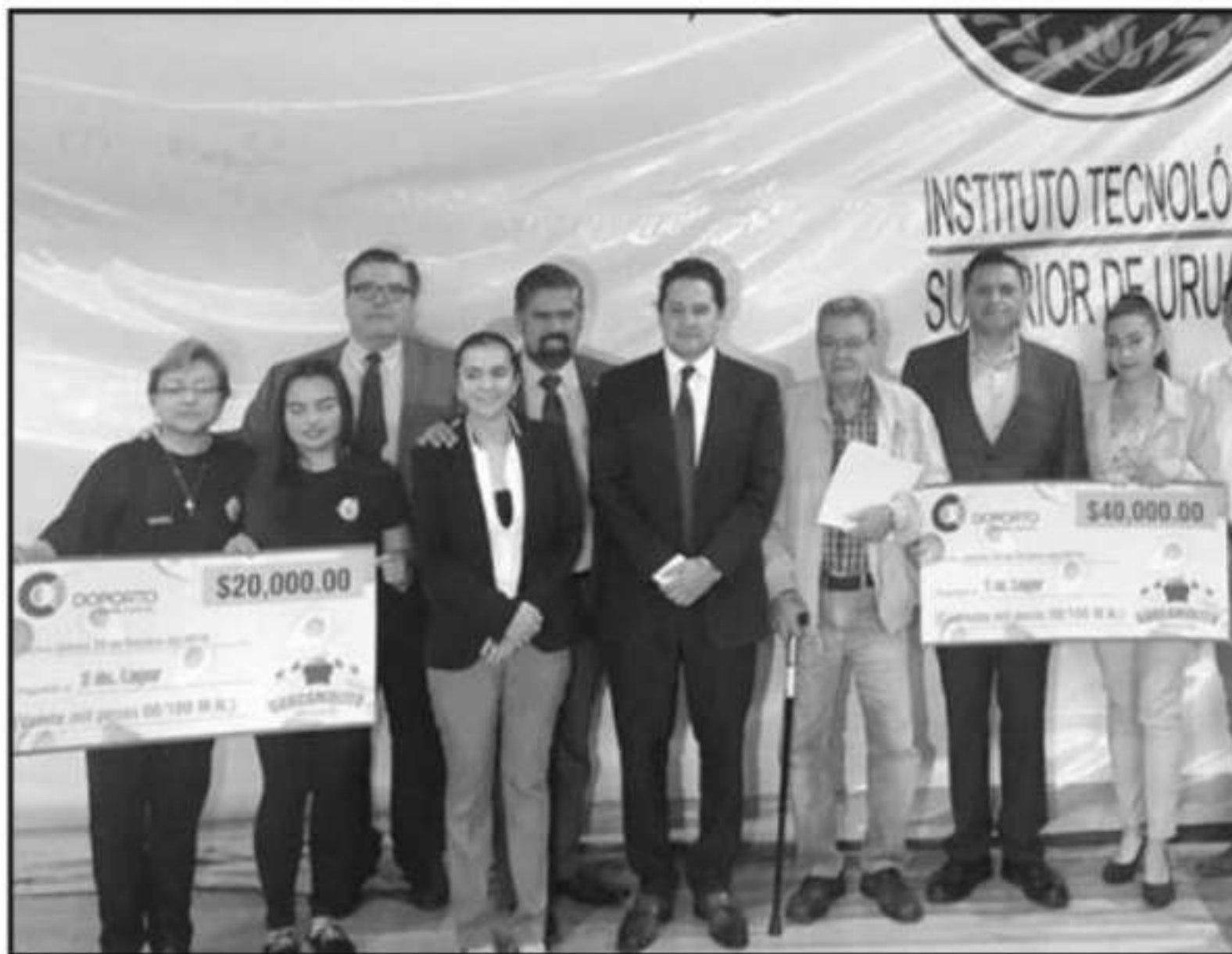
AUTORIDADES EDUCATIVAS Y REPRESENTANTES DE LA INICIATIVA PRIVADA PREMIARON A LOS TRES GANADORES DEL PRIM