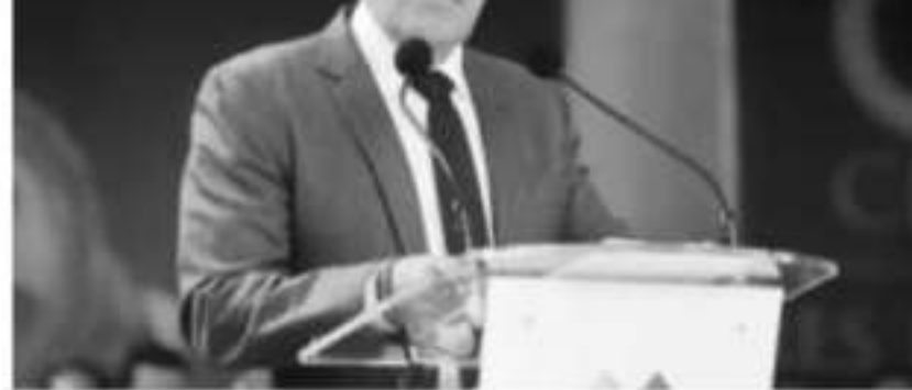
MORELIA, MICH.- El Gobierno de Michoacán reitera su disposición para s con la Federación, dentro del marco legal, en la atención de deman normalistas.

Reiteró que las puertas de la Secretaría de Gobierno estarán abiertas para dialogar con los estudiantes y con ello poder transitar a una nueva etapa en la formación de docentes.