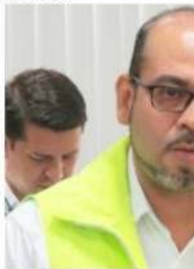
CD. LÁZARO CÁRDENAS, MICH. - Habitante de la zona afectada por la epidemia tropical "Priscilla", ocho brigadas de saneamiento básico, informadas por el Jefe de la Brigada de Saneamiento Básico, Informa y Educación, García Delgadillo.

recomendó reforzar las va contra la influenza, que ya de Salud.