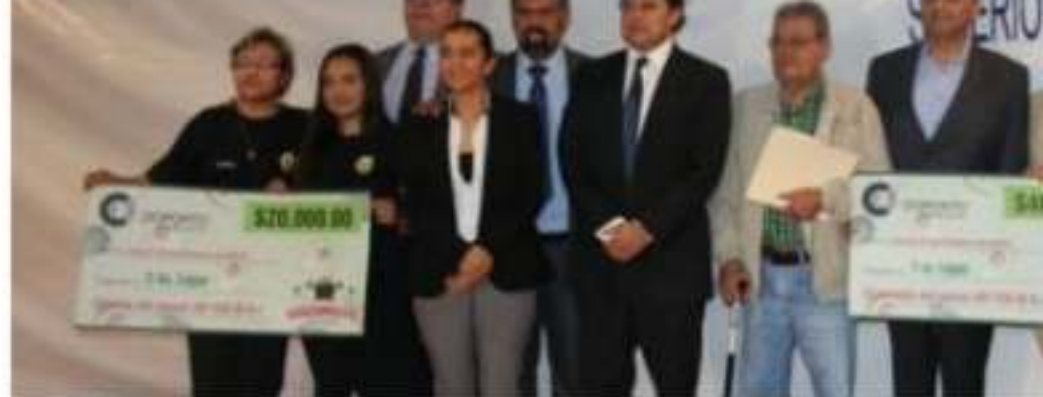
URUAPAN, MICH.- Jóvenes estudiantes del Instituto Tecnológico Superior de Uruapan recibieron el premio por sus mejores proyectos para transformar y aprovechar los desechos del aguacate, que participaron en el Primer Gran Reto Agroindustria Pr1me Capital 2019.

ue es lamentable las expectativas del tiene a nivel nacional, esperando que estre señales de confianza al exterior ctivar las inversiones necesarias para empleos y estabilidad.