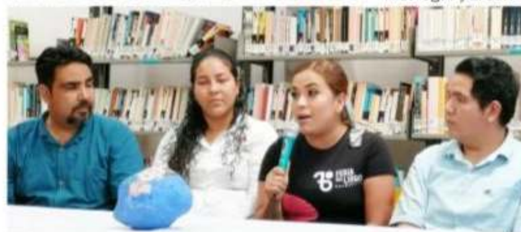
APATZINGÁN, MICH.- Representantes de cinco colectivos culturales informan sobre el Segundo Circuito de Ferias del Libro por la Paz y la Esperanza, próximas a llevarse a cabo en cinco municipios de Michoacán y el año próximo, en Nicaragua y El Salvador.

en Gabriel Zamora, Buenavista, 19 y 20 del 22 de noviembre en Apatzingán. Uriel, cultural y líder del evento, expuso que habrán ponentes de la UMich y contará con la presencia de Cárdenas, Ario de Rosales. Detalló que la feria del Libro por la Paz y la Esperanza es un Festival de Rock con el apoyo de 7 bandas de dicho estado. Asimismo informó que el evento por la Paz y la Esperanza es un evento internacional, pues se realizará en Nicaragua y El Salvador.