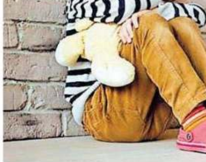
La violación sexual a niños y niñas se castiga de 10