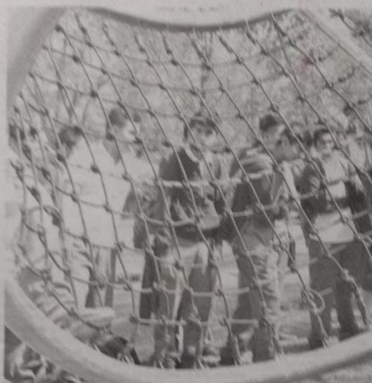
Fiesta de las Ciencias y las Humanidades en UNAM Morelia una oportunidad para estimular vocaciones.

De ocita al de ocita mos. de los ngos des. y las mon- eval- a se ce lo gual-