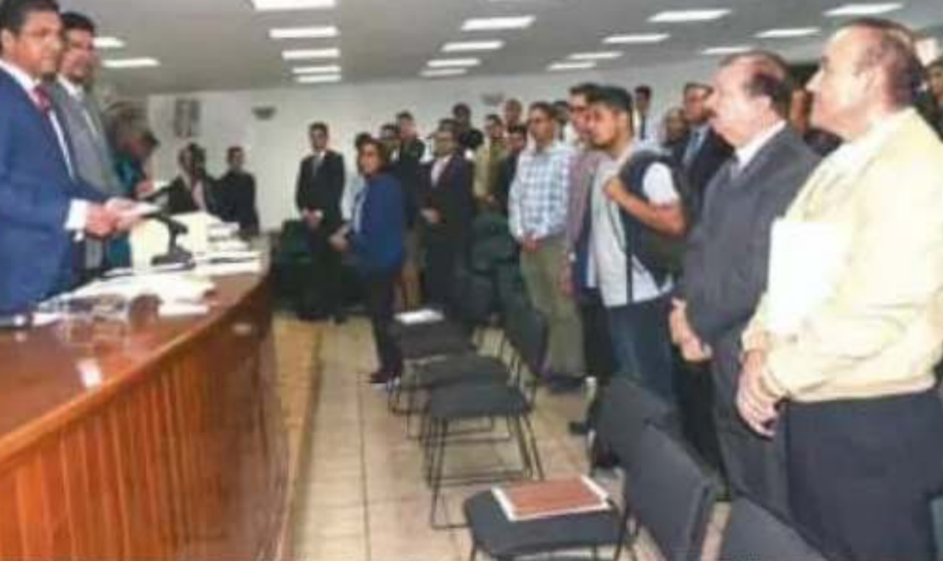
Consejo Universitario aprobó la compactación y disminución de direcciones y subdirecciones en la UMSNH.