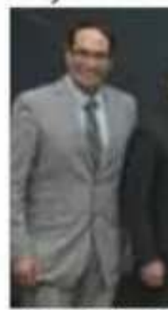
Los organizadores de los espacios del Centro