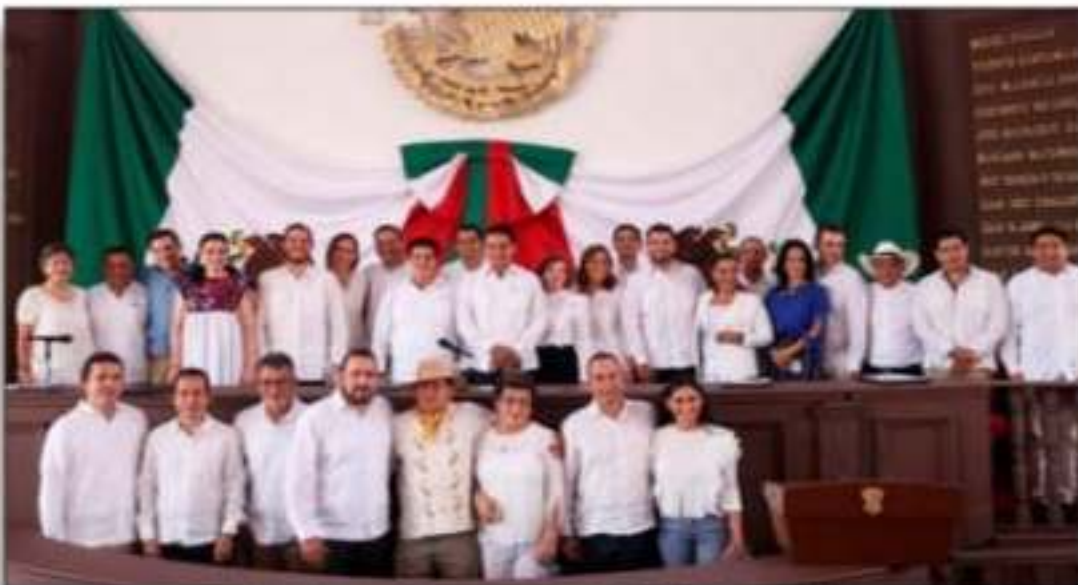
Conmemoran CCV aniversario de la Constitución de 1814.

y a últimas fechas se ha unido a un grupo de alcaldes de Tierra Cliente que desde hace varios meses le están pidiendo apoyo al presidente Andrés Manuel López Obrador para sacar adelante a esa región. Órale pues.... Y YA QUE TOCAMOS el tema de alcaldes, pues definitivamente que en los sucesos de los últimos días, otra noticia que jaló los reflectores fue el hecho de que el martes en Palacio Nacional , en la puerta Mariana , varios alcaldes del país fueron rociados con gas lacrimógeno . Al respecto, en la entrevista mañanera y al preguntársele por esa decisión que tomó su gobierno de lanzar gas lacrimógeno a los alcaldes, el presidente Andrés Manuel López Obrador señaló que eso se hizo porque estaban muy agresivos y que los encargados de la puerta, “sintieron que había una amenaza de que entraran por la fuerza, que iban a ser rebasados” . Dijo el presidente que fue “muy lamentable, querían meterse por la puerta, no se comportaron de manera correcta, les gana mucho el ansia opositora, la desesperación” . Incluso afirmó que en el presupuesto para el próximo año no hay recorte para las alcaldías, pues es lo que establece la ley, “nosotros no podemos transferir menos recursos que lo que establece la Ley de Coordinación