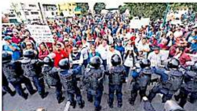
Los trabajadores llevaron a cabo varias protestas como huelga.