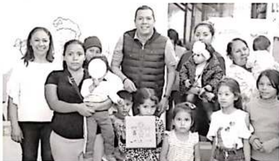
Continúa la atención a niños y niñas de Morelia a través de «Alimentando sus Sonrisas».

dos, en condiciones de vulnerabilidad, ubicados en zonas indígenas, rurales y urbanas de alto y muy alto grado de marginación y