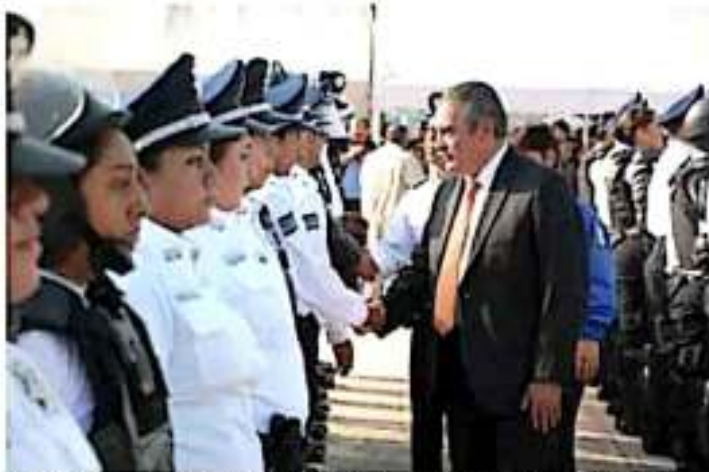
El presidente municipal Raúl Morón en que desea coadyuvarse bajo los valores de la Guardia Nacional. (COMETIA)

Agregó que hay una gran incidencia delictiva que nos ha alcanzado en Morelia; "nosotros tenemos el compromiso de salvaguardar la seguridad de las y los morelianos y