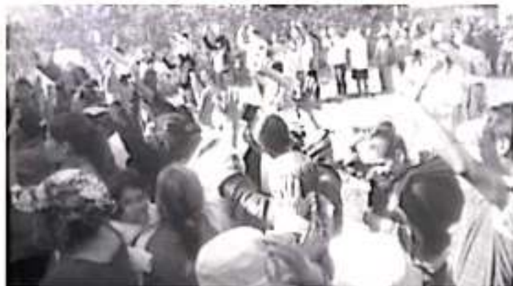
A este lugar han acudido mujeres que abandonan junto con sus hijos su casa, llegan sin ningún documento, sin ropa, ya saben que en este lugar las pueden ayudar.