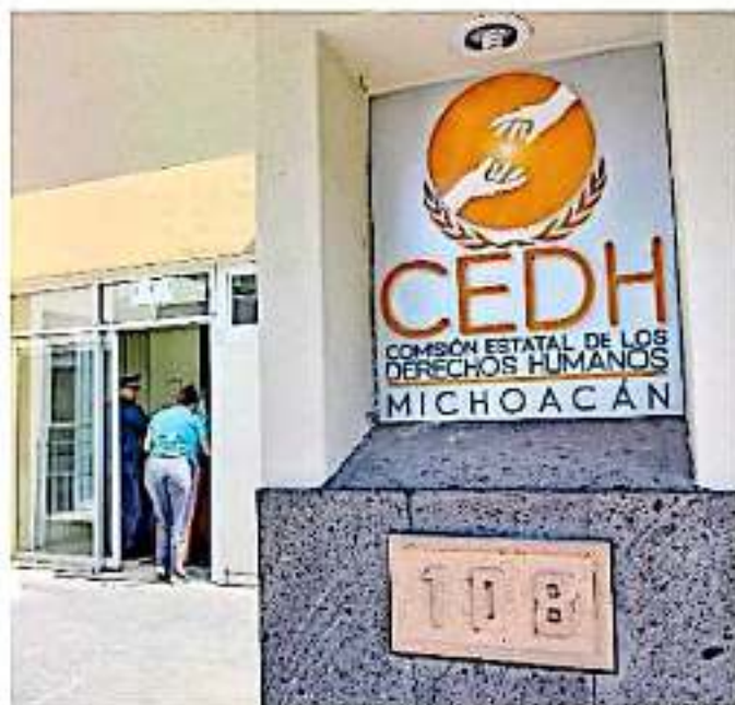
Los legisladores depuraron el registro de los aspirantes a puerta cerrada.