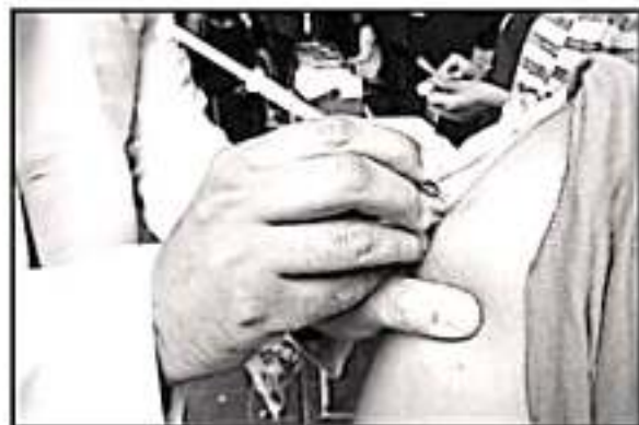
ESTE MES INICIÓ LA CAMPAÑA DE VACUNACIÓN CONTRA LA INFLUENZA, CON LA CUAL ESPERAN CUBRIR MÁS DE 600 MIL CASOS EN TODA LA ENTIDAD.