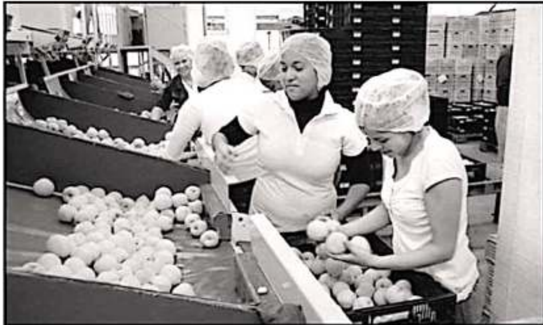
MICHOACÁN LA VOZ DE MICHOACÁN

EL COLEGIO DE ECONOMISTAS SEÑALA QUE EN MICHOACÁN CONTINÚA LA PRECARIZACIÓN LABORAL Y SALARIAL.