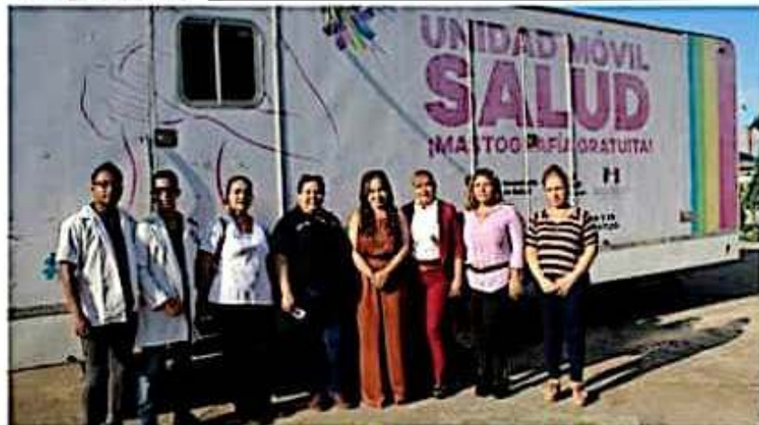
Gobierno municipal destaca la importancia de que las mujeres puedan detectar a tiempo el cáncer de mama.

La funcionaria, quien señaló que los resultados se entregarán en la JSN8, informó que el mastógrafo arribará del dos al cuatro de diciembre al Hospital General; el cinco y seis al municipio de Aquila; el siete a la colonia Flor de Abris; el 10 a la comunidad de Chucuttán; y del 11 al 13 a las tenencias de El Habillal, La Mira y Playa Azul, respectivamente.