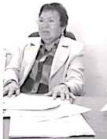
El CODI es una forma de cobro digital que hará uso del Sistema de Pagos Electrónicos Interbancarios (SPEI), ya se aplica y permite realizar su cuestión de segundos pagos electrónicos a través de internet o la banca móvil.

Consideró importante que todos los ciudadanos se informen, mucho más los que tienen un negocio o venden algún producto, pues les resultará imposible vender si no están registrados en la plataforma. Ante este panorama, aseguró que la organización a su cargo buscará la forma de llevar a cabo reuniones públicas con personas que puedan despejar todas las dudas que existan. Se buscará un espacio público para esta actividad, ya sea el Auditorio Municipal o cualquier otro que reúna las condiciones que se necesitan.