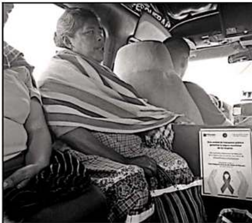
PÁTZCUARO CLINETA CON EL PROGRAMA DE MOVILIDAD SEGURA PARA MUJERES, COMO PARTE DE LAS MEDIDAS.

"Por eso la trascendencia del foro que hoy realizamos en la Casa de la Cultura, nombrado Los retos del acceso a la justicia para las mujeres, impulsado a