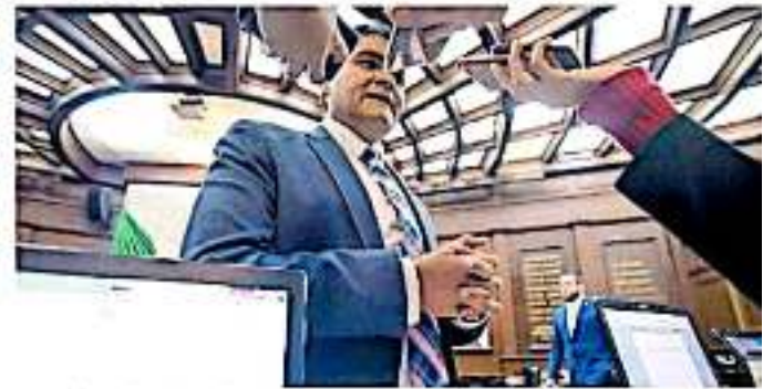
Ante las reducciones lo que queda es buscar nuevas estrategias / ANED HERNÁNDEZ

Hernández Vázquez adelantó que la bancada del Partido Acción Nacional (PAN) rebazará la propuesta de nuevos gravámenes y la valoración al documento serán un base a las posibilidades presu-