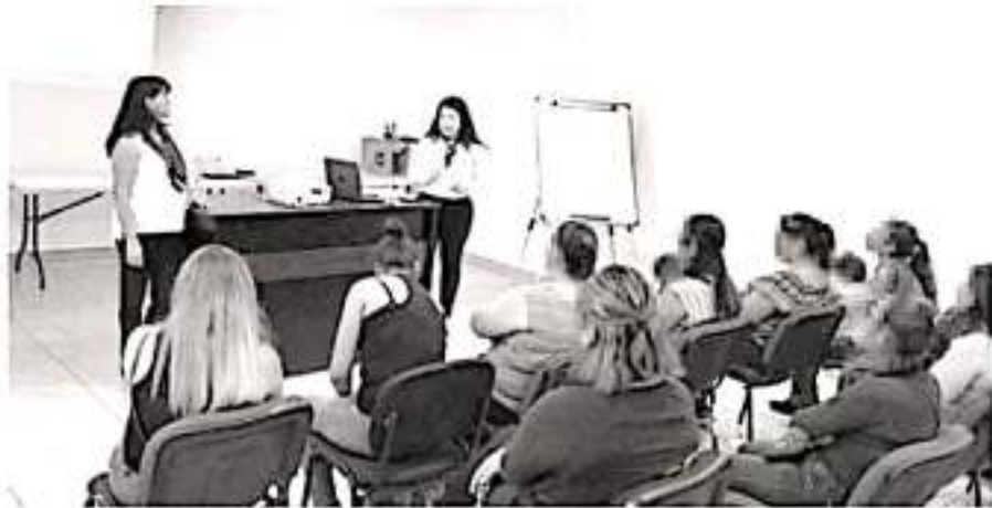
Las medidas de protección son mecanismos que la ley contempla y autoriza para imponerse durante la investigación de un caso y así generar las condiciones adecuadas para asegurar la integridad física de las víctimas.

La FGE refrenda su compromiso de perseguir todo acto que atente contra la integridad de las mujeres michoacanas.