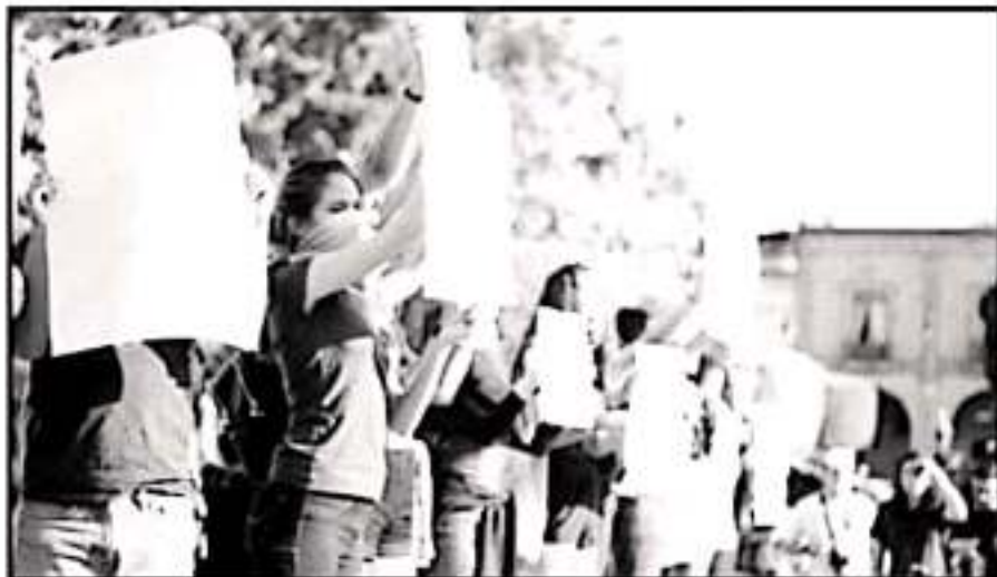
MUJERES PIDEN MAYOR PROTECCIÓN POR PARTE DE AUTORIDADES, PARA QUE PUEDAN CAMINAR LIBREMENTE EN LA CALLE.