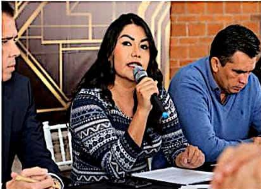
La coordinadora del GPPT planteó que se debe trabajar por un Michoacán para la gente, para los diferentes sectores, pero no para el Gobernador o el Congreso.