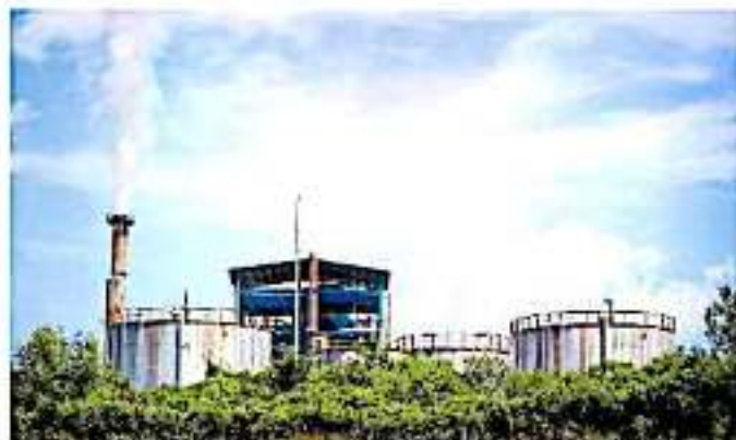
La propuesta será llevada este miércoles a la tribuna del Congreso. ANED/EN

De acuerdo con el planteamiento, este sistema estatal estaría previsto como uno de los instrumentos de la política ambiental contenidos en la Ley de Cambio Climático del estado donde se establece un inventario, un programa estatal de auditoría ambiental y programa equivalente, otro para la inspección basada en riesgos, así como para la restauración de ecosistemas en los proyectos sujetos a autorización de impacto ambiental, un programa estatal de fortalecimiento de capacidades y un fondo privado