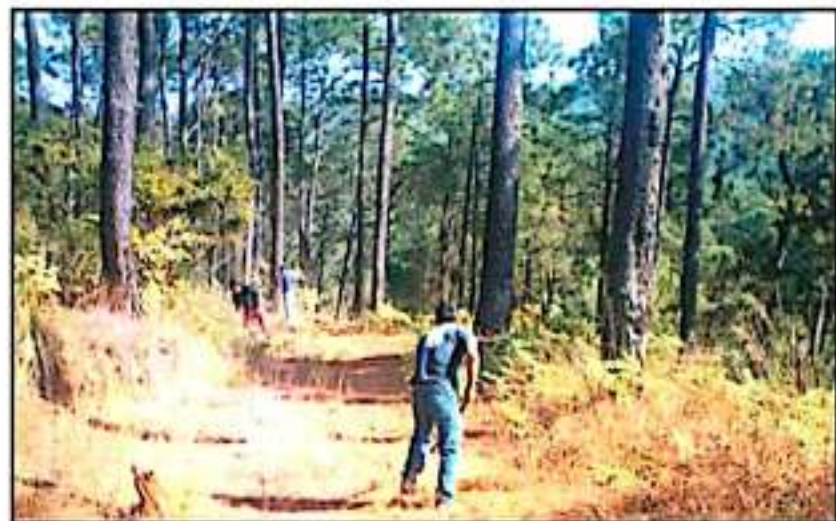
ANTE LAS ESCASAS LLUVIAS, INICIAN DESDE ANTES CON LAS LABORES PARA PREVENIR INCENDIOS FORESTALES.