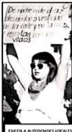
EXIGEN A AUTORIDADES LOCALES NO MINIMIZAR LOS CRIMENES

en Morelia se vive una violencia generalizada como el de otros puntos del país y que hay municipios del estado que enfrentan situaciones más adversas, no hay ninguna otra ciudad michoacana que forme parte de lista de las 100 urbes con mayor número de feminicidios durante este año 2019.