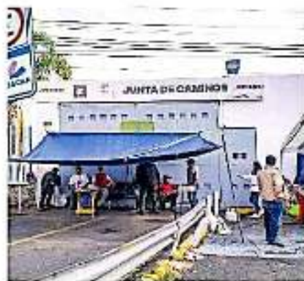
Personal de la Junta de Caminos afirma haber sido embargado por no cubrir adeudos.