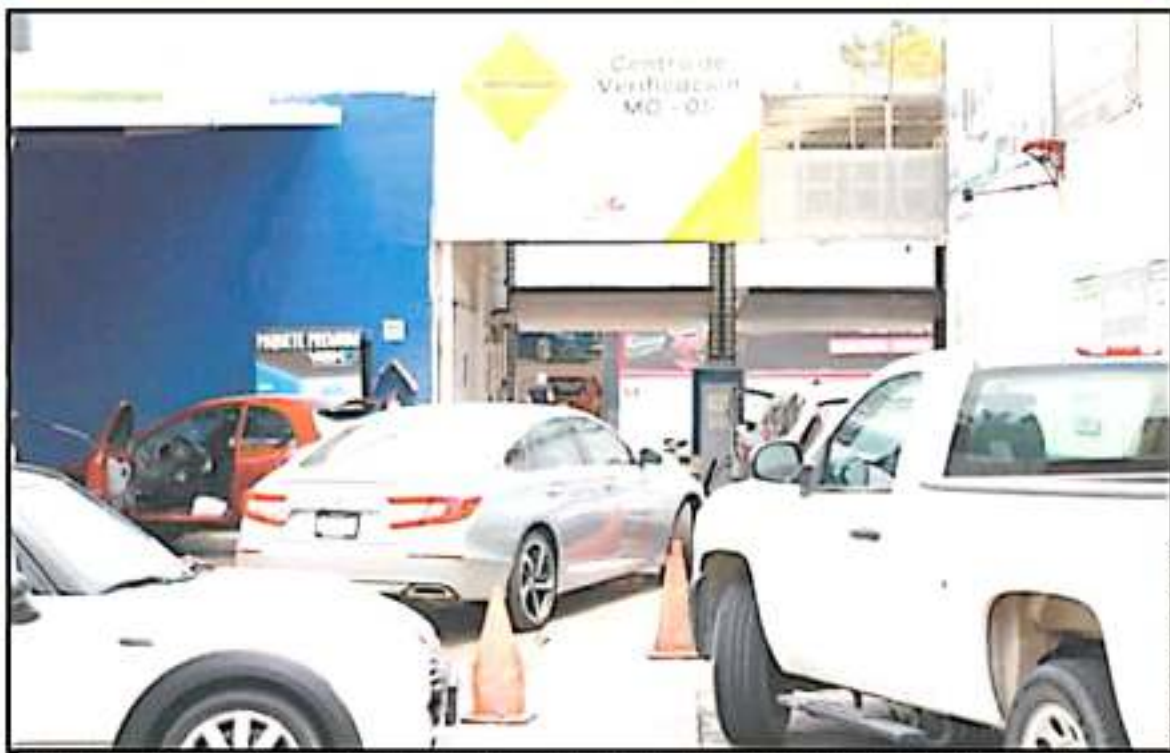
SON SIETE LOS VERIFICENTROS EN QUE SE PUEDE LLEVAR EL AUTOMÓVIL, AUNQUE UNA DE LAS QUEJAS CONSTANTES ES QUE PERMANECEN CERRADOS VARIOS DÍAS.

sería la multa por no portar holograma L