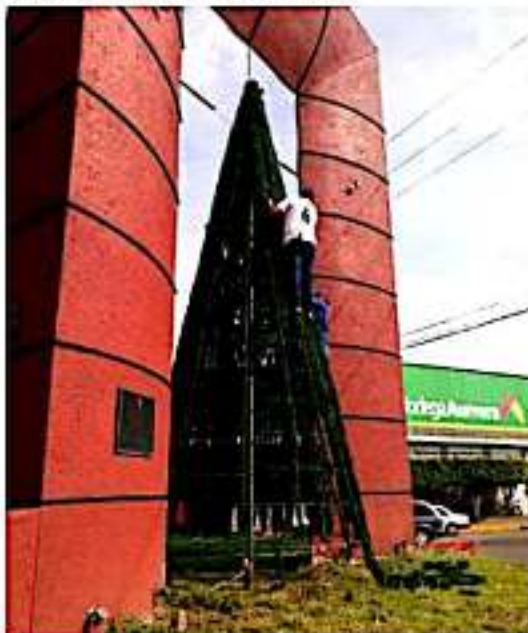
ZAMORA, MICH.- La Dirección de Obras Públicas inició la colocación de adornos navideños en la zona urbana.

El actual visitador ha ostentado el cargo en dos ocasiones al frente de la región Zamora, y una más en la región Morelia, por lo que conoce una importante parte de la entidad en el tema de los derechos humanos, tan solo en Zamora tiene a su cargo 34 municipios, que es la tercera parte del territorio michoacano.