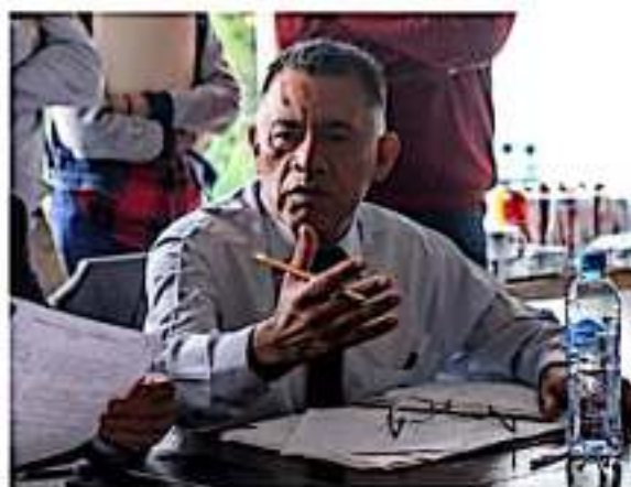
Interno del Instituto Electoral de Michoacán (IEM).