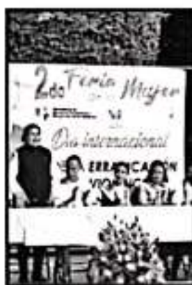
EN PURUÁNDIRO CONMEMORARON EL DÍA PARA ERRADICAR LA VIOLENCIA CONTRA LAS MUJERES.

Pátzcuaro fue el primer municipio en contar con un diagnóstico integral sobre la problemática de género, elaborado en colaboración con el Instituto Nacional de Ciencias Políticas y la Asociación Civil Comunidad Segura A.C., surgiendo posteriormente el Sistema Municipal para prevenir, Sancionar y Erradicar la Violencia contra las Mujeres por razones de Género. Desde su instalación se realizaron mejoras en la infraestructura como la de alumbrado público y la recuperación de espacios, el lanzamiento del programa movilidad segura para las Mujeres, al igual que el fomento para agrupamiento de las mujeres en sistemas de redes comunitarias, que a la fecha cuenta con más de 300 mujeres adscritas en distintas colonias señaladas con la existencia de esta problemática, entre otras acciones.