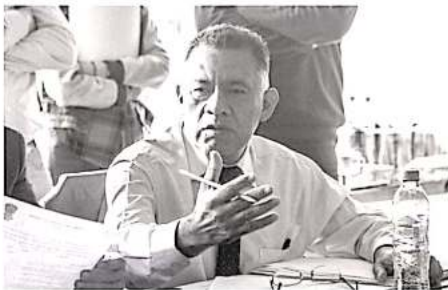
El diputado fija compromiso para sobrellevar pendientes en Comisión de Asuntos Electorales y Participación Ciudadana.

el cual recae la obligación de garantizar transparencia en la operatividad del Instituto. «La Comisión de Asuntos Electorales y Participación Ciudadana sesionó para analizar la