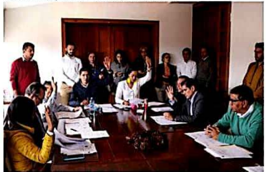
Diputados de la 74 Legislatura local, buscan dar certeza, transparencia y participación equitativa a los participantes para designar al nuevo titular de la CEDH.