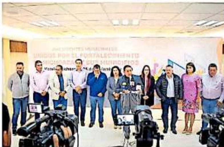
El alcalde de Uruapan anunció la realización de recorridos por los municipios.

Con relación al tema de recorte de personal y la reducción de salarios, se estima una reducción de entre un 12 a 20%, como