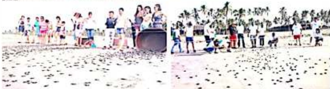
CD. LÁZARO CÁRDENAS, MICH.- El pasado fin de semana turistas de Morelia, Tzintzuntzan y Guanajuato participaron en la liberación de crías de tortuga en el Campamento Tortuguero El Habillal, sumando un promedio de 5 mil ejemplares de quelonio.