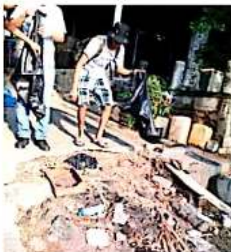
CD. LÁZARO CÁRDENAS, MICH.- Integrantes del Colectivo Azulita, en coordinación con personas voluntarias y pescadores, este fin de semana llevaron a cabo una campaña de limpieza sobre la ribera del Balsas.

En otro tema, Ramírez Galeana dio a conocer que en lo que va de la temporada se han resguardado 1500 nidos de quelonio, de los cuales 835 ya han eclosionado y se han liberado 69 mil 987 crías de tortuga.