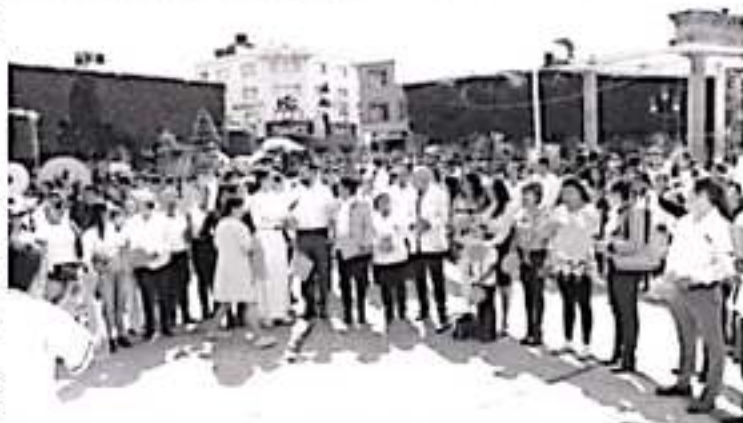
Autoridades municipales, estudiantes y agrupaciones, realizaron una serie de eventos con el objetivo de concientizar y promover el combate contra la violencia de género.