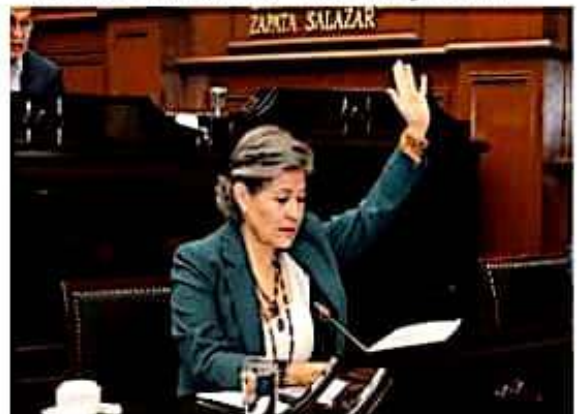
La diputada local presentó una iniciativa con Proyecto de Decreto para reformar los artículos 3° Fracción VI y 8° Fracción X de la Ley de Cambio Climático del Estado de Michoacán de Ocampo.

Previo, se había reconocido que ante las comodidades de las grandes tiendas o tiendas de cadena, una parte de clientes los han perdido a falta de lugar por estacionarse, de ahí que agradecieron el accionar de la autoridad en vialidad y del regidor, esperando recuperar algunos clientes o evitarles quedarse en otra cuadra o de plano realizar sus compras en otro lugar.