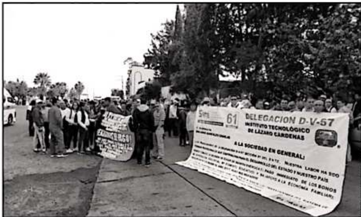
TRAS LA REUNIÓN CON LA SECRETARÍA DE GOBIERNO, LOS TRABAJADORES LOGRAN LA CALENDARIZACIÓN EN EL PAGO DE LOS BONOS QUE LES ADEUDAN

Reiteró que es importante el reconocimiento como prestaciones que están ligadas al tema salarial y no que se vean como bonos, "pues no es un dinero adicional, el origen de que los llamamos bonos es una prestación tras la descentralización educativa y