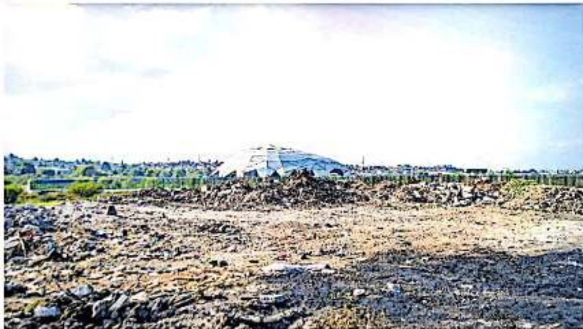
El ejido permanecía como un lote baldío hasta hace un año, cuando comenzaron a llegar camiones a tirar escombros.