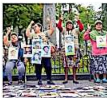
Buscan a personas de siete países, quienes

Verdad, justicia no repetición y reparación son los pedidos que reclaman las familias de los desaparecidos para poder cerrar ciclos de duelo y continuar sus vidas, mismas que