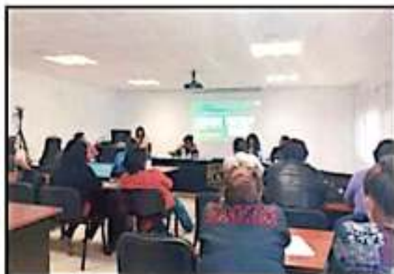
FUERON 14 INSTITUCIONES DE 4 PAÍSES LAS QUE PARTICIPARON EN LA NOVENA EDICIÓN DE ESTE COLOQUIO INTERNACIONAL SOBRE MIGRACIÓN.