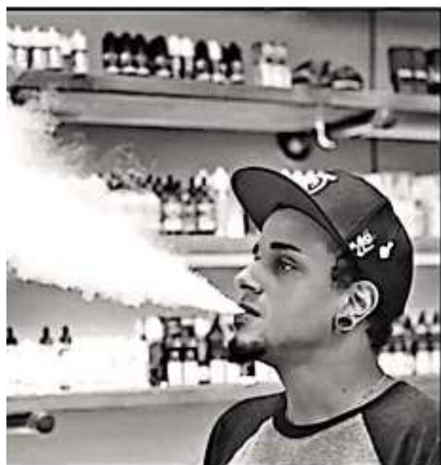
EL VAPOR DEL VAPEO ENTRA A LOS PULMONES A LOS 'INFILTRA', ENTRE OTRAS PROBLEMÁTICAS.

potencialmente dañinas como compuestos orgánicos volátiles, partículas finas, metales pesados como níquel, estaño, plomo, sustancias químicas cancerígenas, saborizantes como el diacetilo, sustancia química vinculada a enfermedad grave de los pulmones", se lee en la alerta emitida por la instancia federal.