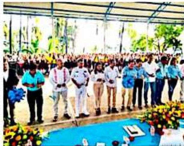
CD. LÁZARO CÁRDENAS, MICH.- Este martes en las instalaciones del Cetmar dio inicio el SEE-Orienta 2019, con la finalidad de orientar a un promedio de 6 mil jóvenes que cursan su educación secundaria y preparatoria.

Por último, recaló que para la administración municipal es una aspiración de orden superior contribuir en la medida de las posibilidades, a la formación de futuros ciudadanos y ciudadanas profesionistas, capaces de proponer soluciones transversales a la diversa problemática social existente.