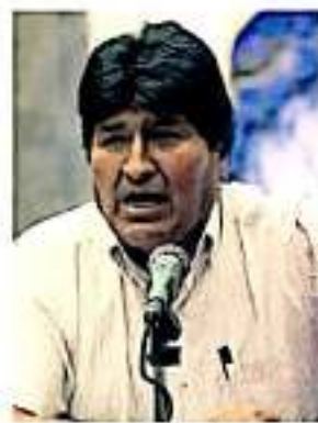
El expresidente de Bolivia podría venir al estado

Detalló el vocero del CSIM que la visita del expresidente de Bolivia a tierras michoacanas queda sujeta a algún movimiento político que requiera su presencia en el país se-