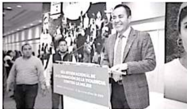
Carlos Herrera destacó que las mujeres son el pilar indispensable de la sociedad, por lo cual es necesario que se atienda la problemática y se sancione cualquier tipo de violencia en su contra.