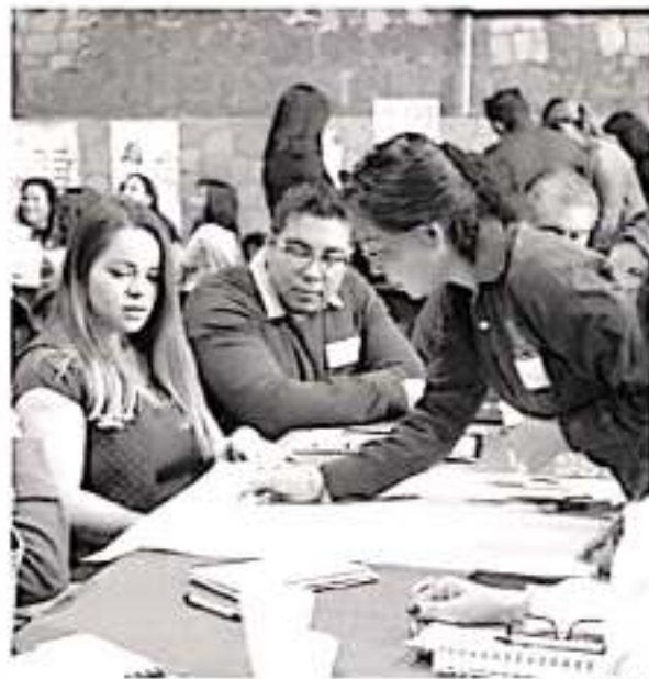
Más de 100 orientadores de todo el estado participan en el Décimo Foro de Orientadores Educativos de la UdeMorelia.

tadores participaron de mesas de trabajo en las cuales desarrollaron estrategias a implementar en sus aulas con el fin de ser un apoyo para los estudiantes próximos a elegir su carrera profesional.