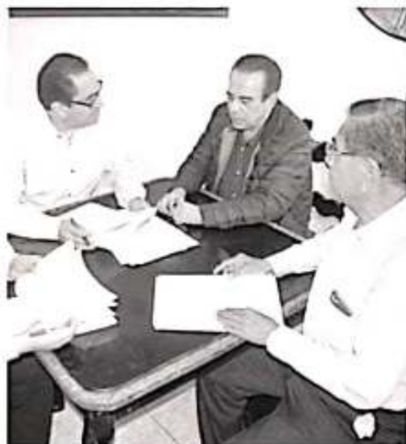
Los registros se realizarán en la Secretaría Ejecutiva de la CEDH en horario de 09:00 a 16:00 horas en donde deberán presentar solicitud por escrito.

Los registros se realizarán en la Secretaría Ejecutiva de la CEDH en horario de 09:00 a 16:00 horas en donde deberán presentar solicitud por escrito, acompañada de toda la documentación que avale el haberse distinguido por la constante y permanente lucha en la promoción, respeto y protección de los derechos humanos en el Estado de Michoacán.