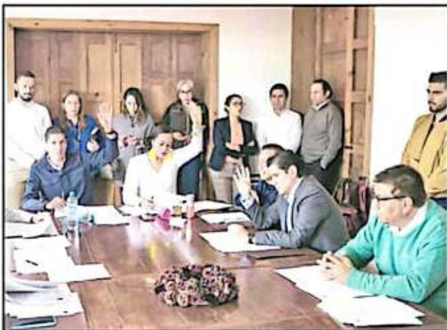
DIPUTADOS LOCALES ANALIZAN A FONDO CADA UNO DE LOS PERFILES DE LOS ASPIRANTES A DIRIGIR LA CEDH.