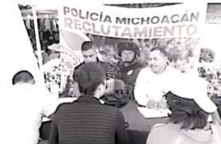
La atención es en un módulo, ubicado en la Plaza Benito Juárez, de lunes a viernes de las 9 a 17 horas.

Para recibir mayor información las y los interesados pueden presentarse en las instalaciones de la SSP, ubicadas en calle Tzucuko Gamero número 165, colonia Sentimientos de la Nación, en Morelia.