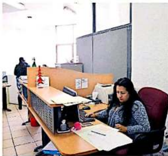
Cada 7 de 10 michoacanos están insertados en actividades en las que no tienen acceso a prestaciones laborales

Ante la reciente publicación de la Encuesta Nacional de Ocupación y Empleo del Instituto Nacional de Estadística y Geografía (INEGI), el economista Heliodoro Gil Corona desahó que la población ocupada monetariamente informal tanto en actividades propias productivas como asalariados o por honorarios, se concentran en el comercio, servicios, turismo y segmentos de la industria, así como en entidades