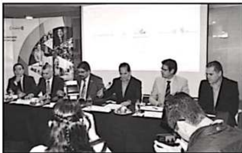
SEDECO Y NAFIN ANUNCIARON EL RELANZAMIENTO DEL PROGRAMA IMPULSO REGIONAL E INDUSTRIAL.