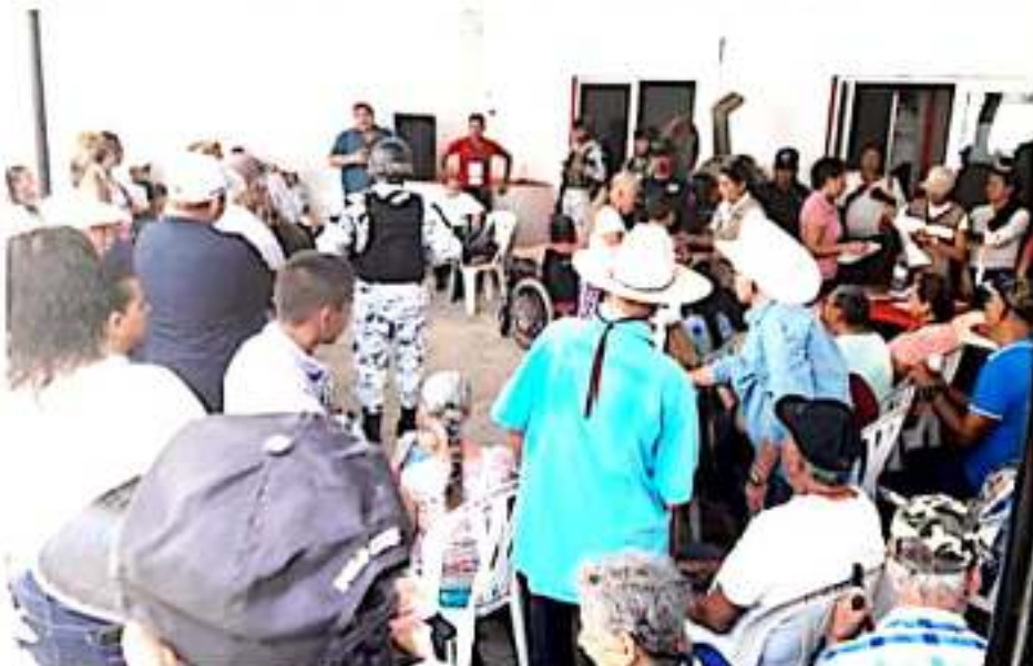
CD. LÁZARO CÁRDENAS, MICH.- La Secretaría del Bienestar, con el apoyo de la administración municipal, entregaron apoyos del Programa de Bienestar para las Personas Adultas Mayores y Bienestar de las Personas con Discapacidad en la comunidad de Chuquiapan y Caleta de Campos.

Asimismo, se informa que, para este jueves, se estará haciendo entrega de estos apoyos a las personas inscritas en el padrón en la tenencia de El Habillal a las 10:00 horas; el viernes 29 en la comunidad de Acaipican de Morelos a las