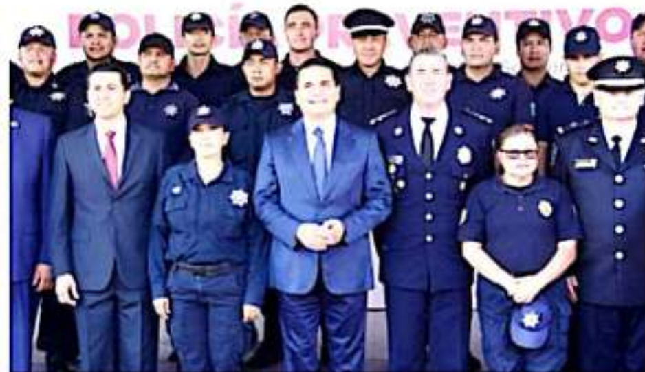
MORELIA, MICH.- El Instituto michoacano obtuvo las más altas calificaciones en los 12 distintos rubros que fueron evaluados por el Secretariado Ejecutivo Nacional de Seguridad Pública.

Actualmente, el instituto tiene en formación a más de 430 elementos policiales estatales, el 30 por ciento de los cuales, son mujeres; además, brinda cursos y formación de instructores a personal de otras entidades federativas.