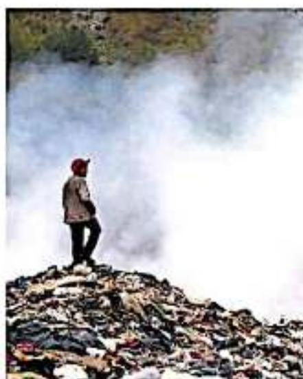
La constante quema de basura, ya ha ocasionado molestias a los vecinos de la colonia.

FUE el año en que se dio a conocer un Atlas de Riesgo de Morelia elaborado por dependencias estatales