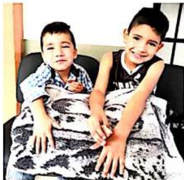
JACONA, MICH.- Se inició en este municipio una colecta de chamarras, suéteres, guantes, gorros, bufandas y cobijas nuevas o en buenas condiciones, para apoyar a sectores vulnerables.

Señaló que el maltrato a los menores puede ser tanto físico como mental y puede perjudicar su habilidad para aprender y socializar, perjudicando su desarrollo como adultos funcionales y a la postre buenos padres. Exhortó a los docentes a tener un ambiente sano dentro de las aulas y