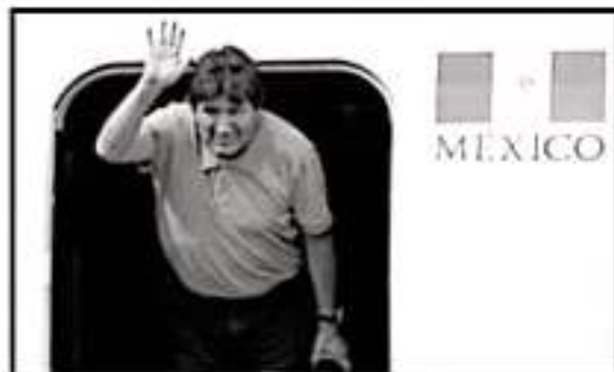
EL EXPRESIDENTE BOLIVIANO ACEPTÓ LA INVITACIÓN QUE EL CONSEJO INDÍGENA LE HIZO PARA QUE VISITARA EL ESTADO, SEGÚN CONFIRMARON