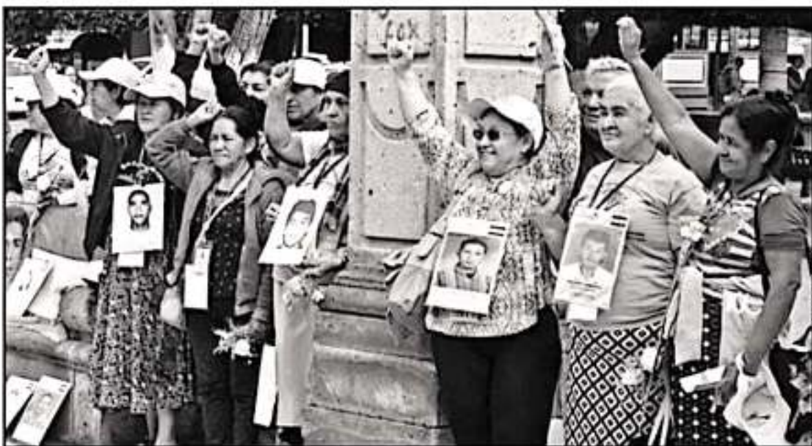
DECENAS DE MADRES CENTROAMERICANAS REDIRIGEN LAS PRINCIPALES RUTAS DE INMIGRACIÓN EN EL PAÍS, EN BÚSCA DE SUS HIJOS DESAPARECIDOS.

ción de la Guardia Nacional, la cual se encuentra dedicada para atender situaciones de migración indocumentada, lo que se ha reflejado en un mayor número de deportaciones.