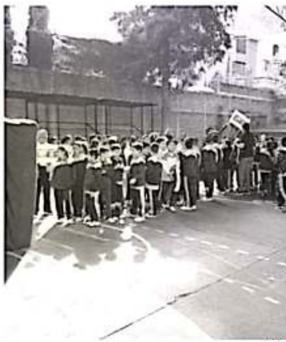
El consumo responsable del vital líquido es tarea de todas y todos, para preservar su existencia a futuro.

Añadió que con este objetivo, la dependencia a su cargo participa periódicamente en capacitaciones, talleres y Ferias del Agua, las cuales son desarrolladas en coordinación con los organismos operadores y los 90 Espacios de Cultura del Agua (ECA) que existen en 86 municipios del estado.