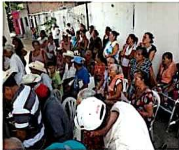
Desde ayer se inició con la entrega del programa de pensión para los adultos mayores.

Por lo que se refiere a la especie de mayor número de arribazones, (golfina) Lemus Alvarado comentó que a la fecha se han liberado casi 70 mil crías, por lo que se espera superar fácilmente la meta planteada al inicio de la temporada que es en el mes de julio, de poder lograr el nacimiento y liberación de 100 mil crías, pues todavía existen en incubación los nidos suficientes para alcanzar esa meta, además de que la arribazón de este tipo de ejemplares continúa todavía hasta el mes de diciembre.