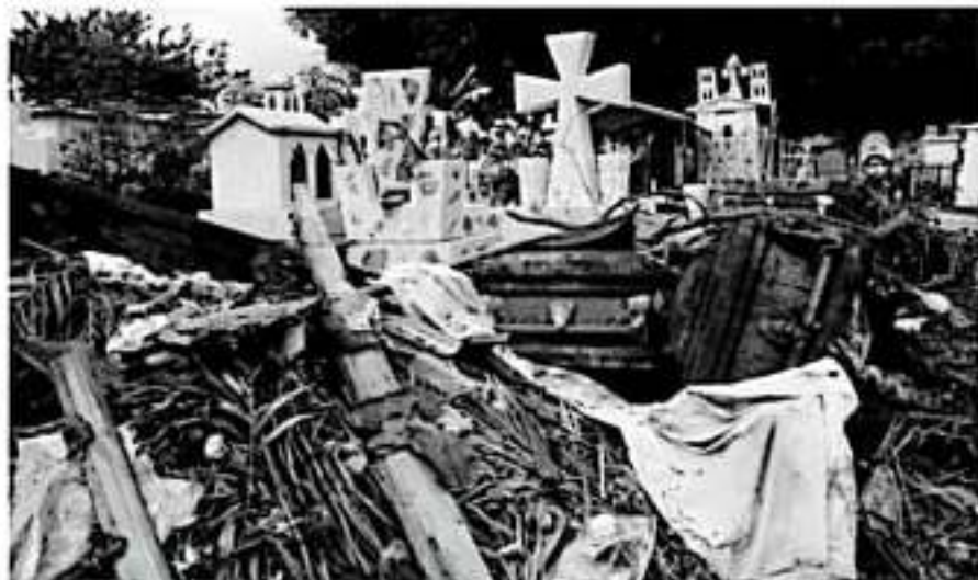
Fotografía ganadora con el título: Ni la muerte nos separa de la basura .

A decir de la comunicadora, el concurso la incentiva a continuar difundiendo mensajes en favor de la sociedad, en este caso en el tema ambiental.