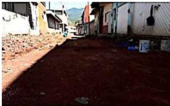
LOS REYES, MICH.- Avanza la pavimentación de la calle Ingenio La Joya, de la colonia La Providencia.

Precisó que independientemente de quien lo aplique, lo importante es que llegue recurso federal para obras y así beneficiar a más población; "esperamos el año que entra contar por lo menos reglas de operación; por lo pronto la Secretaría de Hacienda y Crédito Público abrió una plataforma, ya subimos proyectos por 80 millones de pesos para obras; ojalá que si no llega esa cantidad, por lo menos llegue algo", finalizó.