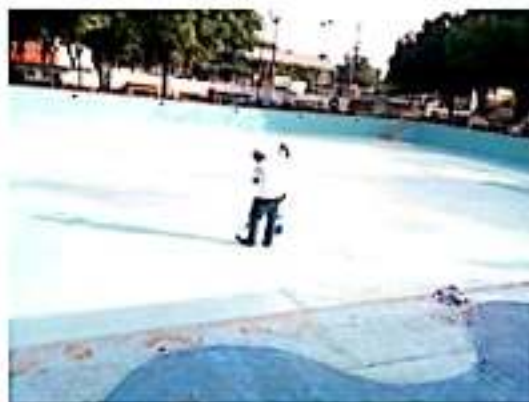
CD. LÁZARO CÁRDENAS, MICH.- Tras una década sin mantenimiento general, el próximo viernes 29 de noviembre se reabrirá la alberca de la unidad deportiva municipal.