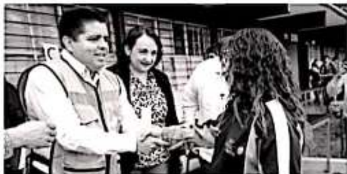
MORELIA, MICH.- La Secretaría de Bienestar, Delegación Michoacán, continúa la dispersión de Becas Benito Juárez en la entidad, con la entrega en un nuevo operativo, de nueve mil 899 apoyos.