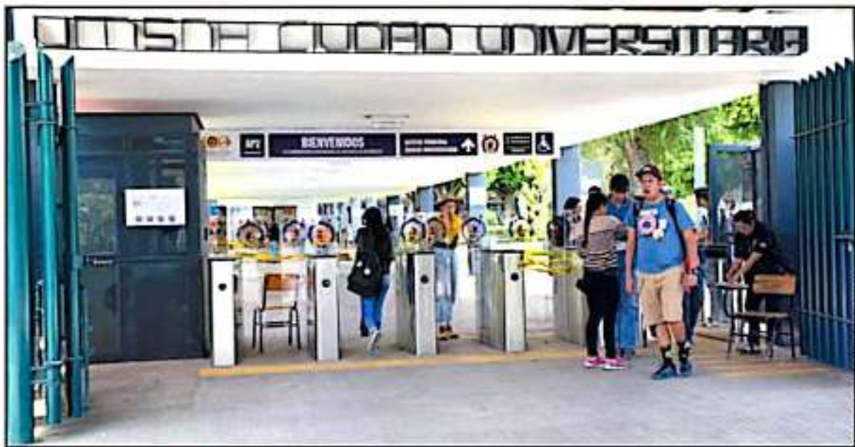
SIGUE LATENTE LA AMENAZA DE HUELGA EN LA UNIVERSIDAD MICHOACANA DE SAN NICOLÁS DE HIDALGO, DEBIDO A LA FALTA DE PAGOS DE LAS ÚLTIMAS CUINCENAS.

En tanto el Sindicato de Profesores de la Universidad Michoacana (SPUM) definirá el próximo 2 de diciembre si acepta la prórroga que solicitó la Rectoría de la institución la semana anterior, un tema que será valorado por las bases sindicales.