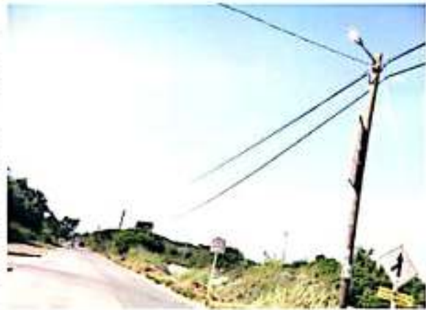
ZIHUATANEJO, GRO.- El denunciante argumenta que el sistema debe estar sulfatado y por ello permanecen las luminarias encendidas las 24 horas del día.

Aclaró que el problema no causa molestias y tampoco su petición debe ser tomada como un reclamo, pero son lámparas nuevas y es una pena que al permanecer encendidas todo el tiempo se puedan dañar.