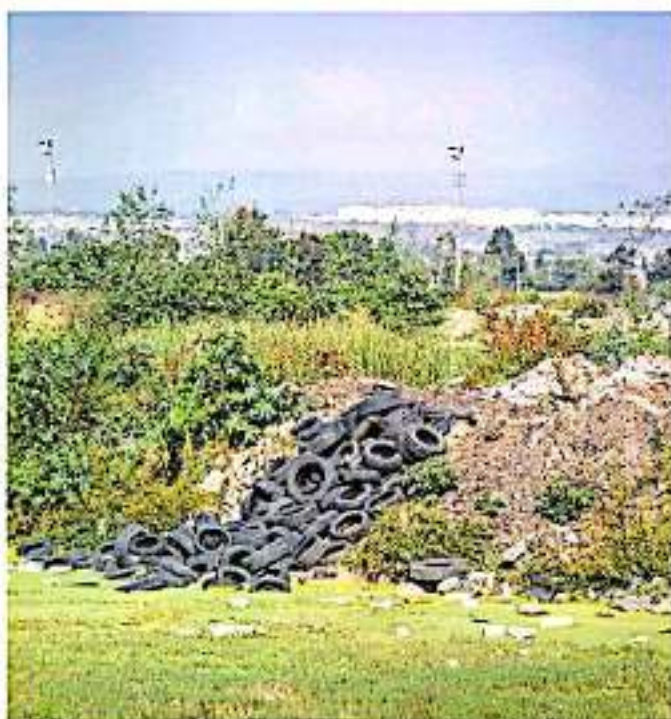
En la actualidad es un tiradero de basura y de escombros.