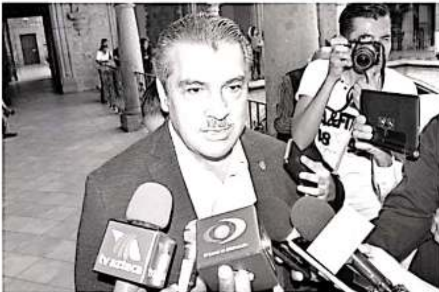
«Nosotros estamos apoyando al presidente de la república y la orientación del presupuesto ante la poca disponibilidad de recursos»

No obstante, dejó entrever la posibilidad de ejercer acciones para conciliar a la federación sobre la necesidad aplicar mayor recursos a los estados y munic-