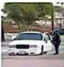
El día de ayer fue el día de mayor registro de homicidios en México desde enero de 2017. | COMPTON

Octubre de 2019 marcó un récord histórico en ejecuciones relacionadas con el crimen organizado al alcanzar los mil 206 en todo el territorio nacional, de acuerdo con datos de Lantia Consultores.