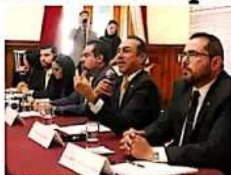
Piden a la federación que se solidarice con los municipios.