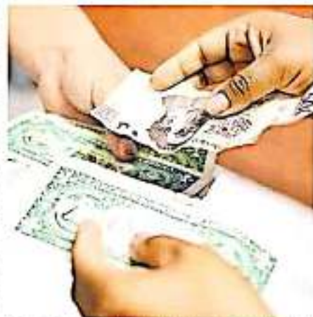
Michoacán, es la entidad número uno receptora de remesas.