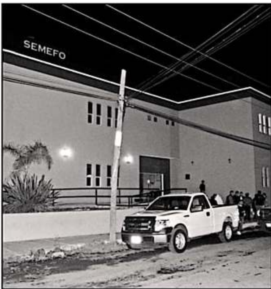
PESE A CIFRAS AL ALZA, DENUNCIADAS POR PADRES DE FAMILIA, DE AGOSTO A LA FECHA SE HAN HALLADO 3 PERSONAS.