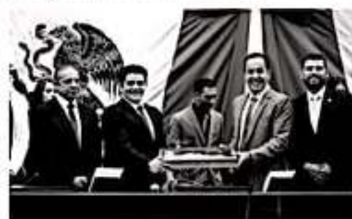
MORELIA, MICH.- Ante la presencia de representantes de los tres poderes del Estado, la LXXIV Legislatura del Congreso de Michoacán, celebró sesión solemne para la recepción del documento original de la Constitución Política del Estado de 1918.

De lo anterior, expuso: "al igual que otros corpus legislativos, el documento original que hoy presentamos nos lleva a transitar no sólo por la historia jurídica de Michoacán, sino también al compromiso que como michoacanos mantenemos, autoridades y ciudadanía, con los derechos y obligaciones que nos conciernen, así como la historia de cruentas batallas que nos han legado un país independiente". Finalmente, coincidió en, responsabilidad de todos los poderes del Estado