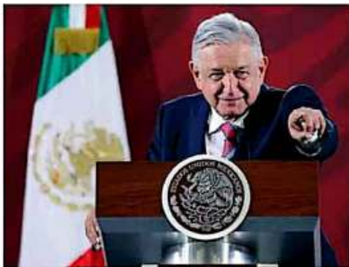
Durante su conferencia matutina, Obrador almorzó con cinco ministros como miembros de honor de su gobierno.

El 42% de los encuestados dijo no identificarse con ningún partido, en tanto que Morena sigue identificándose en segundo lugar, con 25%, el PAN con 11%, el PRI con 11% y 4% el PRD.