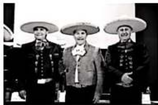
MORELIA, MICH. - El Gobernador del Estado, Silvano Aureoles Conejo, aseguró que la fiesta charra ha sido un eje de unidad para las familias michoacanas y agradeció la oportunidad de realizar en la entidad el Congreso y Campeonato Nacional Charro 2019.