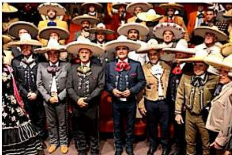
MORELIA, MICH.- Encabeza el gobernador la clausura de la Asamblea Anual Ordinaria de la Federación Mexicana de Charrería y solicita ser sede del Campeonato Nacional Infantil para 2021.