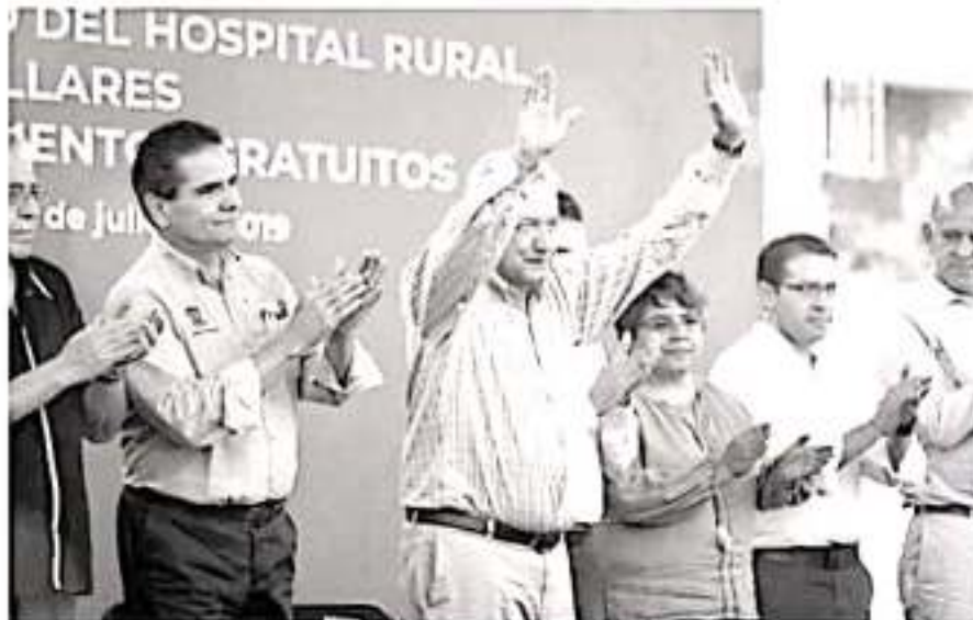
Aspecto de una visita de Andrés Manuel López Obrador a la entidad.