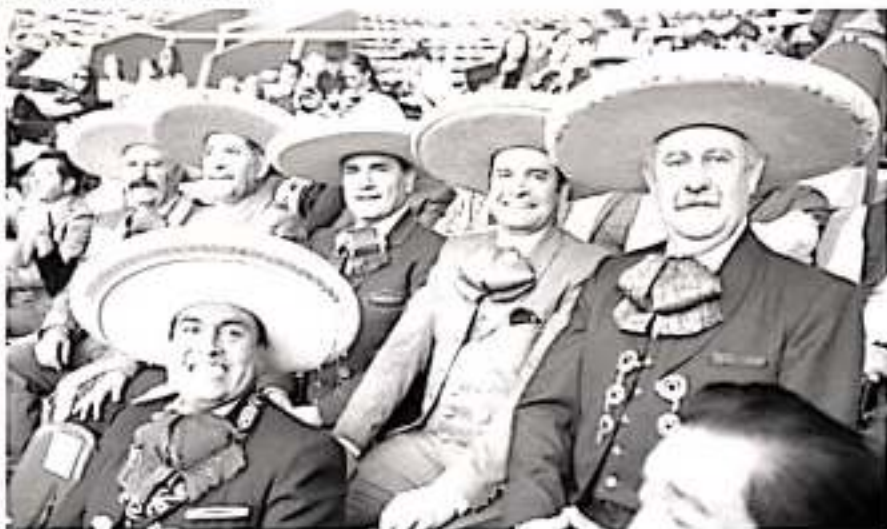
Fiesta charra reúne a gobernadores en Michoacán.

equipos de sus entidades en la recta final, que ya se acerca de este campeonato. El gobernador de Michoacán, también saludó y dio la bienvenida a las niñas, niños y adolescentes que fueron invitados del interior del estado, este miércoles, a presenciar una de las competencias de la jornada número 19.