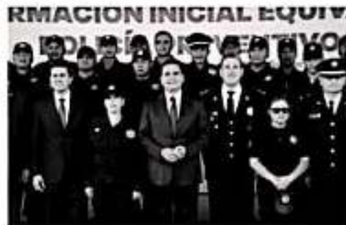
MORELIA, MICH.- Tras obtener las máximas calificaciones en las evaluaciones aplicadas, el Instituto Estatal de Estudios Superiores en Seguridad y Profesionalización Policial de Michoacán (IEESSPP), del Gobierno del Estado, recibió el primer Registro Nacional de Instancias Capacitadoras en Seguridad Pública.

La entrega realizada por el Secretariado Ejecutivo certifica al IEESSPP con el "Registro Nivel A", convirtiéndolo a Michoacán en el primer Estado mexicano en recibir tal calificación por sus procesos de formación policial, en trámite, hay otras entidades cursando sus respectivas evaluaciones. Los criterios de evaluación aplicados, abarcaron no solamente los aspectos teóricos en la formación de elementos policiales, al contar con las instalaciones educativas, de ser-