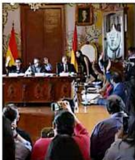
El Cabildo de Morelia aprobó la modificación al Programa Anual de Inversión 2019 por cerca de 14 millones de pesos, que se destinarán a la compra de maquinaria y equipamiento de construcción. Por su parte, se aprobó una modificación al PAI, con la cual el Ayuntamiento podrá disponer de recursos extraordinarios, obtenidos gracias a donaciones, y con ello se podrá ampliar su campo de servicios y realizar, por su cuenta, el abastecimiento de infraestructura básica, principalmente en el sector rural, así como en salud, educación y viviendas urbanas. COMUNICA