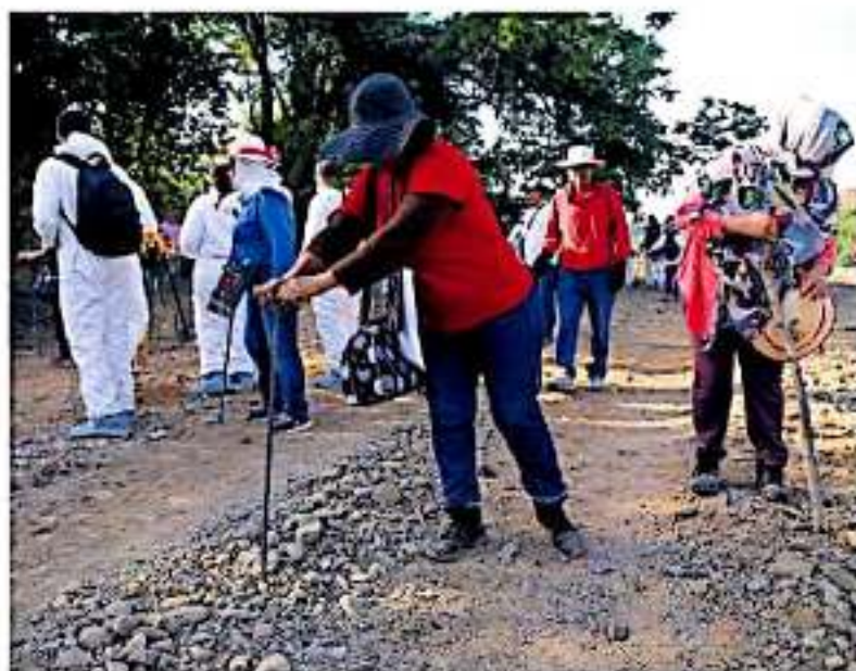
La localidad de El Platónal del municipio de Jacona, ubicado en las cercanías con el estado de Jalisco, es donde se realizó el hallazgo.