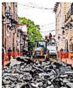
Se autorizó una ampliación de presupuesto 2019.