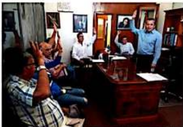
TOCUMBO, MICH.- Rindió protesta el Consejo Municipal de Seguridad Pública.

terinstitucional, para beneficio de la ciudadanía tocumbense.