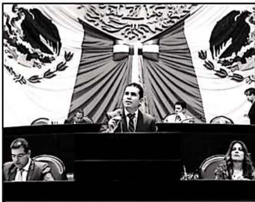
DISCUTEN EN EL CONGRESO LOCAL CÓMO TENDRAN A LAS MUJERES DE LAS CONSTANTES AGRESIONES

dolosas, según datos del secretario ejecutivo del Sistema Nacional de Seguridad Pública.