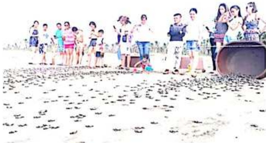
CD. LÁZARO CÁRDENAS, MICH.- El campamento tortuguero de El Habillal se encuentra a poco de superar los resultados obtenidos en la pasada temporada de anidación de la tortuga marina.

Finalmente, destacó se llevan más de 30 mil crías de tortuga liberadas, las que representan un 95% sobre las liberadas en 2018, en espera de cumplir al término del mes de diciembre la meta pactada, sin embargo, dijo, ya es menor el arribo a la costas michoacanas en espera también del arribo de la tortuga laúd que comienza su avistamiento desde el mes de diciembre.