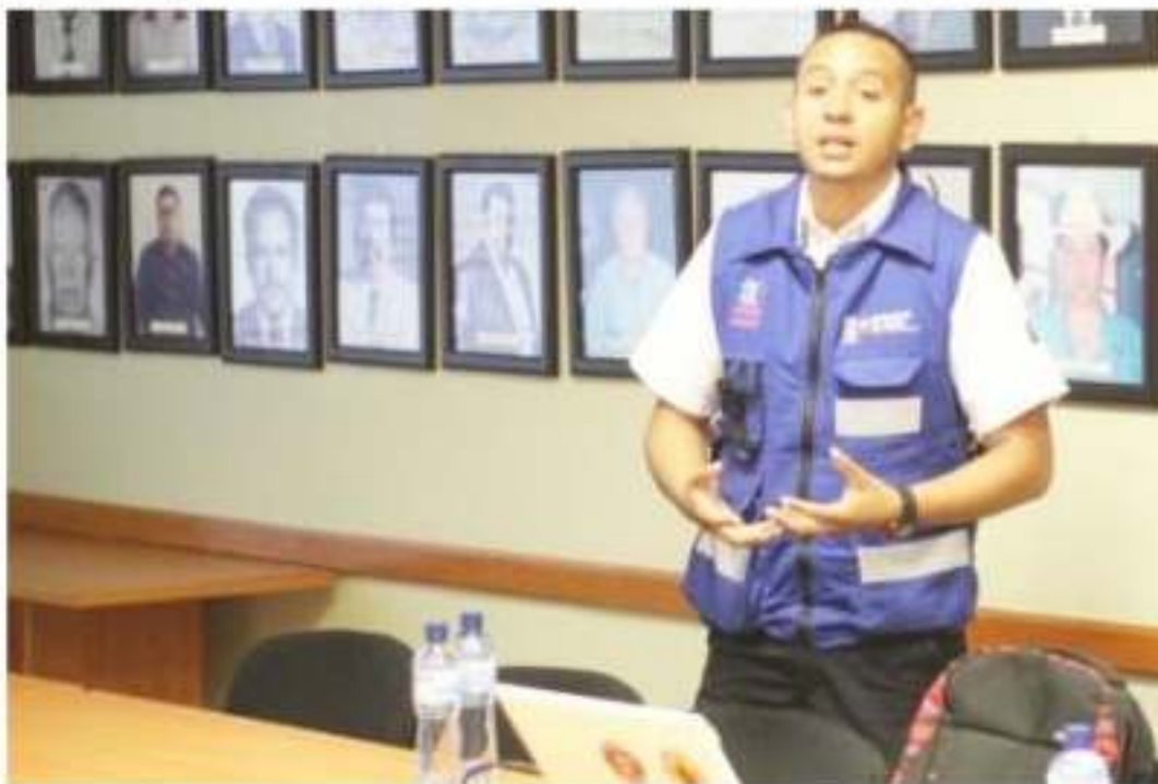
JACONA, MICH.- Mejores paramédicos y homologar criterios de traslado de ent recepción en hospitales bajo conceptos legales acorde a normas oficiales, se Bomberos y Protección Civil Municipal.

Zamora, y Jesús Albe de la sede Zamora de la localidad, les seguimiento como situaciones que se p hospitalarias en el geolocalización y mo materiales y human de pacientes, que re contacto el 911, deso curso. Mediante un historial de la formac salud en el estado, l Roja, después se form actualidad, y acorde General de Salud, es de Salud.