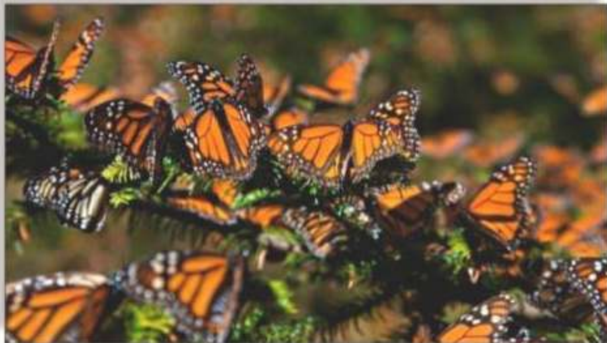
Empieza a llegar la Mariposa Monarca con todo su misticismo.

rotección y Cuidado del Medio Ponce de León González . e los Derechos Humanos, Dante é tal?... Pues definitivamente, bueno que se reconozca a los a estos tiempos tan difíciles por a y en los que escasean empleos, por lo que se espera que cas continúan enfocándose a jóvenes en su propia tierra para en, apoyarlos ¡con todo! en la los negocios , empresas. Y es que