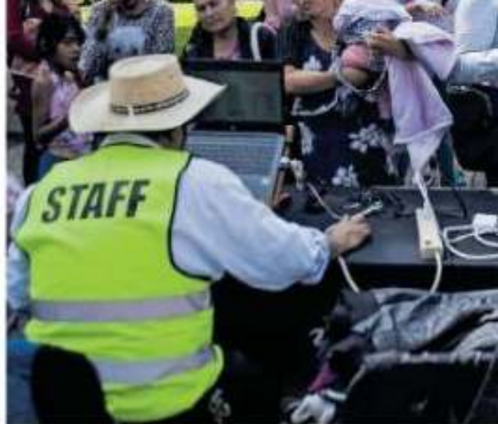
Ayer se realizaron elecciones internas en 12 distritos

En la región de Lázaro Cárdenas, militantes advirtieron restricciones de ingreso a la asamblea distrital realizada en las instalaciones del sindicato minero del Puerto