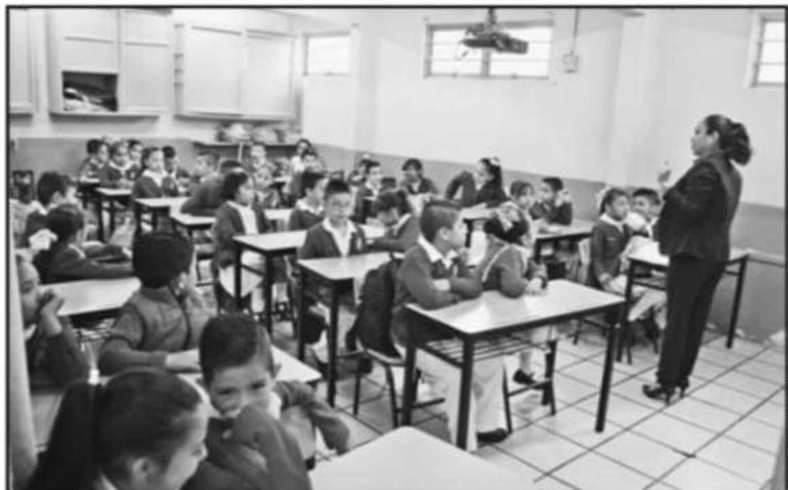
ARCHIVO, LA VOZ DE MICHOACÁN

SE TENÍA PREVISTO QUE ESTE MES FUERA LA FECHA LÍMITE PARA REALIZAR EL DIAGNÓSTICO ESCOLAR EN NIVEL BÁSICO.