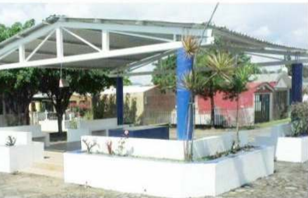
Entra el Panteón Municipal para la visita de miles de personas.

Como cada año habrá ceremonias religiosas, puestos de comida en las afueras, personal de la Unidad Municipal de Protección Civil y Bomberos alertas a cualquier emergencia; de la Policía Municipal en labores de vigilancia y auxilio vial y funcionarios de diferentes dependencias atendiendo a los visitantes.