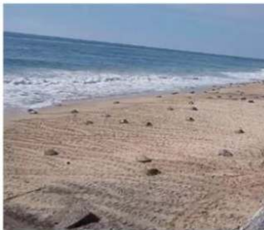
CD. LÁZARO CÁRDENAS, MICH.- El campamento tortuguero de Ixtapilla, informó sobre una posible recuperación en cuanto a la conservación de tortuga golfinia.

Cabe destacar que estas verificaciones se hicieron en coordinación con el Instituto Tecnológico de Lázaro Cárdenas (Itlac) y personal de la CFE, quienes acudieron a cada uno de los 15 domicilios ya verificados, donde se retiraba el medidor y con aparatos de medición, verificaban alteraciones en la energía de las casas-habitación.