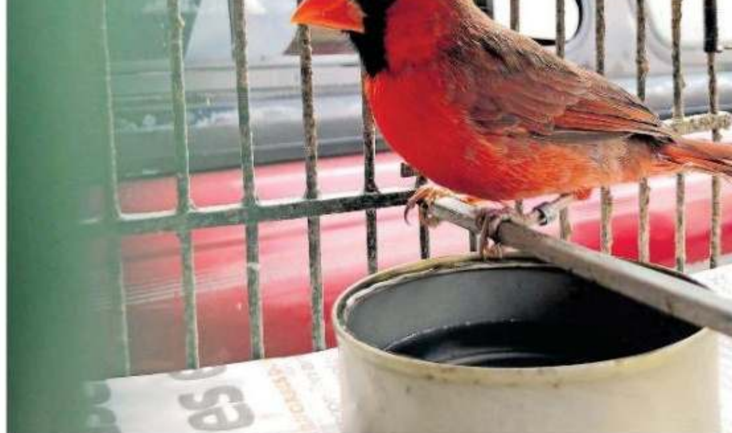
La FGR Michoacán no tiene registro de denuncias presentadas por tráfico ilegal de animales

endencias mpetentes erto Públi- cios o pe- tivo de las omisión de nímicos y uirán a la procesado amente el tal obla-