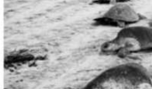
LÁZARO CÁRDENAS, MICH.- Un total de un... ...ha entregado en este año el Gobierno de Mi... ...tos tortugueros en la Costa.

...Disponer de vehículos automo- ...tores le representa a los cam- ...pamentos tortugueros duplicar ...el número de recorridos de vigi- ...lancia y abatir el tiempo de res- ...puesta ante un posible saqueo