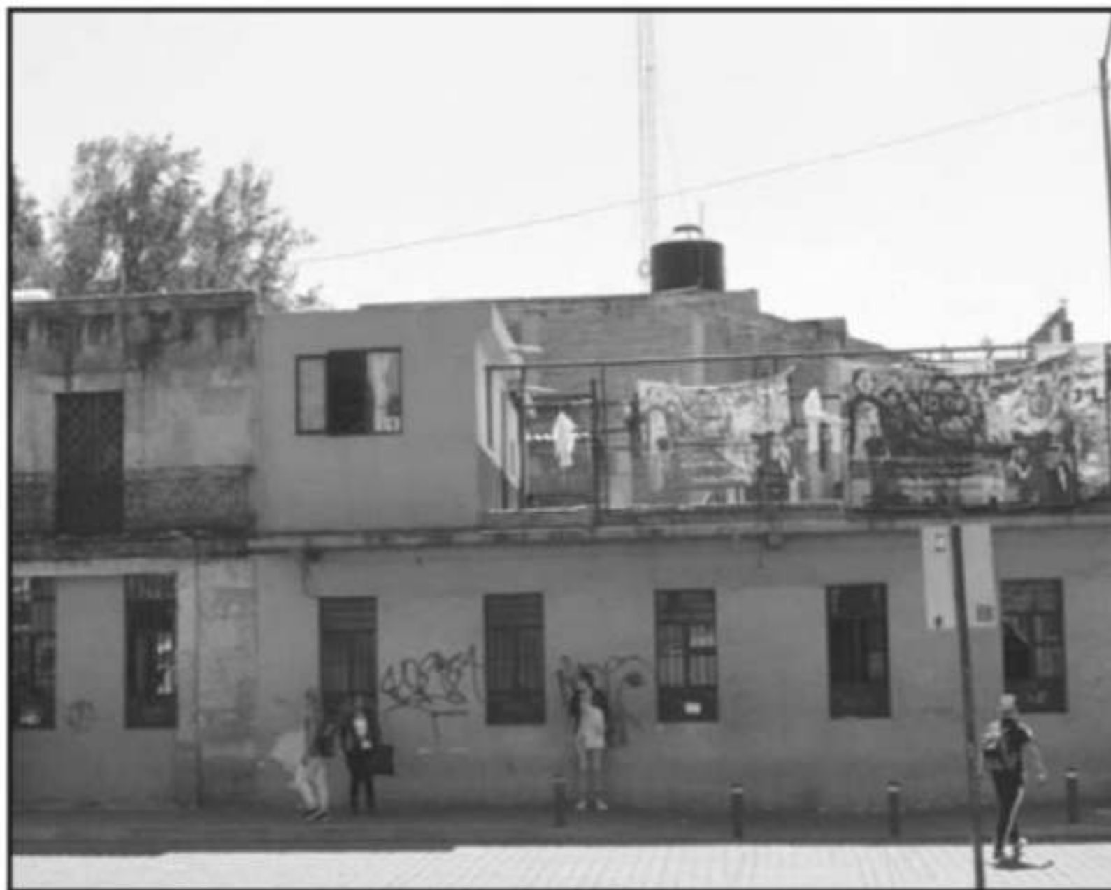
PARA LA IGLESIA CATÓLICA EN MORELIA, LAS CASAS DEL ESTUDIANTE TIENEN LIDERAZGOS QUE, MUCHAS VECES, ENCAUZA