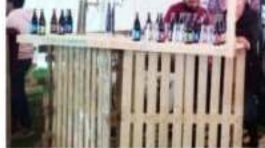
MORELIA, MICH.- Oktoberfest recibió a la cultura de la cerveza.