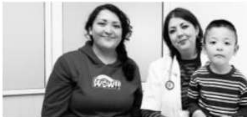
MORELIA, MICH.- El Hospital General Infantil “Eva Sámano de López Mateos” cuenta con médicos pediatras, tanto mujeres como hombres, con una gran calificación humana en la atención de niñas y niños”

...sean de acceso gra- ...tes, lo que permite fo- ...des del personal de ...atención, señaló qu- ...podamos traspolar l- ...nuestros hijos, ent- ...de la gente en este ...sensibilidad, los tra- ...familiares, como si ...sobrino un primo, y ...ción sea de mucha ...mi casa, en un hosp- ...la fortuna de formar ...y eso hace que sea ...amor, al final el hos- ...estoy seguro que p- ...compañeros, es cor-