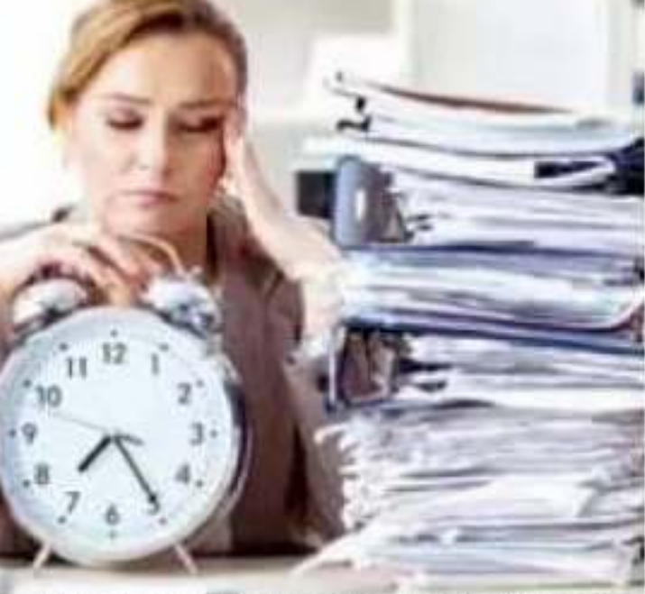
...confiesan que no son felices en sus centros de trabajo.

as de OCCMun- ta Vera, explicó s psicosociales a la NOM 035 son condiciones ne- o sólo afectan la bienestar de los