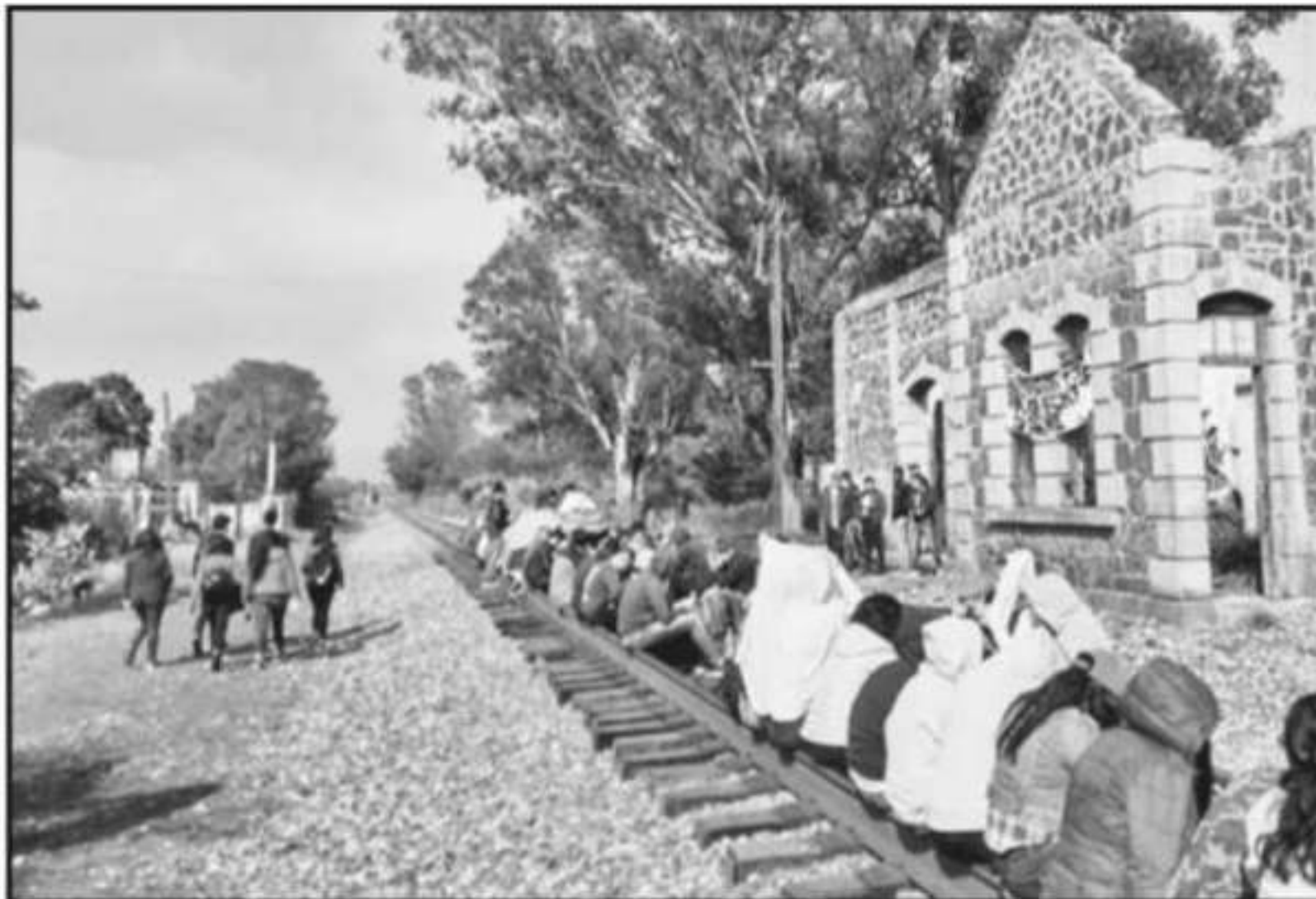
EL BLOQUEO DE LAS VÍAS DEL TREN HA SIDO UNA DE LOS MÉTODOS CONSTANTES DE LOS NORMALISTAS PARA PROTESTAR Y EJECUTAR

grar la estabilidad de la institución, sin embargo se encuentran en la