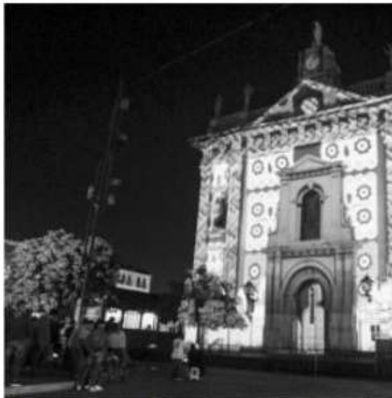
URUAPAN, MICH.- Familias completas se dieron cita para disfrutar de las tres proyecciones y en un ameno momento.

Anotó que cada fin de semana se buscan nuevas y variadas actividades para mantener la buena afluencia de personas que registra el Domingo Familiar.