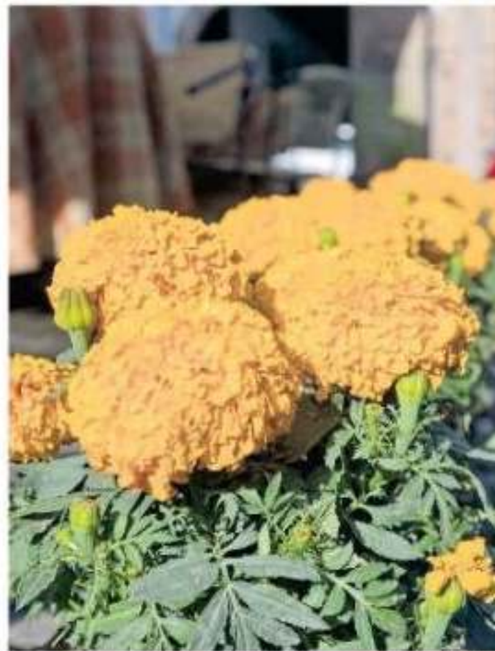
Mientras en México sólo se utiliza para el Día de Muertos, la flor de cempasúchil es aprovechada con fines más complejos en otros países.

El funcionario dijo que existe un desaprovechamiento de la flor de cempasúchil con fines industriales, pero también en el sector alimenticio para el uso pecuario, pues se ha demostrado que algunas especies como los pollos adquieren un mejor aspecto en la alimentación de la