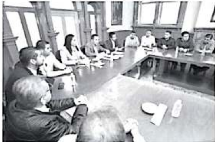
A la reunión asistieron alcaldes y alcaldesas de Aguililla, Álvaro Obregón, Chucándiro, Coahuacán, Contepec, Erongaricuaró, Irimbo, Jacona, Múgica, Senguío, Tepalcatepec y Vista Hermosa.