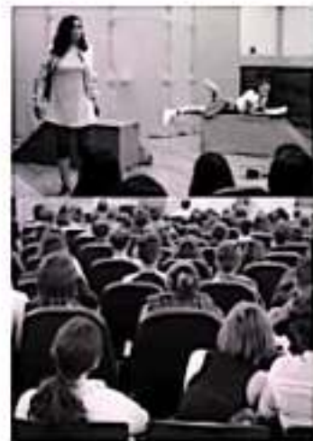
URUAPAN, MICH.- Esta obra teatral tiene como premisa que los jóvenes reflexionen sobre el machismo, la violencia, igualdad de género y sobre todo el respeto por la identidad sexual.