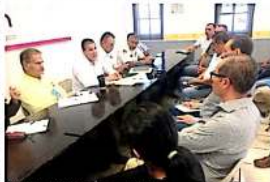
URUAPAN, MICH.- Sin avances significativos se desarrolló ayer una más de las reuniones entre Cocotra y los transportistas urbanos y foráneos de Uruapan.