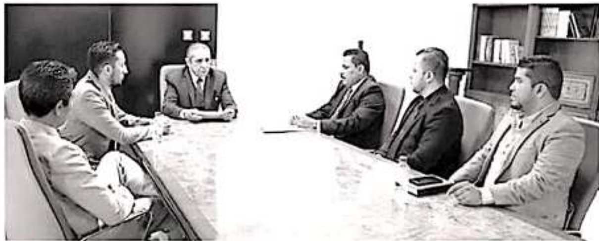
Proponen realizar actividades de capacitación en conjunto en beneficio de la ciudadanía que accede a servicios de justicia.

Por su parte, la Barra de Abogados entregó la petición formal para valorar al interior del Consejo del PJM una firma de convenio de colaboración que materialice la posibilidad de que sus agremiados accedan a las activi-