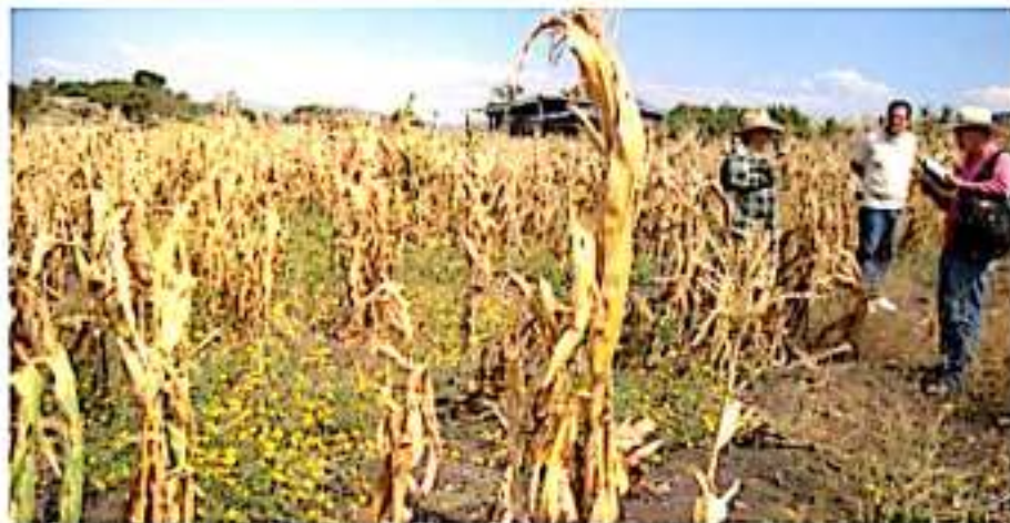
JACONA, MICH.- El maíz sembrado por ecuareros no alcanzó a formarse ni para ser utilizado como forraje ganadero, situación que constataron un funcionario de Sedrua y un representante de la Compañía Aseguradora.

La situación fue reportada a las dependencias oficiales inmediatamente que vieron que las plantas de maíz no lograron desarrollarse; por lo que ahora en el recorrido por las parcelas se levantó relación de pruebas fotográficas, nombres de propietarios y hectáreas de afectación para cada uno de los productores.