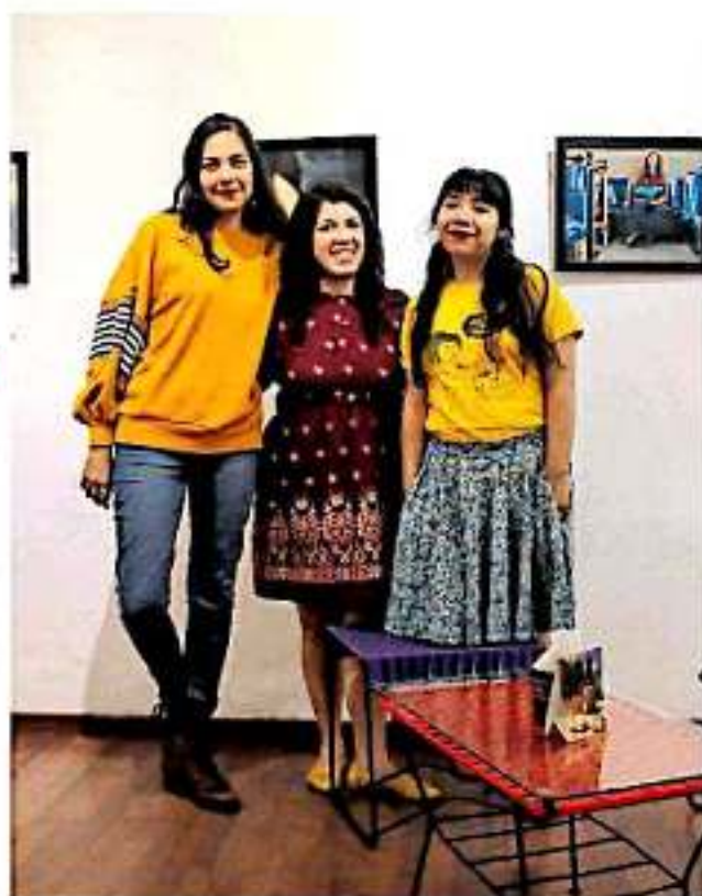
La construcción del slam para morras no ha sido sencilla, ya que el hecho de que sea dirigido a las mujeres no lo hace algo seguro.