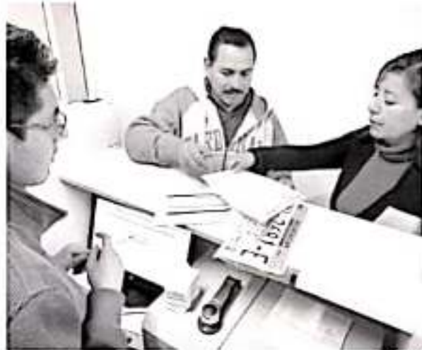
Borrón y Cuenta Nueva operará hasta el domingo 15 de diciembre.

La TAM, es el único módulo para la realización de todos los trámites relacionados a la Dirección de Recaudación, incluyendo expedición de Licencias para Conducir, que labora los fines de semana; los horarios de atención son los mismos en todas las oficinas de rentas en la capital michoacana, de 9 a 15 horas.