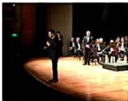
ZAMORA, MICH.- El gobernador del estado, Silvano Aureoles Conejo, estuvo en la presentación de la Orquesta Sinfónica de Michoacán, en el Teatro Obrero.

El 40 por ciento del padrón electoral no ha acudido ante el INE a renovar su credencial, se invita a la población a que asista o realice su cita,