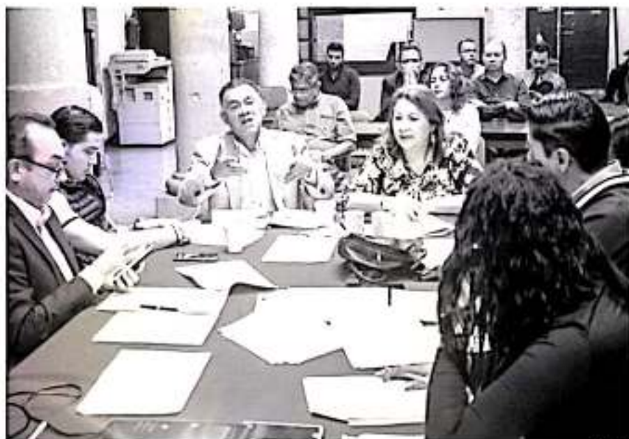
El diputado Fermín Bernabé Bahena, en reunión con integrantes de las Comisiones Unidas de Gobernación y Justicia.

trabajó en el diseño de la convocatoria a la que habrán de res-