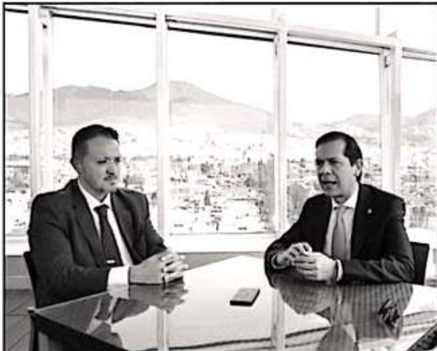
DIRECTIVOS DEL MÉDICO GUERAN QUE NO TODOS LOS TRATAMIENTOS DE FERTILIDAD SON NECESARIAMENTE COSTOSOS

situación que atraviesa la población en general para atender un creciente problema como lo es el tema de la fecundidad.