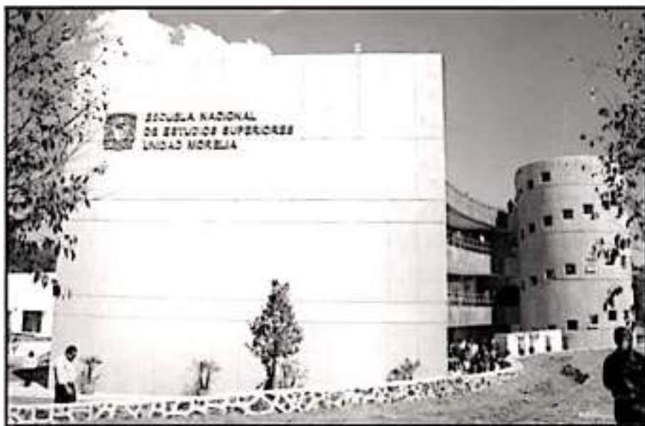
SE CUMPLEN 12 DÍAS DE PARO POR PARTE DE COLECTIVOS FEMINISTAS QUE EXIGEN FRENAR LA VIOLENCIA DE GÉNERO.

cién una semana después del levantamiento del paro y entrega de instalaciones, los puntos que se acuerden en dichas mesas, y que lo requieran, serán sometidos al Consejo Técnico para su aprobación en tanto que es la máxima autoridad de la Escuela; esto ocurriría en un plazo máximo de 30 días hábiles a partir de que se concluyan las mesas de trabajo.