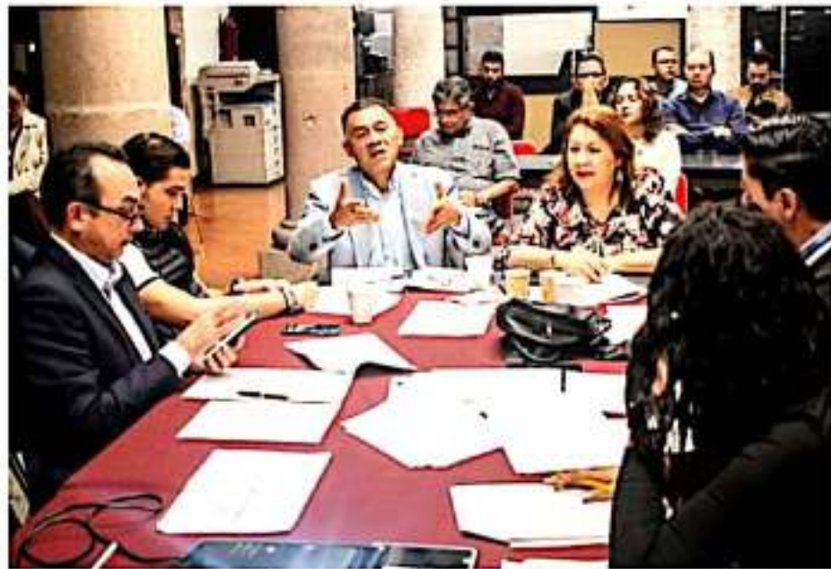
MORELIA, MICH.- Avanza definición de convocatoria para cubrir posición acéfala en Instituto Michoacano de Transparencia, Acceso a la Información y Protección de Datos Personales.

Y finalmente, remarcó que el gran proyecto para la próxima anualidad será el festival de Peter Gabriel, Womad, pero además exhortó al Gobierno del Estado a terminar el Centro de Convenciones de Morelia y el teatro Matamoros para así potenciar más el turismo estatal.