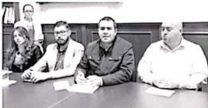
El 70% del presupuesto federal se destina a solo 6 entidades de la república, que estarán sobreestimados en recursos económicos, entre ellos Tabasco.

En este sentido criticó que los legisladores federales de la entidad no defendieron a Michoacán para nada, es el caso de esta zona norte que forma parte del distrito 03, cuya