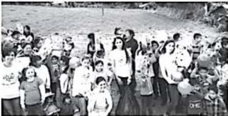
Realizan varias actividades, entre ellas la repartición de cenas en el Hospital Regional a personas que tienen internado a un familiar, también ayudan a niños de la Casa Hogar Fray Servando Ortiz.

«Somos constantes y tenemos disciplina en lo que hacemos, cada persona que está con nosotras no la forzamos a dar una cuota, todo lo que se da es por amor a ayudar a los demás, hay ocasiones por ejemplo que una por trabajo no puede acudir pero estamos tan