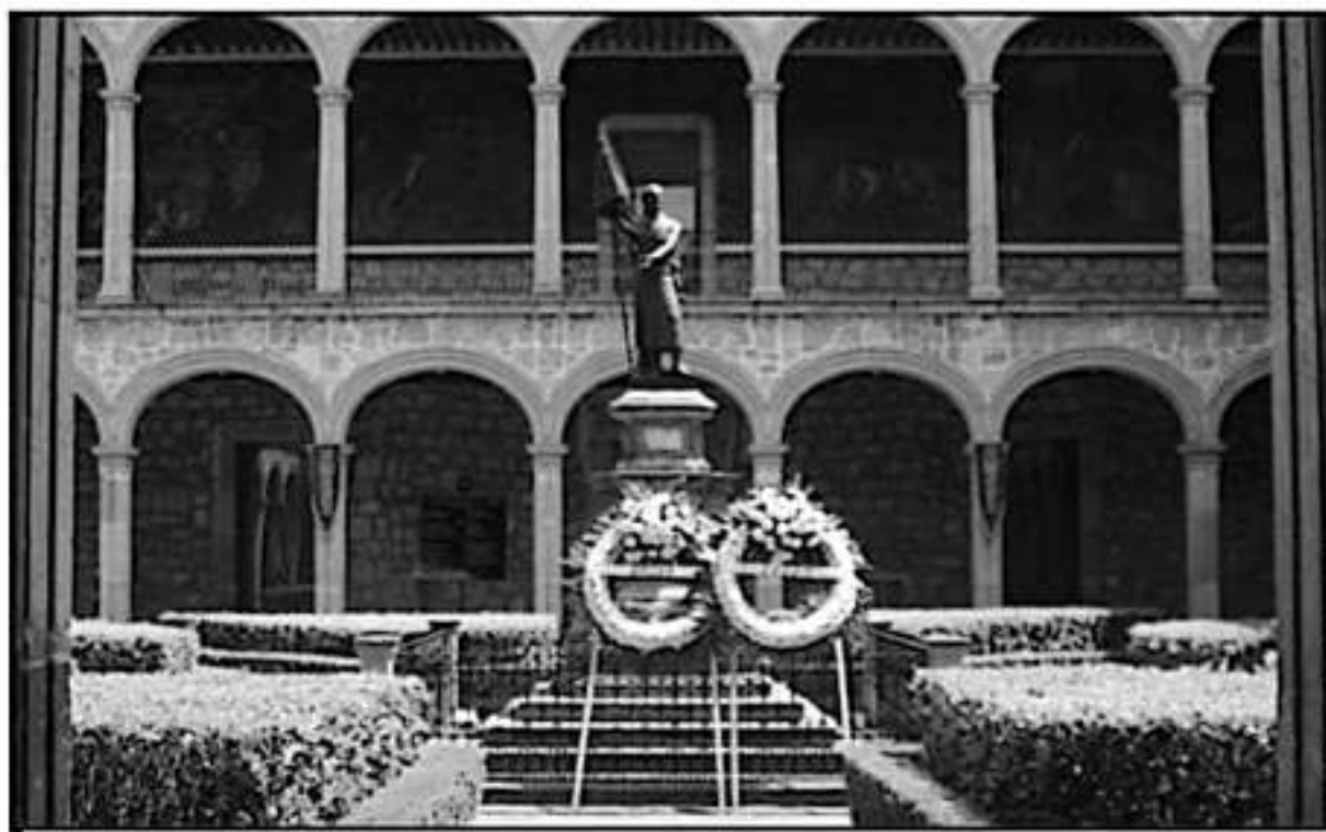
PESE A LOS PAGOS QUE SE HAN LOGRADO CONSEGUIR, LA CASA DE HIDALGO TENDRÍA COMPLICACIONES PARA LAS PRESTACIONES DEL MES DE DICIEMBRE.