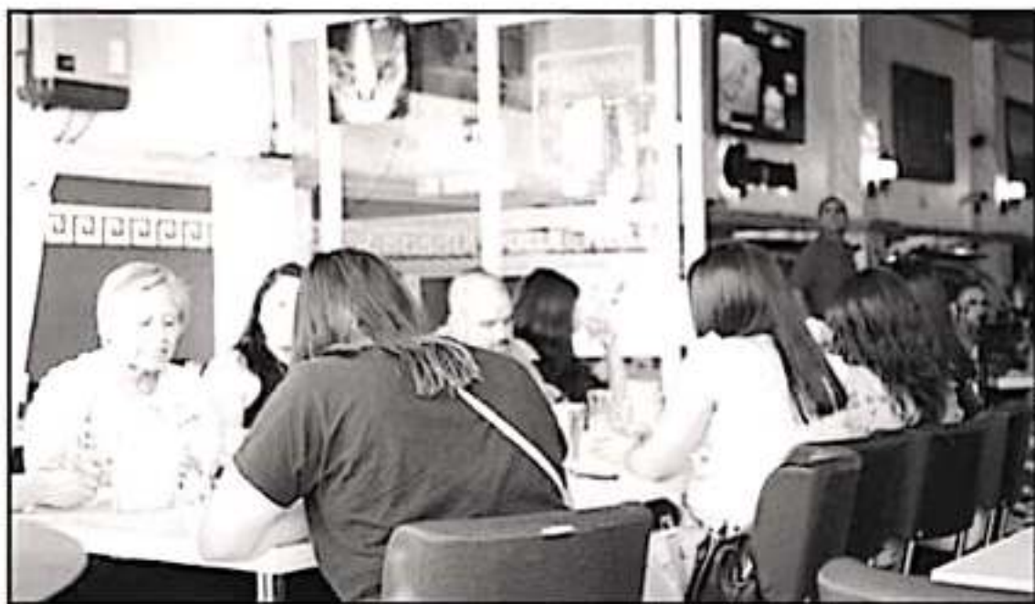
ARCHIVO LA VOZ DE MICHOACÁN

LA PROMOCIÓN DE EVENTOS DONDE SE EXPENDEN ALIMENTOS, ES LO QUE HA SALVADO A LA INDUSTRIA RESTAURANTERA DEL ESTADO.