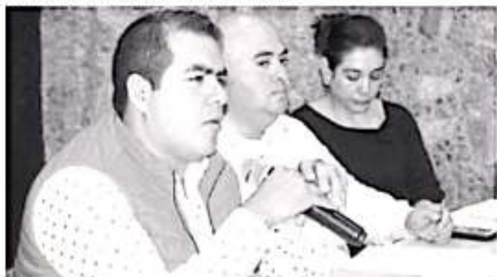
El alcalde exhortó a los secretarías y directores de las distintas áreas, a optimizar recursos y planear de la manera más eficiente y eficaz las obras y acciones.

Agregó que lo anterior forma parte de las acciones mediante las cuales se busca de manera práctica y sencilla considerar la opinión de la sociedad, para dar cumplimiento al documento recer de la planeación de la administración municipal.