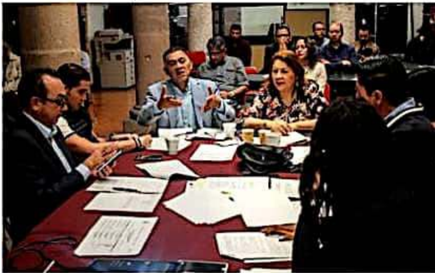
El diputado morenista Fermín Bernabé Bahena, hizo un llamado a potenciar esquemas de transparencia en función pública local.