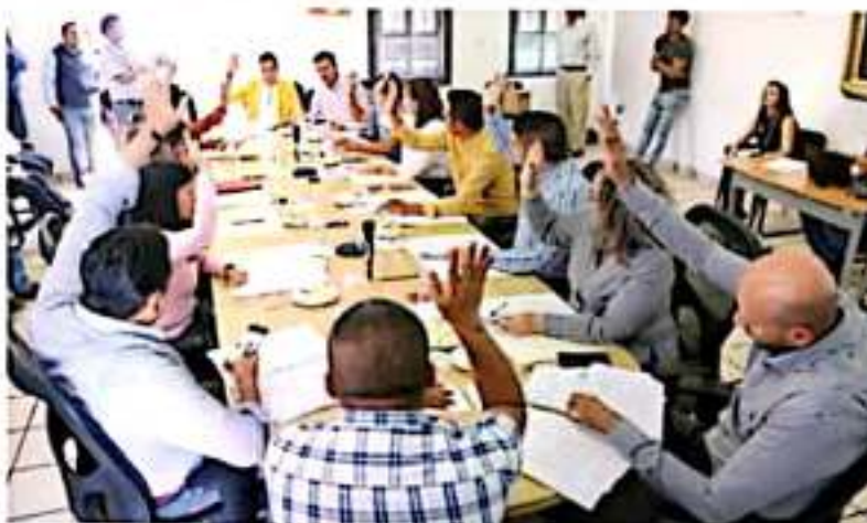
URUAPAN, MICH.- Obras de pavimentación por casi 5 millones de pesos, fueron aprobadas ayer en sesión de Cabildo.

sidad de aplicar un recurso propio para facilitar su funcionamiento, el cual es de suma importancia para preservar la memoria histórica de este municipio y ponerla al servicio de la población.