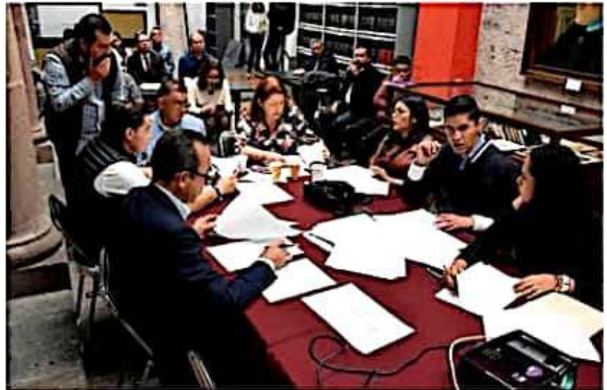
Las Comisiones de Gobernación y Derechos Humanos, coincidieron al señalar su interés de fortalecer dicho Instituto con la selección de los perfiles mejor capacitados.

Cabe señalar que se tiene previsto sesionar el próximo jueves para presentar dicha convocatoria, y posteriormente de que sea aprobada en el Pleno, agotado el plazo de registro de aspirantes, las Comisiones verificarán que los documentos recibidos acrediten los requisitos, realizando posteriormente los trámites legislativos correspondientes y presentar ante el Pleno del Congreso local, una tema que pueda ser votada y electa en su caso.