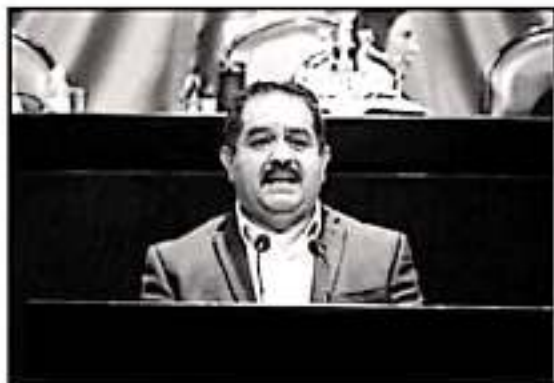
EL DIPUTADO FEDERAL JOSÉ GUADALUPE AGUILERA, ACUSÓ DE FAVORITISMOS PARA CON LAS ENTIDADES QUE SON GOBERNADAS POR MORENA.