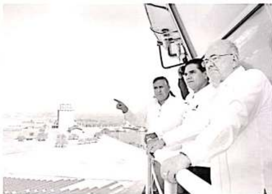
Junto al titular de SCT y el gobernador encabezaron la celebración del 45 aniversario del Puerto de Lázaro Cárdenas y entregan reconocimientos a personal de la comunidad portuaria y al personal de la APIAC.

Durante la celebración también de los 25 años de la Administración Portuaria Integral de Lázaro Cárdenas (APIAC), Aureoles Conejo precisó que en el Gobierno de Michoacán encontrarán siempre un aliado para trabajar de manera conjunta y coordinada por mejorar las condiciones de las y los mexicanos.