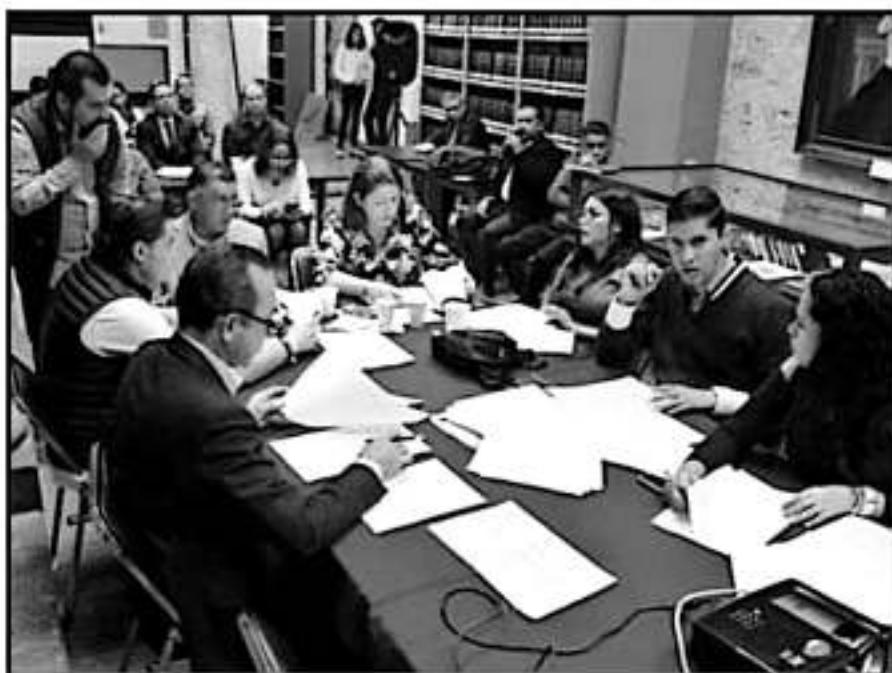
DIPUTADOS DE LAS COMISIONES DE GOBERNACIÓN Y DERECHOS HUMANOS DIERON EL VISTO BUENO A LOS LINEAMIENTOS.