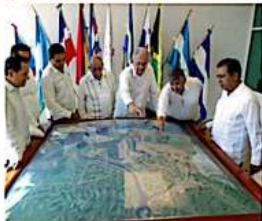
CD. LÁZARO CÁRDENAS, MICH.- En el marco del 45 aniversario de su creación, al que asistió el secretario de Comunicaciones y Transportes, Javier Jiménez Espriú.