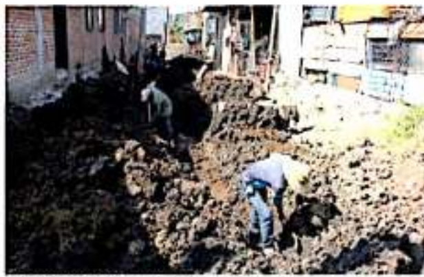
LOS REYES, MICH.- Positivo avance registra la pavimentación de la calle Ingenio Genovevo Figueroa, en La Providencia.

Como todas las obras, se están realizando trabajos integrales con la sustitución de redes de agua y drenaje y que "los vecinos cuenten con servicios como deben de ser, como lo indica el Sistema de Agua Potable, con los materiales, tuberías de acuerdo a sus especificaciones adecuadas para garantizar obras duraderas que no al rato tengamos que andar bacheando o cambiando calles completas por colapsos de tuberías", acotó.