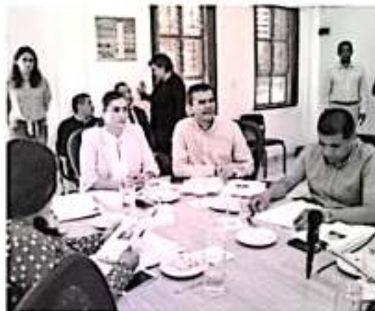
URUAPAN, MICH.- La determinación fue tomada en sesión ordinaria de Cabildo, con el objetivo de hacer frente a las necesidades que tienen las localidades en este tipo de infraestructura

nica y la Historia de Uruapan, organismo de participación ciudadana que realiza una importante labor para la comunidad. Su trabajo consiste en elaborar la memoria histórica de este municipio y ponerla al servicio de la población.