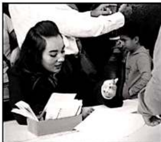
A PARTIR DEL 4 DE DICIEMBRE SERÁN CUERTAS LAS BECAS A ALUMNOS DE EDUCACIÓN BÁSICA, PARA ABATIR LA DESERCIÓN EN MICHOACÁN

"Lo que se está haciendo y de lo que se trata, con estos aparatos de tecnología de punta, es detectar el despliegue de energía de la tierra en las placas tectónicas para poco a poco ganar tiempo para mitigar el riesgo", concluyó.