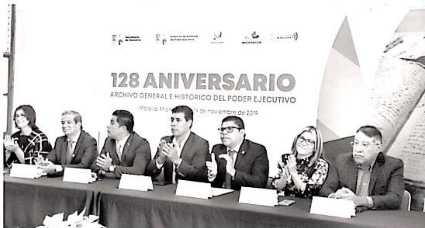
En el marco del CXXVIII Aniversario del Archivo General e Histórico del Poder Ejecutivo, el magistrado destacó la valía de la memoria archivística como testigo de la historia, y celebró «el nuevo paradigma en la materia».

El orador oficial del acto, el doctor Napoleón Guzmán Ávila, recordó la historia y los personajes que han posibilitado la conservación de este acervo a lo largo de los años y lamentó que, no obstante a la existencia de una ley para la conservación de los archivos, no sea cumplida por todas las instituciones en México.