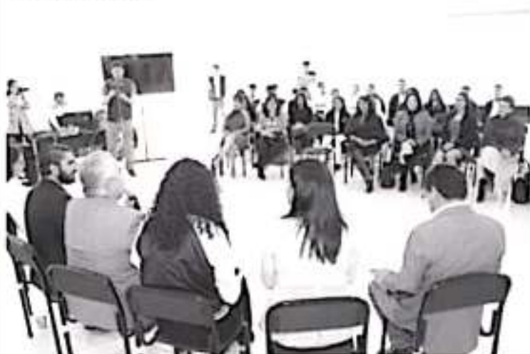
Se realizó el panel "Uso asertivo de las redes sociales", con el objetivo de orientar la interacción de los jóvenes en estas plataformas.

El grupo colegiado de Mujeres Trascendiendo por Michoacán, que rindió protesta hace unos meses ante el gobernador Silvano Aureoles Conejo, tiene como objetivo generar acciones alineadas a la política educativa del Estado, en la que destacan una formación de calidad en beneficio de la sociedad.