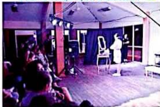
Como parte de las actividades por el festejo del 41 aniversario de la Casa de la Cultura "José Vasconcelos" de esta ciudad, se presentó la obra de teatro "Las Ubarry".