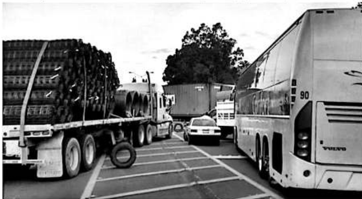
Anuncia Consejo Supremo Indígena toma generalizada de carreteras en Michoacán.

yes que nos rigen para que tomen cartas en el asunto y no se permita que nuestro municipio siga viviendo en vacíos legales», concluye el Ayuntamiento.