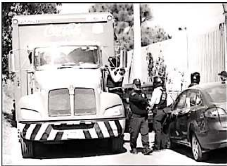
LA UNIDAD QUE DESPOJARON AL CHOFER REPARTIDOR DE REFRESCOS, FUE RESGUARDADA POR ELEMENTOS POLICIALES.