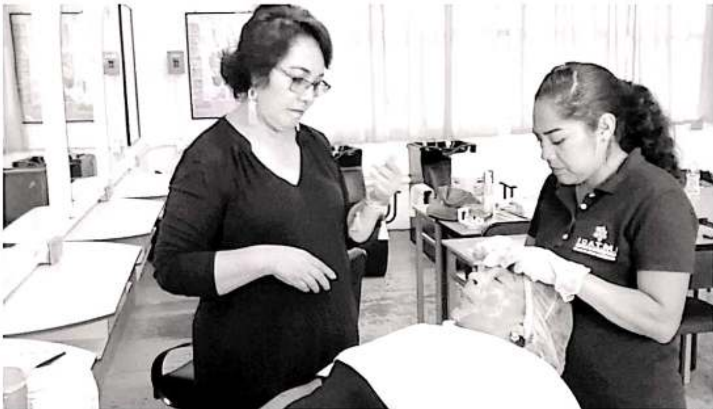
Estudiantes del ICATMI recibieron apoyos para que puedan emprender sus negocios tras las capacitaciones que recibieron.

En 2019, Icatmi lanzó cinco convocatorias regionales para estudiantes emprendedores, resultando quince proyectos seleccionados. A los primeros lugares se les hace entrega de 20 mil pesos en maquinaria, a los segundos lugares 15 mil pesos y 10 mil pesos para los terceros lugares.