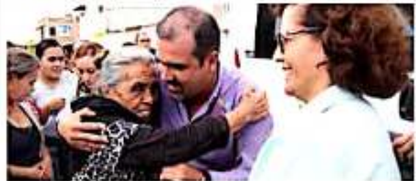
ITLÁN DE LOS NIEVOS, MICH.- Autoridades municipales llevaron a cabo la entrega de cobijas a decenas de familias para que puedan protegerse de estas bajas temperaturas.

Finalmente, la ciudadanía de las colonias Santa Cruz y El Géiser recibieron este apoyo, mismo que continuará por todo el municipio; durante esta entrega se logró beneficiar a un total de 180 familias.