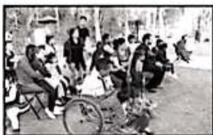
ESPECIALISTAS BUSCAN QUE SE FORTALEZCA LA INCLUSIÓN DE PERSONAS CON DISCAPACIDAD DESDE LAS ESCUELAS