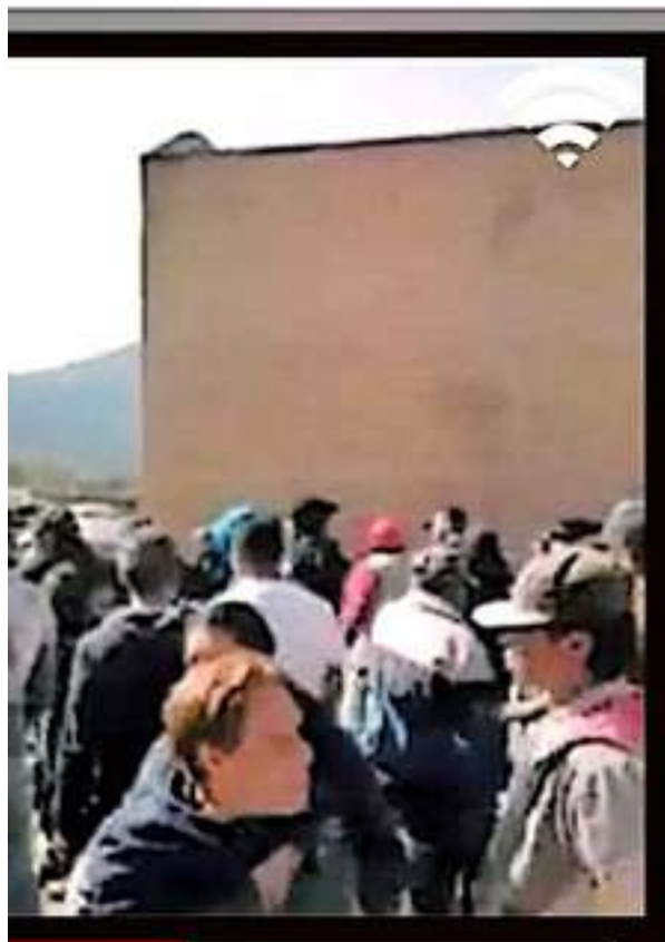
Origen del video Grupos de Facebook de las comunidades en Nahuatzen compartieron el material donde se aprecia el desencuentro entre comuneros y las autoridades electas.