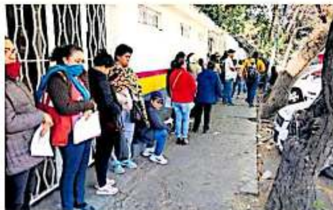
Durante el día se atendió a los usuarios con normalidad.