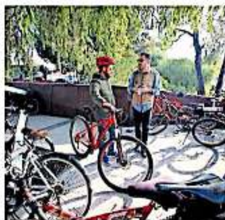
Se llevará a cabo la instalación de macetones y orejas de resguardo www.elsol.com.mx

De la misma forma, se llevará a cabo la instalación de macetones y orejas de resguardo peatonal, así como reflectores de velocidad, semáforos ciclistas, señalamiento de prioridad ciclista, zona de espera ciclista y buffer o zona de amortiguamiento para los mismos.