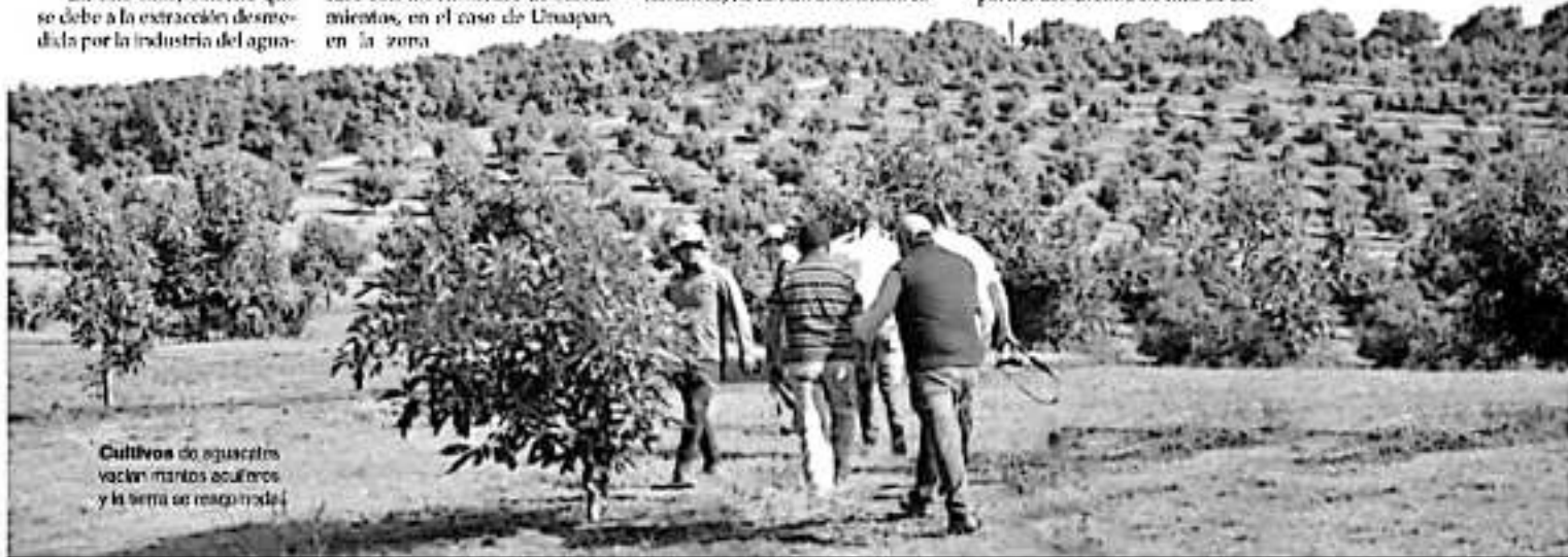
Cultivos de aguacates vacían mantos acuíferos y la tierra se resquebraja

Derivado del agotamiento del acuífero subterráneo superior, la ciudad de Morelia se hunde a un ritmo de hasta 6 centímetros al año. Un comportamiento riesgoso y muy similar al observado en urbes como la Ciudad de México y regiones geográficas de la Megalópolis. Si bien algunas zonas de la ciudad presentan menor grado, el hundimiento es generalizado. En tanto unas áreas de la ciudad se hunden a un ritmo de los 2 centímetros de profundidad, otras se encuentran a 6 centímetros. Actualmente se tienen ubicados al menos doce fallas que son el indicador latente del riesgo que implica que se extraiga agua y no se permita la recarga del acuífero.