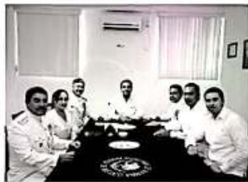
LÁZARO CÁRDENAS.- El gobernador de Michoacán, Silvano Aureoles Consejo asistió a la ceremonia de entrega-recepción del mando de armas de la Décima Zona Naval.

Finalmente, con la entrega de un reconocimiento al almirante Salvador Gómez Meallón, el gobernador Silvano Aureoles reite-