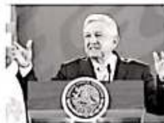
El presidente Andrés Manuel López Obrador anunció que el jueves presentará un plan general de salud y que cada semana habrá un informe en la materia.

Habrán relevos, dijo, para que puedan dar atención 24 horas y se logre la gratuidad en los servicios.