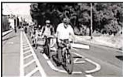
CON EL FIN DE REDUCIR LOS RIESGOS PARA LOS CICLISTAS, SE INSTALARÁN ELEMENTOS DE SEÑALÉTICA.

promedio de ocupación por viaje en un auto