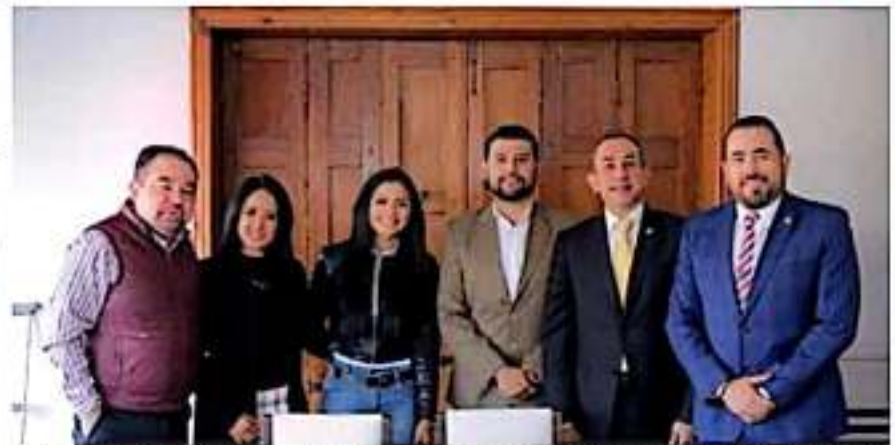
Determinaciones que tocan tomar a los diputados perredistas como bancada, las asumida sin injerencia externa y con plena responsabilidad: GPPRD.