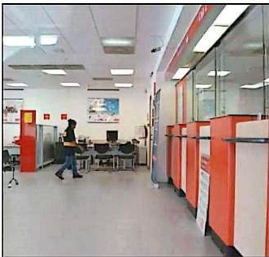
EN 2019 AUMENTARON LOS ASALTOS A CUENTAHABIENTES EN RELACIÓN CON EL 29% REFIRIÉN LAS AUTORIDADES.

delictivos saliendo de ventanilla en dos años