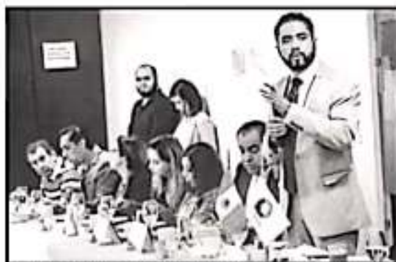
CHUCLA DIO A CONOCER SU PROGRAMA DE TRABAJO PARA SU NUEVO CARGO.

Se detalló que la información que recopilan los encuestadores casa por casa, se realizará con el apoyo de dispositivos de cómputo móvil.