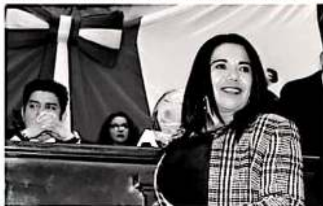
MORELIA, MICH.- Para fortalecer la economía en el Michoacán y sus regiones, es necesario que las adquisiciones que realice el Gobierno Estatal y los municipales, privilegien a las micro, pequeñas y medianas empresas locales.

Frente a tal situación, la legisladora subrayó que es necesario pensar a profundidad las medidas que deben instrumentarse para que las escuelas sean espacios seguros para los menores que diariamente acuden a formarse en ellas, de manera que su desarrollo no se vea afectado por la posibilidad de violencia en las aulas, y resaltó la importancia que en el hogar, los padres de familia también trabajen con sus hijos y tengan comunicación permanente.