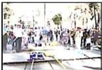
PÁTZCUARO FUE SEDE DEL FUEGO NUEVO EN 2011.