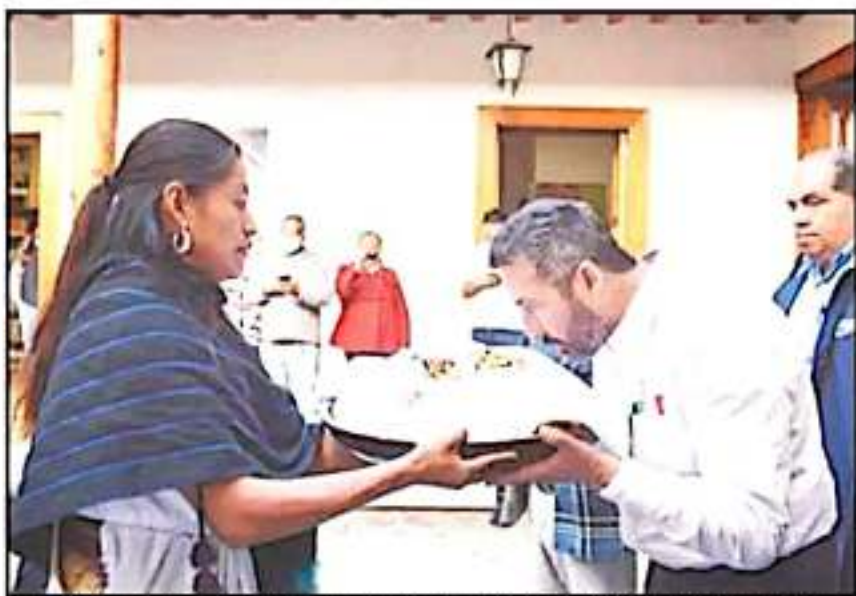
LOS CARGUEROS DEL FUEGO NUEVO PRESENTAN OFERTA AL EDIL DE PÁTZCUARO PARA RECORRER CON EL FUEGO NUEVO.

La caminata es acompañada por varias de las comunidades