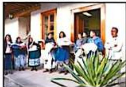
EL 1 DE FEBRERO SERÁ LA GRAN CELEBRACIÓN.