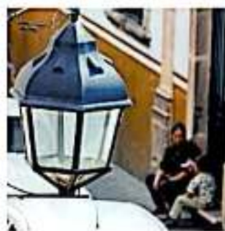
Con 70 mil lámparas se pretende iluminar al municipio. WOLFGANG