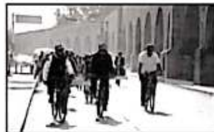
UNA RUTA DE 13 KILÓMETROS, SE ATENDERÁ EN FAVOR DE LOS USUARIOS DE BICICLETAS EN MORELIA.