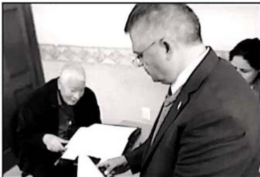
PERSONAL DE LA OFICINA DEL SUEUM SE NEGÓ A RECIBIR AL ABOGADO DE UMSNH CON LA RESPUESTA DE AUTORIDAD.