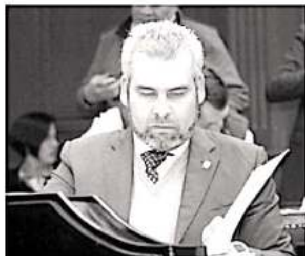
Alfredo Ramírez Bedolla, legislador de Morena.

La estabilidad futura de las finanzas estatales nos exige valorar de forma rigurosa la pertinencia de contratar y refinanciar deuda, sobre todo cuando no hay claridad de los proyectos en que se invertirán los recursos obtenidos mediante financiamiento; «la falta de planeación puede tener un costo muy alto para Michoacán», advirtió Ramírez Bedolla.