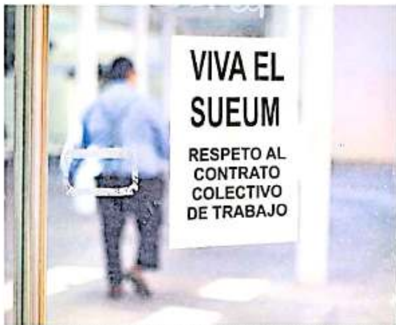
El plazo máximo expuesto por las autoridades nicolaístas para la firma de dicha reforma expiró el día de ayer.

Actualmente se les debe a los trabajadores afiliados al SUEUM los dos pagos de las quincenas de diciembre, así como las prestaciones del cierre de año