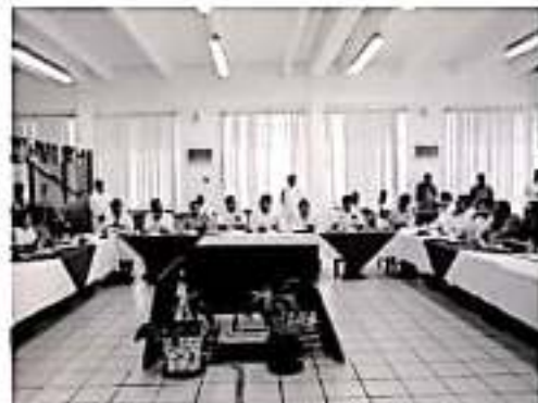
LÁZARO CÁRDENAS, MICH.- En Lázaro Cárdenas ha logrado consolidarse un modelo de seguridad aplicable también a las demás regiones de Michoacán.

El equipo de trabajo insistió en que se deben profesionalizar las Policías Municipales y elaborarse los Planes de Seguridad de los municipios para tener cuerpos policíacos más capacitados. En el encuentro estuvieron presentes el Fiscal General del Estado, Adrián López Solís; el comandante de la X Zona Naval, Vicealmirante Nairo Maqueda Mendoza; el secretario de Seguridad Pública del Estado, Israel Patrón Reyes; la presidenta de Lázaro Cárdenas, María Itzé Camacho Zapata; y los alcaldes de Arzaga, Tumbiscatio y La Huacana, entre otras autoridades municipales, estatales y federales.