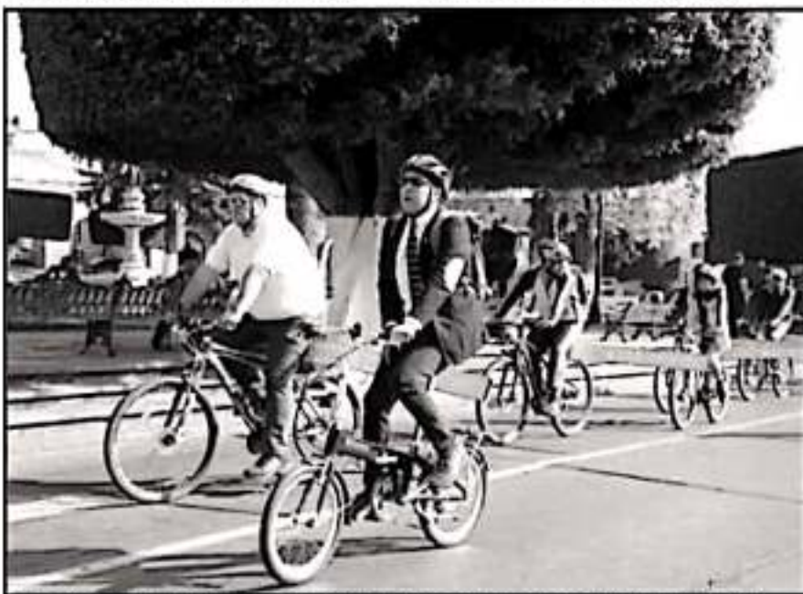
A LO LARGO DE LA AVENIDA MADERO SE MARCARÁ EL ESPACIO PARA LOS CICLISTAS, EL CUAL DEBE RESPETARSE.

nuevas rutas de uso exclusivo de los ciclistas.