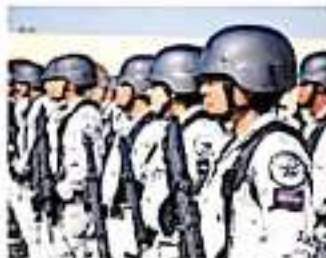
Continuará el arbo de más elementos de la Guardia Nacional en la zona.

Dicho cuartel cuenta con una extensión territorial de más de 17 hectáreas, ubicado en el poniente de Morelia, a razón del crecimiento demográfico de la ciudad, según lo dicho por autoridades municipales.