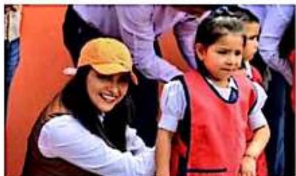
Programas como el de "Mochila segura" parecieran viables, pero ya la ONU se ha pronunciado acerca de que es violatorio del derecho a la intimidad. Saucedo Reyes.

Frente a tal situación, la legisladora subrayó que es necesario pensar a profundidad las medidas que deben instrumentarse para que las escuelas sean espacios seguros para los menores que diariamente acuden a formarse en ellas, de manera que su desarrollo no se vea afectado por la posibilidad de violencia en las aulas, y resaltó la importancia que en el hogar, los padres de familia también trabajen con sus hijos y tengan comunicación permanente.