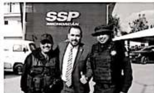
MORELIA, MICH.- En materia de seguridad el Gobierno Federal no debe heredar sus problemas a los Estados, por lo que de darse la incorporación de policías federales a corporaciones estatales es necesario que exista plena garantía de que se trata de perfiles de muy alto nivel.

nómico que tal medida representa. En el caso de Michoacán, el legislador hizo votos porque las autoridades estatales no se dejen presionar para aceptar la propuesta debido a que están en espera la firma del convenio para la descentralización educativa. "Hacemos votos porque la Federación no pretenda condicionar una cosa por la otra, y que por buscar una solución viable para la situación del sector educativo estatal, ahora se pretenda llamarnos como cesto de la basura para depositar los problemas que va generando el Gobierno Federal con sus acciones y políticas públicas", recalcó.