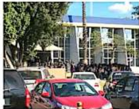
Desde los días siguientes de los detenciones se manifestaron en las afueras de la Fiscalía General del Estado. @BERANDA

La noche de este miércoles los dos estudiantes de la Normal Superior acusados de robo de mercancía y retención de vehículos de empresa privada fueron vinculados a proceso, informó la Fiscalía General del Estado (FGE).