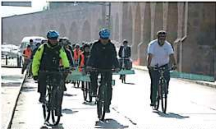
Actividades se vieron que la infraestructura ciclista hará mejoras en movilidad para el peatón y el usuario de la bicicleta. JOINTISA

"Un factor para no utilizar la bicicleta como medio de transporte es que los conductores de vehículos particulares