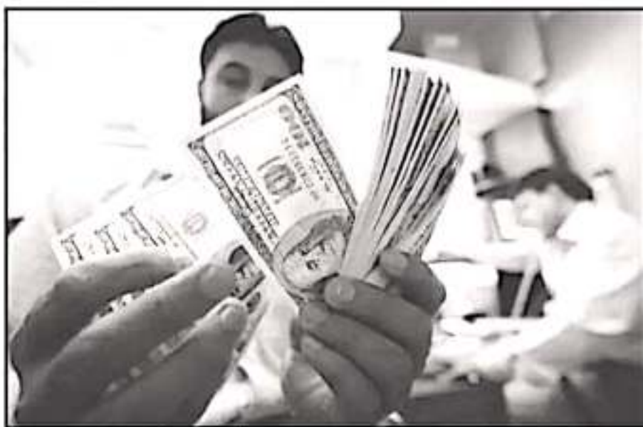
EL REPORTE DEL CEEM, SEÑALA QUE EL ÚNICO INDICADOR POSITIVO ES EL COMPORTAMIENTO DE LAS REMESAS.

10.4% DESCENDIÓ importaciones de la industria michoacana