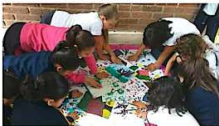
En un día no se presenta nada de la Fiscalía General a reclamar al menor, queda a disposición del DF. @BERANDA

La reforma de ley dice que se investigue únicamente a los papás, si no hay abuelos, para que los niños pasen el menor tiempo institucionalizados; "esta reforma ayudará muchísimo, porque yo no puedo dar un niño en adopción y