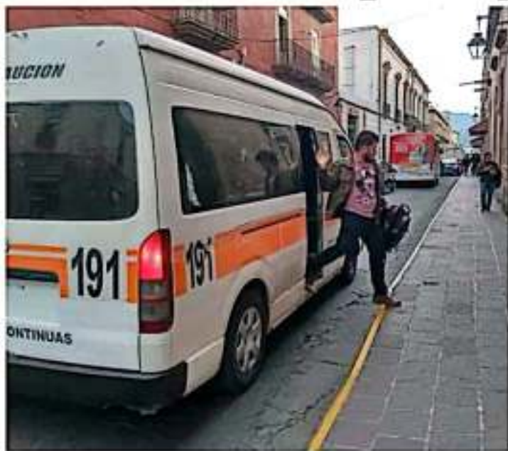
En redes sociales circulan rumores de un incremento en la tarifa.