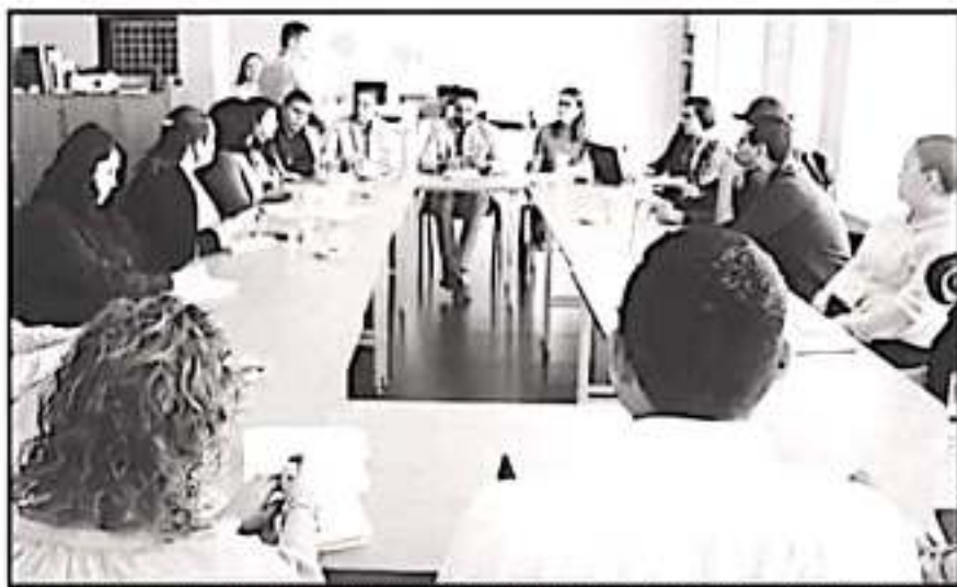
AUTORIDADES MUNICIPALES Y PERSONAL DEL INEGI REUNEN SOBRE LA ESTRATEGIA QUE SEGUIRÁN EN EL CENSO

Asimismo, se pondrán a disposición espacios físicos del municipio para la operación del módulo del INEGI, además de la información actualizada con que se cuenta en las diferentes oficinas relacionadas con la materia en cuestión. "El exhorto es para que la población abra las puertas de sus domicilios a los encuestadores y proporcionen la informa-