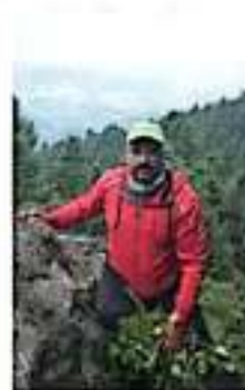
El señor Homero, como es conocido, denunció el pasado 13 de enero. @BERANDA

A demás, en muchas ocasiones se tiene que trabajar psicológicamente con los papás, porque algunas familias se olvidan, "no tienen a las reuniones".