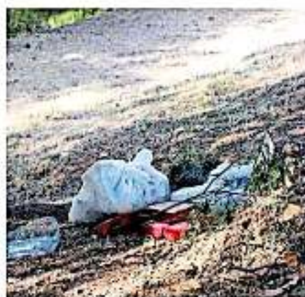
La legislación vigente, contempla la elaboración de programas en materia de residuos. (ARREVALCENA)

Seclusiona a las obligaciones para prevenir la contaminación de sitios por sus actividades y a llevar a cabo las acciones de remediación que correspondan; y por