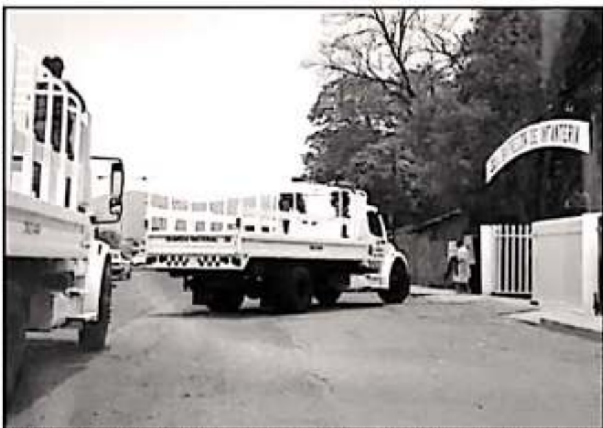
PREVEN QUE A FINALES DE FEBRERO SEAN INAUGURADOS LOS CUARTELES ESTATALES DE LA GUARDIA NACIONAL.