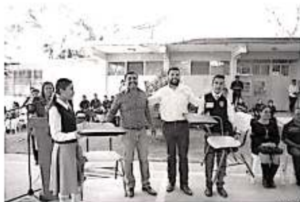
El diputado local, Octavio Ocampo Córdoba, durante su gira de trabajo.

CyTEM), José Hernández Areola, con quienes hicieron entrega de juguetes a los menores y realizaron diversas actividades recreativas.