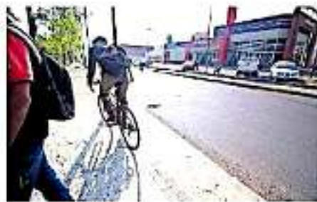
Con esta iniciativa se instalarán nuevas señalizaciones que hagan conciencia en el automovilista