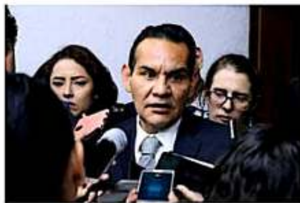
El titular de la ASM apuntó que en esta nueva era del organismo, los esfuerzos de inicio pondrán énfasis en el fortalecimiento del recurso humano.

Consideraron bienvenidas las opiniones y visiones de quienes comparten con ellos el mismo proyecto de luchar por un mejor Michoacán, pero reiteraron que en el ámbito de las responsabilidades que les confiere