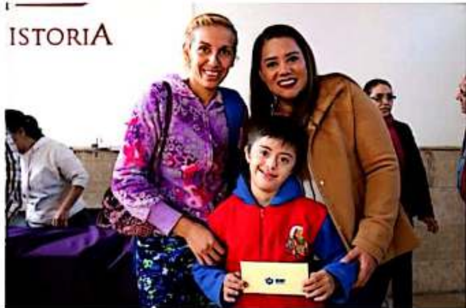
ZAMORA, MICH.- El Ayuntamiento de Zamora y el DIF municipal entregaron becas del Ramo 33 a niños y adultos con algún tipo de discapacidad.