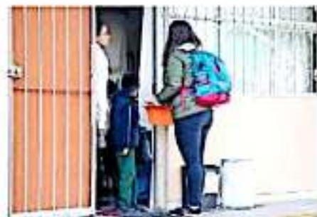
Las jornadas se llevarán a cabo del 22 al 24 de enero.