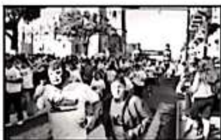
ORGANIZADORES REALIZAN CÁRTERAS COMO UNA FORMA DE HACER COINCIDIR SOBRE LA INCLUSIÓN