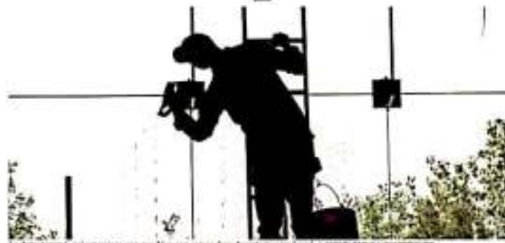
Se detecta la subcontratación ilegal en empresas con posibles riesgos de subcontratación ilegal.

Al participar en la conferencia matutina del presidente Andrés Manuel López Obrador, informó que las ci-