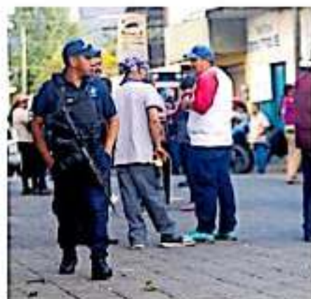
El CSIM exigió se destituya un mando policial.