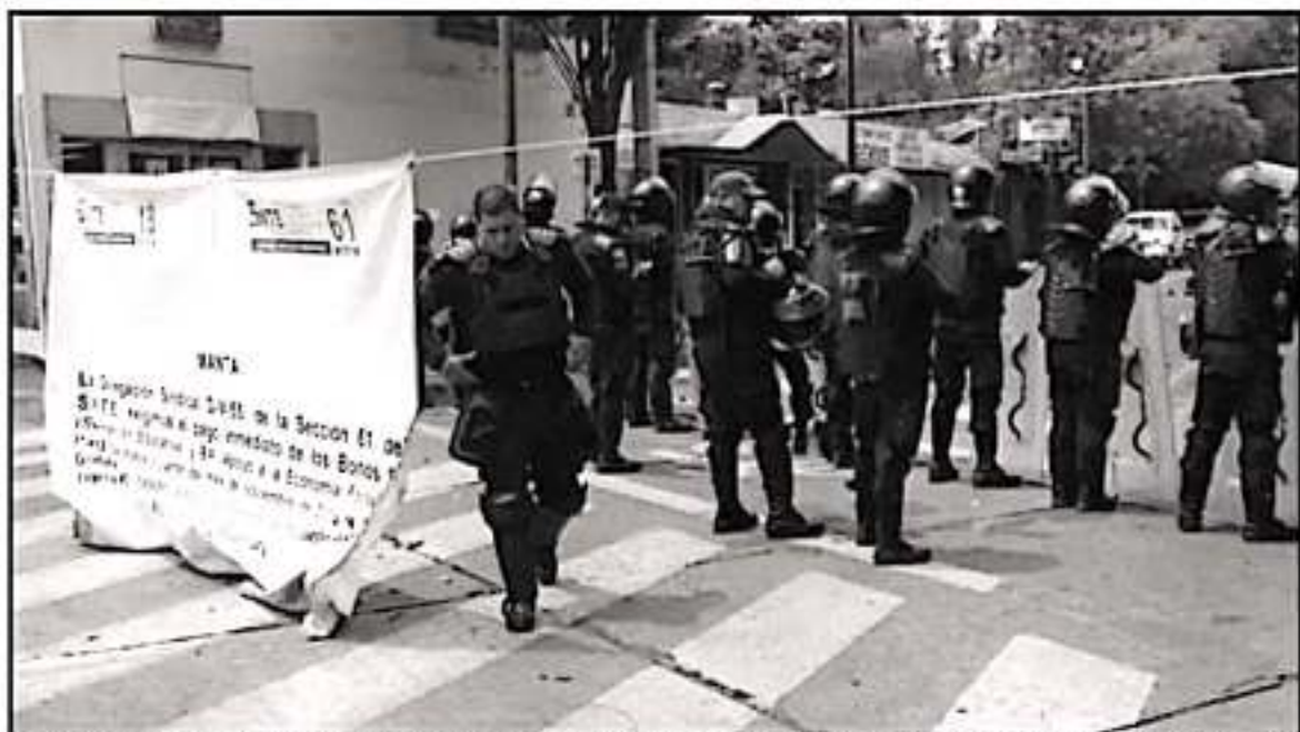
DESDE EL FIN DEL AÑO PASADO MAESTROS DE NIVEL MEDIO SUPERIOR DE TODAS LAS EXPRESIONES SINDICALES HAN TENIDO PROBLEMAS EN CUANTO A PAGOS

En un primer momento detalló que en lo que corresponde al panorama nacional piden “piso parqué” para todas las expresiones