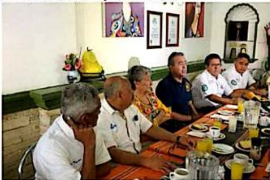
Aspecto de la conferencia de prensa de los integrantes de Bomberos Voluntarios de la Costa Sierra de Michoacán, A. C.

rero, y consejeros de vigilancia y justicia, respectivamente.