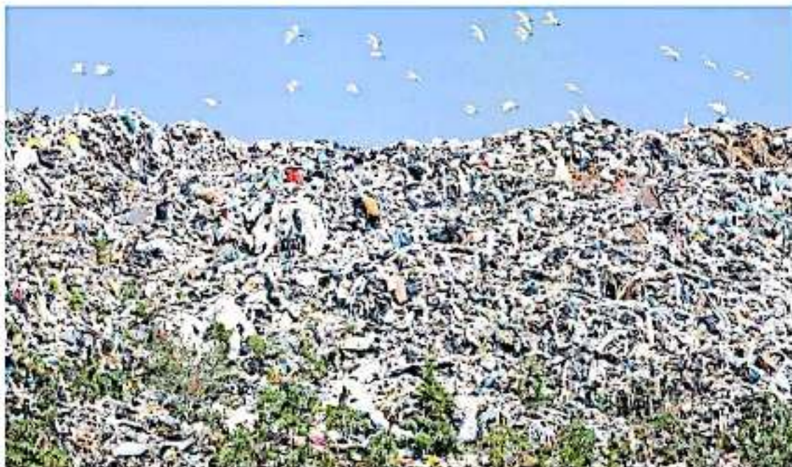
Se debe avanzar en la cultura ciudadana sobre el reciclaje y la reutilización de materiales.