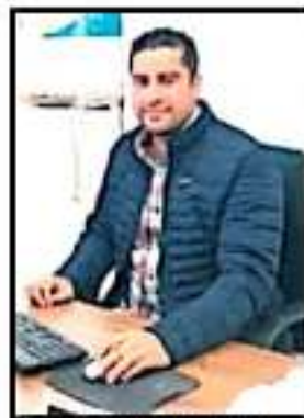
UNAM ACTUALIZARÁ MAPA.

La Piedra Piramidal es una piedra de origen volcánica con forma de que era la arquitectura sagrada de los purépechas y representa el calendario, en ella se han grabado símbolos que representan a los comerciantes que han sido sede del evento.