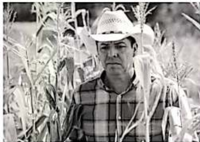
CIUDAD DE MÉXICO.- El Senador de la República, Toño García, respaldó a los campesinos mexicanos y se comprometió a trabajar con sus homólogos de los Estados Unidos.

"Resulta altamente preocupante para el sector agroalimentario mexicano, porque no debe haber un tratamiento especial para productos estacionales o perecederos, ya que iría contra las ventajas competitivas y comparativas de cada región o país".