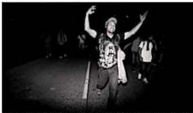
Cientos de hondureños salen este 15 de enero de 2020 de la Gran Central Metropolitana de la ciudad de San Pedro Sula al norte de Honduras.

Agregó que "México no es solo un país de tránsito, que dé un salvoconducto, es un país que abre sus puertas para recibir a las personas que quieren entrar y migrar a nuestro país".