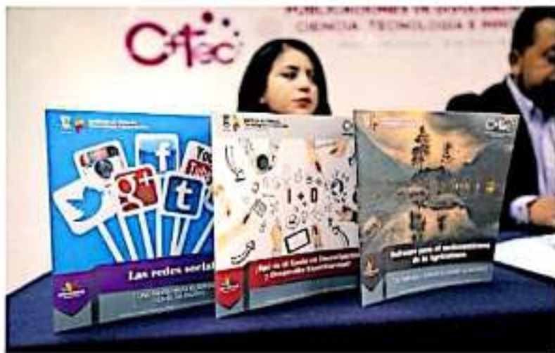
Se informó que cuentan con una bolsa de 100 mil pesos, destinados principalmente para la impresión, edición y corrección de los ejemplares.

Previamente en el caso de C+Tec, se reciben textos en diferentes géneros como artículos, ensayos, reseñas, noticias y reportajes, todos bajo la temática "Problemas de las Humanidades, la ciencia, la tecnología y la innovación para el desarrollo de Michoacán" con máximo de dos auto-