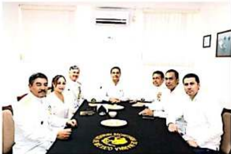
CD. LÁZARO CÁRDENAS, MICH.- El gobernador Silvano Aureoles, reconoció que en la nueva estrategia para la construcción de la paz, las Fuerzas Armadas son un pilar insustituible.

Finalmente, con la entrega de un reconocimiento al almirante Salvador Gómez Meillón, el gobernador Silvano Aureoles reiteró su agradecimiento a la Marina Armada de México, por su compromiso en el cumplimiento del Estado de Derecho en una de las regiones económicas más importantes del estado y del país, como lo es Lázaro Cárdenas.