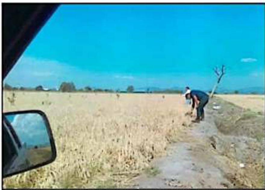
LOS DAÑOS POR LAS HELADAS EN ALGUNOS CULTIVOS COMO LA AVENA SON EVIDENTES, LA ALERTA CONTIÚA.