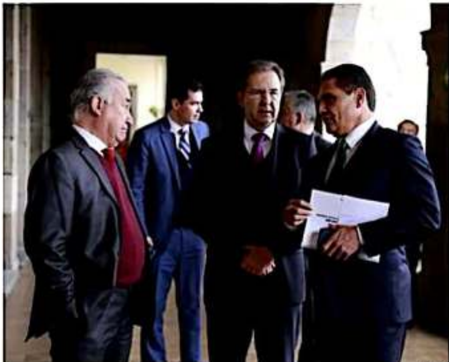
Setienen gobernador y Esteban Moctezuma reunión para dar seguimiento al acuerdo educativo.

«Este proceso implica acabar con inercias burocráticas, intereses particulares o de grupo y muchos vicios que se fueron arraigando en la educación de Michoacán; por eso, con el apoyo del presidente Andrés Manuel López Obrador seguiremos dan-