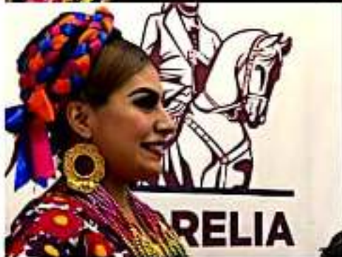
MORELIA, MICH.- Ballet Folklórico de Morelia y Grupo Gabán realizarán gira del 11 al 20 de febrero.