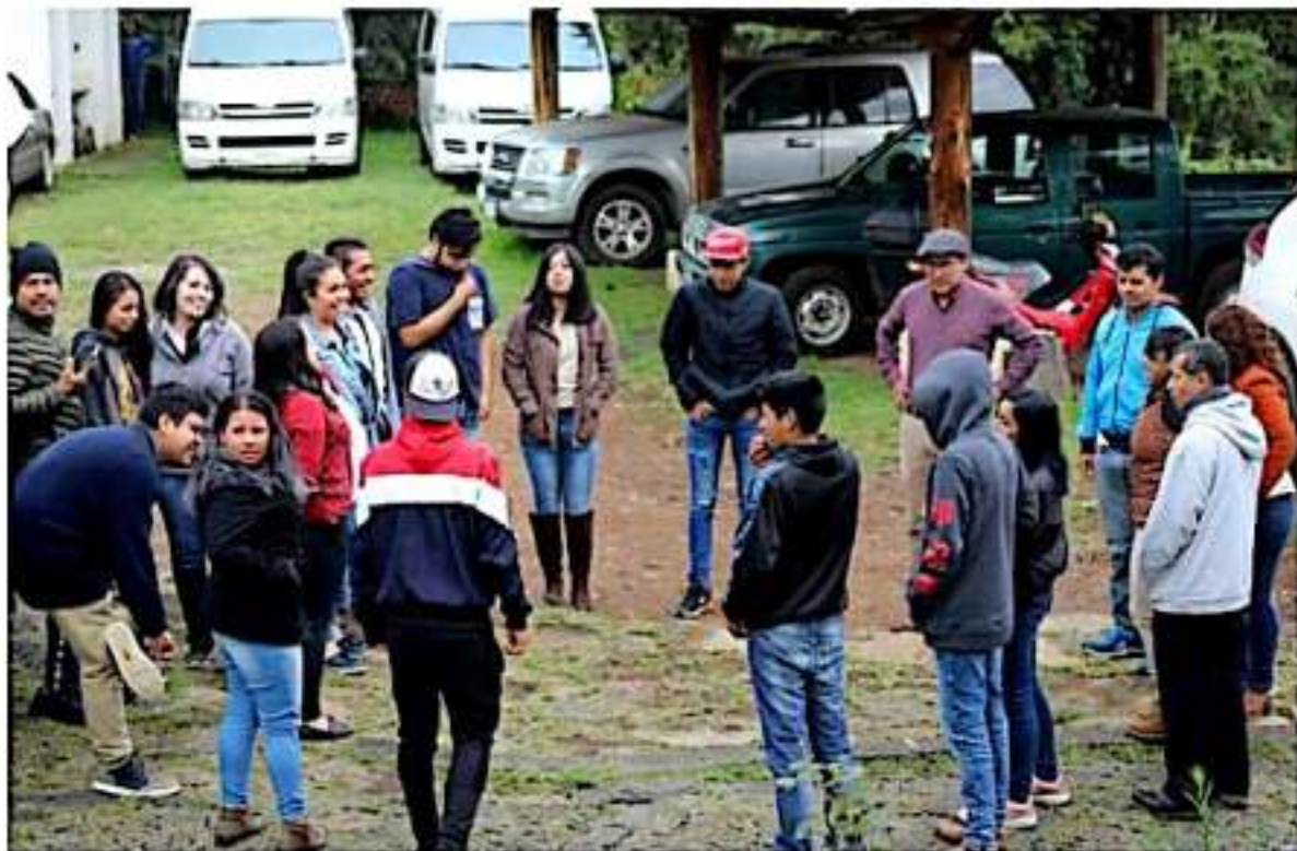
Durante la reunión, se acordó realizar una jornada de capacitación y sensibilización y, posteriormente, foros de discusión en los que podrá participar toda la comunidad universitaria.