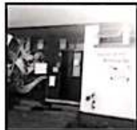
PANDARTAS DE PROTESTA, DESDE DICIEMBRE NO RECIBEN SUELDOS