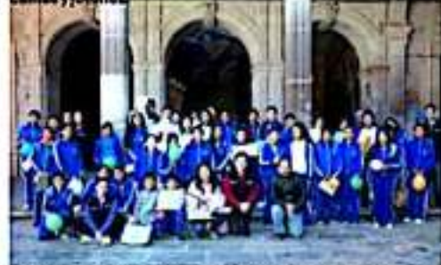
MORELIA, MICH.- Alumnos de la Telesecundaria de Teremendo de los Reyes visitaron Palacio de Gobierno.