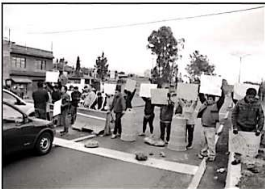
VECINOS CERCAVIDO A LA COLONIA MARANTALES SE MANIFIESTARON POR LA CICLOVIA QUE CONSTRUYE EL AYUNTAMIENTO.

cios que estamos en quiebra por la obra y porque con la ciclovia ya no va a haber lugar donde estacionarse sobre avenida Madero. Nuestros clientes ya no van a tener donde estacionarse. El gobierno nos ha obligado a tomar este tipo de acciones porque no nos escucha, tenemos desde el mes de octubre haciéndole un llamado a la autoridad y nos ha dado evasivas. Llevamos pérdidas de más del 80 por ciento y con la ciclovia estaríamos en una quiebra rotunda", añadió el vecero.