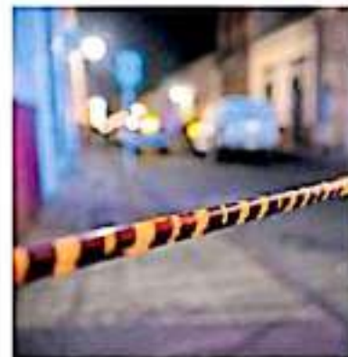
Se localizaron cuatro cuerpos sin vida de varones, también había armas

En el lugar localizando los camiones de modelo reciente una con placas de Michoacán y otra de Jalisco, cerca de las unidades se encontraron sin vida a cuatro personas del sexo masculino, con vestimenta relativa al uso de las