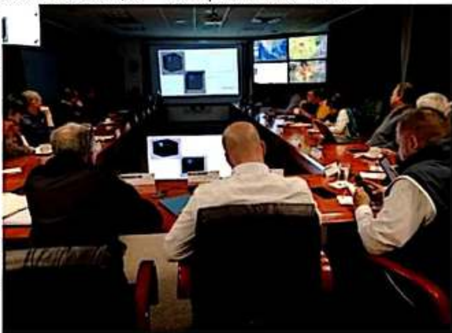
Aspecto de la reunión del Cenapred y científicos de la UNAM y de la UMSNH en torno al "enjambre sísmico" que ha estado ocurriendo en Michoacán.

propagar rumores sin fundamentos, esto solo genera desinformación y miedo innecesario. El Sistema Nacional de Protección Civil trabaja día y noche para mantener a la población segura e informada.