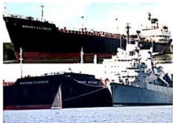
CD. LÁZARO CÁRDENAS, MICH.- Durante 2019 pasaron a chatarra 674 buques oceánicos, de los cuales el 90 por ciento fueron desmantelados en solo tres playas de Bangladesh, India y Pakistán, destacando que esta actividad productiva en la desembocadura del río Balsas tuvo un paso fugaz.

Otro barco de la Armada que acabó inactivo en Lázaro Cárdenas fue el Quetzalcóatl y el Vicente Suárez y un dragaminas, de los tres