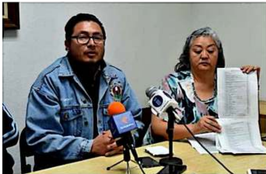
Presentan denuncias por despojo de instalaciones y presuntos ataques a las vías de comunicación.

En las respectivas denuncias o querrelas, la Universidad Michoacana de San Nicolás de Hidalgo subraya que al no tener la posesión de las instalaciones de Radio Nicolaita, «no puede hacerse responsable sobre la transmisión de programación previamente pautada, incluyendo la transmisión de la pauta federal que se debe transmitir a requerimiento de las diversas