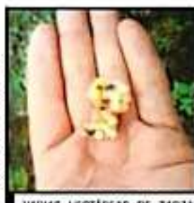
VARIAS HECTÁREAS DE ZARZAMORA SE HAN VISTO AFECTADAS.