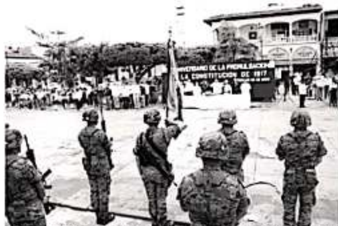
AUTORIDADES Municipales, Estatales, Federales, Educativas y estudiantes, conmemoraron el 103 Aniversario de la Constitución de 1917 con un acto cívico en la plaza de Los Corahuayentes.

Expuso que toda la energía del primer año del gobierno de México, solo se enfocó dentro del marco que brinda el texto constitucional, mismo que ha sido objeto de reformas, para dar cabida al reto de la transformación.