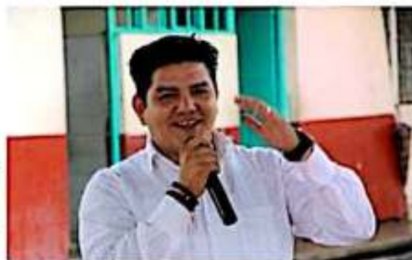
Impulsa gestiones en favor del desarrollo educacional de Gabriel Zamora.

Luego de emprender un recorrido de inspección por planteles educativos ubicados en la localidad de Lombardía, perteneciente al municipio de Gabriel