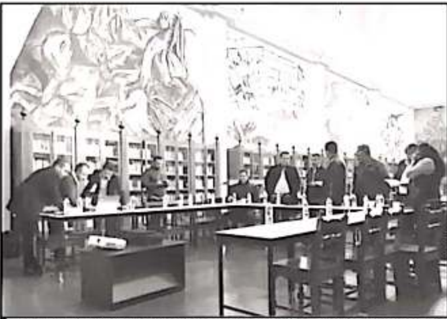
ASPECTOS DE LA REUNIÓN EN QUE SE DIO A CONOCER LA CONVOCATORIA PARA LA ELECCIÓN DE DIRECTOR GENERAL.

rio estatal, en la entidad se generan de manera diaria alrededor de cuatro mil 200 toneladas de basura, "basura que va a terminar a nuestros ríos, lagos, océanos y las calles"; señaló que a través de este proyecto se resolverá de manera circular el tema de la generación, recolección y disposición final de las poco más de 200 toneladas di-