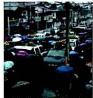
URUAPAN, MICHOACÁN.- En medio de lágrimas y una intensa lluvia, terminó la misa de cuerpo presente para siete de las nueve víctimas mortales del ataque a un negocio de maquinitas en días pasados en esta ciudad.

De la investigación, hasta el momento no se ha dado a conocer ningún detalle