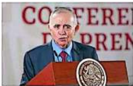
El presidente trae el anuncio en conferencia.

El pasado 29 de enero, el mandatario informó que, tras una reunión en Palacio Nacional con el gabinete ampliado, se constituyó el nuevo equipo