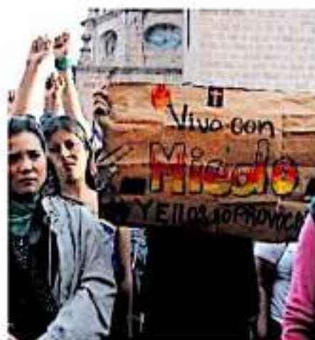
Se registró un total de 172 víctimas de homicidio doloso en 2019.