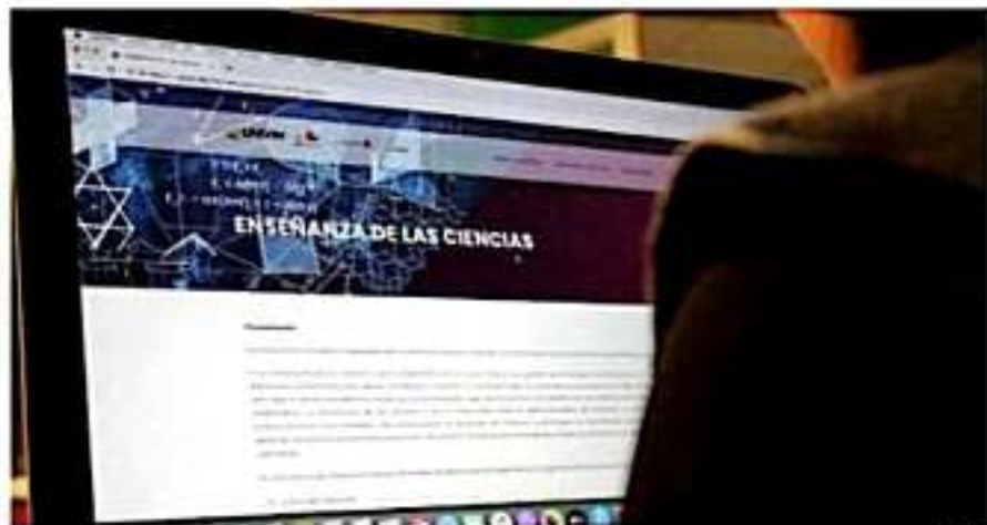
La Univim, cuenta con 6 licenciaturas, 15 maestrías, 3 doctorados, 23 especialidades, más cursos y diplomados, mucha de esta oferta académica está dirigida al área educativa.

La Univim, cuenta con 6 licenciaturas, 15 maestrías, 3 doctorados, 23 especialidades, más cursos y diplomados, mucha de esta oferta académica está dirigida al área educativa, como las maestrías en: Innovación Pedagógica, Competencias Pedagógicas para la Acción Educativa, Enseñanza de las Ciencias con terminales en Matemáticas, Física, Biología y Química, además se tiene el curso de Planeación