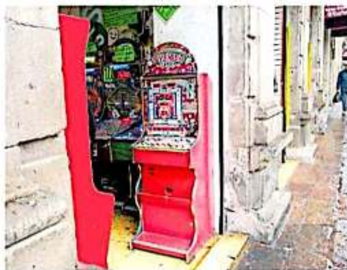
Este tipo de espacios pueden ser perjudiciales para menores de edad. ANA AREZ

Dichos lugares cuentan con licencias de operación tipo B, pues son considerados centros de esparcimiento, según el Reglamento para el funcionamiento de Establecimientos Mercantiles, Industriales y