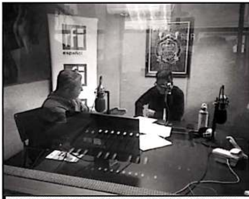
RADIO NICOLAITA ES UNA DE LAS ESTACIONES DE RADIO CON MAYOR TRADICIÓN EN LA CAPITAL MICHOACANA