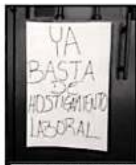
EMPLEADOS ACUSAN A LA DIRECCIÓN DE ACOSO Y FALTA DE PAGO

La Universidad justificó que "no puede hacerse responsable sobre la transmisión de programación previamente pactada, incluyendo la transmisión de la pauta federal que se debe transmitir a requerimiento de las diversas instancias federales competentes, como lo son la Secretaría de Educación Pública, la Secretaría de Goberna-