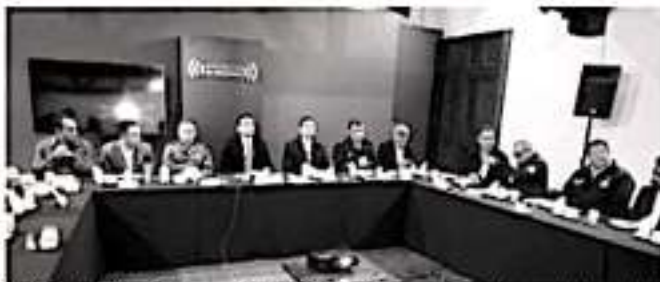
MORELIA, MICH.- En la reunión de trabajo se dieron a conocer los resultados de las acciones operativas de las últimas horas.