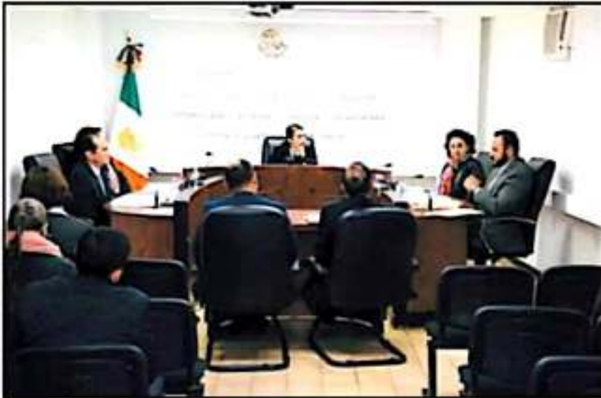
RESOLVIÓ EL TEEM NO PODER INTERVENIR EN LA ASIGNACIÓN DE RECURSOS EN TARECUATO Y CUANAJO.