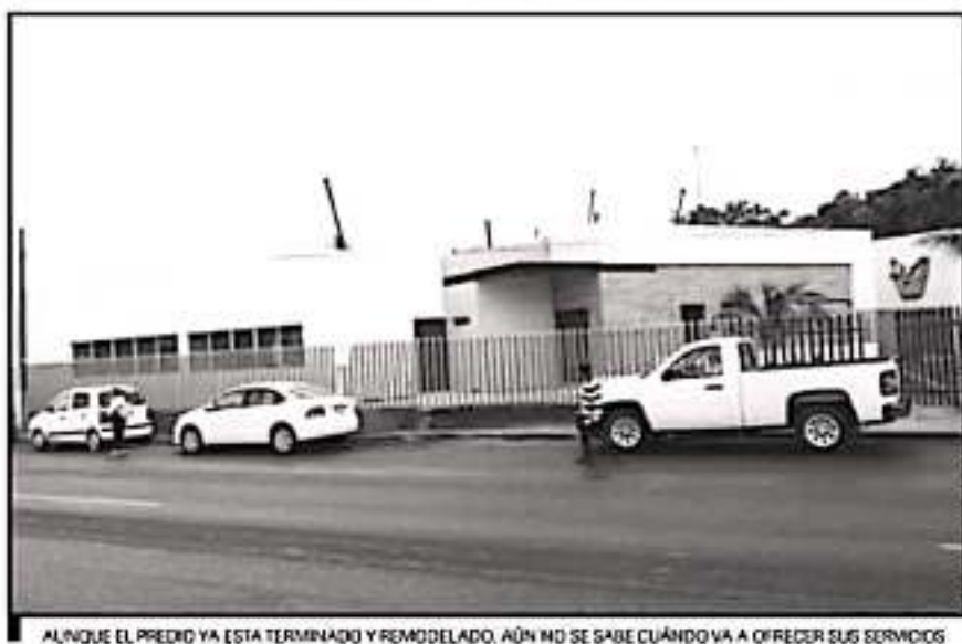
AUNQUE EL PREDIO YA ESTA TERMINADO Y REMODELADO, AÚN NO SE SABE CUÁNDO VA A OFRECER SUS SERVICIOS

con las obras de ampliación y remodelación la Guardería 001 tendría una capacidad instalada para 50 menores.