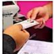
El 30 de noviembre durante el año la apertura de sus 41 módulos de atención ciudadana en el estado.