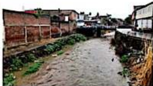
LOS REYES, MICH.- Los ríos que cruzan la ciudad registraron un aumento en su caudal, afortunadamente sin riesgo de desbordamiento.

Si bien ayer por la tarde la lluvia cesó, el pronóstico se mantiene al menos hasta el próximo viernes 7 de febrero, por lo que la alerta se mantiene hasta entonces. Por otra parte, se prevé un considerable descenso en la temperatura, por lo que invitó a la población a tomar todas las precauciones pertinentes, finalizó.