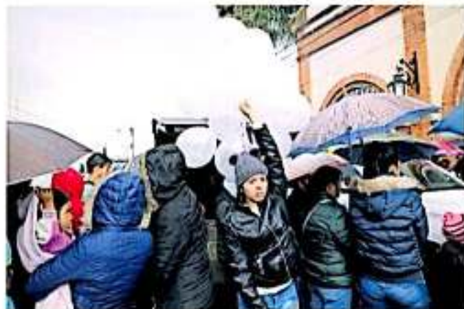
No se permitió el ingreso de los medios de comunicación al recinto religioso a fin de mantener en la privacidad al último adiós a los fallecidos.

Pese a que no se permitió el ingreso de los medios de comunicación al recinto religioso a fin de mantener en la privacidad el último adiós a los ahijados, la exigencia de justicia se hizo presente a través de los llantos y las exclamaciones de padres, madres y demás familiares para que se de