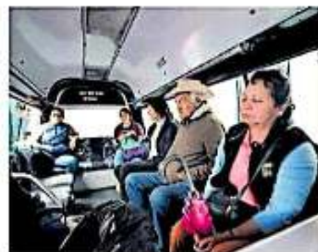
Plantean regular las concesiones del transporte y permitir la operatividad @elsoldadomorelia

tengas todas las prestaciones que te corresponden, que se te entregue una concesión como debe ser, en escalafón y dependiendo la demanda de transporte, pero que no se sigan entregando a discreción a ciertos líderes, porque resulta que al último no reparten nada", expresó.