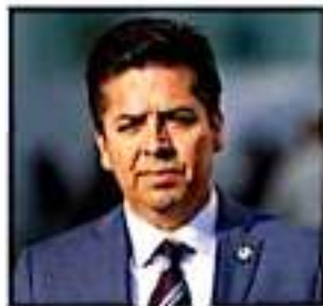
CIUDAD DE MÉXICO.