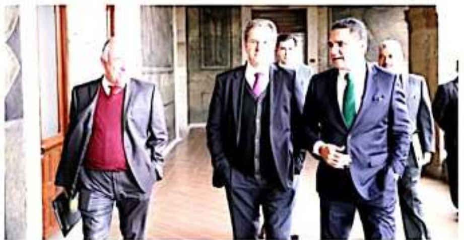
CIUDAD DE MÉXICO.- Sostienen al gobernador Silvano Aureoles Conejo y el titular de la SEE Esteban Moctezuma reunión para dar seguimiento al acuerdo educativo.

Si bien dijo se debe conocer a fondo en qué términos caminarán, pero el hecho de que se reconozca que algo no está bien, y en la práctica no se están viendo los resultados que se quisieran y lamentablemente los hechos de Uruapan se repiten en diferentes puntos del país, y a partir de la entrada del Gobierno Federal se incrementó los delitos, y no existe apoyo a los elementos de seguridad municipal.