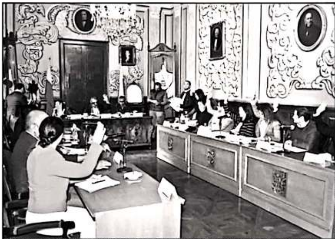
SE TENSAN LAS COSAS EN EL CABILDO DE MORELIA DEBIDO A UN SUPUESTO CASO DE ACOSO SEXUAL, DOS REGIDORAS DISCUTEN SOBRE ESTE TEMA

Fue el pasado 28 de enero cuando la denuncia de presunto acoso sexual se dio a conocer en medio de un evento público del Ayuntamiento de Morelia. Sin embargo, en las declaraciones de personas presentes, no figuraba un nombre o cargo específico. Al