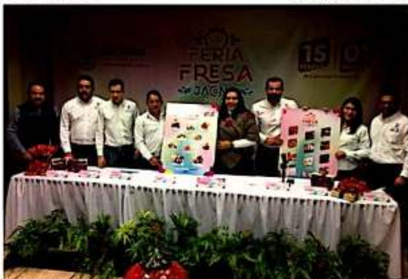
IACONA, MICH.- Esta feria contará con zona gastronómica, agroindustrial, artesanal, exposición ganadera, granja interactiva para los pequeños, zona extrema, etc.

Cabe señalar que los habitantes de esta colonia han buscado concluir estos trámites y tener la confianza de que el terreno está a su nombre y es de su propiedad desde hace más de 20 años. Por este motivo el Gobierno Municipal que preside el alcalde Martín Samaguey Cárdenas convoca a los colonos, líderes o asociaciones acercarse al ayuntamiento para detallar su estatus y culminar los trámites que mejoren la calidad de vida de los zamoranos.