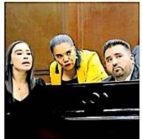
Se rechazaron las versiones de que el 19 de febrero regresarían a las actividades legislativas