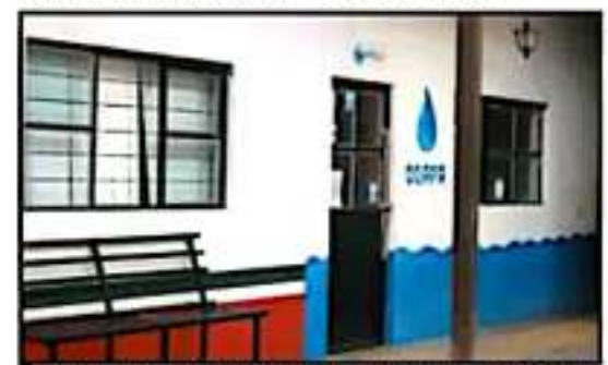
ASPECTO DEL DIAPAS EN CHURINTZIO; SU EXDIRECTOR TAMBIÉN ESTÁ SEÑALADO POR DESVIOS DE RECURSOS PÚBLICOS MUNICIPALES.