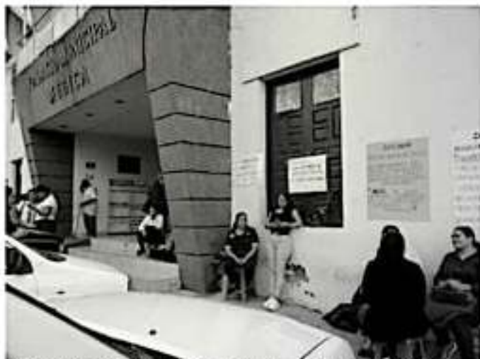
NUEVA ITALIA, MPIO. DE MÚGICA.- Trabajadores adheridos al SITCOBEM, se plantaron afuera del Palacio Municipal para exigir al gobierno del Estado el pago de prestaciones que les adeudan.

prestaciones; le piden al gobernador Silvano Aureoles Conejo, se les pague convenios ya pactados, ante el retraso de los mismos. En cartulinas dicen que son continuas las violaciones a las condiciones generales de trabajo por lo que aseguran harán estos plantones y otras acciones de presión, hasta que les sean cubiertos los pagos que les adeudan.