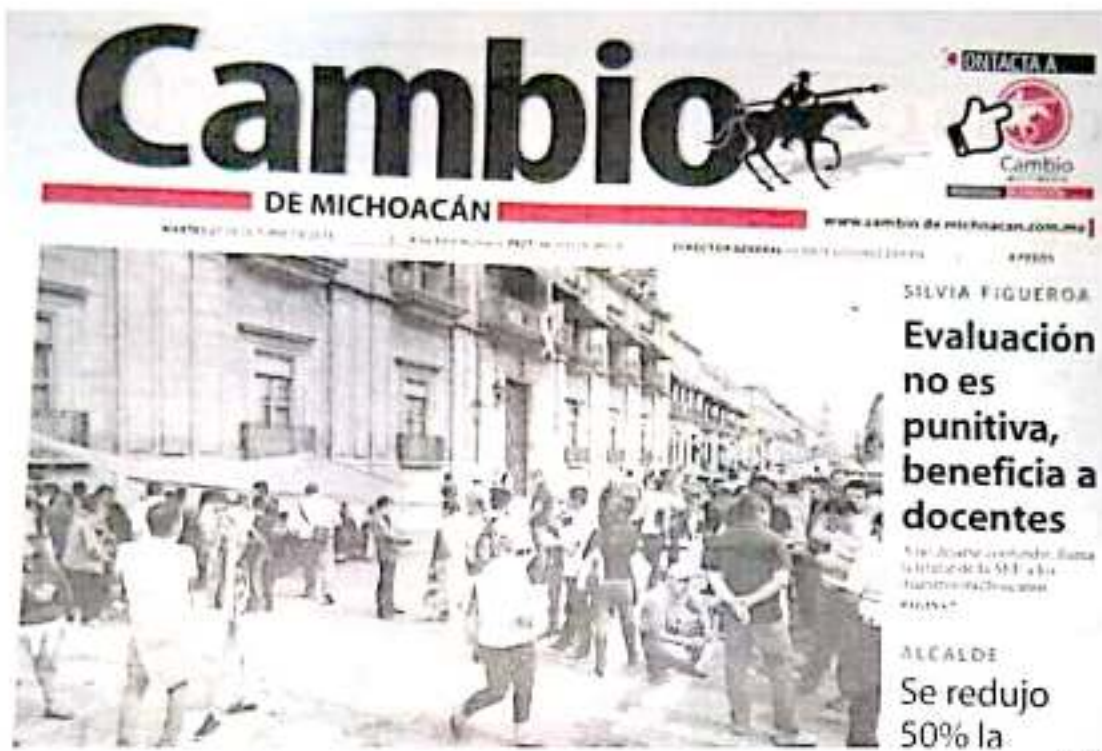
Aspectos de una portada de Cambio de Michoacán .

La viabilidad financiera de los diarios y semanarios de carácter político es complicada, más aun en México donde por años han dependido de la publicidad oficial o gubernamental y en menor medida de la comercial o don-