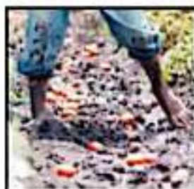
PREOCUPA A AGRICULTORES QUE SE PROLONGUEN LOS FRÍOS.