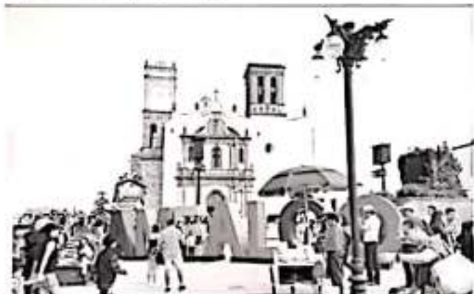
El presidente de la Concanaco, José Manuel López Campos, dijo que si se eliminaran estos fines de semana largos serían afectados pueblos mágicos, destinos cercanos a las metrópolis y los puertos.

destinos cercanos a las metrópolis y los puertos que son destinos para pasar estos días de asueto" afirmó. Lo anterior tendrá un impacto a la economía del país, porque esos fines de semana generan recursos para empresas y gobierno. Por ejemplo, el fin de semana pasado se registraron un millón 600 mil turistas que permitieron a los hoteles tener una ocupación de 62% y dejaron una derrama de 4 mil millones de pesos. "Adicionalmente en el área comercial también afectaría al programa que más éxito ha tenido el comercio, que es El Buen Fin, que se realiza fin de semana largo, correspondiente al lunes del 20 de noviembre, ya no tendríamos los 4 días de El Buen Fin, en los que se vendieron 120 mil millones de pesos", añadió.