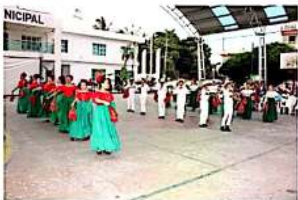
PETATLÁN, GRO.- Panorámica de los diferentes grupos de baile de las diferentes escuelas participantes.

El segundo evento realizado ayer con motivo de conmemorar los 103 años de la Constitución Política de los Estados Unidos Mexicanos y el 85 aniversario de la Erección del municipio, cerrando el evento con un programa cultural por la tarde de ayer, donde se dio un gran espectáculo de bailes regionales de todo el estado donde estuvieron presentes diferentes directores y regidores de la comuna petateca.