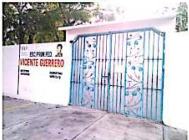
CD. LÁZARO CÁRDENAS, MICH.- Sin reportes de cobros de cuotas durante los dos primeros días del periodo de preinscripciones escolares.

En caso de no tener respuesta se debe presentar la queja en las supervisiones escolares, jefaturas de sector y por último a la Dirección Regional de Servicios Educativos donde se hará una investigación y dará seguimiento al caso para que ningún alumno se quede sin estudiar.