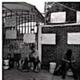
URUAPAN, MICH.- mantienen tomado el plantel desde el pasado jueves 30 de enero.

La Escuela de Educación Especial "Margarita Gómez Palacios", se ubica en la calle Aguálla, un número, del fraccionamiento Residencial Cupestrío, en esta ciudad.