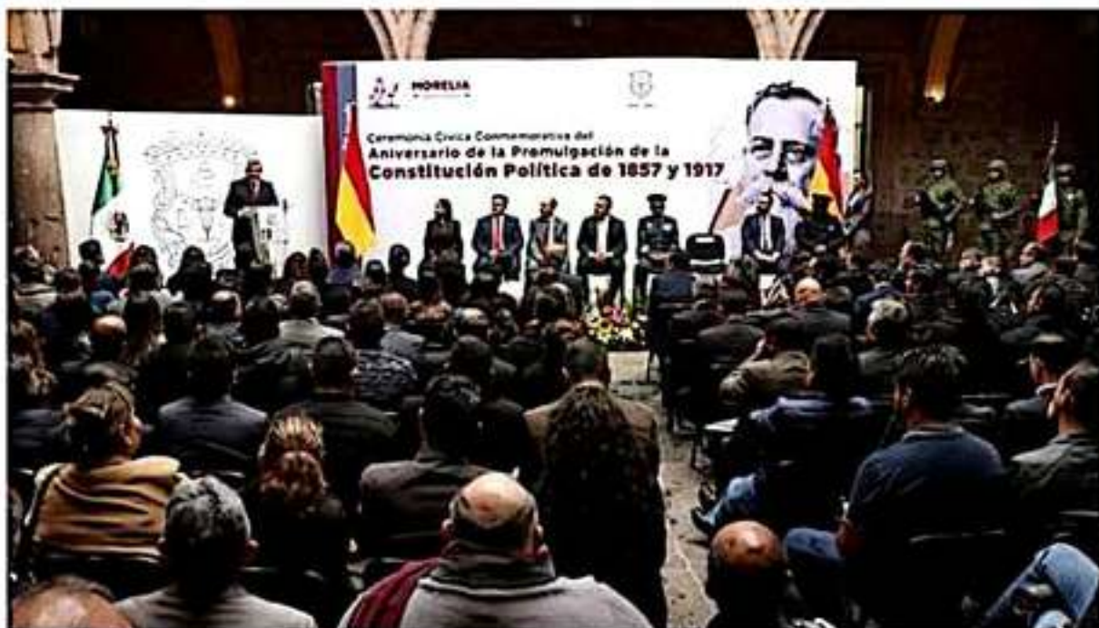
El magistrado penal funge como orador oficial en la ceremonia cívica conmemorativa por el aniversario de la promulgación de la Constitución Política 1857 y 1917.

Asimismo, agregó que una Constitución debe contener y reflejar los anhelos y valores de un pueblo y, en el transcurso del tiempo, le corresponde a cada generación exigir preponderancia a uno o varios de éstos. «Hoy por hoy, considero que lo que se reclama es una mejor economía y seguridad; sin la economía suficiente no se cumple con las garantías sociales y económicas, y sin la seguridad suficiente no se percibe la tranquilidad y la paz». El magistrado de la Cuarta Sala Penal finalizó expresando que la ciudadanía puede contar con la seguridad de que el texto fundamental que hoy nos rige seguirá vigente y actuando en beneficio del país, «en la medida que todos cumplamos con la Constitución, nos garantizaremos a nosotros mismos el orden, el respeto y la paz de la Nación».