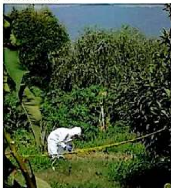
En un predio baldío en Uruapan, ayer fue arrojado desde un vehículo el movimiento, el cadáver de un hombre.

Posteriormente se presentó el personal de la Fiscalía e inició las investigaciones y el levantamiento del cadáver.