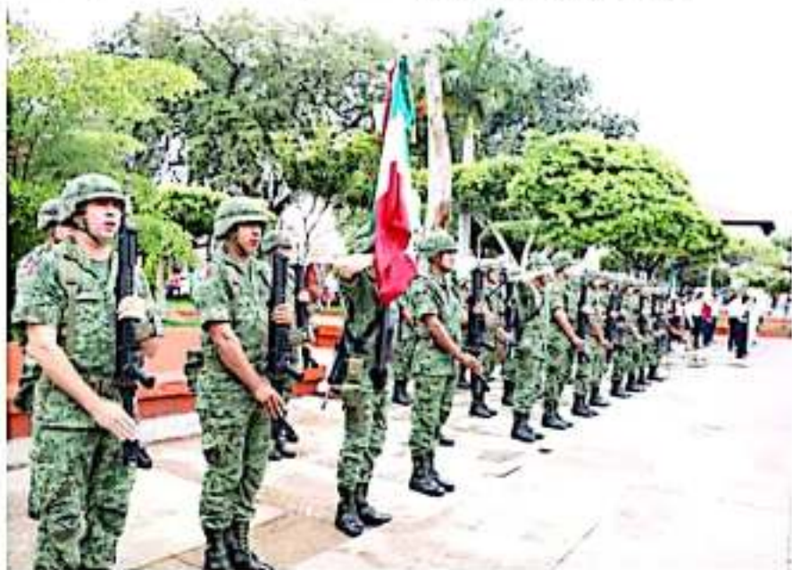
APATZINGÁN, MICH.- Presidente municipal, expuso que México vive tiempos de cambio y de transformación a una nueva forma de gobernar.

En ese sentido, recalcó que el nuevo régimen con AMLO a la cabeza, inaugura una cuarta transformación del país, "donde las mayorías cobran vigencia y se vuelven visibles, donde los desvalidos son primero, donde los jóvenes son escuchados y apoyados y donde las mujeres dejan su huella; en suma se vive una etapa en donde los mexicanos recobran su dignidad y se convierten en la centralidad de la acción pública mediante el ejercicio responsable de gobierno". Expuso que toda la energía del primer año del gobierno de México, solo se entiende dentro del marco que brinda el texto constitucional, mismo que ha sido objeto de reformas, para dar cabida al reto de la transformación.