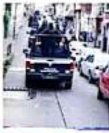
Elementos de diferentes corporaciones de seguridad han reforzado la vigilancia en el municipio.

El mandatario encabezó en Morelia la reunión de la Mesa de Coordinación, en la que confluyen corporaciones de seguridad e investigación de delitos de los tres órdenes de gobierno.