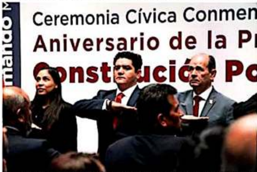
El presidente de la mesa directiva del Congreso local, Antonio de Jesús Madriz Estrada, presente en el aniversario de la promulgación de las constituciones de 1857 y 1917.

De esta manera, la 74 Legislatura refrenda su compromiso de contribuir juntos, sociedad y gobierno, al desarrollo integral del estado y por ende, de los michoacanos.