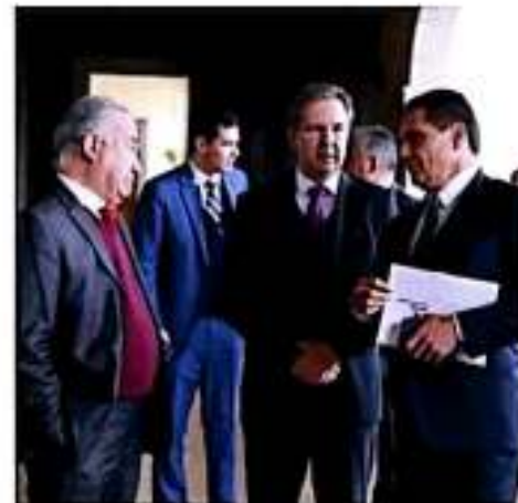
El gobernador Silvano Aureoles Conejo se reunió con el secretario de Educación Pública, Israel Patrón Reyes, para dar seguimiento al nuevo acuerdo educativo. “Queremos asegurarnos de que todo avance conforme a la meta que nos tenemos, de que Michoacán sea modelo nacional, garantizando, mediante la entrega de pago a miembros y escuelas, el derecho de ellas y niños a la educación”, puntualizó el mandatario estatal. |COMTSA