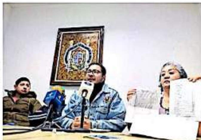
Se consideró que la toma de las instalaciones era una ilegalidad. (FRANCISCO VALENZUELA)

LA UMSNH presentó una segunda denuncia en el ámbito federal por ataque a las vías de comunicaciones, toda vez que la estación está considerada como un bien de la Nación.