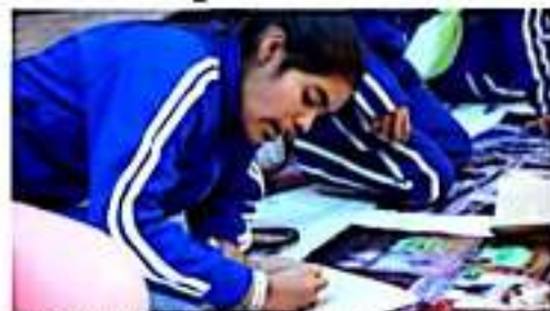
MORELIA, MICH.- En el marco del programa Historia Monumental se realizaron dinámicas lúdicas para niños, adolescentes y jóvenes.

Para ello se emplean una serie de técnicas y herramientas pedagógicas, que facilitan la comprensión y apropiación de la información y garantizan que este legado pase a las nuevas generaciones.