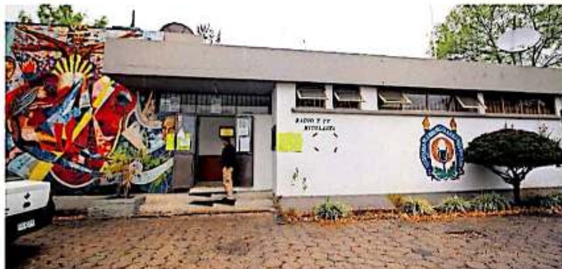
UMSNH presentó una segunda denuncia en el ámbito federal por ataque a las vías de comunicaciones. (MARIBEL LUNA)