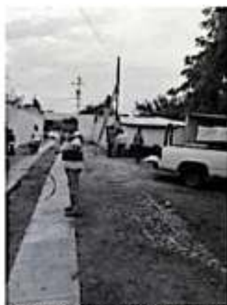
NUEVA ITALIA, MPIO. DE MÚGICA.- El gobierno municipal que preside Raymundo Arreola Ortega realiza obra eléctrica en la tenencia de Huerta de Gámbara.

aprendizaje de cientos de alumnos se viera afectada. Por ello, de manera inmediata Raymundo Arreola instruyó al personal del Área de Alumbrado Público municipal para que se abocara a darle solución a la problemática, por lo que expertos en la materia revisaron el sistema eléctrico que alimenta a la institución, para llegar al punto en que todo el cableado en malas condiciones fuera reemplazado por uno nuevo. Arreola Ortega aprovechó para señalar la disposición que su gobierno tiene para atender necesidades básicas que afectan a los pobladores del municipio, en especial las que van relacionadas con el ramo educativo, "ya que son aspectos prioritarios que tenemos que atender de manera inmediata, porque son los jóvenes y niños los que merecen toda nuestra atención", finalizó el edil.