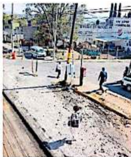
Se tiene un avance del 40 por ciento de la obra (MAYRA LUNA)

El secretario del ayuntamiento y la directora de Inspección y Vigilancia coincidieron que este tipo de espacios pueden ser perjudiciales para menores de edad, pese a que su entrada está prohibida por la ley, pero "hay algunos que camuflan sus máquinas con otro tipo de juegos no son de apuesta y así es más complejo identificar", comentó Arriola Reyes.