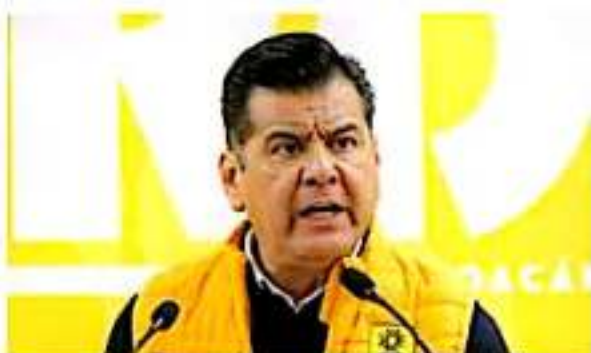
Todo nuestro respaldo al Gobierno Estatal: Juan Bernardo Corona.

líder del PRD- "en el combate a la delincuencia es importante la coordinación de los tres niveles de Gobierno, nuestro llamado es al Gobierno de la República para que también asuma lo que le corresponde y no se distraiga con sus temas como la rifa del avión presidencial o que quiere quitar los puentes escolares".