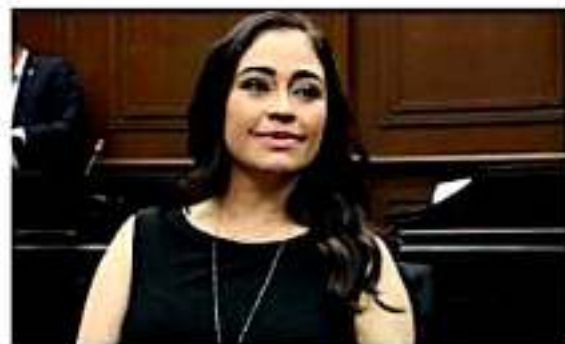
toría Superior de Michoacán o lo haga fuera de los plazos legales. Por ello, refirió que es viable la propuesta formulada por el

Además, señaló que se bene que contemplan como desecato cuando el servidor público responsable no haga entrega de dos o más informes trimestrales a la Cuenta Pública al Congreso, o a los responsables de su formulación, los rinda sin la totalidad de las características señaladas por la ley y la información complementaria que determine la Audi-