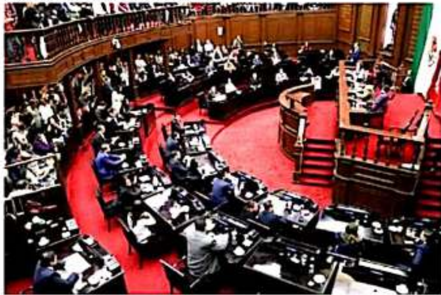
Los integrantes de la 74 legislatura local, buscan establecer diálogo abierto con la ciudadanía.