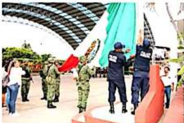
PETATLÁN, GRO.- Momentos en que personal de Seguridad Pública y del Ejército Mexicano hacen el izamiento de bandera.

la educación y la historia del municipio y del país, ayer miércoles 05 de febrero en punto de los 8 de la mañana, inició con un homenaje, donde se celebró los 103 años de la