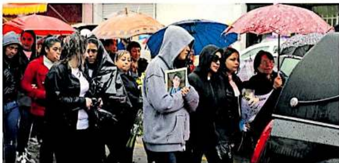
De la iglesia, los cuerpos salieron con destinos distintos, para ser depositados en dos panteones diferentes.