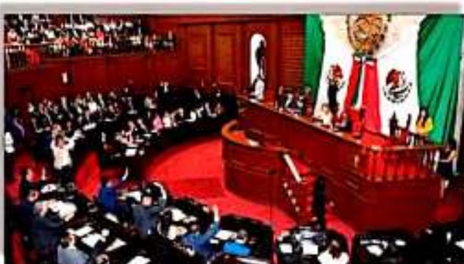
Iniciará el miércoles el periodo de Sesiones en el Congreso.

medio era un desastre, pero trabajando y cuidando que se hagan bien las cosas, la situación ha cambiado", agregó Aureoles Conejo, quien finalmente señaló: "hablamos con el presidente, en esta y en otras tareas; y al de nuevo sírveme, lo que hemos aprendido en estos años en materia de seguridad cuando con él, con toda la disposición y el compromiso, porque México y los mexicanos, y los michoacanos y michoacanas están primero que cualquier otra cosa y ahí vamos a caminar juntos", reforzará... POR SU PARTE, el presidente López Obrador, en esta nueva gira por la entidad señaló que "estamos comprometidos con ustedes a que se garantice la paz y la tranquilidad en nuestro país", tras señalar que en 14 meses "ya se tienen más elementos, el doble de elementos de la Guardia Nacional que los que tenía la Policía Federal; de 36 mil, a cerca de 80 mil elementos que tenemos ahora" agregando: "y lo mismo en cuanto a las instalaciones, en 14 meses hay más instalaciones de la Guardia Nacional que las que se construyeron en los 20 años de existencia de la Policía Federal", dijo tras informar que "solo en Michoacán, se están inaugurando al mismo tiempo 22 cuarteles. A nivel nacional, 69 se están inaugurando, están pendientes 13 y este año se van a construir cerca de 80 más.