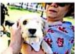
20 perrunos fueron esterilizados y vacunados. Arriaga

de las instituciones gubernamentales, puesto que lo que se hace es con recursos de la asociación. Por ello, dentro de estas actividades se ha establecido la venta de artículos para recaudar fondos. Señaló que la asociación lleva a cabo jornadas escolares en diferentes partes de Morelia con la finalidad de concientizar a quienes tienen un perro en su casa sobre el trato digno de las mascotas, la alimentación que deben tener y los cuidados que requieren para tener una mascota saludable. La rescatista dijo que una de las acciones altruistas que mayor compromiso ha dado es haber recurrido a una familia de color afro, quien perdió su empleo y que durante la feria llevaba en su dueño un letrero