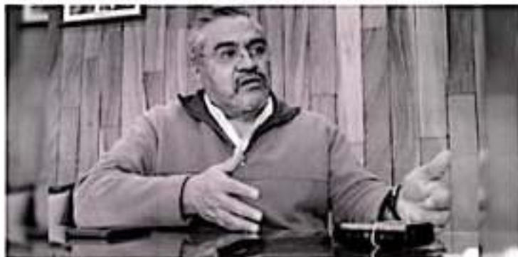
URUAPAN, MICH.- El grupo de expertos considera que estos eventos posiblemente se deban a condiciones magmáticas, pero "un evento magmático no forzosamente termina en el nacimiento de un volcán."

"Cuando nació el Parícutin la sismicidad era tan fuerte que fue detectada en las estaciones de Guadalajara y la de Tacubaya, en la Ciudad de México, y ahora únicamente es registrada por estaciones más cercanas", concluyó.