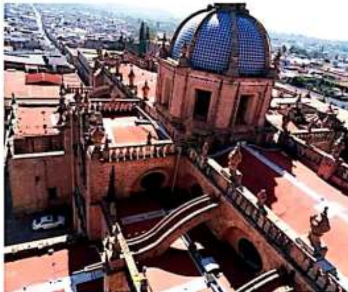
Los huecos tan grandes no podrían soportar el peso de la Catedral, afirma el especialista.