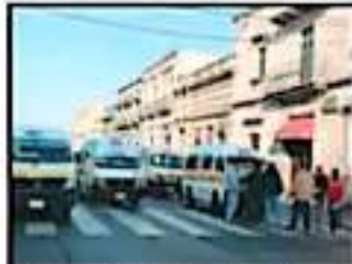
Bloquearon la zona peatonal de la Av. Madero.