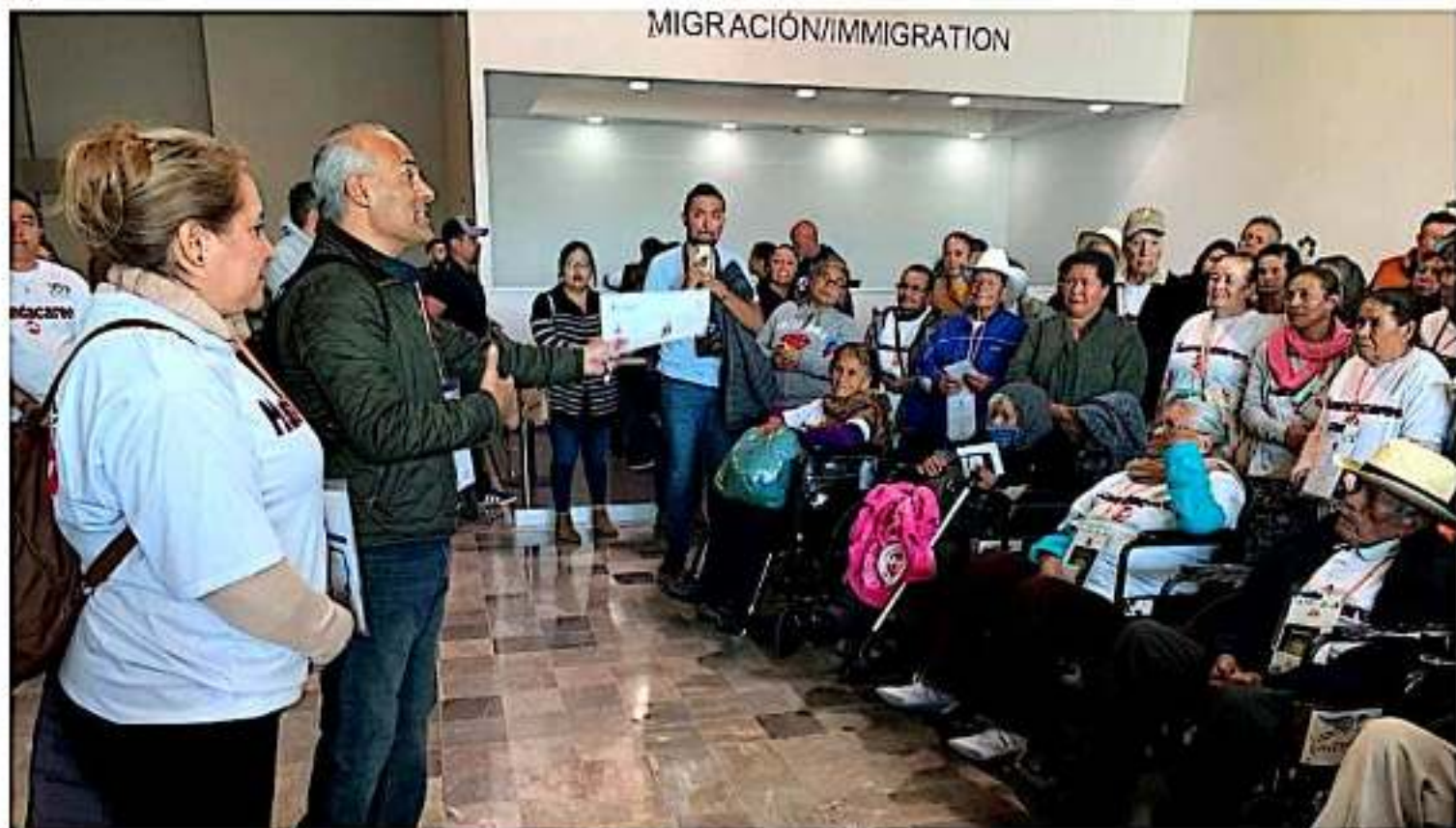
Se reencontran con sus familias en Estados Unidos, 176 Palomas Mensajeras de cinco municipios.

Durante tres semanas, los 176 integrantes de este programa de reunificación familiar binacional impulsado por el Gobierno de Michoacán, disfrutaron de la compañía de esos seres queridos que un día salieron de sus hogares y por distintas razones ya no pudieron regresar.