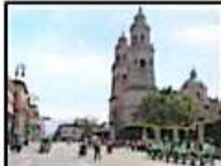
Cerca de las 10:00 se realizó la ciclovía.