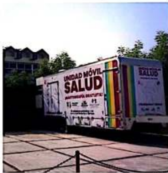
La unidad móvil de Pueblos Indígenas, estará en Tzitzio (18), Pátzcuaro (17 al 19), Huandacaro (17), Cherán (19 al 21) y Salvador Escalante (20 al 21).

Con estas acciones se brinda acceso oportuno y de calidad a las y los michoacanos que por cuestiones geográficas, se encuentran lejos de alguna unidad médica.