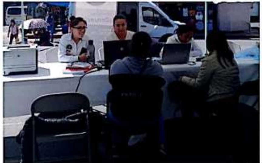
La Fiscalía General del Estado intensificó las pláticas de prevención de violencia en el noviazgo.

Con estas acciones, la institución reafirma su compromiso de garantizar el acceso a la justicia a las mujeres, para que ningún acto que atente contra su integridad, quede impune.