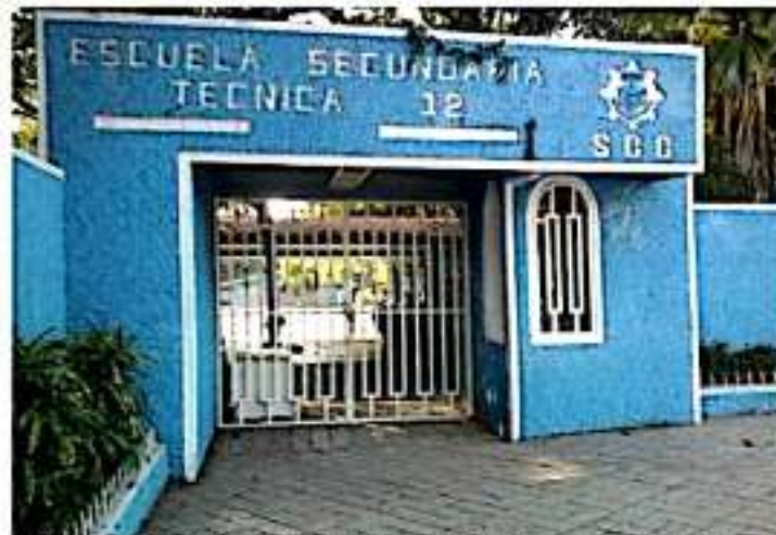
CD. LÁZARO CÁRDENAS, MICH.- Este lunes 17 de febrero culmina el periodo de preinscripciones del Ciclo Escolar 2020-2021.

En caso de no tener respuesta se debe presentar la queja en las supervisiones escolares, Jefaturas de sector y por último a la Dirección Regional de Servicios Educativos donde se hará una investigación y se dará seguimiento al caso para que ningún alumno se quede sin estudiar.