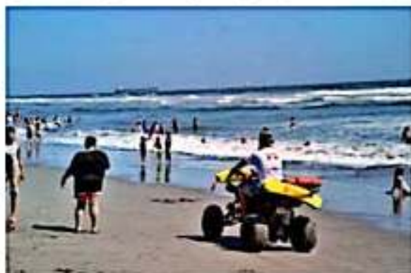
El gobierno municipal, a través del área de Enlace de Turismo, realiza preparativos para atender de la mejor manera posible a los visitantes de la próxima Semana Santa.

El enlace de Turismo Municipal cerró anunciando que también se trabaja en un Manual del Turista Responsable, en donde se plantea concientizar a los visitantes sobre los cuidados que deberán de mantener durante su estancia, como evitar tirar basura en las playas, a fin de cuidar el medio ambiente y mantener en buen estado los atractivos turísticos de la región.