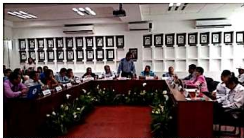
CD. LÁZARO CÁRDENAS, MICH.- El cabildo porteño aprobó el recinto oficial para la sesión solemne por motivo del septuagésimo primer aniversario de la instalación del primer ayuntamiento de Melchor Ocampo, hoy Lázaro Cárdenas.

En 1949, casi dos años después de que la autorizara el Congreso del Estado, se instaló el primer ayuntamiento, en un domicilio particular y en los años setentas, la administración pública se mudó al actual inmueble de la avenida Lázaro Cárdenas, precisamente donde esta vez será la sesión solemne.