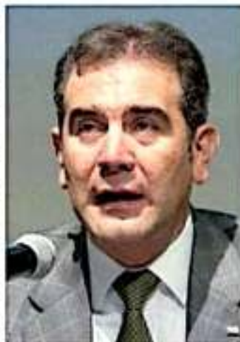
Lorenzo Córdova Vianello.

Aunado a ello, será interesante saber si los cambios solamente son en los perfiles de los titulares de los órganos electorales locales, o también en algunos otros nombramientos al interior de los mismos. Veremos.