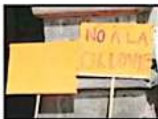
Choferos levantan cartulinas con amenazas.

Es necesario llegar a un acuerdo para el uso de este espacio que 'es de todos'.