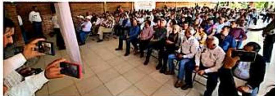
LOS REYES, MICH.- El senador Cristóbal Arias inauguró su Casa de Enlace Legislativo y Gestión Social.

Con este espacio, Arias Solís cuenta con una representación en prácticamente la mitad de los municipios michoacanos, con la finalidad de dar a conocer leyes, decretos y acuerdos de la Cámara Alta y la gestión social a favor de la población, en distintos aspectos como salud, asesorías jurídicas, actividades culturales y deportivas.