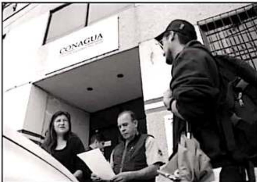
EN 2016, CONAGUA Y UMSNH ESTABLECERON UN CONVENIO SOBRE PROYECTOS QUE AL PARECER NO SE CUMPLIERON

devolvieron de otro fondo para resarcir daño