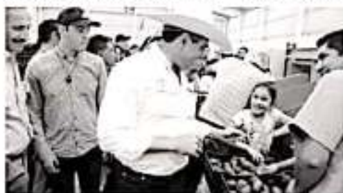
La empacadora tuvo una inversión de más de 10 millones de pesos, proyecto de carácter social

El manantial “Cjo de Agua Grande” es un área de recarga hídrica indispensable para la población, ya que provee el 25 por ciento de agua potable al municipio.