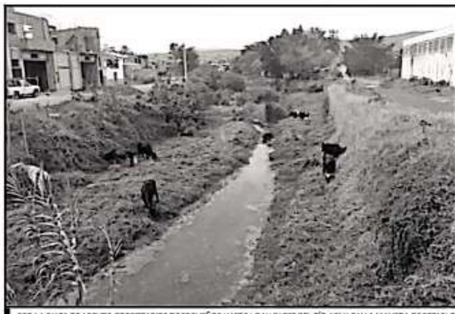
POR LA FALTA DE APOYOS, PROPIETARIOS DE PEQUEÑOS HATOS USAN PARTE DEL RÍO JIQUILPAN A MANERA DE ESTABLO.

"Ayer sábado terminaban, es domingo y por lo menos a mí no me preguntaron nada y a muchos de nosotros tampoco", argumentó que si no fueron incluidos en este