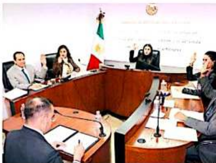
Aspecto de una sesión del TEEM.

Entre esas determinaciones pueden ser la integración de los consejeros locales y distritales del INE de los órganos electorales locales, de diversos cargos técnicos, como los vocales ejecutivos, en su momento la distribución, lineamientos