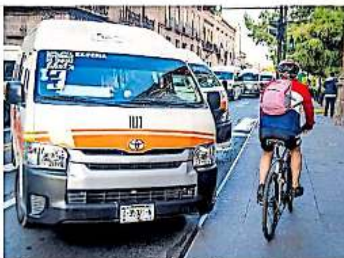
Sus bloqueos serán cada domingo de 06:00 a 13:00 horas.

JUAN ARÉVALO Ayala pidió que por medio de la Comisión Coordinadora del Transporte (Cocotra) se establezcan caminos alternos para 15 rutas del transporte que cruzan con la Ciclovía Recreativa Dominical (CRD).