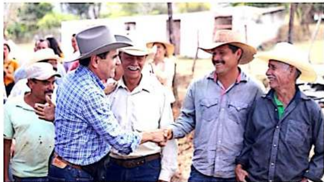
TZITZIO, MICH.- El gobernador Silvano Aureoles Conejo sostuvo ayer una reunión de trabajo con los representantes de las 6 Unidades de Fomento Ganadero en el estado, a quienes refrendó el compromiso de seguir trabajando en beneficio del sector.

Como resultado de esta reunión, el gobierno del estado comprometió dar continuidad a las necesidades de las Unidades de Fomento Ganadero, como el abastecimiento de agua y la gestión de recursos federales para continuar reforzando sus actividades.