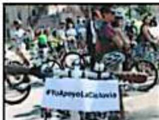
Ciclistas 'rodaron' a favor de la ciclovía.