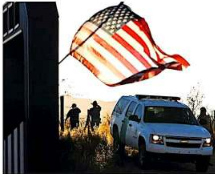
La política migratoria de Estados Unidos se ha relajado desde la llegada de Donald Trump al gobierno. JAR

Respecto a los estados de México a donde más deportados llegaron entre 2017 y 2019, Guerrero encabeza la lista, con 61 mil 648; seguido de Oaxaca, que registró 54 mil 308, y Michoacán, cuya cifra fue de 50 mil 297; de estos, 45 mil 867 son del