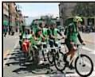
La bicicleta también tuvo participación.