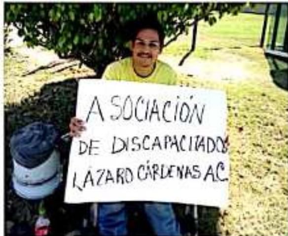
CD. LÁZARO CÁRDENAS, MICH.- La Asociación de Discapacitados de Lázaro Cárdenas denunció públicamente supuestos actos de corrupción en los Programas Federales del Bienestar.

En esa misma reunión, agregaron, pudieron constatar presuntas irregularidades en las órdenes de pago, ya que algunas no contaban con nombre del beneficiario, dirección ni referencias, pero que aun así, estas serían entregadas.