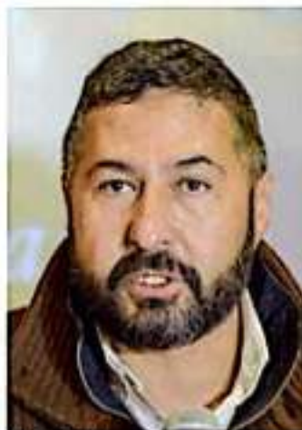
Víctor Báez Ceja.

Frente a esa situación, en ocasión de la apertura de los dos primeros cuarteles de la Guardia Nacional que vino a inaugurar el tabasqueño en Sahuayo y Jaguilpan, el Gobierno de Michoacán dejó claro varios puntos: