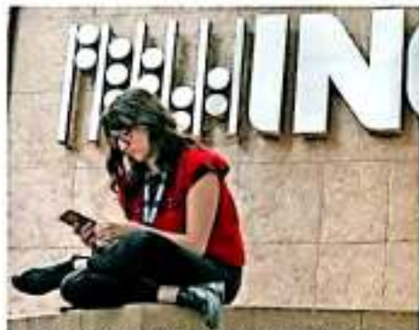
El Censo de Vivienda 2020 se levantará del 2 al 27 de marzo en 45 millones de viviendas de toda la República Mexicana. RODRIGO PABLO | COMPROBADO

En una entrevista con Publimetro , detalló que con esta