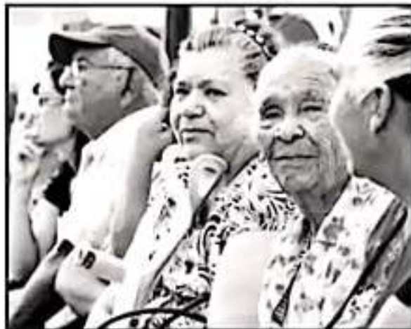
ANALISTAS SEÑALAN QUE VA EN AUMENTO EL GASTO DE LAS PENSIONES