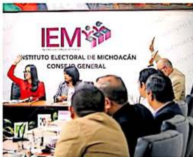
Se abordará el proyecto por el que se designará a los consejeros. Arriaga

Además los consejeros electorales revisarán el funcionamiento temporal con dos consejeros de la Comisión de Administración, Premias y Partidos Políticos, Comisión de Vinculación y Servicio Profesional Electoral, Comisión de Fiscalización, Comisión Electoral para la Atención a Pueblos Indígenas, Comité Editorial y Comité de Transparencia. Y se propone la rotación de la Presidencia de las Comi-