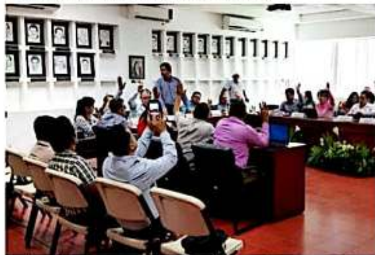
CD. LÁZARO CÁRDENAS, MICH.- Se aceptó la petición de donación de la calle trasera aledaña a la clínica hospital "Ricardo Flores Magón" del Issste, de esta ciudad.

El Gobierno municipal de Lázaro Cárdenas refrendó su compromiso por la salud y bienestar de los ciudadanos, luego de autorizar la donación de una calle aledaña a la clínica del Instituto de Seguridad y Servicios Sociales de los Trabajadores del Estado (Issste) "Ricardo Flores Magón".