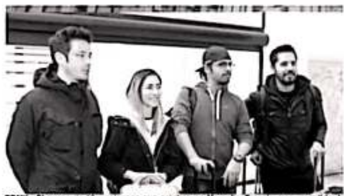
CDMX.- El grupo de 10 mexicanos que estaban en Marsella, Francia, tras su salida de Wuhan, China, llegaron a bordo del vuelo 498 de Lufthansa.

El grupo proveniente de Marsella, Francia, hizo escala en Frankfurt, Alemania, en un vuelo que duró casi 16 horas. Algunos pasajeros provenientes de otros destinos utilizan cubreboca, aunque no se observa un protocolo de seguridad o salud en la terminal aérea.