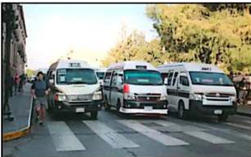
DECENAS DE COMBIS SE HICERON PRESENTES POR SEGUNDO DOMINGO CONSECUTIVO PARA EVITAR LA CICLOVÍA.