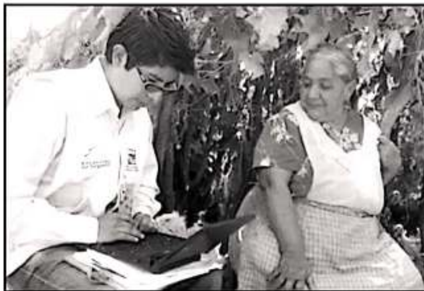
UN PROMEDIO DE 151 MIL ENTREVISTADORES DEL INEGI RECORRERÁN CASA POR CASA PARA RECOPIRAR DATOS.