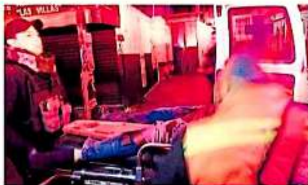
Tras el aviso, elementos de la Policía Moreliana acudieron al lugar. JOSÉ LUIS HERNÁNDEZ

Tras el aviso, elementos de la Policía Moreliana acudieron al lugar para precautelar de que Alex A. había sufrido heridas de proyectil de