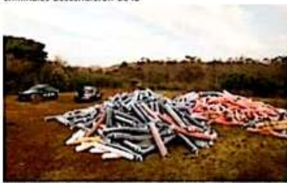
Elementos de la GN lograron recuperar un cargamento de telas que era transportado en un tracto camión que fue robado con violencia sobre la autopista Siglo XXI. Lograron rescatar también al chofer y el custodio del tráiler.

Los efectivos de la GN se movilizaron rápidamente y también consiguieron dar con la carga de rollos de tela que los hampones habían dejado en el predio del municipio de Lagunillas y la aseguraron.