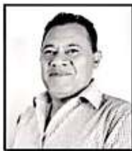
FERMIN ESPINOZA PUGA POR UNA MEJOR ATENCIÓN EN EL IMSS

La líder de la bancada perredista en la LXXIV Legislatura manifestó el respaldo y compromiso de los diputados integrantes del Grupo Parlamentario del PRD, con el progreso de Michoacán.