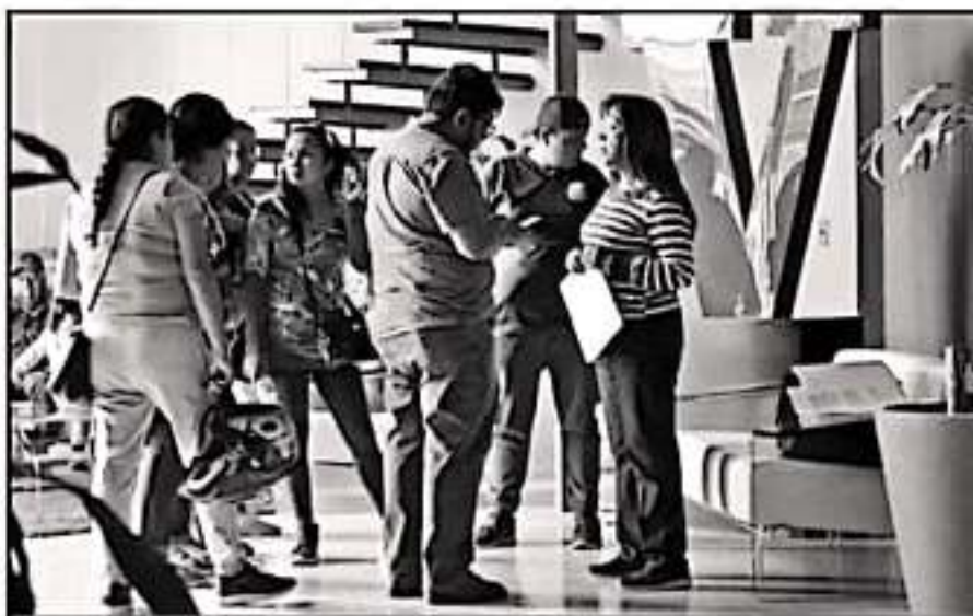
EL MIÉRCOLES PASADO ASISTIÓ A DAR SU VERSIÓN A ESTA CASA EDITORIAL EL GRUPO DE LA DIRECTORA DEL PLANTEL.