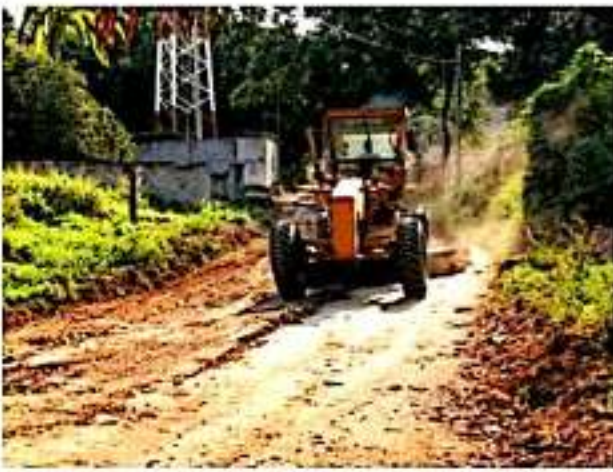
CD. LÁZARO CÁRDENAS, MICH.- Personal de la Secretaría de Obras Públicas Municipales, trabaja para mejorar condiciones en las vías alternas por la construcción del distribuidor vial.