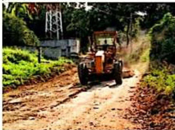
A través de Obras Públicas, el gobierno municipal mejora las condiciones de las vías alternas disponibles para desviar hacia esos sitios el tránsito vehicular, con motivo de la construcción del Distribuidor Vial.

Con estas acciones el gobierno municipal de Lázaro Cárdenas refrenda su compromiso por atender las necesidades de la población y mejorar las condiciones de la ciudad.