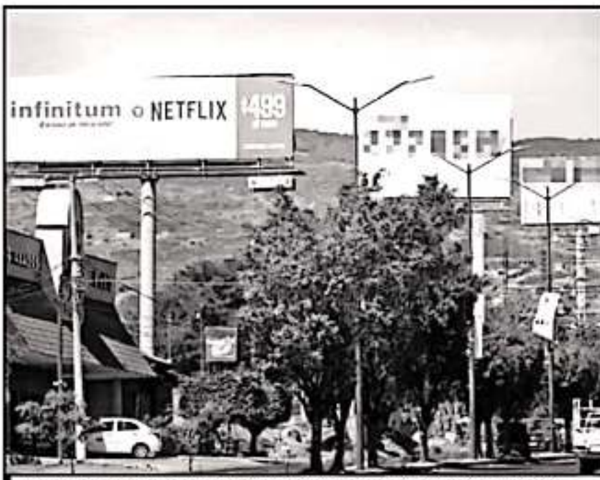
HAY VARIOS PUNTOS DE LA CIUDAD CON UN ANUNCIO TRAS OTRO CON MUY POCOS METROS DE DISTANCIA.

algunas de las zonas donde más se ha visto el aumento de los mismos es en la subida a Santa María, así como en todo el circuito del Libramiento que rodea a la capital michoacana.