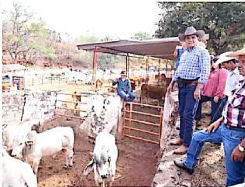
En los últimos 4 años, Unidades de Fomento Ganadero en Michoacán han aumentado 40% el número de cabezas de ganado.

Como resultado de esta reunión, el Gobierno del Estado comprometió dar continuidad a las necesidades de las Unidades de Fomento Ganadero, como el abastecimiento de agua y la gestión de recursos federales para continuar reforzando sus actividades.