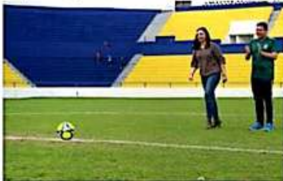
La diputada llamó a los diversos niveles de gobierno a fortalecer las actividades deportivas y recreativas.

ció el que la consideraran madrina del equipo y se comprometió a seguir apoyando a este sector.