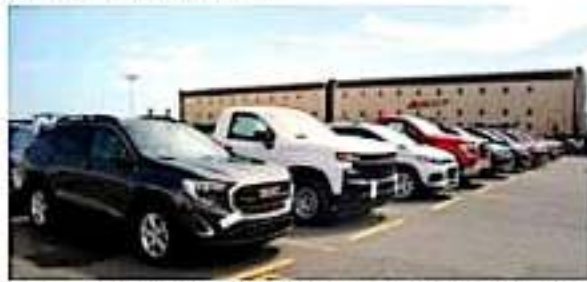
El puerto michoacano concluyó el 2019 como el líder en movimiento de carga automotriz en todo el Pacífico Mexicano.

El arribo de nuevas plantas armadoras al país aunado a capacidad y servicios competitivos que se desarrollan en este recinto portuario, concebirán mayores oportunidades para el sector laboral como de una mejor economía para el país.