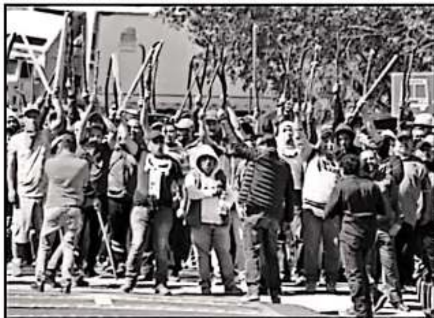
GRUPO Opositor a Zavala acordó la "expulsión" simbólica de quien aún sigue siendo dirigente de la CNTE.

5 INTEGRANTES del equipo de Zavala fueron expulsados