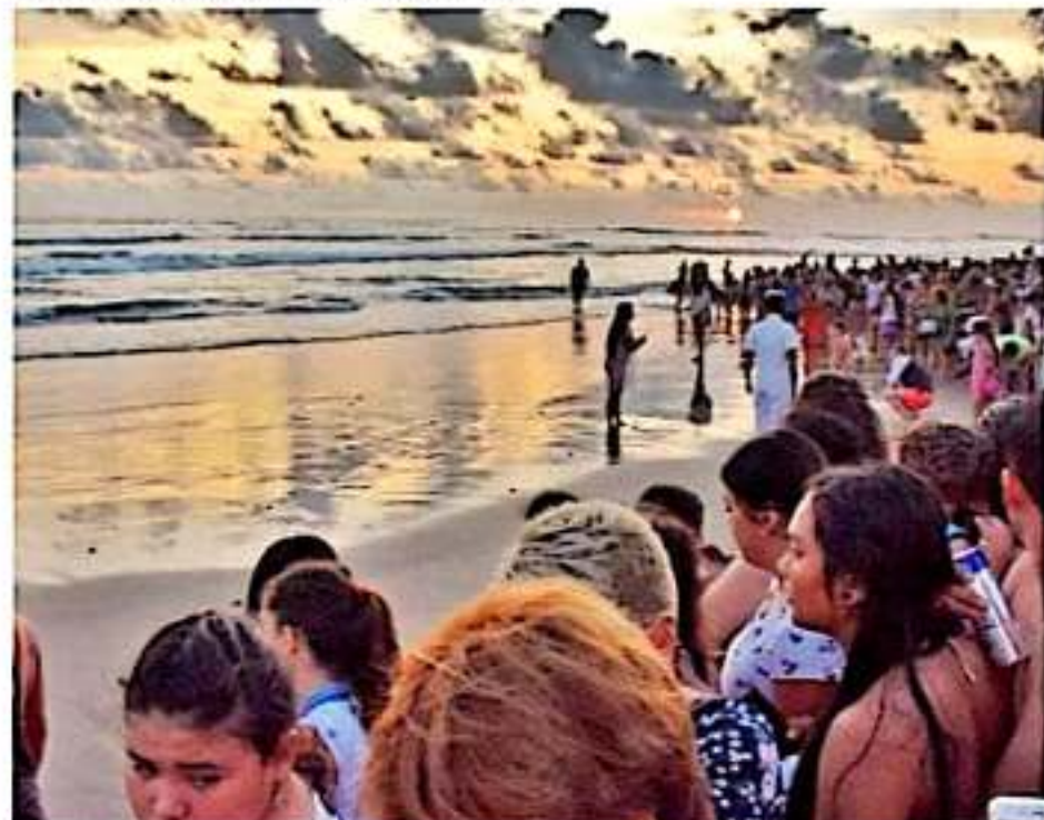
CD. LÁZARO CÁRDENAS, MICH.- Turismo Municipal, en coordinación con prestadores de servicios y autoridades de las comunidades costeras, establecieron medidas conjuntas para la promoción de la Costa, previo al periodo vacacional de Semana Santa.

La enlace de Turismo Municipal cerró anunciando que también se trabaja en un Manual del Turista Responsable, en donde se plantea concientizar a los visitantes sobre los cuidados que deberán de mantener durante su estancia, como evitar tirar basura en las playas, a fin de cuidar el medio ambiente y mantener en buen estado los atractivos turísticos de la región.