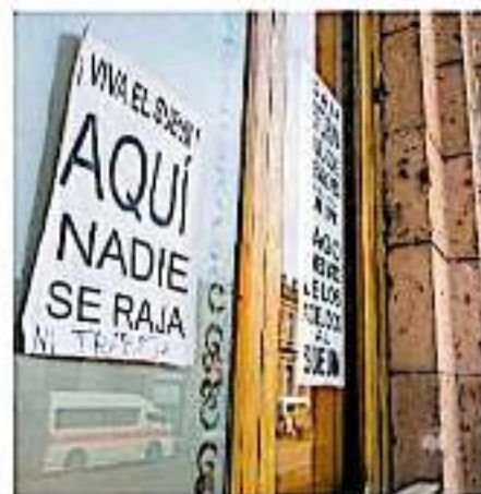
Los sindicatos SUEUM y SPUM analizarán si se van a huelga en esta semana (PAOLA MENDOZA)

A los miembros no se les han pagado tres quincenas y media, así como diversas prestaciones incluidas dentro del Contra-