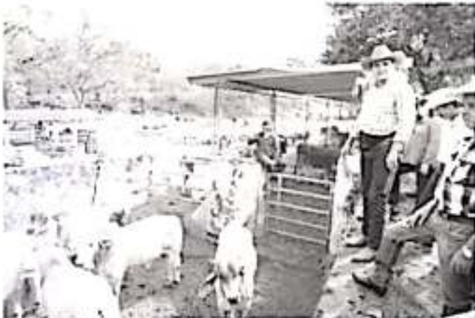
Silvano Aureoles Conejo, al sostener una reunión de trabajo con los representantes de las 8 Unidades de Fomento Ganadero.

bierno del Estado comprometió dar continuidad a las necesidades de las Unidades de Fomento Ganadero, como el abastecimiento de agua y la gestión de recursos federales para continuar reforzando sus actividades.