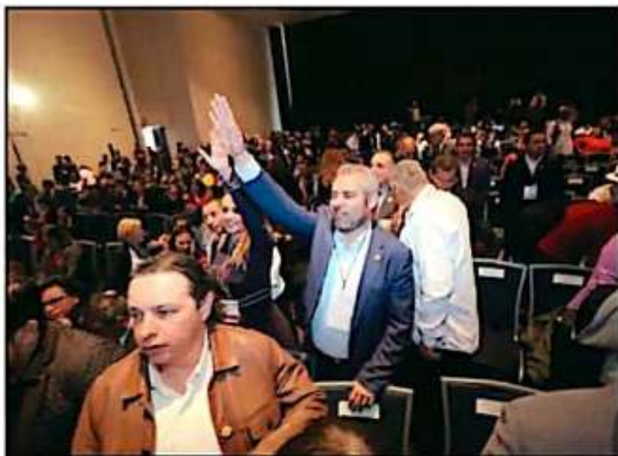
EL DIPUTADO ALFREDO RAMÍREZ SEÑALÓ QUE SE BUSCA GENERAR UN TRABAJO COORDINADO POR EL BIENESTAR.

Los derechos del bienestar no pueden estar sujetos al criterio de los gobernantes, deben ser reconocidos en las leyes para que su aplicación sea obligatoria, por eso es importante que las legislaturas locales cerremos filas con el Congreso de la Unión, recaló.