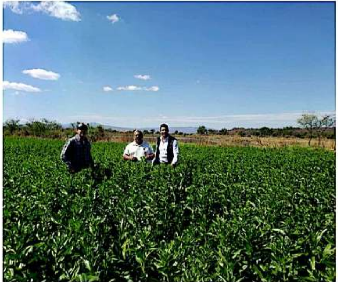
Ante resultados exitosos, Ayuntamiento de Villamar, decide incentivar 300 hectáreas de cultivos.