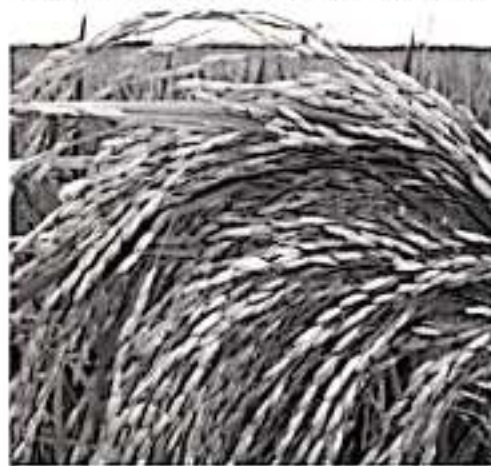
MORELIA, MICH. - Con el programa de agricultura sustentable, la cosecha de maíz registró un incremento del 42 por ciento en su rendimiento y una reducción del 30 por ciento en su costo de producción.

Se aplicó en poco más de 7 mil hectáreas de 25 diferentes cultivos, con una inversión de 15 millones de pesos entre el estado y los agricultores, para beneficio de 2 mil productores.