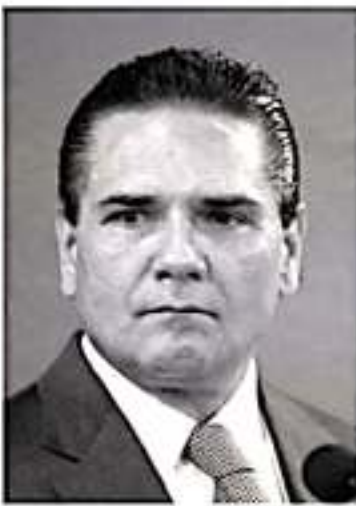
Silvano Aureoles Conejo.

Paradójicamente, es en el principal activo que tienen los morenistas donde se ve en este momento la mayor debilidad. Dicho de otra manera, el partido no está construyendo una ruta que le permita a Morena mantener la ventaja que revelan las encuestas, y que esa fuerza que tendría en las urnas le dé una base sólida para elegir un candidato afín a sus principios, no por marketing político.