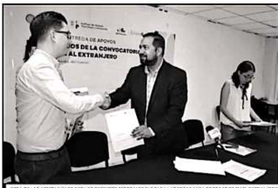
OTRA DE LAS AFECTACIONES POR LOS RECORTES FEDERALES FUE PARA LAS BECAS PARA POSGRADOS EN EL EXTRANJERO.

de marzo para disponer de los recursos federales como el caso del Fondecyt, lo que sí podría incrementar la cifra con la gestión de fondos, lo pendiente de las multas electorales".