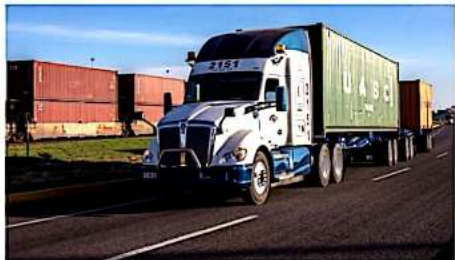
CD. LÁZARO CÁRDENAS, MICH.- El Puerto Lázaro Cárdenas, reportó durante el cierre de año 2019 un total de ingresos de 366 mil 110 camiones, a través de la ASLA.