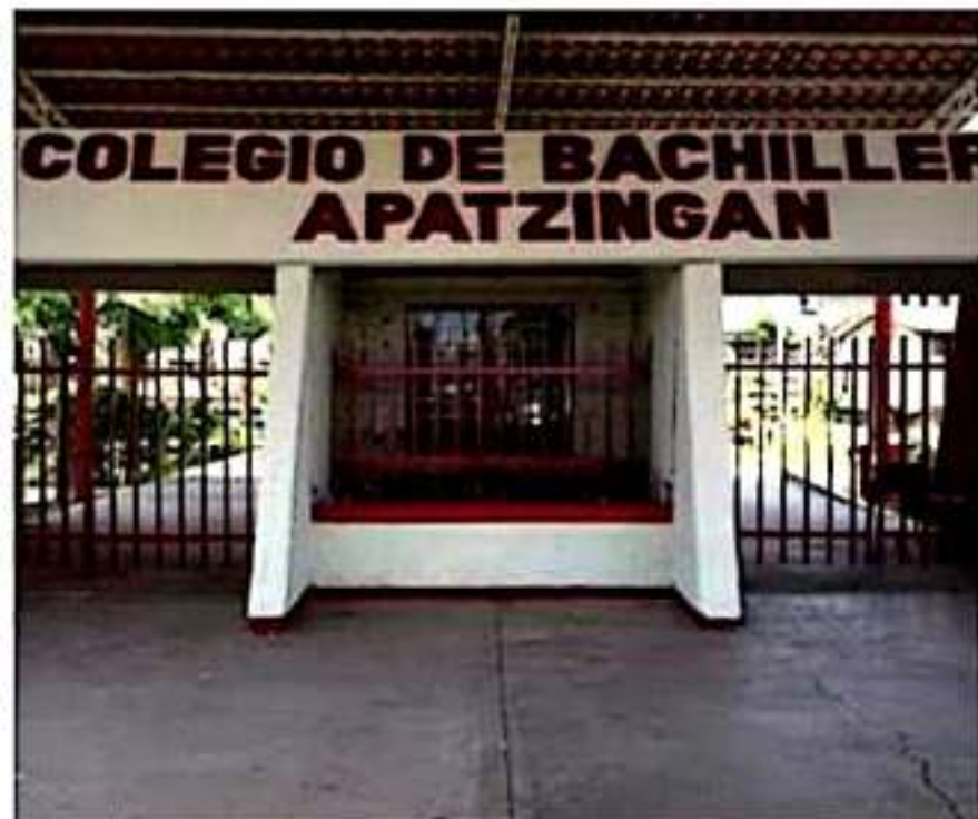
APATZINGÁN, MICH.- El pago es en riguroso efectivo y se realiza en la Contraloría del plantel.

Otros datos a informar son dirección, nombre de la escuela secundaria donde estudia y el turno, así como estudios máximos del padre o tutor y su ocupación, y nombre completo de la madre.