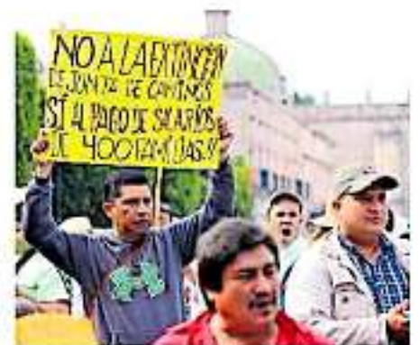
Para 2019 el gobierno estatal no incluyó partida presupuestaria para la Junta de Caminos

Mientras que los ocho diputados de Acción Nacional (PAN) estarán haciendo la diferencia para que, conforme a la Ley Orgánica y de Procedimientos del Congre-