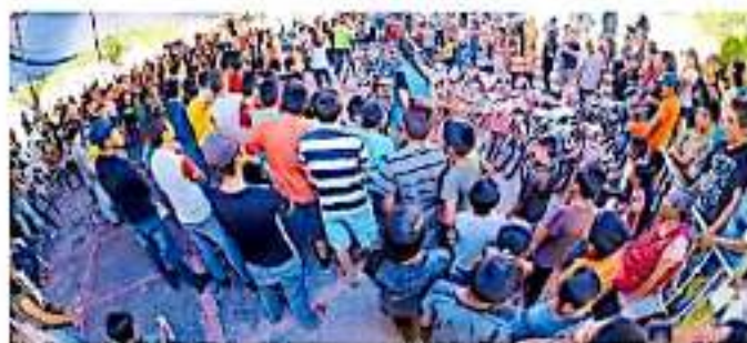
En el marco del Día del Niño, nuevamente se realizará con más vehículos de este tipo, así como con juguetes.

como con juguetes, para lograr más niños y niñas felices, sonrientes.