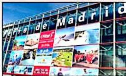
Michoacán en la FITUR.

de la iniciativa privada que también asistirán a ese evento, con la finalidad de consolidar a Michoacán dentro de la agenda mundial de Turismo. Y explicó: "Es un sitio de encuentro donde podremos encontrar oportunidades y nuevas estrategias para promover destinos y productos turísticos"... Por cierto que incluso explicó que "Michoacán es el primer estado asociado a la Organización Mundial de Turismo", ya que de acuerdo a las reglas de la organización, "los estados no pueden estar, sino los países; pero hicimos ahí las gestiones y nos aceptaron como socios", detalló el gobernador. Enumeró que entre los objetivos de esta visita están los de fortalecer los lazos de cooperación con el gobierno de España, además de que se buscará la participación en los fondos de organismos de cooperación y promover la candidatura de la Ruta Don Vasco, al Premio de las Mejores Prácticas del Turismo Mundial enfocadas en los ODS y mayor reconocimiento a los proyectos turísticos a nivel mundial. Y agregó: "quiero reiterar el compromiso de mi gobierno para seguir promoviendo el turismo y fortaleciendo la actividad turística, es la cara amable del estado y Michoacán tiene que seguir así apostándole a esta actividad". En ese evento