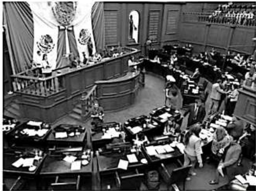
Aspecto de una sesión en el Congreso del Estado.

La fracción parlamentaria de Morena ha señalado en reiteradas ocasiones que esta es una atribución única del Congreso, al haber sido quién decretó su creación.