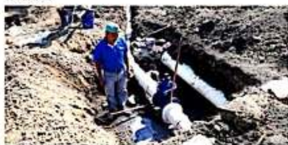
ZAMORA, MICH.- El proyecto contempla la colocación de 256 metros lineales de tubería de 12 pulgadas.

Esta obra se hace posible por medio del fondo II, con una inversión importante para fortalecer la infraestructura hidráulica de la tenencia y con ello, poder otorgar mayores condiciones de vida a los zamoranos.