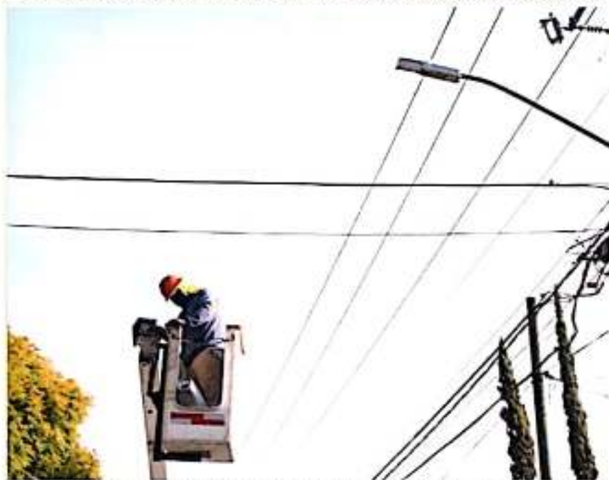
JACONA, MICH.- Colocaron las luminarias tipo LED en la calzada, sobre el tránsito vehicular y se encuentran reemplazando las lámparas sobre la zona peatonal.

Los cambios comienzan a ser notables gracias a la iniciativa de la alcaldesa Adriana Campos, de implementar esas estrategias, atendiendo una de las demandas de la ciudadanía, las luminarias, que eran prioridad y necesidad para brindar un municipio más seguro para las familias jaconenses.