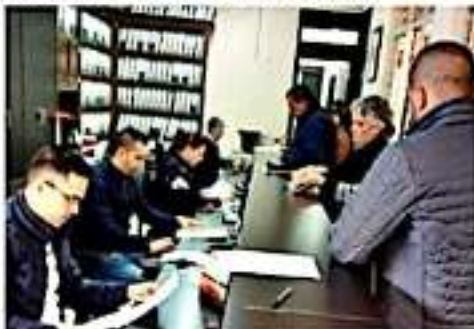
COTUA, MICH.- Positiva afluencia de contribuyentes registra el pago de predial y agua potable.

Por ello, para ofrecer más y mejores resultados, es importante que todos los propietarios de un predio y titulares de alguna toma de agua potable, se acerquen a pagar, con la confianza de que, si existen atrasos de años anteriores, se les harán descuentos y se les brindarán todas las facilidades para ponerse al corriente.