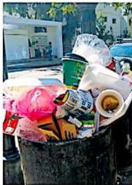
La Proam recaudó durante 2019, 793 mil pesos en multas. (AGUIRRE)

Además, el funcionario estatal dijo que la Procuraduría está en planes de expandir el operativo a otros municipios del estado como serán Zitacuaro, Zamora y Uruapan, sin precisar fecha para el inicio de los mismos.