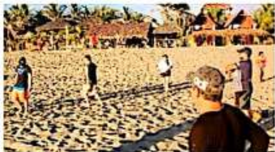
CD. LÁZARO CÁRDENAS, MICH.- Notable afluencia de turistas en Nexpa por época decembrina.

Además, refiere que se mantiene un notable cambio del turista nacional al local o estatal, ello debido a la misma publicidad, por la cual turistas michoacanos llenan las habitaciones, dado que estos buscan otras alternativas para vacacionar, no obstante, se mantiene la presencia internacional, nacional y estatal.