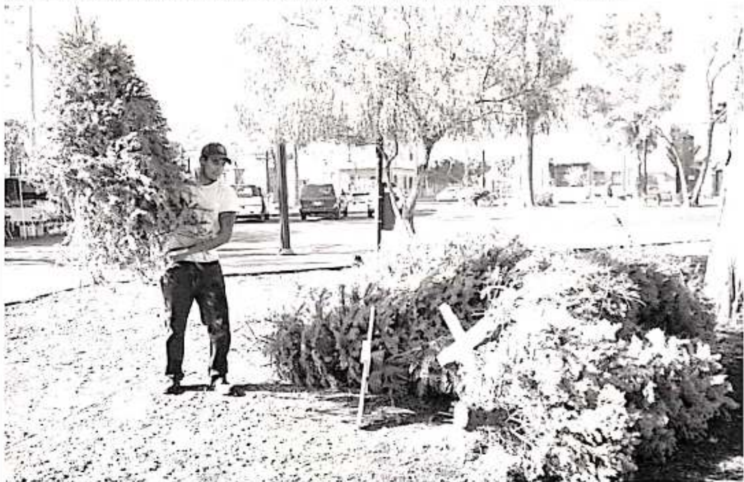
Los árboles de navidad reciclados, serán composteada para más plantaciones forestales; hasta ahora, más de 100 árboles se han recibido en los siete centros de acopio.

Finalmente, destacó que Michoacán ocupa el cuarto lugar nacional en la producción de árboles de Navidad, con alrededor de 400 hectáreas establecidas en predios de 12 productores, de los municipios de Zitácuaro, Zacapu, Carapan, Acuitzio, Indaparapeo y San Juan Nuevo.