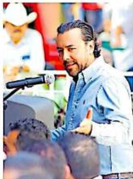
En el evento se agradeció la colaboración y altruismo.