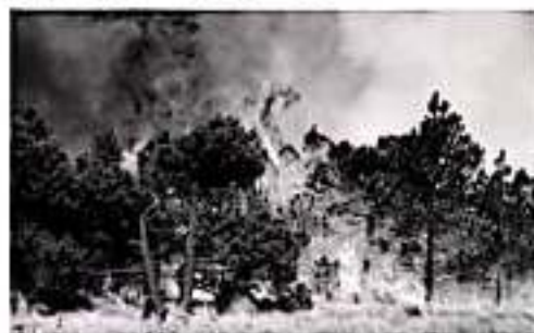
MORELIA, MICH. - Michoacán se ubicó en el tercer lugar nacional por número de incendios forestales registrados en lo que va de 2020, de acuerdo con la Comisión Nacional Forestal (Conafor).

y Ciudad de México, con 28 hectáreas, en tanto que San Luis Potosí, seis hectáreas, y Tlaxcala, cuatro hectáreas. El 50 por ciento de los incendios forestales fue provocada de manera intencional, conforme los datos de la Conafor, mientras que el 16 por ciento derivó de fogatas; el ocho por ciento, quema de basureros y actividades agrícolas y pecuarias, cada una; el cinco por ciento, otras actividades productivas; el tres por ciento, por causas desconocidas, y el dos por ciento, por descuidos de fumadores.