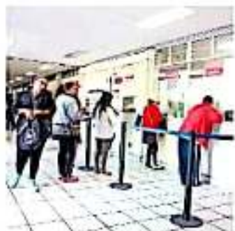
En lo que va del año se han atendido 77 asuntos. (ARCHIVO)

Detalló que, además de las ocho quejas por el tema del Insabi, cuatro refieren al derecho a no ser sujeto a detención ilegal, tres a derecho al acceso a la educación; dos por derecho a la fundamentación y motivación; dos más por derecho a una educación libre de violencia y una más por el derecho a la debida diligencia. El encargado de la CEDH agregó que estos