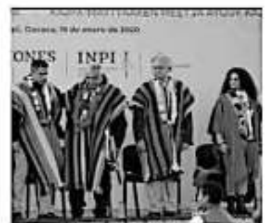
En el municipio de Santa María Tepantlall, Oaxaca, el presidente López Obrador se comprometió a garantizar que no falten médicos, enfermeras y medicamentos en los centros de salud, y que los servicios sean gratuitos.