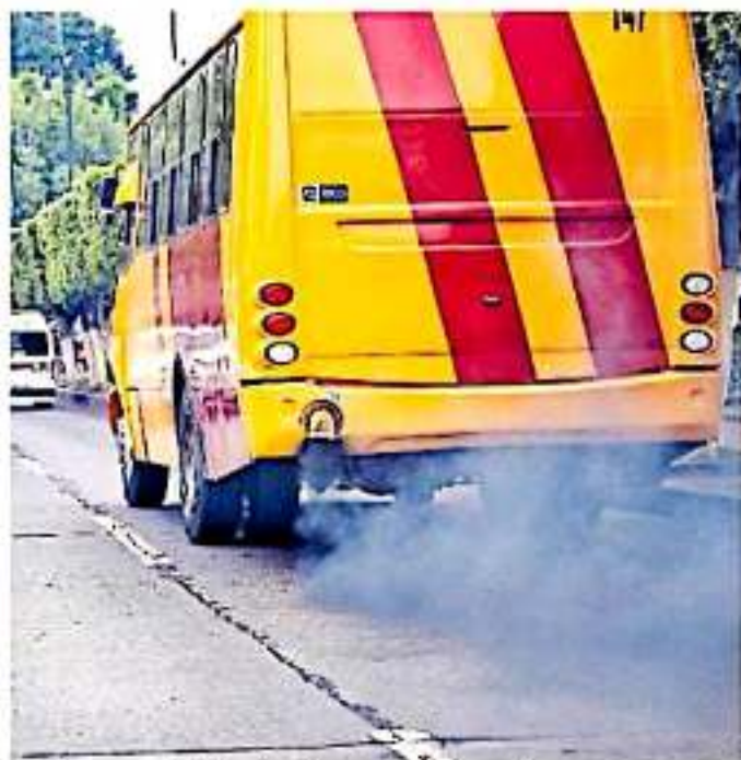
Se tiene contemplada la realización de más de 15 operativos anuales

El procurador de Protección al Medio Ambiente en Michoacán, Vega Solórzano