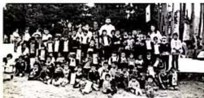
MORELIA, MICH.- Con el objetivo de atender las demandas directas de la población de las comunidades, el diputado Octavio Ocampo Córdova realiza un recorrido por las mismas, en donde además de otorgar apoyos, se comprometió al impulso de proyectos productivos.

Como diputado integrante de la Comisión de Educación expresó que seguirá visitando los centros educativos, para seguir aportando a la rehabilitación de las instituciones y equipamiento. "Me alegra mucho estar aquí en la Parota en Tuzapán, es una comunidad que le tengo mucho cariño, por lo que también buscaré los mecanismos para apoyarles, saben que soy un hombre de trabajo y compromiso, como presidente municipal, siempre me enfoco en generar acciones afirmativas en todas las zonas, como fue aquí en donde cumplimos con el mejoramiento de la escuela, y continuaremos haciendo más".