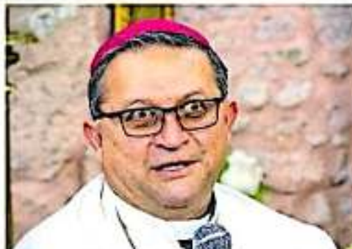
Expresó que es lamentable que estas "barbaries" se sigan presentando

"Todos nosotros tenemos que volver a tomar conciencia de que es responsabilidad de la sociedad en general de construir la paz y la forma de hacerlo es empezando por el respeto a todas las personas".