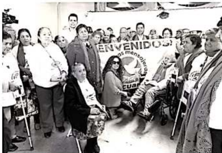
Durante tres días, 17 habitantes de Tzucutla, 24 de Tlalpujahua, 23 de Angangueo, 17 de Angamacetiro y 50 de Pajacuacán, salieron de sus comunidades de origen para viajar a EU a reencontrarse con hijos e hijas que no habían visto en décadas.

Las 131 personas, que durante los tres días se reencontraron con sus seres queridos a través de este programa de reunificación familiar binacional, fueron recibidos en Estados Unidos con flores, globos y regalos, entre lágrimas, risas y abrazos, por los integrantes de las familias que sus hijos e hijas confirmaron en el vecino país del norte.