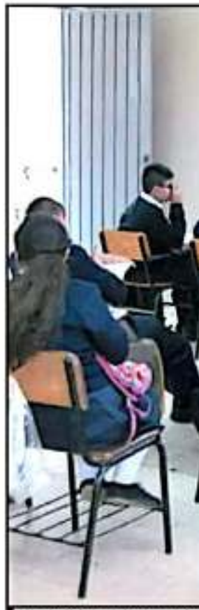
CIUDADOS MÁS PERSONALIZADOS Y

fica se trabaja con la "Guía de intervención mhGAP para los trastornos mentales, neurológicos y por consumo de sustancias en el nivel de atención de salud no especializada", con la que se podrá ayudar a los maestros y padres de familia a detectar algún indicio de trastorno o problemas conductuales y con ello evitar complicaciones para los niños.