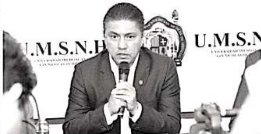
En el pasado el proceso de inscripción los estudiantes recibían su comprobante en cuenta institucional, por lo que si aún no la tienes envía un mensaje a contacto@umich.mx

Finalmente, detalló que para activar tu cuenta solo necesitas acceder al siguiente link: https://www.microsoft.com/es-es/education/products/office .