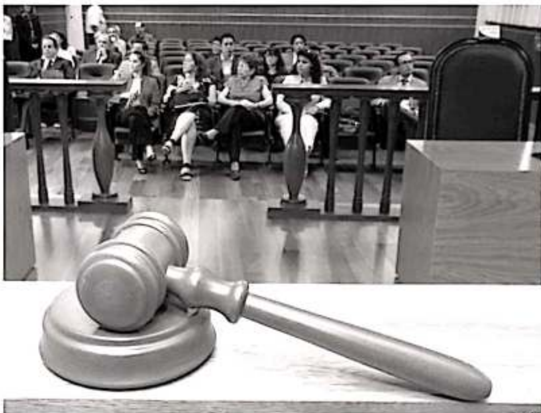
El sistema acusatorio coloca a las partes en un plano de igualdad frente a la autoridad de procuración y administración de justicia.

Para los estudiosos de la antropología jurídica, es necesario que transcurran 25 años para poder evaluar los resultados de la implementación de un nuevo paradigma jurídico, como en este caso la reforma penal; no obstante lo anterior la presente administración federal con el afán de desmontar todas las estructuras del anterior régimen, sin importarle lo incipiente de la paleta en marcha del nuevo sistema penal; al llevar repito 3 años; ahora se propone descomponer lo apenas iniciado bajo el argumento de ineficacia, ineficiencia, puerta giratoria, y pretende con las reformas ya señaladas, frenar la impunidad, eliminando la presunción de inocencia; eliminar el garantismo jurídico a través de la desaparición del juez de control; suprimir la presunción de inocencia por el arraigo para todo tipo de delitos, actualmente solo aplica para el delito de delincuencia organizada. Trata de pulverizar la independencia ju-