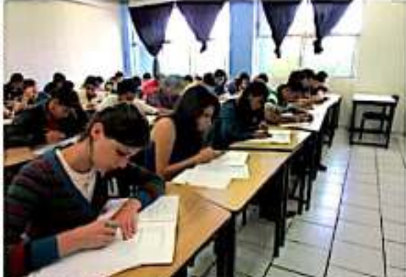
LOS REYES, MICH.- Esta semana se llevará a cabo el periodo de reinscripciones del Tec Los Reyes.

El 4 de febrero iniciará el nuevo semestre, con un periodo de altas y bajas de ese día al 14 del mismo mes, mientras que, del 17 al 22 de febrero, todos los alumnos deben acudir a Control Escolar con la credencial de estudiante para firmar su carga académica, con el mismo orden y horarios que en la entrega de comprobantes.