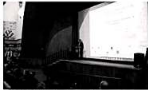
PÁTZCUARO, MICH.- La sociedad organizada, en conjunto con el gobierno, logrará el cambio necesario para prevenir, contener y mitigar el daño producido a la naturaleza por las actividades humanas.