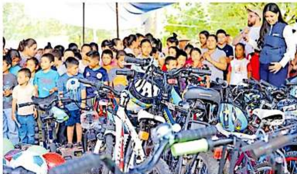
Va dirigida a este sector de la población de la región de Tzitzio.