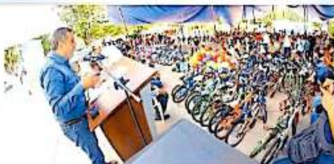
También se resaltó la creciente participación y la suma de voluntades.

Adelantó que para mayo próximo, en el marco del Día del Niño, nuevamente se realizará con más vehículos de este tipo, así