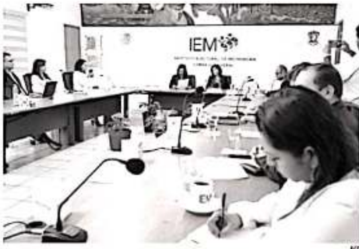
De forma insólita, el Instituto Nacional Electoral (INE) decidió que ninguno de los perfiles que competieron para ser presidente del IEM cubrió la expectativa institucional.

1. Instalar las áreas que atenderán el voto de los michoacanos en el extranjero, a efecto de poder llevar a cabo los trabajos y estudios necesarios para que puedan inscribirse en el Estado en su lugar de origen, así como generar un trabajo conjunto con el INE para lograr la difusión y otras actividades que permitan incrementar en mayor medida la cantidad de votos de michoacanos en el extranjero. De igual forma, se encargará de encontrar el mejor