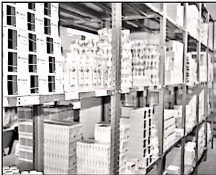
HASTA EL MOMENTO, MICHOACÁN CUENTA CON UN ABASTO DE MEDICAMENTOS SUPERIOR AL 25%, DICE LA SEN.

menos dos mil 500 millones de pesos en medicamentos y el abasto que había en los centros de salud no rebasaba el 25 por ciento. Hoy con 800 millones, andamos arriba del 90 por ciento y nos alcanza para 15 meses de medicamentos. No hay mucho que rascarle, era el gran negocio de muchos ampines, dedicados a distribuir medicamentos y materiales de curación”, expresaba el mandatario en conferencia de prensa en julio de 2019.