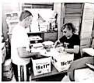
MORELIA, MICH.- El Gobierno de Silvano Aureoles Conejo, garante de los derechos laborales de las y los trabajadores de la educación, inició la dispersión de la nómina y pago de cheques a personal docente y administrativo estatal.