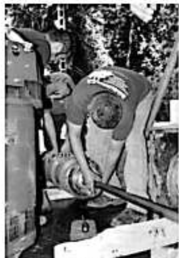
URUAPAN, MICH.- Los Pinos, y que abastece a más de 50 colonias del norte de la ciudad.

De igual manera, Paredes Melgoza señaló que la Capasu viene trabajando de manera permanente, en la revisión y mantenimiento de cada uno de los equipos de bombeo a su cargo, a fin de evitar alguna contingencia que pudiera llegar a afectar a los usuarios. Finalmente, hizo un llamado a la ciudadanía para no desperdiciar el vital líquido, ya que existen colonias que les hace falta esa agua que otros desperdician; mencionó que se aplicarán las sanciones correspondientes a quienes sean sorprendidos desperdiciando el agua potable.